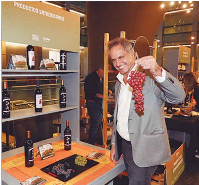
El foco en la industria