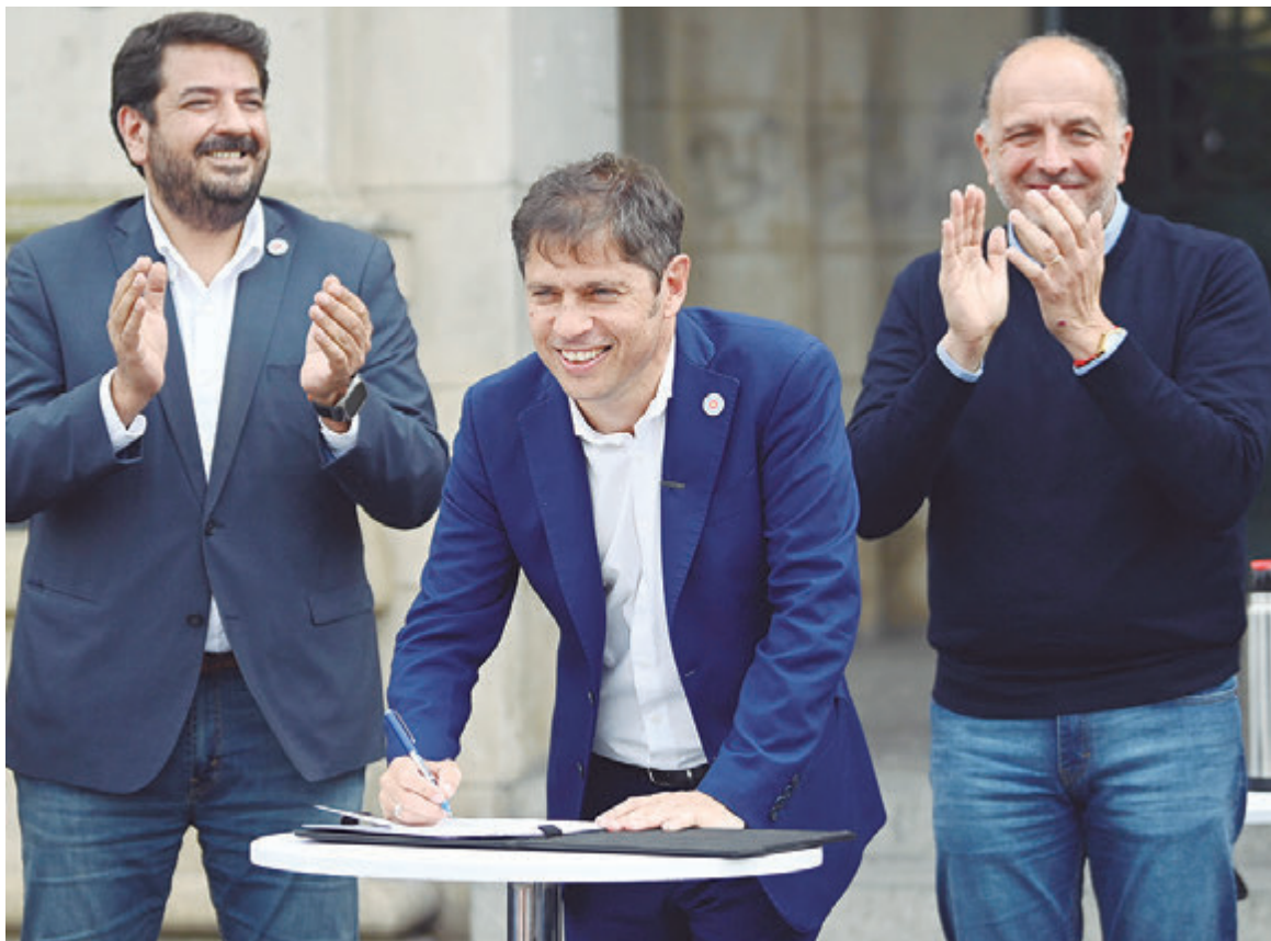
Kicillof firmó escrituras en el sur de la Provincia

El gobernador confirmó inversiones en Tres Arroyos y destacó el rol del Estado con duras críticas a la administración liberal. Además, volvió a reclamar por fondos recortados