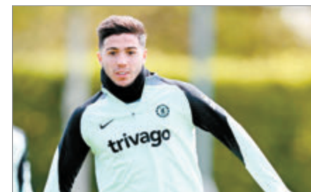
El ex River se entrenó con normalidad pese a algunos rumores de operación

En el transcurso de la jornada de hoy, su elenco disputará las semifinales de la FA Cup frente a un rival que llega con la sangre en el ojo tras haber quedado afuera de la Champions League a manos del Real Madrid.