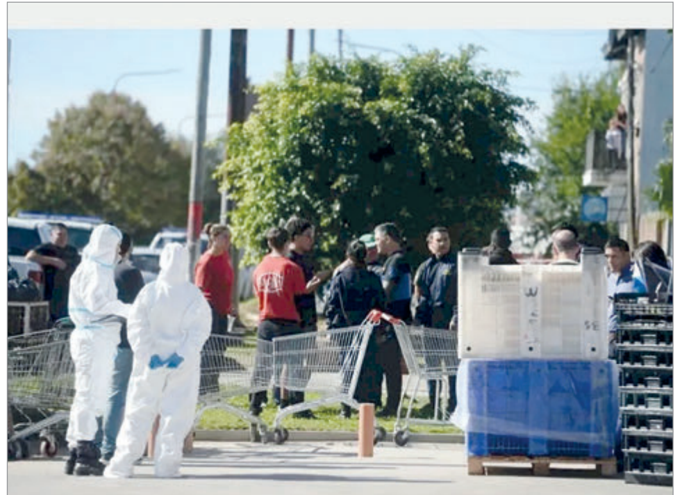
Agentes policiales en el lugar

En cuanto a la moto en la que circulaban, tenía pedido de secuestro, ya que había sido robada. Quedó en la escena del hecho y también será peritada.