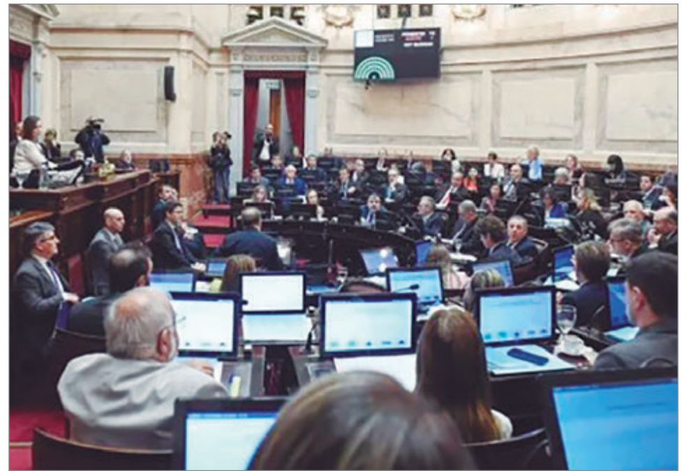
Los senadores pasarían a cobrar más de $4 millones

que en el caso que todos los legisladores del bloque libertario y del PRO acompañen retrotraer el incremento, solamente sumarían 13