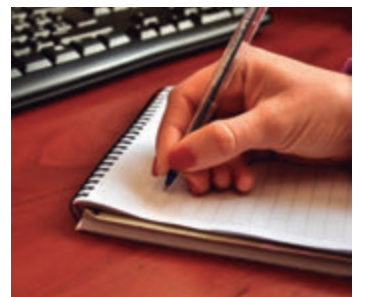
Es la tercera edición

La inscripción y presentación de obras estará disponible hasta el 30 de abril de 2024, a través del sitio web oficial de la entidad. Para ello, las y los participantes deberán presentar un cuento corto, de dos a siete páginas, de temática libre y completar este formulario con datos personales: nombre y apellido, DNI, domicilio, contacto, entre otros.