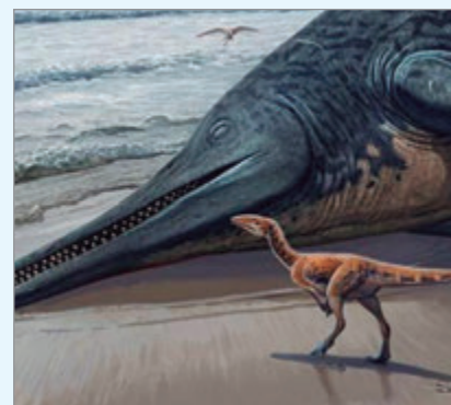
Expertos recrearon la imagen del animal

"Excavé en todo el barro espeso. Después de aproximadamente una hora, mi pala golpeó algo sólido y el hueso salió perfectamente conservado", recordó.