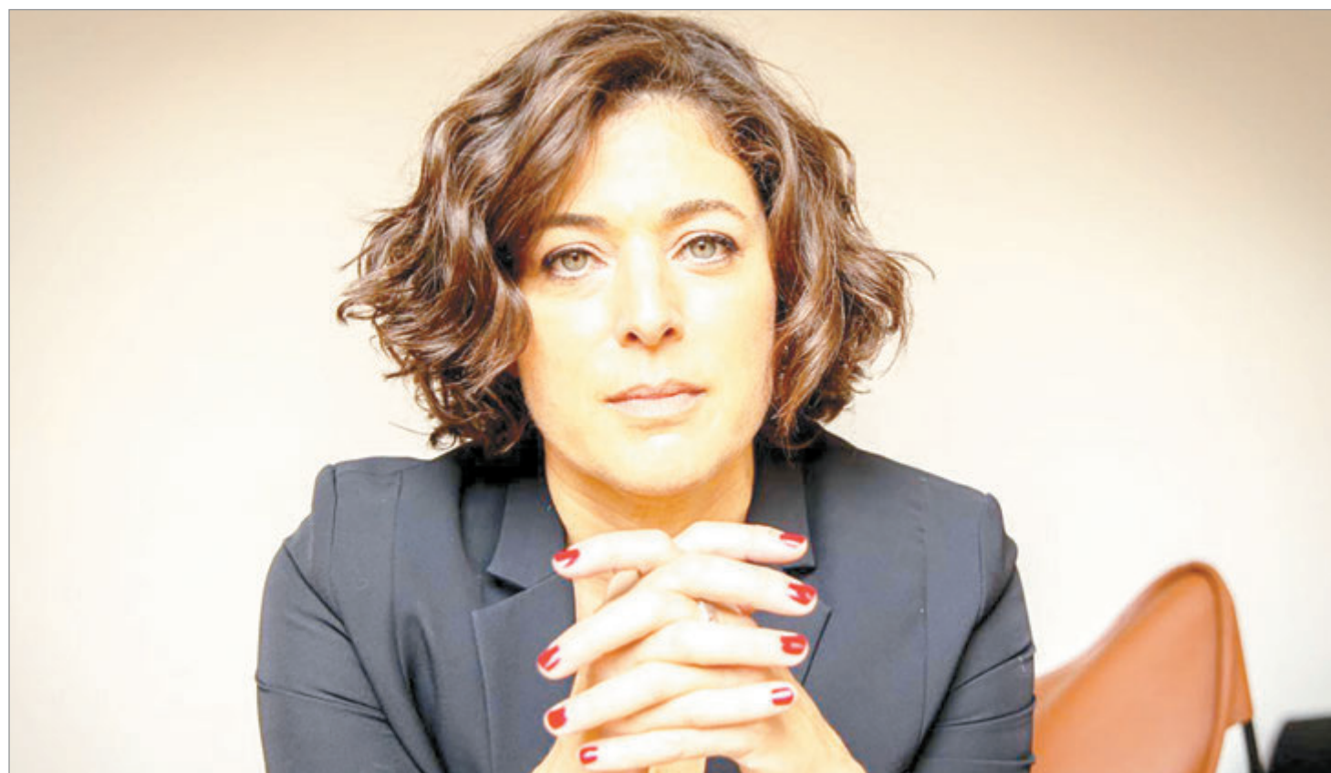
La comunicadora soñaba con dirigir

—Se sintió superhalagado, después fue como un poquito más pudor que le surgió, no tenía ganas de revisar, porque de hecho nunca lo hizo, toda la cosa de la represión y la chupadera, nunca le interesó, y eso le costó un poco más también, lo de volver a su lugar de origen, lo del exilio. Y espero que la película no