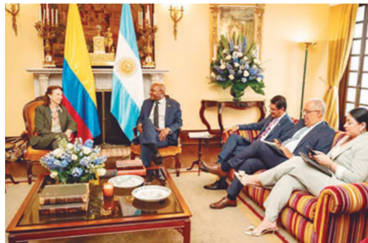
Mondino se reunió con el canciller de Colombia

La ministra de Relaciones Exteriores, Diana Mondino, se reunió en el Palacio San Carlos, en Bogotá, junto al canciller Luis Gilberto Murillo, donde realizaron un balance de la relación bilateral.