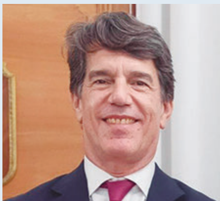
Será el 15 de mayo