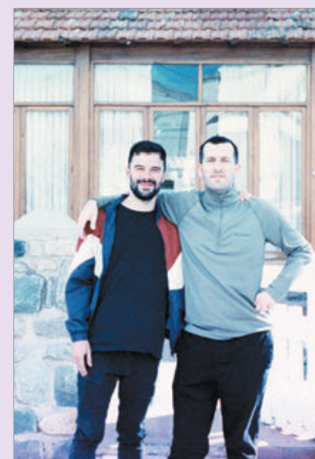
La dupla en el rodaje

Y en ese sentido fuimos los dos muy permeables para poder perfilar un estilo que nos resultara cómodo a los dos y que tuviéramos ganas, obviamente, de llevar adelante. Tuvimos muchas reuniones, algunas de ellas virtuales y siempre me dieron un montón de películas, siempre vimos fragmentos de escenas y películas mientras conversamos respecto de la propia. Y fuimos incluso tomando referencias directas de planos que eventualmente los íbamos a buscar de repente, hablando de tal o cual escena. Ah, yo me acuerdo de este plano, de esta secuencia, en esta película, y así vamos un poco dándole de forma a la nuestra, como en base a esas múltiples referencias ir buscando la forma propia. Pero creo que el trabajo de a dos, en ese sentido, es muy fructífero, porque va generando un buen filtro y es un feedback permanente, un ida y vuelta permanente que se va retroalimentando y está bueno. Es como que hay un gran embudo que trabaja más eficientemente que si uno tal vez trabajara solo, hay siempre un doble check sobre cada decisión, y eso me parece que siempre es provecho.