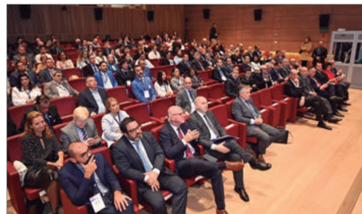
El foro congregó a 200 delegados de 21 países latinoamericanos y de Italia

Asimismo, recordó que esta edición celebró los 10 años del nacimiento del Foro y subrayó “los resultados tangibles en términos de apoyo a las relaciones entre empresarios y proyectos concretos, surgidos precisamente de los encuentros realizados”.