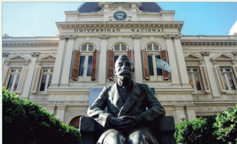
Universidad Nacional de La Plata

El Gobierno ya utilizó esta estrategia sin resultados positivos. Ante el conflicto, rechaza su existencia, ataca a sus protagonistas, cuando todo está por desmadrarse hace una oferta y, a través de las redes sociales, vende una solución que no existe. Así lo hizo el pasado 14 de marzo cuando intentó frenar la huelga nacional de los docentes universitarios. La noche anterior anunció el incremento de un 70 por ciento para gastos de mantenimiento que las universidades debían recibirlo los primeros días de abril. Los gremios docentes y