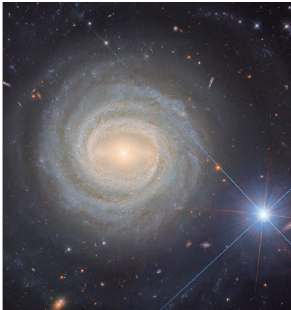
La imagen que captó el telescopio de la NASA y la ESA

"La estrella y la galaxia parecen cercanas, pero esto es una ilusión"