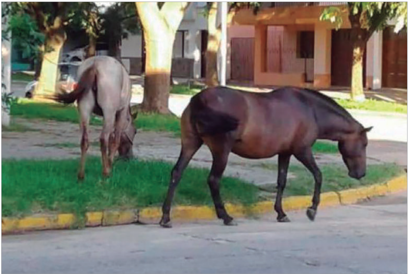
Los caballos sueltos un peligro para los que transitan por la zona

Ciudadano han instruido operativos para controlar a las motos y los autos en 13 entre 91 y 92, y dejaron abierta la puerta para ampliar el margen de operaciones con los dueños de los equinos que también aparecen sueltos en la zona de 8 y 90 y en ocasiones en 7 y 90.