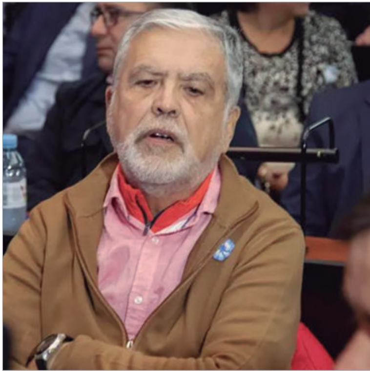
Pidieron elevar a juicio oral otra causa contra De Vido

El procesamiento por el expediente que analiza el perjuicio al Estado a causa del "Convenio de cooperación para la implementación del Laboratorio de Investigaciones y Desarrollo de Tecnologías y Contenidos Audiovisuales Digi-