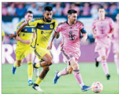
El encuentro será a las 20:30 horas de nuestro país