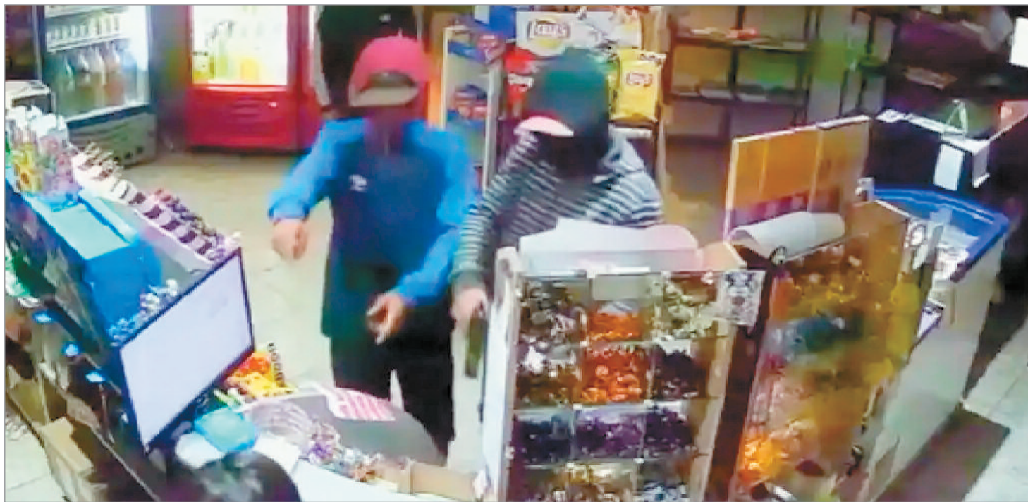
Los cacos quedaron filmados

La denuncia fue radicada en la comisaría Tercera, la cual cuenta con jurisdicción en la zona, y el caso está siendo investigado por la Unidad Funcional de Instrucción N°11, que impartió las correspondientes directivas. Los sospechosos se dieron a la fuga de forma inme-