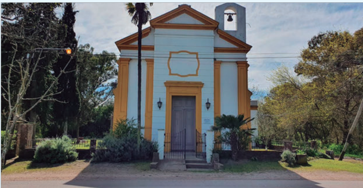
La Capilla de San Pedro donde se hará la misa

La localidad platense festejará un nuevo año con una feria de artesanos, emprendedores, actos protocolares, la tradicional torta y un festival con arte, danza y música en vivo.