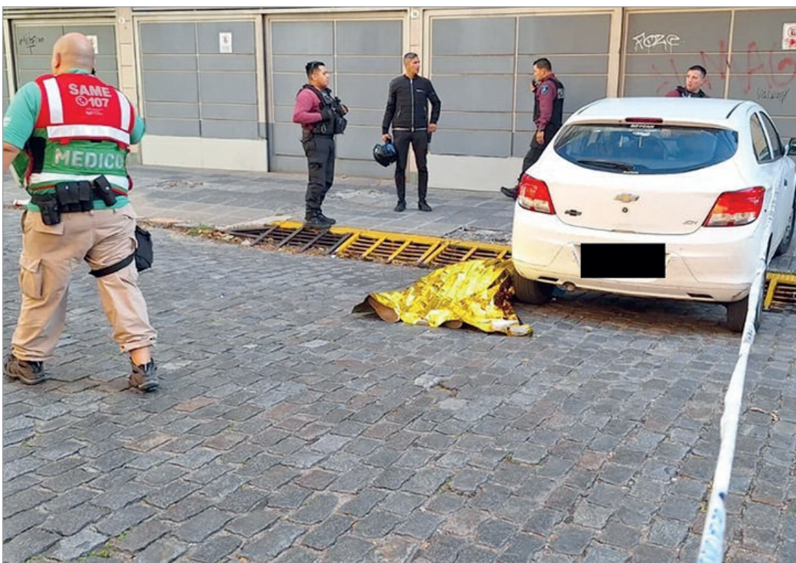
La imagen fatal

Lo abordaron dos individuos, pero el damnificado extrajo su arma reglamentaria y les disparó, resultando con la muerte de uno de los sospechosos