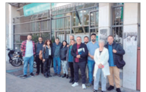
El incremento en los haberes alcanzará un 51,7 % en lo que va de 2024

Por último, tras las negociaciones se acordó que el próximo mes se retomarán los diálogos en relación a las paritarias y donde se realizará una nueva revisión salarial.