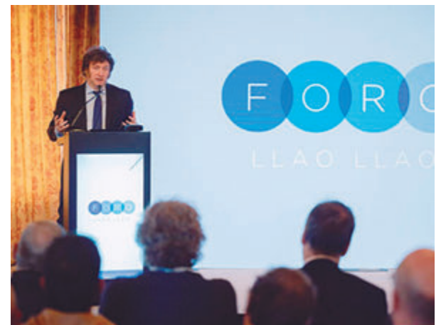
Fue en Bariloche

En otro fragmento, el hombre continuó señalando que “para hacer gradualismo por sobre todo hay que tener tiempo y financiamiento (dos aspectos que no teníamos)” y continuó: “Cuando pasas de una economía hiper socialista a una economía de mercado podés tener problemas adicionales propios de esta transición”.