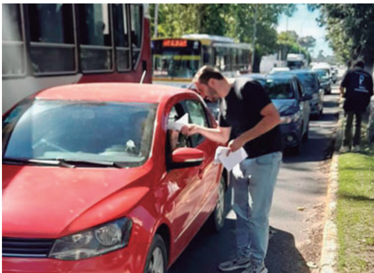
Se repartieron volantes a los vecinos

Asimismo, la jornada se dio en medio de una comunicación del Gobierno, el cual informó un incremento en el presupuesto universitario pero que solo abarca los gastos de funcionamiento. Por ello, desde el CIN, Consejo Interuniversitario Nacional, señalaron que es un reconocimiento al ajuste, aunque consideran insuficiente la propuesta, y sigue en pie el plan de lucha (ver página 3).