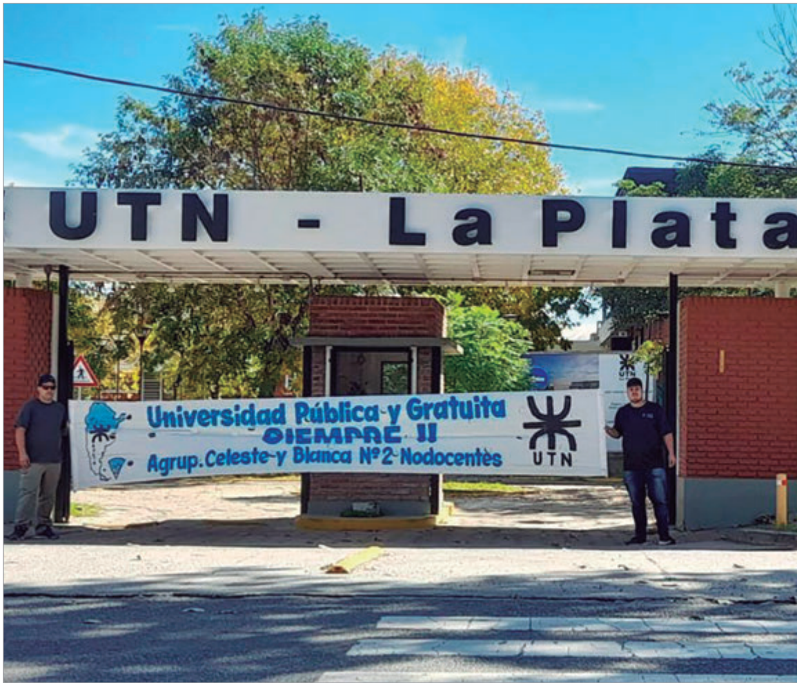
El lunes 22 se hará una asamblea interclaustrós

La institución realizó una jornada de concientización sobre la avenida 60 para visibilizar la delicada situación que atraviesa el sistema universitario