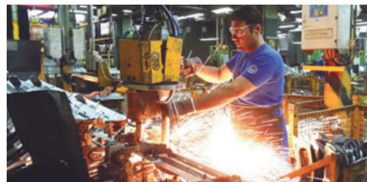
Lo anunció el ministro Pablo López

“Ningún modelo macroeconómico justifica la destrucción planificada de fuentes de trabajo. En la medida en que se actualizan los datos, se anticipa mayor desocupación y pobreza. Prometieron libertad, pero hasta ahora lo único que hicieron fue provocar daño a las y los argentinos”, selló.