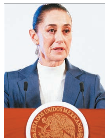
"No aceptamos una intervención de ningún gobierno extranjero", declaró Claudia Sheinbaum

"Ellos han entendido, tan es así que el entendimiento que tenemos con ellos es de colaboración y de coordinación y los primeros puntos quedan muy claros: el respeto a la soberanía, el respeto a nuestra territorialidad y que hay colaboración y coordinación sin subordinación", afirmó. Vale remarcar, que desde septiembre, el ejército estadounidense ha destruido una veintena de lanchas en el Caribe y el Pacífico, cerca de Venezuela y Colombia, matando a más de 80 personas.