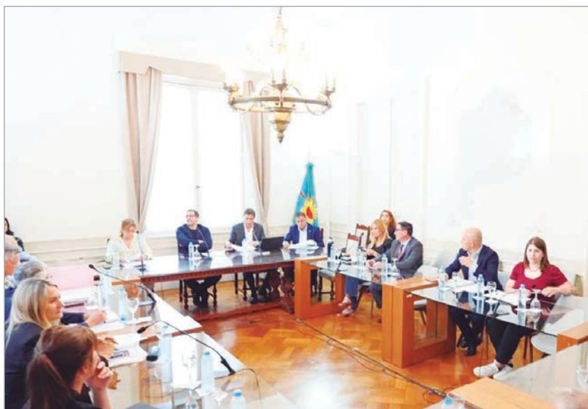
La comisión de Presupuesto bonaerense despachó el proyecto con dictamen dividido

UCR, PRO y la Coalición Cívica impulsaron un dictamen en minoría con propuestas para mejorar el equilibrio fiscal. Incluyen la eliminación de Ingresos Brutos para billeteras virtuales, beneficios impositivos para productores afectados por inundaciones y una escala progresiva del automotor. También exigen que el Fondo de Inversión Municipal tenga un monto fijo, actualizable y de libre disponibilidad.