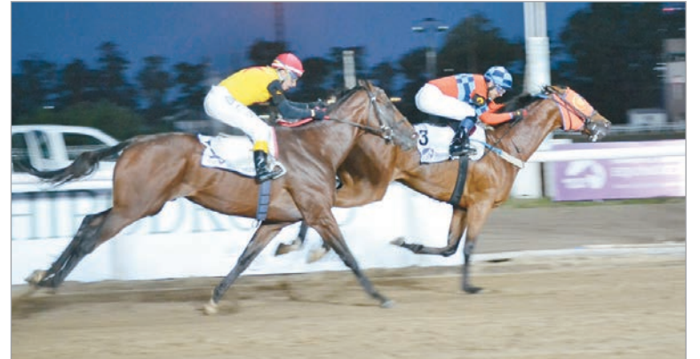
Por el doblete. Treasure Island ganó la edición 2024 del "Dardo Rocha" y ahora va por la hazaña de repetir el éxito

El Gran Premio Dardo Rocha no es un clásico más. Es la carrera "soñada", la más esperada del año. La que convulsiona a todo el Barrio Hipódromo. Es la carrera que desde el patrón hasta el peoncito, pasando por el cuidador y el jockey sueñan con ganar. Para el burrero es, como un Estudiantes-Gimnasia al hinch de fútbol. Son 2.400 metros desde el pique a la raya que traducido en tiempo es un poquito más de 2m.30s. que se corren con el corazón a "mil" y que a tan solo uno lo espera la gloria. El "Rocha" -así, a secas- se vive de una manera especial, con la pasión tan folklórica del turf, inexplicable para el que no conoce el "pañó". Es el día en que el "Teatro del Turf del Barrio Hipódromo" abre sus puertas para recibir a los platenses que colmarán las añejas tribunas como nunca en el año. Donde el burrero de ley, ese que mantiene encendido el fuego sagrado durante los doce meses -llueva o el sol raje la tierra- se molesta porque ve invadida su quintita de asistencia perfecta por visitantes de ocasión: neófitos, profanos o simplemente debutantes en estas lides "pasticheras". Y es el momento en que el viejo "catequista" se pregunta: ¿Qué sabrán estos "logis" de un final "tête a tête", de taco y lonja?. ¿Qué sabrán de esta