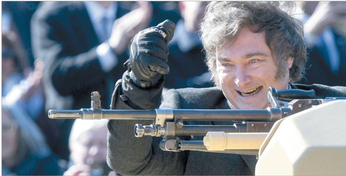
Milei sigue desregulando la compra de armas

ARCA digitalizó los trámites para importar armas, municiones y pólvora. Para ello, modificó normativa sancionada en la década del '70