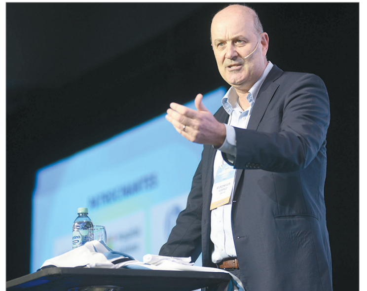
Sturzenegger adelantó que modificarán el régimen del monotributo

“El FMI tiene en la mira al monotributo desde hace mucho tiempo porque quiere que Argentina avance en un régimen general para recaudar más”, afirmó el especialista en derecho tributario y exdirector de Aduanas.