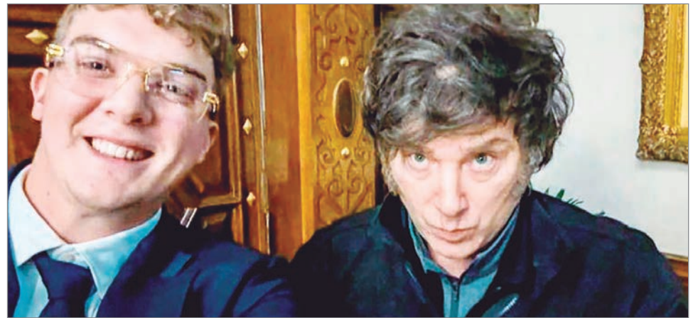
El informe acusa a Milei de usar su investidura en beneficio de intereses privados

La investigación desmiente las afirmaciones oficiales sobre el bajo número de afectados y revela que más de 114.000 billeteras sufrieron pérdidas. El informe también expone antecedentes que muestran un patrón repetido. Entre ellos