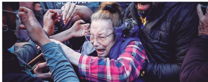
Funcionarios del Presidente Milei defendieron la represión y negaron cifras de violencia denunciadas por organismos

El informe presentado por la CPM registró más de dos mil heridos y más de 200 detenciones arbitrarias desde diciembre de 2023,