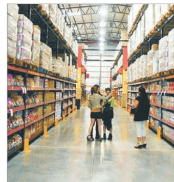
La inflación mayorista fue del 1,1% en octubre

Tras cuatro meses en alza, la inflación mayorista rompió la tendencia ascendente en octubre. Según el Indec, el Índice de Precios Internos al por Mayor (IPIM) arrojó una variación del 1,1% en el décimo mes del año.