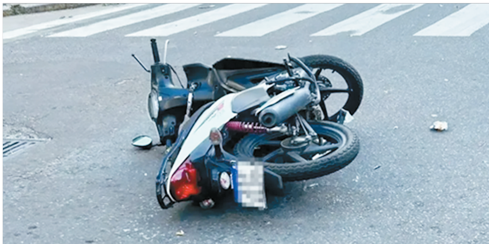
El lugar del hecho

Al mismo tiempo, otro impacto ocurrido en pleno centro platense demuestra que el peligro acecha en cada esquina. En la madrugada de un domingo, dos autos colisionaron violentamente en la intersección de 5 y 46, provocando que uno de ellos volcara. El conductor de un Volkswagen Gol fue asistido por el SAME y trasladado consciente al Hospital San Martín con heridas en la cabeza y moles-