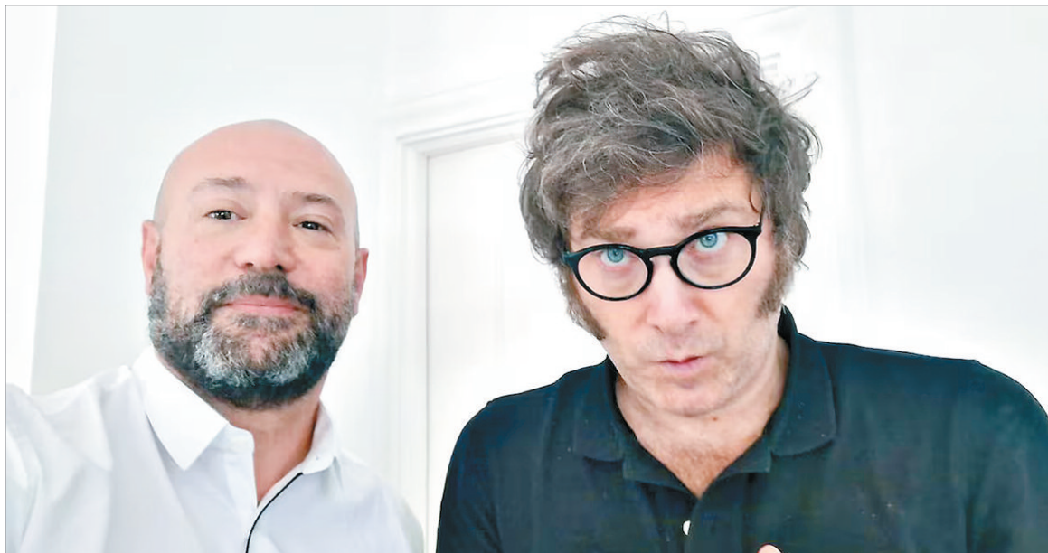
Se conocen detalles del entramado de coimas en Andis

Avanza la investigación por coimas que salpica a Spagnuolo, Karina y los Menem. Además, una funcionaria de Caputo debió renunciar por estar involucrada