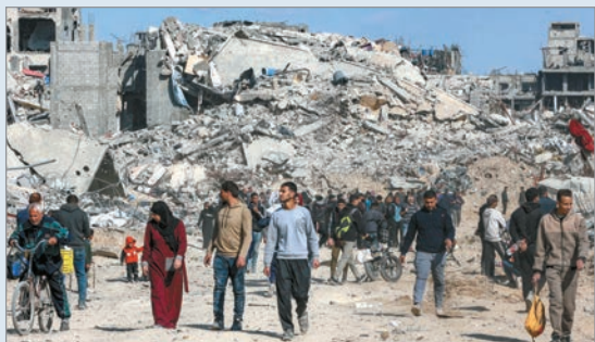
Tuvo las abstenciones de China y Rusia

El Consejo de Seguridad de Naciones Unidas aprobó, con votación de 13-0 y las abstenciones de China y Rusia, la creación de una fuerza internacional de estabilización para Gaza, contenida en el plan de 20 puntos para la paz