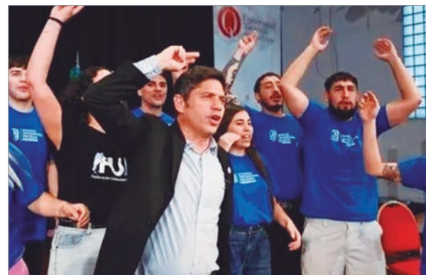
El mandatario habló ante la Juventud Universitaria Peronista y llamó a renovar banderas históricas

Por último, Kicillof señaló que la universidad pública, gratuita y de calidad no es solo un derecho conquistado, sino también una herramienta estratégica para construir un país más justo y soberano.