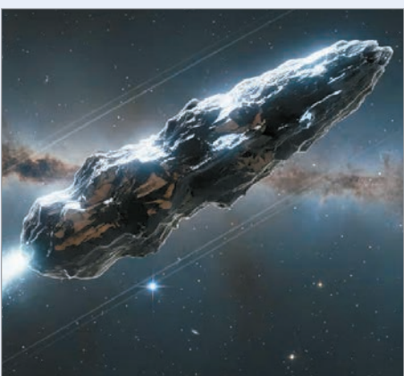
Este cuerpo es el tercer objeto identificado hasta la fecha que entró en nuestro sistema solar

Después de un gran apagón administrativo que causó varios retrasos en su accionar diario, la NASA convocó a la comunidad científica y al público para este miércoles 19 de noviembre para revelar nuevas imágenes y datos clave del cometa interestelar 3I/ATLAS.