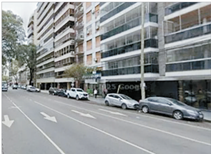
La zona del hecho

Sin embargo, a pesar del esfuerzo realizados por los profesionales de la salud que los asistieron, el niño falleció en el nosocomio como consecuencia de politraumatismos y un paro cardíaco. En tanto, sus padres recibieron contención psicológica y en el operativo participaron efectivos de la comisaría Vecinal 7 C.