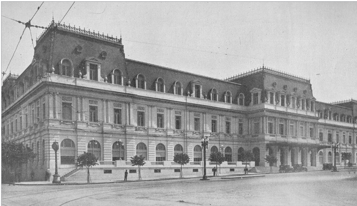
El Pasaje Dardo Rocha en sus orígenes

Después de superar las demoras por un incendio de las instalaciones, el 30 de agosto de 1887 el Pasaje Dardo Rocha abrió sus puertas