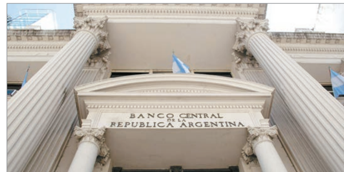
Vuelve a crecer el endeudamiento del sector privado

En cambio, el mercado observa que la apreciación del peso es artificial generada por sobreendeudamiento del sector privado. Estos temores quedaron expuestos por dos jornadas consecutivas en caídas.