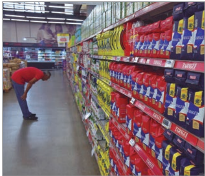
Milei limita al Instituto Nacional de la Yerba Mate en medio de la tensión con yerbateros

Desde 2002 el INYM fijaba precios mínimos para sostener la actividad, pero ahora queda impedido de dictar medidas que afecten la competencia, en línea con un gobierno que privilegia la lógica del mercado.