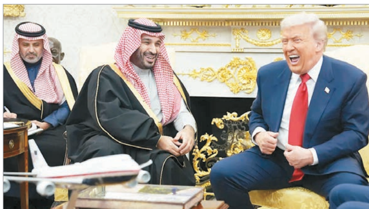
Arabia Saudita acordó una inversión de al menos 600 mil millones de dólares en Estados Unidos

Trump ha hecho una prioridad reforzar los vínculos con el rico reino petrolero del Golfo. El hecho es inédito dadas las tensiones entre los países que vienen del informe de los servicios de inteligencia estadounidenses, que afirma que Mohamed bin Salman, conocido como "MbS", aprobó el secuestro y asesinato del periodista y disidente Jamal Khashoggi a manos de agentes saudíes en Estambul en 2018. El pasado lunes, Trump anunció una transacción sin precedentes, que podría alterar el equilibrio militar regional al afirmar