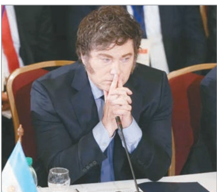
Mercosur celebrará su cumbre en Brasil

Según trascendió desde Casa Rosada, Javier Milei piensa participar de la Cumbre del Mercosur que se celebrará el próximo 20 de diciembre en Foz de Iguazú, Brasil. Sin embargo, desde el entorno del Presidente no guardan esperanzas sobre la posibilidad de concretar