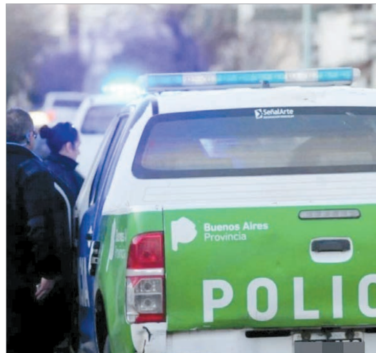
Buscan a los ladrones

Enseguida, uno de los malvivientes extrajo la pistola que llevaba consigo, le apuntó y apretó el gatillo. Acto seguido, los implicados escaparon sin cometer el ilícito y pronto las autoridades policiales fueron notificadas mediante un llamado al 911 de la presencia de una persona fallecida. Al arribar, los oficiales se encon-