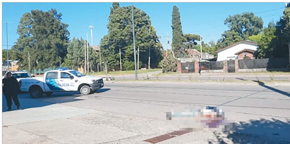
El accidente de 44 y 153

la moto y se dio a la fuga, mientras que el otro, se quedó en el lugar aguardando a las autoridades. El personal del SAME se acercó y constató que, pese a los esfuerzos, uno de los damnificados, de 20 años, había perdido la vida en el momento.