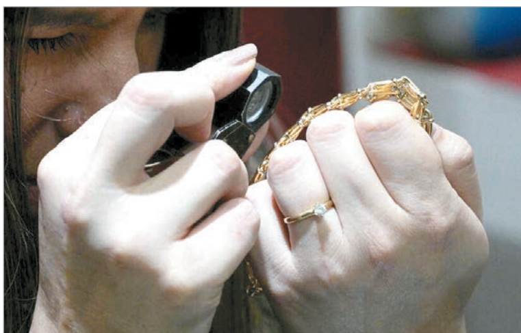
Cada vez más argentinos venden objetos de valor