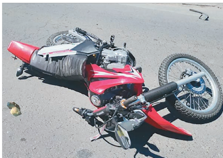
El siniestro de 523 y 137

E l domingo estuvo cubierto por muerte y desolación en La Plata, luego de que dos motociclistas perdieron la vida en sendos accidentes que ocurrieron en la localidad de San Carlos. Con estos hechos, ya son 65 las víctimas