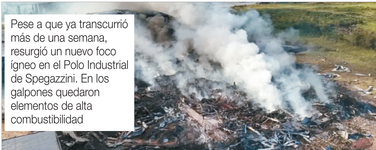
El impactante siniestro

Pese a que ya transcurrió más de una semana, resurgió un nuevo foco ígneo en el Polo Industrial de Spegazzini. En los galpones quedaron elementos de alta combustibilidad