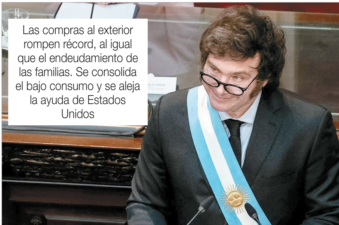
Se profundizan las debilidades del modelo económico

Las compras al exterior rompen récord, al igual que el endeudamiento de las familias. Se consolida el bajo consumo y se aleja la ayuda de Estados Unidos