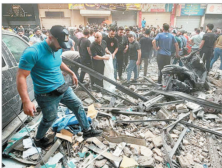
Hubo cinco muertos y 28 heridos

Vale recordar, que Hezbolá quedó debilitado tras su enfrentamiento con Israel, que comenzó en octubre de 2023 cuando el grupo lanzó intercambios de fuego transfronterizos en apoyo a su aliado Hamás en Gaza, lo que luego escaló a dos meses de guerra abierta.