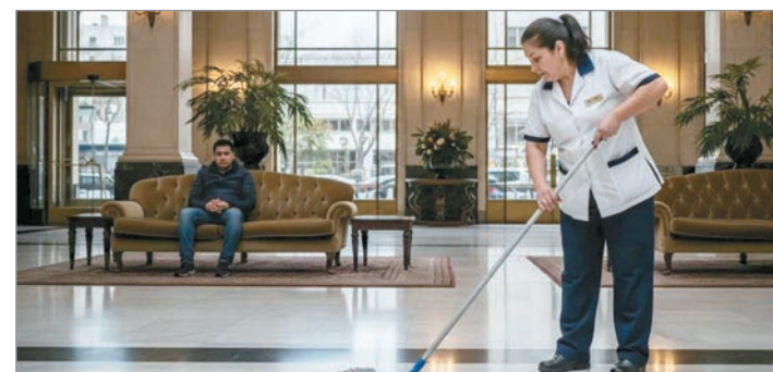
Los hoteles se adaptan al modelo de Milei

La inestabilidad económica convierte cada estrategia empresarial en un paliativo frente a una crisis estructural.