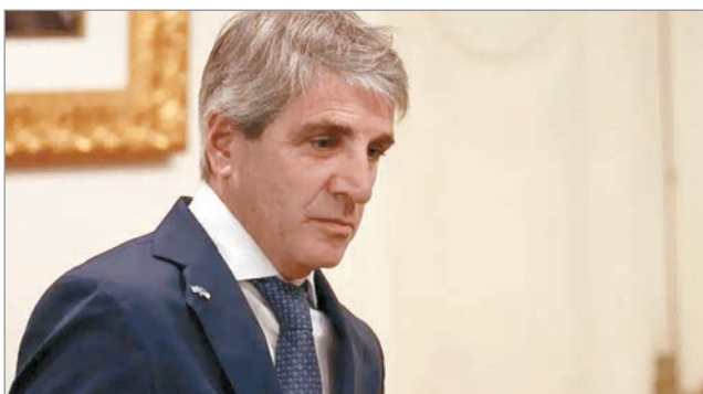
Gobernadores plantean reclamos para debatir el Presupuesto

Si bien el Gobierno nacional avanza en negociaciones para conseguir consensos entorno a las reformas estructurales, lo más urgente es el Presupuesto 2026. Para ello, el diálogo se enfoca en los gobernadores. En este camino, el ministro de Economía, Luis Caputo, se enfrenta a la disyuntiva si aceptar los pedidos de los mandatarios provinciales para aprobar la Ley de Leyes.