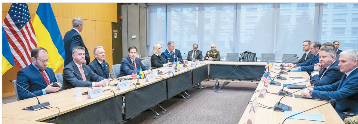
“Estamos avanzando hacia la paz justa y duradera”, destacaron desde Ucrania

Altos funcionarios mencionaron que el intercambio producido en Ginebra fue muy significativo y el más productivo de los últimos tiempos