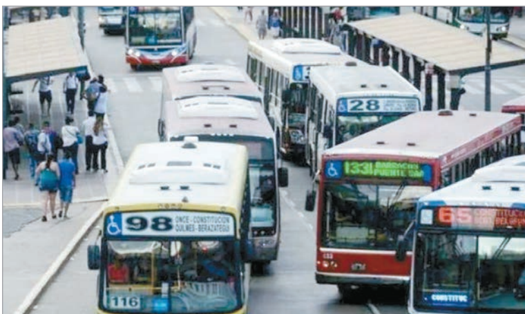
La UTA responsabiliza a empresarios y Nación por la crisis del transporte urbano