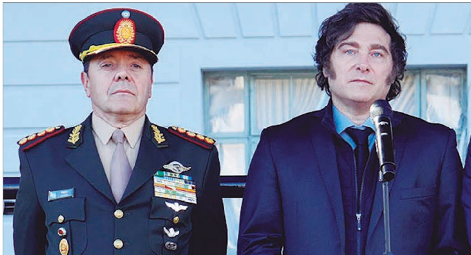
La designación reabre tensiones históricas y enciende las alarmas de varios sectores de la sociedad

conjunto, las críticas apuntan a que la medida no fortalece a las Fuerzas Armadas, sino que las expone a un uso político que erosiona el consenso democrático construido en las últimas décadas y proyecta un giro riesgoso en la relación del