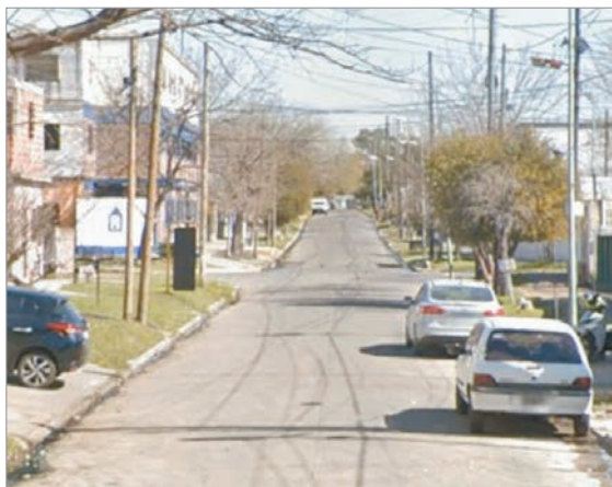
El lugar del hecho

Se esperan pericias, pruebas de lesiones y testimonios de vecinos para esclarecer los momentos previos al trágico desenlace.