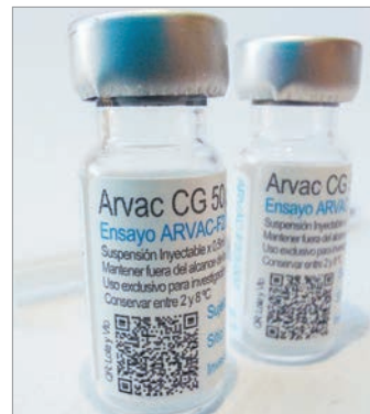
Formosa y Buenos Aires recibirán vacunas Arvac

En tanto, desde Formosa señalaron que “el laboratorio se comunicó con el Ministerio de Desarrollo Humano y acordaron la entrega de 1.000 dosis para la próxima semana”.