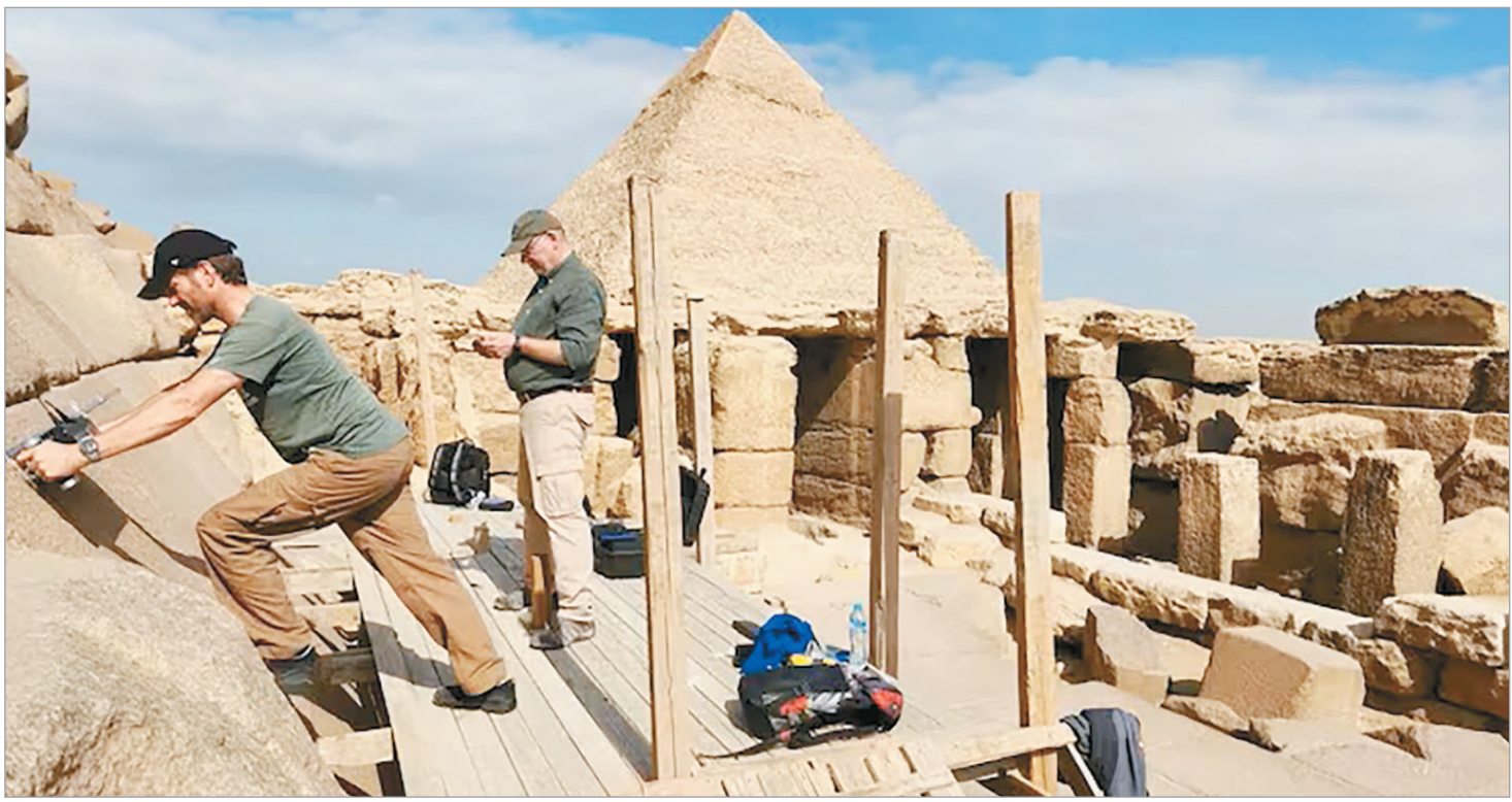
Se identificaron dos huecos bajo la fachada de granito exterior

Según indicaron, el proyecto ScanPyramids, que desde 2015 aplica tecnologías no invasivas para estudiar las estructuras de Giza, detectó bloques de granito pulido y zonas con densidad anómala en el lado este del monumento. Estas señales condujeron al descubrimiento de las cavidades subterráneas. “Una de las cámaras mide un metro aproximadamente de alto por un metro y medio aproximadamente, y la otra 90 centímetros aproximadamente por 70 centímetros aproximadamente”, detalló el estudio, que después explicó: “No son grandes, pero sí lo suficiente como para que una persona pudiera desplazarse a través de ellas”. Ambas se encuentran entre 1,1 y 1,4 metros por debajo de la superficie, lo que sugiere que podrían formar parte de un antiguo pasadizo de acceso o ventilación. La forma, el tamaño y la ubicación de las cavidades han sido sometidas a simulaciones numéricas para descartar que se trate