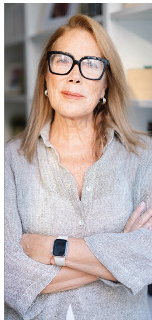
Desea volver a escribir en “argentino”

que cuentan la vida de otros, nosotros vemos de qué manera se destruye una mujer cuando se la trata de infiel, y cuando toma un micrófono y habla, y cómo opina la gente, con qué liviandad. Es una defensa a la bigamia, no es una defensa a la mentira, es un personaje que tiene sus fallas de origen, ella explica cuáles son las carencias por las cuales se ve involucrada en esta situación de todo el tiempo estar necesitando ser querida, y tiene sus razones familiares, pero a su vez no hay una manera de amar, esto es cultural, nosotros en el set se armaban unos debates con los técnicos, que eran maravillosos, pues estábamos, tenemos una directora mujer, un director hombre, técnicos mujeres, técnicos hombres, y las mujeres absolutamente adherían a esta situación, las mesas de almuerzo, yo fui mucho al set, todo el mundo contaba su vida privada, de distintas maneras, parecían terapias lo que se provocaba, y finalmente llegamos a la conclusión que es cultural, que si nosotros viviéramos en una sociedad donde estuviera permitido la poligamia de otra manera, seguramente Alicia lo hubiera vivido de otra manera, pero el personaje de Alicia no está proponiendo una relación abierta, esto es otro tema.