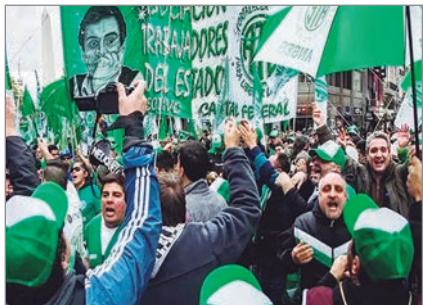
El gremio advierte que la pérdida salarial golpea a los estatales y reclama medidas para proteger el empleo público

En ese marco, el sindicato sostuvo que no hay margen para más deterioro y remarcó la necesidad de reabrir paritarias sin topes, garantizar la estabilidad laboral y avanzar en el pase a planta permanente.