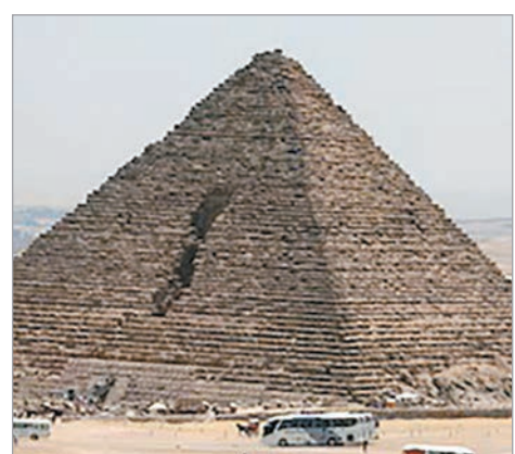
La pirámide mide 65 metros

Vale destacar, que no es la primera vez que el proyecto ScanPyramids revela secretos de estas estructuras milenarias. En 2023, el mismo equipo descubrió un corredor oculto en la pirámide de Keops, de unos nueve metros de largo, ubicado detrás de la entrada principal.