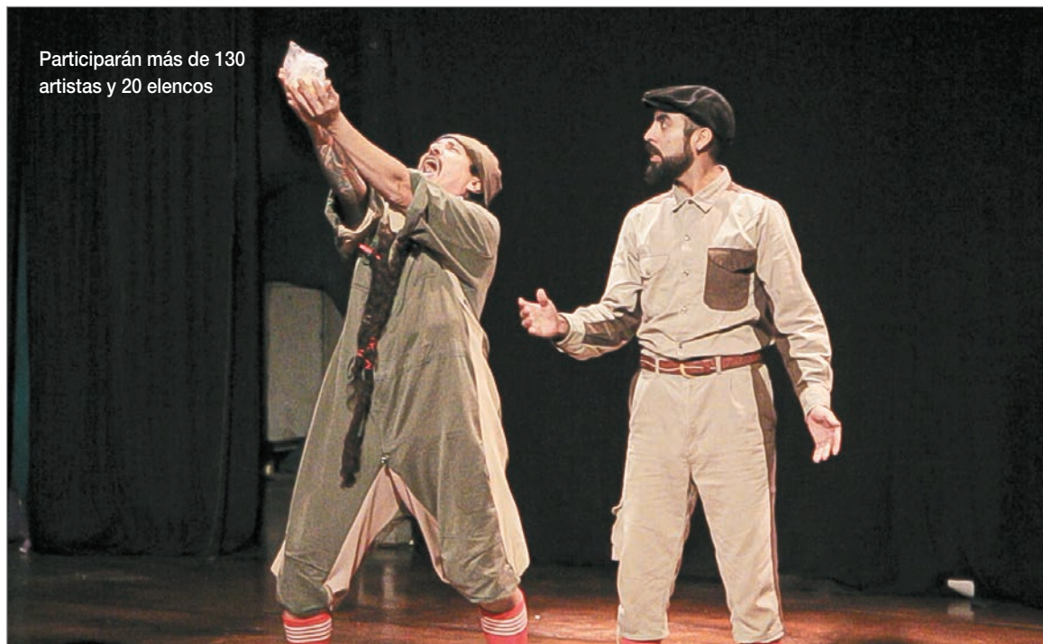
Participarán más de 130 artistas y 20 elencos