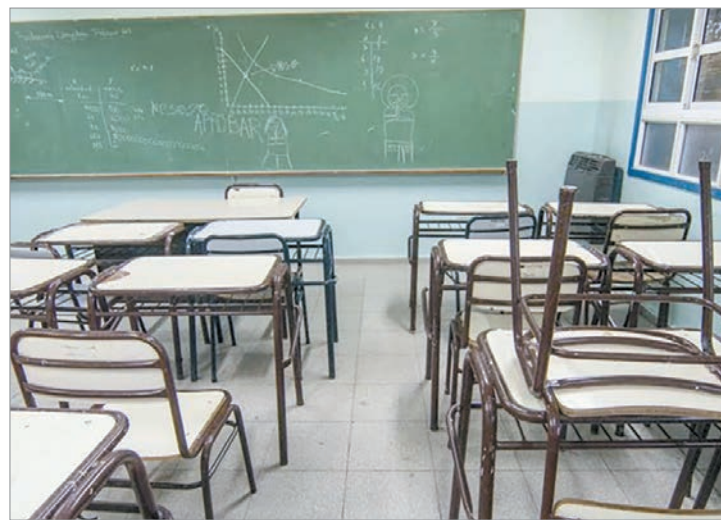
Senadores bonaerenses pidieron datos oficiales y medidas de prevención ante el aumento de agresiones en escuelas

En sus fundamentos, Ventura definió el escenario como “preocupante” y recordó que cada mes ocurren múltiples agresiones. Citó el caso del Normal 2 de La Plata, donde una pelea entre alumnos dejó herida a una preceptora. Frente a ello, reclamó que el Estado garantice la integridad de los jóvenes, los docentes y los no docentes, y que las escuelas vuelvan a ser espacios de respeto y seguridad.