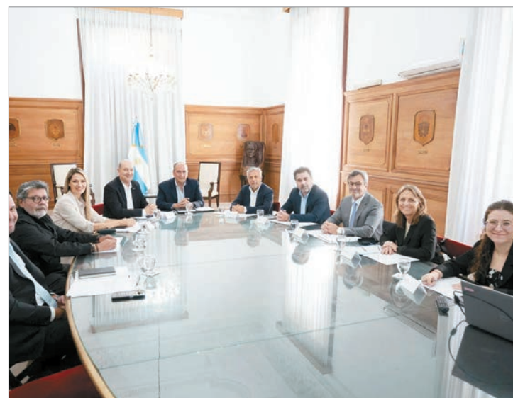
Adorni coordinará el último encuentro del Consejo de Mayo

Pese a que la instancia de discusión incluye los 10 puntos acordados por una veintena de gobernadores y Javier Milei, la reforma laboral ocupa un gran lugar en el temario de debates. Este punto generó además tensión entre los equipos técnicos luego de que el mandatario rechazara la filtración de algunos puntos. Estas reuniones fueron suspendidas, pero las tareas continúan en el diseño del proyecto que se enviará el 15 de diciembre.