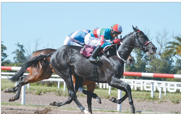
De atropellada. Cargando desde el fondo en los metros postreros Glorioso Rim dio caza a nuestro candidato Ridge Prince

Hándicap reservado para todo caballo de 4 años y más edad, ganador de tres o más carreras, ocupó el sexto