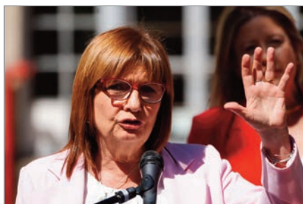
Bullrich presentó la Agencia Nacional de Migraciones

Cabe destacar que Bullrich estuvo acompañada por Alejandra Monteoliva, quien la sucederá en el cargo a partir del 10 de diciembre.