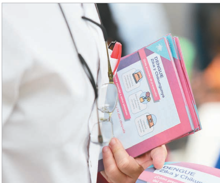
Los encuentros serán en el Pasaje Dardo Rocha

El encuentro reunirá a equipos profesionales de distintas áreas con el objetivo de promover el intercambio de experiencias, fortalecer las redes territoriales y difundir los trabajos comunitarios que se desarrollan en los CAPS. Además, durante ambas jornadas habrá una feria de salud y espacios de exposición con iniciativas de los distintos centros de atención.