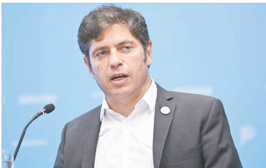
El oficialismo consiguió los votos para habilitar la doble sesión en la Legislatura.

La sesión doble se realizará hoy, a las 14