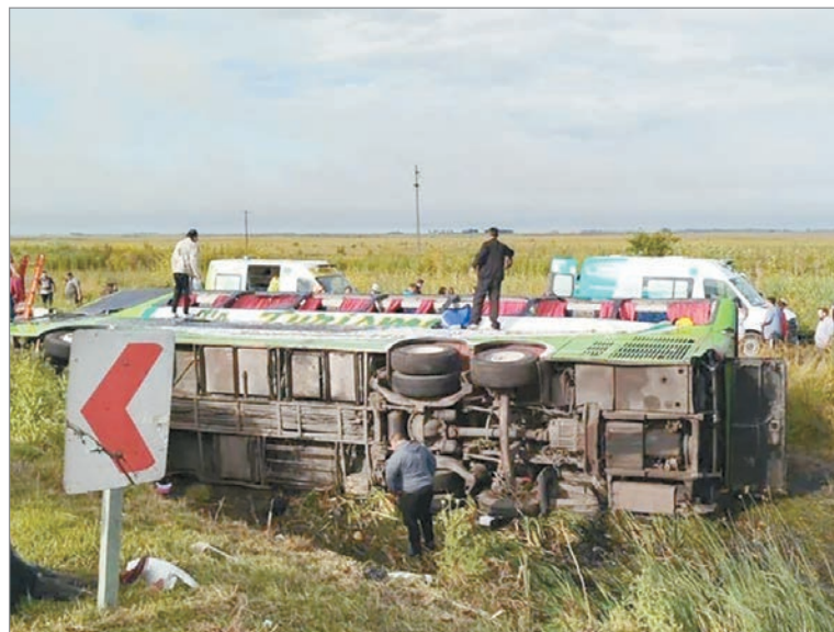
Imágenes del colectivo

rescatar a las víctimas y comenzar con las tareas de peritaje.