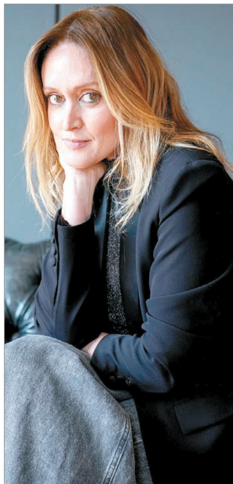
Se prepara para una nueva temporada de Viudas Negras

—Soy meme, soy sticker, la cantidad de stickers que me van mandando. Pasaba algo con Mecha, el personaje de Viudas , una escena en particular se hizo muy viral, yo no tengo TikTok, pero me fueron mostrando y mandando, la de las uñas, y