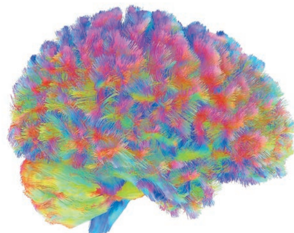
La transición tiene lugar a los 9, 32, 66 y 83 años

► El cerebro tiene el mayor cambio alrededor de los 30 años