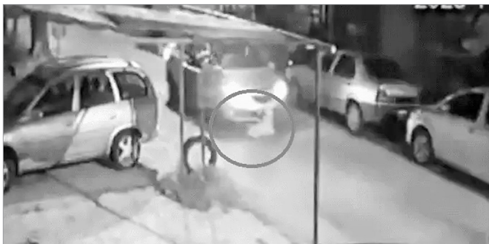
El cobarde hecho de Ensenada

mató a una perra que cruzaba la calle, para luego darse a la fuga. Por otro, un auto embistió a un caballo cuyo jinete sufrió la fractura de cadera y el vehículo escapó sin detenerse. Ambos episodios evidencian no sólo negligencia vial, sino una falla grave en el sentido de responsabilidad y de reparación del daño.