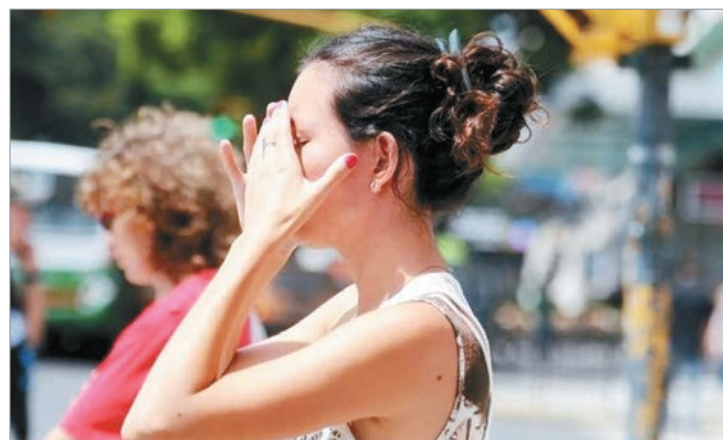
Alerta por altas temperaturas

El fin de semana llegará con un escenario más inestable: entre el viernes y el sábado las tormentas se generalizarán y podrían intensificarse sobre el centro-oeste, el centro del país y luego el Litoral. De esta manera, noviembre se despedirá con episodios de tormentas fuertes a severas, acompañadas por abundante caída de agua en periodos cortos, que podrían dejar acumulados significativos en varias provincias.