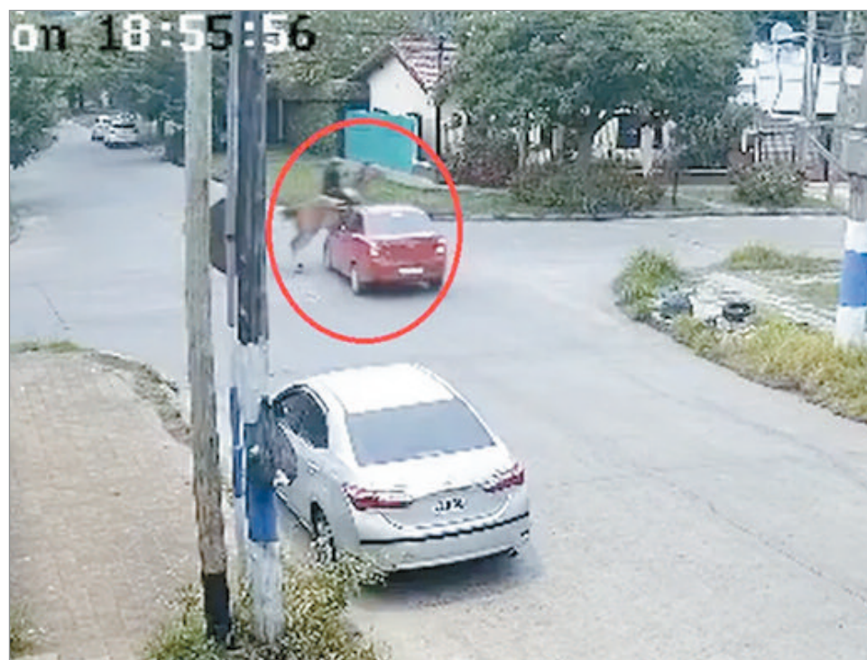
El caso de 121 y 67

En el caso de Ensenada, el incidente ocurrió el domingo 23 de noviembre, a las 21:47, en 124 y 48: un auto Chevrolet embistió a la perra y el conductor huyó sin siquiera asistir al animal. Las cámaras de vigilancia registraron el episodio y vecinos difundieron el video para intentar identificar al autor. Por su parte, el atropello del caballo ocurrió el 27 de octubre, en 121 y 67: el jinete