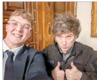
Avanza la causa por la estafa $Libra