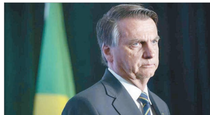
El líder de la ultraderecha estaba en prisión domiciliar desde agosto pasado

El juez Alexandre de Moraes ordenó a Bolsonaro que comenzara a cumplir su condena en la sede de la Policía Federal en Brasilia, donde permanece detenido desde el sábado.