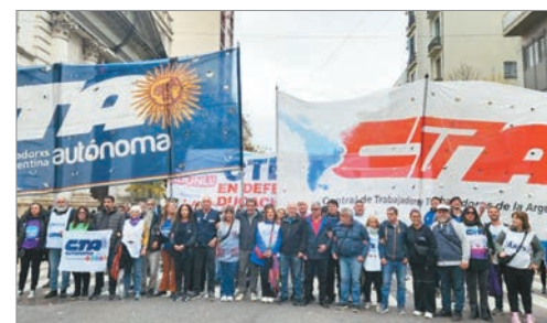
Las centrales advierten que sin las leyes se ponen en riesgo áreas clave de la provincia

Ambos espacios informaron que convocaron a multisectoriales para organizar medidas de resistencia y se declararon en estado de alerta y movilización. En ese marco, anticiparon que, si no se aprueban las leyes provinciales, llamarán a plenarios de secretarías y secretarios generales para definir acciones que garanticen el funcionamiento del Estado y la defensa de los derechos de los bonaerenses.