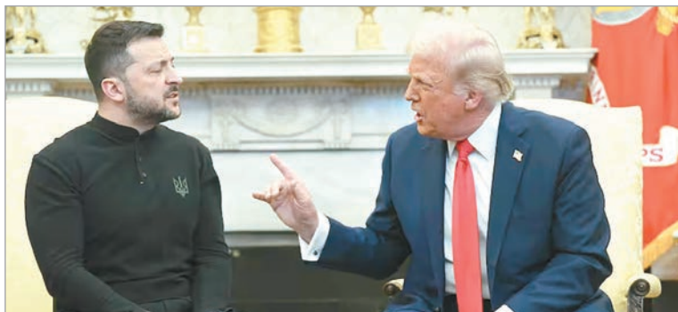
Zelensky podría visitar Estados Unidos en los próximos días

Un plan inicial de Estados Unidos, que en gran medida favorecía a Rusia,