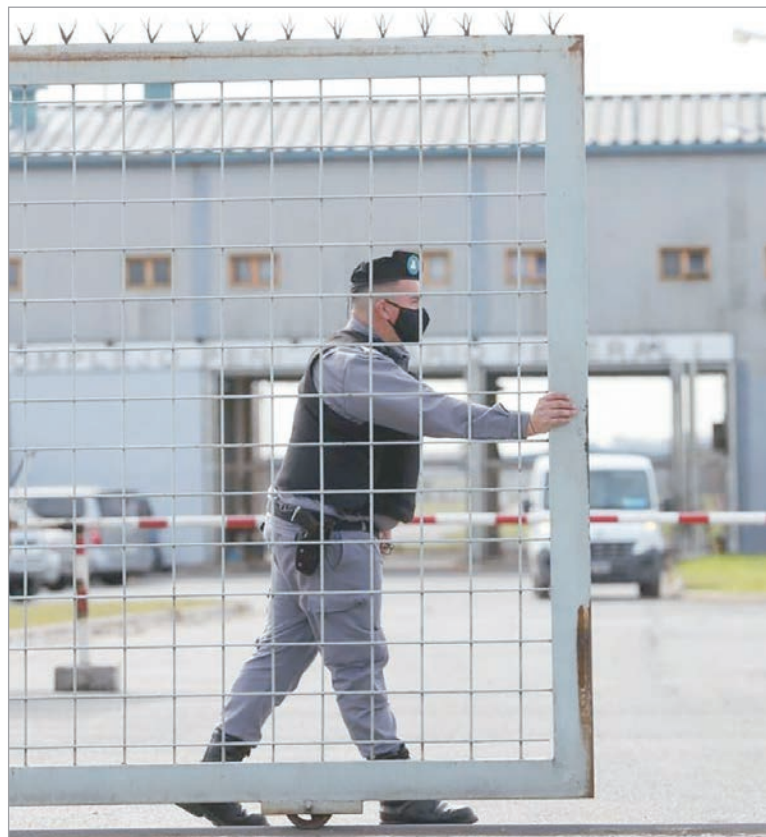
Aumentaron los casos de torturas en cárceles federales

Si se observan todas las categorías de maltrato y/o tortura, el listado de los principales casos está liderado por "Malas condiciones materiales de detención", 427 casos;