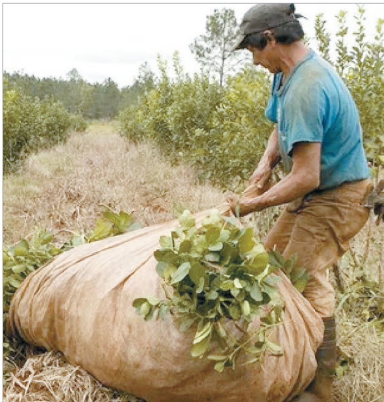
La desregulación golpea a los pequeños productores.

Poco después, un fallo de primera instancia suspendió los artículos del DNU vinculados al INYM, que luego fue ratificado por la Cámara Federal de Posadas. Allí, los camaristas coincidieron con que si la recaudación del Instituto pasa a la órbita del Estado, se genera "el inminente vaciamiento o desfinanciamiento y por ende la imposibilidad de contar con recursos propios para cumplir con sus obligaciones legales y convencionales, entre ellas la de aportar los fondos o recursos pertinentes para la ejecución del régimen de