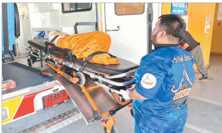
El curioso incidente ocurrió en la provincia de Nonthaburi, al norte de Bangkok