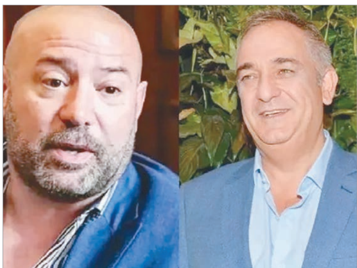
Se confirmó la renuncia de otro funcionario de Economía

Picardi acusa a Spagnuolo, a Calvete y a otros 14 exfuncionarios de integrar una organización que digitaba las compras para las llamadas Prestaciones e Insumos de Alto Costo y Baja Incidencia (PACBI), que "se caracterizan por tener un costo económico elevado o un tratamiento prolongado".