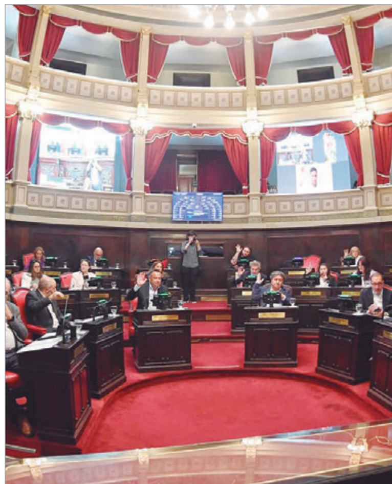
El Senado dio sanción definitiva al Presupuesto y Ley Impositiva.

No obstante, y con relación al resultado financiero, el gasto total contemplado es de $43 billones, mientras que los recursos totales alcanzan los $41,5 billones, es decir que en este ítem habrá déficit, por lo cual el Ejecutivo consideró "prioritario" la sanción de la ley de financiamiento, es decir, endeudamiento, debate que la Legislatura retomará el viernes a par-