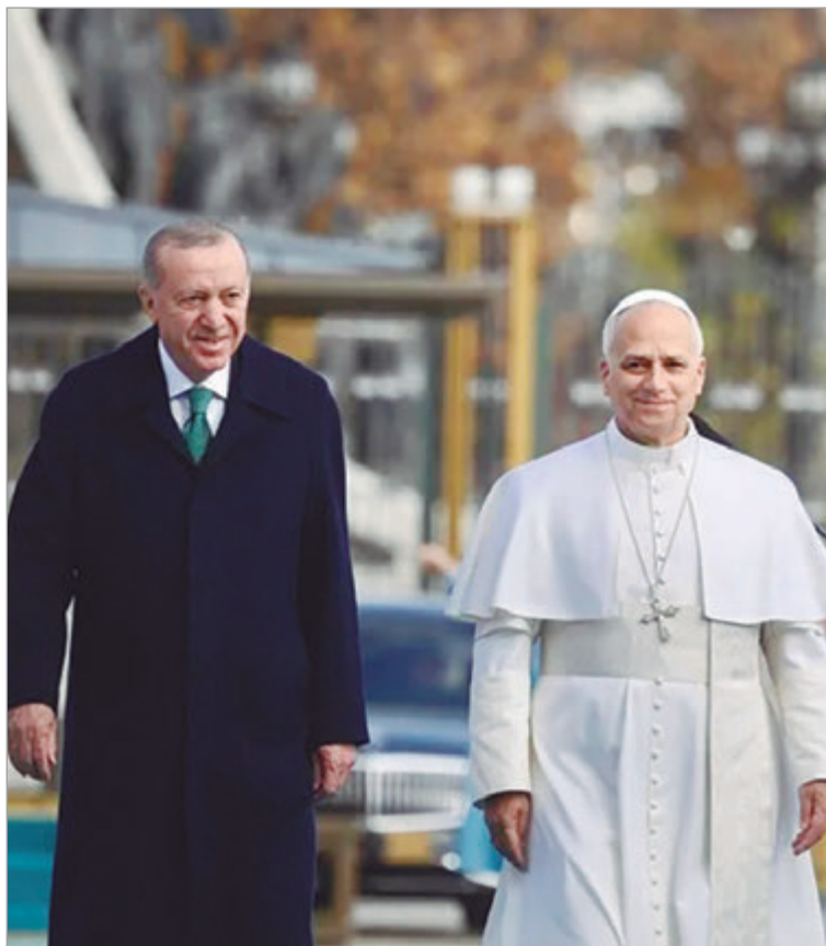
León XIV se convirtió en el quinto Pontífice en visitar Turquía

León XIV se convirtió en el quinto Pontífice en visitar Turquía, después