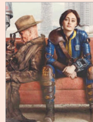
Es uno de los estrenos más esperados del año

La segunda temporada de Fallout se estrenará el 17 de diciembre en Prime Video, con un nuevo episodio cada semana hasta el final de temporada, el 4 de febrero de 2026. La nueva temporada retomará los eventos que se desarrollan tras el impactante final de la primera entrega y llevará al público en un viaje a través del yermo del Mojave hasta la ciudad postapocalíptica de New Vegas. Todos los episodios de la primera temporada están disponibles en Prime Video y está basada en una de las franquicias de videojuegos más icónicas de todos los tiempos.