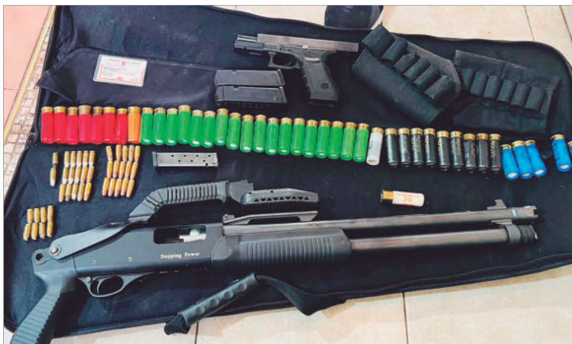
Parte de lo incautado

El saldo del enfrentamiento fue grave: uno de los Tehuelches sufrió una puñalada en el muslo y otro recibió impactos de bala, mientras que un efectivo de la Policía Bonaerense terminó herido con dos disparos en un brazo al intentar intervenir en medio del caos. En los días