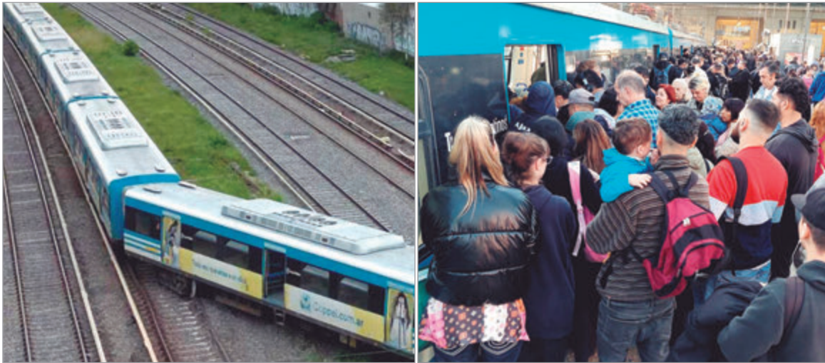
El deterioro ferroviario expone el avance de la privatización

La crisis en el sistema ferroviario revela una estrategia oficial que recorta servicios y personal mientras prepara activos públicos para el sector privado