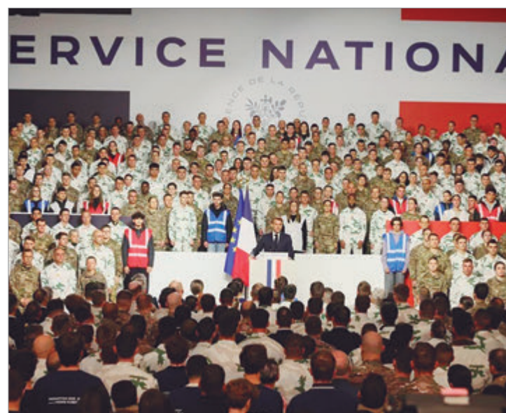
Será para jóvenes de entre 18 y 19 años

En Europa un total de 12 países mantienen o han restablecido el servicio militar obligatorio. Ante la degradación del entorno estratégico, otros seis han decidido instaurar un servicio voluntario.