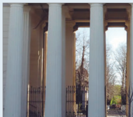
El Cementerio tendrá autonomía propia

El Concejo Deliberante de La Plata aprobó un proyecto que convierte al Cementerio de la ciudad en un ente autárquico con recursos propios. De esta manera, el predio, que dependía de la Secretaría General del Municipio, adquirió autonomía operativa, financiera y administrativa.