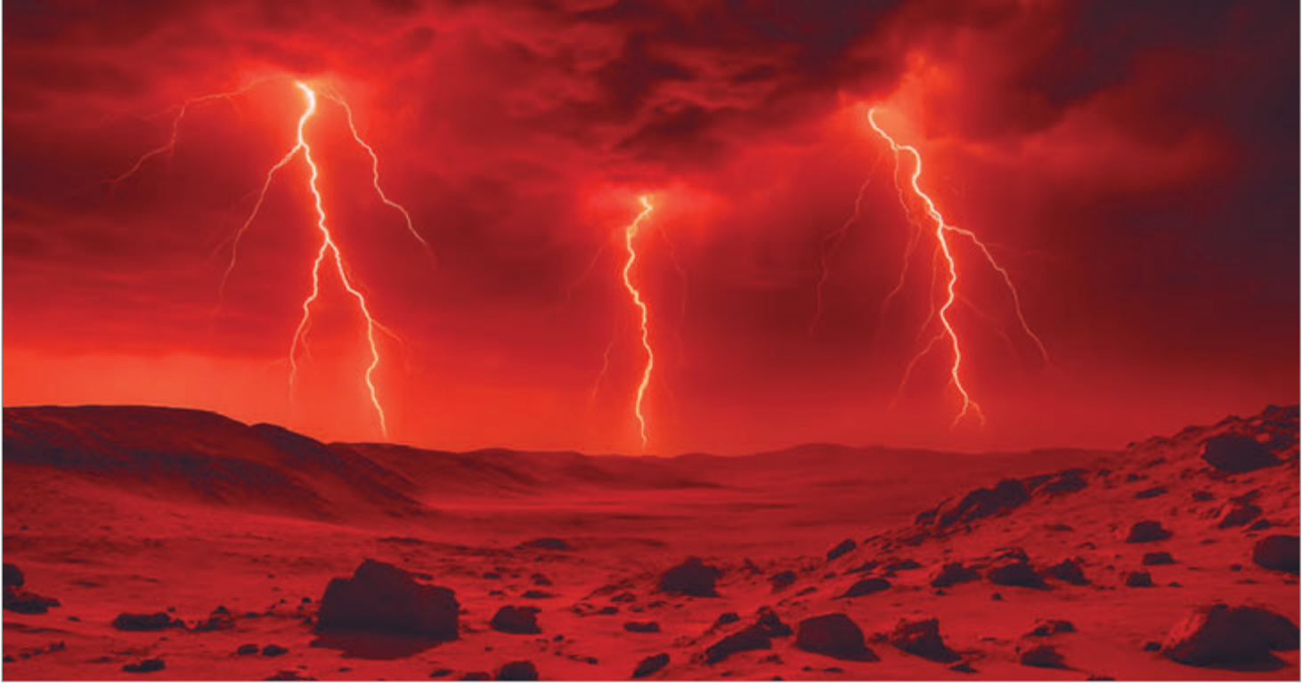
El rover Perseverance detectó descargas en Marte

Cabe señalar que Perseverance no fotografió descargas eléctricas en el cielo de Marte.