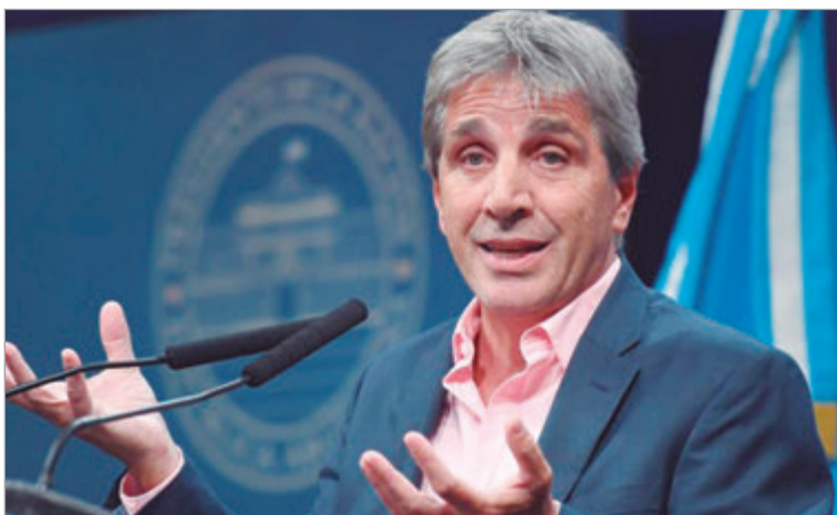
El discurso oficial se distancia de los datos que muestran fragilidad en la economía real

El ministro defiende el tipo de cambio y desestima advertencias sobre pérdida de competitividad y cierre de empresas