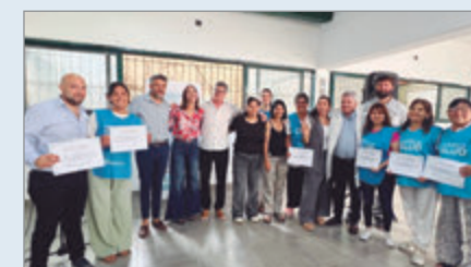
El acto que se realizó en la Escuela N° 514

Desde la organización destacaron que este operativo marca un precedente histórico en La Plata y expresaron la intención de sostenerlo todos los años para facilitar el acceso de los auxiliares a sus certificaciones obligatorias.