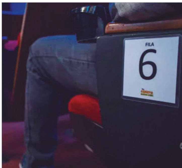
Aprueban una ley para desarrollar la industria audiovisual