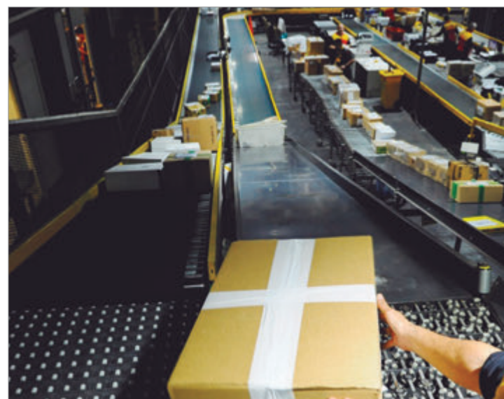
El ingreso de productos por compras online desplaza producción local y presiona a las fábricas argentinas

El cierre de empresas y la pérdida de puestos de trabajo se convierten en señales de alerta. La presión importadora no muestra signos de agotamiento y los especialistas advierten que, sin medidas de contención, el jaque a la industria nacional puede transformarse en un golpe estructural difícil de revertir.