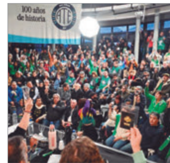
ATE reúne a sus delegados para resolver un plan de lucha frente al ajuste propuesto por el Gobierno nacional

La posibilidad de un paro nacional anticipa un cierre de año atravesado por la conflictividad y por la disputa abierta sobre el rumbo de la política laboral en la Argentina.