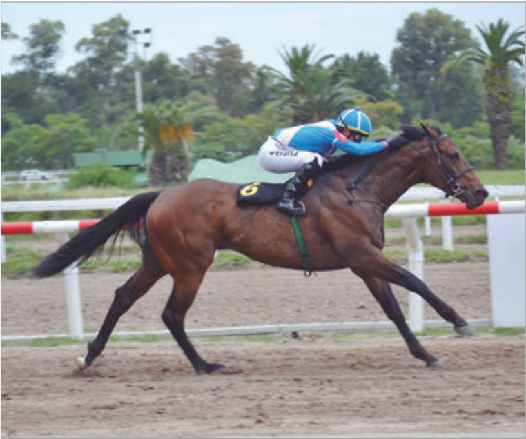
Buen estreno en esta pista. Melancólica bajó por primera vez a esta pista y fue con victoria

Abiertos los partidores, y tal su manera de correr, Jalimba salió