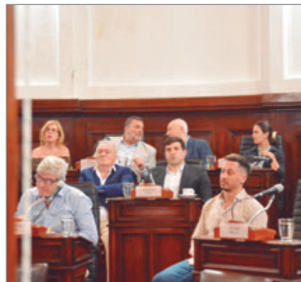
La suba promedia el 30%

El paquete impositivo fue convalidado por