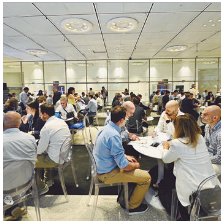
En la Sala Ginastera del Teatro Argentino

Del encuentro participaron también autoridades provinciales, intendentes de distintos municipios, representantes de organismos culturales y artistas invitados, consolidando un espacio de debate estratégico para el desarrollo cultural bonaerense.