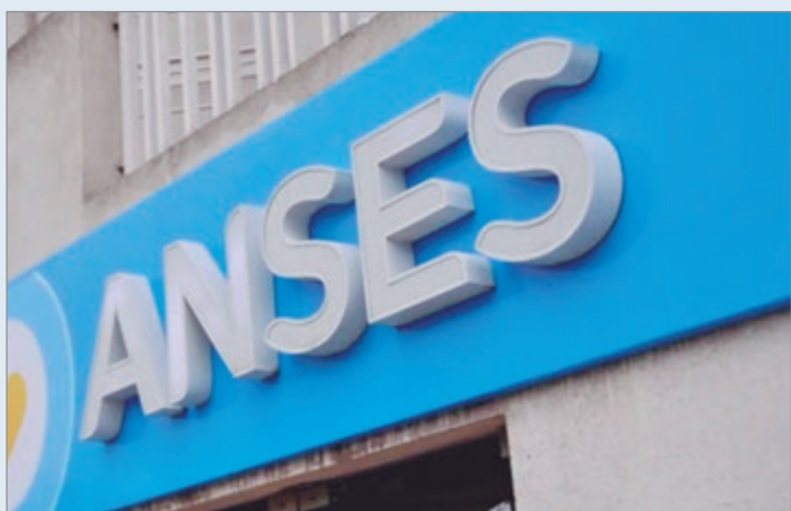
El organismo aplicará la suba junto al pago del bono extraordinario