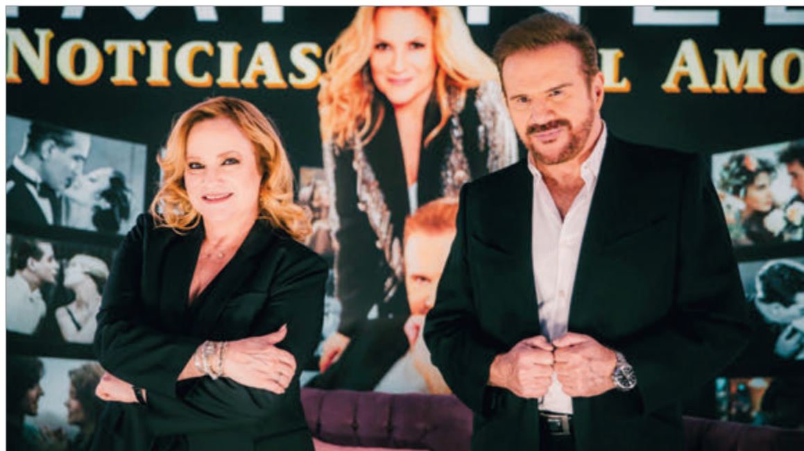
La dupla en la conferencia de prensa en la que estuvo Hoy

—JG: Yo, personalmente, que no piense en el éxito, que piense en la oportunidad que tiene de poder estar haciendo algo que le gusta. Es decir, concentrarse en eso, en la concentración, vamos a llamarlo, en su creación, en el producto, en la canción, concentrarse en eso, y no esperar el resultado. Creo que eso es muy importante. Creo que rodearse de gente que les haga bien, que es fundamental el retorno, la conexión del amigo más íntimo, y luego ser agradecidos, tratar de hacer algún mindfulness , tratar de conectarse interiormente, creo que es importante eso, que es fundamental, no esperar el trabajo. Sentir que están mejorando cada día, pero sin tocar el resultado, porque ahí empieza la competencia con uno mismo y con el entorno. Eso lo recomiendo, entonces,