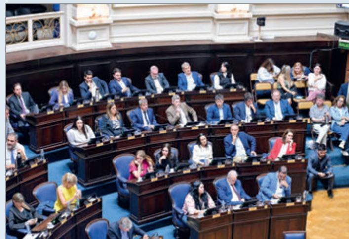
Oficialismo y oposición se enfrentaron en redes tras fracasar la sesión en Diputados

La discusión, trasladada a las redes sociales, convirtió la sesión caída en un escenario de confrontación donde cada bloque buscó instalar su relato.