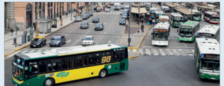
El Gobierno provincial oficializó un aumento extraordinario que llevará el mínimo a más de $600 en el AMBA

Vale mencionar que, previo a la oficialización, el Gobierno bonaerense sometió la propuesta a una Consulta Ciudadana, con el fin de garantizar el derecho de los usuarios a expresarse y acceder a información adecuada sobre la medida.