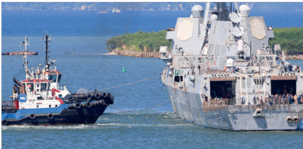
Tiene el objetivo de monitorear actividades dentro y fuera del país

Así lo confirmó la primera ministra de Trinidad y Tobago, Kamla Persad-Bissessar. El mismo se encuentra próximo a la costa de Venezuela