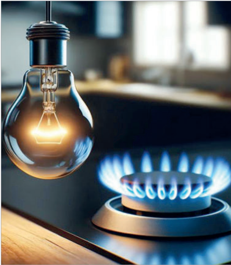
El plan de Javier Milei impulsa un esquema que reduce subsidios y tensiona la economía familiar

En electricidad, los hogares subsidiados tendrán una bonificación del 50% siempre que no superen los 300 kWh en invierno y verano, y los 150 kWh en primavera y otoño. Si se exceden esos límites, el costo adicional deberá pagarse sin descuento. Hasta ahora, los usuarios de bajos ingresos tenían bonificado todo el consumo de hasta 350 kWh mensua-