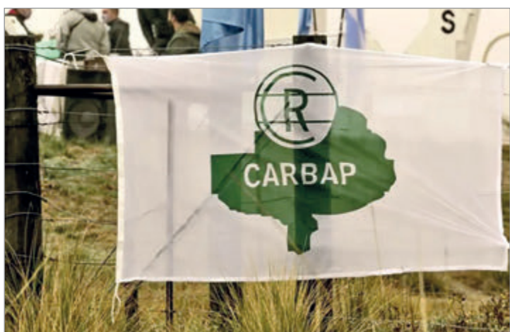
La entidad rural cuestionó gasto político y el gobierno defendió su esquema fiscal