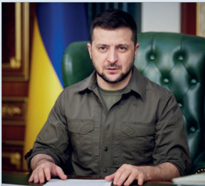
Se trata de Andriy Yermak

El presidente ucraniano, Volodymyr Zelenski, anunció ayer la dimisión de su jefe de gabinete, Andriy Yermak, después de que las autoridades anticorrupción del país registraran durante la mañana su departamento y la oficina de Yermak en el marco de una de sus investigaciones. “Siempre tuvo una posición patriótica”, dijo Zelenski en un discurso a la nación sobre el desempeño en los contactos con Estados Unidos de Yermak, que lideró la delegación ucraniana en las últimas reuniones con emisarios de la Casa Blanca. “Pero quiero que no haya rumores ni especulaciones”, agregó. El presidente ucraniano anunció que representantes de los servicios de inteligencia, del Ministerio de Exteriores, del Ejército y del Consejo de Seguridad Nacional que integraban junto a Yermak el equipo negociador seguirán representando a Ucrania en la próxima reunión con los estadounidenses.