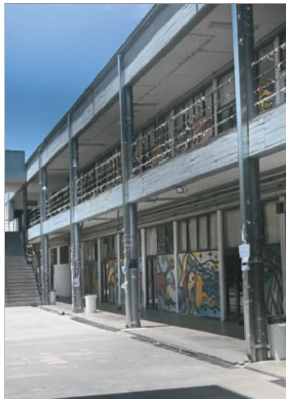
La Facultad de Artes cerró sus puertas

Según indicaron fuentes del caso semanas atrás cuando comenzaron a aparecer estas amenazas, “no hay evidencia de la existencia del grupo en Argentina, sí en Estados Unidos, donde se arrestó a algunos de sus