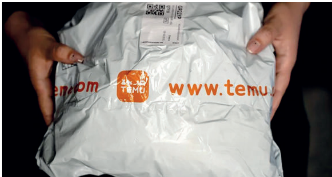
Alarma por el aumento exponencial de las importaciones

Las compras al exterior realizadas por plataformas ya sumaron cerca de 700 millones de dólares entre enero y octubre de 2025