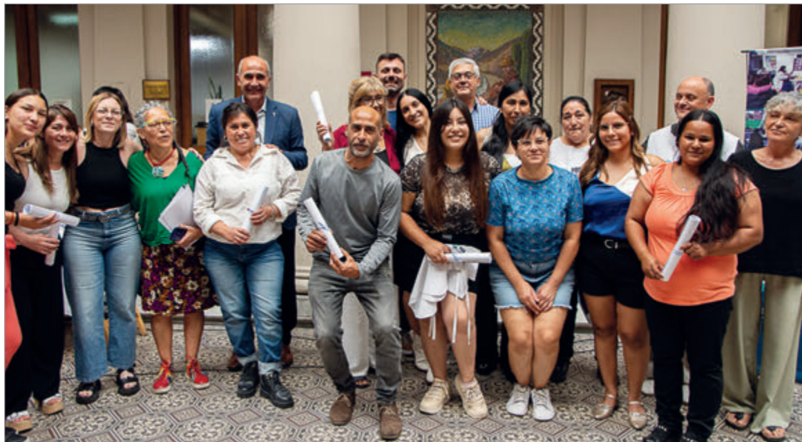
El evento que tuvo lugar en el patio del Rectorado

La Universidad Nacional de La Plata celebró la graduación de una nueva camada de promotores y promotoras de la salud, formados en territorio y con una mirada integral, comunitaria y de derechos