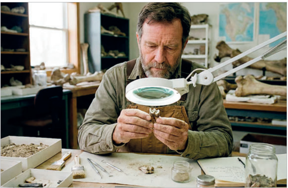
Reconstrucción del mamífero que recibió el nombre de Notopolytheles joelis

Investigadores del Conicet identificaron en Chubut un diminuto diente fósil que permite probar que una especie extinta habitó el sur de Argentina