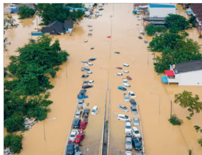
Hubo más de 400 fallecidos

Vale recordar, que los países del sudeste asiático suelen sufrir inundaciones y deslizamientos de tierra durante la temporada de lluvias, que se extiende de noviembre a abril. Esta vez, las precipitaciones monzónicas se agravaron por una tormenta tropical que golpeó la región. El cambio climático ha hecho que las tormentas sean más severas, con lluvias torrenciales, crecidas súbitas y vientos más violentos.