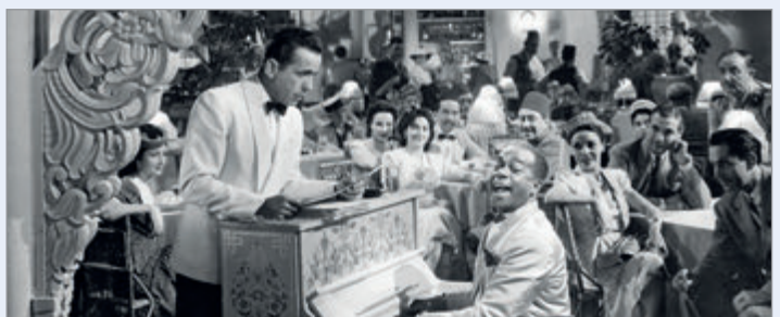
El café de Rick en Casablanca, un lugar de película

la resistencia checa. La historia se desarrolla en torno a la lucha interna de Rick, quien debe decidir entre ayudar a Laszlo o recuperar a Ilsa. Para los amantes del cine, se trata de una de las historias de amor más icónicas. Un amor trágico y apasionado marcado por la nostalgia y la imposibilidad. Pese a que muchos sueñan con poder visitar aquel sitio, ese mítico local venerado en la pantalla fue en realidad un decorado creado en un estudio de Hollywood. Aunque el Rick's Café es un lugar ficticio, hay un restaurante en Casablanca, Marruecos, que se inspiró en la película y lleva el mismo nombre. Fue inaugurado en 2004 y recrea la atmósfera y la decoración de la película, con un piano bar y música en vivo.