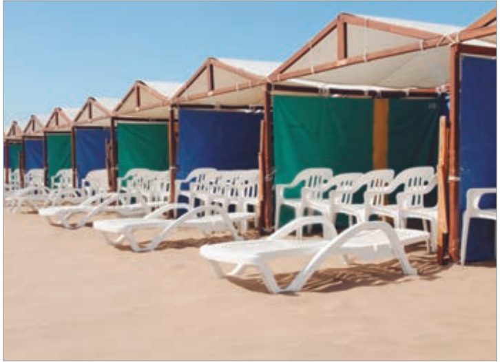
Precios que varían según las zonas

Por su parte, Pinamar y Cariló continúan liderando el ranking de precios más altos. Con valores en muchos casos dolarizados, el alquiler diario oscila entre $70.000 y $100.000, mientras que los mensuales rondan los $1.500.000, reflejando una temporada marcada por la segmentación del turismo y el impacto de los costos en el descanso frente al mar.