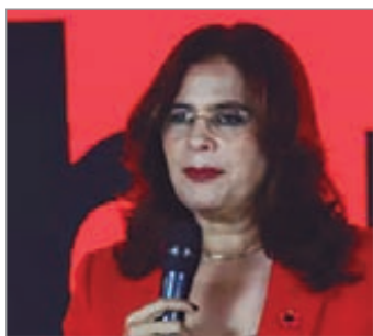
Rixi Moncada, candidata a presidenta de Honduras por el oficialista Partido Libre