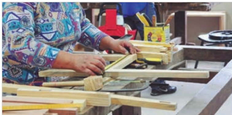
La precarización laboral avanza con Milei

régimen del monotributo crecieron, se redujo la cantidad de puestos de trabajo registrados. Según cifras oficiales, desde noviembre del 2023 se perdieron más de 276 mil empleos