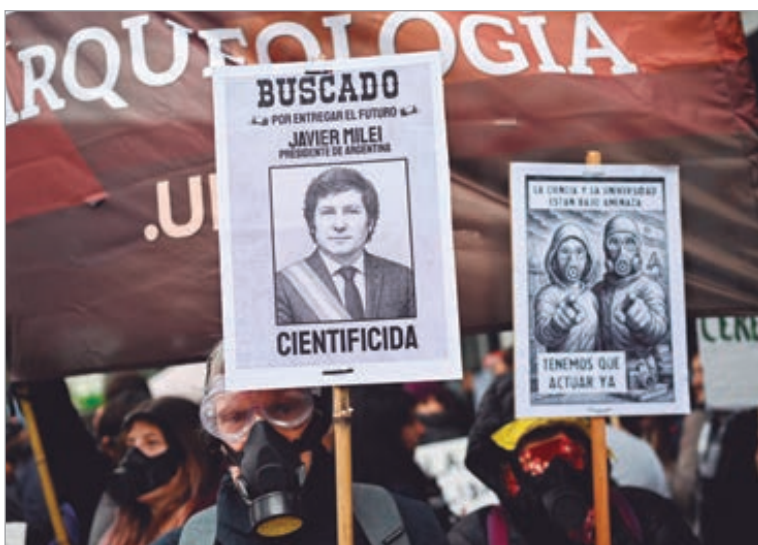
Investigadores advierten que el recorte del Gobierno amenaza proyectos, becas y laboratorios

La eliminación de los proyectos PICT, que durante años sostuvieron la diversidad de investigacio-