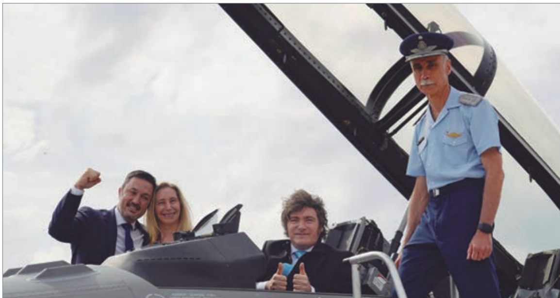
Milei encabezó el acto de presentación en Río Cuarto

Durante el evento, el Presidente estuvo acompañado del ministro de Defensa saliente, Luis Petri, quien está atravesando sus últimos días como titular de la cartera antes de dejársela al actual jefe del Ejército, Carlos Alberto Presti y asumir su banca en la Cámara de Diputados. También estuvieron presentes el titular de la Cámara de Diputados, Martín Menem; la secretaria de la Presidencia, Karina Milei; y de