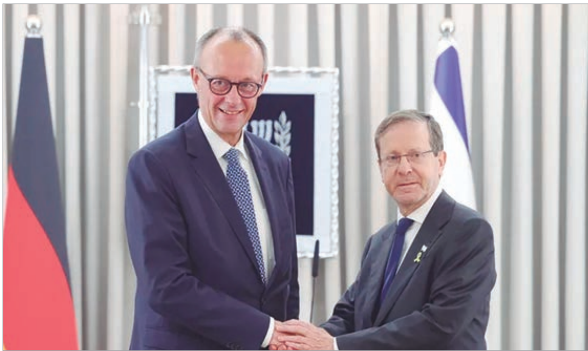
El canciller alemán, Friedrich Merz y el presidente israelí, Isaac Herzog

El canciller alemán, Friedrich Merz, cerró filas el día de ayer con Israel a su llegada a Jerusalén, donde se citó con el presidente israelí, Isaac Herzog, a quien trasladó su apoyo total pese a que las relaciones entre ambos países se tensaron meses atrás. “Está en nuestro ADN apoyar a Israel. Las acciones militares y las acciones del gobierno israelí nos plantearon un dilema. Tuvimos que reaccionar, pero tengan la seguridad de que seguimos estando de su lado. Israel tiene derecho a defenderse y a existir”, aseguró Merz a Herzog delante de los medios de comunicación, antes de iniciar su reunión privada.