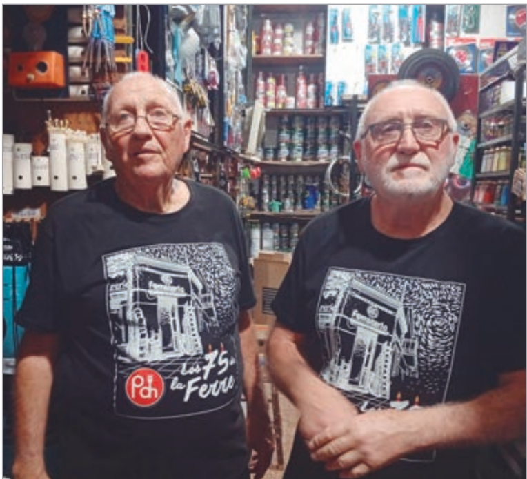
Los hermanos celebrando

“Con el paso de los años mi papá se fue quedando sordo y me empezó a necesitar y ahí empecé a ayudar.