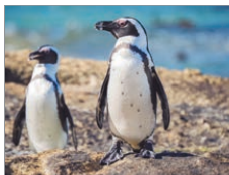
El pingüino africano está catalogado como en peligro crítico de extinción

Los pingüinos de El Cabo, Sudáfrica, se encuentran enfrentando su peor crisis en décadas. Un nuevo estudio realizado por la Universidad de Exeter y el Departamento de Bosques, Pesca y Medio Ambiente de Sudáfrica, cuyos datos fueron retomados por agencias internacionales, revela que más de 62 mil pingüinos africanos han muerto por