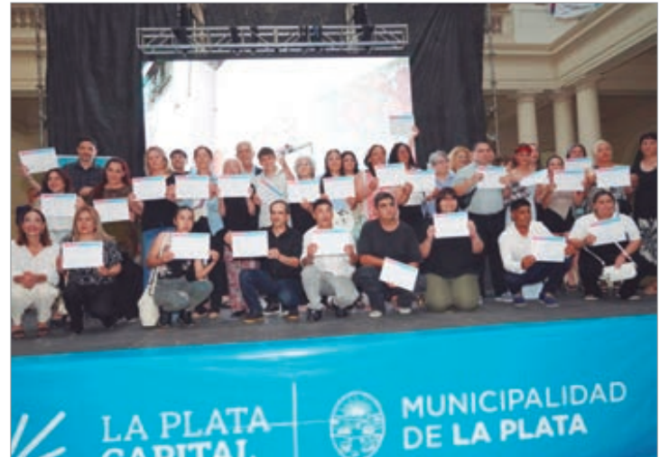
La entrega en el Pasaje Dardo Rocha

Los programas Fines, CENS y Cebas tienen como objetivo garantizar el derecho a la educación y ofrecer nuevas oportunidades de formación, fortaleciendo la inclusión y el desarrollo personal y comunitario de quienes deciden retomar o finalizar sus estudios.