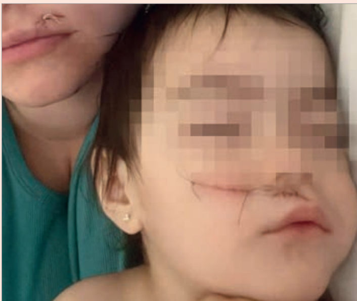
Así quedaron las víctimas

La madre afirmó que no es la primera vez que el joven ejerce violencia y sostiene que se trató de un intento de femicidio. También denunció amenazas contra la familia. La causa está caratulada como lesiones, pero piden que se recaracte como tentativa de femicidio. Interviene la UFI N°5 de La Plata.