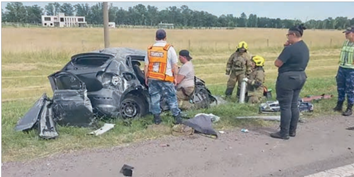
La zona de desastre

Viajaba desde La Plata y también resultaron heridos otros dos integrantes de la misma cartera que viajaban con él. Investigan lo sucedido