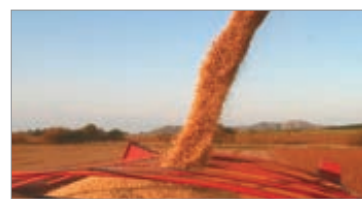
Siete de cada diez productores advierten que no es buen momento para invertir

1450 empresarios y 228 asesores de distintas regiones, deja en claro que la percepción dominante es de incertidumbre y falta de estímulos para apostar a nuevas inversiones. La planificación de la campaña agrícola 2025/26 confirma esa prudencia. Se proyecta un crecimiento del área de maíz tardío respecto al ciclo anterior y aumentos más moderados en girasol y maíz temprano, pero la soja será la gran perdedora. La oleaginosa sufrirá una reducción significativa de superficie, arrastrada por precios relativos desfavorables y condiciones de mercado poco atractivas.