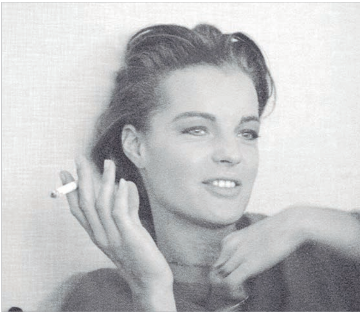
Romy Schneider fue una actriz de culto cuyo estilo marcó tendencia

En 1955 volvió a filmar con su madre, una muy exitosa saga de tres películas, Sissi , basada en una muy edulcorada versión de la adolescencia de Elizabeth de Austria, abundante de terciopelos y frivolidades aristocráticas. Los productores descubrieron que el rostro de esa ado-