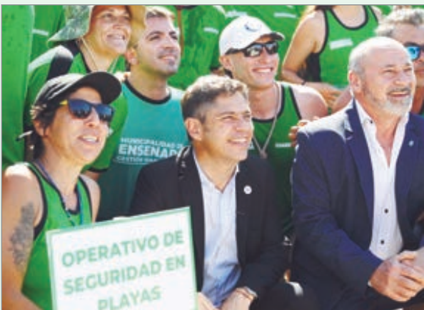
“Gracias a un Estado presente, Punta Lara es una opción pública y gratuita”