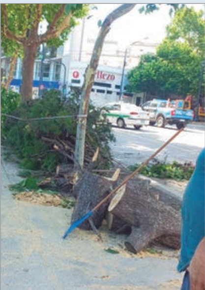
Los trabajos para sacar parte del ejemplar

Una escena de tensión se vivió en las primeras horas de este miércoles en la ciudad de La Plata cuando un enorme árbol cayó en las inmediaciones de Plaza Italia, a metros del monumento principal del tradicional paseo ubicado en la zona de diagonal 74 y avenida 7. El episodio ocurrió tras una madrugada marcada actividad eléctrica, tormentas, ráfagas de viento y elevados niveles de humedad.