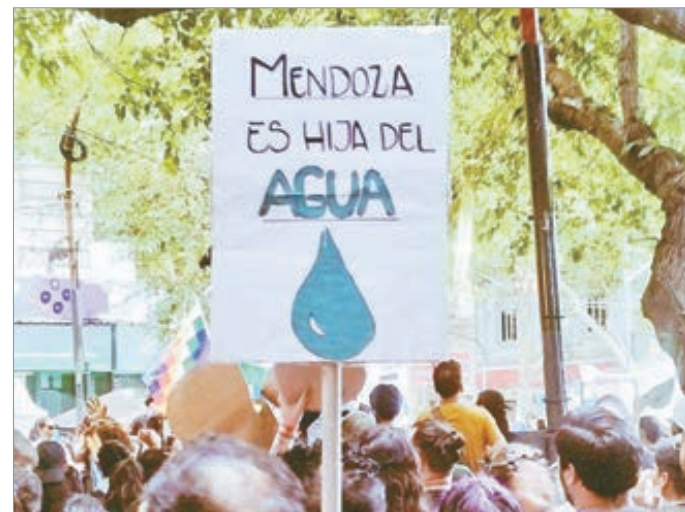
Ambientalistas rechazan el proyecto minero

Por su parte, Milei había hecho público su respaldo, y aseguró que la iniciativa "traerá una inversión de 600 millones de dólares". No obstante, aun restan varios pasos para concretar el proyecto.