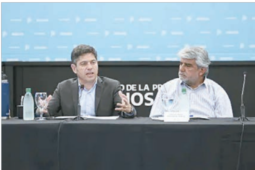
El mandatario bonaerense reafirmó que “el lugar de los pibes es la escuela”