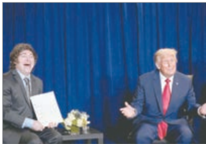
El presidente de EE. UU. dijo que el líder libertario estaba perdiendo hasta que recibió su apoyo

Las declaraciones del mandatario reavivaron la polémica sobre el rol de Washington en la política argentina y la dependencia del oficialismo de gestos externos para sostener legitimidad, intensificando la polémica en el escenario local.