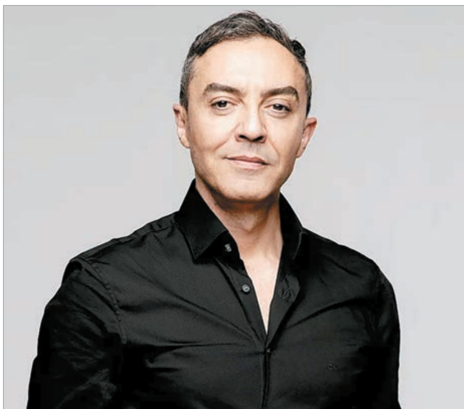
Es la segunda vez que se presentará con un espectáculo

—Es una sorpresa, yo no tenía previsto volver y menos con un espectáculo así, esto más que un espectáculo, si lo comparamos con el Miguel de Molina, con el que vine la vez anterior, no es un recital, es un espectáculo que he conformado precisamente pensando en el Picadero y el público de Buenos Aires, y donde voy a mezclar, he hecho un repertorio de copla, de tangos, de canción latinoamericana, de boleros, de esas canciones que, como yo digo, son canciones que yo siempre ya he interpretado, algunas no, pero que sí que forman parte de ese universo, ese acercamiento que he tenido siempre con la música latinoamericana.