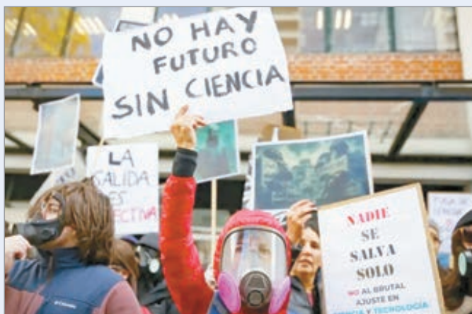
Nuevo ataque del gobierno al sistema científico