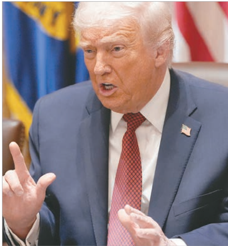
El presidente de Estados Unidos, Donald Trump

El gobierno de Trump, que no reconoce la legitimidad de Maduro en Venezuela y lo acusa de liderar el Cartel de los Soles, ha desplegado desde mediados de año una presencia militar sin precedentes en la región con el argumento de combatir el narcotráfico. Esa operación, bautizada como Lanza del Sur, ha destruido una veintena de lanchas supuestamente cargadas con droga en el Caribe y el Pacífico, matando de forma extrajudicial a más de 80 personas, a las que Washington acusa de "narcoterroristas". El propio Trump ha reiterado además en varias ocasiones que "pronto" comenzarán los ataques contra el narcotráfico dentro del territorio venezolano. A pesar de la tensión,