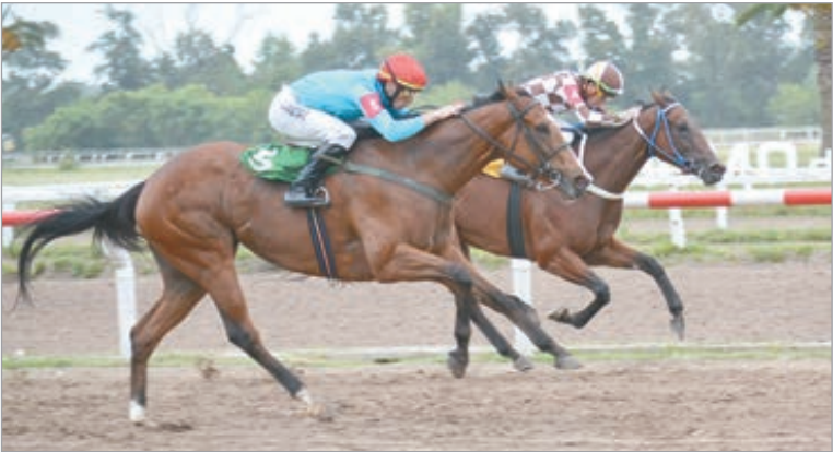
En su primera visita se hizo jerárquica. City Land dominó en el final a Puerta Plateada para lograr la mejor victoria de su campaña