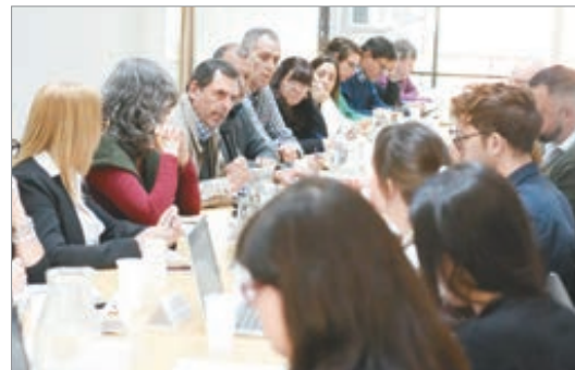
El FUDB reclamó al gobierno provincial un aumento salarial urgente y pidió reunión con Educación

El reclamo docente se inscribe en un cierre de año marcado por tensiones económicas y sociales, con la expectativa de que el Gobierno provincial defina si habrá un aumento que permita mitigar el impacto de la inflación en los salarios.