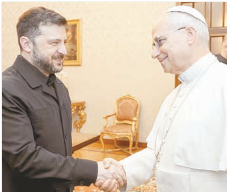
León XIV renovó el deseo "urgente" de llegar a la paz

Tras su reunión con el Papa, Zelenski tuvo un encuentro con la primera ministra de Italia, Giorgia Meloni, bajo el marco de una ronda de contactos con los principales líderes europeos sobre el proceso de paz en Ucrania.