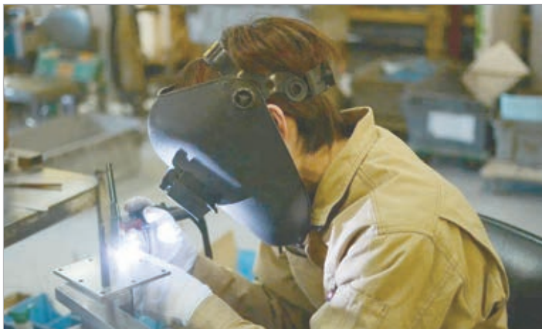
La industria volvió a marcar números en rojo

La actividad industrial se derrumbó 2,9% frente al 2024, que fue un pésimo año. En cuanto a la construcción, si bien mostró un leve repunte, sigue muy lejos del nivel del 2023