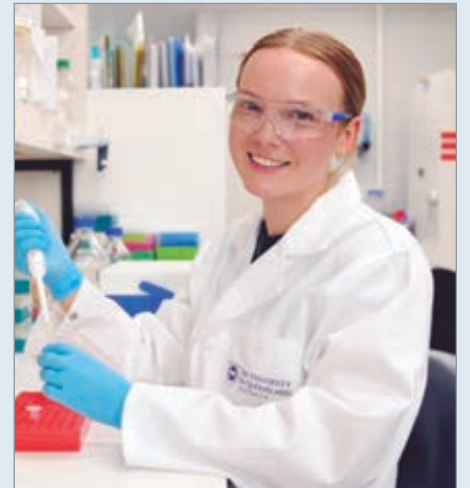
La obtención del mapa tridimensional completo del virus aporta nuevas claves

El estudio, realizado en colaboración con Monash University y otros centros de investigación de Australia y Estados Unidos, empleó criomicroscopía electrónica para mapear la arquitectura completa del virión de la fiebre amarilla. Hasta ahora, solo existían datos parciales sobre proteínas individuales del virus, pero no una visión global del virión maduro. Este mapa tridimensional permite comparar en detalle las características antigénicas de la cepa vacunal 17D con las cepas virulentas que circulan en la actualidad.