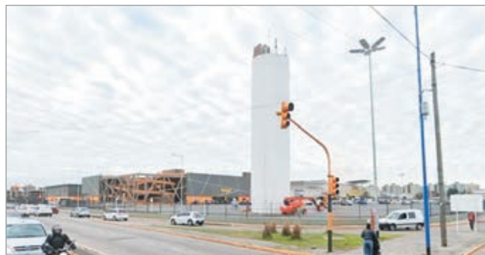
La zona del ataque

Por su parte, uno de los detenidos fue herido en el omóplato derecho y se encuentra estable en el Hospital Eva Perón de Lanús, mientras que otro sufrió una herida de arma de fuego en la pierna derecha cerca de la rodilla y estaba en el mismo centro de salud.