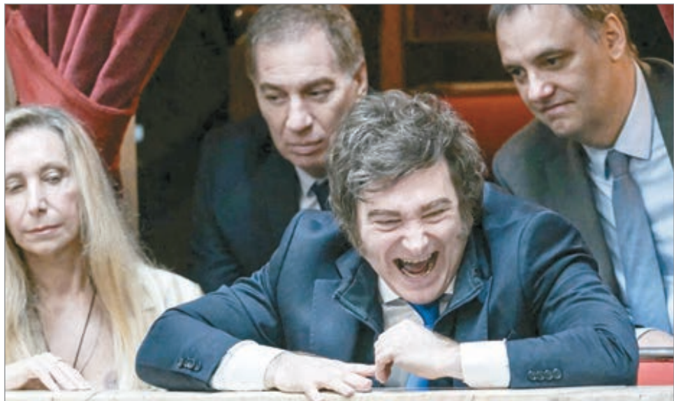
Milei impulsa su agenda con reforma laboral y dejando de lado las demandas previsionales y de las provincias

Entre las iniciativas que sí ingresarán al