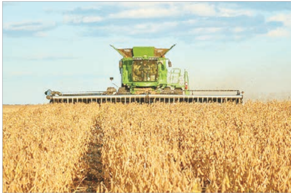
Caputo favorece nuevamente al sector agropecuario

En este camino, las alícuotas de la soja se reducirán del 26% al 24%, de sus productos derivados del 24,5% al 22,5%, del trigo y la cebada del 9,5% al 7,5%, del maíz y el sorgo del 9,5% al 8,5%, y del girasol del 5,5% al 4,5%.