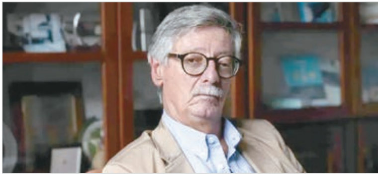
La querella cuestionó su objetividad y reclamó que otro fiscal asuma la investigación que involucra a Milei