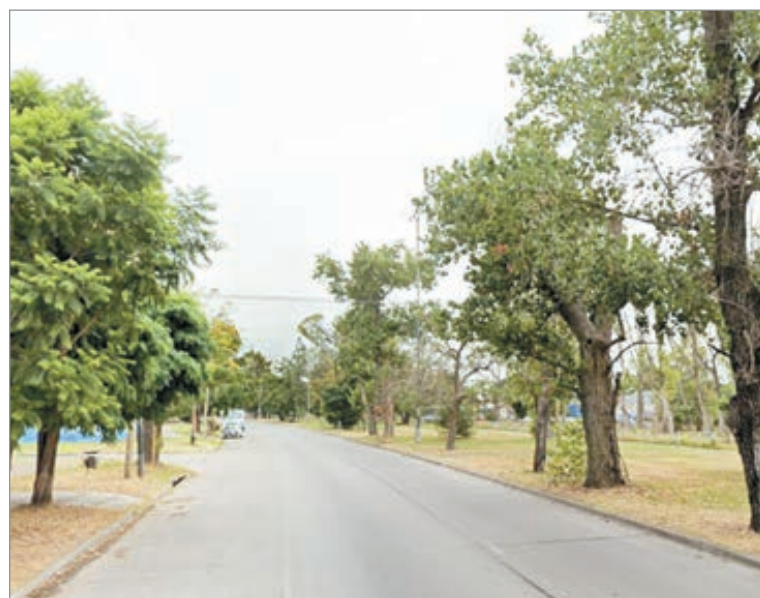
La zona del hecho

El hecho generó fuerte preocupación entre los vecinos, que volvieron a reclamar por mayor presencia policial en una zona que viene registrando reiterados episodios de inseguridad.