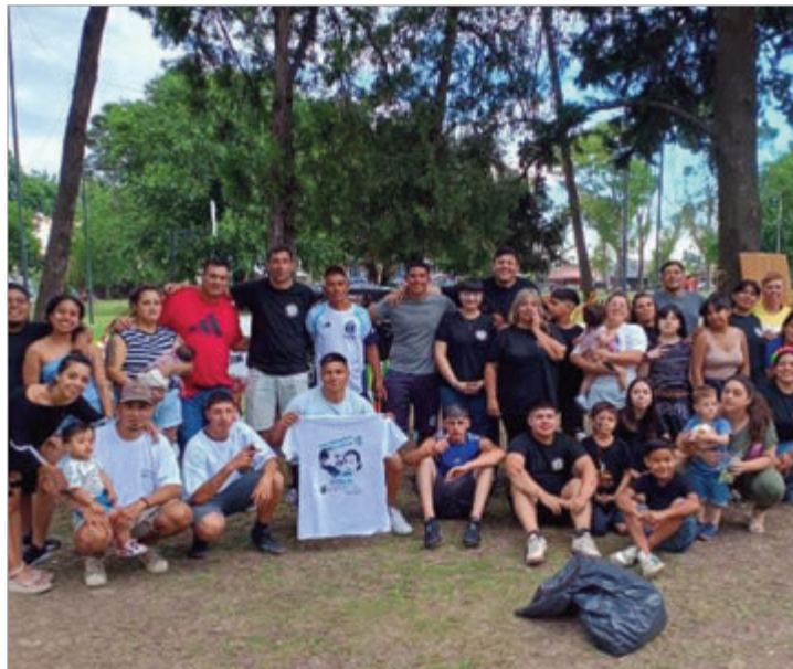
En el Polideportivo de 66 entre 151 y 152

El mismo Gómez encabezará esta semana el acto alusivo a los 25 años de Fecopeba, que es la federación de consejos pastorales evangélicos de la Provincia de Buenos Aires, que se llevará a cabo en la sala Astor Piazzola del Teatro Argentino el martes a partir de las 18.