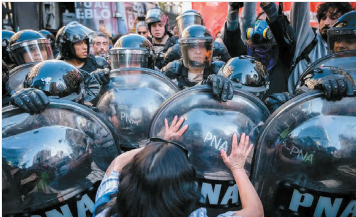
Organizaciones impulsan la anulación del Protocolo Antipiquetes.

Se cumplen dos años de la aplicación de Protocolo Antipiquetes y Amnistía Internacional publicó un duro informe al respecto