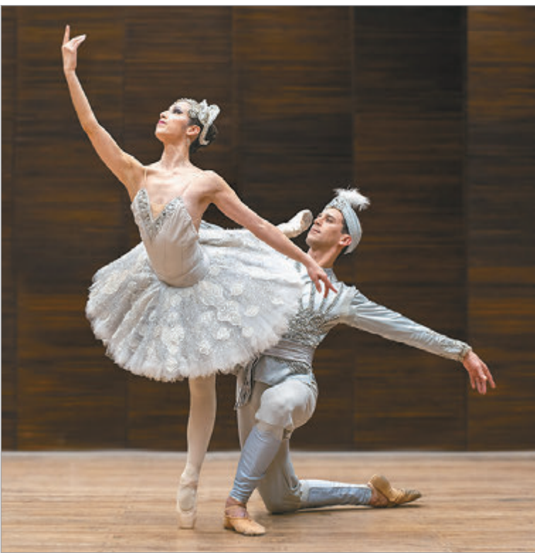
El ballet Estable en la Sala Ginastera

Con sala colmada, el Ballet Estable y la Orquesta Estable ofrecieron la primera función de la suite del clásico de Minkus y Petipa, repuesta por Edgardo Trabalón