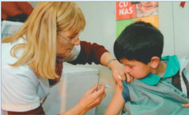
Drástica caída de la vacunación infantil