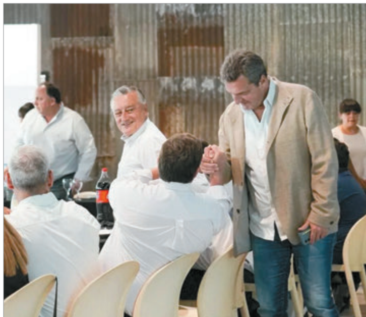
Massa también disputa dentro de la interna peronista

Con ese escenario, en el encuentro que encabezó Massa con intendentes, legisladores nacionales y provinciales y dirigentes del FR se realizó un balance de fin de año y una evaluación de la situación que atraviesan los municipios. También se delineó la hoja de ruta de cara al 2026, año en el que la fuerza espera reposicionarse dentro del entramado peronista.