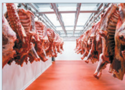
El precio de la carne volvió a escalar en noviembre y el consumo cae

El precio de la carne volvió a presionar la inflación de noviembre y consolidó una tendencia que se profundiza desde hace meses. Con ese marco, el consumo interno cayó a cuarenta y nueve kilos por habitante al año, en un escenario marcado por salarios rezagados y una producción que no acompaña el avance de la exportación. El stock ganadero permanece estancado en torno a cincuenta millones de