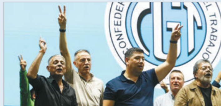
La CGT exige una mesa de debate con el Gobierno

A su vez, exigió que el Gobierno nacional tenga "la responsabilidad institucional" a llamar "a una mesa de negociación". "Nunca existió eso, nunca quiso dialogar con las contrapartes naturales que son el sector empresario y el sindical", arremetió el dirigente sindical.