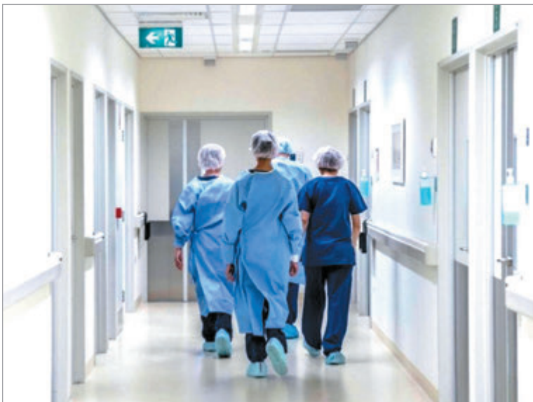
Alerta por la “libertad de matrícula” que propone Milei

En este sentido, la institución remarcó que la eliminación o debilitamiento de los Colegios Profesionales implicaría “la pérdida de organismos autogestivos esenciales para garantizar el control de la matrícula, la promoción de la ética, la vigilancia del ejercicio adecuado de la profesión y la defensa de estándares de calidad indis-