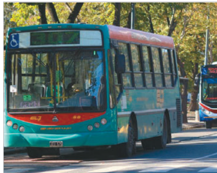
Desde enero aumentan las tarifas del AMBA y el ajuste vuelve a golpear a usuarios con salarios rezagados

El aumento simultáneo en todos los modos de transporte vuelve a plantear un escenario complejo para quienes dependen del sistema público para trabajar o estudiar. La combinación de ingresos rezagados y ajustes mensuales configura un panorama que no muestra señales de alivio.