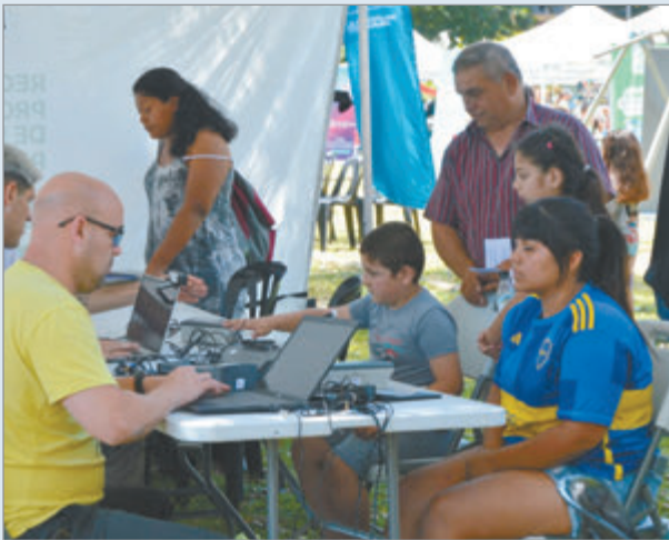
Las actividades se desarrollaron en el Parque Julio López

En Los Hornos se llevó adelante dos nuevas jornadas de "Nos vemos en el barrio", que le ofreció a la comunidad la posibilidad de acceder a trámites esenciales y recibir asesoramiento sobre diversos temas de interés. Las actividades se desarrollaron el jueves 11 y el viernes 12 de diciembre en el Parque Julio López, en 66 entre 151 y 152.