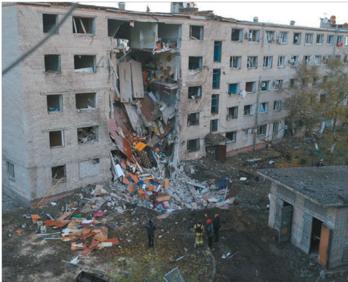
Rusia emplea más de 450 drones y 30 misiles Kinzhal

El Ministerio de Defensa ruso afirmó que la ofensiva se dirigió contra objetivos militares y energéticos, en respuesta a lo que calificó como "ataques terroristas de Ucrania contra objetivos civiles en Rusia"