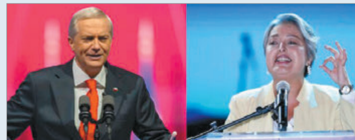
Poco más de 15.770.000 de personas están habilitadas a volver a las urnas este domingo

Jara, de 51 años, es militante del Partido Comunista de Chile y resultó ganadora de las primarias de la "Unidad por Chile", una coalición de los siguientes partidos: el Partido Socialista de Chile, Frente Amplio, Partido Comunista de Chile, Partido Demócrata Cristiano, Partido Liberal de Chile, Partido por la Democracia, Partido Radical de Chile e Independientes.