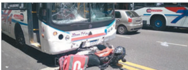
El lugar del hecho

Efectivos policiales de la Comuna 15 concurrieron al lugar y solicitaron la presencia del SAME, cuyo personal de salud constató las lesiones del motociclista. En este sentido, se determinó el traslado del paciente al Hospital Pirovano por politraumatismos, mientras que el vidrio delantero del rodado de mayor porte quedó destruido.