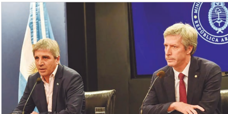
Las bandas cambiarias se actualizarán por inflación

La medida busca mejorarle la competitividad al peso, en medio de profundas y variadas críticas de bancos, inversores y economistas por el atraso cambiario. “Dado que el ritmo de deslizamiento de las bandas no se ajusta por la inflación de Estados Unidos, el techo de la banda se incrementa en términos reales a lo