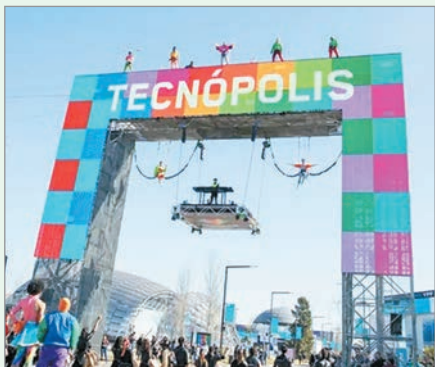
La Casa Rosada formalizó el llamado a licitación para concesionar el predio por 25 años

El Gobierno avanzó con la privatización de Tecnópolis y publicó el llamado a licitación para concesionar el predio por 25 años. El esquema prevé que la administración privada comience en julio de 2026 y que el adjudicatario pague un canon mensual inicial de 611 millones de pesos,