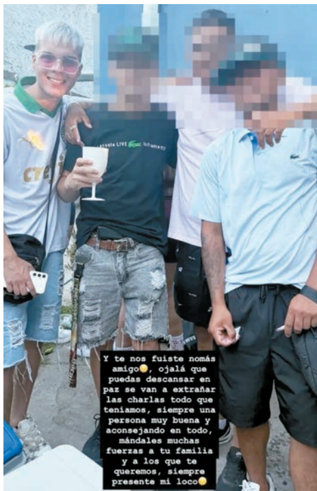
ción de autopsia.

Fue trasladado hasta el policlínico San Martín, en estado crítico y desesperante, y pronto se notificó que sufría muerte cerebral, con estado irreversible. Horas después perdió la vida y su cuerpo fue sometido a la correspondiente opera-