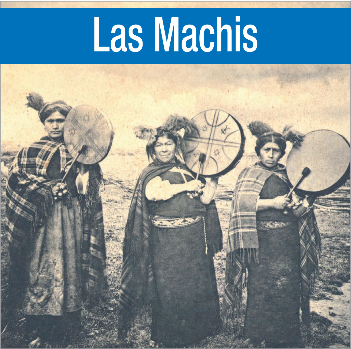
Las machis son figuras centrales en el pueblo indígena mapuche.

A partir del rol de la machi que se atribuye por el peuma (sueño), subyace su conocimiento especializado de la sanación, a través de enfermedades que son causadas por wekufu, energía negativa, se extirpa el mal que se presenta físicamente en forma de objetos o animales, la machi realiza la ceremonia conocida como machitun. Asimismo, las machi posee la visión y orientar a la comunidad en el sentido moral, y se re establece el equilibrio entre el individuo y la comunidad, así mismo la machi es una figura dominante y trascendente dentro de la cultura mapuche, pues es quien conectaría los mundos, mapu, el mundo físico, wenu mapu y anka wenu, a través del rewe, altar de la ascensión, y el trance, catalizado en el ritmo del kultrun, y que impli-