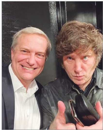
Kast visitará este martes el país

“Estoy seguro de que vamos a trabajar juntos para que América abrace las ideas de la libertad y podamos liberarnos del yugo opresor del socialismo del Siglo XXI”, expresó el líder libertario en X luego de conocerse el triunfo de Kast.