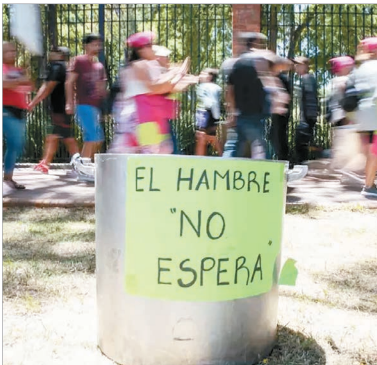
El informe de la PIA expone fallas estructurales en la gestión de Pettovello

Entre las observaciones más relevantes, el informe menciona inconsistencias en los datos de stock, diferencias entre planillas oficiales y registros judiciales, remitos sin firmas de recepción y ausencia de documentación clave para seguir el recorrido de los productos. La Procuraduría remarcó que el propio Ministerio reconoció que no existen manuales ni procedimientos formales que regulen la distribución, un