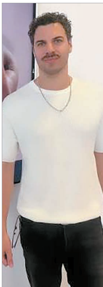
La Revista... vuelve en breve