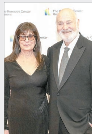
Estaban juntos desde 1989