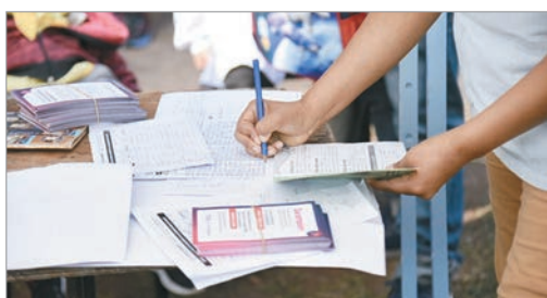
Controles y atención gratuita en los barrios

En tanto el jueves 18 de 9:30 a 13:00 se encontrarán en Amanecer de los Abuelos de 4 bis entre 612 y 613, en Villa Elvira. Y el viernes 19 de 9:30 a 13:30 en la Plaza de la Madre de 137 y 60, en Los Hornos va a estar realizando vacunación de calendario y lo mismo en UTT, sede central en 197 entre 32 y 38, de Abasto.