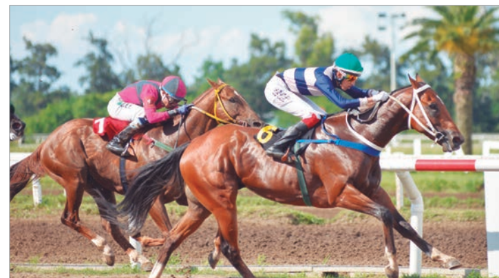
Va por la revancha. Oro Azteca viene de perder por "nada" contra Arrosto y esta tarde va por la victoria

Se viene una carrera que hará temblar al cronómetro. Hagan juego...señores!!!