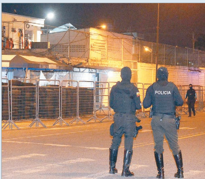
Fallecieron 15 personas

El Servicio Nacional de Atención Integral a Personas Adultas Privadas de la Libertad y a Adolescentes Infractores (SNAI) de Ecuador informó que 15 reclusos de la prisión del Litoral fueron encontrados muertos entre el pasado jueves y domingo. Las autoridades agregaron que los cuerpos no presentaban signos de violencia y que los servicios de medicina legal se encuentran realizando las autopsias, por lo que los exámenes forenses permitirán esclarecer si los decesos se produjeron por factores naturales, enfermedades o hechos violentos.