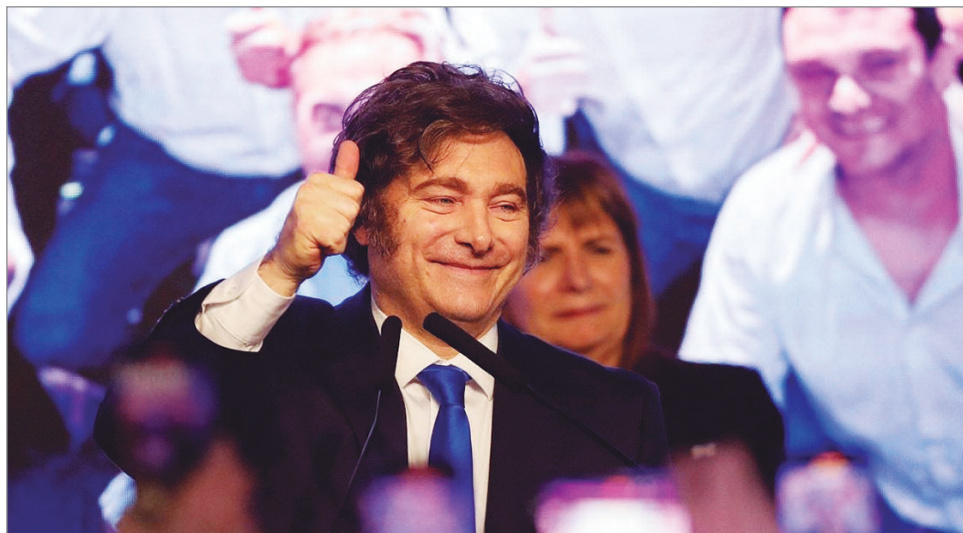
La reforma le perdona $1,75 billones a las 144 empresas más grandes del país

turan por encima de los 15.000 millones de pesos, significa 1,75 billones de pesos que dejará de percibir el Estado argentino.