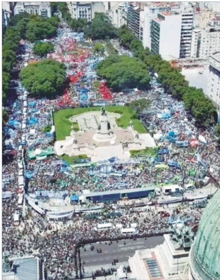
La protesta del 18D se amplía y el oficialismo busca sostener el ritmo legislativo

En vísperas del debate legislativo, el Gobierno enfrenta dificultades para ampliar apoyos y decidió dejar afuera de la discusión a los gobernadores alineados al kirchnerismo. El Ejecutivo admitió que no habrá reuniones con Axel Kicillof, Ricardo Quintela, Gillo Insfrán ni Gustavo Melella por la ausencia de puntos de conexión política.