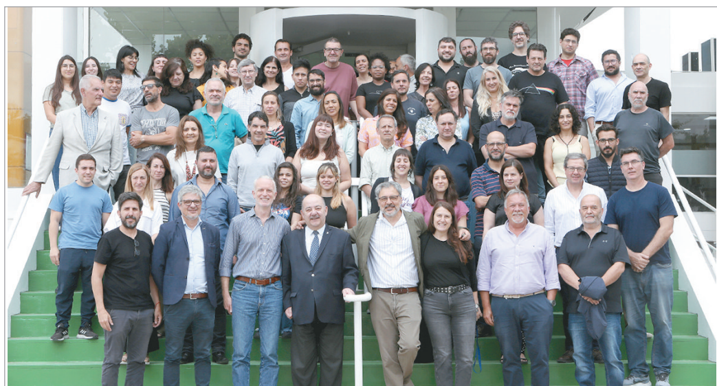
El acto contó con la presencia de autoridades académicas

miento, Obras y Servicios detallaron que la intervención abarcó más de 5.000 metros cuadrados del edificio original y sus anexos. Las tareas respondieron al notable desgaste de las instalaciones, el mobiliario y las tecnologías, producto de más de 50 años de uso continuo y de sistemas que demandaban un mantenimiento costoso y poco eficiente.