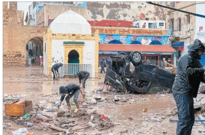
Sucedio al suroeste del país

En septiembre del año pasado, el sur y el sureste del país también registraron importantes inundaciones a causa de la lluvia, que se saldaron con la muerte de 18 personas. Yendo más atrás en el tiempo, en noviembre de 2014, al menos 32 personas murieron en el sur tras unas intensas precipitaciones, que provocaron desbordamientos de varios ríos a los pies de las montañas del Atlas.