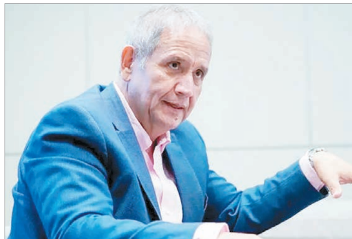
El titular de la Asociación Bancaria afirmó que el proyecto oficial recorta derechos y debilita la negociación colectiva

El dirigente remarcó que la discusión se da en un contexto de caída del empleo y cierre de pymes. En ese escenario, sostuvo que avanzar con una reforma que reduce protecciones laborales profundiza la vulnerabilidad de quienes ya enfrentan un mercado de trabajo inestable.