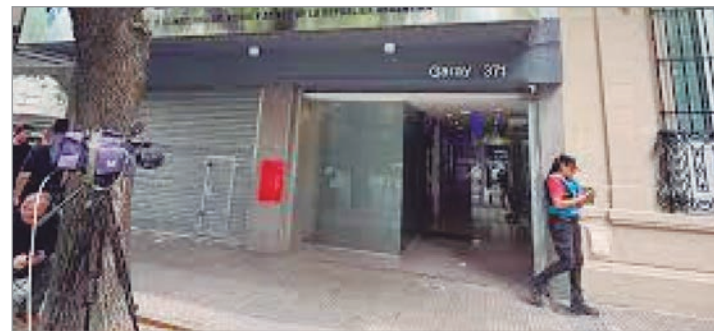
La sede del Seivara fue destruida en un hecho que el gremio lee como intimidación en la previa a la marcha

El gremio considera que estos hechos buscan erosionar la presencia sindical en la calle y generar un clima adverso en la previa de la marcha. La conducción insiste en que la unidad del movimiento obrero será determinante para enfrentar un escenario que se vuelve más áspero a medida que se acerca el 18D.