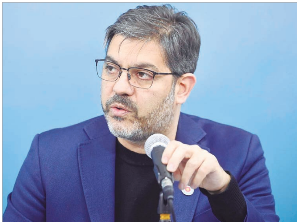
“El de Milei es el gobierno que más se ha endeudado”