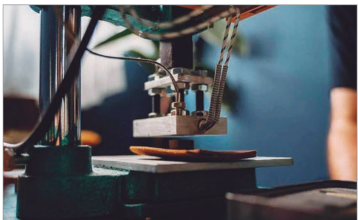
La caída de la industria golpea al AMBA

Consultado por diario Hoy sobre el turismo de cara al verano, calificó de la situación como “crítica”: “Venimos de dos temporadas muy malas y de fines de semanas largos que no estuvieron a la altura. Desde la Provincia acompañamos al sector, pero no podemos cambiar el sistema de variables macroeconómicas”. En este sentido, apuntó contra el gobierno de Milei por un tipo de cambio que favorece el turismo emisivo y perjudica los destinos locales, y que no bajó la inflación “como lo había prometido”.