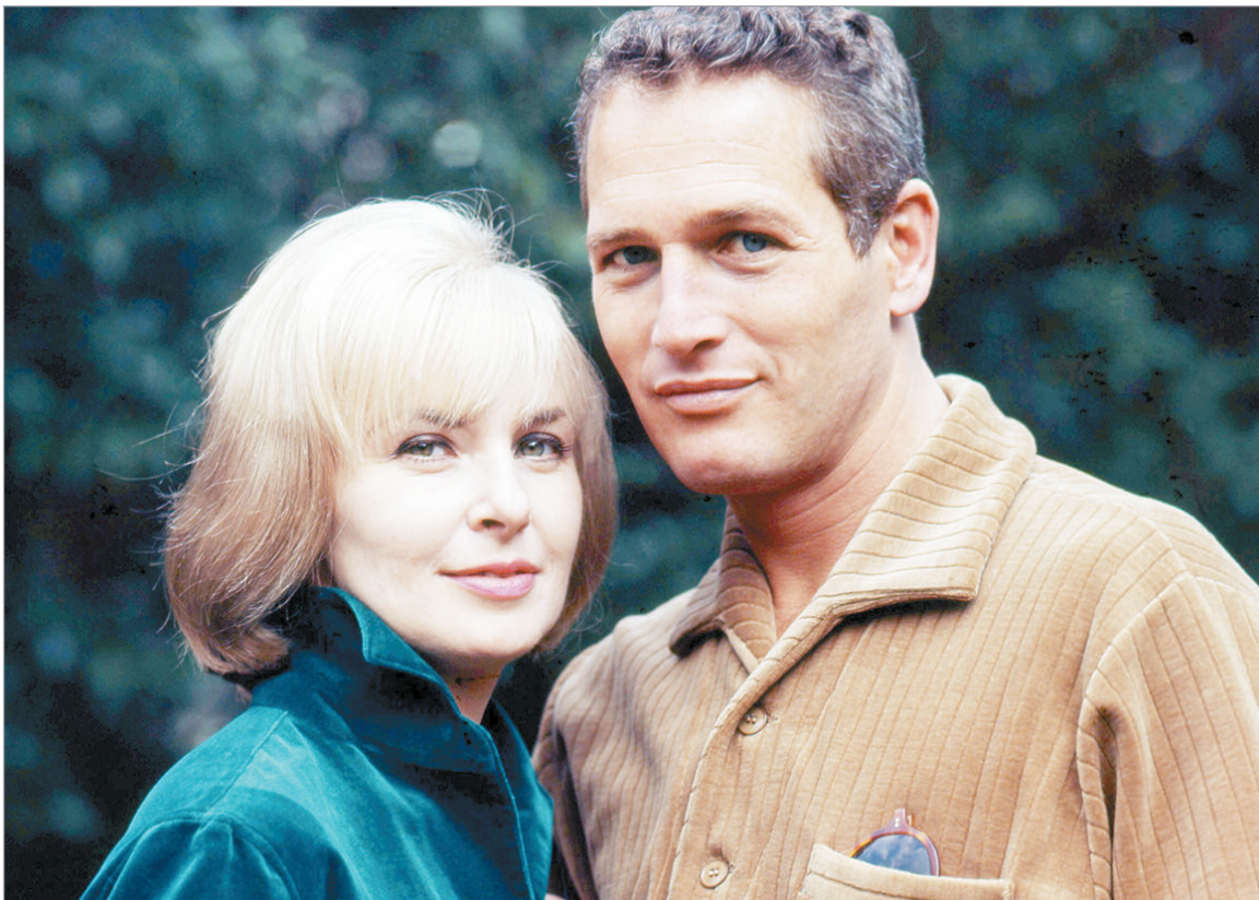
Newman y Woodward, la historia de una pareja de ensueño entre Hollywood y Cannes

había hecho otras obras y aparecido en varias series televisivas.