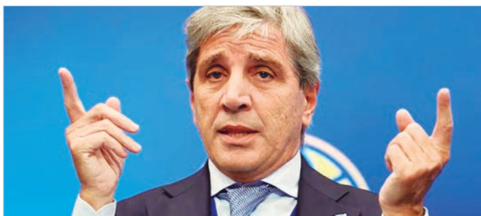
El ministro sostiene el nuevo esquema de bandas pese a señales que tensionan su relato desinflacionario

La explicación llega en un contexto donde la inflación mensual sigue lejos del umbral que promete y donde el mercado observa con cautela un régimen que se redefine sobre la marcha. Caputo proyecta un proceso de desinflación sostenido y anticipa un crecimiento que ubica entre cuatro y ocho por ciento para 2026, estimaciones