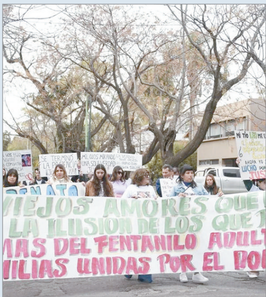
Familiares de las víctimas

Los familiares de víctimas de fentanilo contaminado, producido por los laboratorios HLB Pharma y Ramallo S.A. del empresario Ariel García Furfaro, realizaron una nueva marcha para continuar con el reclamo de justicia y que la causa no cese.