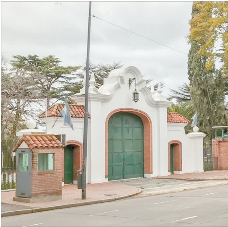
La residencia presidencial

Custodios de la Quinta, el jefe de la seguridad residencial y personal de la DUOF San Isidro trabajaban en la escena del hecho,