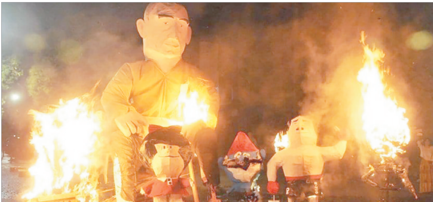
La región se preparaba para la tradicional quema de muñecos

el objetivo de que se cumplan los estándares establecidos en materia de prevención, será requisito contar con la autorización de la Secretaría de Control Urbano y Convivencia para la quema.