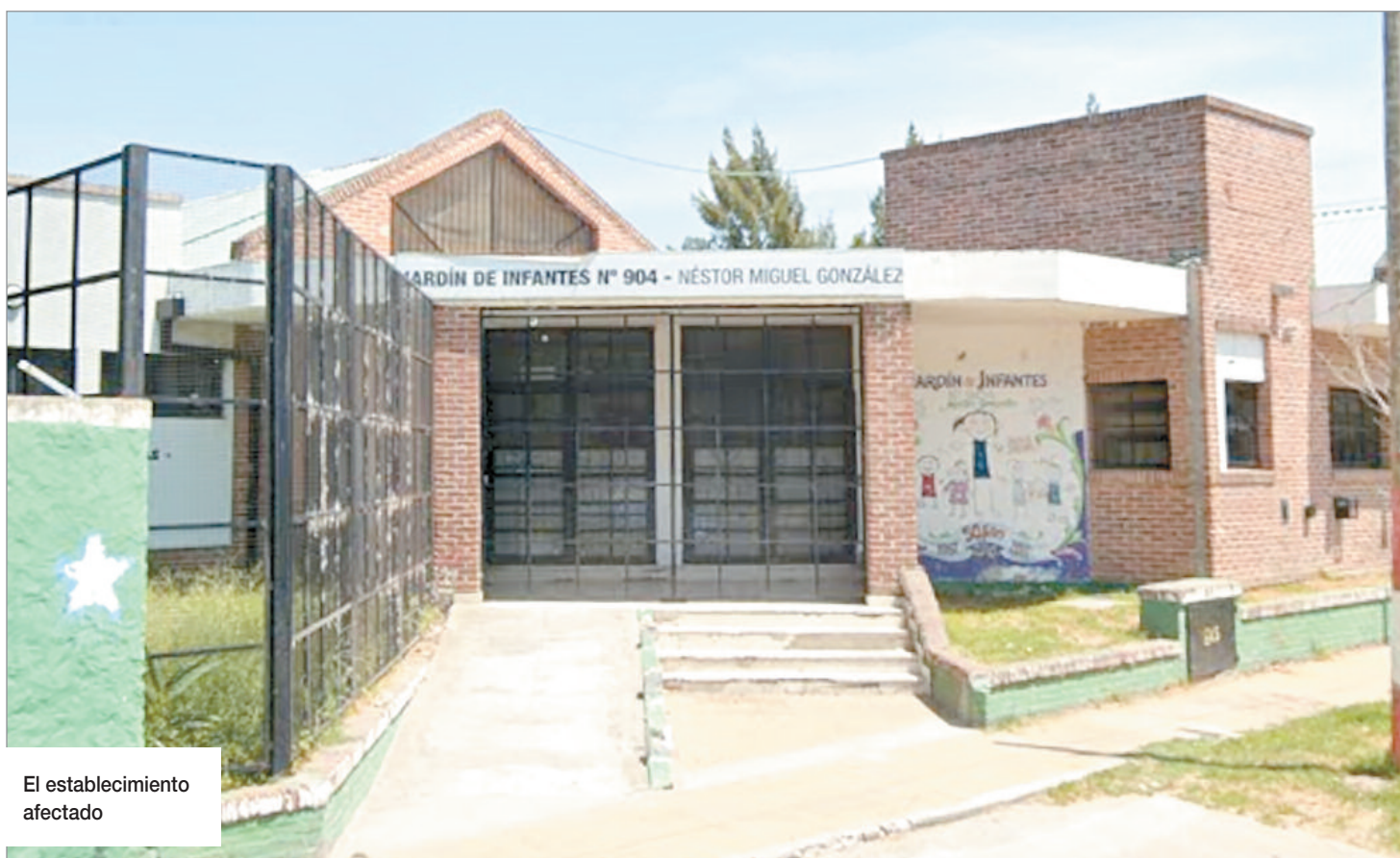
El establecimiento afectado

Las cámaras de seguridad instaladas en el predio lograron registrar movimientos sospechosos en el techo del jardín, donde se observó a al menos dos personas desplazándose durante la madrugada. Según las primeras averiguaciones, serían tres los involucrados en el robo, quienes ya fueron identificados y son intensamente buscados por la Policía.