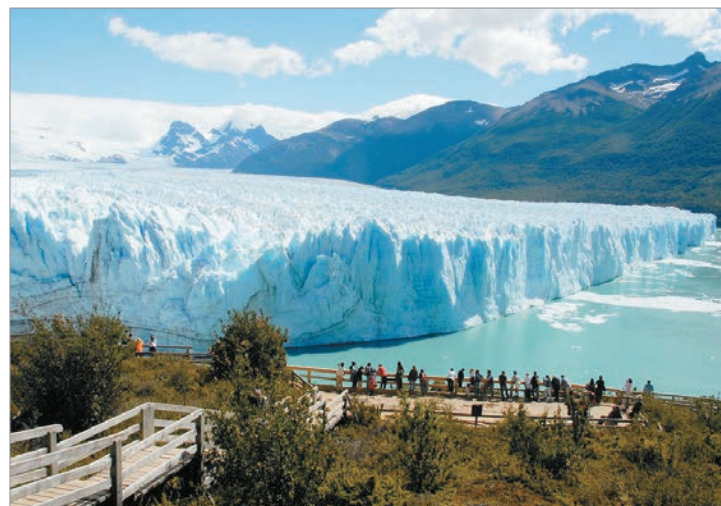
Organizaciones alertaron por la modificación

Greenpeace y otras organizaciones alertaron que esta redefinición implica un retroceso en la protección de reservas estratégicas de agua dulce. Señalan que muchos glaciares pequeños y ambientes periglaciares quedarían fuera del resguardo legal, lo que habilita proyectos mineros en zonas críticas.