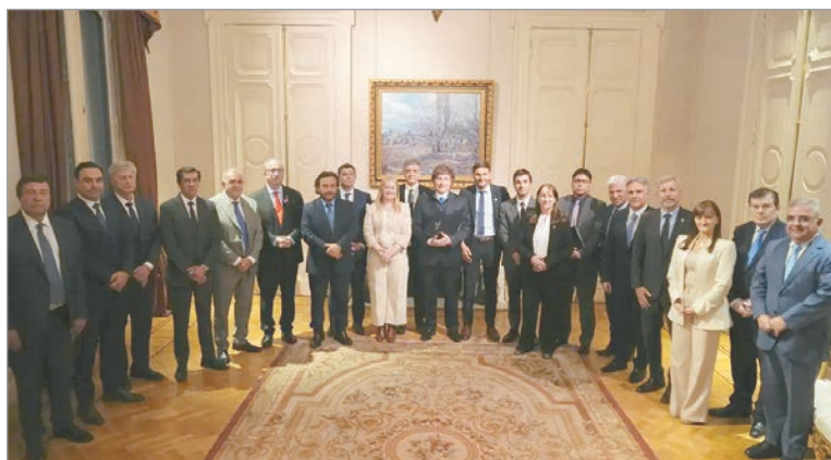
Bochornoso reparto de ATN a provincias aliadas

Para tener referencia, antes de recibir los 20 mil millones de pesos, desde Nación habían girado a Tucumán 15 mil millones entre enero y noviembre, lo que totaliza 35 mil millones en todo el año. Otros casos