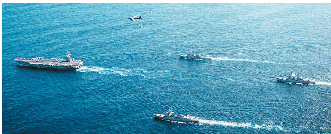
Ya son más de 25 los ataques a estas embarcaciones

La operación, enmarcada por el gobierno de Estados Unidos como una lucha contra el narcotráfico, sucedió cerca de Colombia y dejó un saldo de ocho muertos