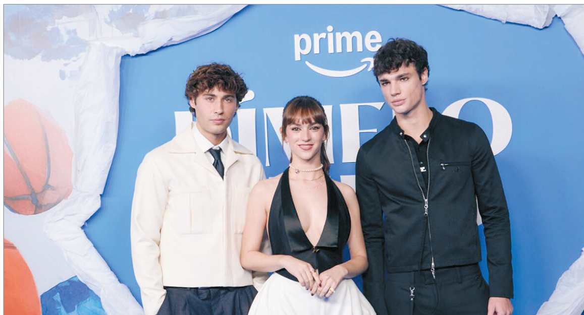
El trío ya es una sensación