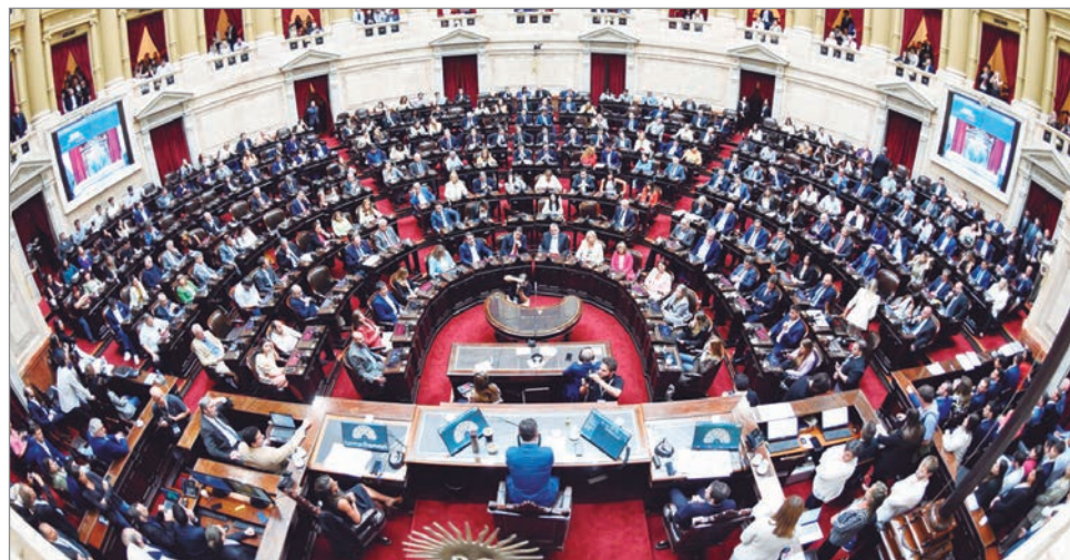
El oficialismo busca sostener apoyos y asegurar la media sanción

En paralelo al avance del dictamen, tomó fuerza la polémica por el artículo que elimina