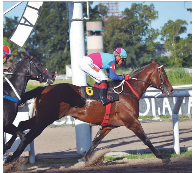
Volvió a la victoria. Payucano, de muy buena campaña, regresó a la senda triunfal postergando a Glorioso Rim