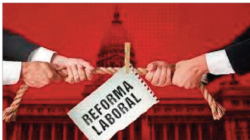
El PJ elaboró ocho puntos para contraponer a la reforma laboral

En el segundo eje hablan de la reducción de la jornada laboral para "conciliar la vida laboral, familiar y personal". Allí, proponen reducir la jornada laboral a un