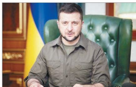
Se mantiene la incertidumbre sobre el acuerdo de paz

El presidente ucraniano, Volodimir Zelenski, explicó a medios ucranianos que el principal obstáculo para la paz es la exigencia rusa de que los ucranianos le entreguen toda la región del este de Ucrania, formada por las unidades administrativas de Lugansk y Donetsk,