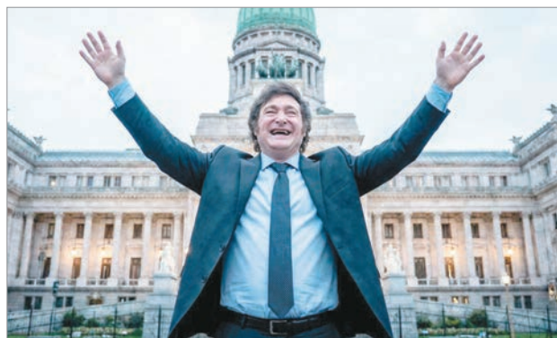
Continúa el rechazo a la reforma laboral

Por otra parte, la reforma también invierte uno de los principios básicos del derecho laboral: la presunción de existencia de una relación de trabajo. A partir del nuevo esquema, el uso del monotributo o los contratos de locación se considerarán relaciones civiles, incluso cuando en los hechos encubran vínculos laborales. "Es la legalización del fraude", sentencia el CETyD. En el mismo sentido, se excluye explícitamente a los trabajadores de plataformas digitales de la Ley de Contrato de Trabajo.