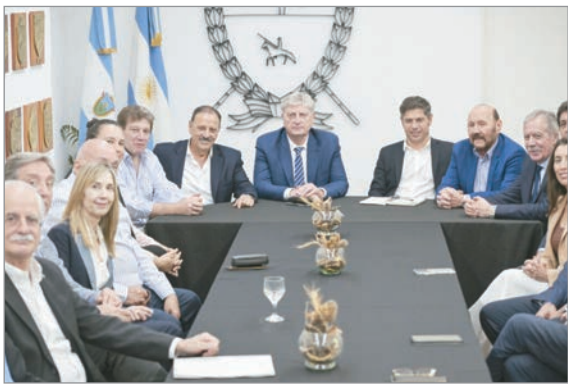
El gobernador bonaerense selló un acuerdo con mandatarios para defender recursos provinciales y coordinar acción política