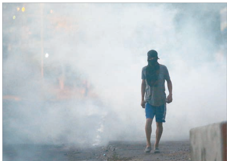
Hubo ocho heridos en las manifestaciones

La presidenta del Consejo Nacional Electoral (CNE) de Honduras, Ana Paola Hall, aseguró que la protesta "impidió las condiciones necesarias para que comenzara el recuento especial", que se centrará en las 2.773 actas, aproximadamente el 15% del total, que requieren una revisión exhaustiva tras presentar inconsistencias. Esta etapa podría alterar el recuento en más de 500.000 votos, lo que aumenta el suspenso político en la fase final del estrecho balotaje. El 99% de las actas escrutadas por el CNE otorgan la victoria a Nasry "Tito" Asfura, el candidato del Partido Nacional apoyado por Donald Trump, con 1.305.033 votos, lo que representa el 40%; seguido muy de cerca por Salvador Nasralla, del Partido Liberal, con 1.261.849 sufragios, es decir, el 39%.