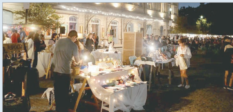
Este sábado vuelve con más de 150 emprendedores

con intervenciones artísticas y musicales, una variada propuesta gastronómica en diferentes puntos y un cronograma de espectáculos gratuitos.