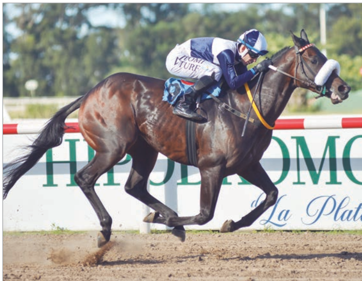
Alegría para “Nico y Pulga”. Tiempo de Gloria no dejó dudas y logró un triunfo terminante para alegría del stud “Nico y Pulga”.

De esa forma abandonaron el opuesto y al zambullirse en el codo de Tolosa, el favorito fue decididamente a plantearle lucha al puntero, en tanto a tres cuerpos se agrupaban Islote Lobos, Ree Especial y Mareg. Manteniendo dichas posiciones completaron la elipse y al pisar el derecho seguía la lucha adelante, pero faltando 200 metros escapó Tiempo de Gloria rumbo al disco que cruzó con holgada ventaja sobre Torrente. El tiempo de la carrera fue de 1m.00s.86/100 para los 1.000 metros de pista normal.