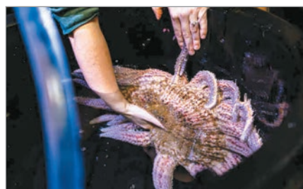
Un avance tecnológico permite proteger especies marinas en riesgo.

Este declive dejó a los bosques de kelp sin su principal depredador de erizos púrpura, lo que provocó una proliferación de estos animales, la transformación de extensos bosques submarinos en paisajes rocosos y la pérdida de equilibrio ecológico en la región.