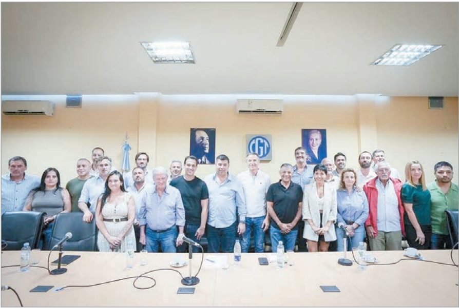
Intendentes peronistas y diputados se alinean con la estrategia sindical

La CGT profundiza su armado político y territorial de cara a la marcha del 18 de diciembre, una convocatoria que la conducción renovada presenta como un punto de inflexión frente al avance de la reforma laboral. Con este marco, los secretarios generales recibieron a intendentes bonaerenses que ratificaron su presencia y se comprometieron a coordinar acciones con el movimiento obrero. El encuentro se suma a la reunión con diputados nacionales, en un clima de articulación creciente entre sindicatos, jefes comunales y legisladores opositores que buscan frenar el proyecto oficial. Los intendentes que participaron del encuentro representan a municipios del conurbano y del interior. La coincidencia fue unánime en torno a la necesidad de acompañar la protesta y rechazar un proyecto que consideran regresivo para los derechos laborales. Para la CGT, el respaldo territorial es clave para garantizar una movilización masiva que envíe un mensaje político al Congreso y al Gobierno nacional, en un momento de fuerte tensión social.