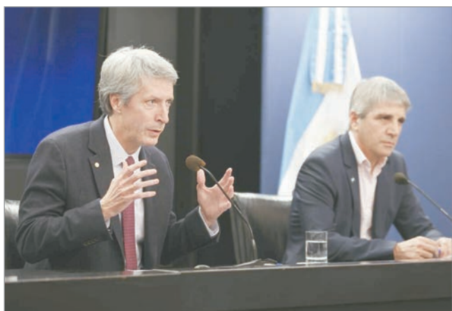
Se aproxima un abultado vencimiento de deuda