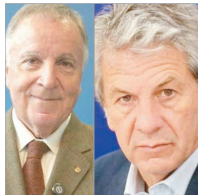
Fuertes movimientos en el equipo del Gobierno