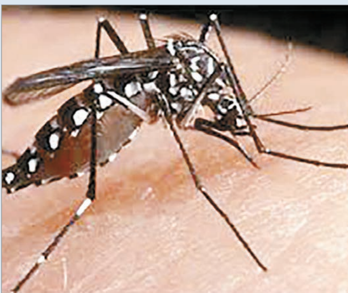
Avanza el virus en el país

Las autoridades sanitarias de Panamá informaron que se han registrado 25 muertes por dengue y 15.098 casos de la enfermedad hasta el pasado mes de noviembre. Además, 1.474 pacientes requirieron hospitalización y 103 se clasificaron como graves, donde la mayoría de los contagios se registran en personas de entre los 10 y 49 años. El área metropolitana y San Miguelito, en la capital, acumulan la mayoría de casos, con 7.242. Las defunciones por la enfermedad se han registrado en casi todas las regiones del país, siendo la provincia occidental de Chiriquí, fronteriza con Costa Rica, la que registra la mayor cantidad, con cinco muertes, seguida de la vecina Bocas del Toro con cuatro y el área metropolitana con tres. Así, los casos de dengue crecieron un 94% y las muertes sumaron 52 al cierre de este año en dicho país.