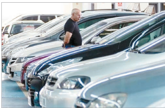
La economía platense creció de la mano de la venta de autos y propiedades