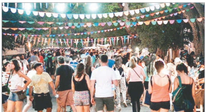
Sucedará esta noche desde las 18

la autogestión y el trabajo de manualistas creadores que van desde sus talleres a las ferias. Promovemos el consumo responsable, consciente y solidario que valora la importancia de la producción local y regional”, remarcaron desde la organización. Además, la gran jornada contará con intervenciones artísticas y musicales, una variada propuesta gastronómica en diferentes puntos y un cronograma de espectáculos gratuitos, siendo así una opción para recorrer en familia o con amigos. Con el correr de los años y de las ediciones, la Noche de las Ferias se volvió uno de los eventos culturales e independientes más importantes de la región, convocando no solo a los platenses.