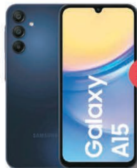
Galaxy A15 SAMSUNG