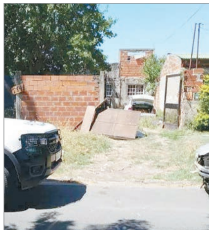
El lugar del hecho

Por orden de la UFI en turno, el cuerpo del individuo será sometido a la correspondiente operación de autopsia.