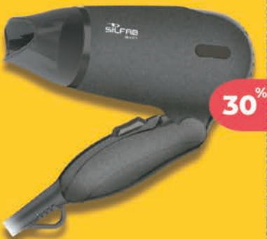
Secador de Cabello SILFAB