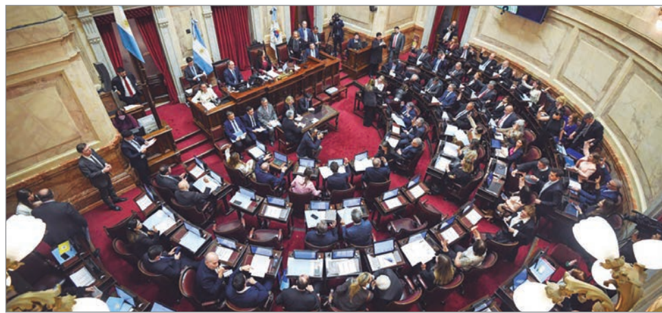
El Ejecutivo apuesta a mostrar gobernabilidad mientras crecen las críticas sociales

E l Gobierno nacional aspira a sancionar esta semana el Presupuesto 2026 sin modificaciones, pese a que la Cámara de Diputados rechazó el capítulo que incluía la derogación de leyes de financiamiento universitario y de emergencia en discapacidad. La decisión de no reincorporar esos artículos responde a la falta de respaldo político, pero también expone la voluntad oficial de priorizar la señal de gobernabilidad hacia el Fondo Monetario Internacional y los acreedores externos. El proyecto, que autoriza nueva deuda pública en un contexto de vencimientos por 4.200 millones de dólares en enero, se presenta como una herramienta de disciplina fiscal. Sin embargo, el “ahorro” administrativo que promete el Ejecutivo genera preocupación entre senadores y gobernadores, que advierten sobre