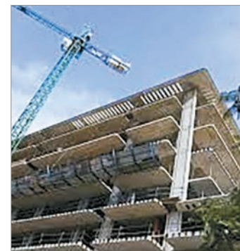
El metro cuadrado aumentó 9% en dólares

En paralelo, el valor de construcción del metro cuadrado para unidades en pozo aumentó en dólares 9,13% este 2025, al ubicarse en 3.056 dólares.