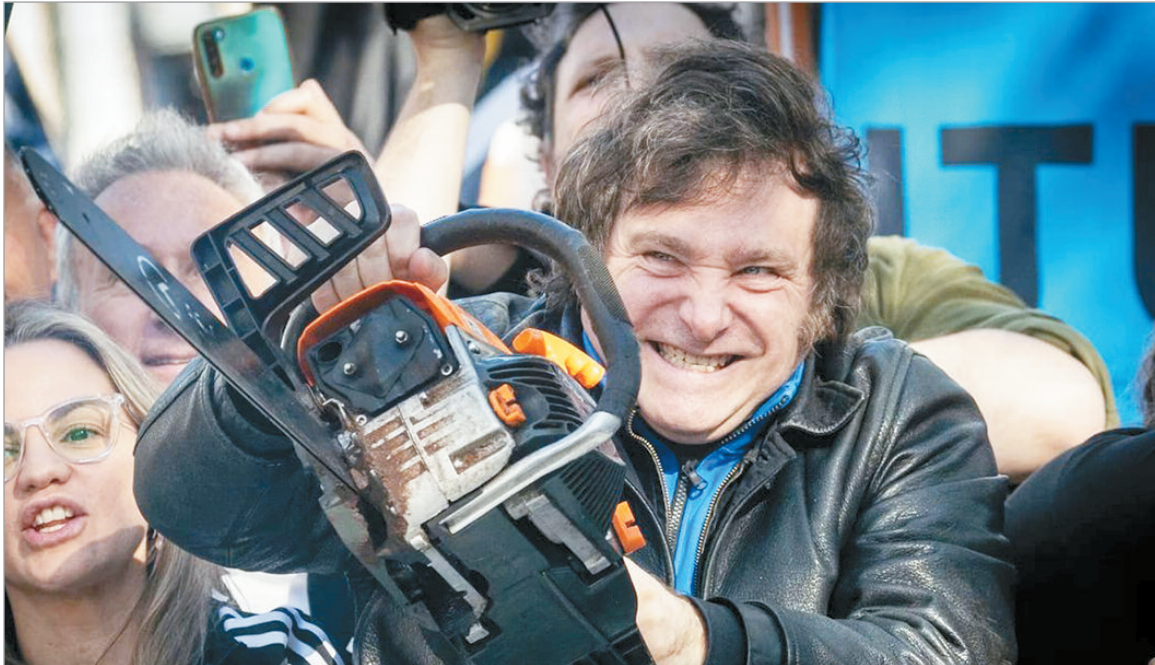
La motosierra de Milei pasa por la educación

El Gobierno nacional solo transfirió un monto simbólico a las casas de estudios para poder inflar el superávit fiscal