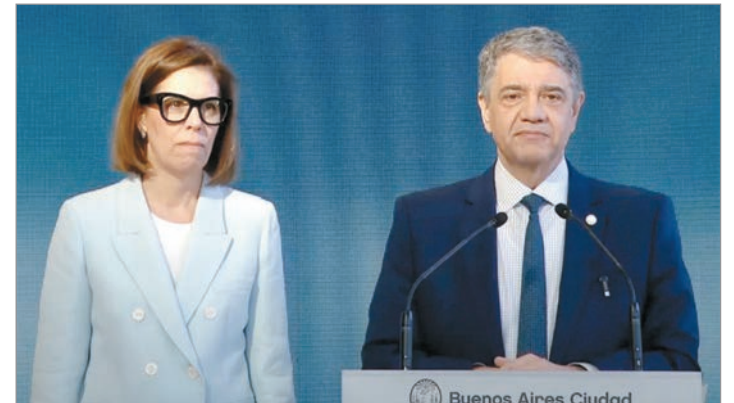
Nación no cumplió con Jorge Macri