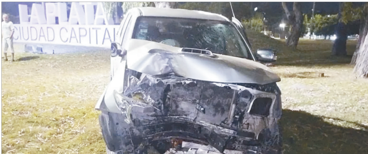
La camioneta del suceso de 120 y 531

Allí, por razones que tratan de establecerse, el conductor de una camioneta Toyota Hilux se despidió y terminó incrustándose contra un árbol, a pocos metros del cartel de bienvenida. Testigos se comunicaron con el servicio de emergencias 911 y poco después se hizo presente un móvil del Comando de Patrullas y de la comisaría Sexta, pero cuando llegaron notaron que los familiares