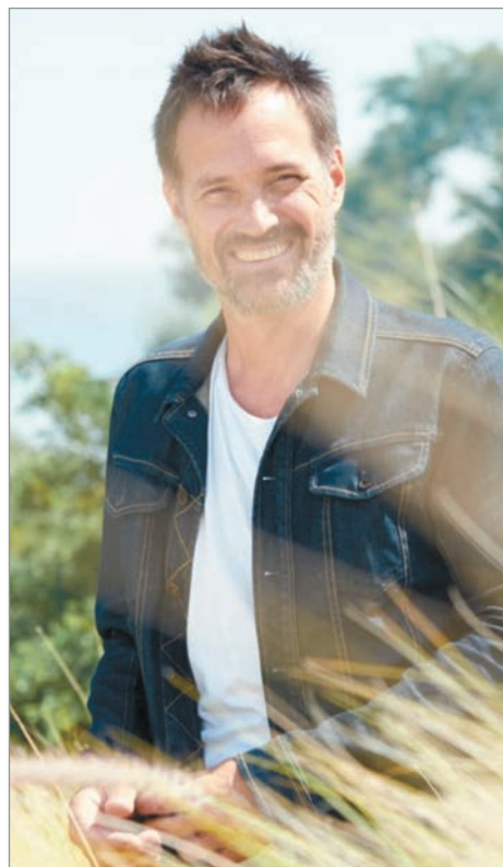
Revisa su vida hasta hoy en día

—El libro básicamente empezó siendo un libro de herramientas por las cuales yo me sostuve para tener un cambio de vida y cambio de hábitos, para una vida más plena, más saludable, más feliz, más presente, y más en contacto con conmigo y entonces era compartir esas herramientas que a lo largo de los últimos ocho años he compartido en mis podcasts, en programas de radios, en columnas y demás. Entonces cuando me di cuenta que todo eso tenía mucha recepción, sobre todo videos que subía a Instagram, dije esto es para ayudar al prójimo. Y en esa justamente, en dejarte mejor de lo que te importe, es donde me entusiasmé para hacer este libro de herramientas, para compartirlas. A partir de un hecho trágico que pasó en enero del año pasado, el 1 de enero, donde yo estaba con un íntimo amigo, estábamos los dos solos, con otros hijos, era su cumpleaños, estábamos esperando que llegue la gente, que lleguen para poner música en su cumple, de repente recibió una llamada para decirle que su hermano