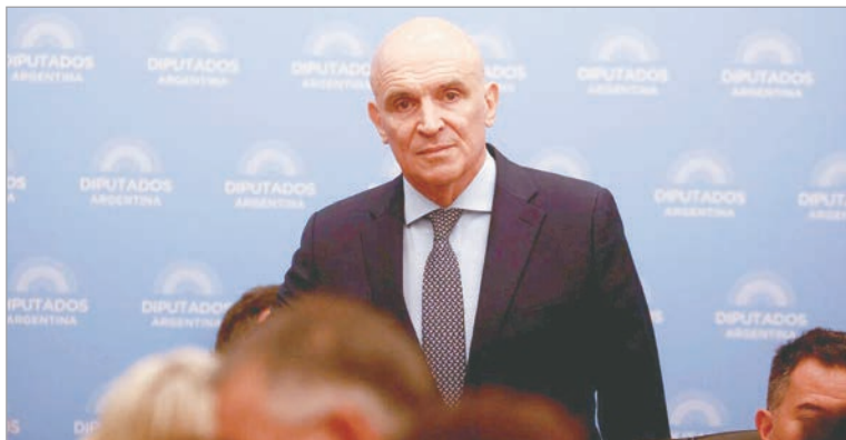
El juez federal ordenó el congelamiento de los bienes y activos financieros

En el caso de Espert, “la incorporación de activos de significativa rele-