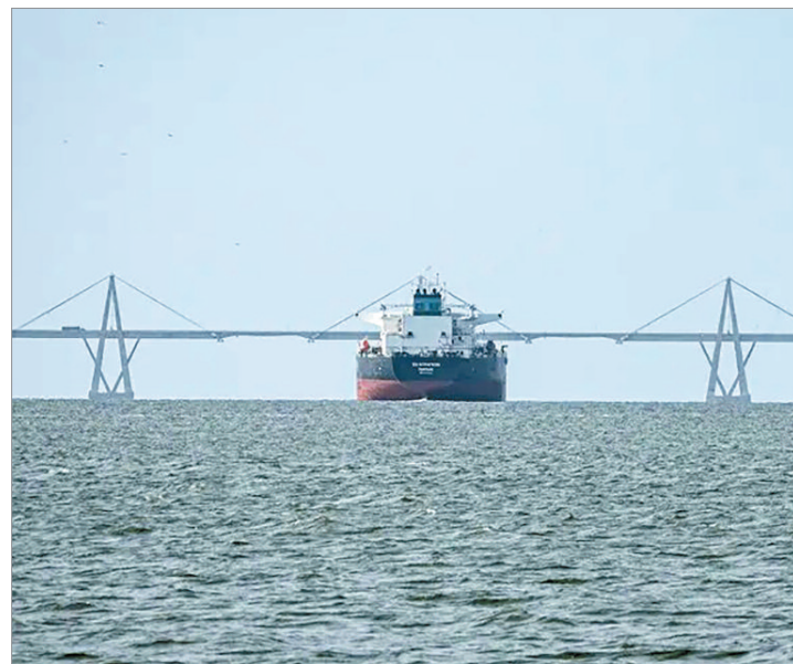
No está claro aún si transportaba crudo venezolano

El presidente Maduro tachó justamente ayer de “piratería de corsarios” la confiscación de petroleros por parte de Estados Unidos. En un mensaje en su canal de Telegram, Maduro habló en general y no se refirió a las dos confiscaciones efectuadas este fin de semana por la fuerza estadounidense. El líder chavista señaló que su país “tiene 25 semanas denunciando, enfrentando y derrotando una campaña de agresión que va desde el terrorismo psicológico hasta los corsarios que han asaltado petroleros”. Sin embargo, aseguró que están “preparados para acelerar la marcha de la revolución profunda”.