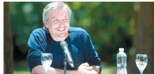
EL presidente del PJ bonaerense compartió mensajes y fotos de la militancia que acompañó a su madre

Cristina fue sometida a una cirugía de urgencia por un cuadro de apendicitis este sábado por la noche (ver página 2). La intervención fue exitosa y ahora permanece en el Sanatorio Otamendi a la espera de su recuperación. El gesto de Máximo buscó poner en valor la cercanía de la militancia y de los dirigentes en un momento delicado, reforzando la idea de comunidad política y afectiva que rodea a la expresidenta. La movilización espontánea frente al hospital se convirtió en una muestra de respaldo humano y político que excedió lo coyuntural.