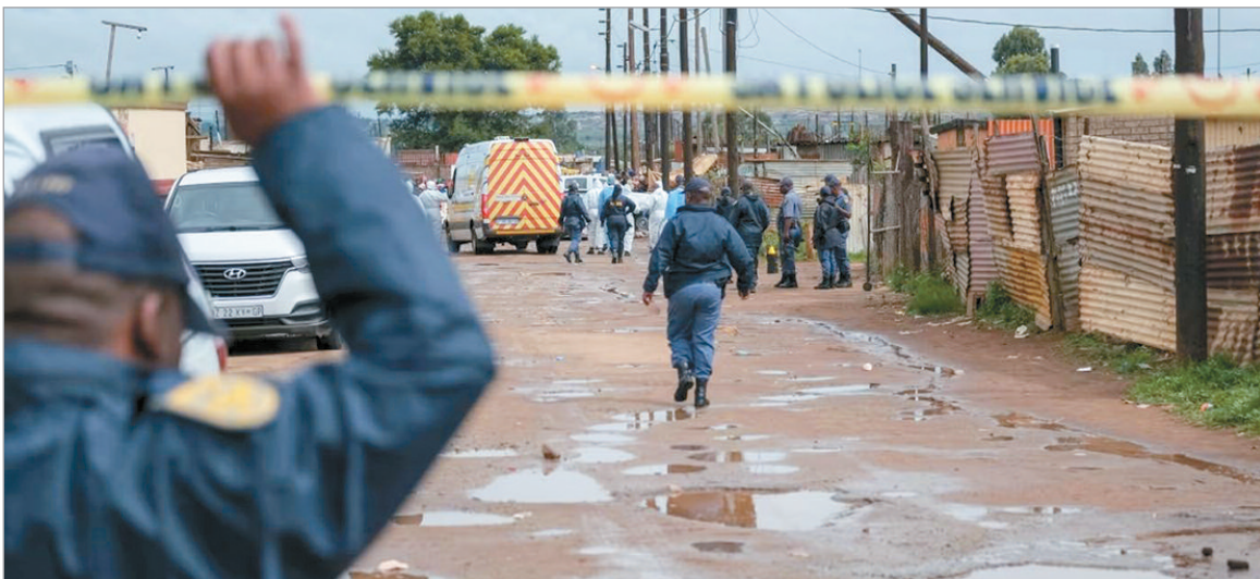
Hubo también 10 heridos

El tiroteo, que ocurrió en un bar al suroeste de Johannesburgo, sigue bajo investigación por las autoridades