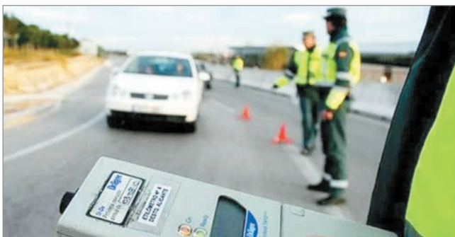
Legisladores bonaerenses avanzan con un proyecto que exige testeos previos y sorpresivos para garantizar la seguridad vial