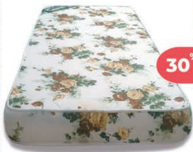
Colchón Tropical CANNON