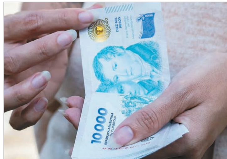
Aumentó 16% las personas que usan el aguinaldo para las deudas

Desde Focus Market sostuvieron que “en un contexto de salarios estabilizados pero insuficientes, el aguinaldo actúa como “salvavidas” para fin de mes, especialmente para la clase media, donde el 53% recurrió a ahorros o deudas en 2025”.