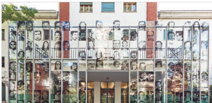
Organismos de derechos humanos advierten que cambios en el museo pondrían en riesgo la política de memoria

Uno de las iniciativas sería intentar contextualizar el golpe de 1976 dentro de la sucesión de rupturas constitucionales. El enfoque oficial pondría el acento en las acciones de las organi-