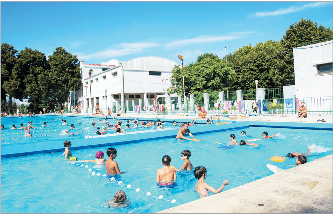
La colonia está abierta a toda la comunidad

La Universidad Nacional de La Plata ya tiene todo preparado para ofrecer una alternativa para disfrutar de las vacaciones en el predio del campo de deportes