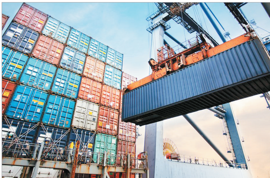
La baja en la participación industrial amenaza la complejidad exportadora bonaerense

Cabe mencionar que, en el período enero-octubre, el principal socio comercial fue Brasil, con 24,7 % de las exportaciones bonaerenses,