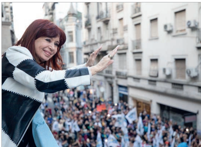
Continúan las restricciones para la expresidenta

Cabe recordar que la exmandataria recibió en los últimos días el alta médica luego de permanecer internada en el Sanatorio Otamendi a raíz de un cuadro apendicitis aguda con peritonitis.