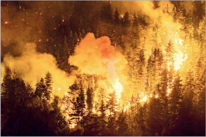
Afectó a más de 2.200 hectáreas de bosque nativo

operando en las zonas más comprometidas por el fuego. En la Comarca Andina y el sector de Puerto Patriada, el incendio ya afectó a más de 2.200 hectáreas de bosque nativo, en un escenario agravado por condiciones meteorológicas adversas, como altas temperaturas, baja humedad y vientos, que complican las tareas de control. Según informó la Agencia Federal de Emergencias, además del foco de Puerto Patriada, permanecen activos otros incendios en el Parque Nacional Los Alerces, también en Chubut, y en el área de Túnel Inferior, dentro del Parque Nacional Los Glaciares, en la provincia de Santa Cruz. En paralelo, avanza la investigación judicial en Chubut, bajo la órbita de la fiscalía de Lago Puelo, para determinar el origen del incendio. En el lugar donde se inició el foco ígneo se detectaron gases inflamables compatibles con acelerantes, lo que refuerza la hipótesis de un hecho intencional.