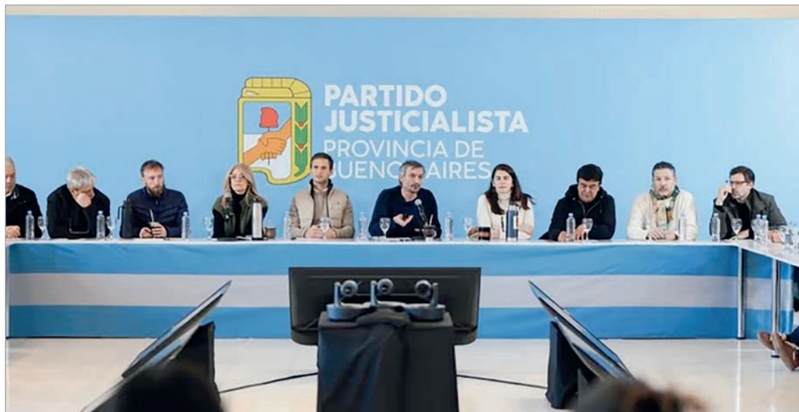
Máximo Kirchner convocó a un encuentro clave mientras crecen tensiones por la sucesión partidaria

El PJ bonaerense se reúne para definir si habrá internas o lista de unidad en marzo, en medio de tensiones por la sucesión