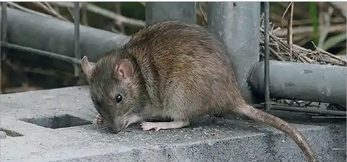
Se contagia al inhalar partículas microscópicas contaminadas

El Municipio difundió información clave sobre las formas de contagio, los síntomas y una serie de medidas preventivas para reducir el riesgo de transmisión de esta enfermedad asociada a roedores silvestres