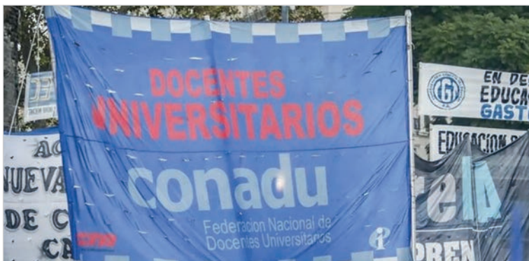
Conadu denunció que los salarios se ubican en mínimos históricos y muchos docentes no superan los $500.000

Chevalier sostuvo que el Gobierno recorta funciones esenciales bajo el argumento de la falta de fondos, afectando directamente a la Universidad y a la Ciencia. En esa línea, señaló que la situación tiene un componente ideológico y no meramente económico, y denunció que los docentes