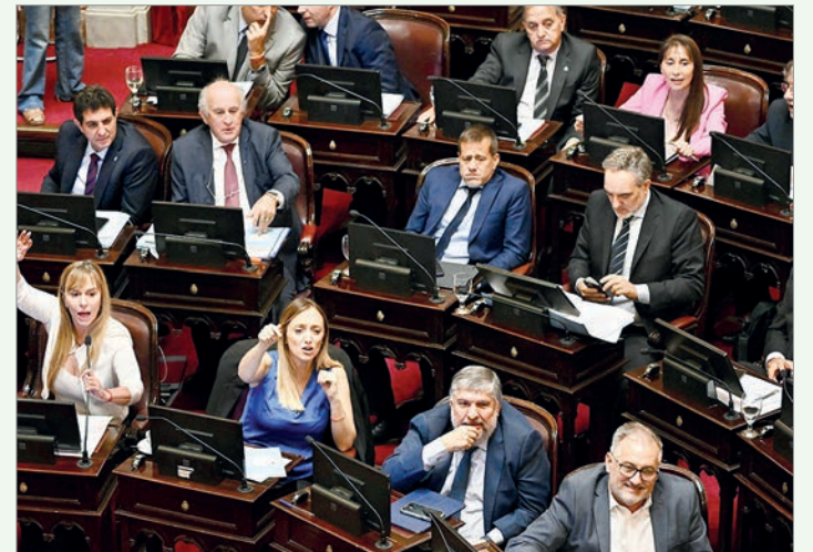
La oposición presiona para tratar el polémico decreto

En Diputados también se reportaron conversaciones opositoras para voltear el DNU si entra al recinto. Por la vía administrativa, el bloque de Unión por la Patria exigió que se convoque a extraordinarias para bajar el DNU que empodera y limita el control de la SIDE, mientras que Provincias Unidas pidió que la vicepresidenta Victoria Villarruel y el titular de la Cámara Baja, Martín Menem, llamen a conformar las comisiones Bicamerales de Trámite Legislativo y la de Seguimiento de las Actividades de Inteligencia.