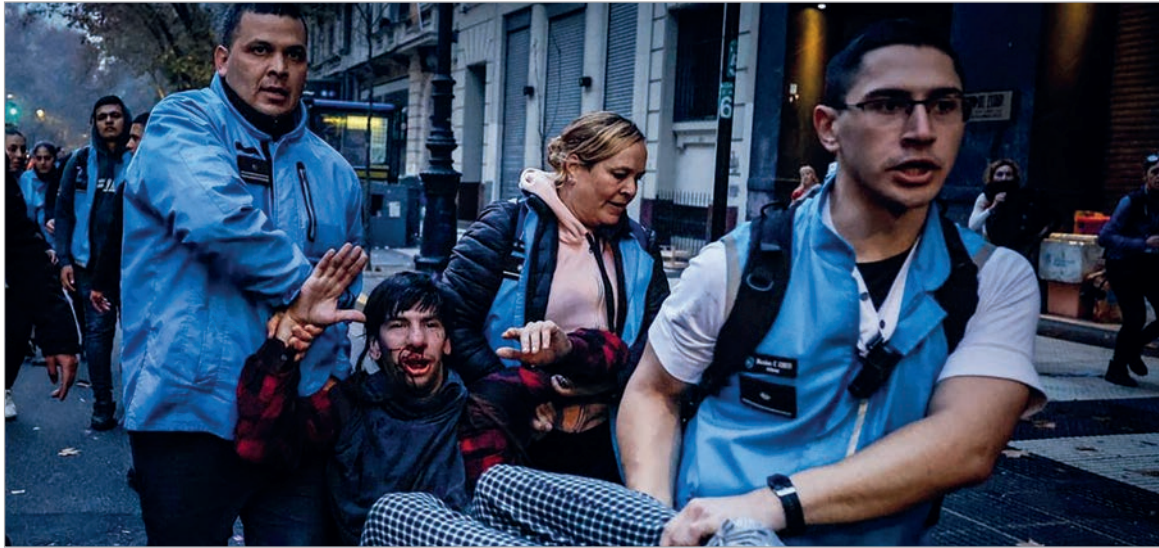
Con el Protocolo vigente, se registraron 103 represiones

La CTA Autónoma publicó un detallado informe sobre el saldo de la política que instauró Patricia Bullrich para reprimir protestas