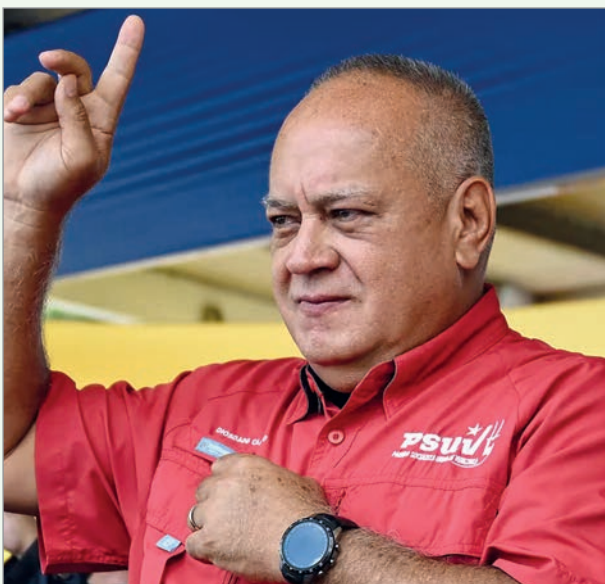
Cabello tildó a Milei de "jalabolos"

El ministro del Interior de Venezuela, Diosdado Cabello, reapareció en su programa "Con el mazo dando" y lanzó duras críticas no solo contra Donald Trump, sino también contra Javier Milei. Se trató de su primera aparición luego de los bombardeos de Estados Unidos a la capital venezolana Caracas (que dejó un saldo de alrededor de 100 muertos) y la captura de Nicolás Maduro.