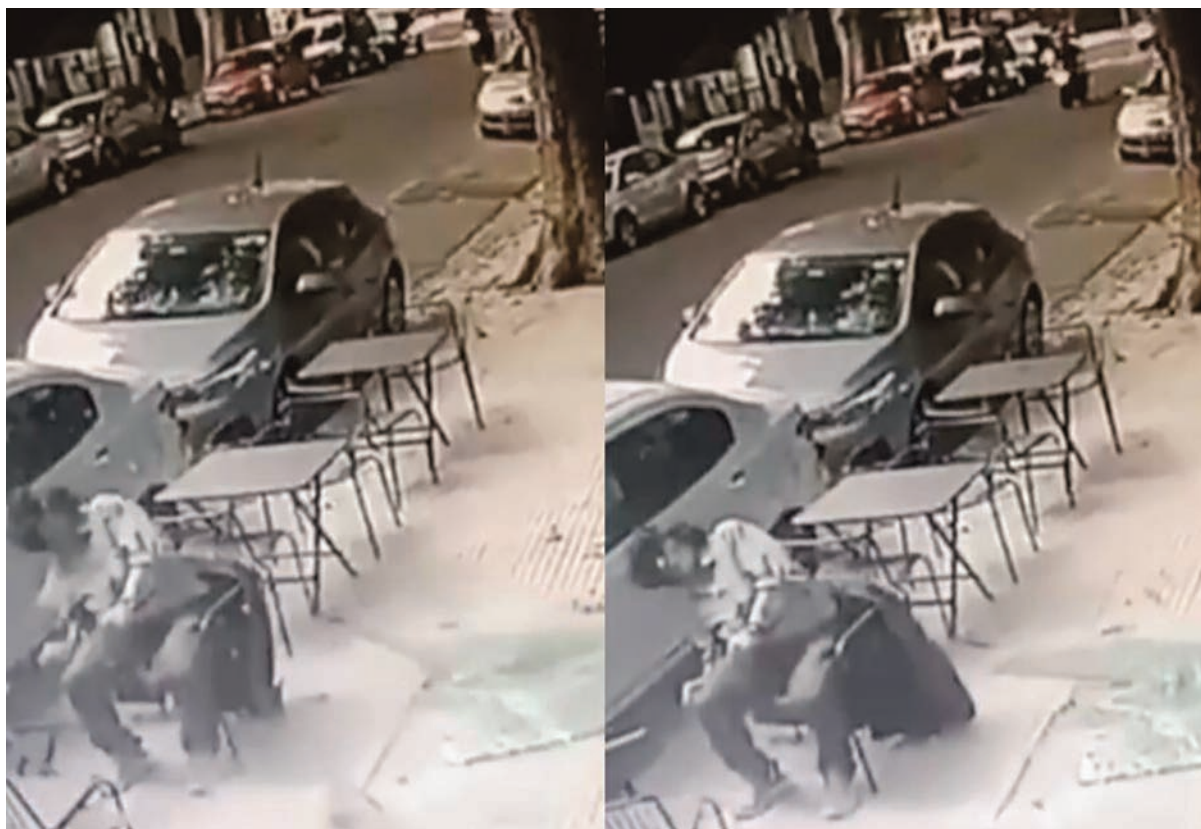
La secuencia del hecho

U n hombre sobrevivió de milagro luego de que un vidrio que se encontraba en la ventana de un departamento cayera sobre su cabeza mientras comía en un bar del barrio porteño de Palermo, informaron fuentes oficiales.