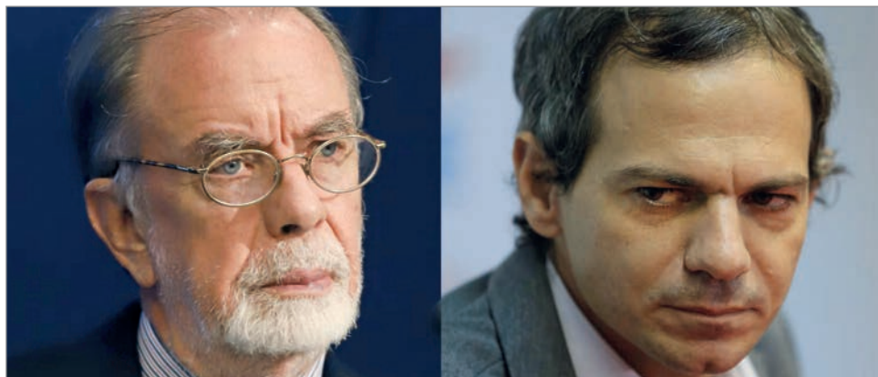
La causa judicial avanza con embargos e inhabilitaciones contra exautoridades del Nación