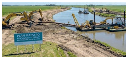
El senador Germán Lago destacó la obra estratégica para prevenir inundaciones y potenciar la producción

El senador bonaerense Germán Lago resaltó el avance del Plan Maestro Integral de la Cuenca del Río Salado y subrayó su importancia para el interior productivo de la provincia de Buenos Aires. El legislador consideró que se trata de una de las obras más relevantes de la historia provincial, por su impacto en la producción agropecuaria y en