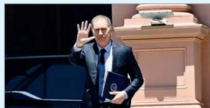
El ministro del Interior visitará Chaco y Mendoza buscando sumar consensos legislativos