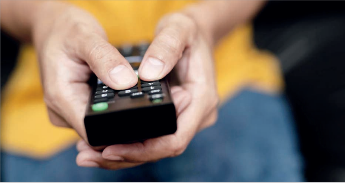
Las señales en cuestión no están disponibles

E n las últimas horas se dio a conocer que en Uruguay los usuarios de Directv y Flow ya no pueden acceder a los canales 4, 10 o 12. Al querer ver estos canales, los usuarios se encuentran con una placa de advertencia de que las señales en cuestión no están disponibles. “La señal no está disponible por razones ajenas a Directv Uruguay. Estamos trabajando para restablecerla. Lamentamos las molestias ocasionadas”, asegura el texto en el caso de Directv, mientras que el de Flow detalla: “Estimados clientes, esta señal se encuentra temporalmente indisponible. Estamos trabajando para normalizar el servicio cuanto antes”.