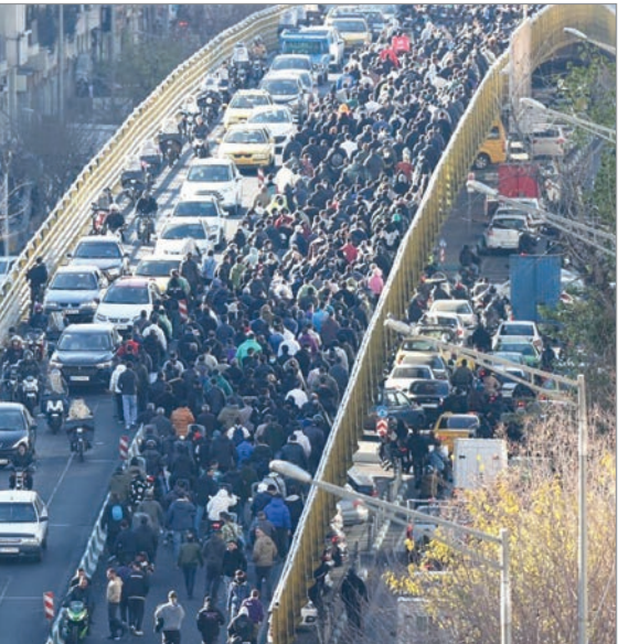
Al menos 45 manifestantes perdieron la vida

Miles de personas salieron a las calles de Irán, especialmente en Teherán, tras el llamamiento a protestar del príncipe heredero en el exilio Reza Pahlavi.