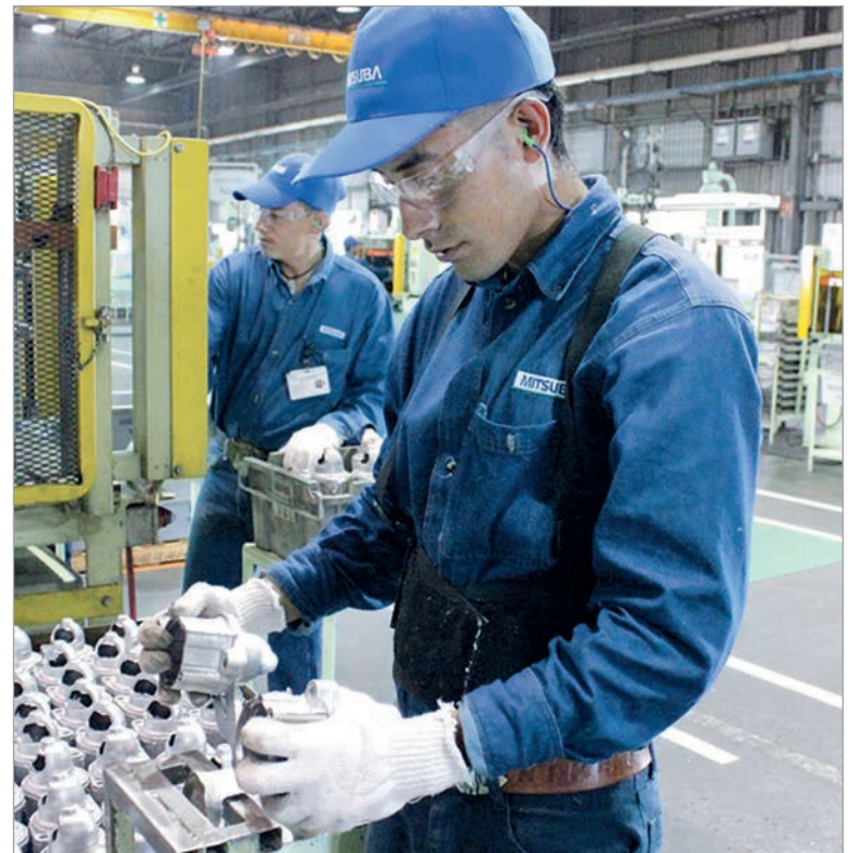
Dos sectores clave de la economía no repuntan

Si se analiza por sector y a nivel internacional, las incidencias de las divisiones que componen el nivel general del índice presentan caídas de 2,3% en "Alimentos y bebidas"; 1,2% en "Vehículos automotores, carrocerías, remolques y autopartes"; 1,1% en "Maquinaria y equipo"; 0,8% en "Prendas de vestir, cuero y calzado"; 0,7% en "Productos de metal"; 0,6% en "Productos textiles"; 0,5% en "Productos de caucho y plástico"; 0,5% en "Sustancias y productos químicos"; 0,5% en "Otros equipos, aparatos e instrumentos"; 0,3% en "Muebles y colchones, y otras industrias manufactureras"; 0,2% en "Industrias metálicas básicas"; y 0,1% en "Productos minerales no metálicos".