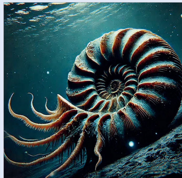
Los amonites lograron sobrevivir al impacto del asteroide K-Pg

La pregunta central fue si los amonites hallados representan supervivientes reales o fósiles desplazados desde capas anteriores. La redeposición puede alterar la interpretación del registro fósil y dar una imagen errónea sobre la duración real de la especie. El objetivo principal de los investigadores fue demostrar si los amonites vivieron y murieron en el Paleógeno o si llegaron allí por procesos geológicos posteriores. Consideraron que su investigación iba a ser útil para entender cómo se recuperó la vida marina tras la extinción y cuánta resistencia mostraron los amonites ante los cambios globales. Los investigadores también buscaron definir cuánto tiempo sobrevivieron estos moluscos después de la catástrofe y si su presencia se extendió a otras regiones.