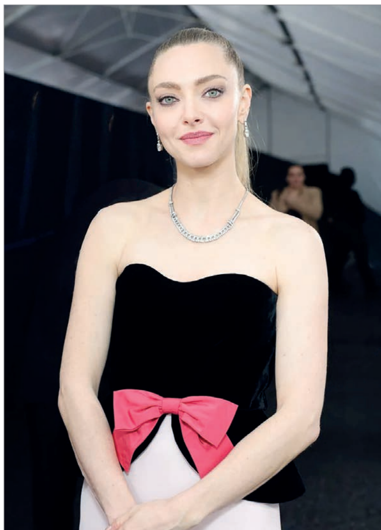
En una reciente entrega de premios

—Intento no hacer lo mismo que acabo de hacer. Si es oscuro, si los temas son oscuros, si es pesado, intento elegir algo ligero, que es lo que acabé haciendo después de Ann Lee . Y después de eso, vuelvo a elegir algo pesado. A veces elijo mover todo en el piso de arriba. A veces elijo hacer algo en lo que no soy el protagonista o en lo que solo soy una coprotagonista, solo para tomarme un pequeño descanso, pero también para estar en el set y formar parte de una buena historia. Pero también tiene que ver con el director, a veces surgen proyectos tan radicales e interesantes que tengo que aceptarlos, independientemente de si conozco al director o he visto su trabajo. A