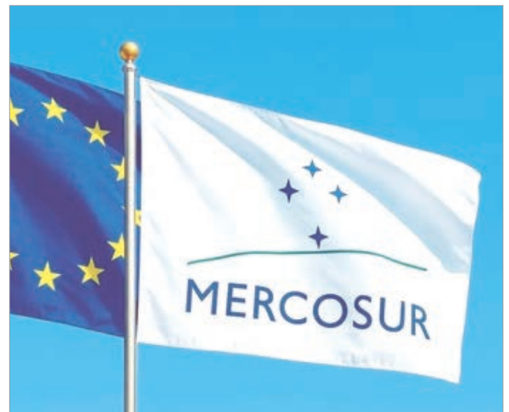
Se da tras más de 25 años de negociaciones

Los opositores, liderados por Francia, el mayor productor agrícola de la Unión Europea, afirman que el acuerdo incrementará las importaciones de productos alimenticios a bajo precio, como carne de res, aves de corral y azúcar, perjudicando a los agricultores nacionales.