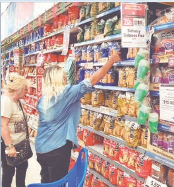
En CABA, la inflación fue del 2,7%

Al ritmo del último semestre, la inflación en la Ciudad de Buenos Aires se volvió a acelerar: según datos oficiales del instituto de estadísticas porteño, el índice de precios de diciembre marcó una variación positiva de 2,7%. Se trató de un incremento de 0,3 puntos con relación al 2,4% de noviembre.