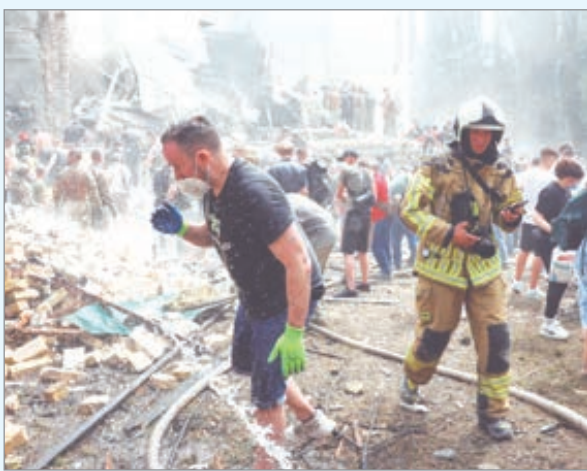
Fallecieron cuatro personas

La Operación Lanza del Sur “no es temporal” y “continuará desarrollándose mientras sea necesario”