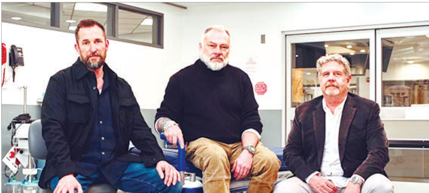
La dupla junto con Wyle

—RSG: Creo que porque son uno de los pocos, en términos de narración, los médicos y enfer-