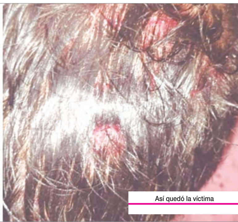
Así quedó la víctima

Momentos después se presentó en la vivienda el exnovio de la mujer, quien habría iniciado una agresión directa contra el hombre. Según el reporte oficial, el atacante utilizó inicialmente un tubo de hierro recubierto para golpear a la víctima, provocándole lesiones en la cabeza y otras partes del cuerpo. Tras ello, continuó la agresión con un arma blanca, ocasionándole heridas cortantes en la zona de la espalda.