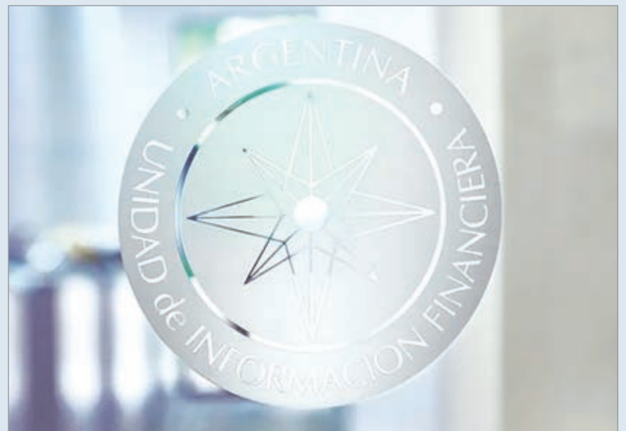
El organismo aplicó una medida inédita en América Latina tras recibir inteligencia financiera internacional

La normativa responde a compromisos asumidos ante la ONU y a los estándares del GAFI, que exigen sanciones inmediatas para impedir el acceso de personas o entidades vinculadas al financiamiento de la proliferación de armas de destrucción masiva. Con esta decisión, la UIF fortaleció el sistema nacional de prevención y se ubicó entre las pocas jurisdicciones globales que adoptaron este tipo de medidas.