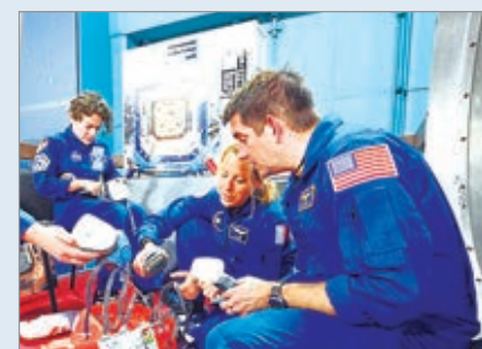
Se trata de la primera vez que una misión regresará anticipadamente por motivos médicos

el miembro de la tripulación”, señaló. La agencia también destacó que este tipo de medidas, aunque poco comunes, forman parte de los protocolos de seguridad establecidos para misiones de larga duración en el espacio.