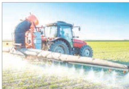
Tras el fallo de la Corte, crece la presión para debatir una norma que unifique criterios

El reciente fallo de la Corte Suprema bonaerense, que suspendió ordenanzas municipales sobre fumigaciones en Tandil y Rauch, reavivó el debate por la falta de una ley provincial que regule el uso de fitosanitarios. La decisión judicial, de carácter cautelar, puso el foco en los riesgos ambientales y en la necesidad de