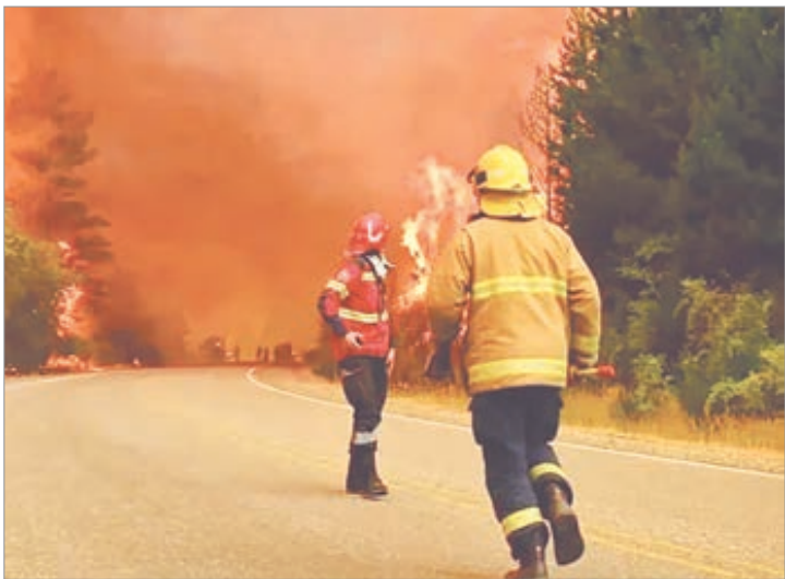
El CEPA cuestiona la reducción de fondos en plena emergencia por incendios en la Patagonia

Especialistas remarcan que el SNMF cumple un rol estratégico en la coordinación de brigadas y provisión de equipamiento. La reducción de fondos, advierten, limita la capacidad de desplegar operativos en simultáneo y sostener la logística necesaria para enfrentar emergencias de gran escala. Desde el CEPA insisten en que el financiamiento adecuado es indispensable para proteger ecosistemas y comunidades.