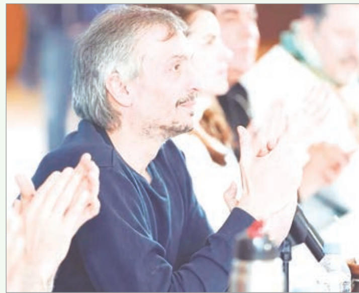
La Junta Electoral busca depurar el padrón y garantizar transparencia ante una posible interna en marzo

La junta electoral volverá a reunirse el 20 de enero, en un escenario donde la definición sobre candidaturas marcará el rumbo del peronismo bonaerense.