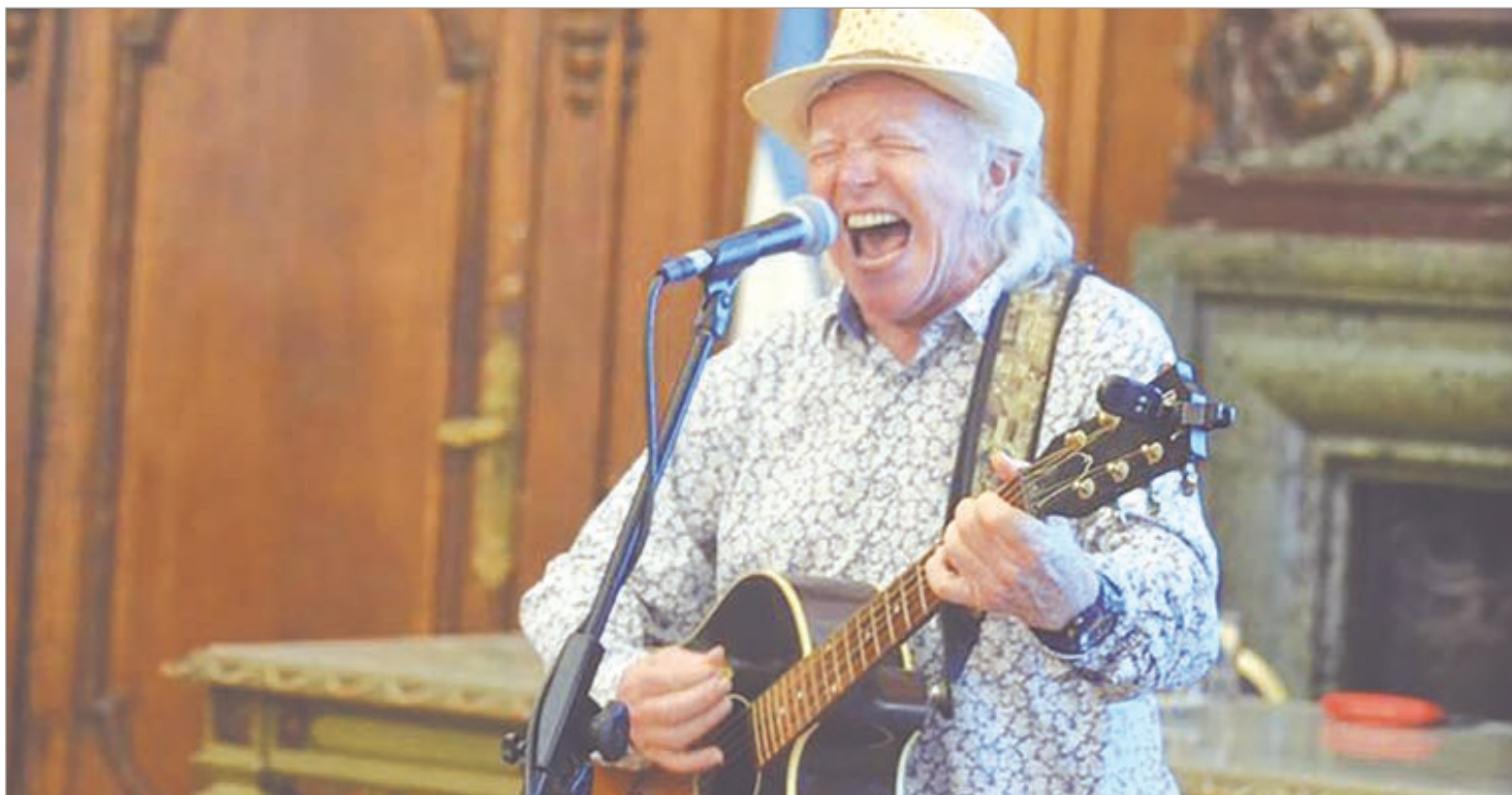
Cantilo es vocalista, guitarrista, compositor y autor de canciones

var de que algo pasaba», relata Cantilo. Comenzaron a cantar públicamente en La Fusa, un café bar de la ciudad balnearia uruguaya, que frecuentaban Jorge Schussheim, Carlos Perciavalle, Nacha Guevara y Susana Rinaldi.