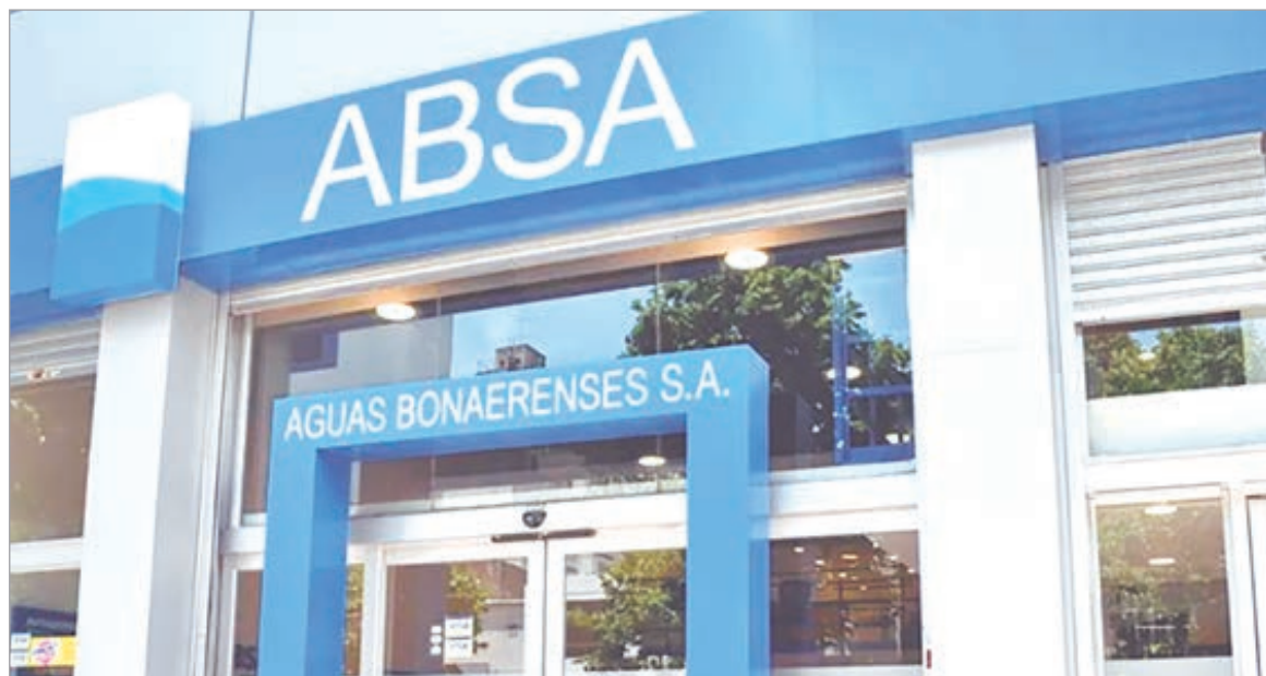
Tras la audiencia pública, la empresa detalló cuánto pagarán los usuarios

A guas Bonaerenses S.A. avanzó ayer con la actualización de las tarifas del servicio de agua y cloacas tras realizar la audiencia pública requerida para habilitar el incremento. La empresa confirmó un aumento del 40% que regirá durante 2026 y alcanzará tanto a usuarios residenciales como a comercios e industrias en las 95 localidades bonaerenses donde presta servicio.