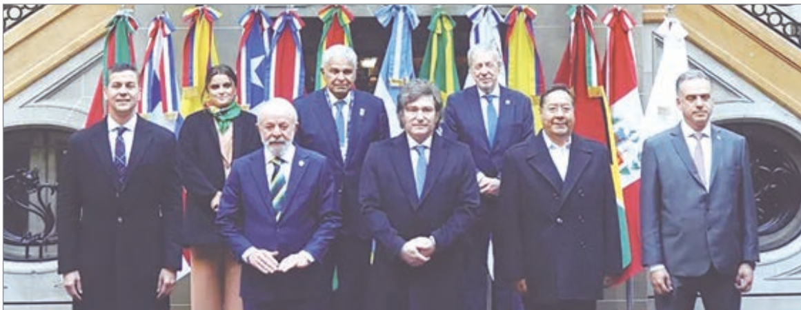
Argentina participará del acto de firma el 17 de enero en Asunción

La UE concentra cerca del 14% de las importaciones globales de bienes y servicios. En paralelo, alrededor del 15% de las exportaciones del Mercosur se dirigen a ese bloque, mientras que el 20% de lo que importa la región proviene de Europa. Entre los productos que se beneficiarán figuran la soja, aceites industriales, frutas frescas, frutos