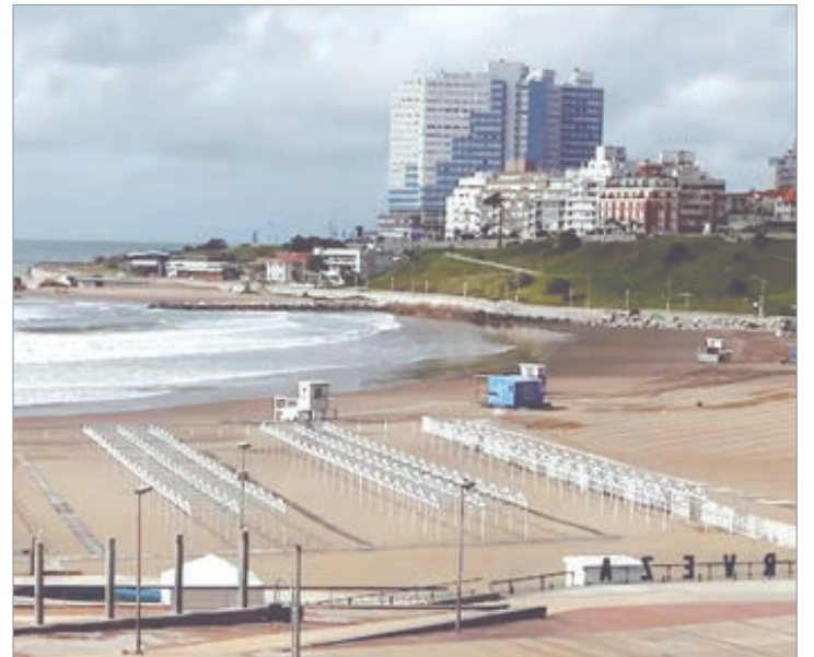
El 56% no se tomó vacaciones por dificultades económicas

Al contrario, entre los trabajadores que sí pudieron vacacionar durante el último año, los destinos seleccionados muestran una combinación entre proximidad geográfica y costos accesibles. Al respecto, el 24% de quienes viajaron eligió la Costa Atlántica de la provincia de Buenos Aires. Otros destinos concentraron el 22%, con el Caribe como principal opción, mientras que Brasil representó el 16% y la Patagonia el 13%, de acuerdo a los datos de Bumeran.