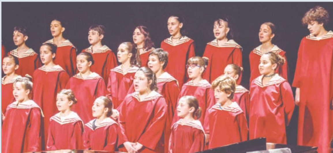
Destinada a chicas y chicos de entre 6 y 12 años

La audición estará dividida en tres instancias. En una primera etapa, los aspirantes deberán interpretar una canción de libre elección y realizar ejercicios de vocalización. La segunda parte incluirá juegos vocales orientados a evaluar la memoria y la independencia musical. Finalmente, la tercera instancia consistirá en la enseñanza de un fragmento de ópera, a determinar por el jurado, y la posterior evaluación integral.