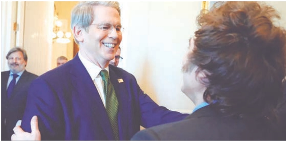
Bessent confirmó que Milei devolvió la plata del swap

La gestión libertaria canceló las operaciones del swap, dinero que le había prestado Trump a Milei para ganar las elecciones