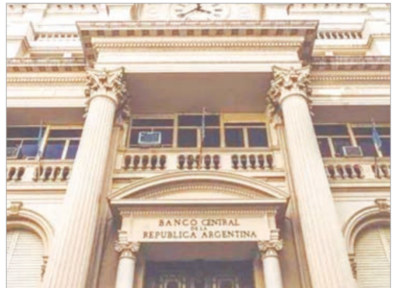
El Tesoro abonó bonos por US$4300 millones con dólares propios en un escenario restrictivo

El esquema permitió cubrir el pago sin sobresaltos, aunque volvió a poner en evidencia la fragilidad del margen financiero con el que opera el Ministerio de Economía. La