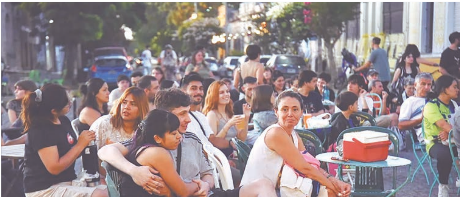
Actividades para realizar con amigos o en familia