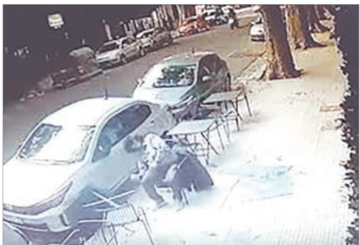
El momento del suceso

Acerca de cómo es su día a día, contó que trabaja en la parte administrativa y que ahora está con licencia: "No es nada fácil. Tengo que arreglármela con un solo brazo y hasta para cortar la comida me tiene que ayudar mi familia".