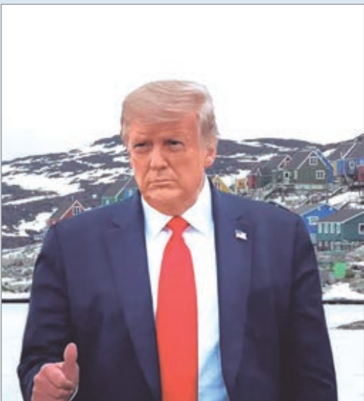
Donald Trump quiere apoderarse de Groenlandia

Groenlandia rechazó nuevamente la idea de convertirse en un territorio estadounidense, después de que el presidente Donald Trump volviera a amenazar con el uso de la fuerza para anexionar el territorio autónomo danés.