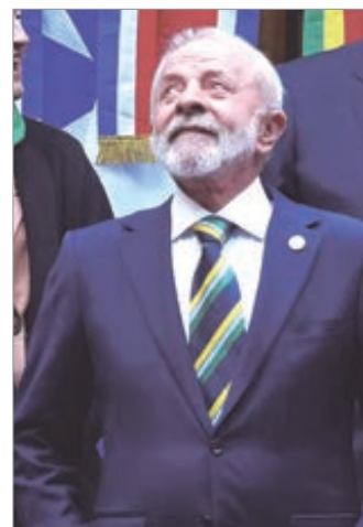
Brasil abandonó la representación argentina en Venezuela

El gobierno de Brasil decidió abandonar la representación de la Embajada argentina en Venezuela, a una semana del ataque