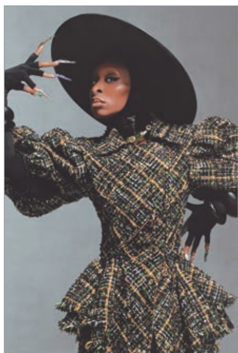
Dice que el personaje la acompañará toda su vida