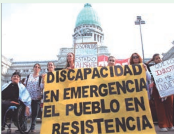
Organizaciones acusan al Gobierno de maniobras dilatorias y falta de fondos