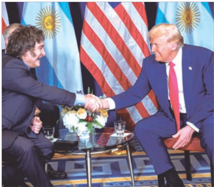
Milei no descartó el envío de tropas argentinas en apoyo de EE. UU.

También Milei quedó desairado cuando calificó de "estupidez" la teoría de que la invasión a Venezuela tenía como principal objetivo hacerse con el petróleo, cosa que Trump ratificó una y otra vez desde entonces. Además, sus últimas publicaciones en redes sociales solo se refirieron a ese tema.