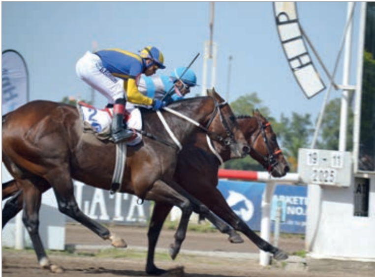
Es nuestro candidato. Resero con Capa en oportunidad de alzarse con el Clásico “Ciudad de La Plata” (G II-1.200 mts.) y esta tarde va por el bi