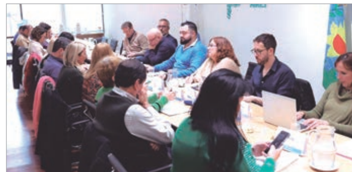
Docentes se sumaron al pedido de reapertura paritaria

Además, exigieron la continuidad de la paritaria salarial docente, en virtud de la pérdida del poder adquisitivo que atraviesan las y los trabajadores de la educación y la necesidad de garantizar condiciones laborales y salariales dignas".