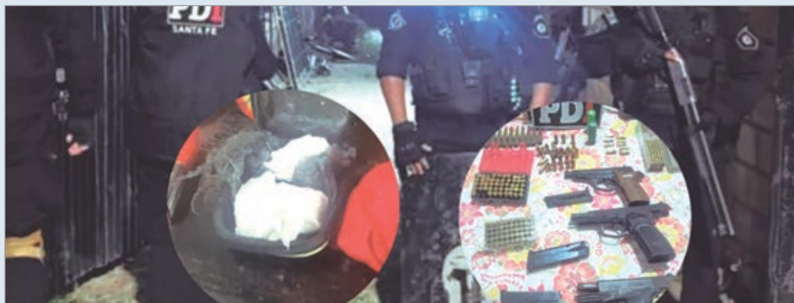
El operativo y los elementos incautados

En las requisas se secuestraron 12 armas de fuego de distintos calibre y municiones, 1 kilo de cocaína -entre fraccionada y sin fraccionar, vehículos, gran cantidad de teléfonos celulares, balanzas de precisión y elementos para corte y fraccionamiento de drogas.