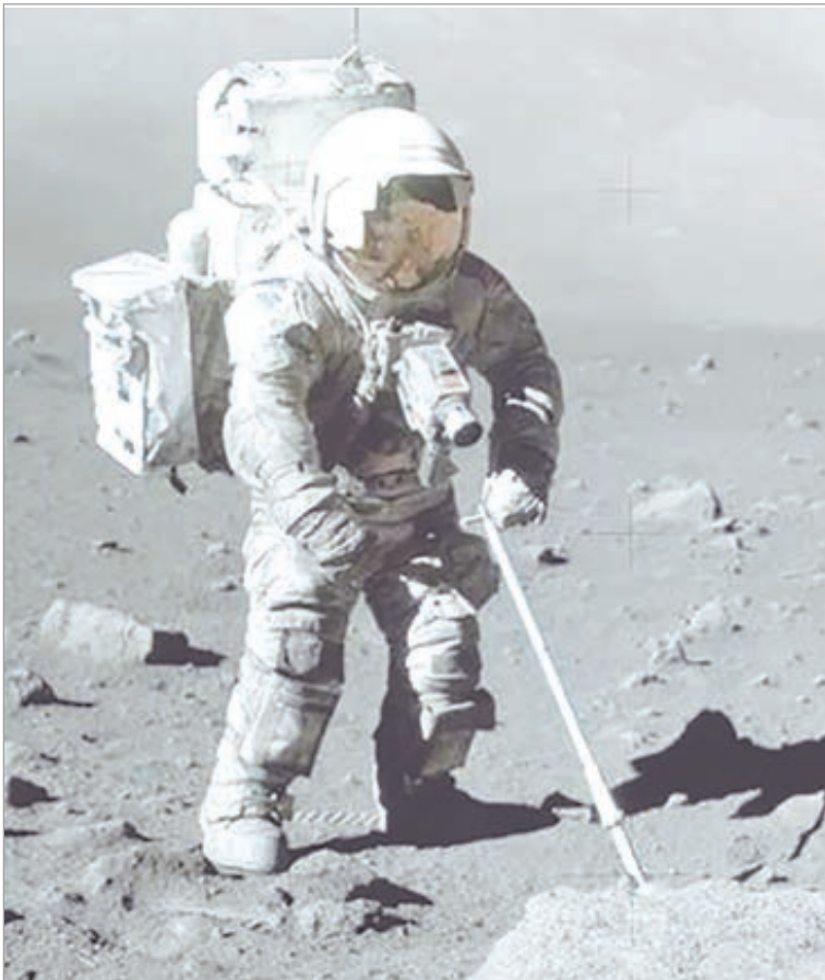
El análisis del material mostró una huella química única de hace 4.500 millones de años

"Antes se pensaba que el manto lunar tenía la misma composición