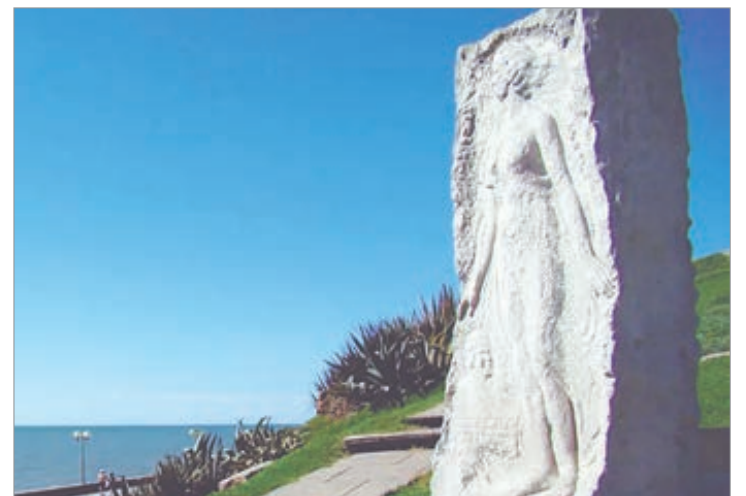
El monumento a la poetisa argentina se encuentra en el Barrio La Perla, frente al balneario y playa del mismo nombre

A los doce años escribió su primer poema. Nunca abandonó su deseo de estudiar y con mucho esfuerzo logró recibirse de maestra y ejercer la profesión.