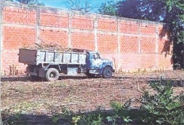
Los trabajos en las tierras usurpadas

El reclamo está siendo tratado en esferas judiciales, pero mientras tanto resulta imposible convivir en la zona.