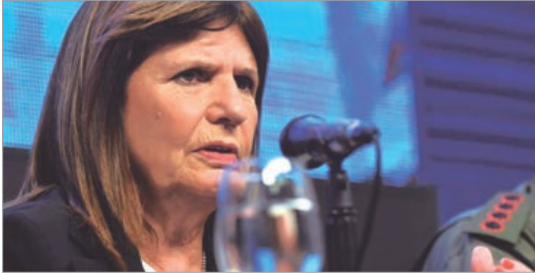
El Ejecutivo busca apoyo en el Senado y la CGT intensifica contactos para discutir la reforma

El oficialismo busca aprobar la reforma en febrero, mientras la central obrera reclama cambios y amenaza con medidas de fuerza