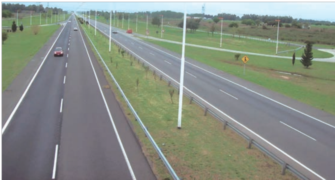
El Gobierno nacional licitará la concesión de las rutas 3, 5 y 205

Se trata de las rutas nacionales 3, 5 y 205. Su privatización corresponde a la Etapa II de la Red Federal de Concesiones