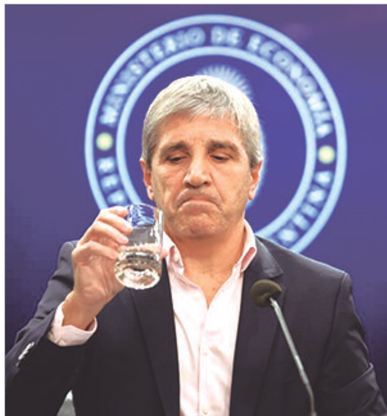
Caputo necesita que suban los bonos para pagar la deuda

Para alcanzar la esperada suba de los bonos, Caputo debe revertir dos señales hacia el mercado. Una de ellas es la acumulación de reservas, que explícitamente se lo pide el