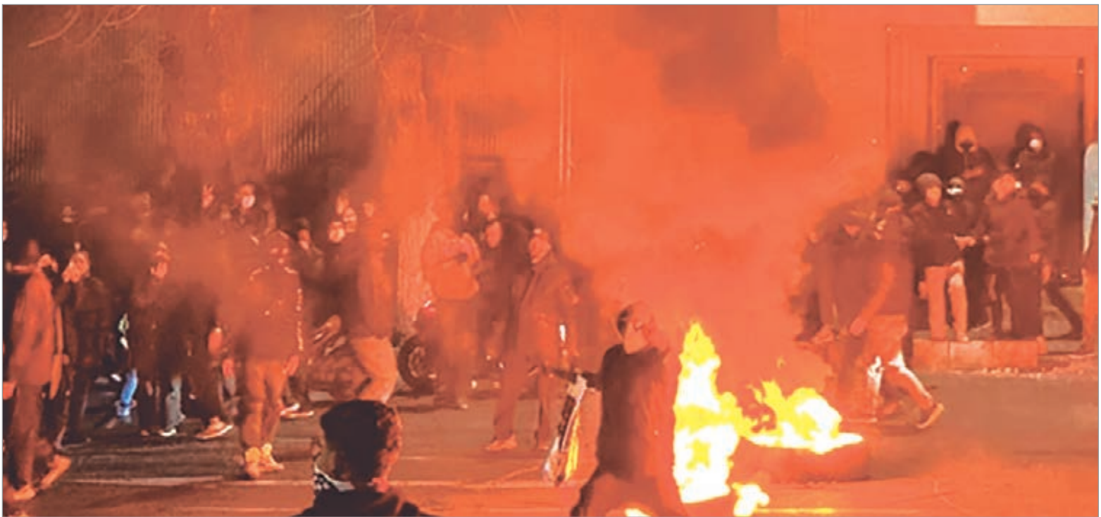
Las protestas comenzaron impulsadas por comerciantes descontentos con la crisis económica

Organizaciones defensoras de derechos humanos señalaron que el apagón digital no solo impide la circulación de información, sino que también puede servir para ocultar abusos y violaciones de derechos