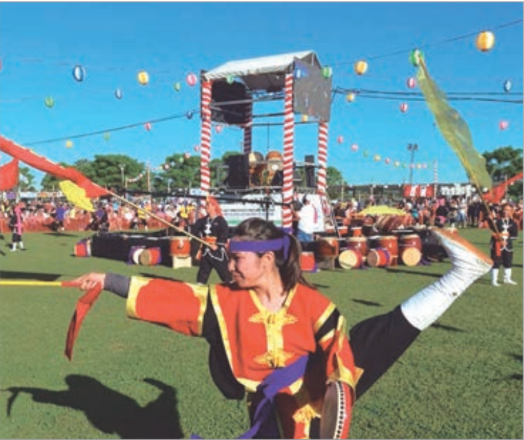
La XXV edición del festival japonés en la ciudad

La organización decidió cambiar la fecha del tradicional festival japonés ante pronósticos climáticos adversos previstos para el sábado 10. Las entradas anticipadas mantendrán su validez y también se habilitó la devolución total para quienes no puedan asistir