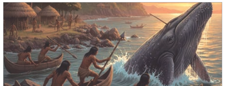
Las comunidades indígenas del sur de Brasil cazaban grandes cetáceos hace 5.000 años