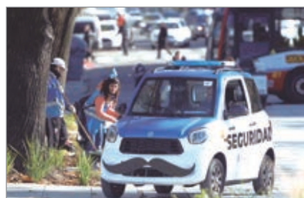
La empresa que contrató el Municipio no paga los sueldos

Los trabajadores están vinculados a la Cooperativa "El Custodio", que también aporta personal de seguridad en otros edificios y espacios públicos de la ciudad.