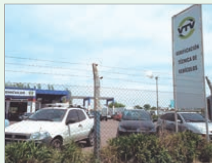
Buscan que talleres privados puedan realizar la VTV

Según explicó el legislador, en los últimos