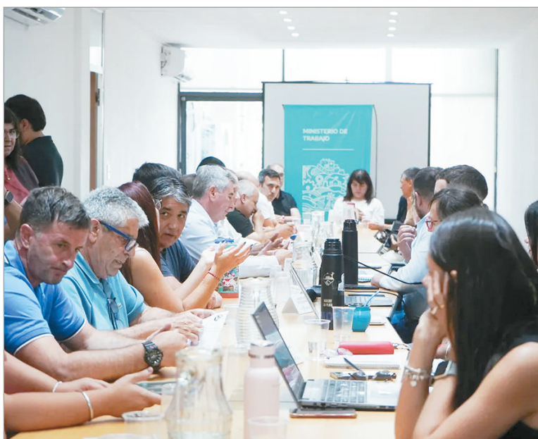
La oferta del Gobierno bonaerense fue considerada insuficiente y las negociaciones pasaron a cuarto intermedio

En la mesa paritaria, el FUBB insistió en que se contemple una compensación para los meses de noviembre y diciembre, con el fin de cerrar el año en paridad con la inflación. Los dirigentes remarcaron que la propuesta oficial no responde a las necesidades de los trabajadores y que el retroactivo es clave para evitar un desfasaje en los salarios. El último