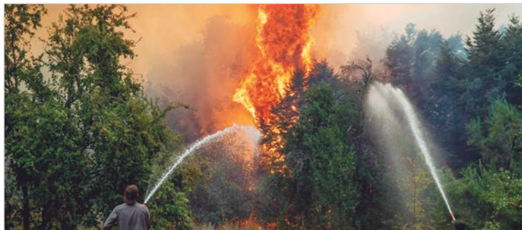
El proyecto busca asistencia inmediata y critica la falta de sensibilidad del Gobierno nacional