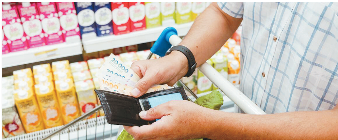
La inflación en 2025 cerró en 31,5%

La suba fue impulsada por alimentos y transporte