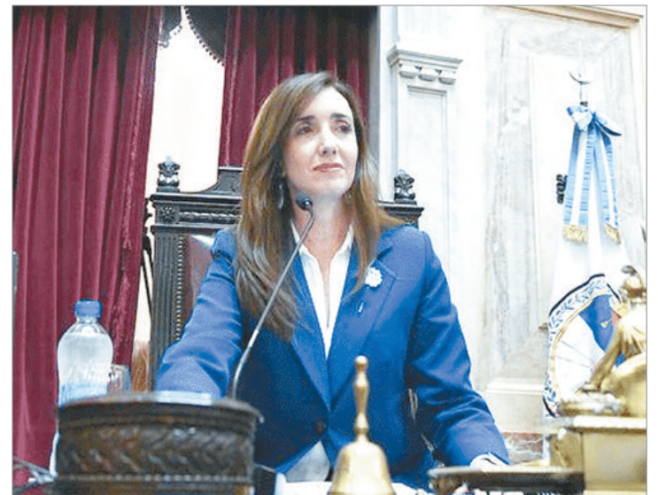
Villarruel propone penas más duras para quienes inicien incendios

“El art 41 de nuestra Constitución Nacional consagra el derecho a un ambiente sano para todos los habitantes así como la obligación a las autoridades de garantizarlo y restituirlo cuando éste resulta dañado. Nuestra Patagonia es un bien de todos los argentinos y de las generaciones venideras y nunca se debe escatimar en su cuidado y protección”, cerró su mensaje Villarruel.