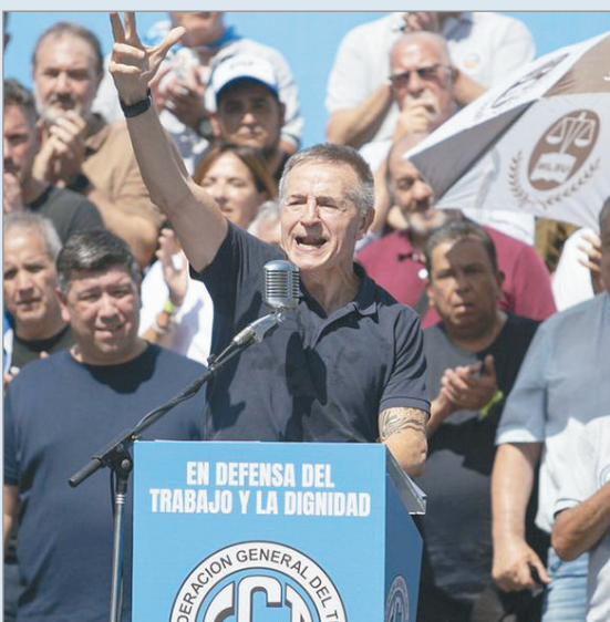
La CGT no asistirá a la mesa convocada por Bullrich

La Confederación General del Trabajo (CGT) rechazó, por el momento, sumarse a la mesa técnica que Patricia Bullrich convocó en el Senado para debatir la reforma laboral.