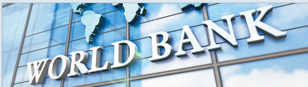
El Banco Mundial bajó las expectativas para Argentina

Al respecto, el organismo internacional remarcó que "el apoyo de Estados Unidos, incluyendo la provisión de líneas de swap, ayudó a estabilizar las condiciones financieras" y agregó que "la transición a una banda cambiaria en abril de 2025 aumentará la flexibilidad cambiaria, fortaleciendo su papel como amortiguador de shocks".