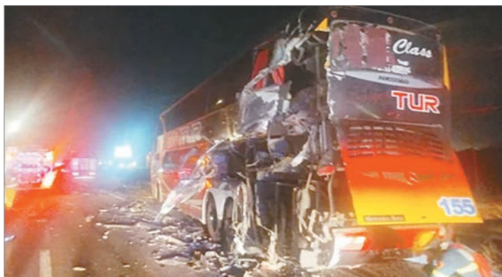
Los vehículos involucrados