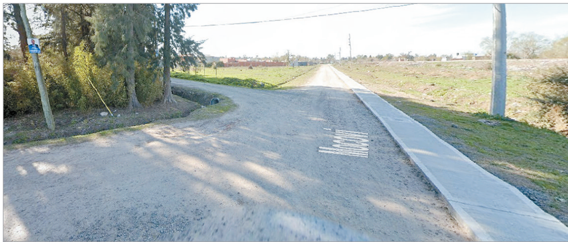
La zona del hecho

El hombre fue ultimado de varios disparos en la cabeza y los investigadores sospechan de un vendedor de drogas como el autor del crimen