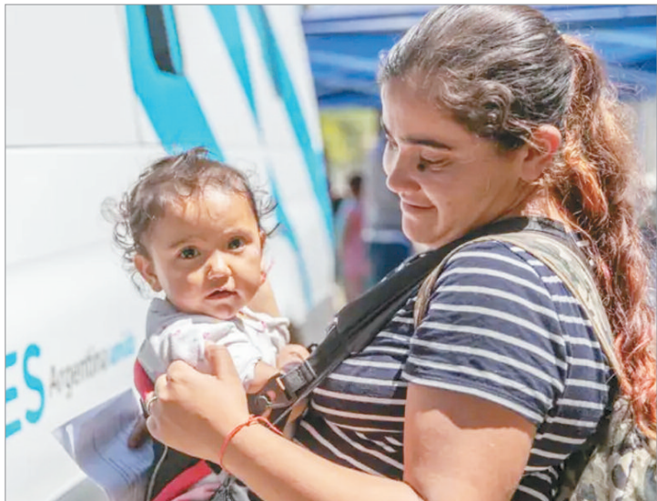
Quienes cobran AUH aumentaron su poder adquisitivo

En este escenario, los trabajadores públicos nacionales perdieron el 33% de su poder adquisitivo en términos reales; los trabajadores públicos provinciales del 6,5%; los jubilados que cobran el haber solamente (sin bono) del 9,3%; y los jubilados que cobran el haber mínimo y el bono del 7,5%.