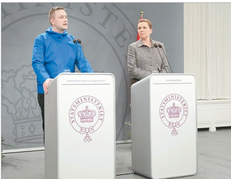
Aseguraron que Groenlandia “no está a la venta”

Nielsen reiteró que Groenlandia “no está en venta” y que es un Estado de derecho, y calificó la situación de “muy, muy grave”, debido a la “enorme” presión que hay sobre este territorio. “El límite es que no se puede comprar Groenlandia. Estamos juntos en el reino con Dinamarca y siempre seremos parte de la alianza occidental. El futuro de Groenlandia lo decidirán los groen-