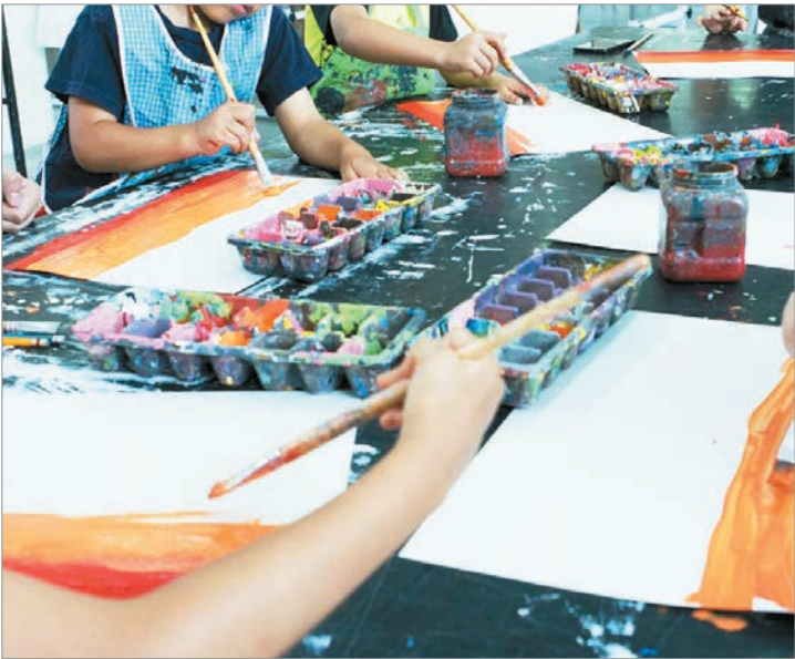
Para niños y niñas a partir de los seis años

La iniciativa tiene como objetivo garantizar el acceso gratuito al arte y la cultura en los barrios platenses, promoviendo espacios de encuentro, inclusión y desarrollo creativo para las infancias durante el verano, al tiempo que fortalece el vínculo comunitario y el derecho a la expresión cultural desde edades tempranas.