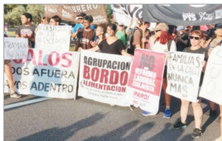
La empresa Lustramax echó a 29 empleados y los trabajadores reclaman diálogo y respuestas ante la crisis laboral

El conflicto se enmarca en un proceso preventivo de crisis presentado ante el Ministerio de Capital Humano, donde la compañía justificó la necesidad de despedir empleados, pese a haber declarado un patrimonio neto superior a los 11 mil millones de pesos en 2024.