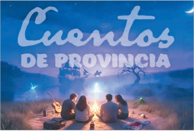
Relatos para conocer más Buenos Aires

La propuesta combina una experiencia cultural que invita a leer y a escuchar Buenos Aires, descubriendo sus paisajes, mitos y relatos durante el verano