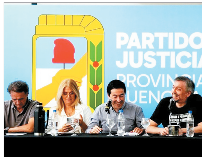
La oferta del Gobierno bonaerense fue considerada insuficiente y las negociaciones pasaron a cuarto intermedio