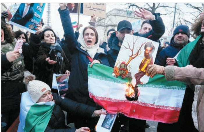
Estiman que podrían ser más de mil