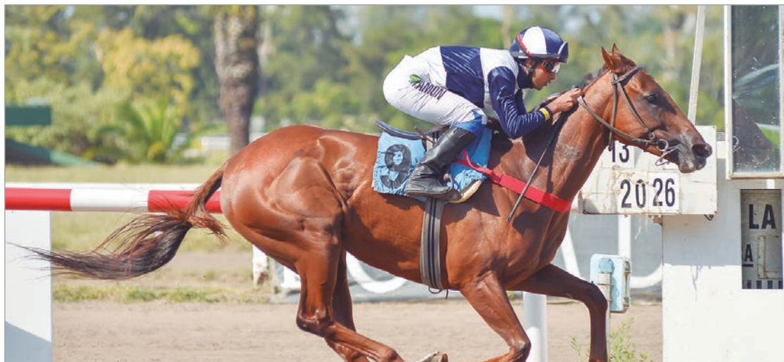
Ganó por “demolición”. Nuestra candidata Chica Global se vuelve para San Isidro con una espectacular victoria

E n una tarde calurosa de este “martes 13” de enero, por cuarta vez en el año, abrió sus puertas el Teatro del Turf del Barrio Hipódromo para ofrecer un programa de 11 cotejos. En el Premio “Magnificent” (L-1.200 mts.), nuestra candidata exclusiva –ningún medio especializado la nombró– Chica Global volvió a la senda triunfal y lo hizo en forma concluyente, ya que vino cerca del fuego peleando con Victorija y Argentina Libre, a quienes despachó ni bien pisaron la recta y se mandó a mudar, muy fácil, rumbo