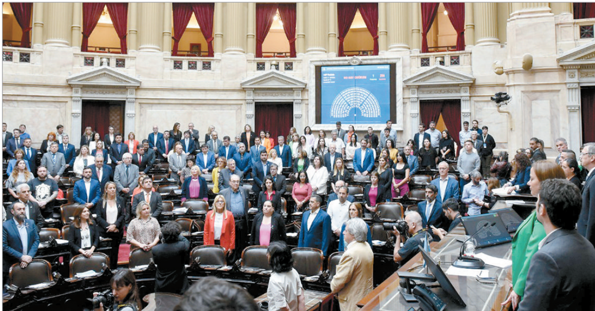
La oposición busca bajar el DNU

Mientras la oposición busca tratar el decreto en el Congreso lo antes posible, el oficialismo lo dilata. A su vez, crece el repudio social