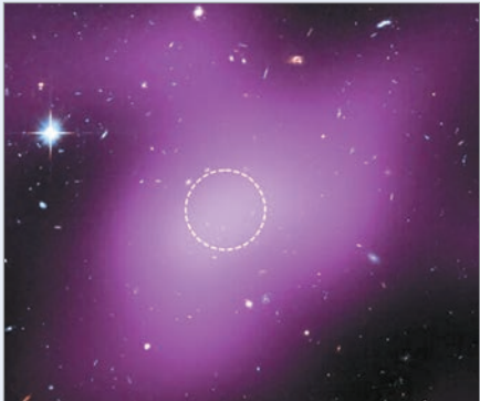
Se confirma la existencia de una estructura cósmica dominada por materia oscura

Esto la convierte en un “fósil cósmico”: un resto primordial del universo temprano que nunca encendió la formación estelar, lo que permite a los científicos estudiar direc-