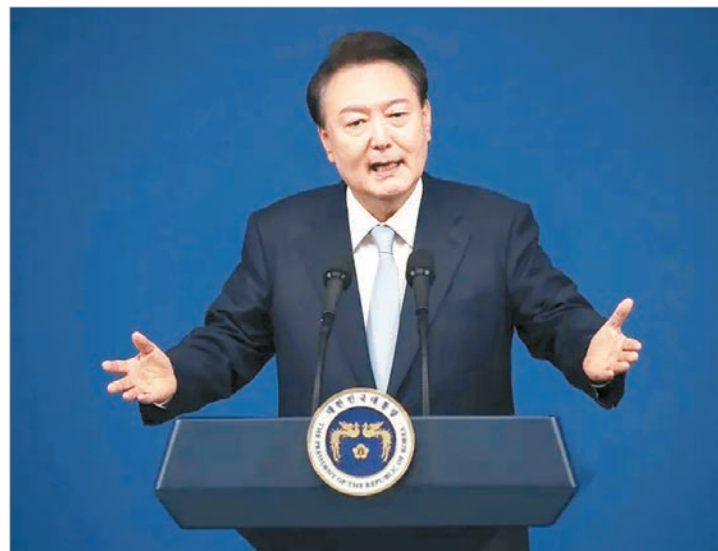
Se espera que el juzgado dictamine sentencia a principios de febrero

Según se indicó, Yoon enfrenta cargos como dirigir una insurrección, abuso de poder, obstrucción de justicia, ayudar a un enemigo y perjurio en relación con la ley marcial que el mandatario justificó como una manera de proteger a la nación de “fuerzas antiestatales”.