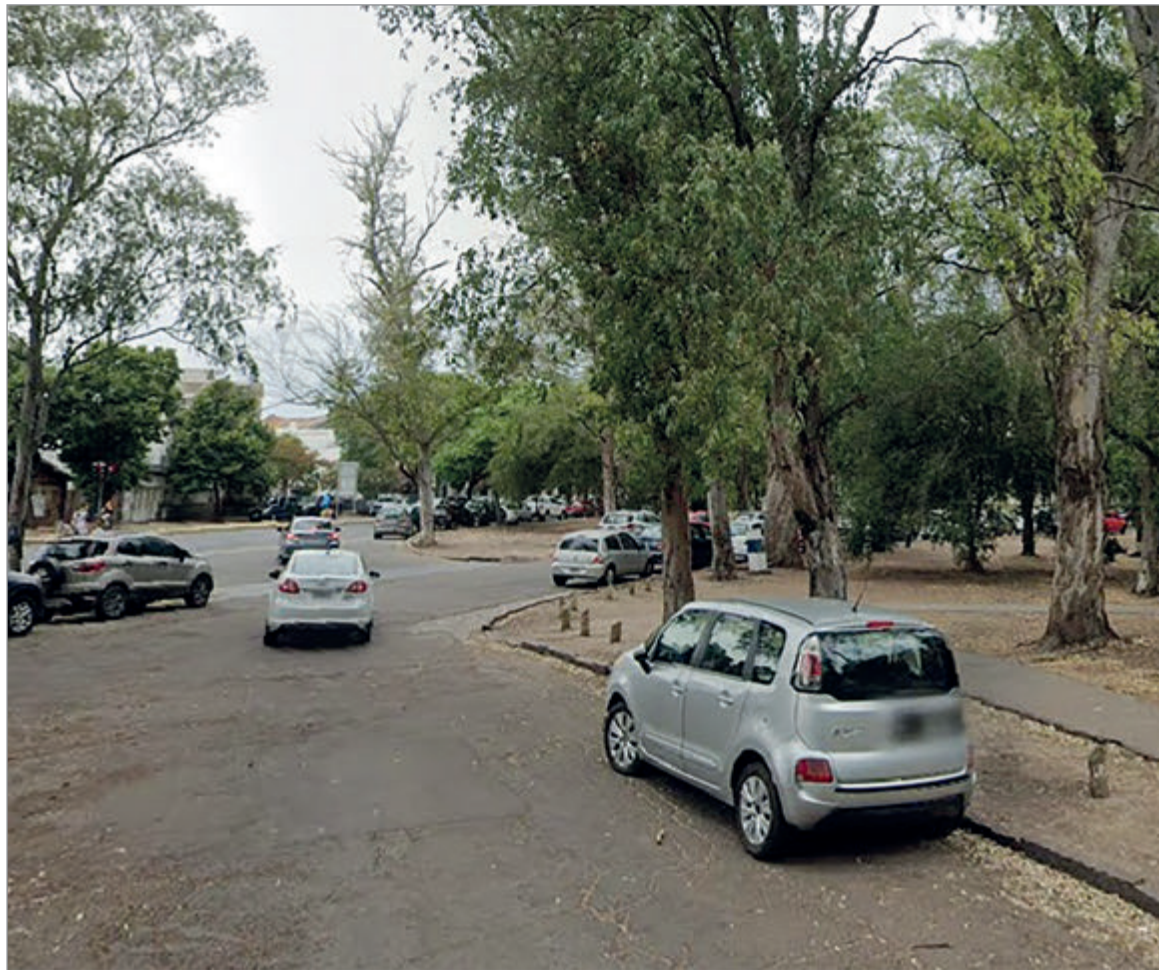
La zona de los hechos

Con los objetos de valor en su poder, la patota se retiró de lugar metiéndose nuevamente en la profundidad del bosque, sin ser identificados para luego darse a la fuga. Hasta el momento poco se sabe sobre el paradero de los sospechosos que actuaron bajo la modalidad del robo piraña y no se descarta que hayan protagonizado otros episo-