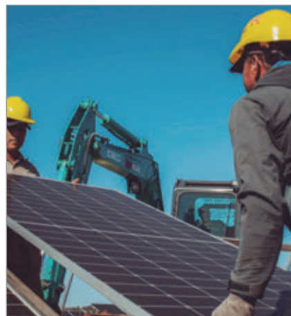
Lanzan un nuevo régimen para la energía renovable

El gobierno bonaerense reglamentó un nuevo régimen que habilita a vecinos, pymes y consorcios a generar energía renovable de forma conjunta e inyectar excedentes a la red