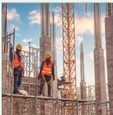
Construcción e industria, dos sectores que perdieron con Milei

Días atrás, el Indec publicó los datos de la industria y la construcción a nivel nacional correspondientes a noviembre, con caídas interanuales de 8,7% y 4,7%, respectivamente. Ante esto, el ministro de Economía de la provincia