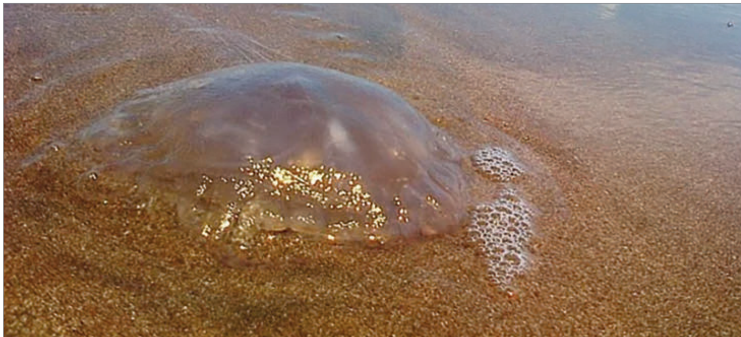
Es recomendable consultar al guardavidas cualquier duda

En todos los casos, los tentáculos poseen nematocistos, células microscópicas que liberan