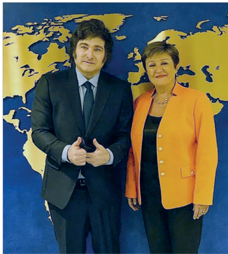
Las negociaciones con el Fondo se intensifican en medio de vencimientos inmediatos

Las reservas netas muestran un déficit superior a los USD 16.000 millones, cuando el acuerdo establecía que el rojo debía ubicarse cerca de los USD 1.000 millones. La brecha es tan marcada que analistas del mercado anticipan un nuevo permiso de excepción para sostener la relación con el Fondo. En paralelo, el calendario de vencimientos agrega presión, ya que en febrero deberán afrontarse pagos por USD 860 millones, una cifra similar a la de diciembre, cuando el Gobierno recurrió a financiamiento extraordinario para cumplir.