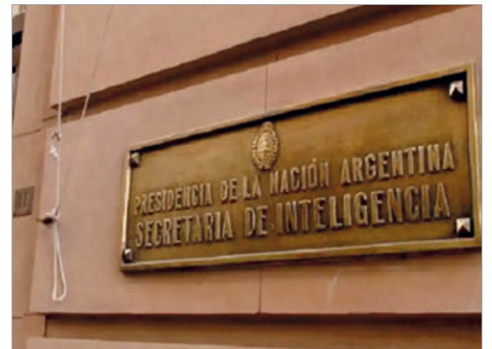
El CELS y Amnistía Internacional impulsan reclamos internacionales contra el decreto firmado por Milei

El Gobierno, por su parte, defendió el decreto y anunció que enviará una reforma más profunda al Congreso. Sin embargo, las organizaciones sostienen que el camino elegido profundiza la falta de transparencia y debilita los mecanismos democráticos.