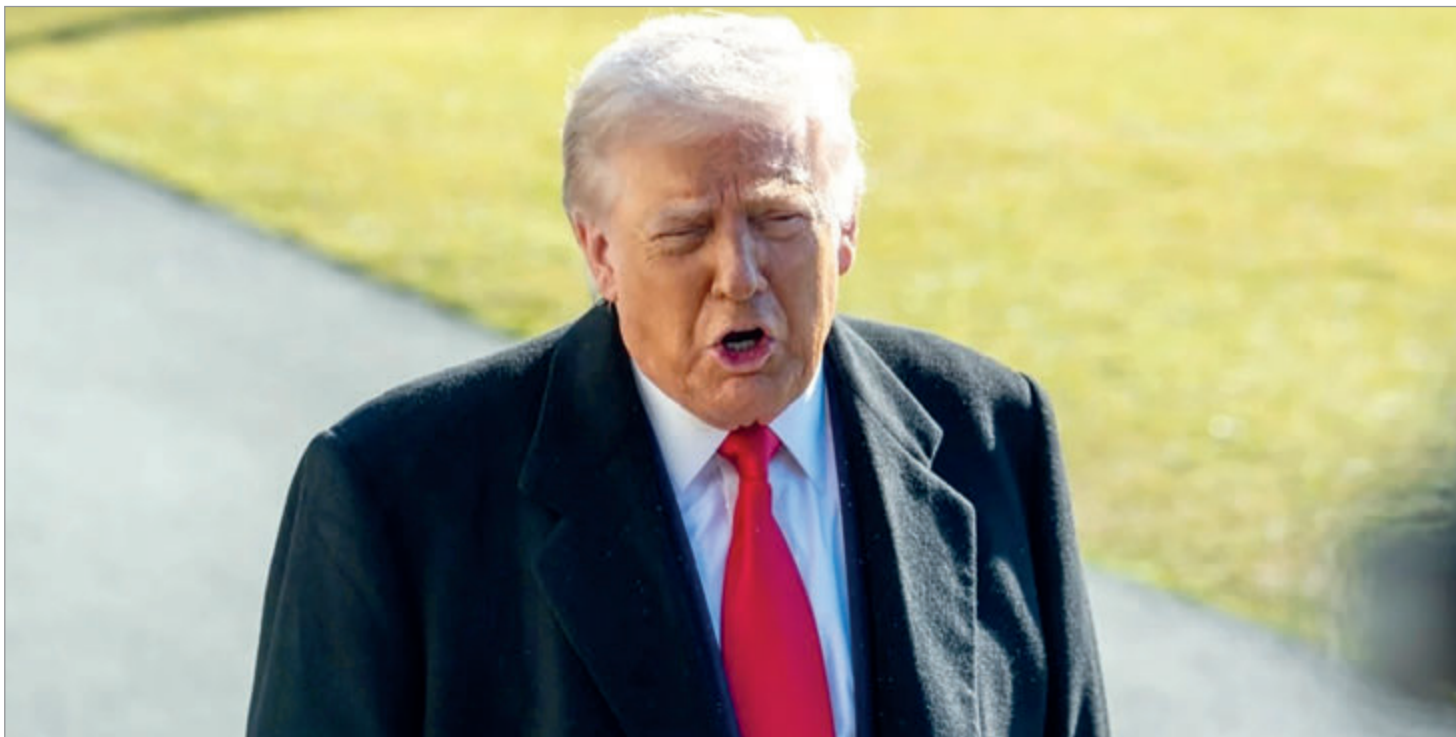
Groenlandia sigue firme posicionándose junto a la Unión Europea

Si bien Dinamarca ha gobernado Groenlandia durante siglos, la isla ha ido avanzando gradualmente hacia la independencia desde 1979, un objetivo compartido por todos los partidos políticos elegidos para el Parlamento del territorio. El ministro de Defensa danés, Troels Lund Poulsen, en un intento de rebajar las preocupaciones de Washington sobre la seguridad de Groenlandia, dijo que Copenhague está