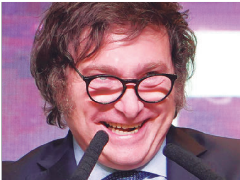
Solo en octubre se perdieron 30.000 puestos de trabajo formales

Desde su asunción hasta octubre de 2025, acumulan casi 273.000 puestos de trabajo formales menos. Además, desaparecieron 30 empleadores por día 12.836.496 en septiembre a 12.803.362 en octubre. Esto significa una reducción de más de 30 mil puestos de trabajo en un mes. En la comparación respecto a octubre de 2024, el mercado laboral perdió 91.100 trabajadores. De ese total, el empleo privado registrado se redujo en 58.000 puestos, el sector público en 18.400, y el trabajo en casas particulares en 14.700. Por otro lado, el número de monotributistas creció 2,5%, equivalente a 52.200 nuevas inscripciones, mientras