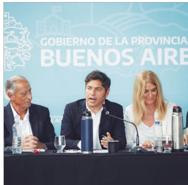
“Milei festeja la inflación mientras destruye la producción”

Luego de la conferencia de la tarde, Kicillof un encuentro con jefes comunales y dirigentes del espacio Movimiento Derecho al Futuro (MDF), el espacio político lanzado por el Gobernador en febrero de 2025, para analizar los desafíos de gestión de 2026 y trazar una hoja de ruta.