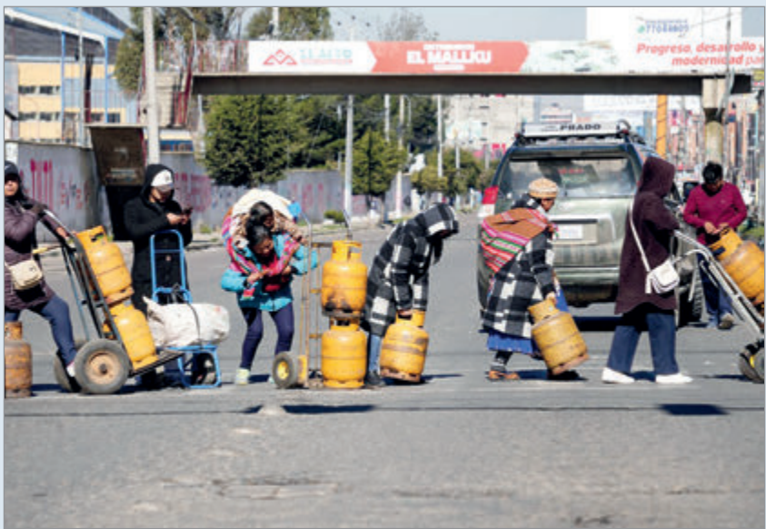
Es por la crisis económica

Bolivia declaró la jornada pasada, mediante un decreto, la “emergencia energética y social” debido a la crisis económica por la que atraviesa el país marcada por una inflación acumulada de 20,40% durante el año pasado y autorizó de manera excepcional la libre importación y venta de combustibles. “El presente Decreto Supremo tiene por objeto establecer y adoptar medidas excepcionales destinadas a garantizar el abastecimiento de combustibles y energía; reactivar la producción, con la finalidad de devolver la calidad de vida a las y los bolivianos y garantizar la reconstrucción integral de la economía boliviana”, se detalla en la normativa. La norma dispone la suspensión del diésel de la lista de sustancias controladas “con el fin de garantizar el abastecimiento continuo y oportuno de combustibles para el transporte, la producción, la agroindustria y los sectores estratégicos del país”. De esta manera, estas medidas adoptadas por el gobierno boliviano “tienen carácter excepcional, temporal e inmediato”.