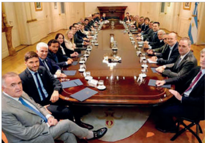
El escenario en las provincias se presenta complejo y genera discusiones con el Gobierno nacional

En paralelo, el mercado sigue de cerca las emisiones recientes realizadas por algunas provincias. Córdoba colocó USD 725 millones en junio pasado a una tasa cercana al 10%, Santa Fe logró financiamiento por USD 800 millones al 8% y la Ciudad de Buenos Aires se endeudó por USD 600 millones al 7,8%. Estos compromisos, sumados a los vencimientos inmediatos, configuran un panorama exigente que genera preocupación en el Gobierno nacional, donde temen que una mayor demanda de dólares por parte de las provincias vuelva a presionar sobre el tipo de cambio.