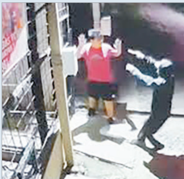
Una cámara registró el suceso

Dos delinquentes menores de edad asesinaron de un disparo en la cabeza a un joven durante un salvaje robo que se materializó en Tucumán y el hecho quedó registrado por las cámaras de seguridad, en las que se constata que la víctima no se resistió al hecho delictivo.