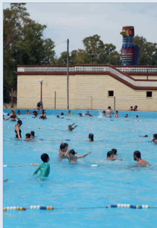
También hay actividades especialmente diseñadas para personas mayores y personas con discapacidad

Los interesados en tramitar la inscripción deben acercarse a la Secretaría de Desarrollo Social, ubicada en 7 N° 840 entre 48 y 49, 2° piso, de 8:30 a 14:30. Para participar es requisito presentar DNI, ficha médica actualizada y certificado de aptitud física, además de copia de CUD en el caso de las personas con discapacidad. Quienes deseen recibir mayor información pueden comunicarse a los teléfonos (221) 427-1532 y (221) 489-6493.