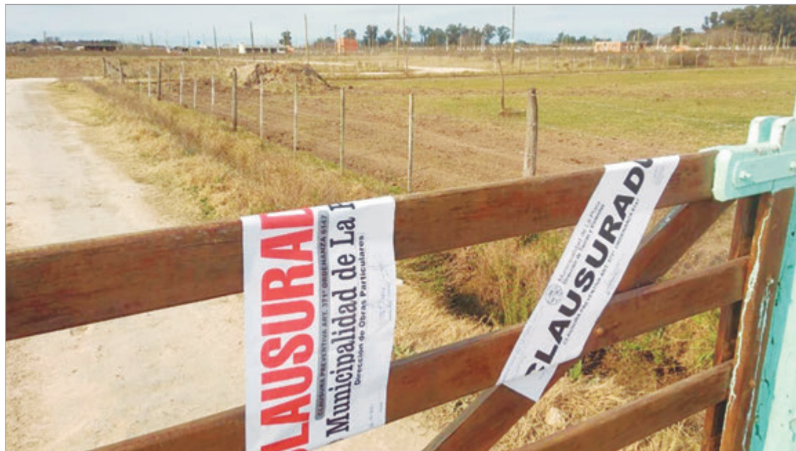
El Municipio platense advierte ante loteos ilegales

El Municipio de La Plata denunció la proliferación de ofertas de terrenos en zonas no habilitadas, por lo advirtió a la comunidad por posibles estafas