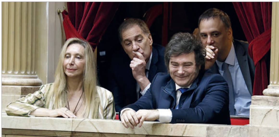
La Casa Rosada busca alinear voluntades para encarar el debate parlamentario

Con la reforma laboral como eje, el oficialismo retoma reuniones para alinear posiciones en un escenario legislativo adverso