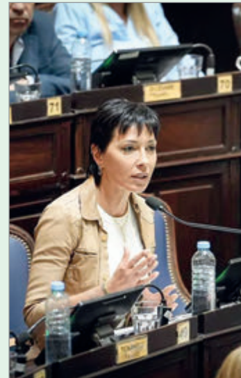
Responsabiliz  a Milei de la crisis industrial en Quilmes