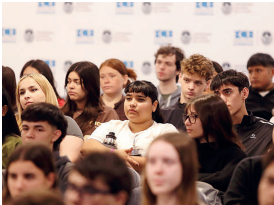
Previo a comenzar los cursos de ingreso

Desde la UNLP destacaron que estos números consolidan a la universidad como una de las principales instituciones públicas de educación superior del país, y anticiparon que en las próximas semanas se brindarán detalles sobre el inicio formal de actividades y el acompañamiento a los ingresantes en esta nueva etapa académica.