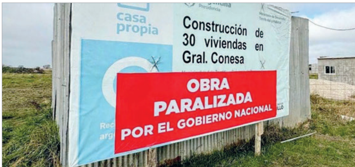
La obra pública quedó paralizada y no hubo proyectos nuevos en 2025

El último año el Gobierno no inició ningún proyecto de infraestructura, profundizando el ajuste y su impacto en el empleo y la producción