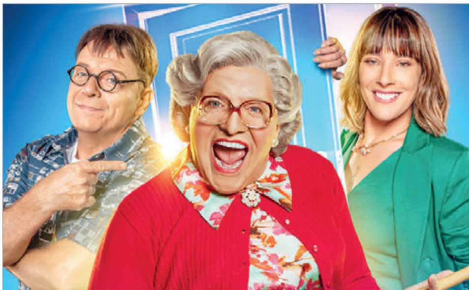
Caracterizados para la obra