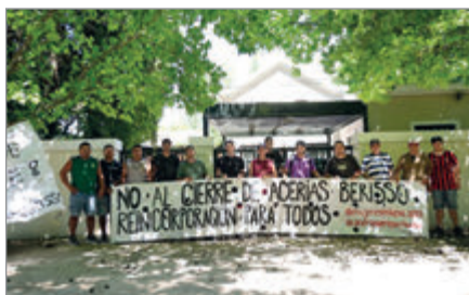
Los trabajadores reclaman armar una cooperativa

Los actuales due os se hab an hecho cargo de la hist rica metal rgica de Berisso hace m s de un a o. Cuando el conflicto sali  a la luz, desde la UOM sostuvieron que la situaci n se ven a agravando con demoras en el pago de sueldos, malos tratos, p simas condiciones laborales y despidos discrecionales.