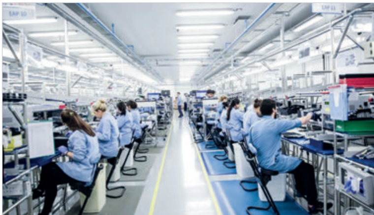
Esperan que la medida impacte en la industria local

Tras el anuncio del Gobierno nacional, comenzó a regir la eliminación de los aranceles para la importación de celulares. La medida completa el esquema definido por el decreto 333, que en mayo de 2025 redujo el derecho de importación del 16% al 8% y fijó su eliminación total para el 15 de enero. Durante el período en el que rigió el arancel del 8%, el ingreso de teléfonos importados no mostró un crecimiento significativo. “Menos impuestos, más competencia y mejores precios para todos. Dios bendiga a la República Argentina”, había publicado el jefe de Gabinete, Manuel Adorni, al anunciar la medida. Por el contrario, el gobernador de Tierra del Fuego, Gustavo Melella, expresó que “tras cada aumento de