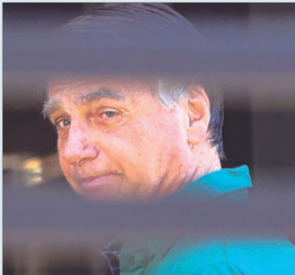
El expresidente brasileño cumple una sentencia de 27 años de cárcel por intento de golpe de Estado

El juez del Supremo Tribunal de Brasil, Alexandre de Moraes, ordenó el traslado inmediato del expresidente Jair Bolsonaro a la cárcel de Papuda, situada en las afueras de Brasilia.