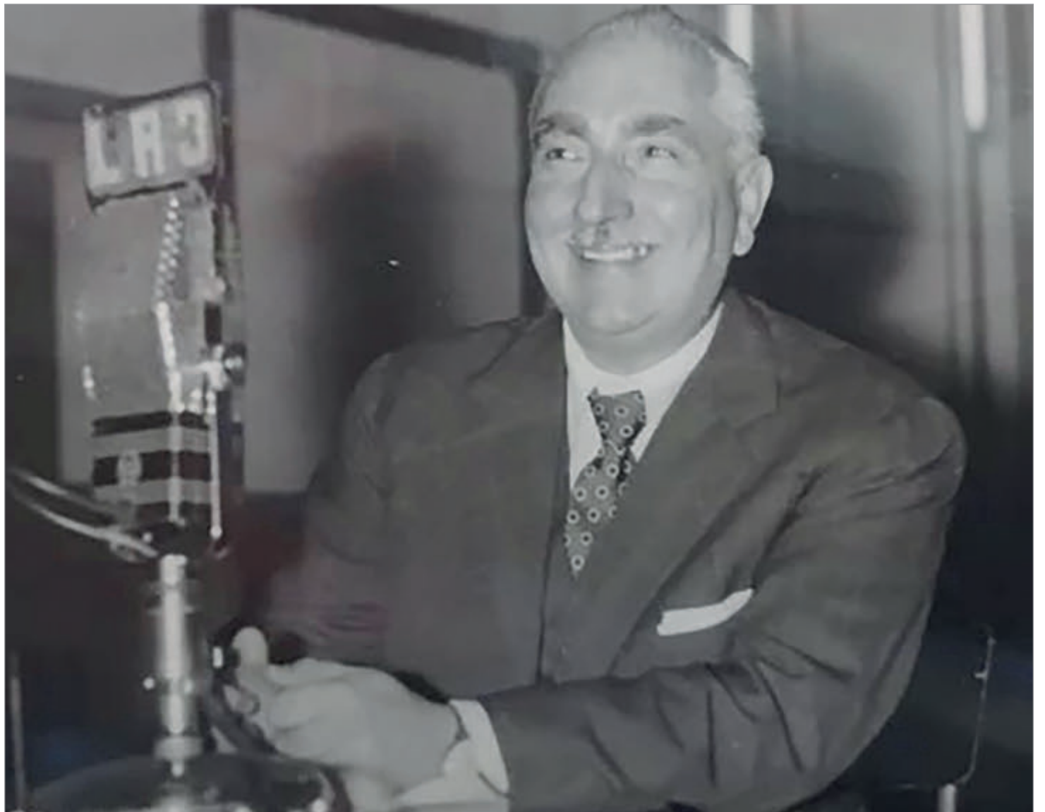
Oscar Alende era reconocido como el "médico de los humildes"

Como médico y político, Alende no creía en soluciones tibias o intermedias, de ahí que se recuerde una de sus clásicas frases: "O se cura o se muere". Como titular del Partido Intransigente se convirtió en una de las voces más duras del espectro político, aunque le retacearon infinitas veces espacio en radios, canales de televisión y prensa escrita. Decidido a no caer en trampas, ni aceptar acuerdos con el gobierno militar, porque entendía que los hechos eran irreversi-