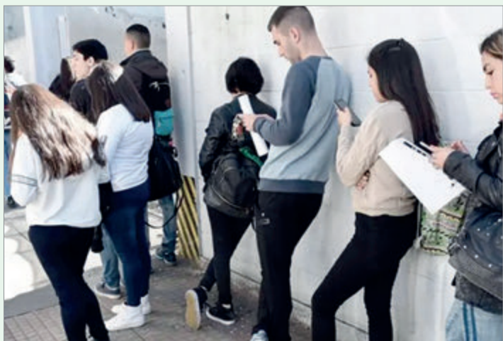
El mercado prevé que el empleo seguirá disminuyendo

Así, el mercado anticipa que, aun con reformas en marcha, la desocupación seguirá siendo una de las principales tensiones sociales y económicas del país durante 2026.