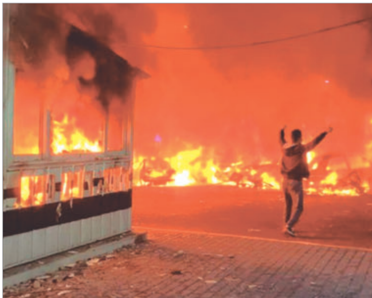
La ONU instó a rechazar posibles ataques militares contra Irán y evitar así una escalada del conflicto

Las manifestaciones comenzaron el 28 de diciembre de 2025 en Teherán, cuando comerciantes del Gran Bazar protestaron contra el colapso de la moneda nacional, la inflación descontrolada y el dete-