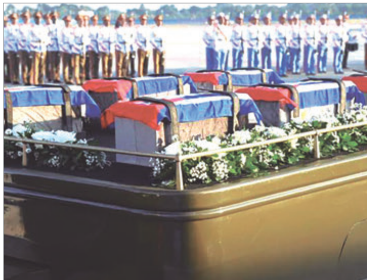
Guardias cubanos del Batallón Ceremonial cargan las urnas con los restos de 32 militares muertos

Los uniformados fallecidos pertenecían a las Fuerzas Armadas Revolucionarias y al Ministerio del Interior, las dos dependencias de seguridad de Cuba, y según la información oficial formaban parte de un convenio de seguridad bilateral.