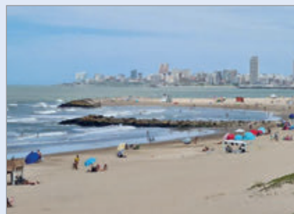
Los indicadores del turismo empeoraron

Seg n informaci n oficial brindada por el gobierno bonaerense, "desde el 1  de diciembre visitaron la Provincia 3,6 millones de turistas, lo que representa una ca da del 2,4% respecto al a o anterior". La tendencia se acentu  durante los primeros d as de enero ya que "registr  un descenso del 6,2% en comparaci n al mismo per odo de la temporada pasada".