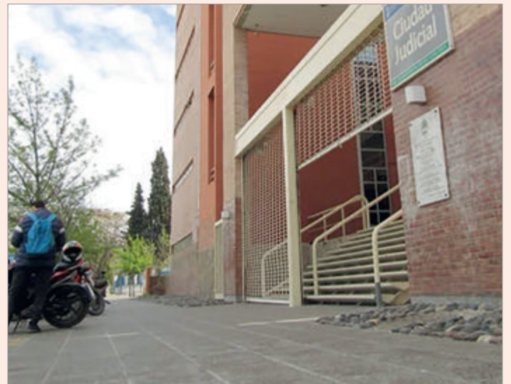
Terminó en el hospital

La Fiscalía, por su parte, fundamentó su pedido de prisión preventiva que finalmente registró durante el plazo de la investigación penal preparatoria, mientras continúan las medidas para reunir prueba y avanzar con el proceso judicial.