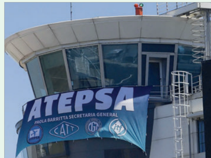
La conciliación obligatoria vence y el gremio mantiene la presión sobre EANA en plena temporada alta

El escenario combina tensiones gremiales y la amenaza de nuevas medidas de fuerza en un momento crítico para el turismo y el transporte aéreo. La falta de acuerdo mantiene en vilo a miles de pasajeros que dependen de una resolución que, por ahora, no parece cercana.