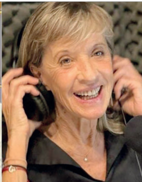
Duro cruce entre un periodista y la asesora del Gobierno

distista le cuestionó que no se puede hacer una política pública (como lo es la reforma laboral) sin estadística. Por último, la abogada aclaró que