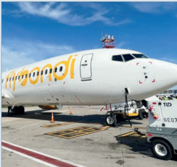
La ANAC constató incumplimientos tras 125 vuelos cancelados, pero por ahora no aplicó multas económicas

La Administración Nacional de Aviación Civil (ANAC) elaboró actas de infracción contra Flybondi por cancelar vuelos comerciales sin aviso y por reclamos de pasajeros que denunciaron incumplimientos en el servicio. Durante la última semana se registraron 125 cancelaciones, lo que motivó la intervención del organismo dependiente de la Secretaría de Transporte.