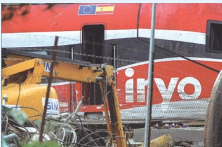
Es la tragedia ferroviaria más importante de los últimos años en España