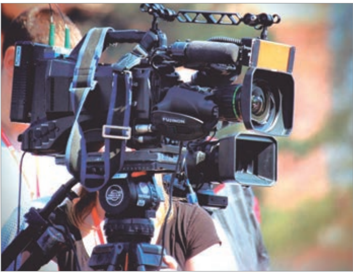
Cierre del tr nsito vehicular en inmediaciones del Pasaje

Para llevar esta historia a la pantalla, el rodaje contar  con una producci n que involucrar  a m s de 200 t cnicos y a casi 500 extras convocados a trav s del sindicato SUTEP (Sindicato  nico de Trabajadores del Espect culo P blico y Afines de la Rep blica Argentina).