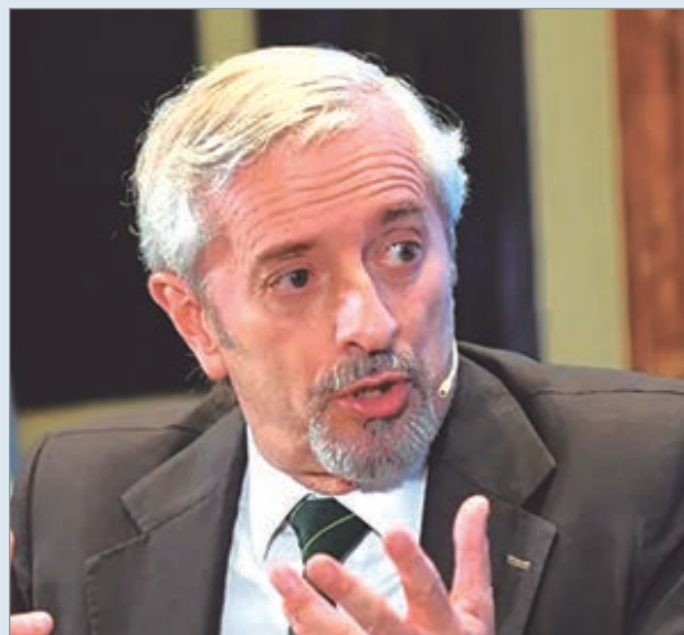
Carlos Casares dejó su cargo con críticas y es la quinta salida de funcionarios en días

La seguidilla de renuncias en el Gobierno sumó un nuevo capítulo con la dimisión de Carlos Casares como interventor del Ente Nacional Regulador del Gas (Enargas). Su salida, oficializada mediante una carta pública, se convirtió en la quinta registrada en apenas 24 horas.