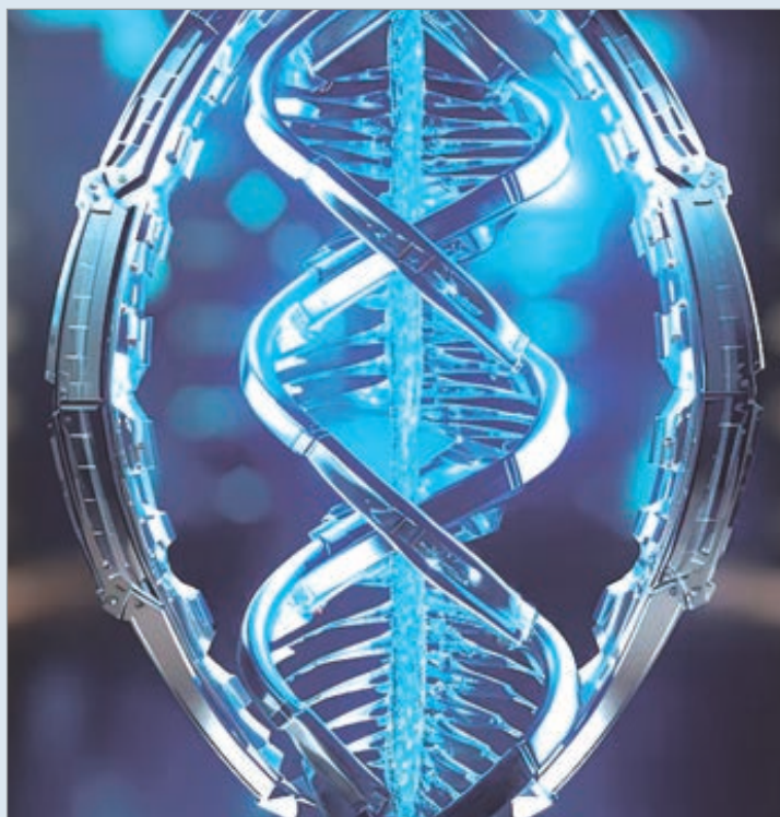
Esta nueva herramienta posibilita investigar las transformaciones celulares

La capacidad para rastrear cómo una célula responde y se adapta a lo largo del tiempo representa una de las fronteras más codiciadas de la biología. Durante décadas, investigadores buscaron herramientas que permitan archivar la actividad genética de las células para comprender mejor su evolución, sus respuestas al estrés celular y los motivos detrás de fenómenos como la resistencia de tumores a ciertos fármacos.