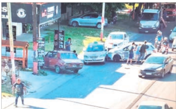
Las postales del suceso vial