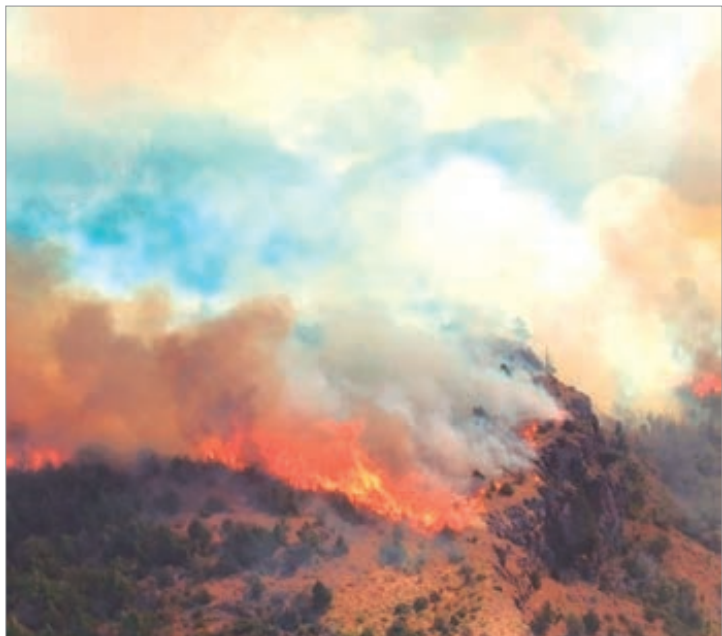
El radicalismo denuncia subejecución del Plan de Manejo del Fuego y exige sanciones por delitos ambientales

Por último, el partido expresó su solidaridad con el pueblo de Chubut y reconoció el trabajo de brigadistas, bomberos y voluntarios que enfrentan los incendios en la Patagonia. Para el radicalismo, la combinación de propuestas legislativas, denuncias políticas y acciones solidarias marca un camino de compromiso frente a una problemática que exige respuestas inmediatas.