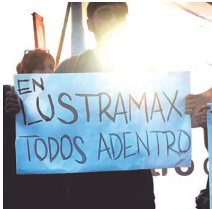
Despidos masivos y audiencias trabadas exponen el choque entre gremios y empresas que no cumplen la ley

Como contraste, en Industrias Secco se logró la reincorporación de 11 despedidos, incluidos delegados gremiales, tras ocho meses de lucha. El caso se convirtió en referencia para el sindicalismo provincial y refuerza la idea de que la organización y la presión sostenida pueden revertir decisiones empresariales. La reincorporación marca un precedente que hoy funciona como faro para quienes enfrentan la ola de despidos en la Provincia.