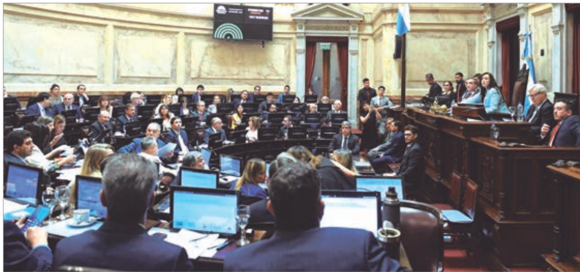
El bloque opositor intenta consolidar una estrategia común frente al avance oficialista

Bloques opositores articulan con la CGT una estrategia común para resistir el avance oficialista sobre los derechos laborales