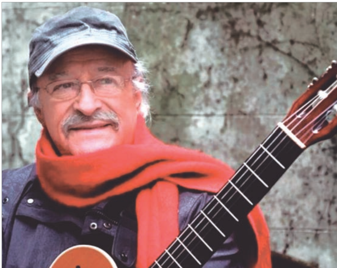
Isella fue uno de los músicos y compositores más notables del folklore nacional

A los 5 años ya actuaba en un circo y cobraba por su trabajo de cantante. Su infancia salteña y la influencia de la “mama vieja”, que le contaba historias del norte argentino y cantaba coplas populares españolas transformadas en rituales de habaneras, fueron la simiente que encontró cauce para su creación. Integrante durante una década de Los Fronterizos, recorrió países próximos y lejanos con el único afán de cantar por cantar.