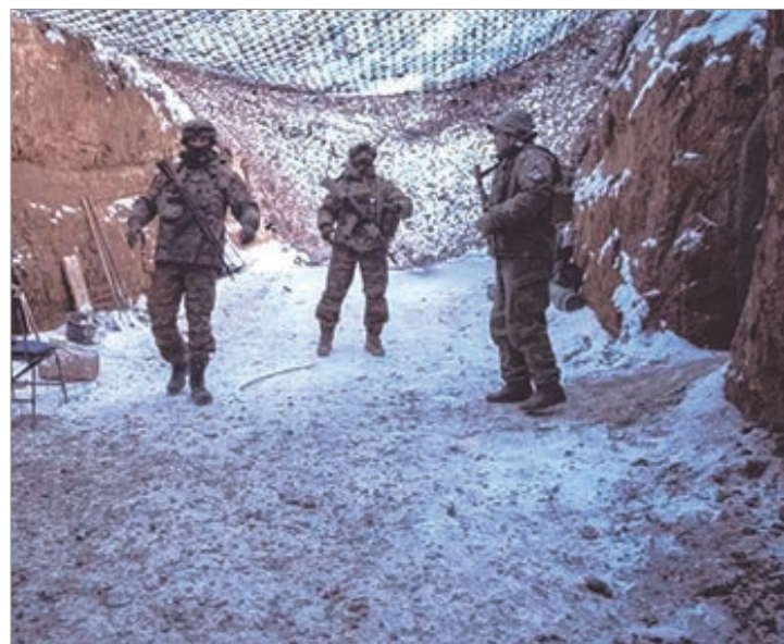
Para Rusia es vital tener poseer esta región