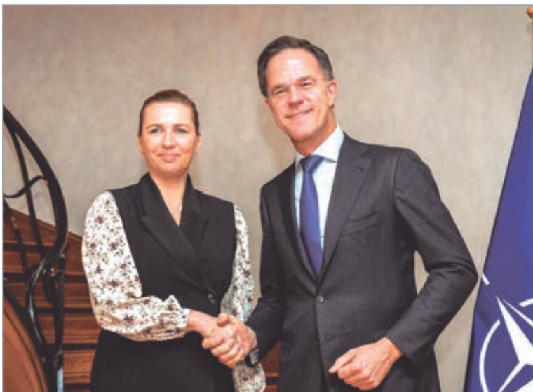
Europa no se fía de que Groenlandia esté exenta de un ataque estadounidense

Esta decisión se tomó dado que Europa no se fía de que Groenlandia esté exenta de un ataque estadounidense, como aseguró el presidente estadounidense Donald Trump en el Foro Económico Mundial en Davos. El jefe del Consejo Europeo, Antonio Costa, prometió después de la cumbre que el bloque “seguirá defendiendo sus intereses” y se protegerá