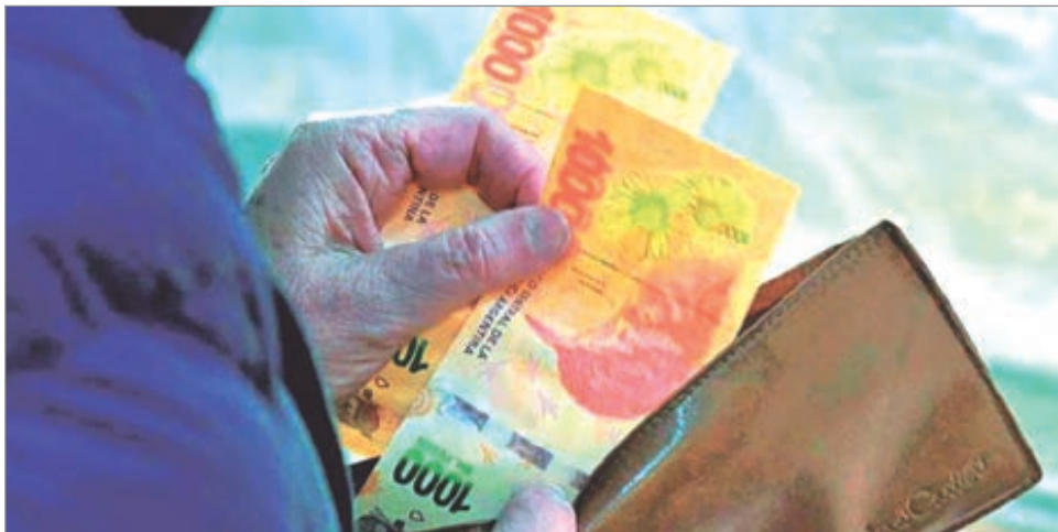
El deterioro salarial expone el impacto directo del ajuste sobre los trabajadores

Los salarios registrados volvieron a perder frente a la inflación y confirman el deterioro del poder adquisitivo en la gestión de Javier Milei. Según datos oficiales del Indec, en noviembre los haberes subieron apenas 1,8% mientras los precios treparon 2,5%. El resultado es una caída acumulada del 6,4% en el poder de compra desde el inicio del actual Gobierno. La supuesta recuperación macroeconómica no se traduce en mejoras para los trabajadores. En el trimestre septiembre-noviembre los salarios retrocedieron 1,7% en términos reales y solo en noviembre la pérdida fue de 0,7%. El sector privado registrado mostró un alza de 2,1%, mientras que el público apenas alcanzó 1,2%, muy por debajo de la inflación. En el acumulado de 2025, los salarios formales crecieron 26,2%, contra una inflación del 27,9%, lo que confirma el retroceso. Ante este escenario, la Asociación Trabaja-