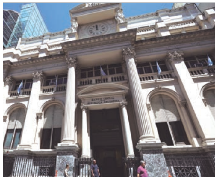
Ya adquirió más de 900 millones de dólares en enero

Para el 2026 se prevé que el BCRA adquiera hasta 10.000 millones de dólares, con un posible aumento de la base monetaria al 4,8% del PBI (actualmente en 4,2%). En las mejores condiciones, ese número escalaría hasta los 17.000 millones de dólares si la demanda de dinero supera el 1% del PBI.