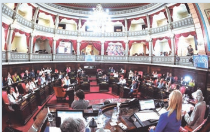
Presentan una batería de proyectos en el Concejo al respecto