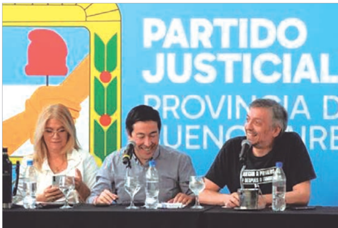
La demora en la validación judicial del padrón de La Matanza condiciona el cierre de listas y alimenta la tensión entre sectores

La Junta Electoral partidaria dio a conocer el listado que se usará en la interna del 15 de marzo, aunque la publicación dejó fuera de la nómina definitiva al distrito de mayor caudal del Conurbano por una controversia sobre nuevas adhesiones