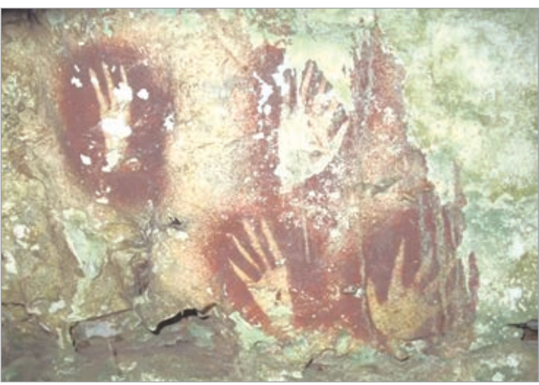
La pintura ofrece nuevas perspectivas sobre la expansión cultural de los primeros humanos modernos en Asia

Adam Brumm, coautor del estudio, explicó que la intención deliberada parece haber sido “dar la impresión general de una mano con