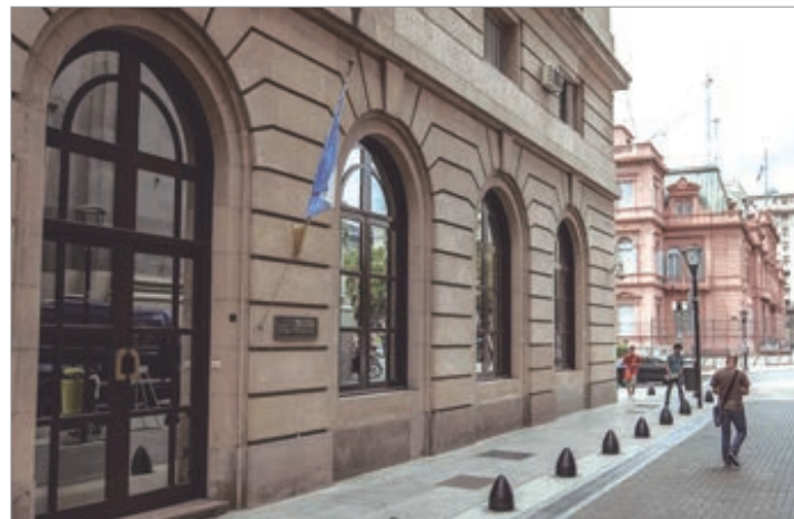
El DNU enfrenta resistencia parlamentaria y críticas por la falta de mecanismos de control

El oficialismo, por su parte, aún no muestra señales claras de ceder en torno al respaldo al DNU, y sectores aliancistas manifiestan cautela frente a eventuales cambios de postura que puedan facilitar el rechazo.