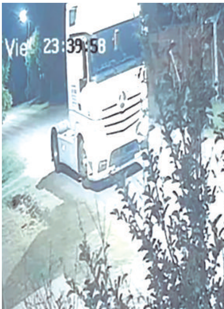
Los momentos del asalto

Como suele suceder en los robos bajo esta modalidad, uno de los maleantes descendió del ciclomotor y fue directamente hacia donde estaba su presa. El mismo hampón se subió al camión y enseguida le pidió que le diera la