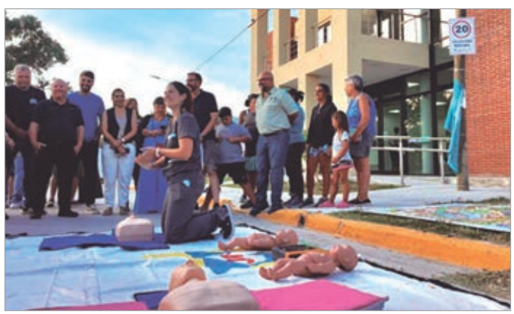
Se dio en el marco del operativo de Sol a Sol 2025-2026