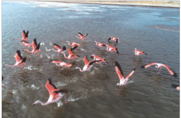
Tiene una superficie de 16.000 hectáreas y fue creado en el año 1980

Los pueblos originarios de la Cuenca de Pozuelos, antecesores del actual pueblo Kolla, mantienen vivas prácticas ancestrales como el trabajo con lana, la elaboración de tejidos, la construcción de viviendas y el manejo de camélidos.