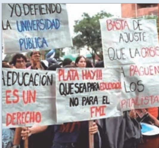
Gremios advierten que la mayoría de trabajadores mantiene salarios congelados en torno a los 250 mil pesos desde hace un año

Los sindicatos que representan a docentes universitarios alertaron que la mayor parte del personal continúa con sus salarios “congelados” alrededor de 250 mil pesos desde hace al menos un año, en un contexto de inflación elevada y sin apertura formal de negociaciones paritarias, según denuncias gremiales radicadas recientemente en distintos ámbitos del sector educativo. La situación fue expuesta como un síntoma del deterioro del poder adquisitivo de los salarios académicos frente al avance de los precios.