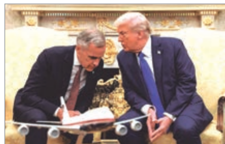
Estados Unidos acusó a Ottawa de facilitar la entrada de productos chinos

El líder de la Casa Blanca indicó que el