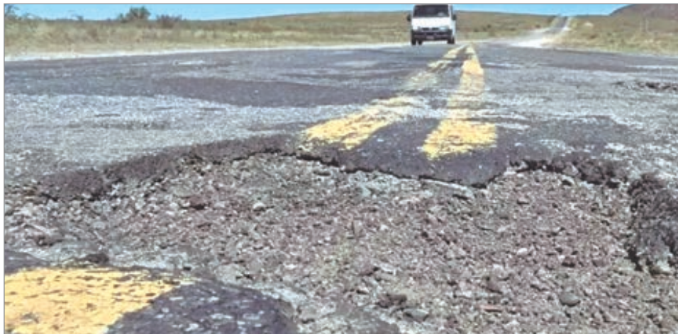
La falta de inversión vial agrava la siniestralidad y golpea a corredores productivos clave

Un informe técnico advirtió que la mayoría de las rutas nacionales presentan un grave deterioro por la falta de obras y mantenimiento sostenido