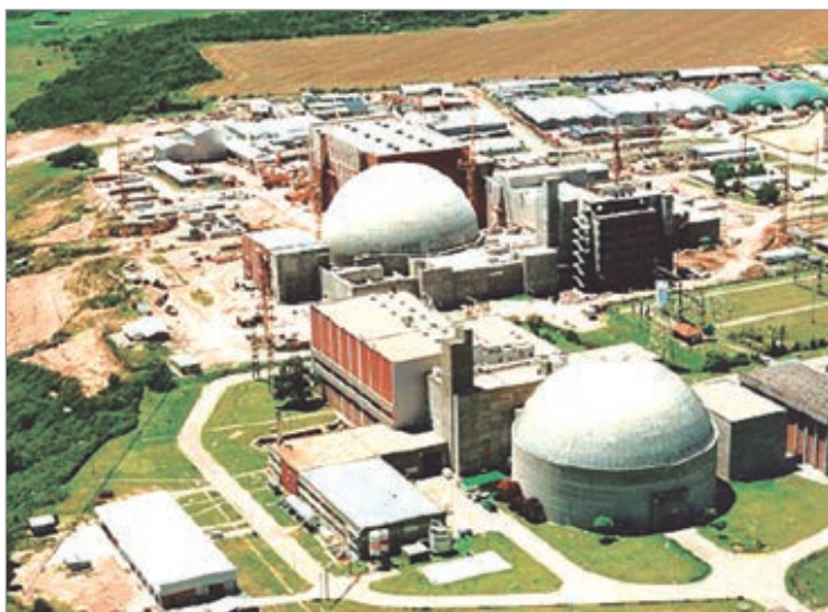
La compañía estatal que opera las centrales nucleares enfrenta una tensión institucional

Uno de los puntos más cuestionados es un proceso de licitación para la limpieza de las tres centrales nucleares —Atucha I, Atucha II y Embalse— cuyos costos habrían excedido ampliamente las estimaciones iniciales. Según fuentes sindicales y documentos internos, la contratación proyectada inicialmente en valores cercanos a 600 mil