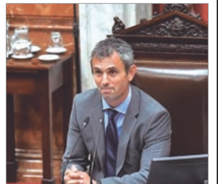
El oficialismo insiste en reducir la edad de imputabilidad este año

El legislador aseguró que la medida responde a un mandato ciudadano y reafirma la política de tolerancia cero frente al delito. A través de un mensaje en redes sociales, sostuvo que la iniciativa busca transformar el sistema penal juvenil y garantizar que las sanciones se apliquen sin medias tintas.