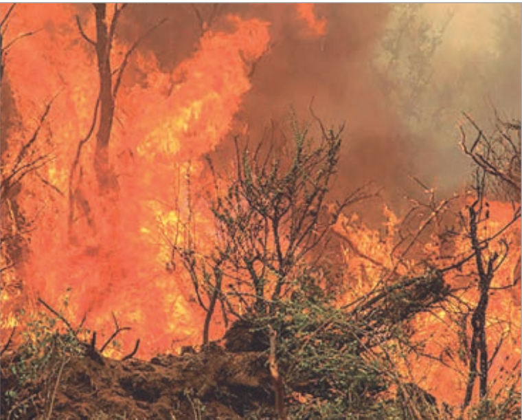
En Chubut los incendios consumieron 30 mil hectáreas

Nacional Los Alerces, fue declarado Patrimonio Mundial de la Humanidad, protege más de 259 mil hectáreas de la ecorregión de los Bosques Patagónicos. Desde el inicio del fuego, el parque permanece cerrado al turismo y se restringió el ingreso a toda persona ajena al operativo de emergencia.