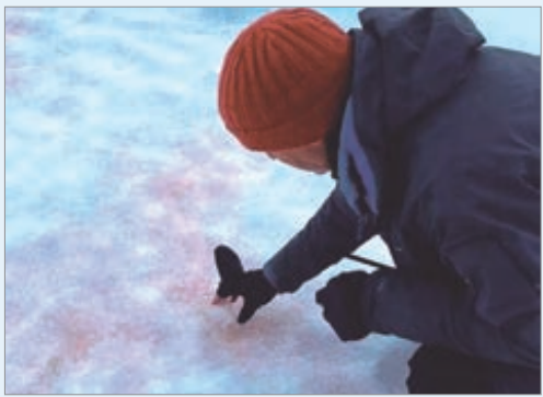
El trabajo documentó la presencia de las algas tanto en glaciares como en nieves costeras

Este cambio cromático no solo tiene relevancia visual, sino que incide decisivamente en la dinámica del deshielo. Los datos que aporta esta investigación permiten a la comunidad científica monitorear con mayor precisión la evolución de los ecosistemas polares y evaluar el impacto de los microorganismos sobre la estabilidad del hielo antártico.