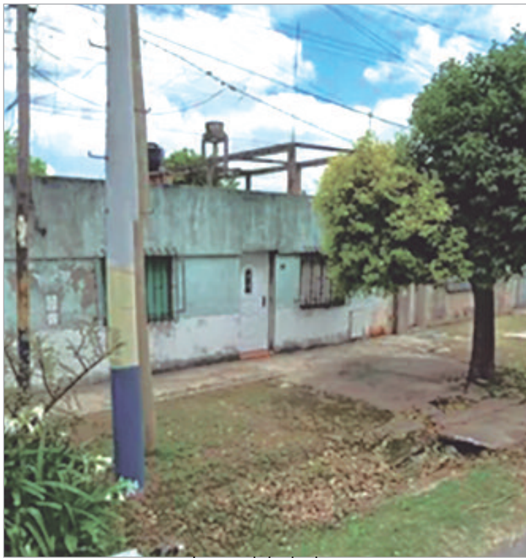
La zona de los hechos

De todos modos, todo es materia de investigación, por lo que tampoco