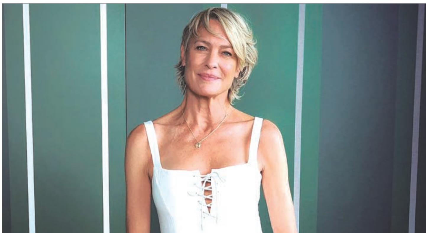
En la alfombra roja de los Globo de Oro

—Creo que definitivamente ha progresado, ya que se ven más historias protagonizadas por mujeres en primer plano y más directoras. Pero diría que es un buen progreso para