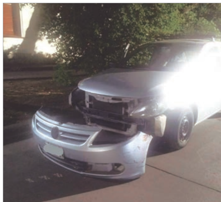
Los autos involucrados

El acusado de 47 años tiene domicilio en Pipinas, localidad perteneciente al partido de Punta Indio, fue arrestado y trasladado hasta la comisaría. Mientras que la víctima, de 36 años, sufrió heridas de carácter leve por lo que no requirió su traslado a un centro de salud.