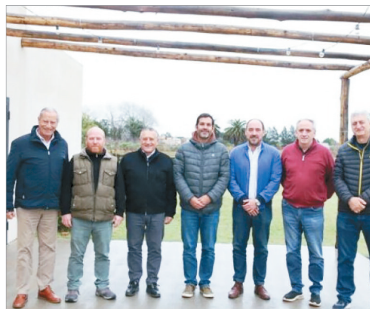
La interna pone en evidencia tensiones y estrategias territoriales en el PJ provincial

Este llamado a la unidad llega luego de semanas de conversaciones entre diversos sectores del partido, que en algunos casos han expresado desacuerdos sobre la forma en que se deben encarar las próximas elecciones internas y la representación de distintas regiones. La Quinta sección, por su peso demográfico y político, juega un rol clave en estas deliberaciones.