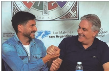
Los gobernadores piden proteger la coparticipación y modernizar sin recortar derechos laborales

La principal preocupación de los gobernadores radica en la reducción del Impuesto a las Ganancias para empresas, que según informes técnicos podría restar más de $3,1 billones a las provincias. “Hay que bajar impuestos, pero no solo los coparticipables”, reclamaron.