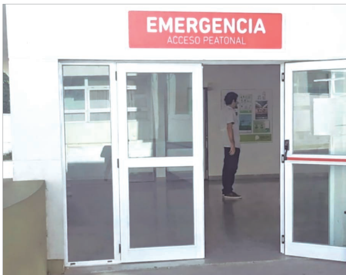
El nene fue derivado al Hospital Gutiérrez

El menor fue atendido de inmediato por el personal de la guardia pero, según detallaron los portavo-