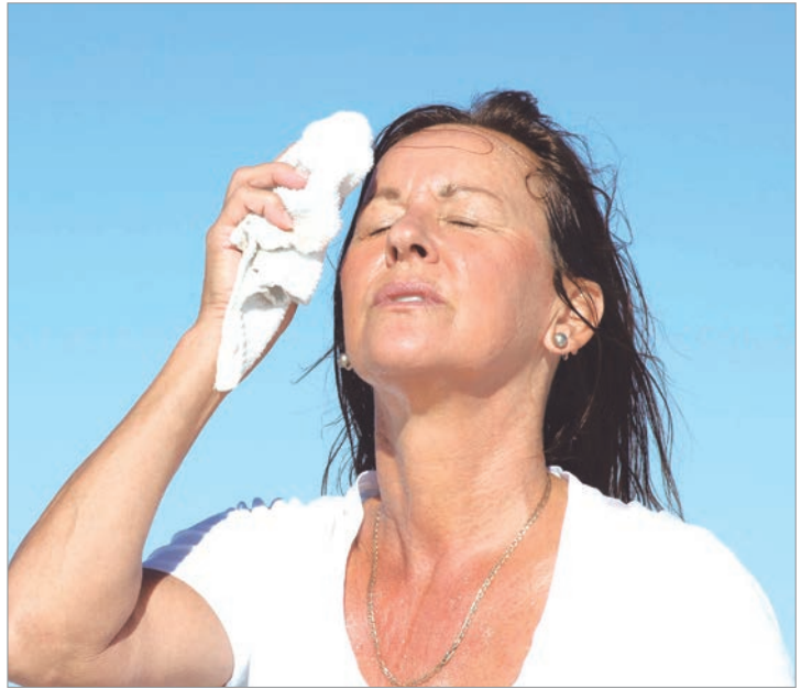
Hay que evitar la exposición solar entre las 10 y las 16 horas

tomar agua, incluso, aunque no se tenga sed, y evitar también las bebidas alcohólicas ya que aumentan la temperatura corporal y la pérdida de líquido. Una de las complicaciones de salud más frecuentes tras estar expuestos a elevadas temperaturas, es el conocido golpe de calor. Por eso, para prevenirlo, los especialistas aconsejan darle a los más chicos y adultos mayores agua segura o jugos de fruta en forma frecuente, y amamantar a los bebés con mayor frecuencia, bañarlos o mojarles el cuerpo si hace mucho calor. También, es preferible elegir una alimentación fresca, liviana y saludable, como frutas, verduras y ensaladas. Lo mejor es evitar comidas abundantes, altas en calorías, bebidas alcohólicas y gaseosas; y estar atentos con el tiempo que permanecen los alimentos fuera de la heladera, para no cortar la cadena de frío.