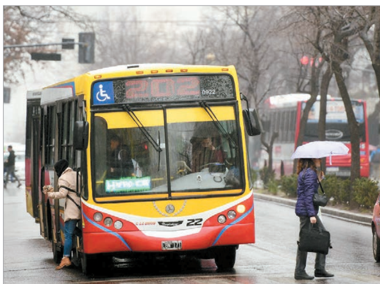
La falta de acuerdo salarial mantiene en tensión al transporte público de pasajeros

Ante esta situación, el Ministerio de Trabajo reprogramó una nueva audiencia, prevista para esta semana, con el objetivo explícito de intentar destrabar el conflicto antes de que se