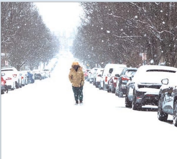
Una persona camina en soledad por una calle residencial cubierta de nieve

La tormenta invernal Fern avanzó este fin de semana sobre buena parte de Estados Unidos y mantiene bajo alerta a cerca de 140 millones de personas —más del 40% de la población—, desde Nuevo México hasta Nueva Inglaterra. Ya se reportaron más de 13.500 vuelos cancelados por las malas condiciones meteorológicas.