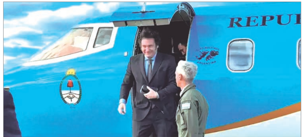
Milei viajará a Nueva York para participar de un evento de inversiones

Según Oxenford, la Argentina Week será el mayor evento de inversiones de los últimos años y busca mostrar oportunidades en secto-