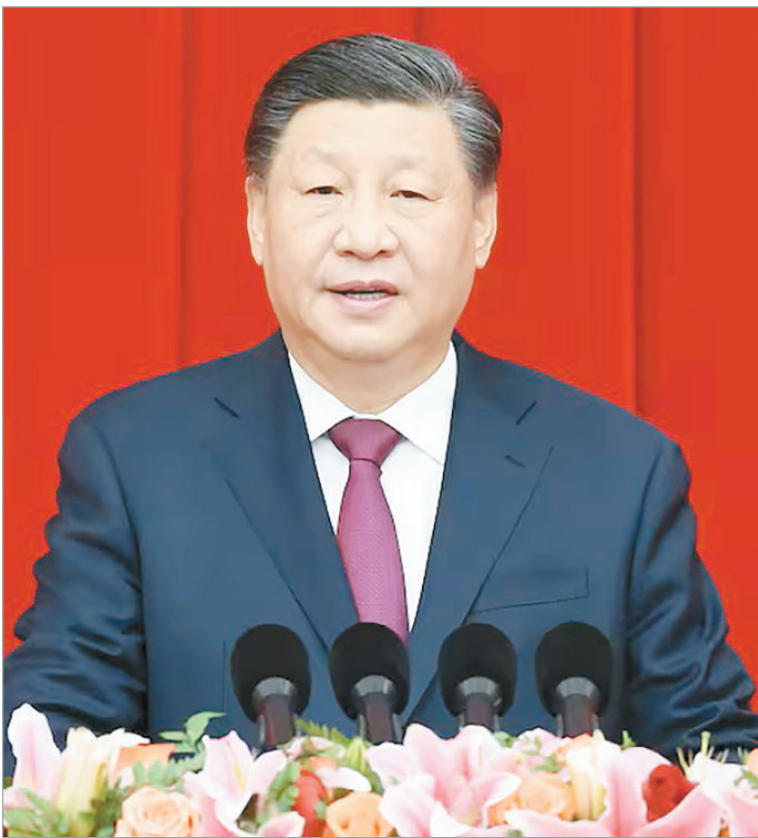
El máximo líder chino, Xi Jinping

Medios como The New York Times, Reuters y The Washington Post lo describen como una consolidación absoluta del poder de Xi sobre las fuerzas armadas, en medio de una campaña anticorrupción que ya ha afectado a decenas de altos mandos desde 2012. Por otro lado, en redes sociales y medios opositores circulan rumores intensos de un intento de golpe de Estado contra Xi Jinping, con supuestos tiroteos entre tropas leales a Zhang y guardias presidenciales, detenciones masivas (hasta 3.000 militares y familias de los generales), movilizaciones de ejércitos regionales hacia Pekín y hasta un presunto atentado frustrado el anterior domingo en