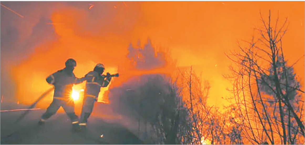
Anunciaron que el panorama no es alentador de cara a los próximos días

Durante el fin de semana se reactivaron focos que estaban controlados. Ante esta situación, reforzaron los operativos