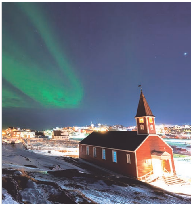
La aurora boreal ilumina el cielo sobre la catedral de Nuuk, Groenlandia