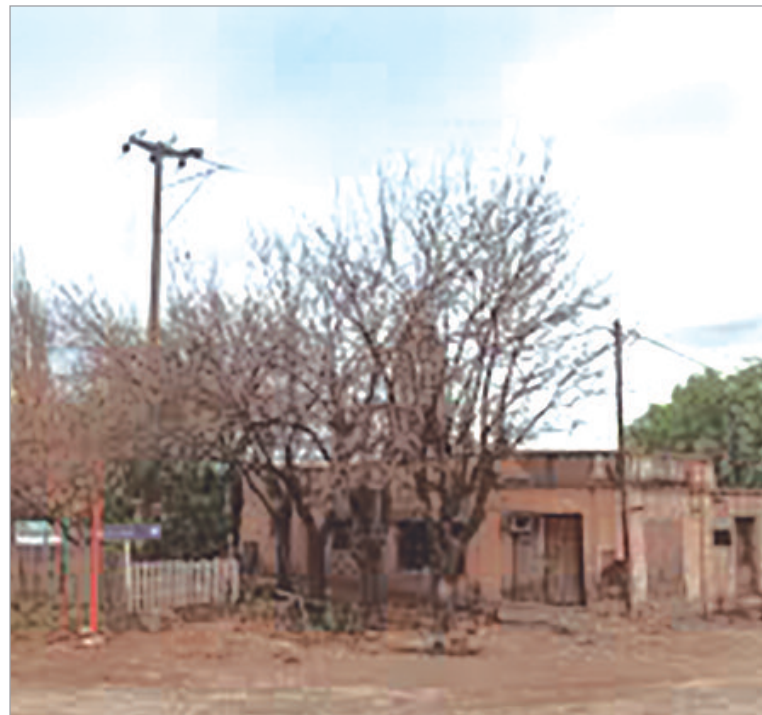
La escena del hecho

Poco después efectivos policiales se desplazaron al lugar tras recibir reiterados llamados al servicio de emergencias 911, que alertaban sobre una ráfaga de disparos en la vía pública. Según puntualizaron los portavoces, el agresor habría interrumpido la celebración bajo una lluvia de insultos que derivó en un enfrentamiento fatal.