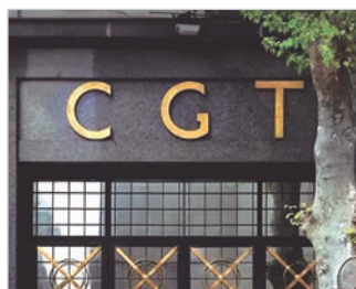
Los gremios presionan a gobernadores y senadores mientras crece el rechazo empresarial al proyecto oficial