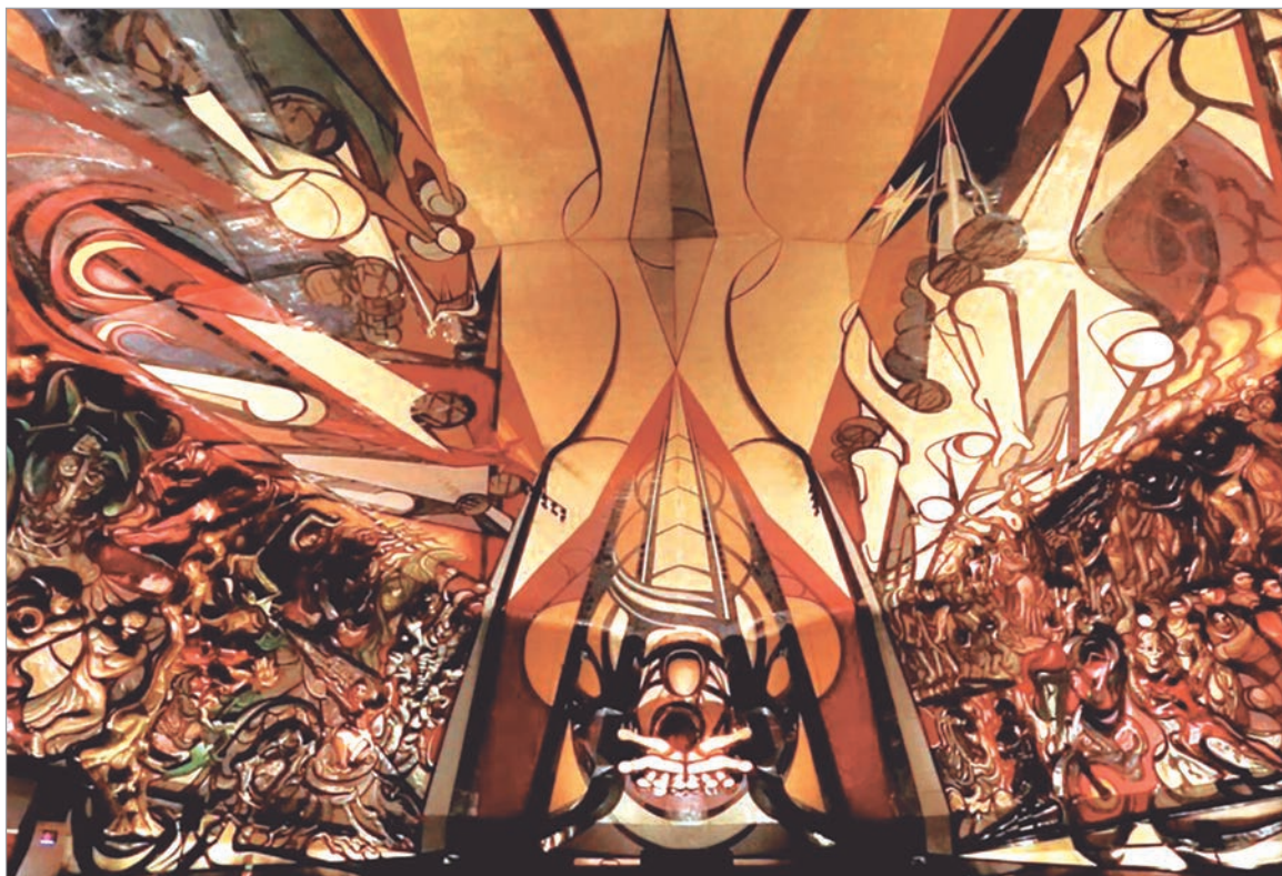
"La Marcha de la Humanidad", el mural creado por David Alfaro Siqueiros.

En su enorme taller de Cuernavaca, sobre un puente-grúa operado electrónicamente, se deslizaba a lo largo de un riel suspendido del techo. El ruido hacía estremecer los andamios que se levantaban junto a las paredes. Sobre su complicada estructura trabajaban los obreros manejando sopletes y pinceles. Los ayudantes, protegidos por sus cascos de seguridad, miden, consultan planos y calculan. La mayoría son mexicanos pero hay también japoneses, italianos, israelíes y franceses, algunos becados por sus gobiernos para aprender junto al maestro. Pesados camiones dejan su carga de chatarra en un depósito adyacente. Pero no se trata de una fundición ni de una fábrica de locomotoras. En medio de las chispas, los golpes y las órdenes dadas a gritos, lentamente iban tomando forma La Marcha de la Humanidad un mural de dos mil cuatrocientos metros cuadrados, que sigue siendo considerado el mural más grande del mundo.