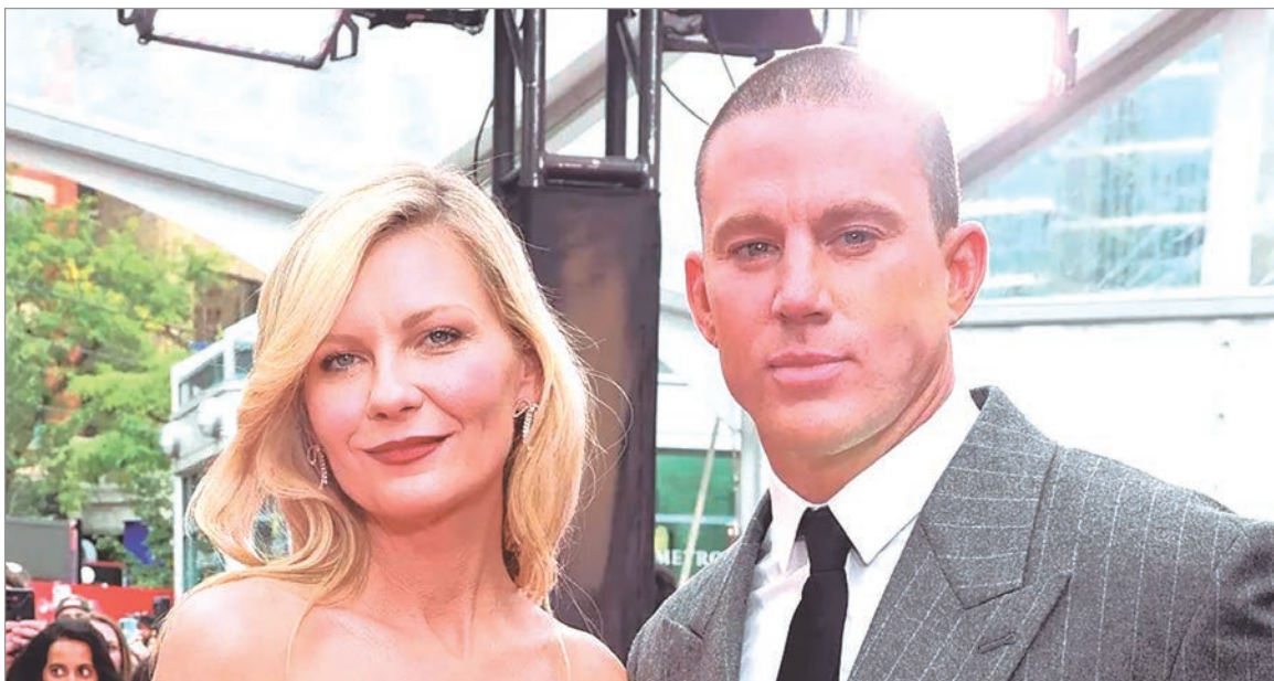
Fue una de las grandes películas de 2025

—Kirsten Dunst: Bueno, en mi caso, aprendí de las personas que me rodeaban. Como dije, empecé muy joven, pero tuve la oportunidad de