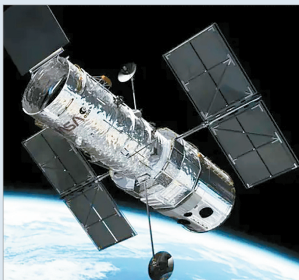
El telescopio espacial Hubble se sumergió seis mil millones de años luz.

La exploración del universo no deja de sorprendernos y ahora ha sido el telescopio espacial Hubble el que ha sido capaz de localizar en una región del cosmos un objeto masivo compuesto casi íntegramente por materia oscura, un hallazgo inédito que puede ayudar a entender mejor la formación de las primeras galaxias. Nos encontramos ante un nuevo misterio cósmico que ha sido hallado por un equipo internacional de astrónomos, que con ayuda del telescopio de la NASA y la ESA, han podido aportar más información sobre este objeto cósmico inédito que ayuda a confirmar algunas teorías sobre la formación de las galaxias.