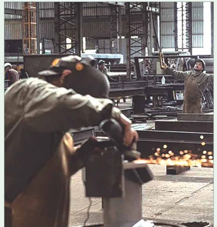
La caída del consumo impacta en la producción y condiciona las expectativas laborales para 2026

En conjunto, los datos del Indec exhiben una industria que opera con márgenes ajustados, sin impulso de la demanda y con decisiones defensivas en producción y empleo. El panorama anticipa un inicio de año complejo para el sector fabril, con tensiones crecientes entre la necesidad de sostener la actividad y la falta de políticas que reactiven el consumo interno, lo que profundiza la incertidumbre empresarial y condiciona las expectativas laborales. En este contexto, los analistas advierten que la recuperación dependerá de medidas concretas que devuelvan dinamismo al mercado interno.