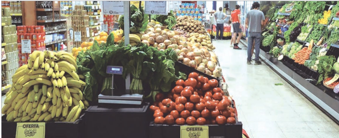
Los precios de carnes y verduras impulsaron la variación semanal en la tercera semana de enero

Pese al discurso oficial sobre la baja de los precios, el relevamiento semanal mostró aumentos en productos básicos como carne y verduras