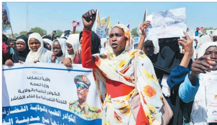
11 millones de personas se han visto desplazadas

Más de tres cuartas partes de los actos violentos (77 por ciento) son violaciones atribuidas en 87 por ciento a las FAR, recoge un informe reciente de la red Siha, que defiende los derechos de las mujeres en el Cuerno de África.