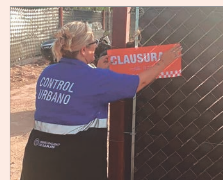
En Abasto tuvo lugar uno de los sucesos

“Fueron los vecinos los que avisaron, por la música alta y gritos”, detalló una fuente consultada.