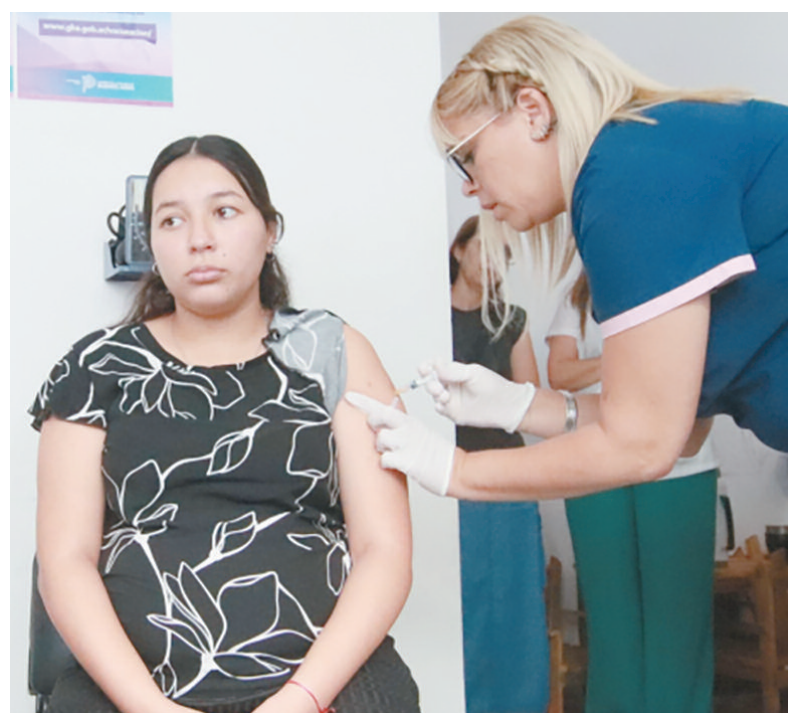
La cantidad de casos en menores de seis meses se redujo un 20%

"Vacunarse al final del embarazo es una de las mejores formas de