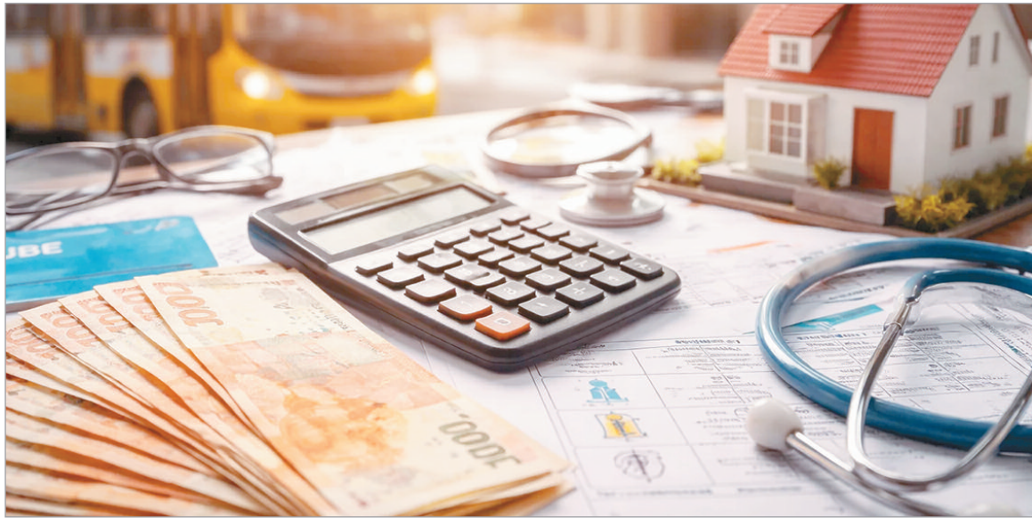
Algunos aumentos superan la inflación

Con una inflación en alza, las variaciones en los valores de los servicios, transporte, salud y alquileres no ceden