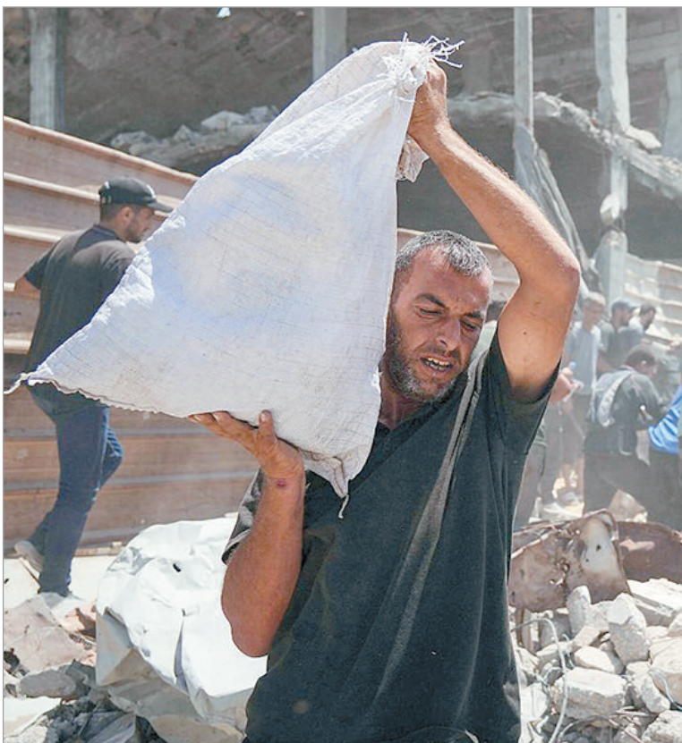
La organización se declaró abierta al diálogo con las autoridades israelíes

Médicos Sin Fronteras afirmó que había intentado durante meses