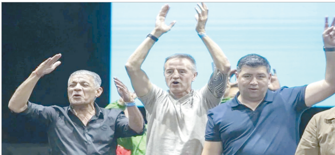
El sindicalismo busca apoyo político para frenar la iniciativa en el Senado

La central comienza en Córdoba su ronda de reuniones con gobernadores y advierte que habrá paros y marchas si la reforma laboral avanza sin cambios