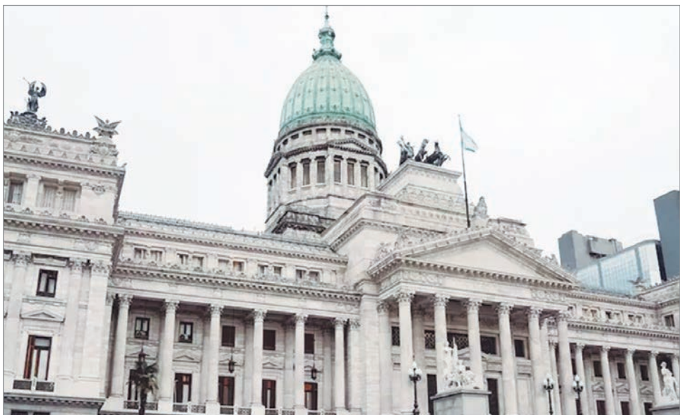
El Senado concentra las tensiones por la reforma laboral y penal juvenil

Mercosur y la Unión Europea, que el Ejecutivo busca reactivar en el Congreso. Otro punto relevante es el proyecto para modificar la Ley de Glaciares, que redefine criterios de protección y otorga a las provincias la facul-