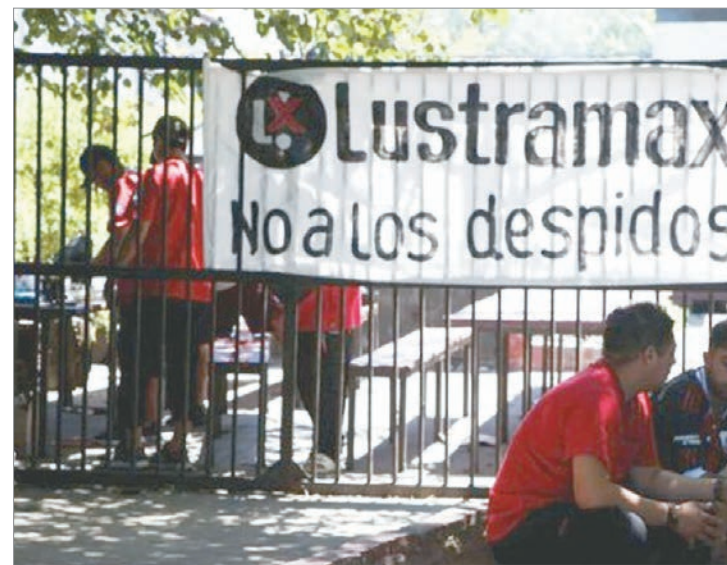
Senadoras y diputados bonaerenses reclamaron la reincorporación de 28 empleados a la fábrica