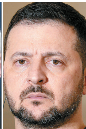
Sucedirá el miércoles y el jueves