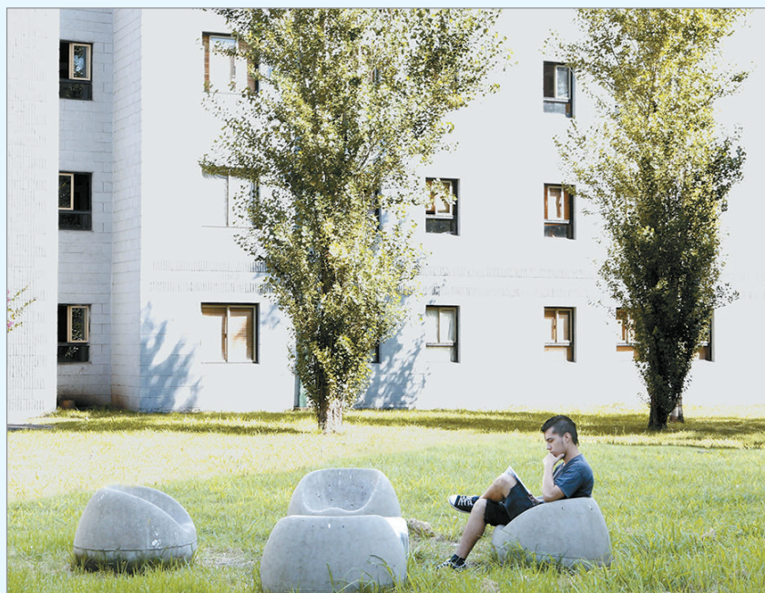
Comienzan a llegar a partir de esta semana