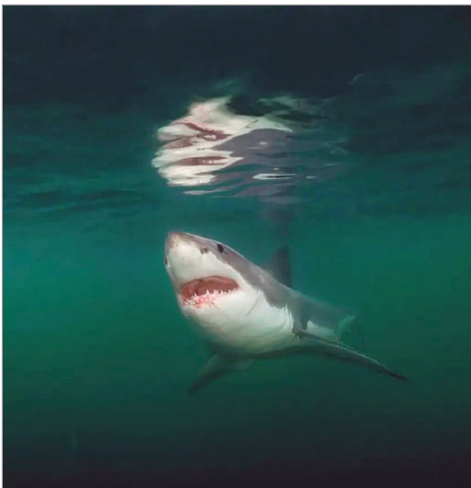
Un gran tiburón blanco en el golfo de Maine, Estados Unidos.