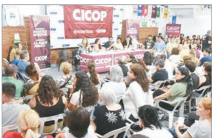
Cicop y sindicatos unidos lanzan plan de lucha contra la reforma impulsada en el Congreso

Desde el espacio sindical remarcaron que la propuesta no ofrece mejoras en la creación de empleo ni en la calidad del trabajo. En esa línea, señalaron que la reforma busca desmantelar el tejido industrial y consolidar la utilización de los salarios como ancla frente a la inflación. Asimismo, advirtieron que se pretende legalizar prácticas ya instaladas, como el techo impuesto por el Estado a las paritarias.