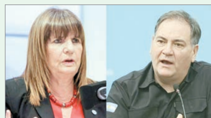
El ministro bonaerense acusó a la senadora de usar la discusión sobre con fines políticos