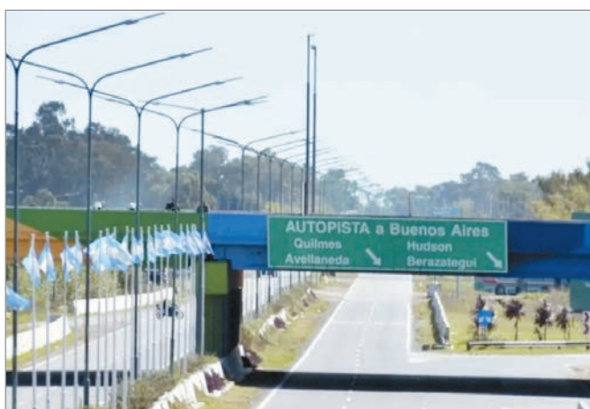
Remodelarán la subida a la Autopista