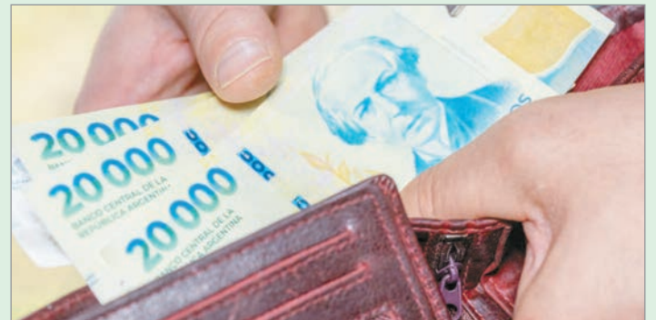
Las paritarias cierran por debajo de la inflación

Como la inflación mensual es muy alta, las paritarias siguen quedando debajo de la inflación. Hasta septiembre pasado, el 70% de los convenios estaba por debajo de 2%, actualmente menos del 50%. “Esto lleva a esperar que la tendencia al estancamiento (o caída) de los salarios continúe en el marco de las dificultades del Gobierno de bajar la inflación por debajo del 2% mensual”, agregaron los especialistas en el documento publicado.