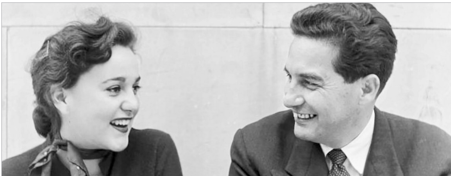
Octavio Paz y Elena Garro: dos mentes brillantes para el desencuentro