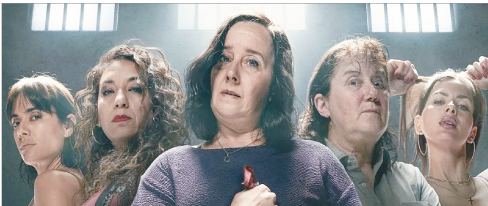
El 13 de febrero, En el barro promete convertirse en uno de los grandes eventos televisivos de 2026

La reacción de la actriz no se hizo esperar. A través de su cuenta de X, la novia de Mauro Icardi compartió el anuncio oficial y acompañó la publicación con dos emojis