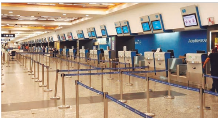
ATE denuncia incumplimientos salariales y mantiene asambleas que afectan la operatoria aérea

Cabe señalar que, ante la aplicación de una medida de fuerza, la normativa vigente establece un preaviso de cinco días para los servicios esenciales, lo que trasladó la fecha probable del paro al 9 de febrero. Sin embargo, la tensión no disminuyó: los trabajadores acusan al Gobierno nacional de desconocer un aumento salarial previamente acordado, reliquidar haberes y dejar a