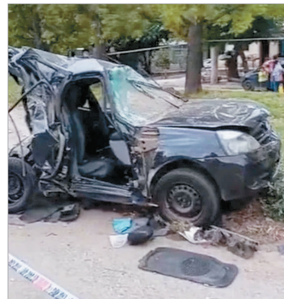
Así quedó el vehículo de menor porte

Un fatal accidente de tránsito conmocionó a la ciudad de Córdoba en las primeras horas de este domingo. Cerca de las 3 de la madrugada, una colisión por alcance en la intersección de General Manuel Savio y Diego de Funes y Salinas terminó con la vida de dos personas, de acuerdo a lo informado ayer por fuentes policiales y judiciales.