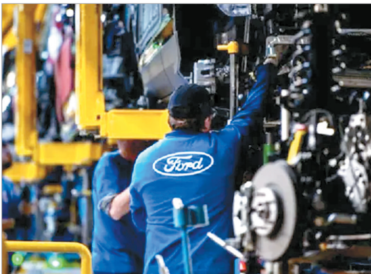
La empresa lleva 65 años de historia en el país

“La planta de Pacheco es hoy un centro industrial de última generación, con productividad y calidad de clase mundial; pero sin exportaciones, sería una planta sin futuro”, escribió Galdeano en un posteo en LinkedIn.