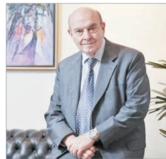
El exministro pidió emisión para comprar reservas

En la publicación de su blog, Domingo Cavallo señaló que una de las claves para reactivar el mercado interno es “comprar reservas con emisión”, a la que consideró como “la política monetaria más apropiada”.