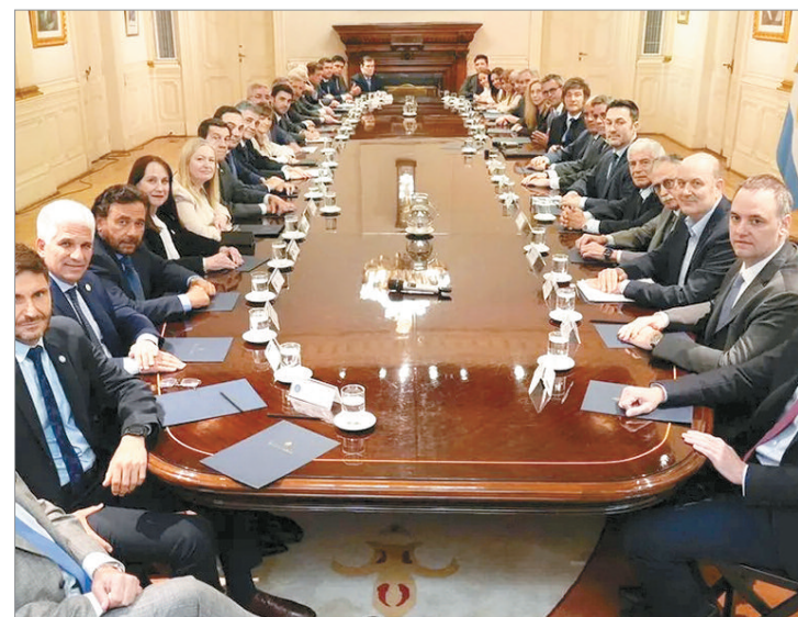
Nación recorta mientras negocia con gobernadores

La baja de los envíos a los estados subnacionales se da en un escenario de estancamiento de la actividad y del empecinamiento del ministro de Economía, Luis Caputo, en que se apruebe la rebaja del Impuesto a las Ganancias para las empresas, incluida en la reforma laboral. Según un informe publicado días atrás por diario Hoy, el capítulo fiscal del proyecto oficialista tiene como consecuencia la pérdida de $3,187 billones destinados a las jurisdicciones. La provincia de Buenos Aires sería la más perjudicada, con un recorte de $400 mil millones.