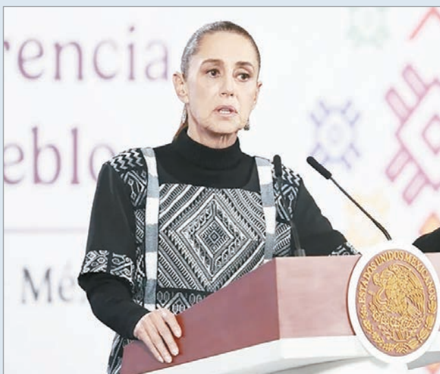
Serán alimentos y productos básicos

La presidenta de México, Claudia Sheinbaum, anunció ayer que su gobierno planea enviar ayuda humanitaria a Cuba durante esta semana, con alimentos y otros productos básicos, mientras busca "por todas las vías diplomáticas" el cómo retomar el envío de petróleo a la isla, en medio de las restricciones que impulsó Estados Unidos. Durante una gira por el estado de Sonora, en el noroeste del país, la mandataria explicó que la asistencia será coordinada por la Secretaría de Marina e incluirá "alimentación y otros productos" para atender necesidades inmediatas. Sheinbaum sostuvo que el objetivo es mantener el apoyo humanitario y, al mismo tiempo, encauzar el tema del combustible por la vía diplomática. Además, la presidenta mexicana rechazó que ella haya abordado directamente el asunto con su homólogo estadounidense, Donald Trump.