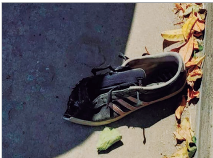
La zapatilla de la mujer

Asimismo, se solicitó el relevamiento de las cámaras de vigilancia instaladas en los alrededores como parte de la causa que quedó en menos de la UFI en turno y que fue caratulada como lesiones por accidente.