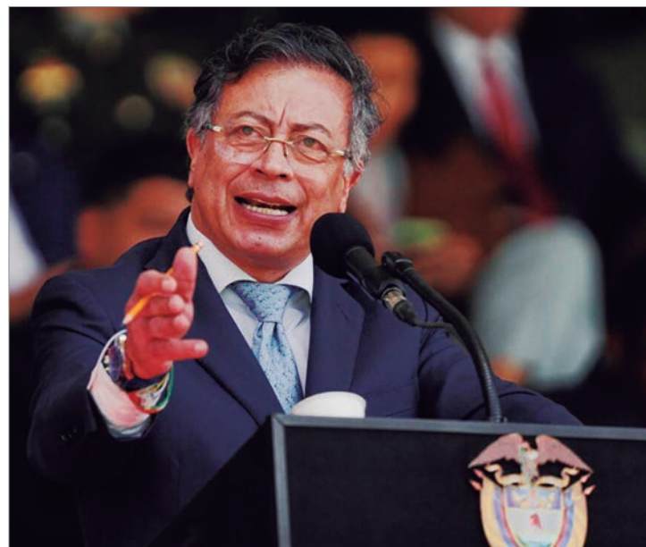
Sucedirá el día de hoy

Además de los temas migratorios, ambos mandatarios han expuesto profundas diferencias en asuntos como la cooperación en la lucha contra el narcotráfico y las acciones de Estados Unidos en Venezuela, incluidos los ataques del 3 de enero en Caracas en los que fue capturado Nicolás Maduro junto con su esposa, Cilia Flores. Según la Presidencia de Colombia, Petro también desarrollará en Washington una agenda que incluye actividades políticas, académicas, empresariales y con la comunidad colombiana en Estados Unidos.