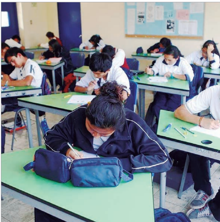
Alertan por la caída de los alumnos y la morosidad de las familias

En la provincia de Buenos Aires funcionan 4.800 escuelas privadas