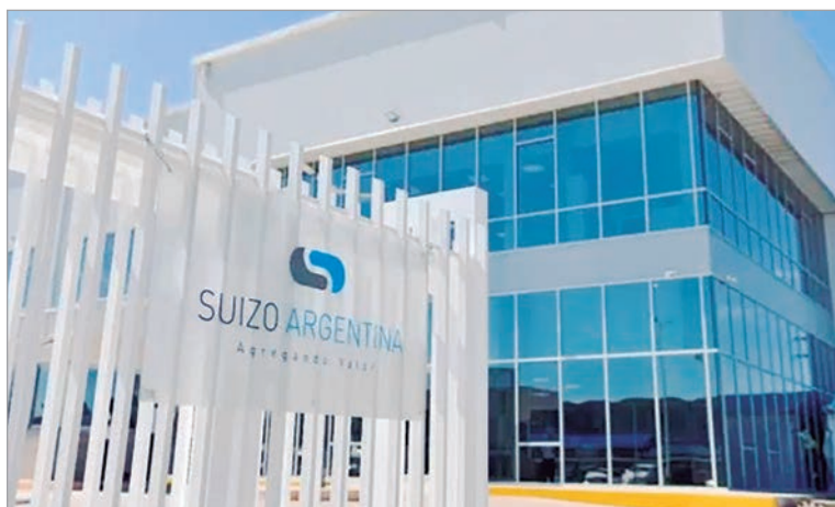
La firma investigada reapareció en licitaciones del Ministerio de Salud

En poco más de un año y medio de gestión libertaria, Suizo Argentina acumuló contrataciones por más de 100 mil millones de pesos con distintos organismos del Estado. La firma cerró acuerdos con los minis-