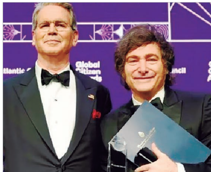
Argentina pagó intereses con DEG vendidos por Washington, en una señal de dependencia financiera creciente

El recurso de los DEG contrasta con otras herramientas financieras que en su momento se anunciaron como alternativas. El swap acordado en octubre no fue activado ni en esta ocasión ni en el vencimiento de 4.300 millones de dólares que se canceló el 9 de enero. Esa ausencia alimenta las versiones de que la opción ya no se encuentra disponible, lo que expone la creciente dependencia de la asistencia del Tesoro estadounidense para evitar incumplimientos.