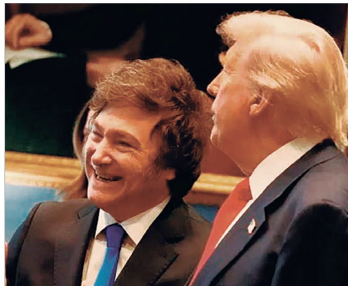
El Presidente será invitado en Mar-a-Lago, en un gesto que refuerza vínculos y también cuestionamientos

El encuentro con Donald Trump, más allá de su valor simbólico, deja planteada la discusión sobre prioridades y sobre el equilibrio entre la proyección global y las necesidades locales.