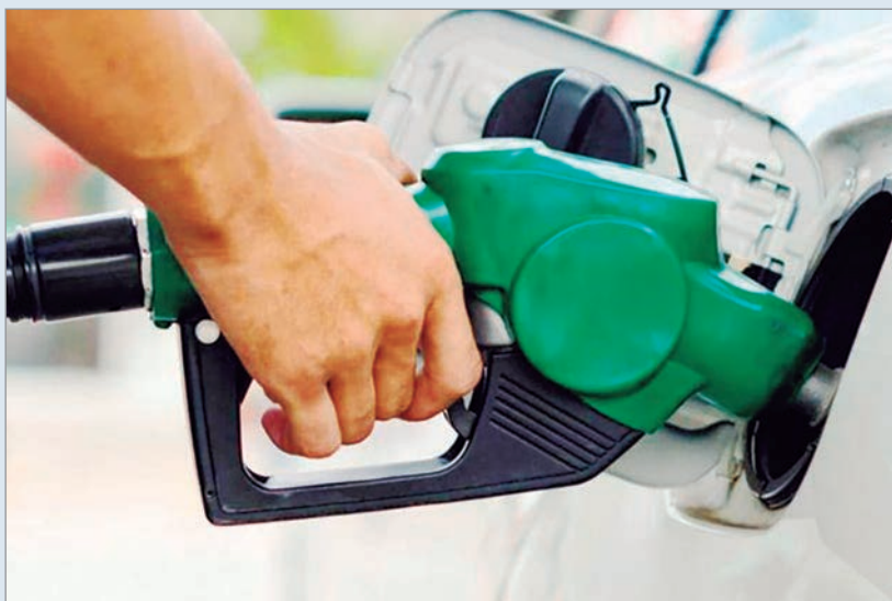
El combustible trepó casi tres veces más que el índice oficial y el Gobierno ajustó biocombustibles

El precio de la nafta cerró diciembre con el mayor salto mensual del año y casi triplicó la inflación del mismo período. El informe de la Fundación Colsecoar mostró que el litro promedió $1.668 en localidades del interior y $1.611 en la Ciudad de Buenos Aires, con una diferencia de 3,5%.