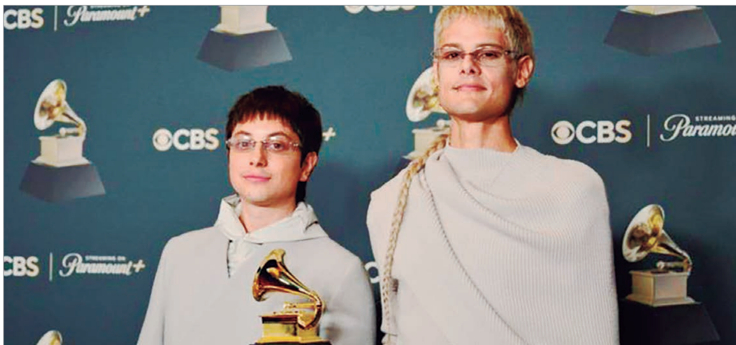
"Papota" es el primer EP del dúo de música alternativa

"Estamos muy agradecidos con esta oportunidad que nos dieron. A nuestra familia, a