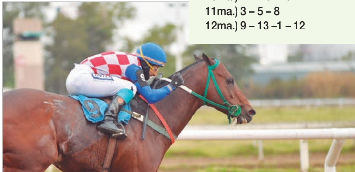
“Viejo es el viento y...”. Vespaciano da ventajas en la edad y en el peso, pero igual es nuestro candidato

Acción de martes en el Teatro del Turf del Barrio Hipódromo que levanta el telón para ofrecer un programa de 12 carreras, entre las 15.30 y las 21. La competencia destacada de la tarde es el Especial “Bernabeu” (1.000 mts.), donde vamos a confiar nuestro voto en el “eterno” Vespaciano con un destacado recorrido en sus albores en el más alto nivel competitivo. Hablamos de la temporada 2021 donde no solo ganó el tradicional Gran Premio “Dos Mil Guineas” (G I-1.600 mts.) sino que ha vuelta de hoja escoltó a Real Rim en el tradicional “Jockey Club” (G I-2.000 mts.). Prosiguió su campaña en el más alto nivel sin desentonar y con el pasar de los años fue bajando gradualmente el metraje y de las distancia de fondo pasó a la media distancia e incluso desde mediados del año pasado se asentó en las carreras de velocidad –incluso sus últimas dos victorias fueron sobre 1.200 metros– con buen suceso. Por eso esta tarde, a pesar de sus 7 años y la ventaja que da en el peso –por sus títulos– cargará 60 kilos, el gravamen más alto de la carrera, defenderá nuestro voto. El buen hijo de Daniel Boone es de venir cerca del fuego pero sin chamuscarse, para avanzar de firme en los metros definitorios. Así, por cartilla y por su buen presente lo plebiscitamos arriba de todo.