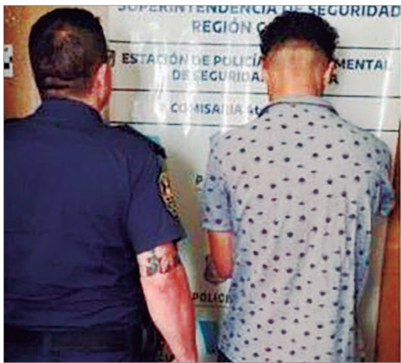
El hombre y la víctima

Expuso que la pelea fue únicamente verbal y que jamás golpeó a la mujer. Afirmó que fue ella, por su cuenta, quien se arrojó por la ventana, y que si bien él intentó evitar esa acción, no pudo hacerlo. Ya con la víctima en el piso, salió del inmueble emplazado en diagonal 76 y 22 y pidió ayuda a los gritos, solicitán-