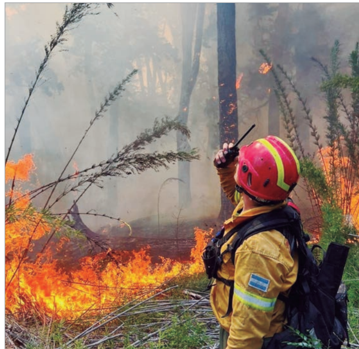
La Provincia desplegó un fuerte operativo

Se trata de un despliegue logístico para garantizar la efectividad del operativo en la topografía compleja de Chubut. La medida responde a una solicitud de la Agencia Federal de Emergencias (AFE) y se enmarca en el Sistema Federal de Manejo del Fuego. El contingente bonaerense tiene como objetivo prioritario el incendio de Puerto Patriada y el sector de Laguna Villarino, donde el fuego tiene comportamiento extremo.