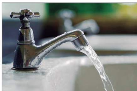
Presentarán un amparo judicial contra el aumento

Según el dirigente radical, la situación del servicio es “insostenible” y criticó la falta de respuesta de la empresa frente a