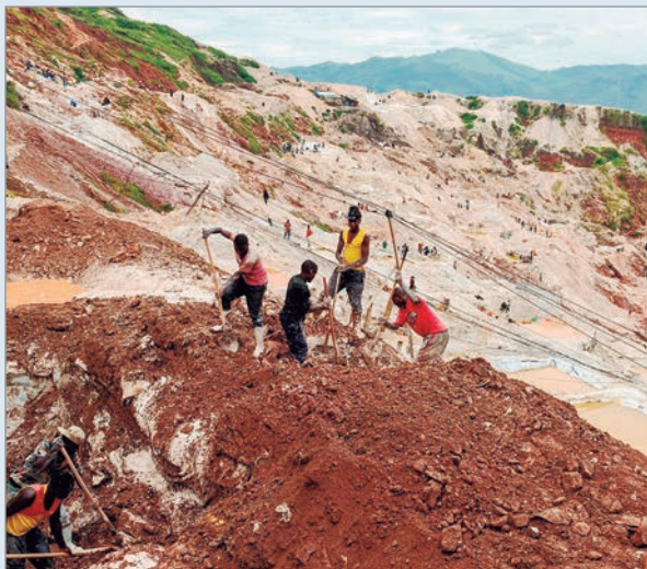
Perdieron la vida más de 400 personas

Ya son más de 400 los muertos por el deslizamiento de tierra en una mina de coltán de la localidad de Rubaya, en el este de la República Democrática del Congo. El derrumbe ocurrió el pasado jueves después de que lloviera sobre esa mina, situada en la jefatura de Mupfuni Kibabi, territorio de Masisi, en la provincia de Kivu del Norte, un área bajo control del grupo rebelde Movimiento 23 de Marzo (M23) en el que continúan las labores de rescate. “Ya superamos los 400 muertos, incluyendo mineros artesanales y comerciantes, provenientes no sólo de Masisi, sino también de territorios aledaños e incluso de países vecinos, que vienen a trabajar aquí. Por lo tanto, la tragedia es enorme”, declaró Teleshore Nitendike, presidente de la sociedad civil de Masisi, quién luego agregó: “Estamos avanzando con las operaciones de búsqueda y rescate poco a poco con los recursos disponibles. Así, es difícil”.