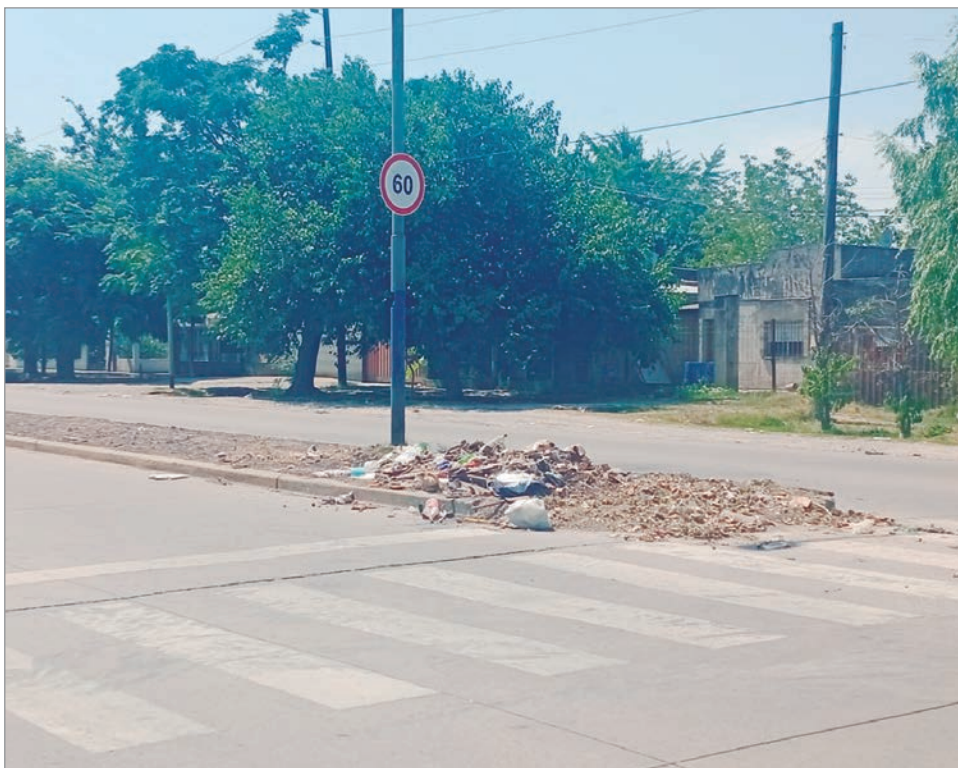
La basura que se acumula en las calles

Los restos de cáscaras de naranja o bananas calentadas al sol le aportaban un aroma