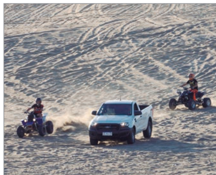
La Justicia tomó cartas en el asunto

Ante este panorama, el juez estableció que la prohibición seguirá vigente hasta que la Municipalidad asegure la señalización, la delimitación y el control efectivo del área.