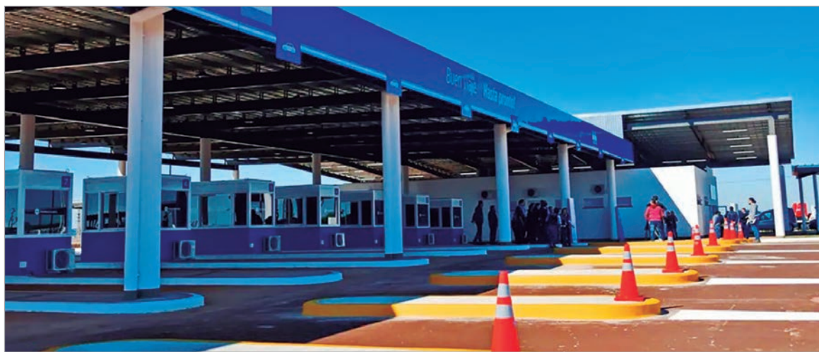
El paso fronterizo

La pasajera iba al país vecino para realizar unas compras cuando se descompensó al llegar al paso fronterizo y perdió la vida