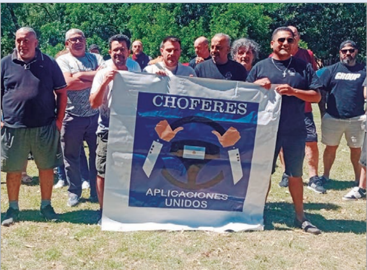
Los choferes se reunieron en 120 y 34

Chofers de las aplicaciones de transporte Uber, DiDi y Cabify llevaron adelante una jornada de apagón total de las plataformas en La Plata, Berisso y Ensenada como parte de una protesta nacional contra la reducción de tarifas y el esquema de comisiones que, aseguran, deterioró fuertemente sus ingresos. La medida consistió en una desconexión completa durante 24 horas y afectó la disponibilidad de autos a lo largo del día.