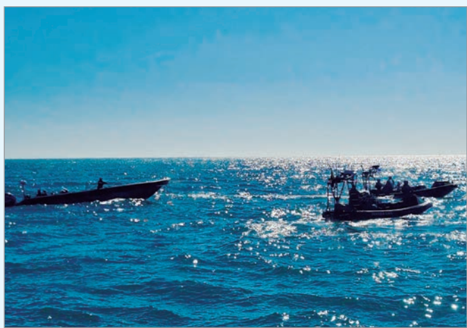
Fallecieron dos personas