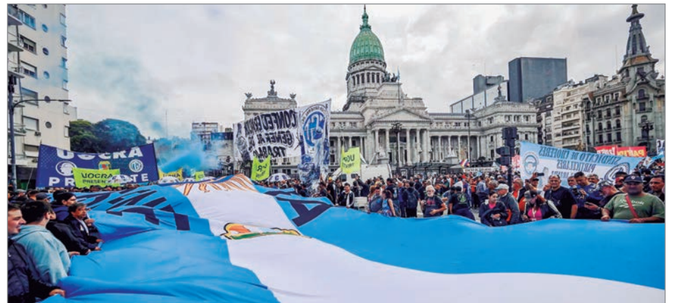
El sindicalismo se divide entre la protesta y el paro frente al debate legislativo

Durante el encuentro, algunos gremios propusieron sumar una medida de fuerza para potenciar la convocatoria, incluso con paros