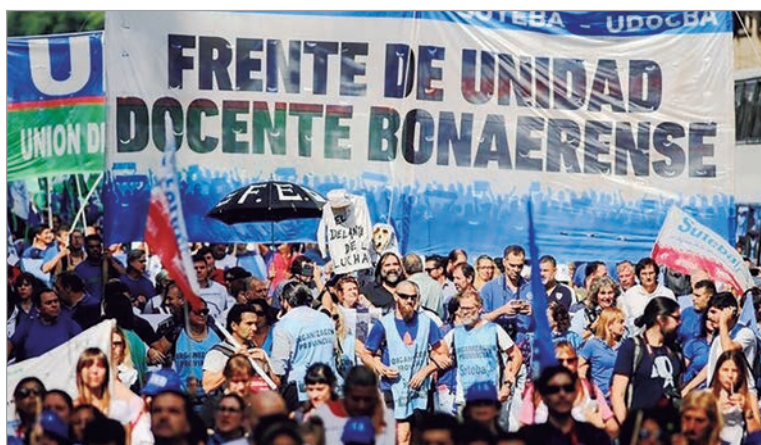
La protesta docente apunta contra la reforma laboral y exige restitución del FONID

Los gremios remarcaron que la protesta se da en medio de las negociaciones paritarias con el gobierno de la provincia de Buenos Aires. En