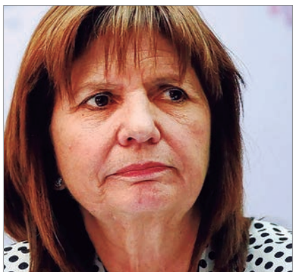
La senadora promovió compras extranjeras sin reparar en su impacto local

Patricia Bullrich volvió a encender la polémica en una entrevista televisiva al reivindicar la compra de un traje importado y valorarlo como “barato y lindo”, mientras la industria textil argentina enfrenta una profunda crisis productiva y pérdida de empleo. El relato, presentado como anécdota simpática, naturaliza la celebración de importaciones a bajo costo y relativiza las consecuencias de abastecerse fuera del país en un contexto de cierre de fábricas y presión sobre trabajadores locales.