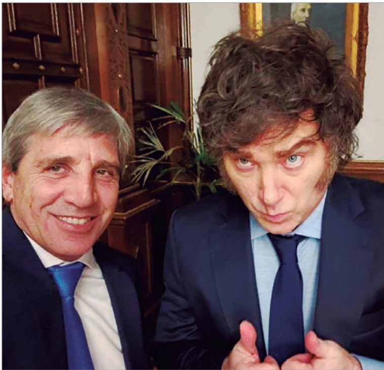
Nuevo favor de Milei a Caputo, Sturzenegger y Macri

Lo polémico es que la disposición de Milei no solo favorece a Macri, sino a dos de sus ministros. En aquel entonces, el actual ministro de Economía, Luis Caputo, era ministro de Finanzas. También fue parte de la operación el hoy ministro de Desregulación, Federico Sturzenegger, entonces titular del Banco Central,