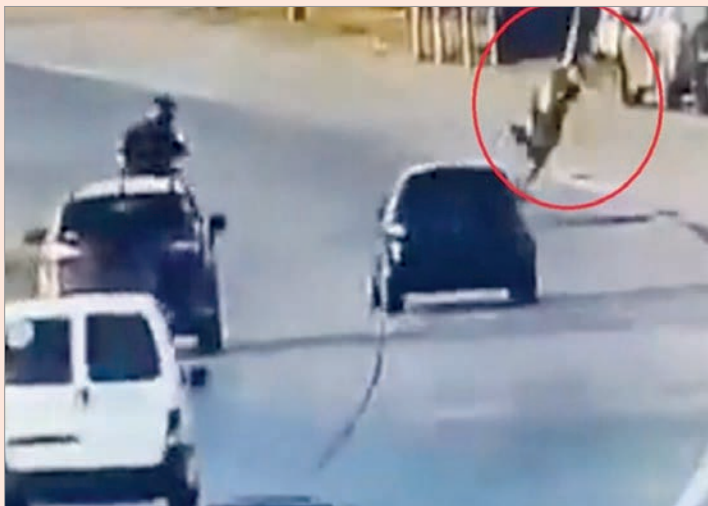
Una cámara registró el suceso

Quien no le dio la espalda fue la sociedad y, en una colecta, se llegó a juntar más de 30 millones de pesos, para que pueda comprarse un auto ya que el que atropelló al malhechor quedó destruido.