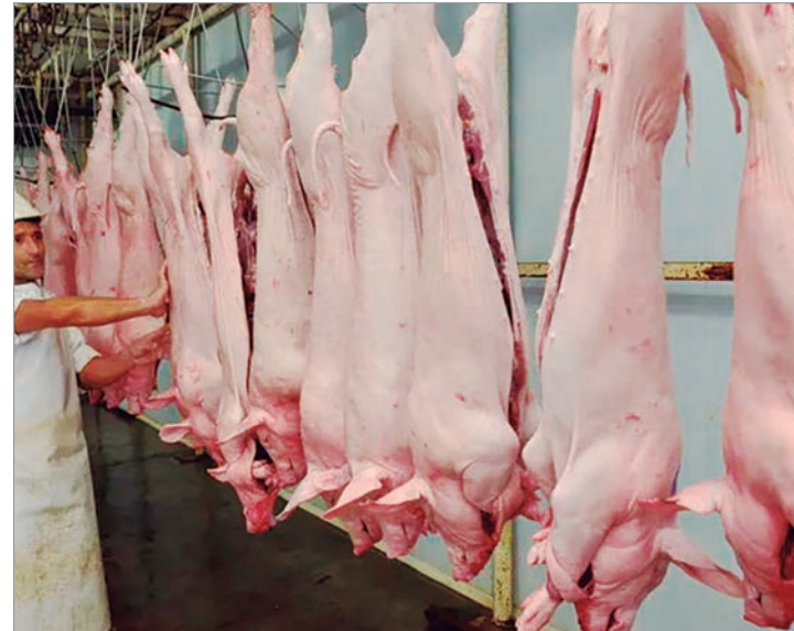
Crece el consumo y la exportación de cerdo.

Cabe destacar que en 2024 el consumo de carne vacuna descendió 10% en comparación con el 2023, y promedió 47,7 kg/h por año. Esta cifra se convirtió en el segundo registro más bajo desde que se inició la medición en 1914. Solo en 1920 se verificó un nivel inferior al de 2024.