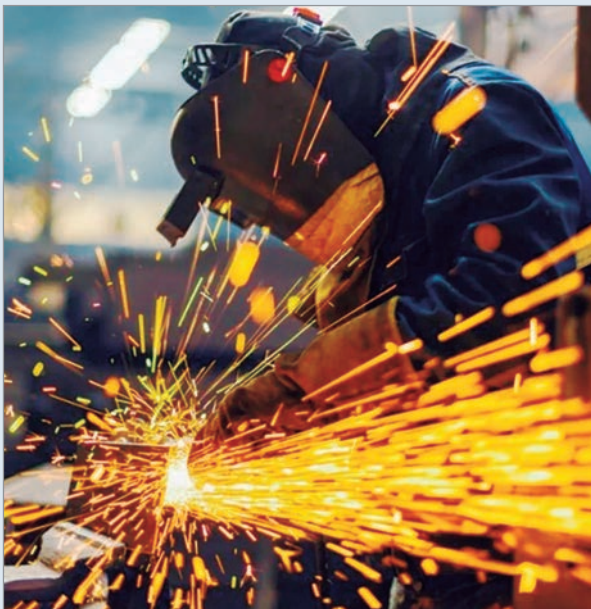
Denuncian que las empresas redujeron la tarifa base.

El Instituto Nacional de Estadísticas y Censos (Indec) publicó el Índice de Producción Industrial Manufacturero (IPIM) de diciembre, que arrojó una caída mensual del 0,1%. De esta manera, el guarismo acumula seis meses consecutivos en descenso.