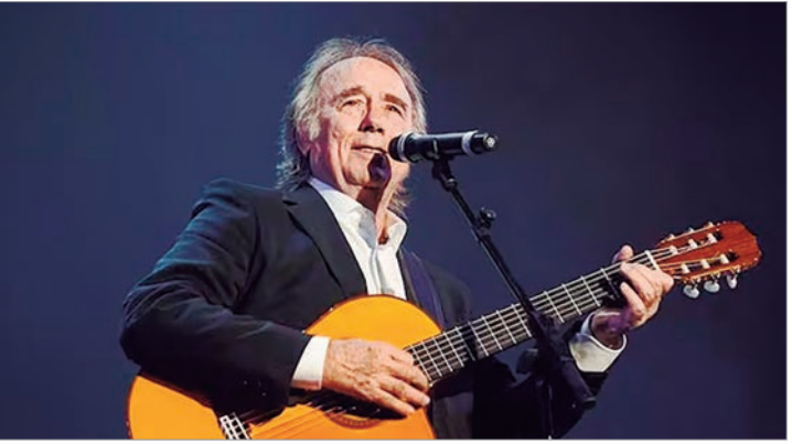
Serrat se consagró como referente de la música popular a temprana edad

A propósito de la evolución de la música española en aquel momento, Serrat aseguraba que había comenzado una crisis de difusión, no de creación, que confundía porque era lo que se veía. En ese sentido, la música según Serrat se estaba manejando, en cuanto a distribución, por un aparato burocrático, administrativo-económico, en el cual los ejecutivos llegaron a tomar el rol de creadores.