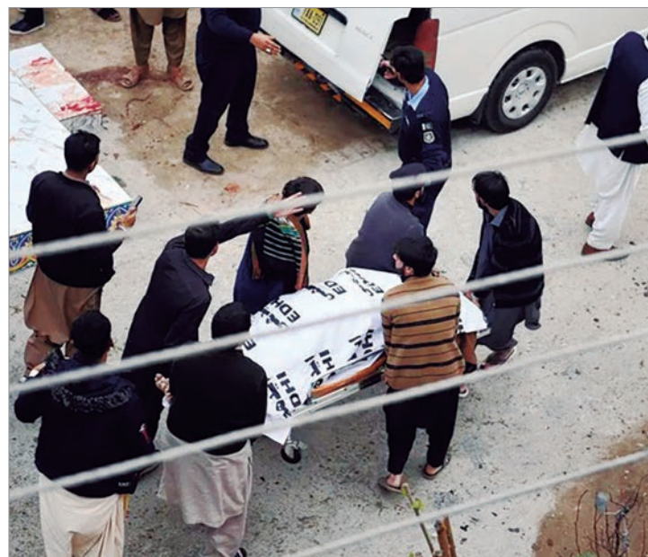
Sucedio en Pakistán

de culto chií, situado en la zona de Tarlai, a la hora de la oración del viernes, cuando un gran número de fieles se encontraban reunidos en el interior. Las autoridades mantienen acordonada la zona del ataque y han desplegado personal administrativo en distintos hospitales para supervisar la atención a los heridos. Tras el suceso, el presidente de Pakistán, Asif Ali Zardari, expresó sus condolencias por las víctimas y afirmó que “atacar a civiles inocentes es un crimen contra la humanidad”. Según se informó, las autoridades paquistaníes identificaron al atacante suicida y vincularon al terrorista con movimientos transfronterizos desde Afganistán.