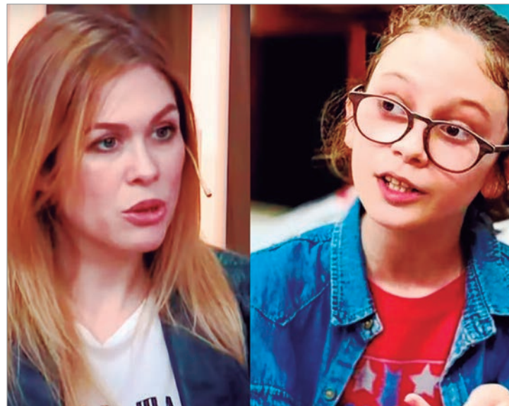
Lemoine podría ser removida como diputada nacional

No es la primera vez que el influencer es el centro de ataque por parte del oficialismo. Durante el año pasado, Milei compartió en sus redes sociales memes en contra de niño.