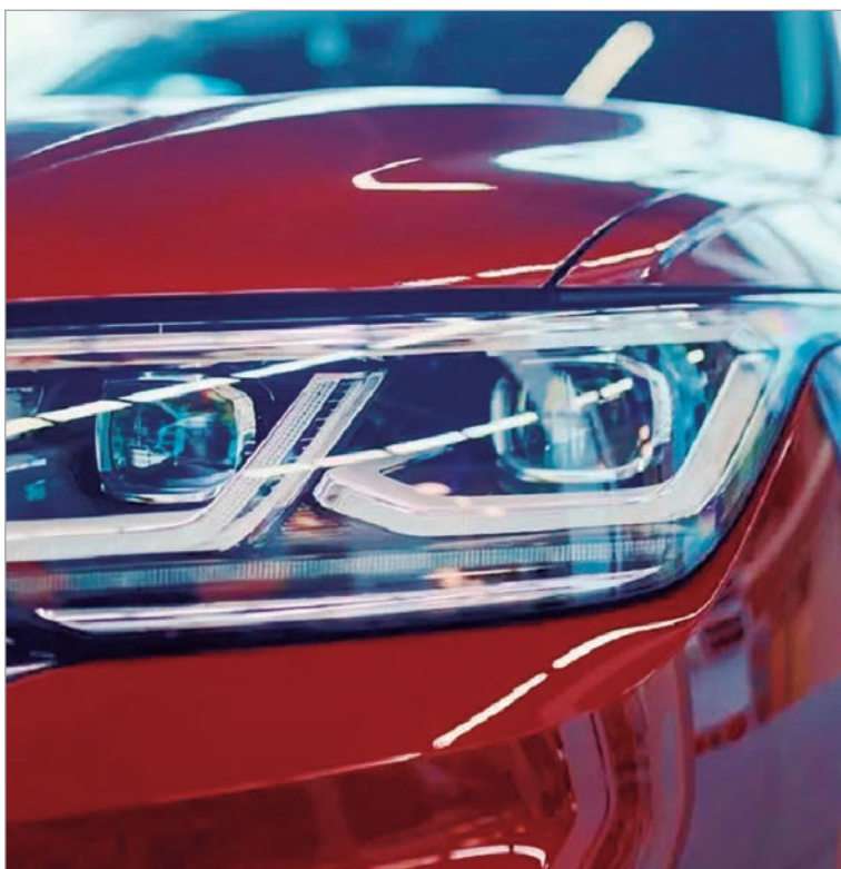
El Gobierno brinda detalles de acuerdo con EE UU

Asimismo, Quirno remarcó que el reciente viaje oficial a Estados Unidos fue “muy productivo en varios frentes”, no solo por el acuerdo comercial, sino también en el fortalecimiento del vínculo bilateral.