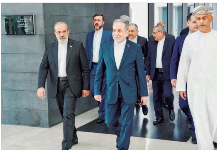
“Fue un buen comienzo para las negociaciones”, declaró Irán

“Fue un buen comienzo para las negociaciones. Existe un entendimiento sobre la continuación de las conversaciones. La coordinación sobre cómo proceder se decidirá en las capitales”, dijo el ministro iraní de Exteriores, Abás Araqchi, a la televisión estatal de su país. “Los argumentos fueron presentados en un ambiente positivo”, añadió Araqchi. El ministro aclaró a la televisión iraní que las modalidades y el momento de la próxima ronda de diálogo “serán definidos más adelante”. Asimismo, confirmó que los funcionarios de ambas partes regresaron una vez concluido el encuentro a sus respectivos países para consultas con