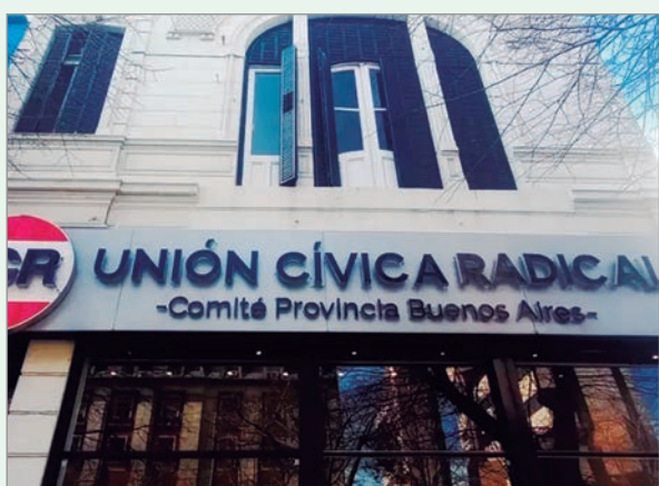
El radicalismo provincial retoma su calendario interno y abre discusiones rumbo al escenario de 2027