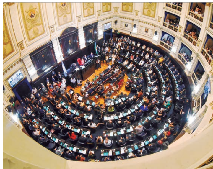
Legisladores del Frente Renovador cuestionan reformas y alerta por retrocesos.

Finalmente, cuestionó la decisión de reemplazar el FOMECA por un nuevo fondo que iguala a medios comunitarios con grandes empresas comerciales. Según el diputado, esta medida debilita la pluralidad informativa y afecta de manera directa a proyectos de comunicación popular que cumplen un rol social clave en barrios y localidades del interior.