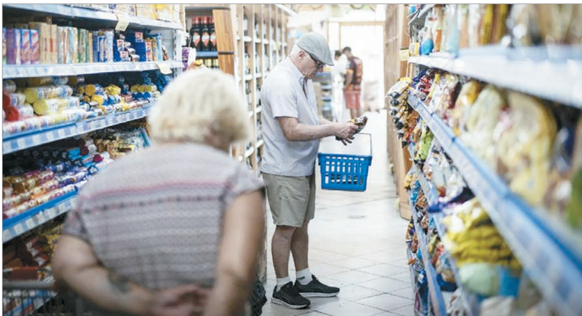
Analistas pronostican una inflación de entre 2,4% y 2,6%

El Indec dará a conocer el primer IPC del año, en medio del escándalo por su medición y una enorme suba en alimentos