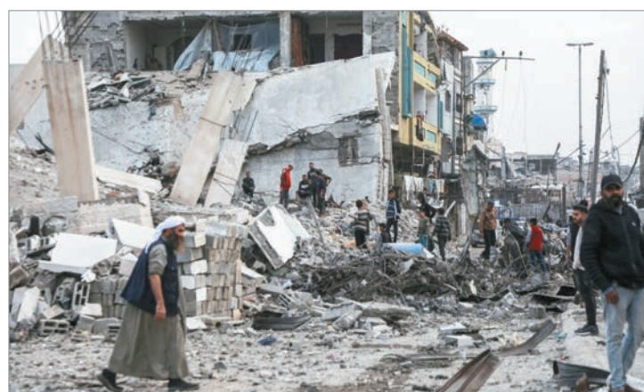
Palestinos inspeccionando los daños después de un ataque aéreo israelí