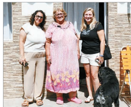
El Gobierno destinó casi $7 millones a la mejora de viviendas

El Ministerio de Desarrollo de la Comunidad de la provincia de Buenos Aires celebró haber alcanzado las 33 mil viviendas reformadas con la implementación del programa de mejoramientos habitacionales.