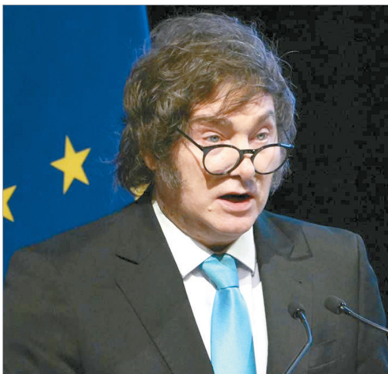
Diputados será escenario de la estrategia oficial para ratificar el pacto

Para garantizar el tratamiento, el oficialismo dispuso una ingeniería parlamentaria que comienza el martes 10 de febrero con la constitución de comisiones clave. La intención es que emitan dictamen al día