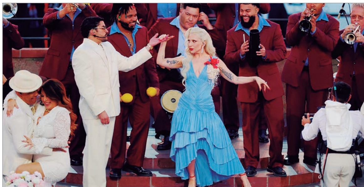
El puertorriqueño abrió su presentación con el éxito Titi me preguntó

El cantante puertorriqueño sorprendió para este tema final invitando a Ricky Martin al escenario para cantar una de las canciones más emblemáticas de su último álbum.