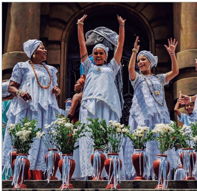
Las mujeres participan en el tradicional evento precarnaval de lavar las escaleras del Teatro Municipal de la ciudad, en San Pablo, Brasil.