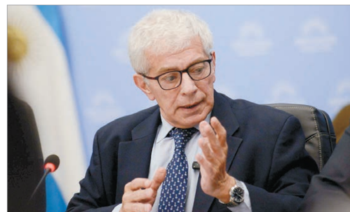
Respaldo por Milei, el ministro impulsa reformas polémicas en imputabilidad y femicidio

Para el titular de Justicia, la legislación actual genera cuestionamientos constitucionales al centrarse en un solo sexo. "El sexo o la orientación no puede generar privilegios ni impunidad. Somos todos iguales ante la ley", insistió.