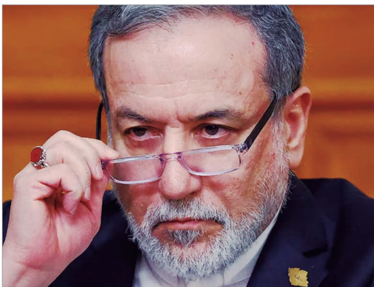
El ministro de Asuntos Exteriores iraní, Abbas Araqchi

El canciller Abbas Araqchi reiteró que Teherán respondería a cualquier ataque norteamericano, pero afirmó la disposición de su país de hallar una solución por la vía diplomática