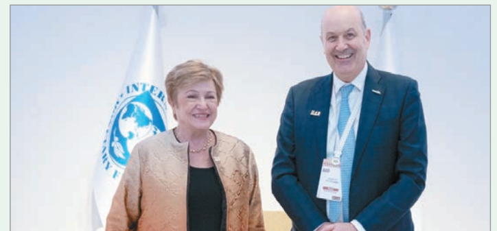
El FMI revisa el acuerdo con Argentina

El encuentro se dio mientras un equipo técnico del organismo multilateral inició en Buenos Aires la segunda revisión del programa acordado con Argentina en abril del año pasado.