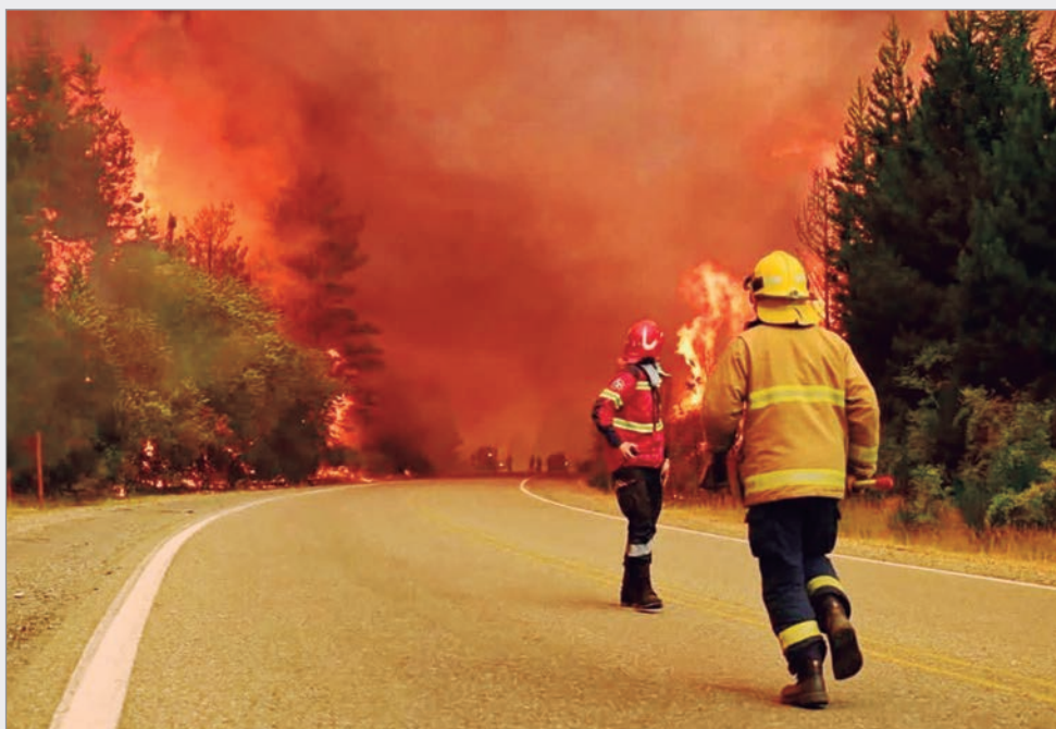
Ya se destruyeron 100 viviendas