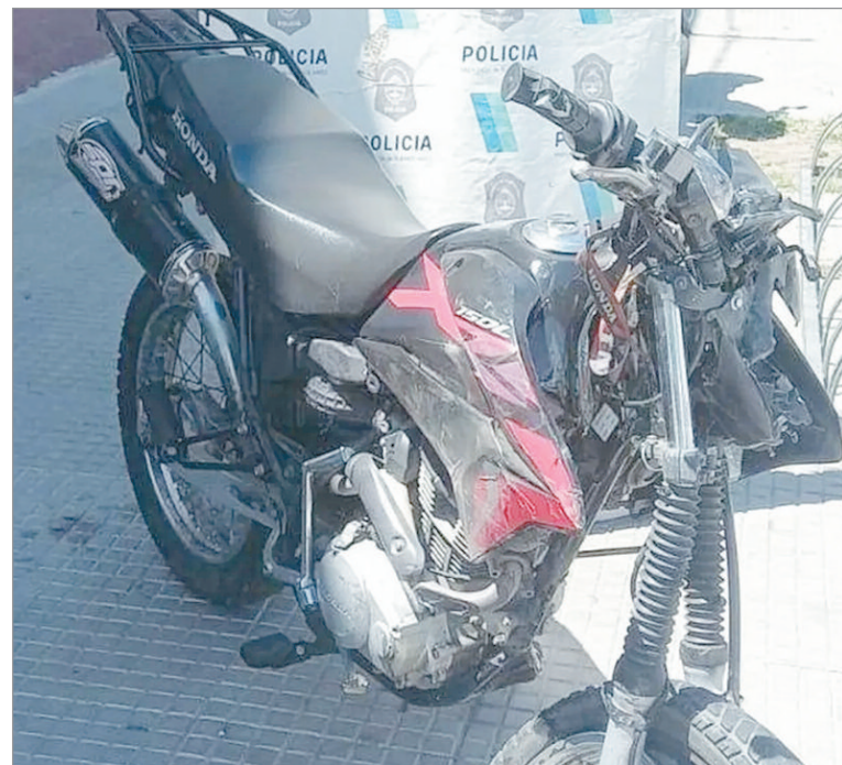
Los vehículos del incidente vial fatal

la gravedad de la víctima y la trasladaron de manera urgente hasta el hospital Rossi.