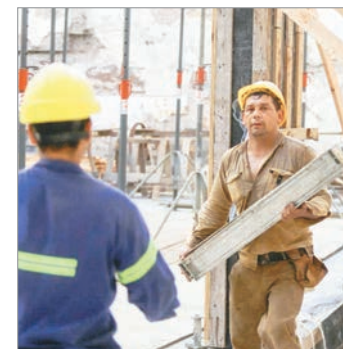
Fuerte caída de la venta de insumos para la construcción

Al analizar los resultados, desde Construya indicaron que "la caída mensual de enero refleja un ajuste tras el cierre de año, en un contexto donde la actividad real de obra aún muestra cautela" y remarcaron que "el comportamiento de febrero y marzo será clave para poder evaluar de forma más precisa la dinámica sectorial en el año que acaba de comenzar".