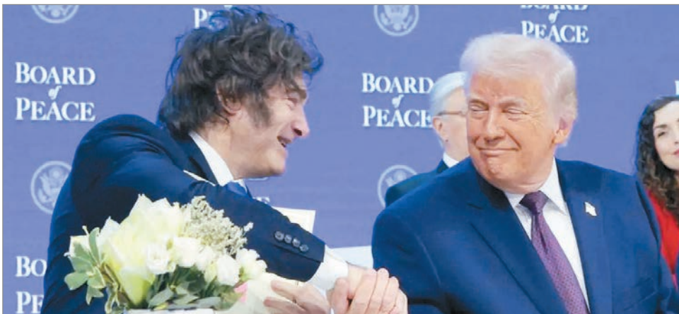
Milei canceló su viaje de este lunes

Allí, el jefe de Estado argentino iba a participar en el evento de la Gala de la Hispanidad en Florida, aunque el comunicado oficial indicó