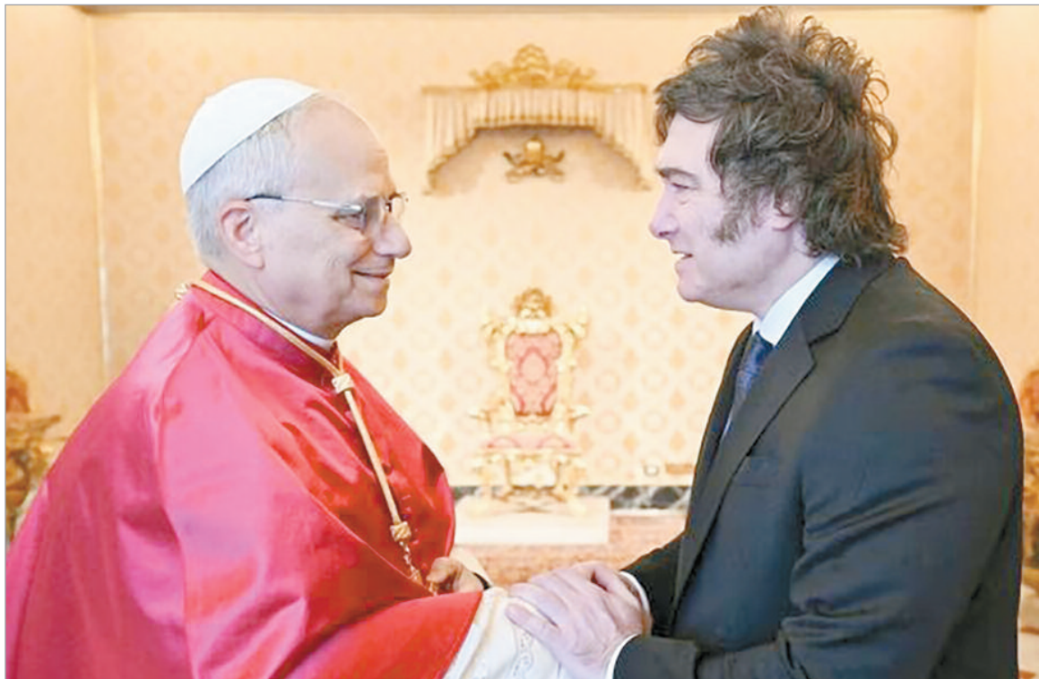
Quirno viaja para concretar la llegada de León a Argentina

El Presidente intentará que León XIV incluya a la Argentina en su gira sudamericana de octubre. Para eso, Quirno viajará al Vaticano