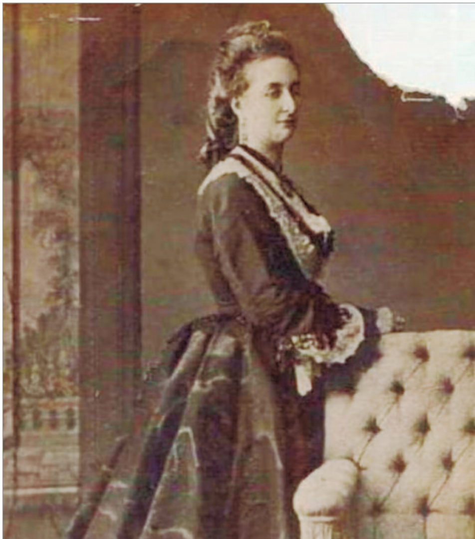
Lynch nació en Irlanda y fue pareja del caudillo Francisco Solano López.

Elisa Lynch fue una figura legendaria por su vida novelesca y por el coraje con que defendió a su país de adopción cuando fue víctima de una guerra