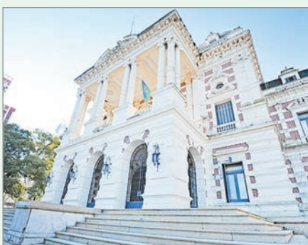
Se profundiza el ajuste a la Provincia

Días atrás, López también había alertado por la merma de la economía: "En 2025, la actividad económica no agrícola de la Provincia acumuló una caída mayor a los 5 puntos respecto de 2023".