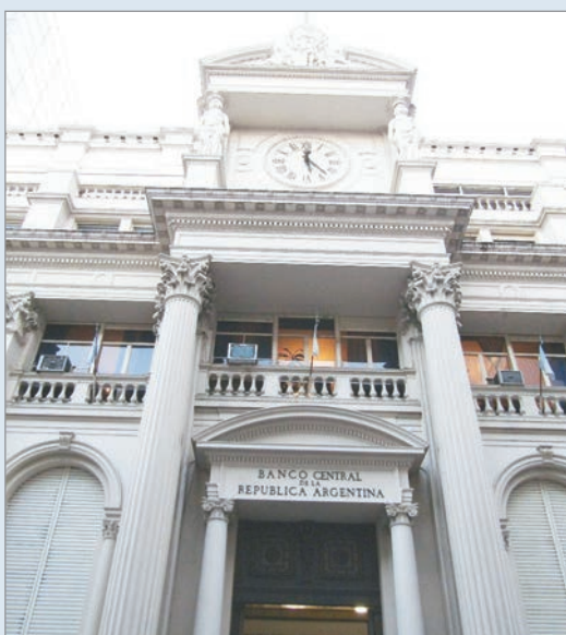
Ya se compraron 1,7 millones de dólares en 2026

El Banco Central continúa con la política de acumular Reservas, iniciada en enero: el lunes compró 176 millones de dólares, y el martes 42 millones. De esta manera, acumula 1.692 millones comprados en lo que va del 2026.