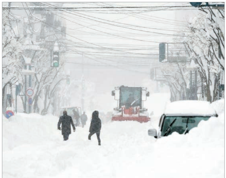
Perdieron la vida 46 personas

con un fallecido. Según la Policía y las autoridades locales, muchos accidentes mortales se produjeron cuando montículos de nieve cayeron sobre los residentes desde los tejados o cuando las personas resbalaron mientras intentaban retirarla. En la ciudad de Aomori, en el norte del archipiélago, los residentes lidian con 1,3 metros de nieve, según la Agencia Meteorológica de Japón. Por su parte, la Agencia también advirtió a los habitantes del país sobre las fuertes nevadas y sus consecuencias en el tráfico, además del peligro de posibles avalanchas y cortes de circulación en algunos puntos del archipiélago.