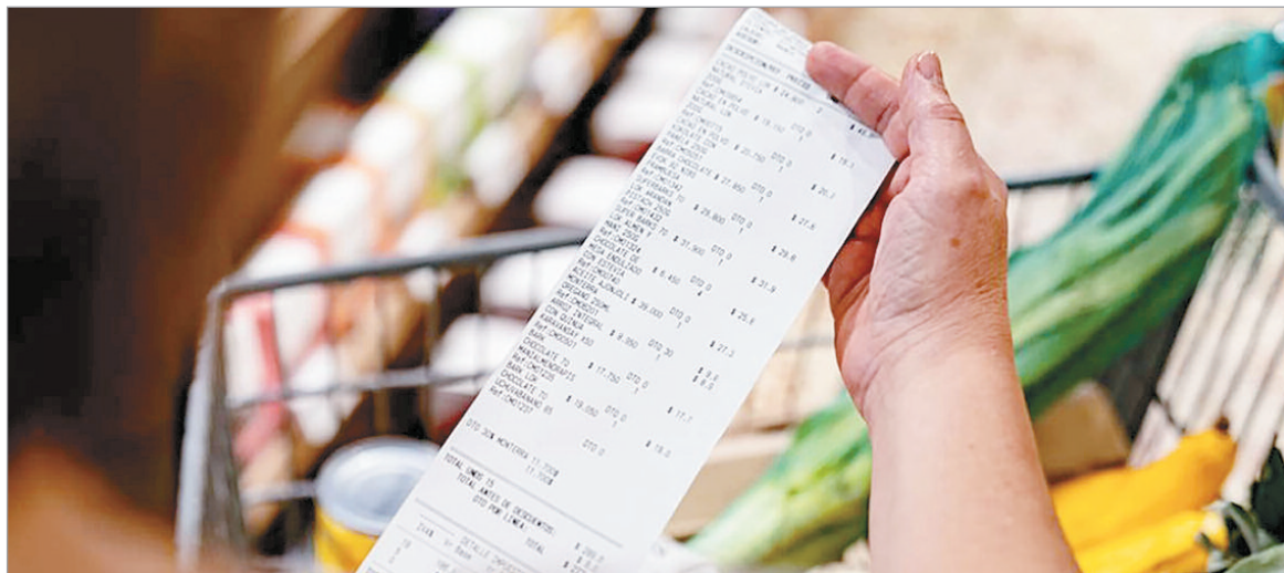
Alimentos y bebidas aumentaron 4,7% promedio en enero

En medio de la polémica por la marcha atrás en su cambio de medición, el Indec relevó un aumento del IPC por octavo mes consecutivo