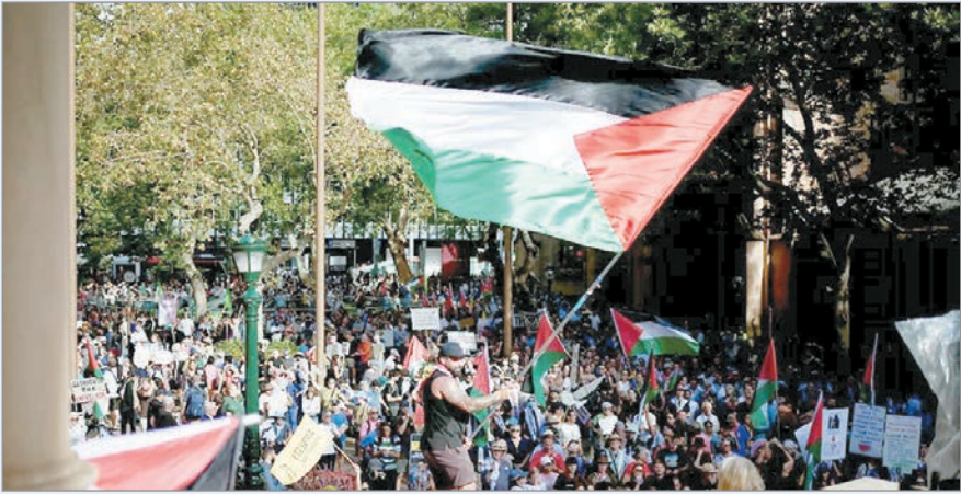
Hubo 27 manifestantes arrestados