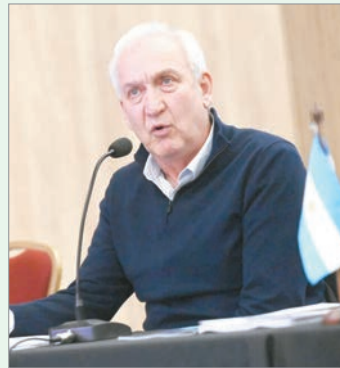
Tensión en el Mercosur por el acuerdo comercial

En este sentido, los parlamentarios alertan que el acuerdo podría afectar directamente la política comercial común del bloque vinculadas a aranceles, regímenes regulatorios y negociaciones y política establecidas previamente.