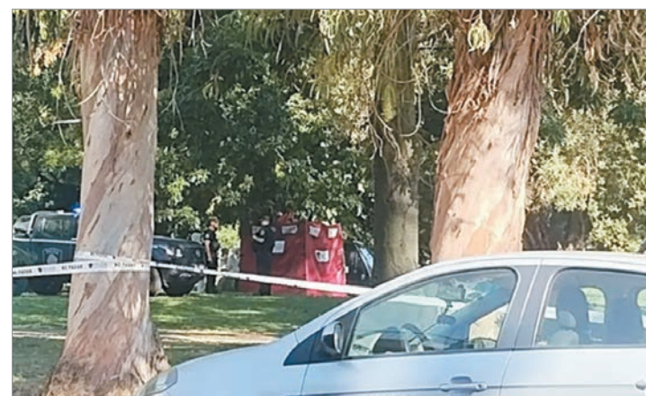
Los peritos en el lugar del hecho

De acuerdo a lo que se pudo saber, la primera hipótesis es que se trató de una pelea entre dos personas que viven en la calle, aunque se terminará de certificar con la pesquisa. Para ello buscan testimonios de personas que pudieran haber escuchado o visto movimientos extraños.