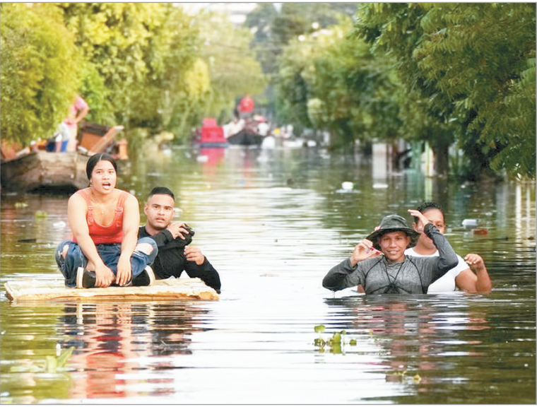
Por lo pronto hay tres personas desaparecidas

U n total de 22 muertos y al menos 140.000 damnificados son hasta ahora las cifras que dejan las inundaciones que afectan al departamento de Córdoba, en el norte de Colombia. Febrero, que suele ser un mes de tiempo seco, este año ha estado marcado por el agua. Los departamentos caribeños de Córdoba y Sucre han sufrido fuertes lluvias en los últimos días por la convergencia de varios fenómenos climatológicos, entre ellos un frente frío que ha impactado el Caribe. “En un día cayó la lluvia que se esperaba para todo un mes”, explicó la directora del Ideam, la entidad encargada de monitorear el clima, Ghislaine Echeverry. El presidente Gustavo Petro alertó que las lluvias registradas en Córdoba superan cualquier antecedente histórico, y que estarían asociadas a frentes fríos árticos y podrían repetirse en los próximos