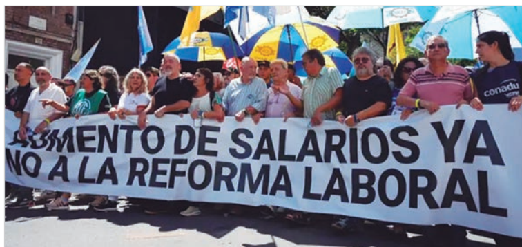
Más de 20 mil personas se movilizaron en rechazo al proyecto oficial y en la antesala del debate en el Senado

Durante la manifestación, los dirigentes cuestionaron que el plan oficial