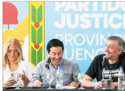
Aunque Kicillof logró la conducción provincial, varias localidades disputarán la conducción local

Con la validación de la Junta Electoral, se inicia la campaña interna en varios municipios, mientras a nivel provincial se busca consolidar un liderazgo que cohesione todas las vertientes del peronismo frente a los próximos desafíos electorales.