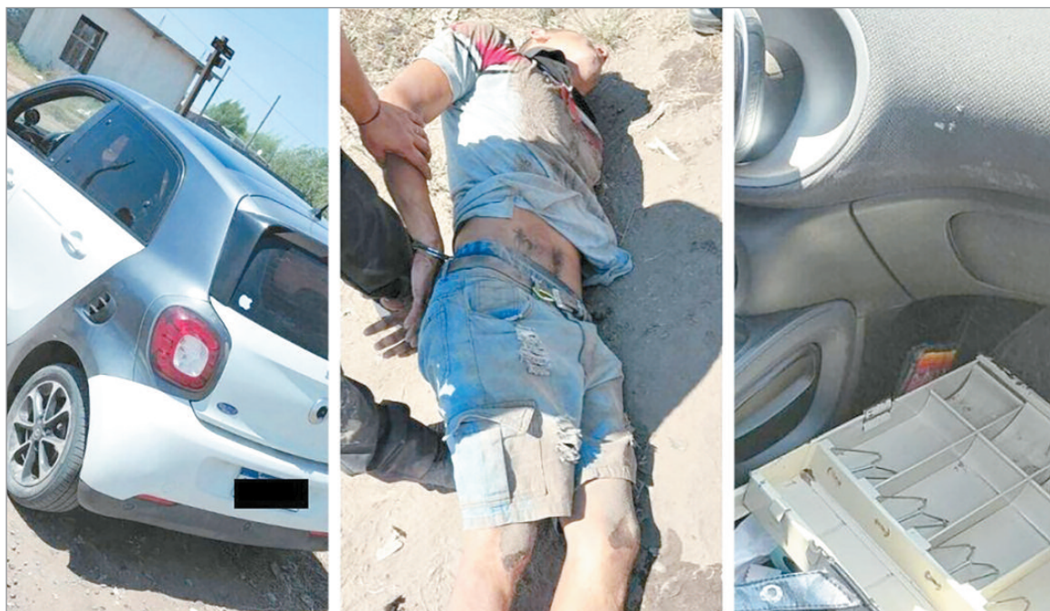
Imágenes del hecho

El operativo se intensificó en la zona de 154 y 72 y finalizó en inmediaciones de 80 y 146, cerca de la Megatoma de Los Hornos. Allí, los sospechosos abandonaron el rodado e intentaron huir. Uno de ellos fue reducido luego de intentar escapar a pie y resultó herido de bala en una pierna, con orificio de entrada y salida, por lo que debió ser asistido médicamente bajo custodia policial.