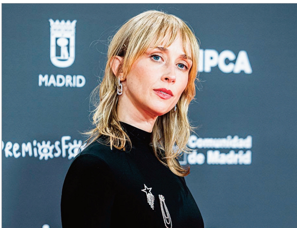
Estuvo en Aliados , de Cris Morena

—La verdad que nunca he tenido como una respuesta clara al asunto. Ha sido un poco algo de siempre, ha sido un impulso que estaba ahí dentro de mí. Yo recuerdo ver incluso en los típicos dibujos animados o programas para chicos, ver cómo de pronto iban en el Instituto Americano a clases de teatro. Yo siempre pensaba, ojalá, ojalá tener un grupo de teatro en mi colegio. Y luego, obviamente, cuando apareció el grupo de teatro fui la primera en apuntarme y siempre sentí como cierta atracción hacia eso. Y luego es verdad que el cine me gusta muchísimo, he consumido un montón. Y luego con el tiempo