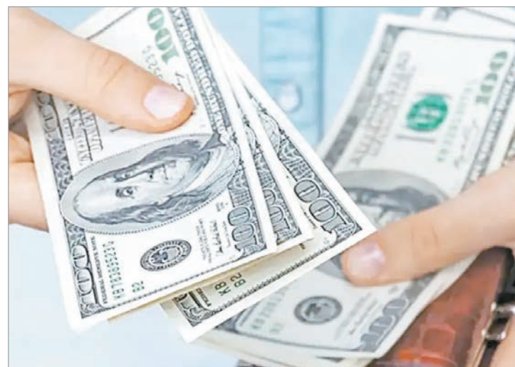
Los interés de depósitos en dólares quedan exentos de Ganancias

Por otro lado, la Ley de Inocencia Fiscal no rige en las provincias (al menos hasta que sus legislaturas aprueben la adhesión o adecuación a la nueva normativa nacional). Por lo tanto, los gobiernos provinciales pueden controlar a los que blanqueen dólares.