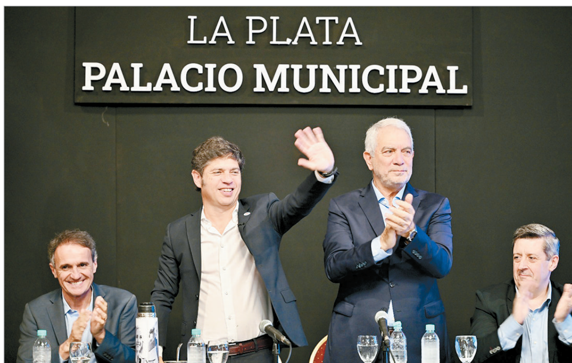
Alak y Kicillof destacaron obras hídricas que mejoran el servicio en La Plata

La obra, que se enmarca en la etapa 1 del Plan Hídrico del Gran La Plata, consistió en la reparación de la cañería del acueducto, que se extiende en una longitud de 8,5 kilómetros desde la Estación de bombeo ubicada en 120 y 33 (Tolosa) hasta la vinculación de 489-Lacroze- y 15 bis (Gonnet).