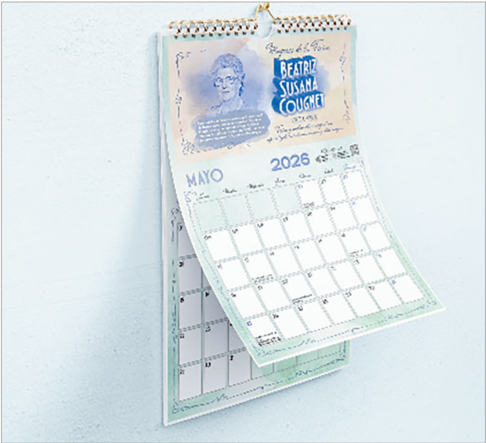
El calendario de Mujeres de la Física

El proyecto surge a partir de una proble-