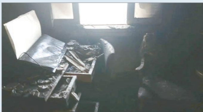
La oficina incendiada

Momentos de extrema tensión se vivieron durante un incendio que se produjo en una oficina del Senado, dejando como saldo al menos seis personas intoxicadas con monóxido de carbono, las cuales tuvieron que ser asistidas por profesionales de la salud.