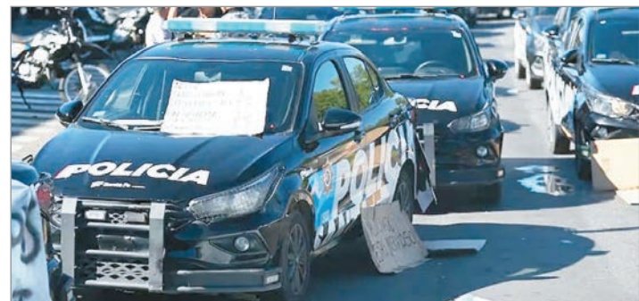
Policías reclaman aumentos salariales

Además de estas dos ciudades, también hubo protestas y acuartelamientos en Reconquista, Vera, Rafaela, San Lorenzo, Casilda, Recreo, Santo Tome, San Javier y Avellaneda. En este contexto, se teme el efecto contagio en otras provincias, ya que la queja por salarios bajos ha sido expresado en varias jurisdicciones.