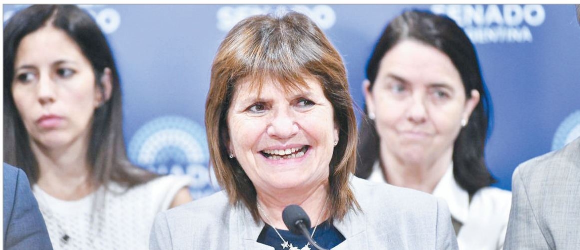
Bullrich adelantó que introdujeron 28 modificaciones al proyecto original

Tanto Bullrich como Santilli aseguraron que tienen lista la media sanción del proyecto luego de concederle Ganancias a los gobernadores