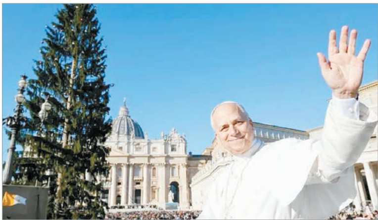
Quirno llevó al Vaticano una carta firmada por Milei en la que invita a León XIV a visitar el país

La eventual visita de León XIV representaría el primer viaje del actual Pontífice a la Argentina desde el inicio de su papado y abriría una nueva etapa en la relación entre el Estado argentino y el Vaticano, con impacto en la agenda bilateral.