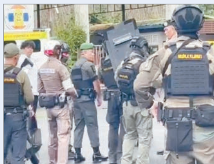
Hubo tres heridos

La Policía de Tailandia detuvo a un hombre sospechoso de irrumpir a tiros en una escuela del sur del país, donde tomó como rehenes a profesores y alumnos, con un saldo de al menos tres heridos, una mujer y dos adolescentes. El asaltante armado entró en la escuela Patong Prathan Kiriwat de la ciudad de Hat Yai, en la provincia meridional de Songkhla, y