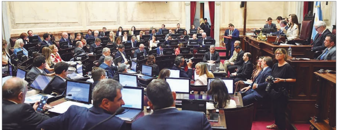
El Gobierno busca aprobar la reforma laboral antes de marzo

las obras sociales. Seguirán en 6%, y no en 5% como pretendía originalmente el proyecto original.