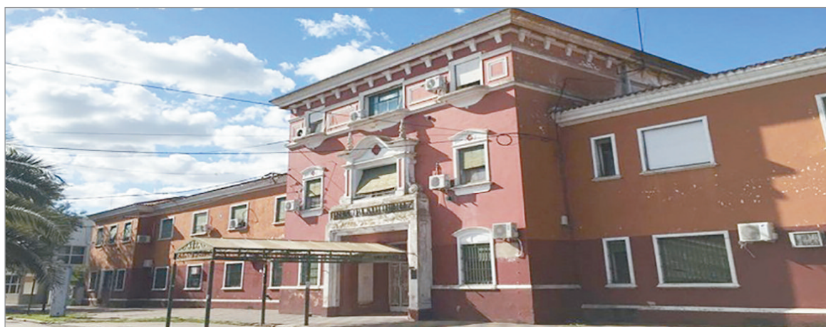
La bebé fue trasladada al hospital

A partir de entonces comenzó una investigación para tratar de determinar qué era lo que había sucedido con ella. El personal que