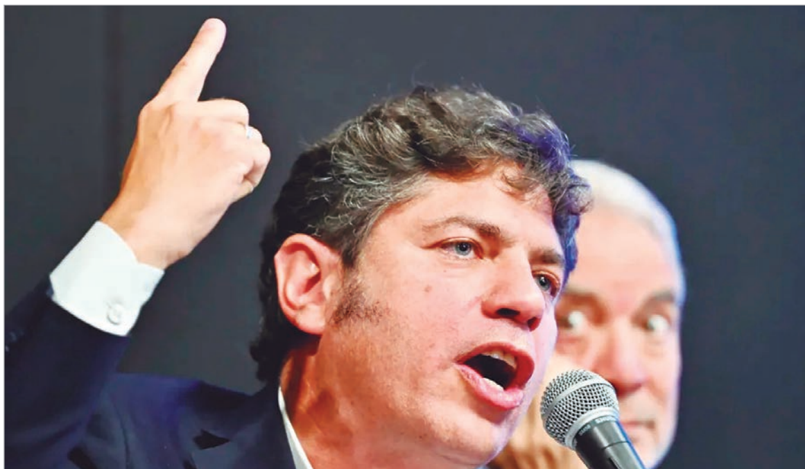
Kicillof explicó que la reforma “no va a generar empleos”

“Es una burla que iguala para abajo y no generará empleo”, sostuvo el gobernador, en la previa de la votación en el Senado