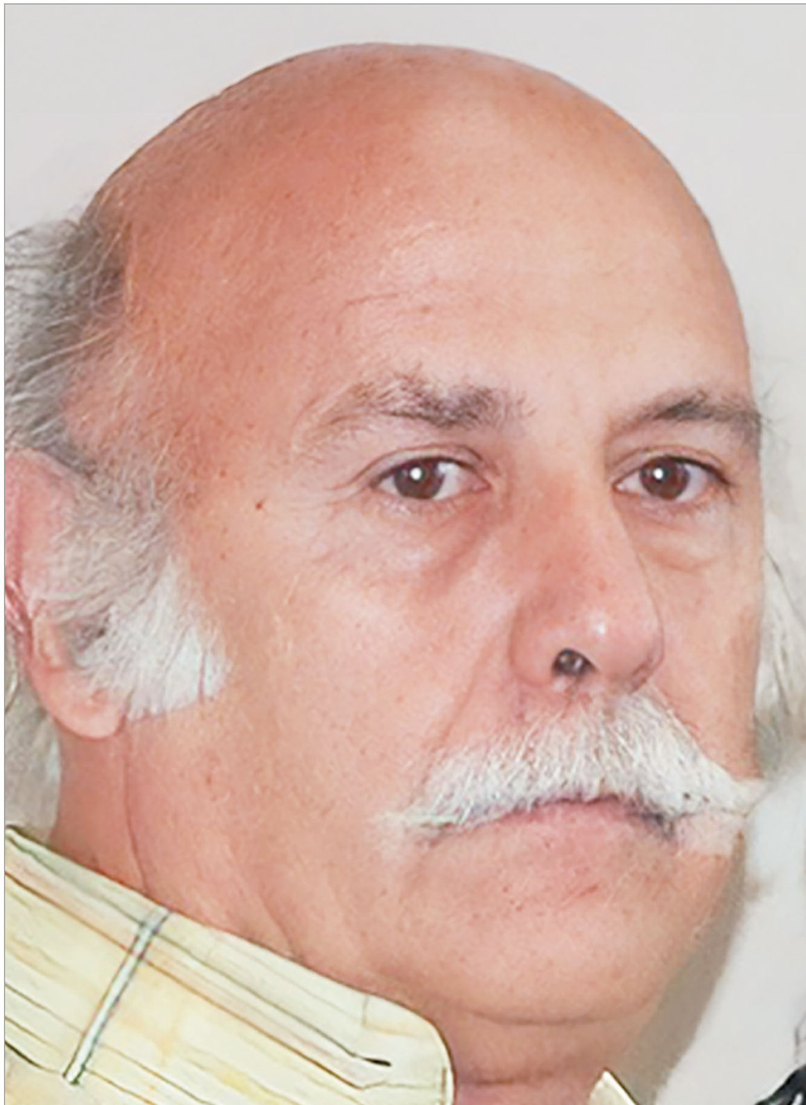
Cerdá fue docente de la Universidad de Lomas.

En el terreno práctico, Cerdá sostenía, por ejemplo, que en los ámbitos hospitalarios el psicólogo hacía psicoterapia con la anuencia de los directores o los jefes de servicio, que son médicos, y comprenden que estaban formados para ello.