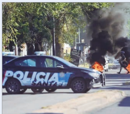
Crece la tensión policial en Rosario