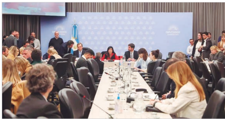
Diputados sesionará este jueves

abordó el acuerdo Mercosur-Unión Europea. La intención es incorporar el tema al temario para su tratamiento en el recinto también este mismo jueves.