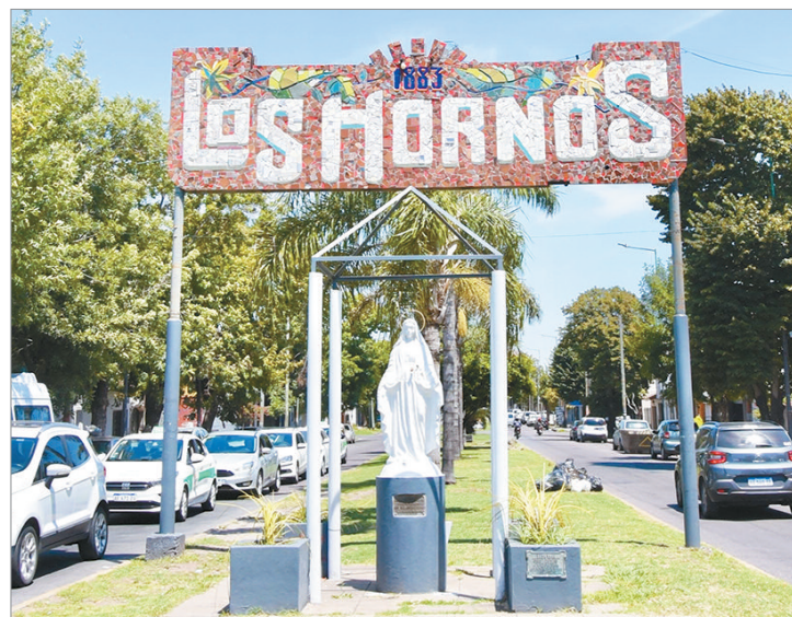
La jornada contará con música, danza y un desfile institucional