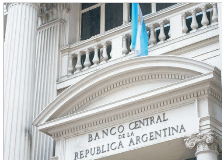
La medida flexibilizaría restricciones vigentes desde la crisis de 2001 y abriría nuevos préstamos