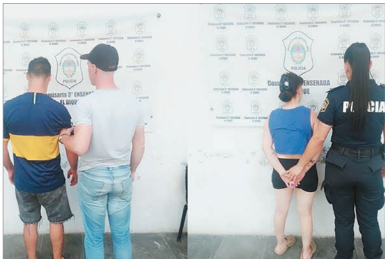
Sus padres quedaron detenidos

se hallaba en el centro de salud cumpliendo los adicionales realizó la denuncia mediante un llamado telefónico, y los efectivos policiales se entrevistaron con los médicos que atendieron a la beba para conocer más detalles.