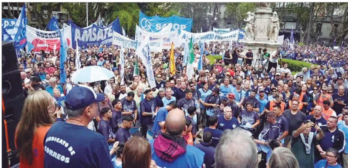
La protesta reunió a gremios y organizaciones frente al Palacio Legislativo

Con cese parcial de tareas y fuerte operativo de seguridad, las centrales obreras marcharon mientras el Senado debatía el proyecto