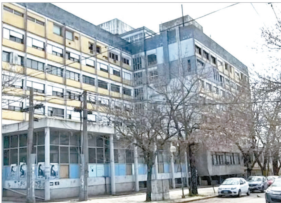
La víctima fue trasladada al Hospital Rossi

Este lo trasladó de urgencia hasta el Hospital Rossi, donde ingresó a la guardia alrededor de las 3.40. Los médicos constataron que había recibido un botellazo, que le provocó contusiones y cortes en el cuero cabelludo. Fue asistido y derivado luego, por la