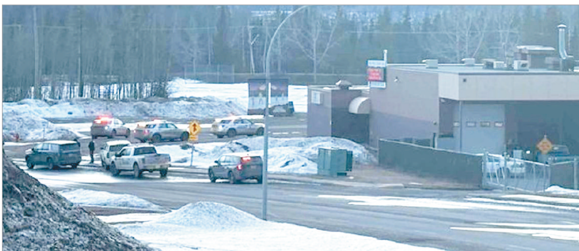
La localidad se encuentra al noreste de Vancouver

Hay 25 heridos. Se trata de una de las peores tragedias por armas de fuego en su historia reciente