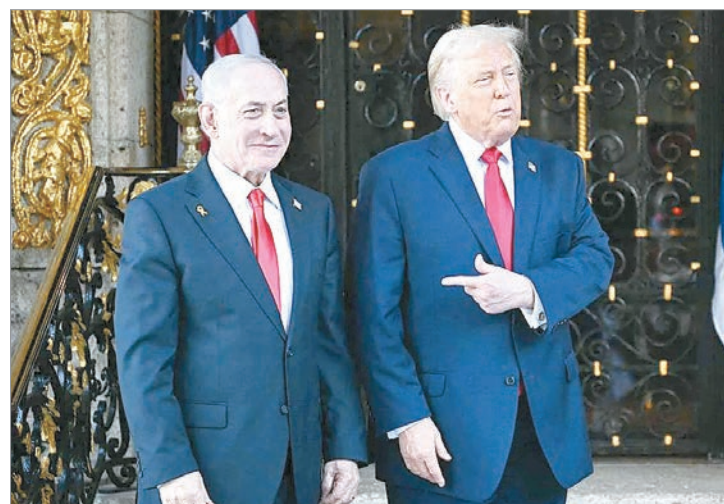
La reunión entre los líderes giró alrededor de las negociaciones para el acuerdo nuclear entre Estados Unidos e Irán

negociaciones para un acuerdo nuclear entre Estados Unidos e Irán. Israel exige que Irán no solo acceda a limitar su enriquecimiento de uranio, sino que también reduzca su programa de misiles balísticos y ponga fin a cualquier apoyo a milicias en la región, como Hizbulá. Por su parte, Irán rechaza estas exigencias y afirma que solo está dispuesto a aceptar ciertas limitaciones a su programa nuclear a cambio de un alivio de las sanciones internacionales. “Nuestro país, Irán, no cederá ante sus exigencias excesivas. Nuestro Irán no cederá ante la agresión, pero mantenemos el diálogo con todas nuestras fuerzas con los países vecinos para establecer la paz y la tranquilidad en la región. No buscamos adquirir armas nucleares. Lo hemos declarado repetidamente y estamos listos para cualquier verificación”, remarcó al respecto el presidente de Irán, Masoud Pezeshkian.