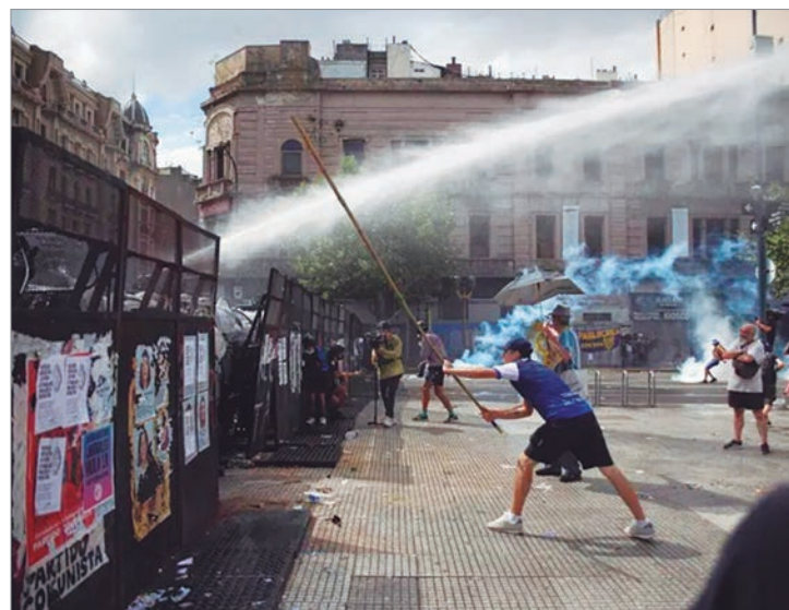
Hubo enfrentamientos con la Policía, uso de gases y balas de goma. Reportaron siete detenidos y varios agentes heridos

De acuerdo con lo informado oficialmente, hubo al menos siete personas detenidas. La ministra de Seguridad de la Nación, Alejandra Monteoliva, indicó además a través de sus redes sociales que varios efectivos policiales resultaron heridos durante los incidentes. El operativo se mantuvo activo durante la tarde para evitar nuevos focos de conflicto y garantizar la custodia del Palacio Legislativo mientras continuaba la sesión en el Senado.