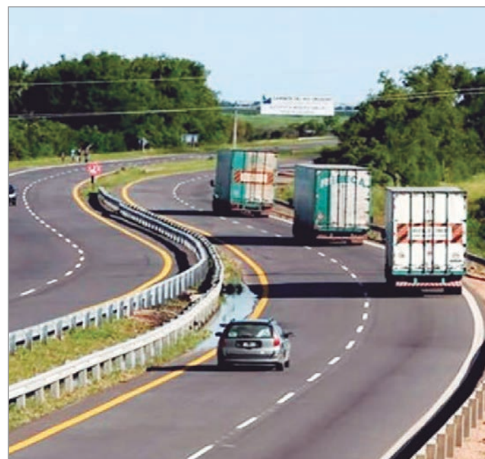
Nación llamó a licitación 2.500 kilómetros de rutas nacionales

El ministro de Economía, Luis Caputo, había anticipado el llamado a través de su cuenta oficial en la red social X. Sostuvo que buscan “reemplazar un modelo deficitario por uno sin subsidios, con más transparencia, competencia y eficiencia en la gestión vial”. En la misma línea, agregó que el Gobierno nacional trabaja “para tener una infraestructura vial más moderna y mejores rutas”.