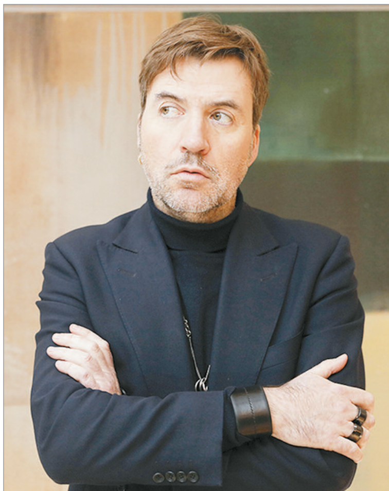
Ganó la Concha de Oro en San Sebastián

—Una casualidad, que es que alguien me pedía desde hace años que una universidad que trabajara con los alumnos hiciera un máster de documental creativo, me decía, haz un documental, y digo, no tengo tema, no me gusta un documental, no tengo tema, no hay ningún tema que me interese, y fueron pasando los años y esto coincidió, era el final de Pacifiction , y dices, ah, voy a hacer otra película, que yo tenía un poco, no tenía muy clara en mente qué película quería hacer, porque cada película mía es una reacción a la anterior, de hecho y entonces se cruzó este proyecto y digo, bueno, esto me encantará, se rueda así con calma, no hay que dirigir actores, que siempre es lo más difícil, y lo