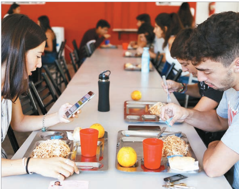
Los tickets ya pueden adquirirse de forma presencial en las distintas sedes

La compra de tickets se encuentra habilitada desde esta semana en las sedes correspondientes: Sede Malvinas (50 e/ 116 y 117); Sede