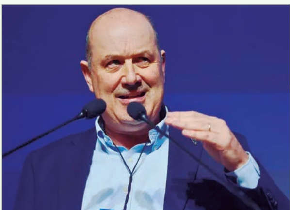
El ministro sostuvo que la "modernización" laboral busca reducir la informalidad y dar flexibilidad al empleo