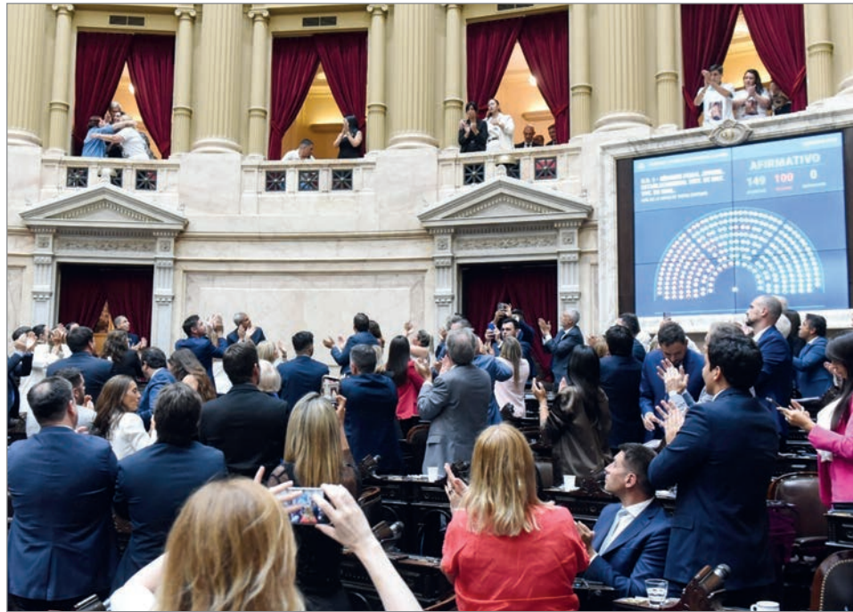
El oficialismo anotó otro triunfo parlamentario

la oficialización de una partida presupuestaria para la implementación del proyecto, dispuesto en 23,7 mil millones de pesos. Para contentar a aliados, el oficialismo lo incorporó. No obstante, algunos diputados destacaron en sus alocuciones que el Ejecutivo nacional ajustó hasta el momento las partidas destinadas al sistema penitenciario. “Me permito dudar que el Gobierno vaya a poner el presupuesto de esta ley”, expresó Miguel Ángel Pichetto, de Encuentro Federal, quien afirmó que está “de acuerdo en bajar la punibilidad en 14 años”.