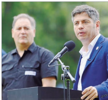
Kicillof defendió el programa Entramados

A su vez, agregó: “Ya son 30 distritos en los que se llevan a cabo acciones apuntando a la revinculación con el sistema educativo, el abordaje de consumos problemáticos y la formación para el trabajo”.