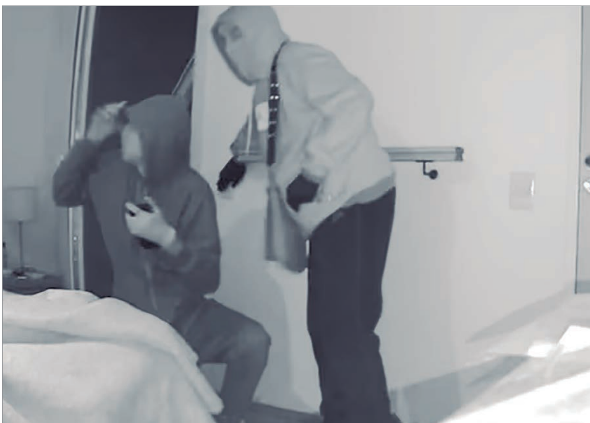
El momento quedó filmado

La causa tomó fuerte notoriedad pública tras difundirse imágenes de