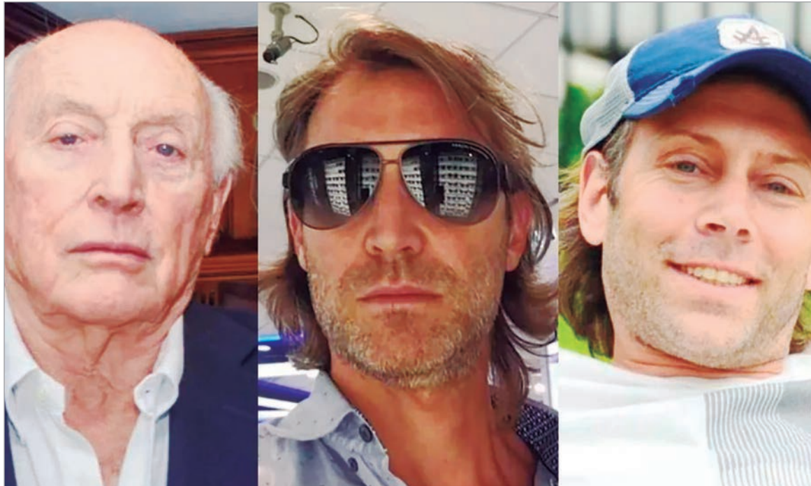
El caso Andis suma pruebas que comprometen a empresarios y funcionarios en maniobras irregulares

El expediente suma pruebas clave y expone vínculos entre la Agencia Nacional de Discapacidad y la firma Suizo Argentina