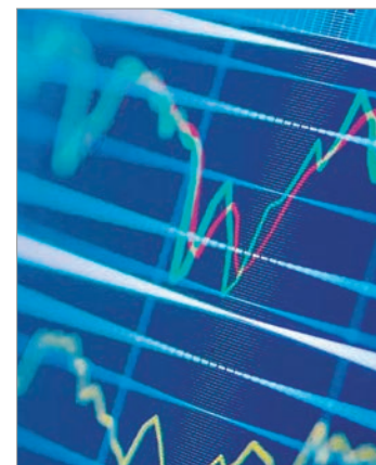
El índice de JP Morgan retrocedió a 497 unidades y cerró en 508 en una jornada volátil

argentinas en Wall Street sufrieron fuertes retrocesos, con caídas de hasta 7,8%. El Merval acompañó la tendencia y recortó 5,3% hasta los 2.856.344 puntos.