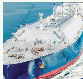
El acuerdo busca monetizar Vaca Muerta y posicionar al país como exportador global de GNL

El convenio incluye tareas de ingeniería, estructuración técnica y aspectos comerciales y finan-