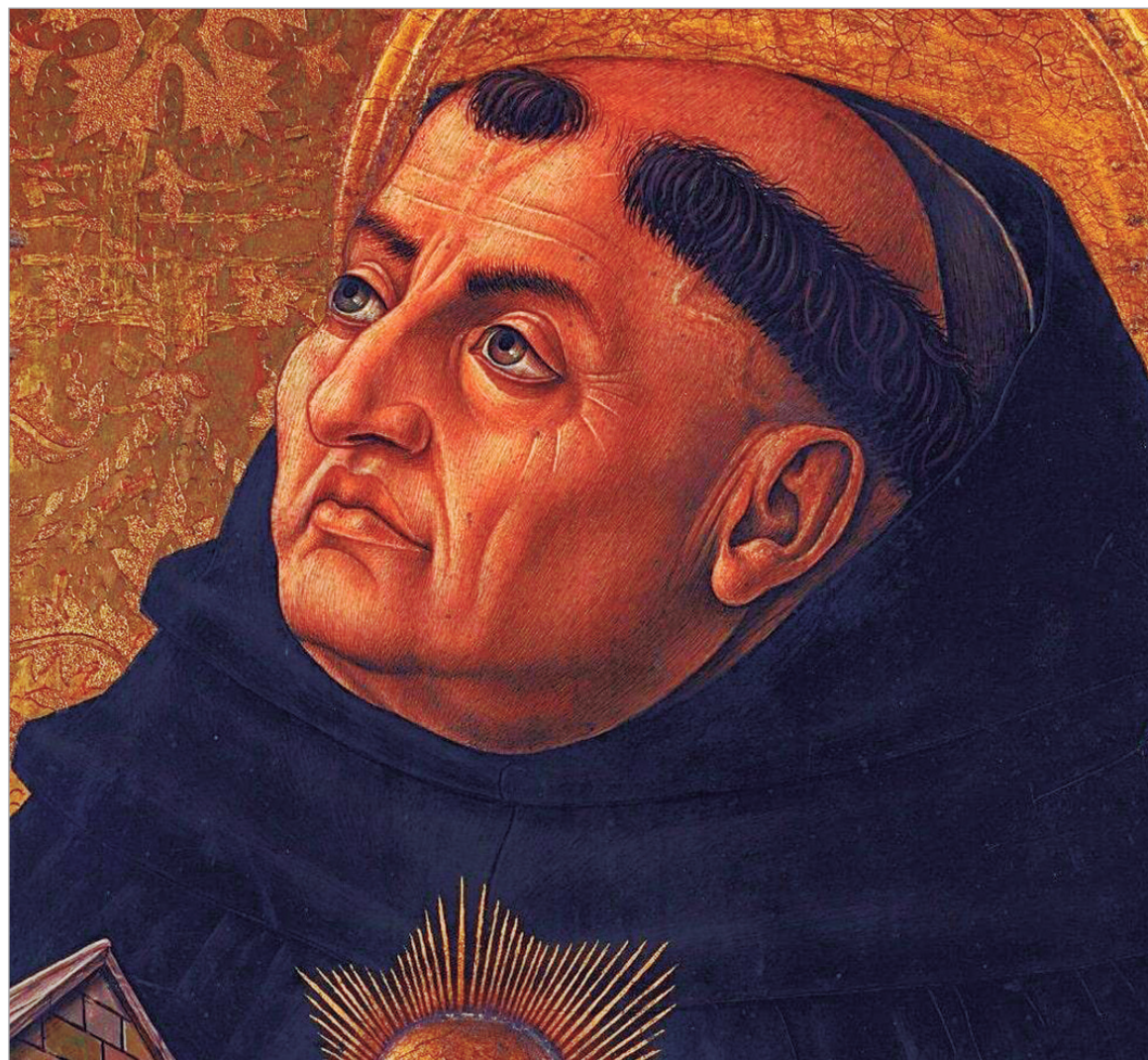
Fue uno de los filósofos más influyentes del escolasticismo.

Aquino había nacido en Roccasecca, en el reino de Sicilia, en el seno de una familia noble emparentada con gran parte de la aristocracia europea. Su primo era el emperador del Sacro Imperio Romano Germánico. A los cinco años, inició sus estudios en el célebre monaste-