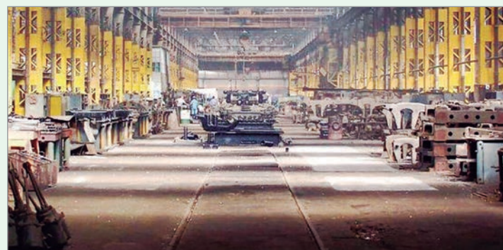
La mitad de las plantas están paradas

En cuanto a sectores, el que mayor nivel registró fue refinación del petróleo (87,1%), seguido de papel y cartón (65%); y el de menor porcentaje fue industria automotriz (31,2%).