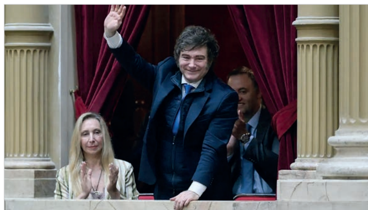
Milei quiere lista la ley en dos semanas

Cabe destacar que para poder cumplir con esta agenda exigente, el texto debe ser aprobado tal y como