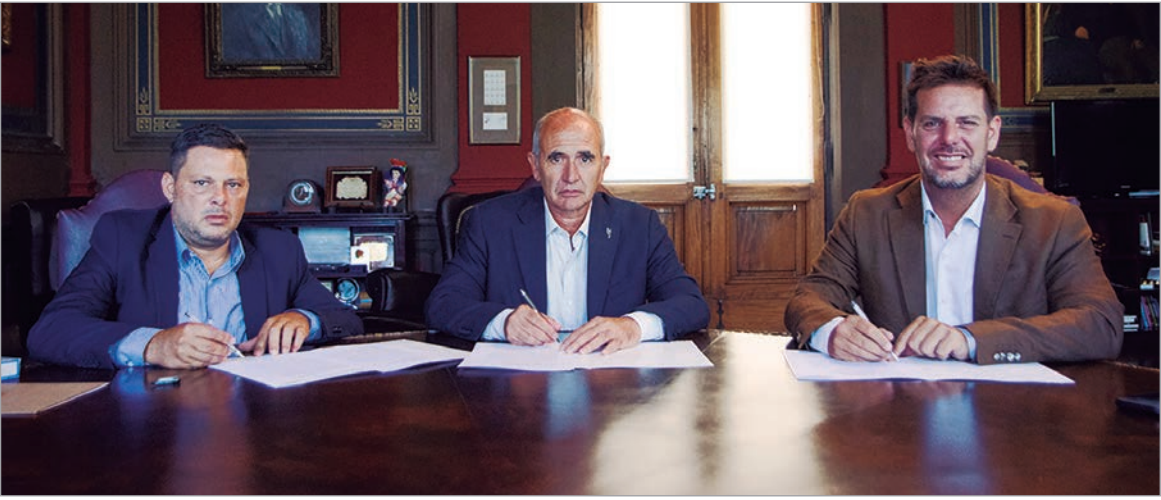
En la firma del acta de compromiso

La Universidad Nacional de La Plata, el Instituto de Lotería y la Fundación Nexum firmaron un acta compromiso para realizar una jornada interdisciplinaria de prevención a la ludopatía y las apuestas ilegales