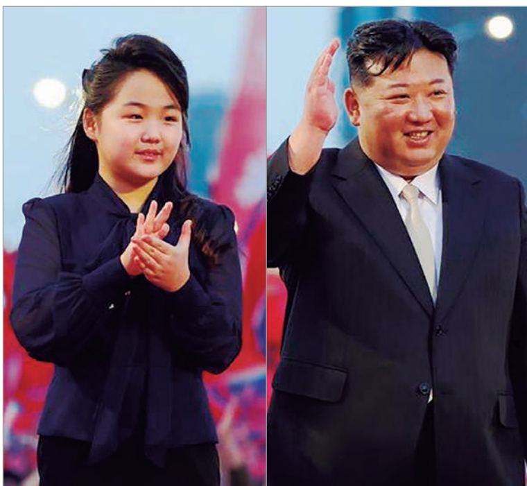
El líder norcoreano Kim Jong Un consolidó a su hija como heredera aparente antes de una conferencia histórica del partido

propaganda, los medios estatales norcoreanos nunca han publicado el nombre de la hija de Kim, refiriéndose a ella solo como su “respetada” o “querida” hija.