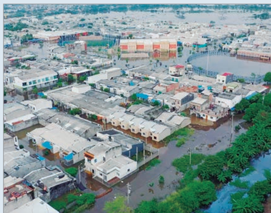
43.000 familias sufrieron daños directos solo en Córdoba

El Gobierno de Colombia decretó el estado de emergencia ante las intensas lluvias que afectaron a ocho departamentos del norte y la región Caribe, donde al