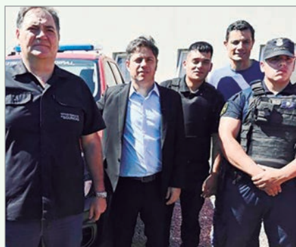
Advierten que no se tolerará protestas como en Santa Fe