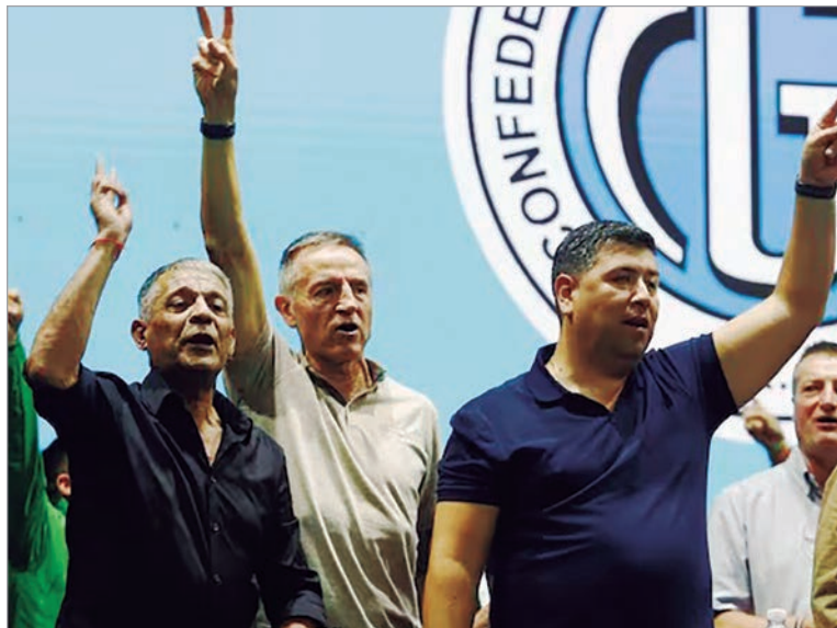
El sindicalismo advirtió que la iniciativa abre un camino de confrontación política y social

El pronunciamiento sindical se dio luego de la movilización realizada frente al Congreso, en el marco del debate en la Cámara alta. Como bien informó diario Hoy en su edición anterior, la CGT marchó junto a las dos CTA y otras organizaciones