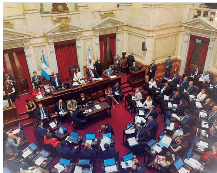
La reforma laboral ocupó portadas internacionales

La presencia de la noticia en medios internacionales confirma que el debate parlamentario trasciende fronteras y se instala como un tema de interés global, reforzando la idea de que la política argentina continúa siendo observada con atención en distintos escenarios del mundo.