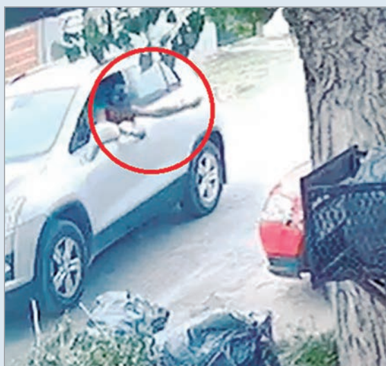
Buscan al implicado

Momentos de preocupación se viven en San Carlos tras la difusión de un video en el que se observa a un hombre ofreciendo dinero a menores con la excusa de que compraran golosinas. El episodio ocurrió este jueves, cerca de las 11, en 523 bis entre 141 y 142.