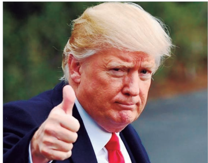
La Cámara Baja se planta ante la política comercial de Trump

El proyecto ahora se dirige al Senado, donde los republicanos también tienen mayoría, lo que reduce las posibilidades de que se convierta en ley.