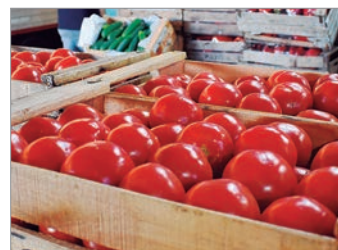
La Provincia alienta la producción nacional