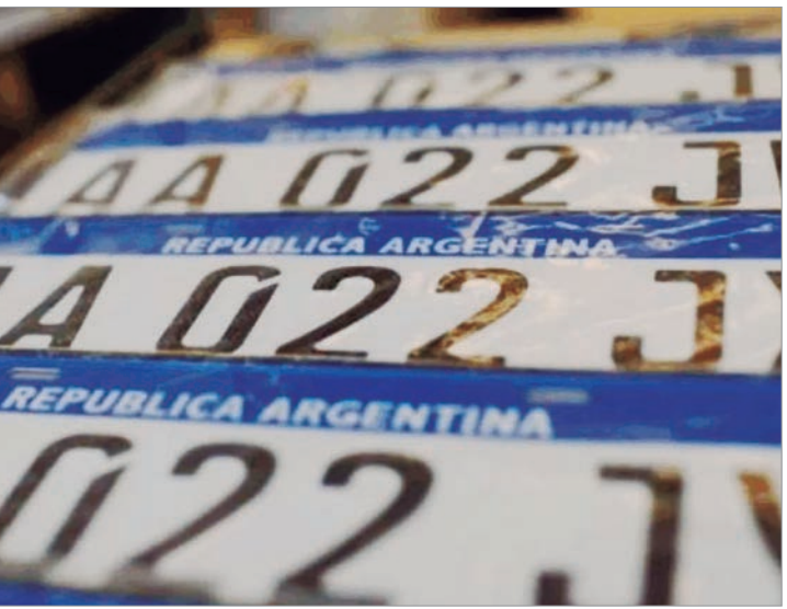
El 10 de marzo es el primer vencimiento

pero además en 10 cuotas. Me parece que eso alivia el problema de tener que pagar cada dos meses y hace más fácil planificarse las finanzas de esa manera. Hasta acá no lo habíamos podido hacer por una restricción tecnológica", expresó Girard. El organismo bonaerense buscaba avanzar con la nueva política contributiva hacía tiempo, pero se encontraba ligada a la culminación del proyecto de modernización tecnológica del sistema. Asimismo, analizan implementar ese esquema de pago para los impuestos inmobiliarios a futuro. Desde ARBA señalaron que la actualización de los sistemas permitió avanzar con este nuevo esquema de pago, que busca otorgar mayor previsibilidad y distribuir el impacto del impuesto a lo largo del año. La combinación de una reducción nominal para el 75% de los contribuyentes y la ampliación del financiamiento apunta a aliviar la carga sobre las economías familiares.