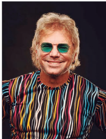
Finalmente el miércoles que viene estrena programa

—Sí, el programa empezaba a ocho y media y yo llegaba ocho y veinte, para que te des una idea de cómo estaba de armadito todo, de previsible todo, cada uno sabía lo que tenía que hacer. Bueno, ahora arrancar de nuevo. Así que, como cuando empezamos con Bendita, empezar a pensar un producto para mucho tiempo. Porque acá, en principio, y salvo que ocurra un cataclismo, no se nos cruza la idea de que sea un desastre y que pueda arrancar mal, porque por supuesto no tenemos atada la audiencia. Pero está pensado como para que tengamos bastante tiempo como para encontrar la identidad y la estética. Es un canal que no tiene urgencias y una productora que tampoco las tiene. Ellos tienen, por ejemplo, la experiencia de LAM, que