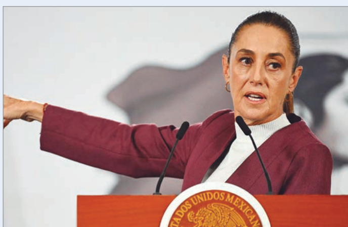
La presidenta, Claudia Sheinbaum