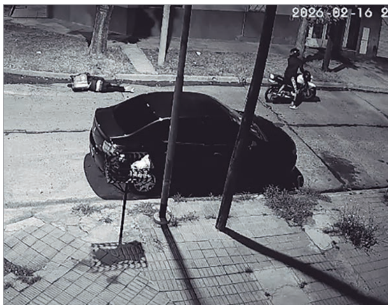
El momento del hecho

La bala impactó en uno de los atacantes y el disparo resultó ser mortal. En ese marco, el acompañante del rodado falleció prácticamente en el acto y en el lugar, mientras tanto que el conductor logró darse a la fuga, huyendo a gran velocidad perdiéndose entre las calles del barrio. Por tal motivo, es intensamente buscado por los investigadores.