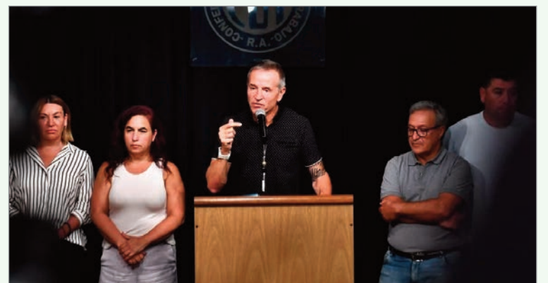
Definiciones sindicales en medio de la tensión política

trabajadores del Estado nacional que participen del paro podrían enfrentar descuentos salariales por la jornada no trabajada. La advertencia, que circuló en ámbitos gremiales y oficiales, introduce un factor de presión sobre la adhesión de los empleados públicos, dado que la eventual retención de haberes impactaría de manera directa en los ingresos mensuales.