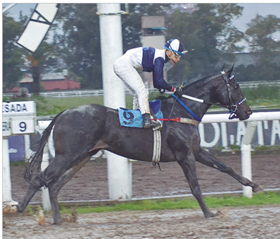
Final de bandera verde. Por media cabeza Letter Money derrotó a Sir Port en el final más emotivo de la jornada hípica.

Abiertos los partidores, Evo Rachín “primereó” a Puerto Bendito y a Sir Port. No obstante, formalizada la carrera, Puerto Bendito se le fue al humo al puntero y en la franca pugna le sacaron buena ventaja a Farale y a Sir Port, quedando cerca Amador Vega. Con un andar vertiginoso concluyeron el recorrido del opuesto y al zambullirse en el codo tolosano, seguía la dura porfía por la vanguardia entre Puerto Bendito y Evo Rachín, con varios cuerpos de ventaja sobre el favorito que buscaba acercarse, quedando detrás