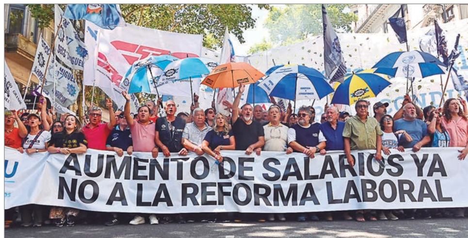
Gremios se diferencian de la conducción de la CGT

E l Frente de Sindicatos Unidos (FreSU), que integran un grupo de sindicatos de la CGT (UOM, aceiteros, pilotos, entre otros) y las dos CTA, ratificó el paro con movilización al Congreso para este jueves en rechazo a la reforma laboral. El anuncio se conoció tras una reunión virtual que mantuvieron los representantes sindicales. De esta manera, se diferenciaron de la conducción de la CGT que resolvió ir a un paro general pero sin movilización. El paro y marcha será el jueves debido a que es el día que suena como más probable para que el proyecto de reforma laboral sea tratado en Diputados luego de haber recibido la media sanción del Senado la semana pasada. “El paro se va a hacer sentir en todo el país, pero no podemos quedarnos en la casa. Si no