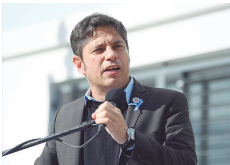
Estrategia política con foco 2027

La idea de “formación puertas abiertas”, según fuentes internas, implica la organización de espacios de capacitación política orientados