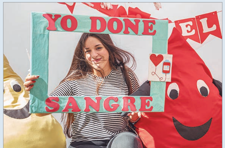
Donar sangre salva vidas

estado de salud, hayan desayunado previamente y concurren con su DNI. La donación es un acto voluntario, seguro y fundamental para salvar vidas.