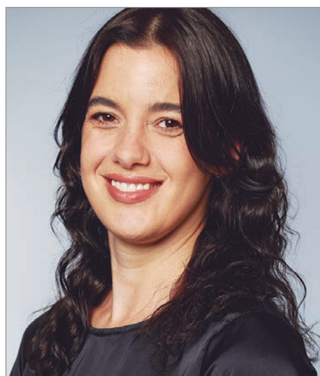
Teatro, televisión, el 2026 arrancó con todo

—Y es paulatino, está buenísimo porque además mi personaje va creciendo de a poco. Entonces me van tirando comentarios y qué va a pasar. Algo que se había perdido y para mí es muy lindo. Que la gente se entusiasma con el no puedo creer que haya pasado esto, y ahora, y ella qué va a pasar, y se va a casar, y no sé, como, y es muy divertido. Y me parece que es divertido también para el espec-