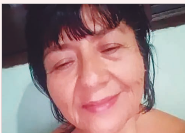
La mujer asesinada