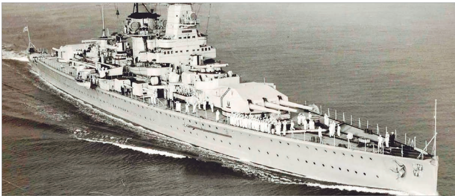
El Graf Spee fue un acorazado de bolsillo alemán de la Segunda Guerra Mundial

El Tigre de los Mares, por Joseph Goebbels, quien lo consideraba el orgullo de la armada alemana: poseía la velocidad de un crucero y la potencia arrolladora de un acorazado. Podía atacar a naves de gran porte –causándole graves daños con el grueso calibre de sus cañones– y evitar el contraataque gracias a su velocidad de 32 nudos.