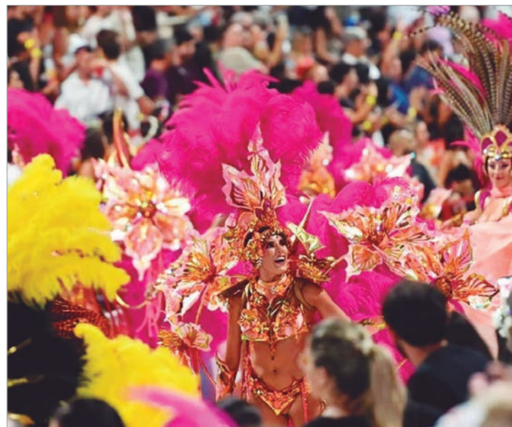
El gasto diario promedio por turista se redujo 7,7%

Cabe destacar que es el quinceavo año consecutivo que la Argentina festeja oficialmente el Carnaval tras más de tres décadas que la celebración había desaparecido del calendario de feriados nacionales.