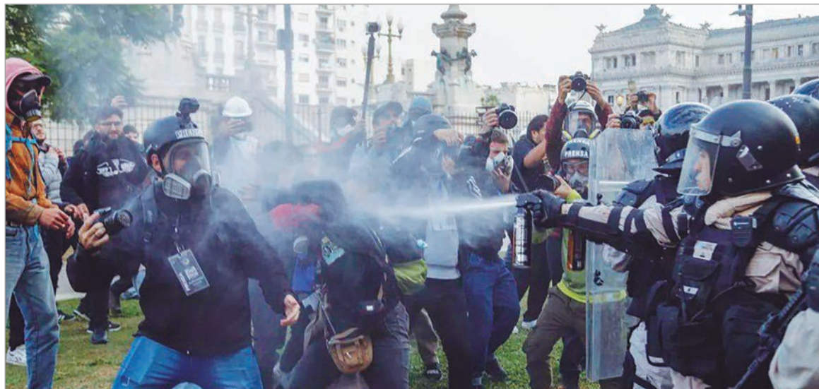
Amenazante comunicado para periodistas y camarógrafos

El Ministerio de Seguridad avisó a periodistas y camarógrafos que la Policía actuará ante hechos de violencia