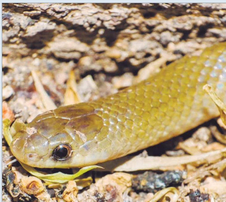
Hasta el momento se conocen únicamente tres ejemplares

Una nueva especie de serpiente subterránea denominada Yakacoatl tlalli fue descubierta por un equipo de investigación integrado por especialistas de la Universidad Nacional Autónoma de México, la Benemérita Universidad Autónoma de Puebla, la Universidad de Texas y el Consejo Nacional de Investigaciones Científicas y Técnicas (Conicet), de acuerdo con información publicada por la Secretaría de Medio Ambiente y Recursos Naturales (Semarnat).