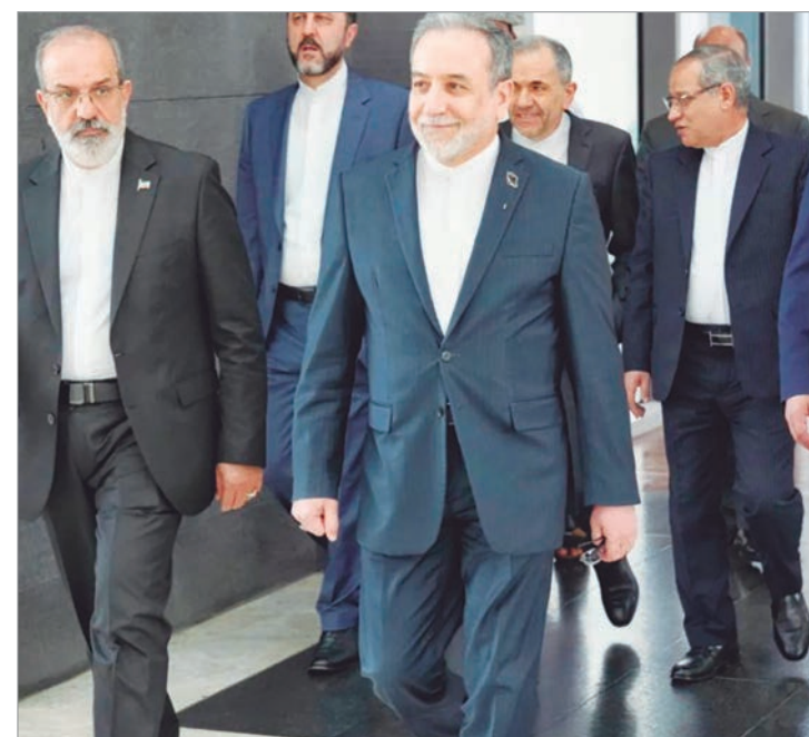
Ambos países retomaron el diálogo

República Islámica tiene en su poder porque un país “sin armamento disuasorio queda a merced de sus enemigos”. “Los estadounidenses, al intervenir en la cuestión del armamento, dicen que ustedes no deben tener cierto tipo o alcance de misiles, cuando en este asunto le corresponde únicamente al pueblo iraní y no les incumbe a ellos”, dijo el religioso en un evento en Teherán. La máxima autoridad política iraní consideró que es “necesario y obligatorio” que los países cuenten con armamento disuasorio. “Cualquier país sin armamento disuasorio queda a merced de sus enemigos”, aseguró.