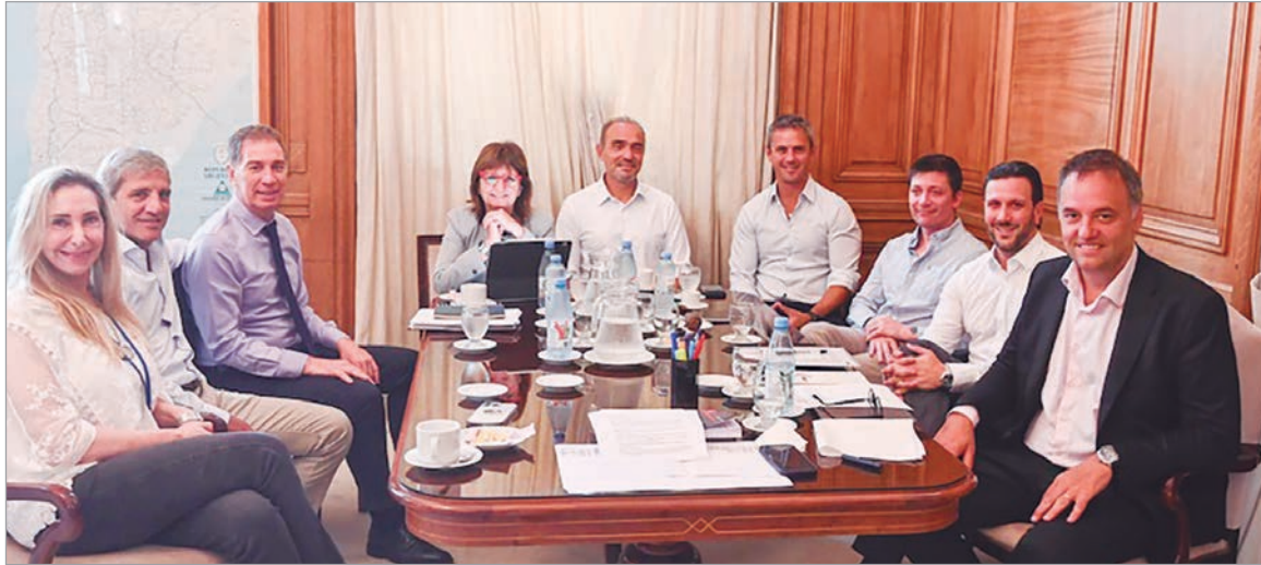
Rediseños en la Ley para ampliar consensos

la concesión de licencias, con el objetivo de garantizar la cobertura efectiva de ausencias justificadas por motivos de salud y evitar eventuales litigios o controversias.