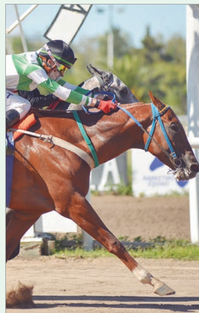
Esta hecho un “óleo”. Haciendo honor a su nombre, Picasso reprisa con buenos trabajos, como para “pintar” a sus rivales