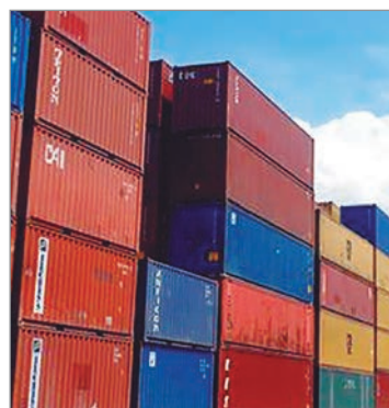
Exportaciones, matriz productiva y mercados

de los productos primarios. Sin embargo, la comparación interanual evidencia una modificación en la estructura de exportaciones: desde