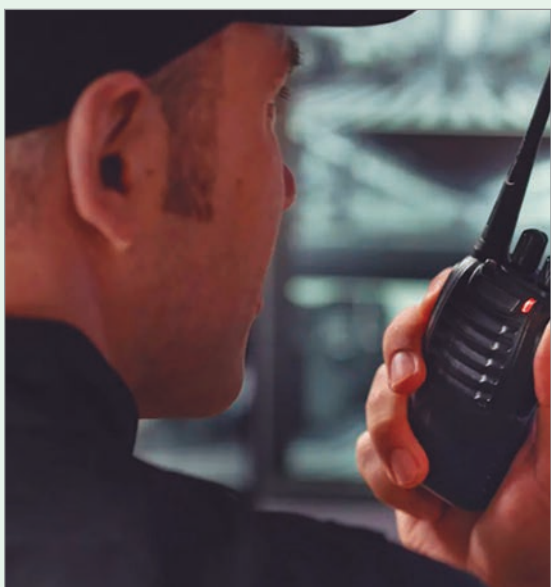
El Municipio quiere 140 agentes de seguridad privada

La Municipalidad de La Plata abrió la licitación para contratar un servicio de seguridad privada que cubrirá plazas, parques, edificios y dependencias públicas. Según detalla el pliego de bases y condiciones, el objetivo es prevenir robos, vandalismo e incidentes y reforzar el control de accesos y circulación de personas y vehículos en la ciudad.