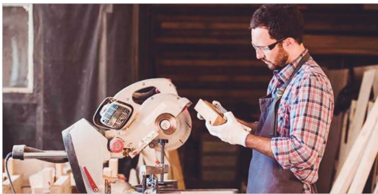
Alertan por la aceleración de los cierres de empresas

De acuerdo a los datos que se desprenden del último Radar PyME elaborado por la Asociación de Empresarios y Empresarias Nacionales para el Desarrollo Argentino (ENAC), 31.500 pymes podrían cerrar este 2026 como resultado de la actual crisis económica. Esto es el 6,3% de todas las firmas en el país, que se sumarán así a las más de 22.000 empresas que ya bajaron sus persianas entre 2024 y 2025. El relevamiento evidenció que el 56,3% de los empresarios cree que la situación económica nacional empeorará (6,7% respecto a un año atrás) y el 21,5% consideró que no hay variables de crecimiento aplicables a su negocio. Por otro lado, mientras el Gobierno