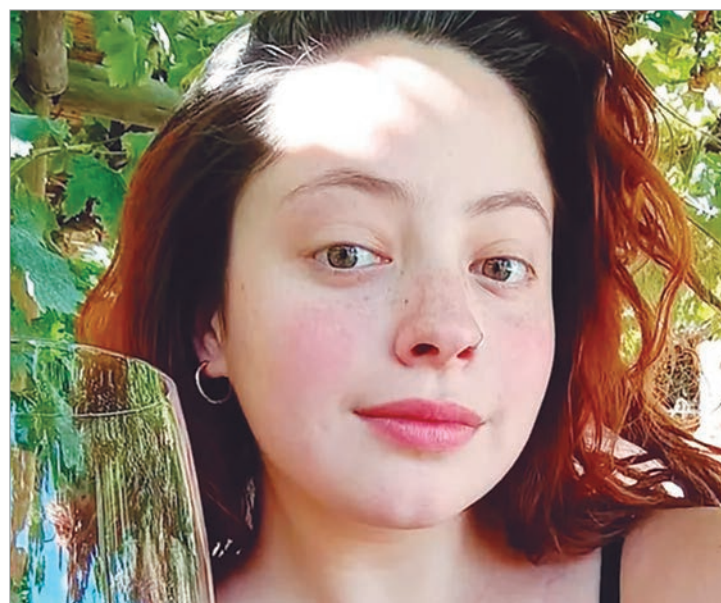
La joven desaparecida

"Lamentablemente tuvimos un accidente bajo el agua y no la encontramos desde ayer. La Prefectura no tuvo un rápido accionar y se centraron en lo burocrático", cuestionó, y agregó: "Primero, en vez de buscar inmediatamente y aceptar la ayuda de otros buzos de las escuelas de Puerto Madryn".