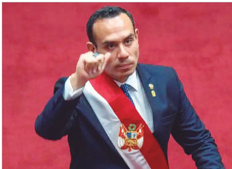
El Parlamento elegirá hoy mismo a un nuevo jefe del Legislativo

El Congreso de Perú destituyó al presidente interino, el derechista José Jerí. Así, el país vive su octavo cambio presidencial en casi una década de inestabilidad política