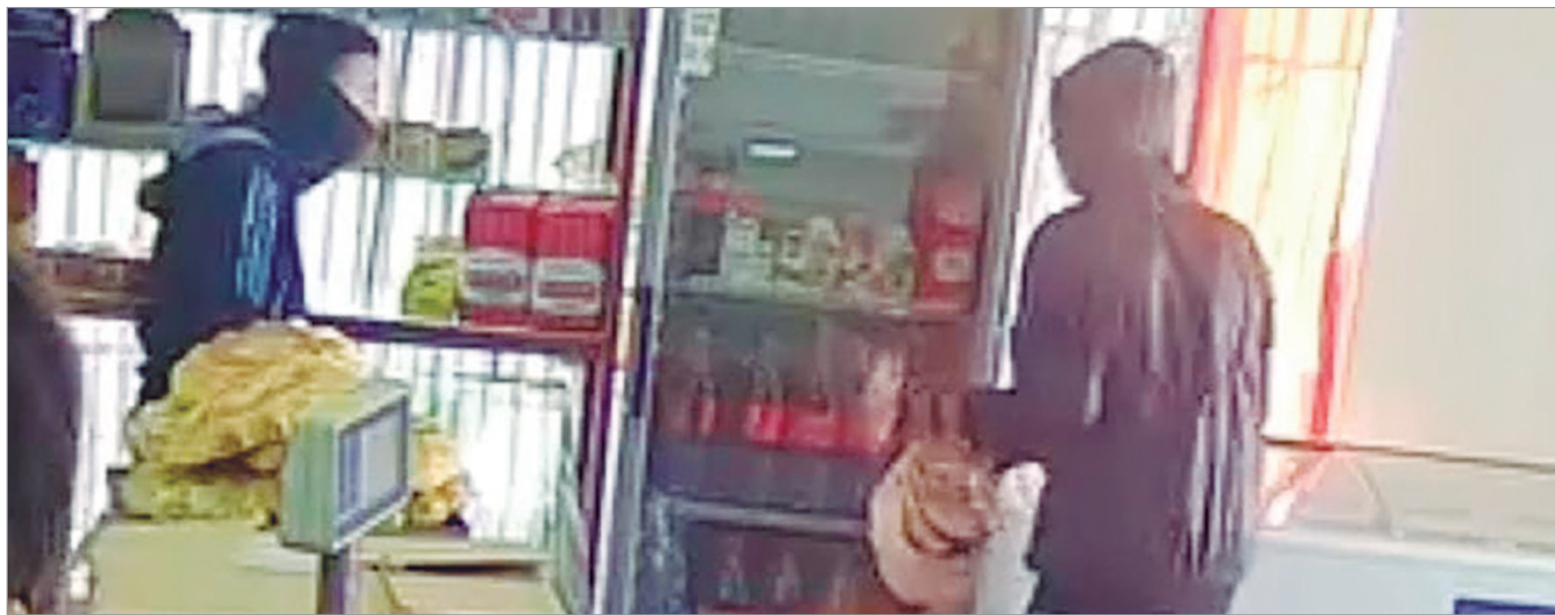
Todo quedó filmado

El último episodio ocurrió en horas de la mañana, minutos después de que el comercio levantara sus persianas. Dos delincuentes encapuchados ingresaron cuando una empleada se encontraba sola atendiendo. Bajo amenazas, exigieron el dinero de la caja registradora y se llevaron también el posnet antes de escapar rápidamente. La secuencia quedó marcada por el