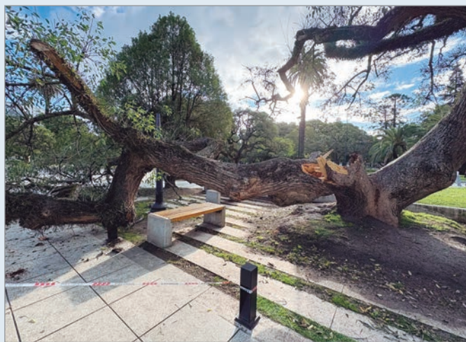
De milagro no hubo heridos

Vecinos de la ciudad que en la jornada de ayer paseaban por Plaza San Martín manifestaron su preocupación por la caída de una enorme rama que de milagro no causó una tragedia.