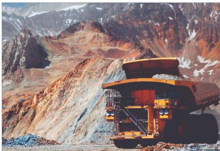
El Indec informó suba interanual de 3,3%, pero caída mensual de 1%