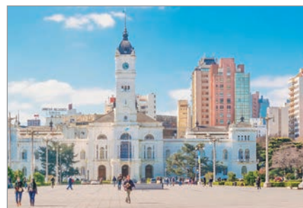
Baches, alumbrado, inseguridad y residuos son los principales reclamos

Al definir al proyecto, indican que lo que se proponen es “visibilizar el estado de la infraestructura y los servicios públicos de la ciudad: las calles deterioradas, los residuos acumulados, las deficiencias en el alumbrado y los graves problemas de seguridad”.