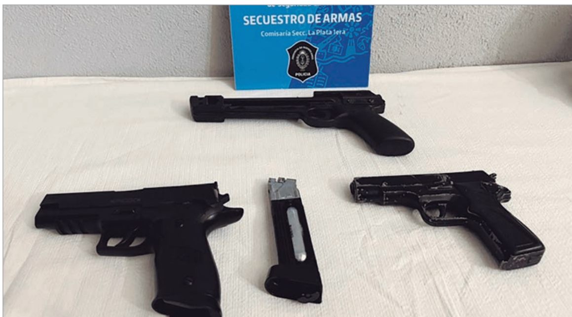
Las armas incautadas

Un hombre y una mujer protagonizaron una fuerte discusión a metros de Plaza Moreno. Tras la denuncia requisaron su casa y encontraron armas