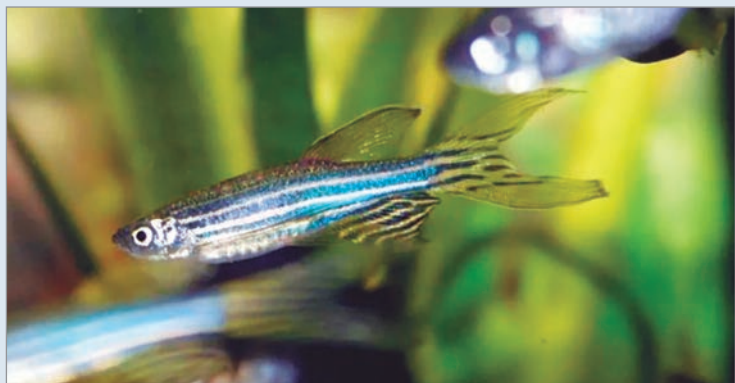
El pez cebra es uno de los modelos utilizados para la regeneración de tejidos

—Miguel Paulino Tato - a quien Sui Generis le dedicó "El señor Tijeras"-, se jactaba en una entrevista pública que si Dios lo ayudaba iba a prohibir trescientas películas por año. Me parece que Dios lo ayudó. Lo mismo pasaba con la música, al estar todo prohibido, nadie sabía qué se podía poner o no. Entonces operaba la autocensura.