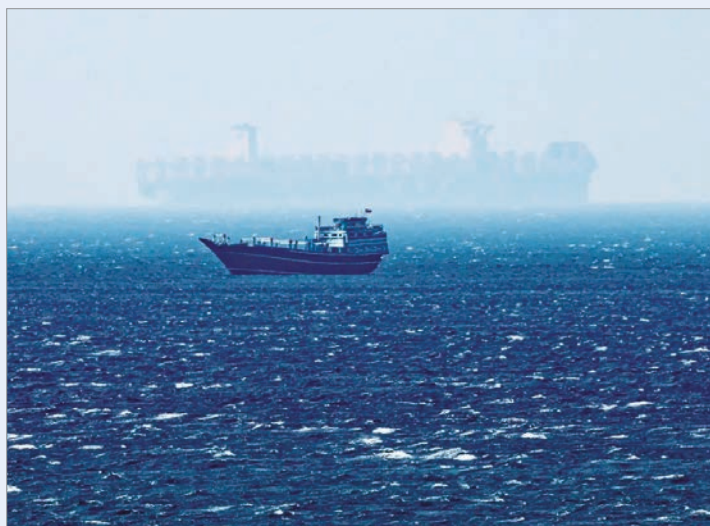
La Compañía Nacional de Petróleo iraní denunció "cobarde ataque" contra su refinería en la isla de Lavan

Bajo este contexto, el presidente de Estados Unidos, Donald Trump, dijo ayer que los ataques de Israel contra Hezbolá en el Líbano son una "escaramuza" separada de la guerra librada junto al gobierno israelí contra Irán, por lo que no forman parte del cese el fuego temporal alcanzado en las últimas horas con Teherán. Según Trump, el propio grupo extremista chiita fue la razón por la que no fueron incluidos en la pausa de dos semanas en el conflicto con la República Islámica. "Por Hezbolá. No quedaron incluidos en el acuerdo. Eso también se resolverá. No hay problema", aclaró.