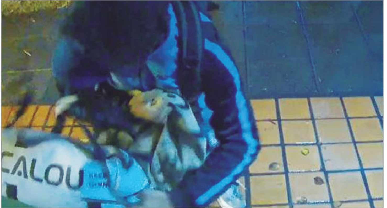
El nuevo atraco quedó registrado

el Café Martínez. Tampoco en esta oportunidad los agentes lograron dar con el sospechoso.