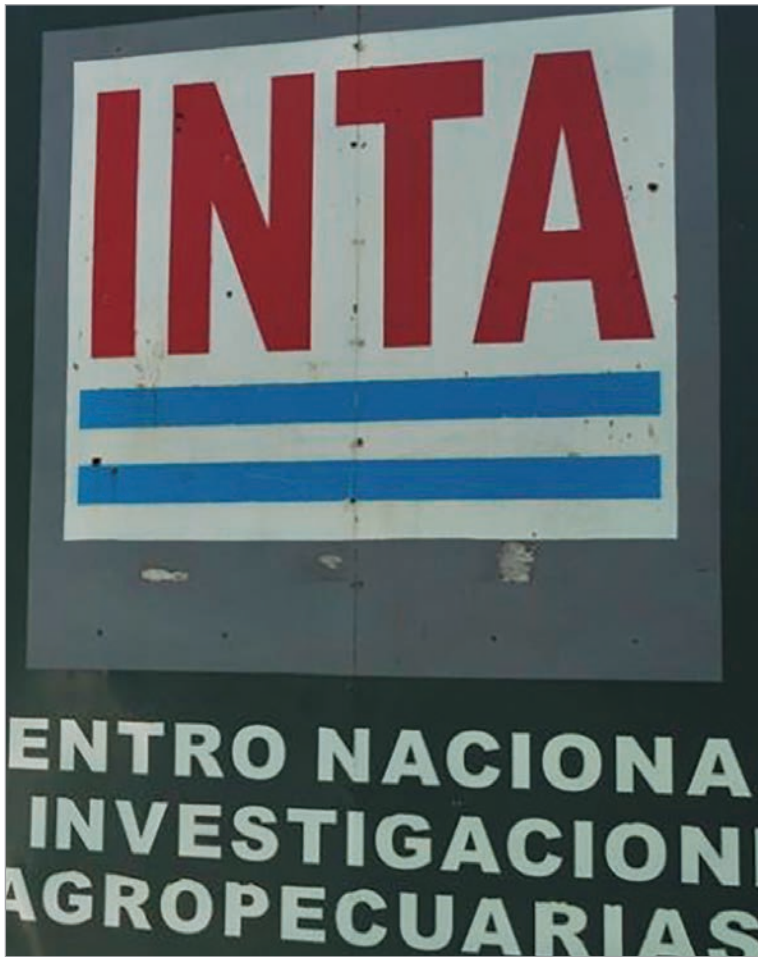
Las sedes eliminadas afectan a productores y comunidades rurales

El relanzamiento del ajuste se produce tras un 2025 marcado por tensiones, cuando los intentos de modificar la gobernanza del INTA enfrentaron resistencias tanto en el Congreso como en la Justicia. Sin