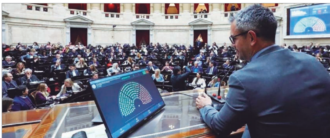
Gobernadores volvieron a apoyar a LLA en el Congreso

En medio de protestas en las adyacencias del Congreso, La Libertad Avanza (LLA) y sus bloques aliados se encaminan a convertir en ley la reforma pro minera a la Ley de Glaciares. Al cierre de esta edición, aún los diputados no habían votado, pero se espera que al menos los 129 que dieron quórum voten a favor de la iniciativa.