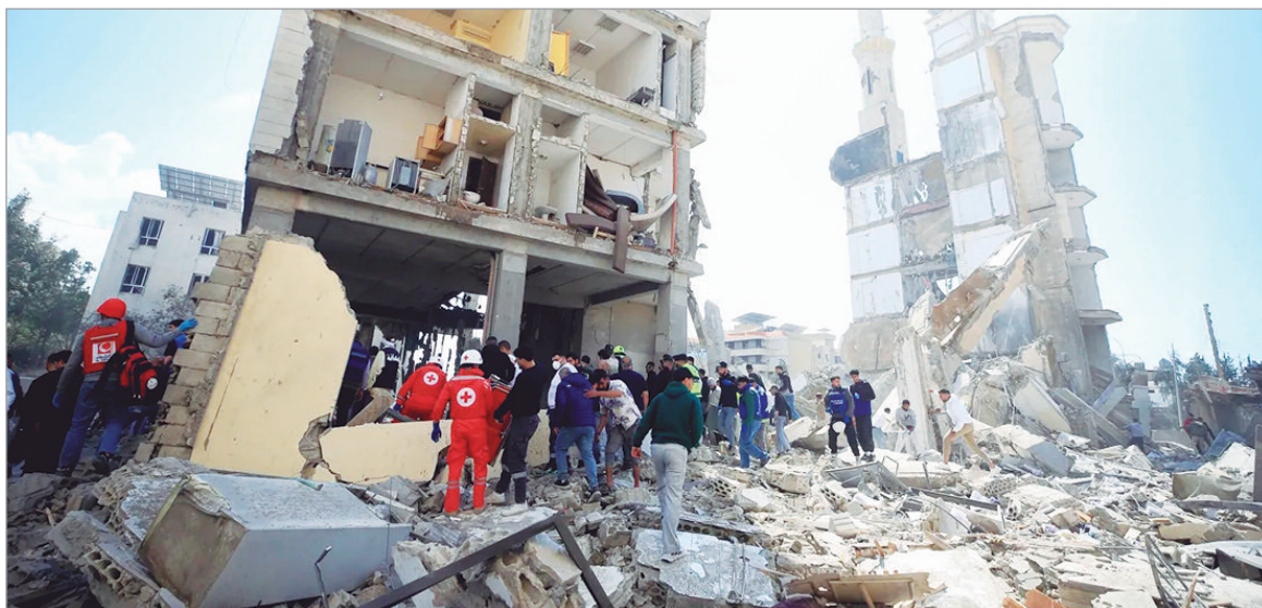
Desde el inicio ya perdieron la vida más de 1.300 individuos

Solamente en las últimas 24 horas han perdido la vida más de 100 personas. Además, ya se registraron más de un millón de desplazados