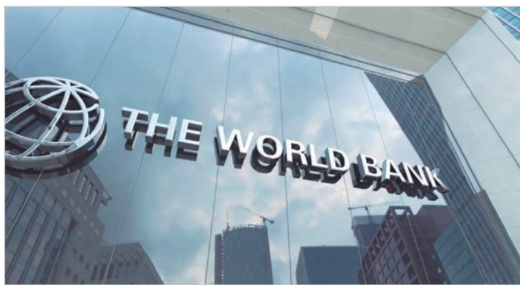
El Banco Mundial respaldó la gestión Milei

La previsión surge del informe Panorama Económico de América Latina y el Caribe de abril. Al revelar que las perspectivas de crecimiento de la región para 2026 “siguen siendo limitadas”, el Banco Mundial remarcó que “Argentina ha emergido como la principal excepción al alza, ya que la estabilización y las reformas han mejorado las expectativas y las condiciones financieras”.