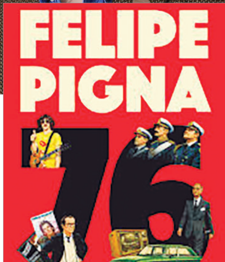
"76" el más reciente libro del historiador Felipe Pigna