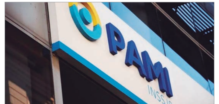
La deuda con prestadores supera los $500.000 millones y afecta la continuidad de tratamientos

La crisis expone la fragilidad del sistema y la necesidad de respuestas inmediatas para garantizar la continuidad de la atención y preservar la confianza en una institución clave para la población mayor.