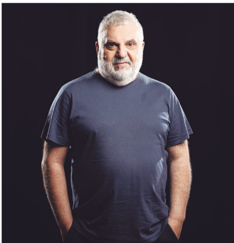
Está feliz por el regreso

—Bueno, en realidad primero, nos manejamos siempre de la misma forma, que es como la primera fase del trabajo es el acopio del repertorio, y eso lo hacemos muy juntos, cada uno de los temas que hacemos nos tienen que gustar rabiosa-