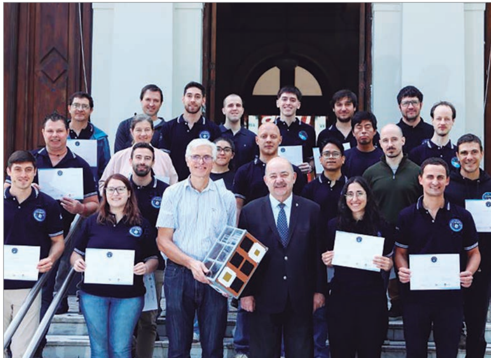
El equipo de la UNLP marcó un hito en la historia de la ingeniería aeroespacial de nuestro país

El equipo de la UNLP que marcó un hito en la historia de la ingeniería aeroespacial de nuestro país, recibió en la jornada de ayer una distinción especial de manos de las máximas autoridades de la casa de estudios platense.