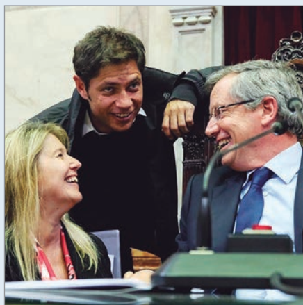
Se suman gestos de apertura política

De cara a las elecciones presidenciales de 2027, Axel Kicillof mantuvo en las últimas horas un encuentro con el ex diputado nacional Emilio Monzó y el legislador Nicolás Massot. Se trata de dos dirigentes que vienen trabajando en la construcción de un armado amplio en oposición