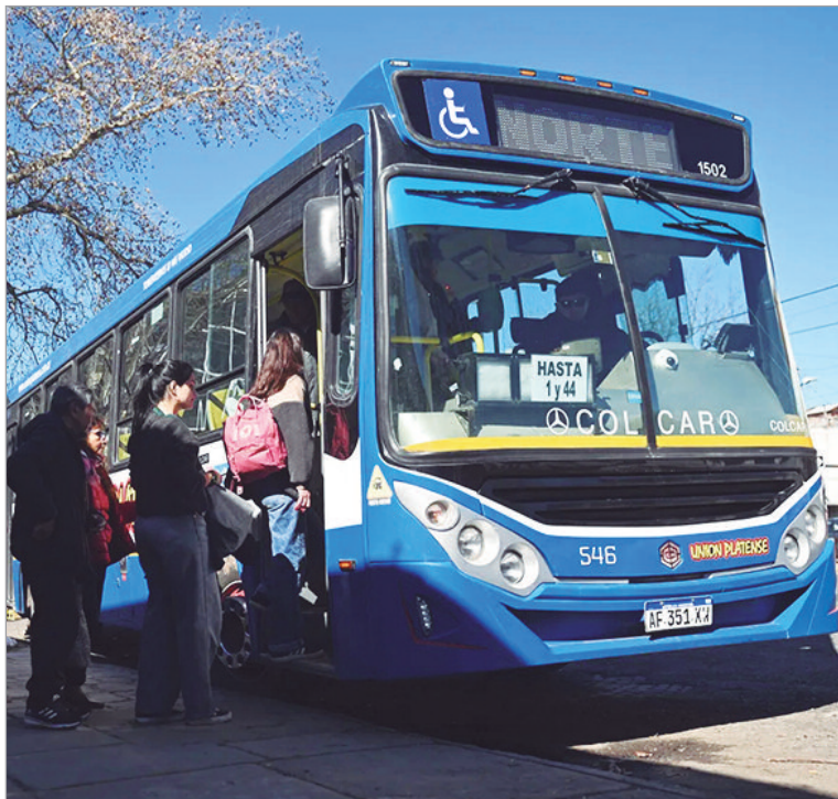
Se multiplican los reclamos de usuarios

La Unión Tranviarios Automotor (UTA) confirmó un paro de micros en el AMBA desde la medianoche de este jueves para las líneas sin subsidios ni pago de salarios de marzo. No obstante, según publicó el portal 0221.com, fuentes del gremio indicaron que la medida no tendrá efecto La Plata, ya que las empresas pagaron en tiempo y forma.