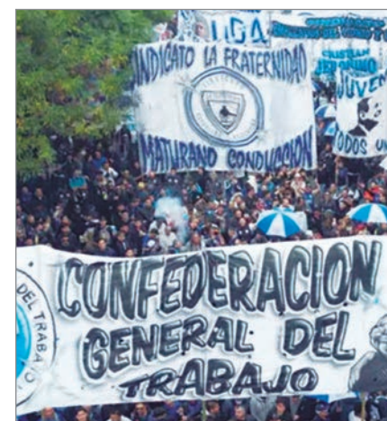
Planea una movilización el 30 de abril