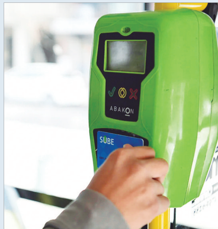
El transporte es el rubro que más aumentó

“El gasto en Transporte es el rubro con mayor peso y que tuvo un incremento del 14,8% respecto del mes anterior”, señaló el documento técnico. Esta dinámica ha llevado a que una familia tipo en el AMBA deba destinar, en promedio, $101.026 pesos mensuales solo para cubrir sus necesidades de movilidad, frente a los $59.370 pesos que requería en marzo de 2025.