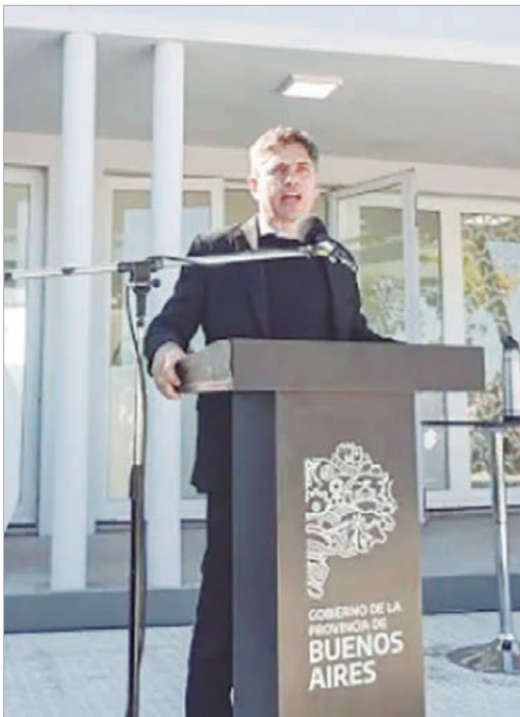
Provincia amplía el acceso universitario mientras critica el ajuste nacional

El nuevo centro universitario de Carlos Tejedor demandó una inversión de 250 millones de pesos. Allí se entregaron 29 netbooks a estudiantes y certificados a egresados de diplomaturas en Producción Ganadera y Conservación de Forrajes, dictadas por la Universidad de