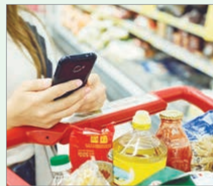
El índice acumula 8,9% en el año y la variación interanual alcanzó el 32,1%

El estudio del instituto porteño indicó que los bienes subieron 2,8% y los servicios 3,1%, con fuerte incidencia de alimentos, cuotas escolares y tarifas de vivienda, mientras que turismo y hoteles moderaron la presión.