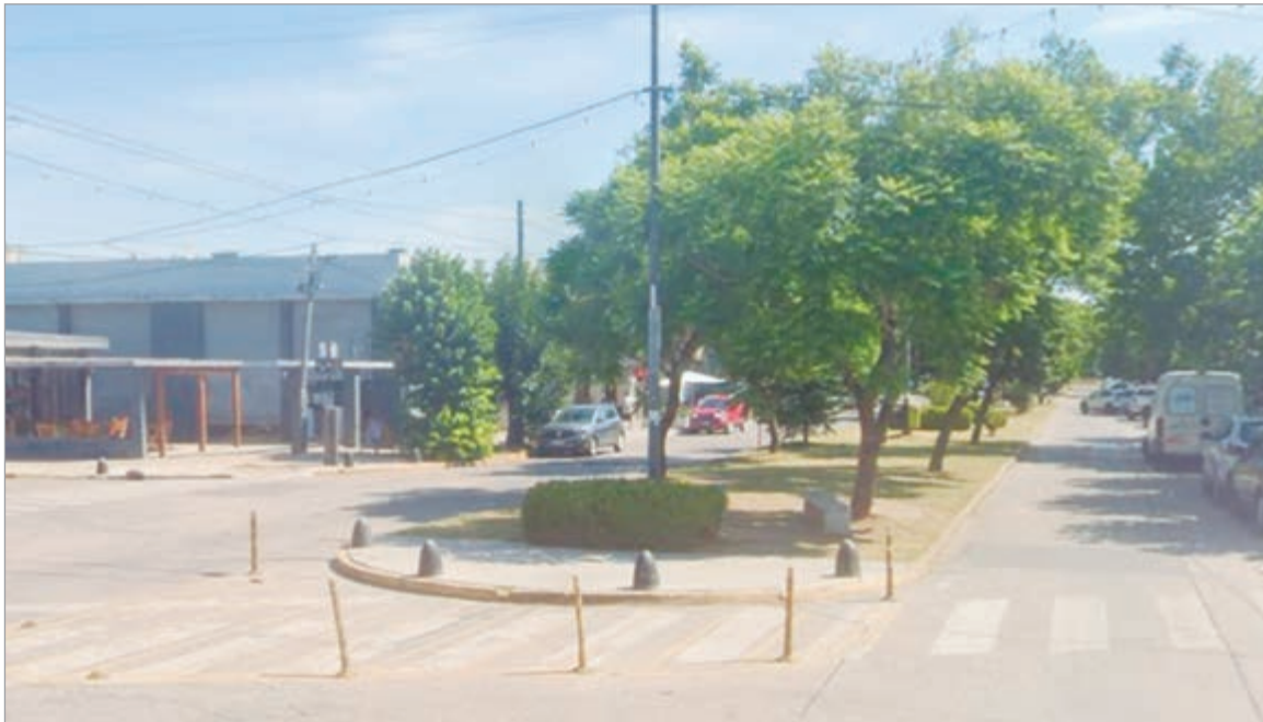
La zona del hecho

El episodio ocurrió en un local ubicado en la intersección de 419 y 5, donde los ladrones habrían ingresado durante la madrugada a través de una oficina situada en la parte trasera del comercio. Según relataron los propietarios, los intrusos aprovecharon ese sector menos visible para acceder sin ser detectados y moverse con tranquilidad dentro