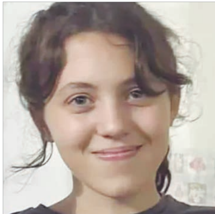
La adolescente tenía 14 años