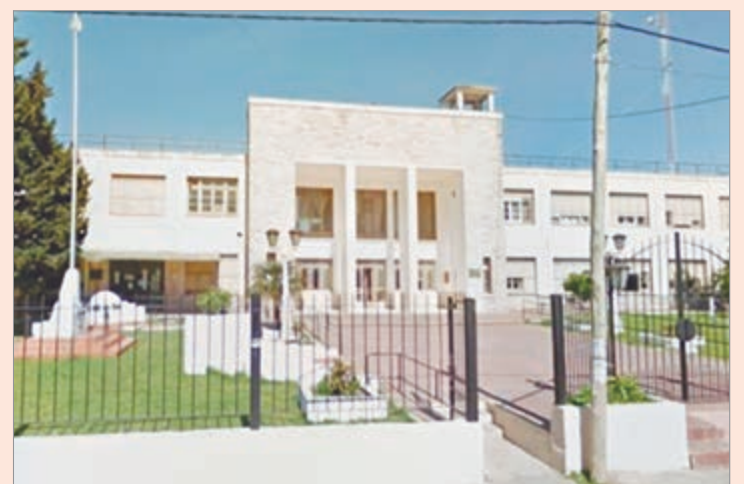
La mencionada cárcel

Mientras tanto, el detenido podría enfrentar sanciones disciplinarias por lo ocurrido, en un contexto que vuelve a poner en debate el funcionamiento del sistema penitenciario y las condiciones de encierro en la región.