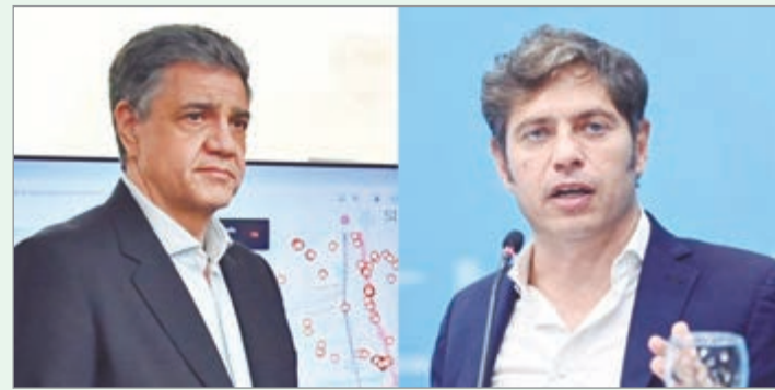
Jorge Macri decretó la "prioridad porteña" en los servicios públicos y reavivó la disputa con Provincia

La decisión abre un nuevo capítulo en la tensión entre ambas jurisdicciones, con la Provincia cuestionando la política de exclusión y la Ciudad defendiendo el derecho de sus contribuyentes a recibir prioridad en el acceso a los servicios públicos.