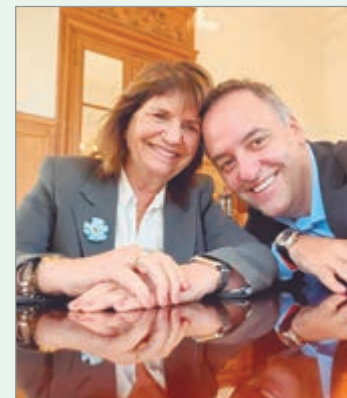
La senadora evitó defender al jefe de Gabinete y señaló que será la Justicia quien determine su situación.

idea de que el oficialismo no interfiere en procesos judiciales. El caso, que generó repercusiones políticas y mediáticas, se suma a un clima de tensión dentro del bloque libertario, donde las denuncias contra funcionarios han puesto en debate la transparencia y la necesidad de sostener la institucionalidad. La posición de Bullrich marca un límite claro y deja en evidencia que la resolución dependerá exclusivamente de la Justicia.