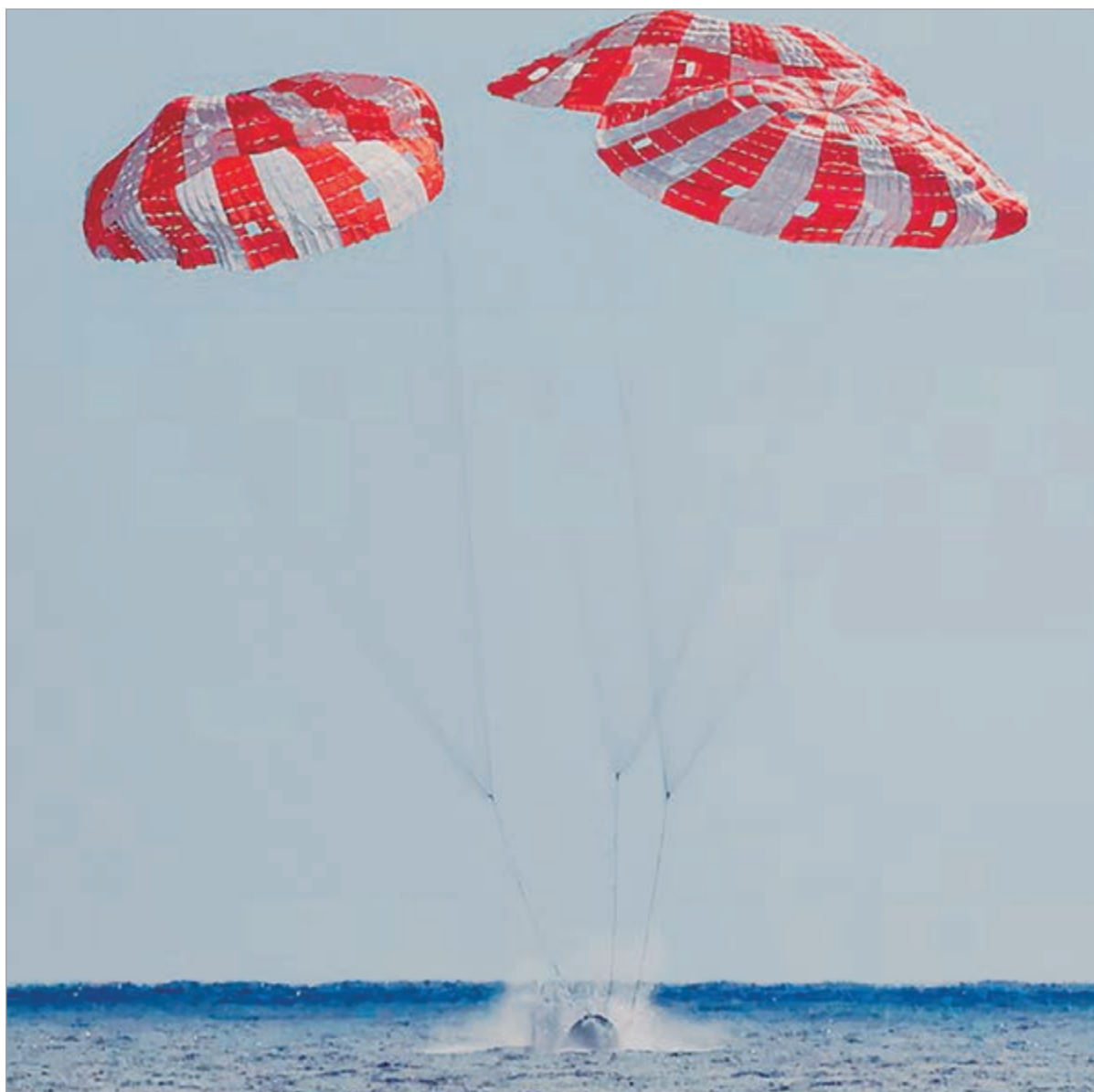
Los astronautas soportaron velocidades que superaron los 40.000 kilómetros por hora

La misión tripulada, que orbitó la Luna, amerizó ayer cerca de la costa de San Diego. La nave enfrentaba temperaturas de 2.760° C