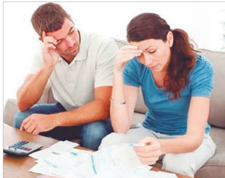
La mora de los hogares se cuadruplicó en un año y medio

El costo del financiamiento aparece como otro factor central detrás del aumento del endeudamiento, ya que, pese a que la tasa de referencia del sistema se mantiene en torno al 20%, las tasas de los préstamos personales rondan entre el 70 y el 100%, según 1816.