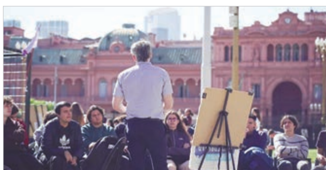
Investigadores, docentes y estudiantes reclamaron financiamiento y mejoras salariales en Plaza de Mayo