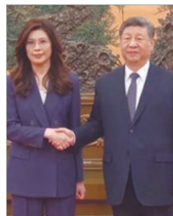
El encuentro con Cheng Li-wun refuerza la apuesta de China por el diálogo

En un movimiento cargado de simbolismo político, el presidente chino Xi Jinping mantuvo este viernes en Pekín una reunión con la líder del opositor Kuomintang (KMT), Cheng Li-wun, en un