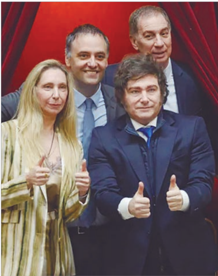
El malestar social y la incertidumbre económica golpean la gestión nacional

Este deterioro de las expectativas configura un clima de incertidumbre que impacta tanto en el plano económico como en el político, debilitando la base de apoyo del Gobierno.