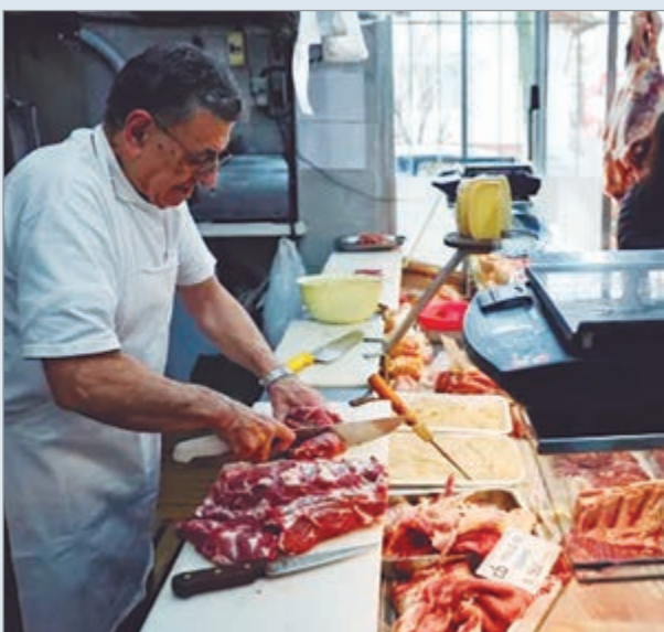
La picada común fue el corte que más aumentó

De acuerdo a un informe elaborado por el Instituto de Promoción de la Carne Vacuna (IPCVA), los precios de los distintos cortes de carne vacuna acumularon un aumento promedio en marzo del 10,6%. De esta manera, en los últimos 12 meses se registró una variación positiva del 68,6%, más del doble de la inflación registrada en el periodo (33,1% interanual en febrero).