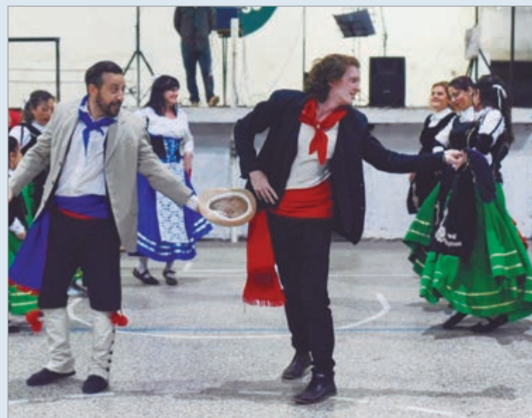
Habrán mañana una misa y tedeum en la parroquia Nuestra Señora de Caacupé y San Roque González

Fue este matrimonio quien impulsó el desarrollo en la zona, loteando y ofreciendo buenos y accesibles terrenos a inmigrantes, quienes tenían la posibilidad de pagarlo en mensualidades.