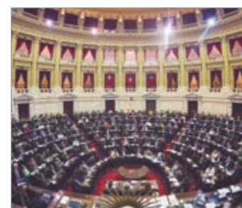
La iniciativa busca mitigar el impacto internacional en energía, alimentos e insumos productivos críticos.

El diputado de Unión por la Patria Máximo Kirchner, presentó un proyecto de ley que propone declarar la emergencia pública en materia energética, alimentaria y de insumos productivos críticos por el plazo de doce meses. La iniciativa apunta a amortiguar el efecto de la volatilidad internacional en los precios de petróleo, ali-