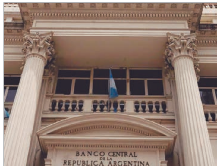
La entidad sumó más de 400 millones esta semana ya superó la mitad de la meta anual de reservas

La continuidad de las compras diarias, que ya suman 65 jornadas consecutivas, refuerza la estrategia de acumulación de reservas y sostiene la paz cambiaria en un contexto de alta expectativa sobre la política económica. Ahora, el desafío del Gobierno será mantener el ritmo en los próximos meses.