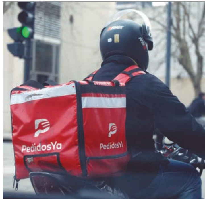
La Justicia confirmó las sanciones impuestas por Provincia

Durante ese expediente, la empresa negó vínculos laborales con ocho personas relevadas en inspecciones. La Corte desestimó ese planteo al considerar que no se trataba de una omisión, sino de una diferencia con la valoración judicial.