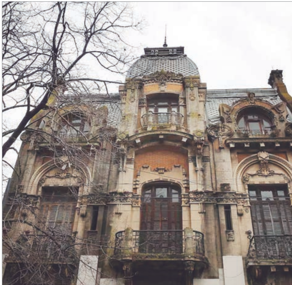
El Palacio Gibert fue proyectado y construido entre 1910 y 1914

Está ubicado en diagonal 80, entre 3 y 45, y forma parte de la "Ruta Argentina del Art Nouveau", reconocido como el emblema más conservado de ese estilo en la ciudad