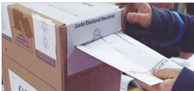
El oficialismo sostiene que las PASO representan un gasto excesivo para el Estado

El Gobierno impulsa eliminar primarias y cambiar el financiamiento de los partidos. La oposición advierte un retroceso democrático y mayor desigualdad electoral