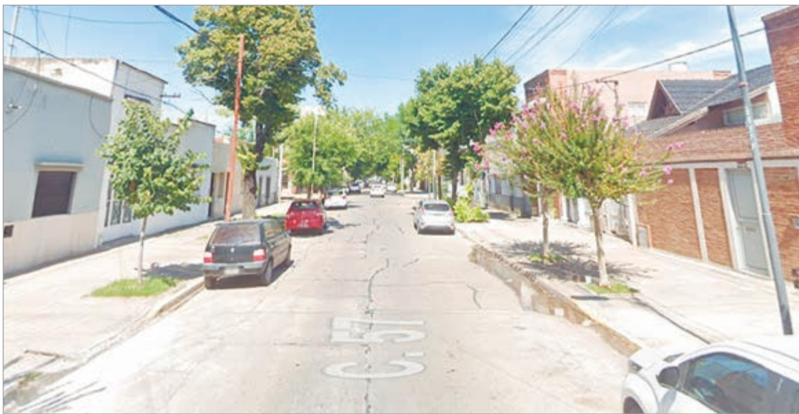
La zona del hecho

Delincuentes irrumpieron en una vivienda a pocas cuadras de Plaza Malvinas y les robaron los ahorros a las víctimas