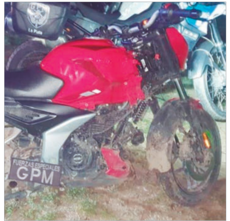
La moto robada

En este sentido, por el momento, el joven solamente fue notificado de la situación hasta tanto se compruebe o rechace su participación en el posible hurto del rodado.