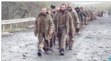
Moscú concretó un canje con Ucrania mediado por Emiratos Árabes Unidos

El Ministerio de Defensa ruso confirmó que el canje fue posible gracias a la media-