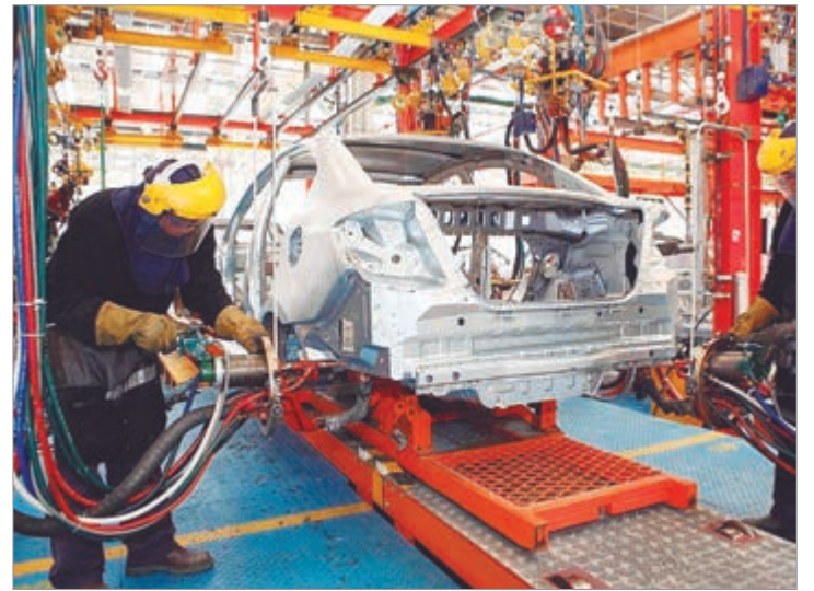
El sector automotriz apunta contra las importaciones

En ese sentido, sostuvo que hay una bifurcación entre el camino que toman países como Brasil o México, que sí aplican algunas restricciones a los productos chinos, y señaló una "contradicción grande entre el alineamiento político con EE. UU. y las políticas comerciales de nuestro país".