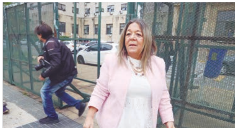
El Colegio de Escribanos porteño contradice a Nechevenko

Tato diferenció ese mecanismo del reporte de operación sospechosa (ROS), que se aplica cuando existen dudas sobre el origen de los fondos. Si la operación se concreta y persisten