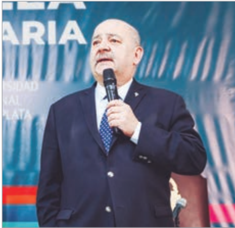
El arquitecto y actual vicepresidente académico iniciará su tercer mandato

Se desempeñará al frente de la casa de estudios durante el período 2026 - 2030. El arquitecto iniciará su tercer mandato tras una jornada marcada por el consenso entre los 270 votantes