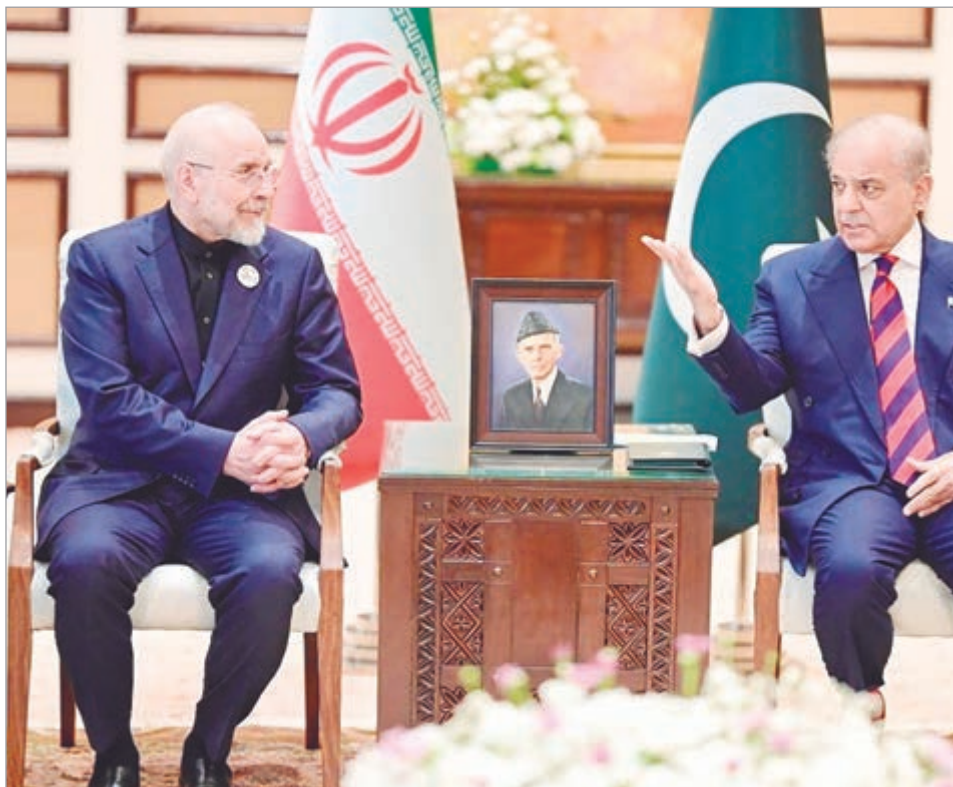
Delegaciones de Irán y Estados Unidos continúan reunidos en Islamabad

Entre los puntos centrales aparece el control del estrecho de Ormuz, una vía estratégica