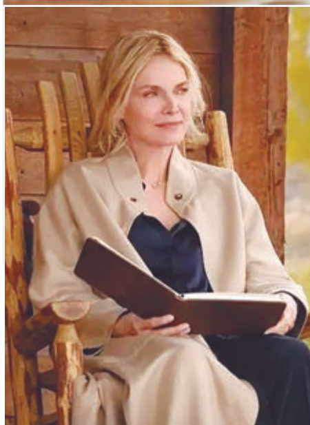
La actriz en la serie

fue cómo mantener mantenerme a flote, de la supervivencia personal, para poder hacerlo cada día durante tres meses. Y siempre era un gran alivio cuando podía hacer algo desde Nueva York, y para todos, en realidad, la gente estaba tan contenta de ver esta otra faceta, porque primero hicimos todo lo de Montana. Así que sí, creo que eso fue realmente lo más difícil.