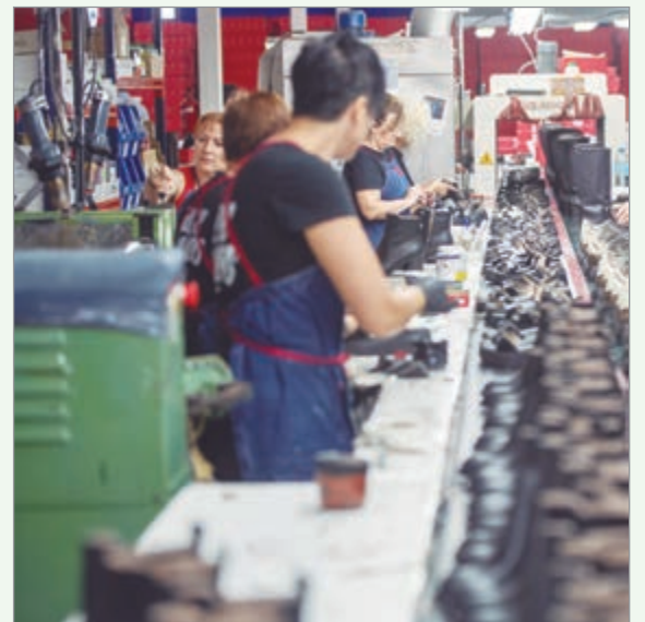
Las importaciones chinas golpean la industria nacional

En los últimos meses se multiplicó la cantidad de empresas que cesó la fabricación para comenzar a traer de Asia. Una de ellas fue la histórica y principal fábrica de vidrio Rigolleau, que tiene su planta en Berazategui, provincia de Buenos Aires, que redujo parte de su producción local, avanzó con despidos en los últimos tiempos y empezará a importar vajilla.