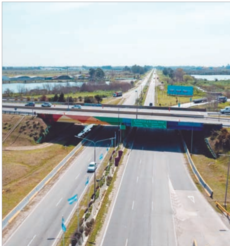
Nuevo capítulo en la disputa por el control de las rutas

La firma estatal bonaerense denunció irregularidades en el dictamen de precalificación que recomienda desestimar su oferta en la Red Federal de Concesiones – Etapa II. Además, sostuvo que la decisión de la administración libertaria se basa en criterios que no respetan las