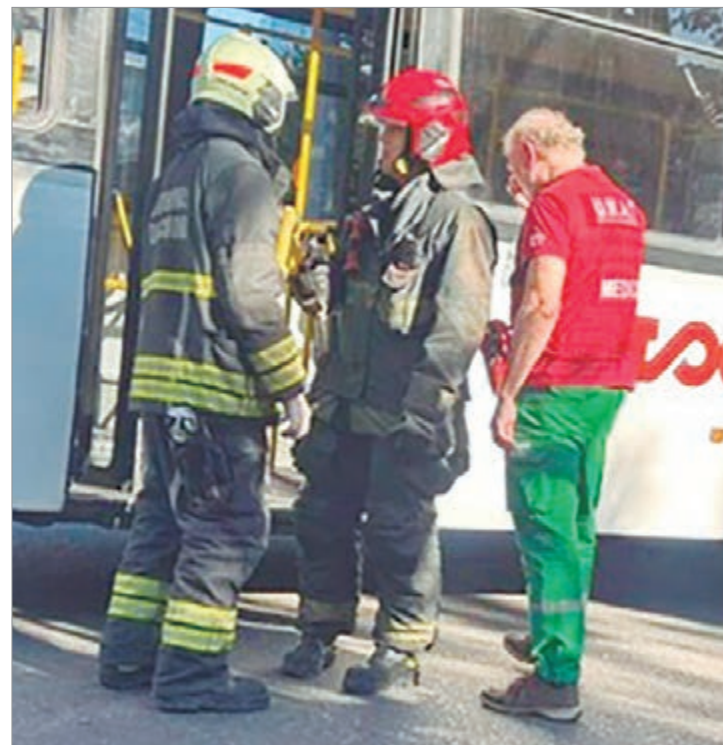
Personal del SAME en el lugar

El personal de salud debió auscultar al conductor durante el operativo ya que el hombre presentaba una crisis nerviosa a raíz de la situación, aunque no requirió el traslado hacia un centro asistencial.