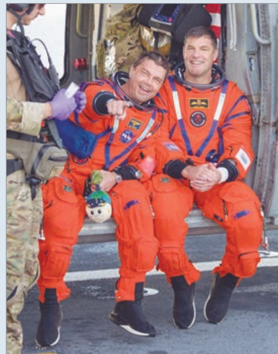
Tras el amerizaje de la cápsula Orión, la NASA trabaja en los próximos pasos

Sobre eso, expresaron que ya hay especialistas en el área trabajando en el buque de recuperación para analizar su estado. Asimismo, revelaron que se detectó una fuga en el sistema de control de presión de la nave, que ya está siendo investigada.