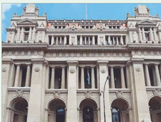
La Justicia desplazó el debate hacia el fuero Contencioso Administrativo Federal