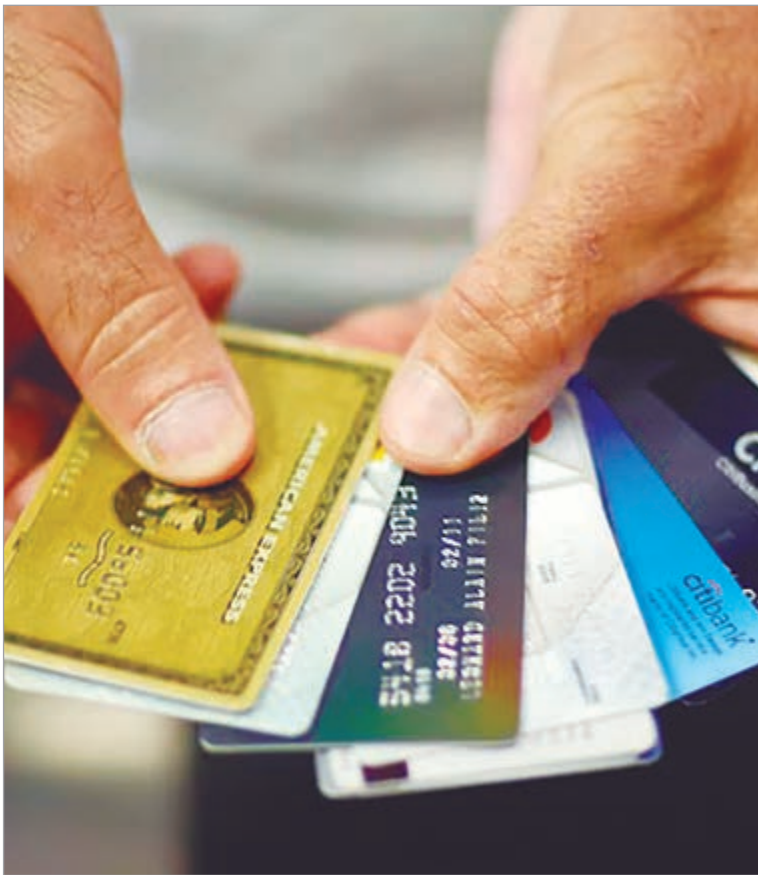
El mercado alerta por la caída del consumo generalizada

Por otra parte, el saldo financiado en dólares por el mismo medio disminuyó un 15,2% mensual. El saldo se ubicó en 684 millones de dólares para el total acumulado, y presentó un incremento interanual del 9,8%, con-