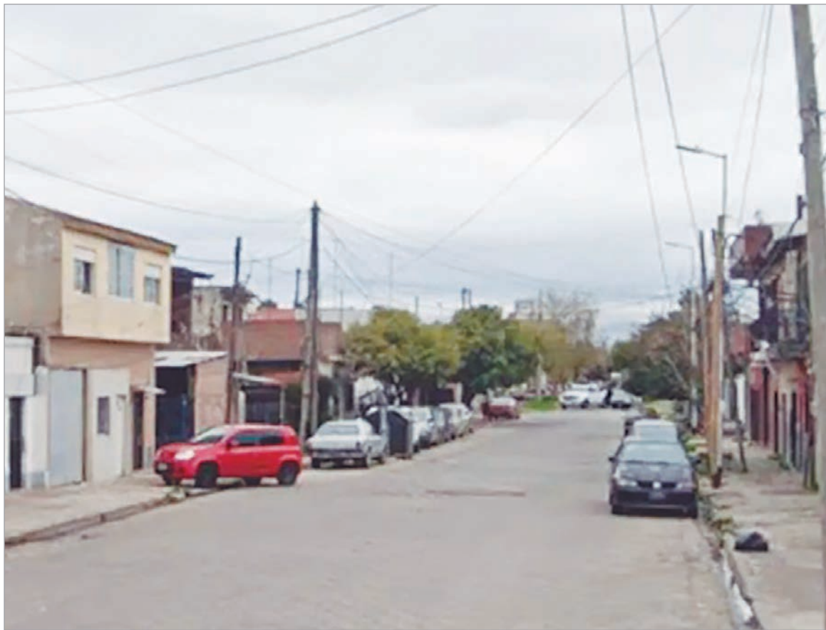
La zona del hecho

El conflicto vecinal ocurrió días atrás, pero agonizó hasta que en las últimas horas se conoció su deceso a raíz de las graves heridas sufridas