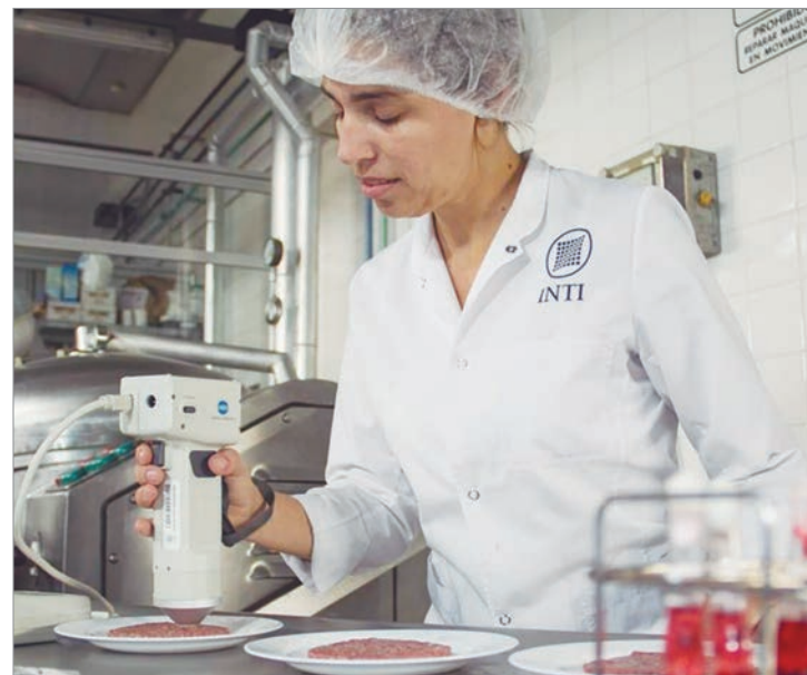
Alertan por una peligrosa medida del Gobierno

En este camino precisó: "No se pagan viáticos, lo que impide a los equipos técnicos realizar visitas a empresas, una instancia central para la prestación y desarrollo de servicios. En paralelo se paraliza la vinculación institucional. No se promueven nuevos convenios y los existentes se suspenden, se dejan caer o directamente se anulan".