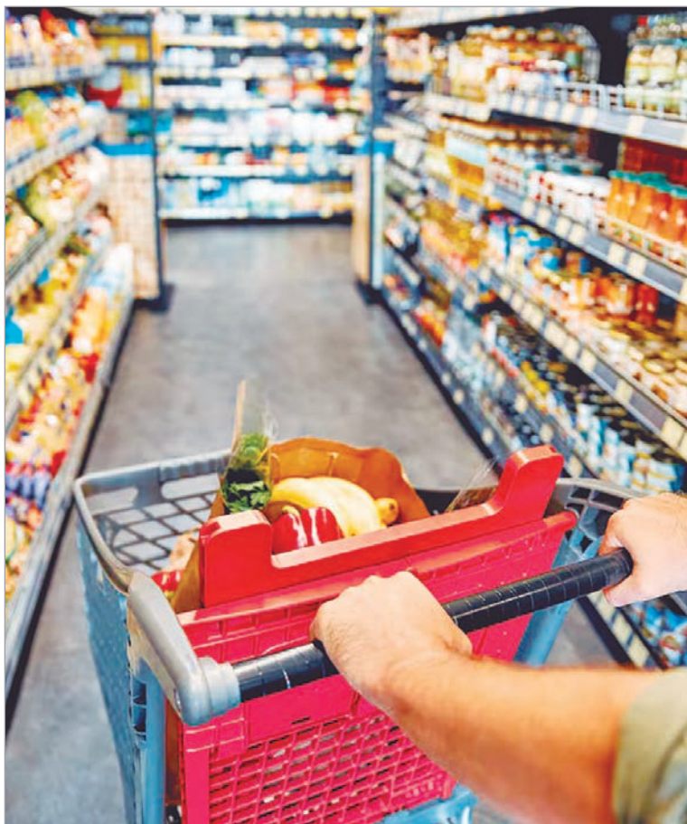
La inflación de marzo fue la más alta del último año

Milei reaccionó en X donde aseguró que "el dato es malo" y "no nos gusta", pero "hay elementos duros que nos permiten explicar lo que ha pasado".