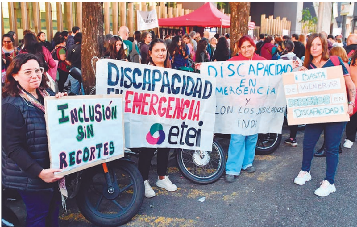
El Gobierno sigue sin aplicar en plenitud la Emergencia en Discapacidad

Las instituciones de apoyo marcharon para advertir que la obra social del Estado dejó de pagarles, en algunos casos, desde octubre del año pasado