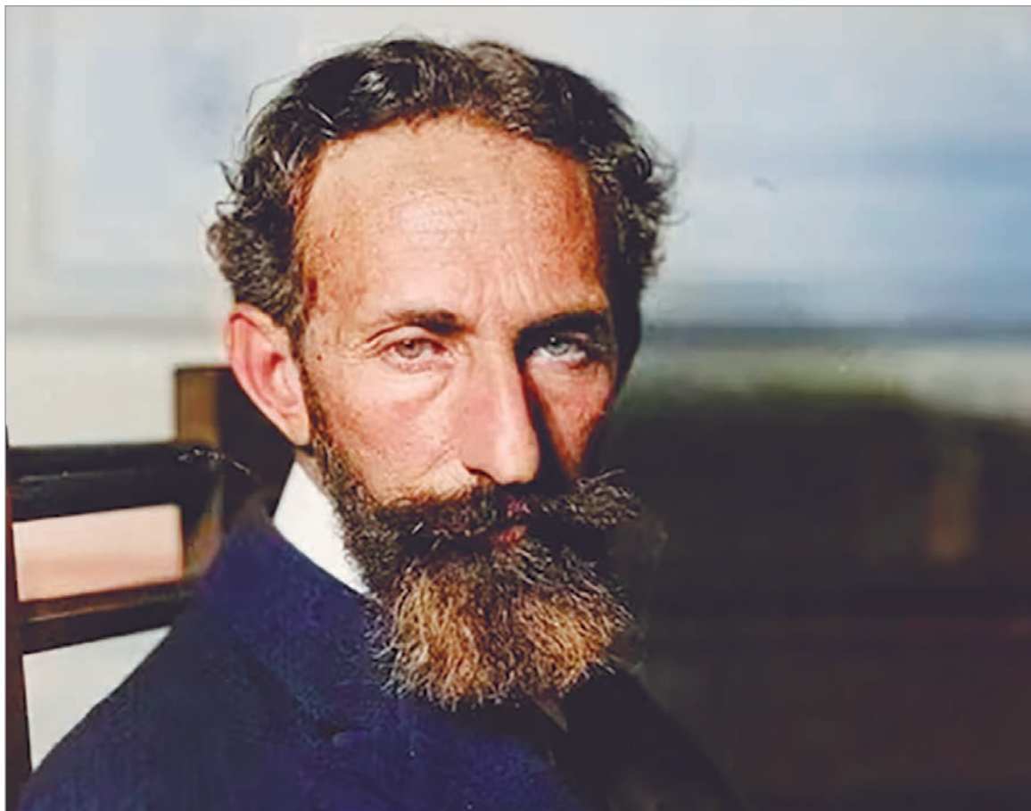
Horacio Quiroga, el maestro del cuento latinoamericano

Desde su primer viaje a las Cataratas del Iguazú, con Leopoldo Lugones —al que había acompañado como fotógrafo, en 1903, se sintió un habitante de la selva. Se instaló espiritualmente en ese mundo de lianas,