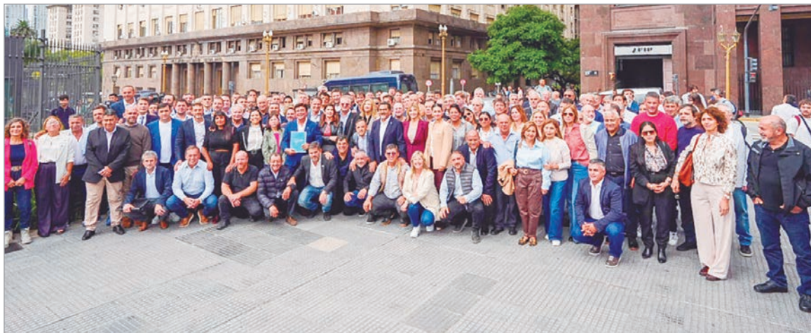
El reclamo incluyó un documento conjunto y críticas al rumbo económico nacional

Más de 150 jefes comunales y ministros bonaerenses exigieron al Gobierno nacional retrotraer combustibles, reactivar obras y frenar el ajuste fiscal