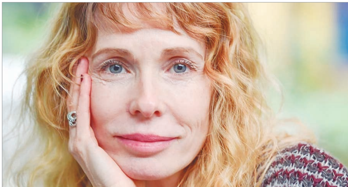
Estuvo en Mar del Plata con Sex en el verano