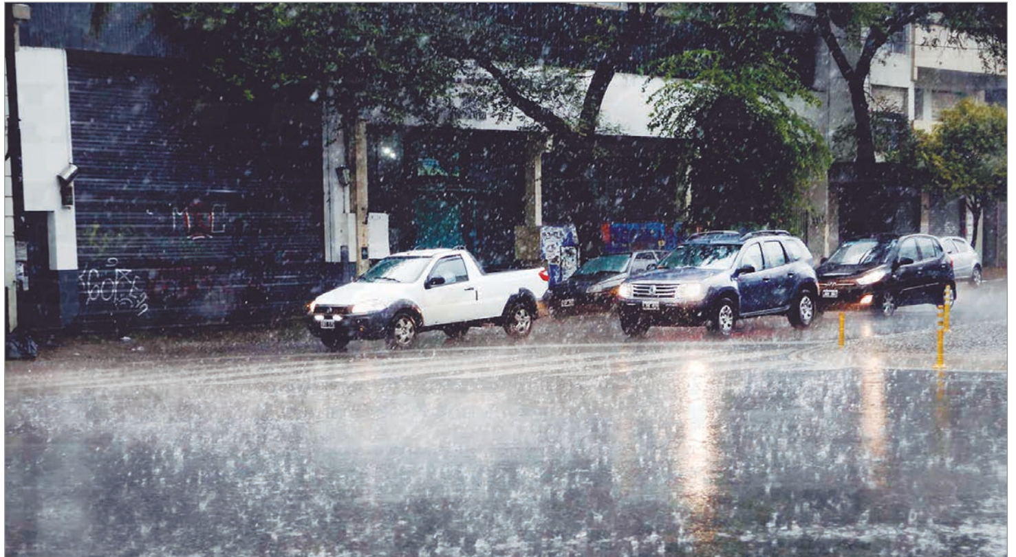
Durará varios días

De acuerdo con los mapas de simulación, el fenómeno se desarrollará con una evolución clara en cuatro etapas. En las primeras horas, el sistema comenzará a organizarse en el norte argentino, donde se generarán condiciones de inestabilidad que darán lugar a lluvias y tormentas. Con el correr de las horas, la baja presión se intensificará y avanzará hacia el centro del país. En ese trayecto, el sistema irá tomando mayor estructura, alimentado por el contraste de masas de aire cálido y húmedo con aire más frío en niveles medios y altos de la atmósfera. Los mapas muestran que, en su fase más activa, el sistema afectará principalmente a provincias del Litoral, el centro del país y sectores del norte bonaerense. En estas regiones se espera la mayor concentración de lluvias, con acumulados que podrían superar