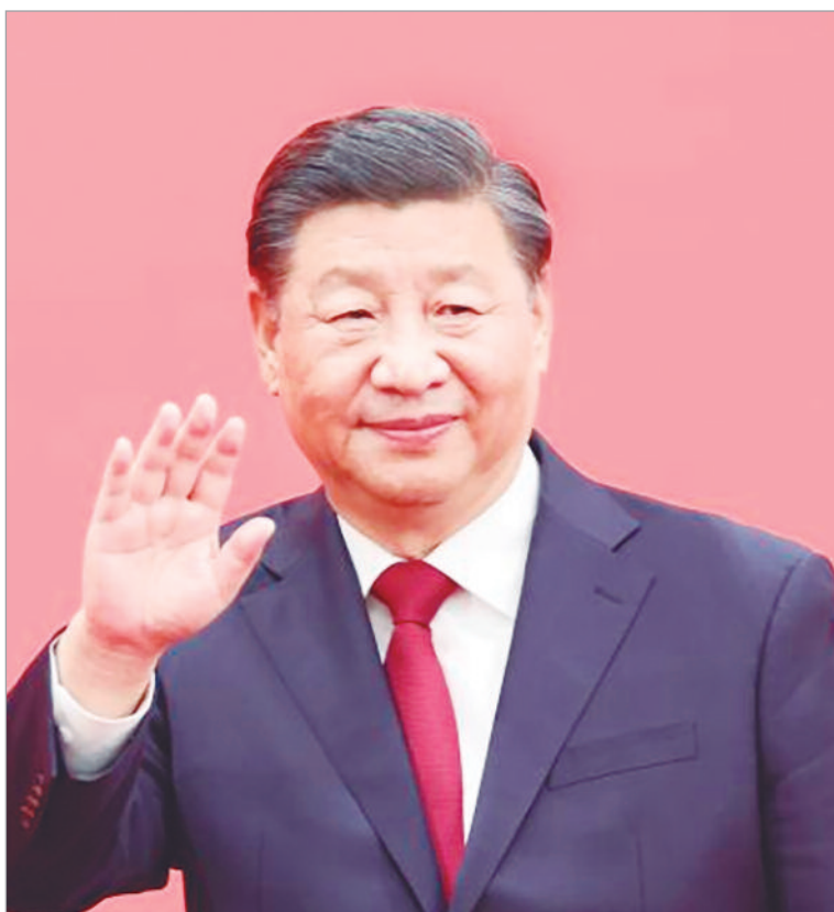
Dura advertencia desde China

Beijing calificó la medida como “peligrosa e irresponsable” y advirtió sobre el riesgo de quebrar el frágil alto el fuego. Teherán denunció un “acto de piratería” y reafirmó su capacidad para responder ante cualquier amenaza en la región