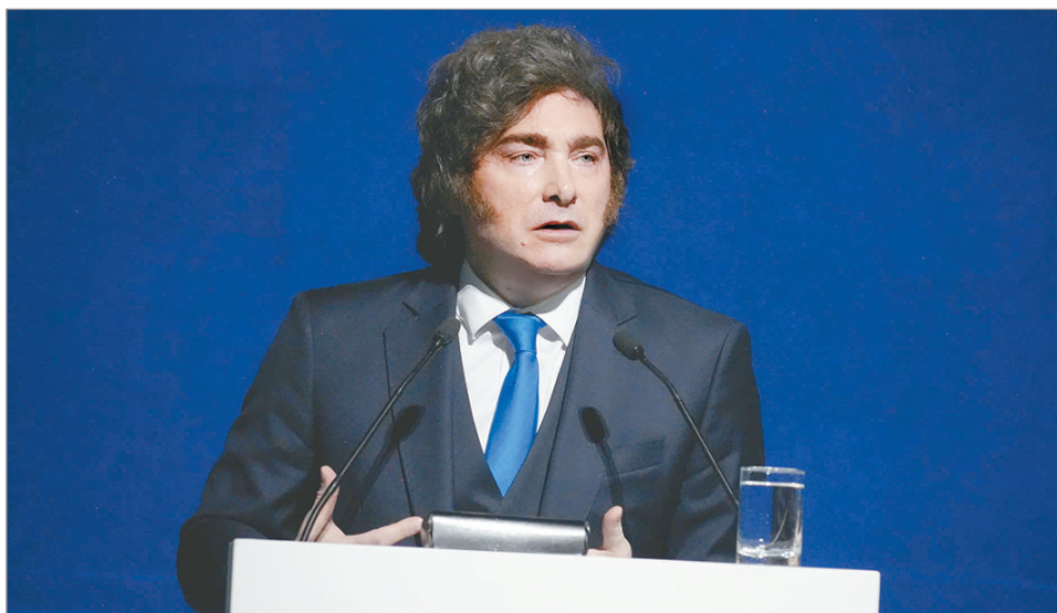
El mandatario cerró la cumbre empresarial con un discurso cargado de explicaciones.

Sin embargo, más allá de las frases, el dis-