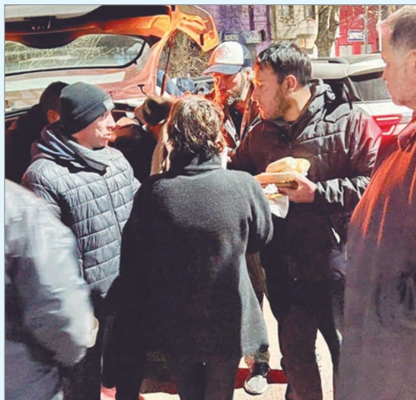
Será este viernes

Llega a la región la 13ª Edición de la Caravana Solidaria Nocturna. El próximo viernes se hará nuevamente este evento que convoca a toda la ciudad con un fin benéfico. En esta ocasión, se hará bajo el slogan "hoy más que nunca necesitamos de tu corazón".