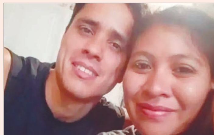
La madre y el padrastro