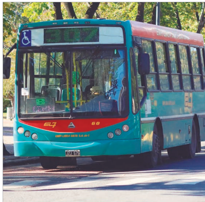
La Secretaría de Transporte anunció una transferencia complementaria a empresas del AMBA para normalizar frecuencias

Las cámaras empresarias remarcaron que el sector no fija el precio de su actividad y reclamaron una tarifa de equilibrio que reconozca los costos reales. En ese sentido, cuestionaron el esquema de subsidios calculado sobre un litro de combustible de $1.750, frente a valores que superan los $2.100. El diálogo se formalizó en mesas técnicas de trabajo que se reunirán nuevamente en 15 días para dar seguimiento a los compromisos asumidos.