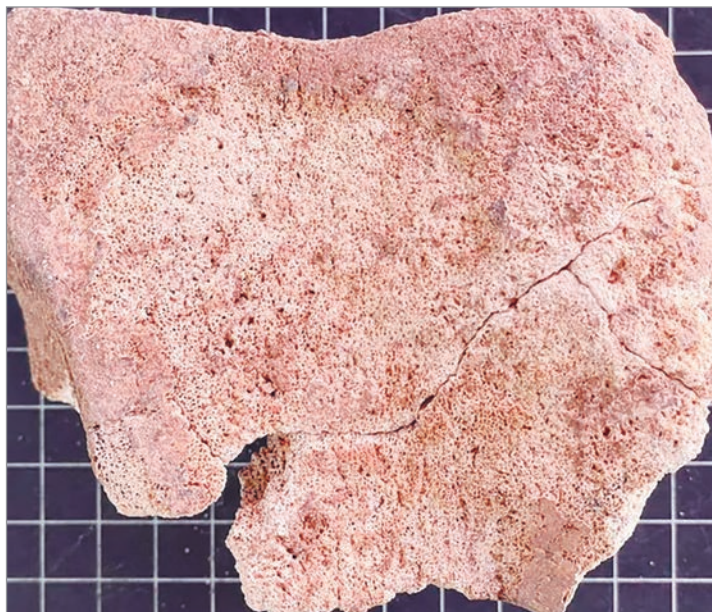
Hueso de elefante muerto entre finales del siglo III y I a.C.

El misterio rodea la aparición de un hueso de elefante muerto entre finales del siglo III y I a.C. en las excavaciones de un bunker que se realizó en el año 2019 para alojar tres equipos de alta tecnología médica para uso del hospital Reina Sofía de Córdoba en la Colina de los Quemados. El descubrimiento ha reavivado el debate sobre la presencia de estos animales en los enfrentamientos bélicos dirigidos por Aníbal en la península Ibérica recoge el estudio The elephant in the oppidum . Preliminary analysis of a carpal bone from a Punic context at the archaeological site of Colina de los Quemados. La pieza ósea identificada corresponde a un periodo anterior a la conquista romana, lo que aporta indicios materiales para interpretar el alcance real del ejército cartaginés en la región.