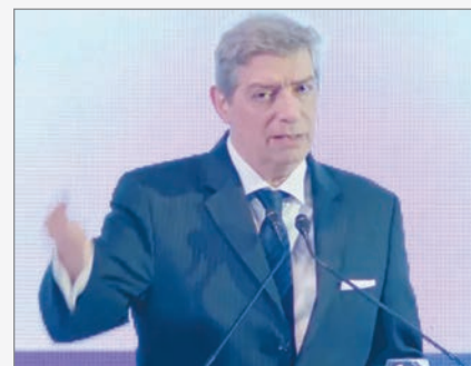
El juez destacó la seguridad jurídica como condición esencial para inversiones y desarrollo institucional.

Rosatti señaló que la seguridad jurídica debe ser igual para todos y que sin reglas claras no hay previsibilidad para quienes invierten ni para quienes reciben inversiones. En esa línea, el magistrado remarcó que las decisiones de la Corte deben ser respetadas por los tribunales inferiores para garantizar estabilidad institucional y confianza económica.