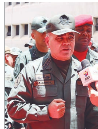
El exjefe militar asume una nueva función clave en la estrategia económica del gobierno venezolano

La presidenta interina de Venezuela, Delcy Rodríguez, designó al general Vladimir Padrino López como nuevo ministro de Agricul-