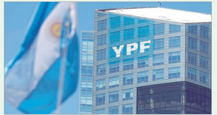
Se consolida el fallo a favor de Argentina

Por tratarse de un litigio centrado en la interpretación del derecho argentino, los especialistas consideran bajas las posibilidades de que prospere. Por esos las acciones de Burford se desplomaron 40% en Wall Street y 46% en Londres.