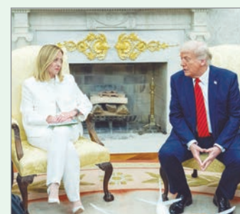
La primera ministra calificó de “inaceptables” las críticas del mandatario estadounidense contra León XIV

La polémica se produce en un contexto complejo para Meloni, cuya cercanía con Trump comienza a tener costos políticos internos. La reciente derrota en el referéndum judicial y la caída en la imagen del líder estadounidense en Italia alimentan las tensiones dentro del oficialismo.