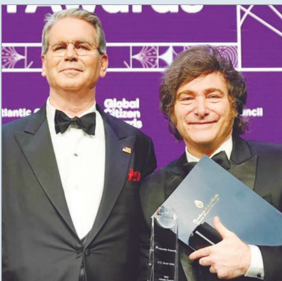
El secretario del Tesoro de EE. UU. respaldó a Milei

El secretario del Tesoro de Estados Unidos, Scott Bessent, volvió a respaldar a Javier Milei y las medidas que implementó en su gobierno. En este sentido, afirmó que Argentina "ha tenido un éxito fantástico".