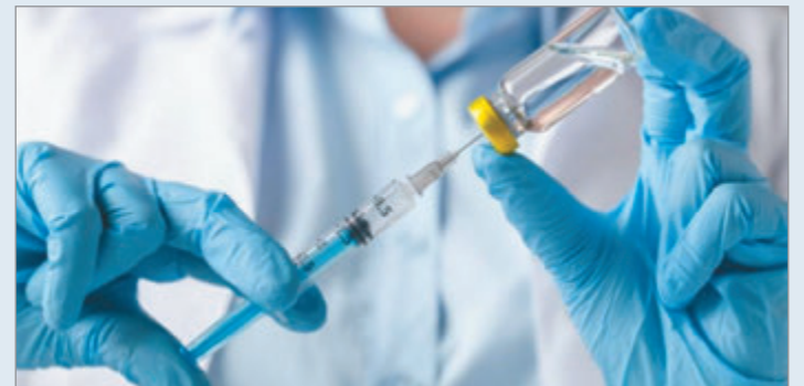
Nación y la OPS aseguraron la entrega de vacunas

Asimismo, ambas entidades indicaron que se transparentarán los procesos de compra iniciados a través de los Fondos Rotatorios de la OPS. Esta medida incluirá instancias de intercambio técnico para informar sobre los tiempos, etapas e hitos operativos involucrados en la adquisición y distribución de las vacunas.