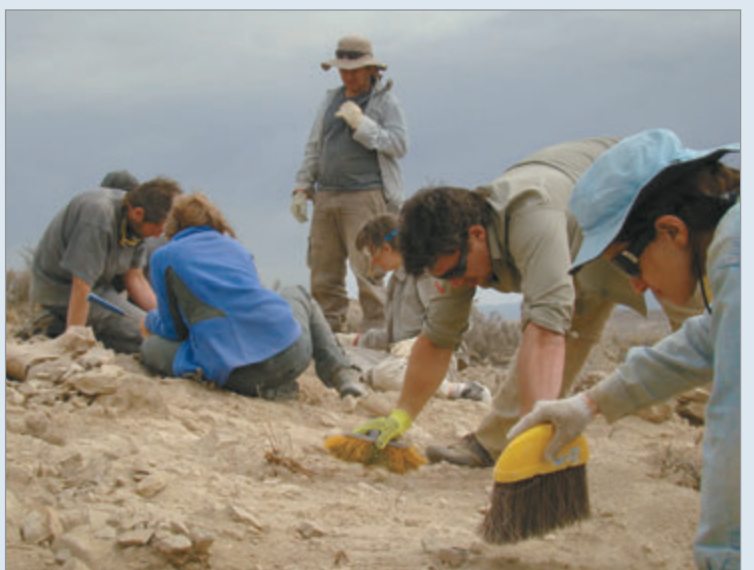
Los huesos encontrados tienen una datación estimada de 160 millones de años

los especialistas estiman que se trataba de un animal adulto de gran porte.