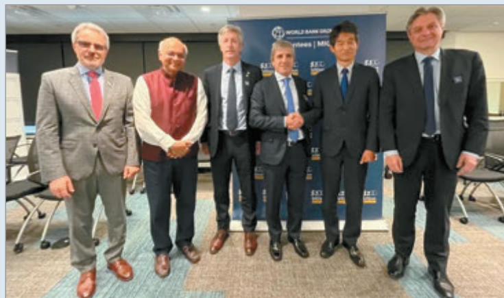
Caputo cerró apoyos en Washington y el FMI aprobó revisión con desembolso de u$s1.000 millones

En paralelo, el Banco Mundial anunció que trabaja en una garantía de hasta dos mil millones de dólares para mejorar las condiciones de inversión privada. El Banco Interamericano de Desarrollo, en tanto, proyecta un respaldo de 550 millones