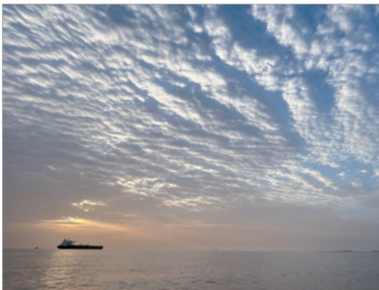
Incidentes con buques profundizan la incertidumbre en una ruta clave para el comercio energético global

Teherán restableció el control total del estrecho menos de 24 horas después de su reapertura y condicionó el tránsito marítimo al fin del bloqueo estadounidense