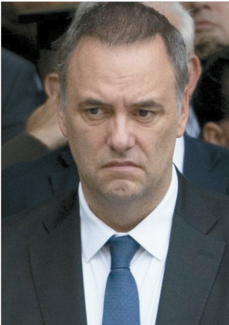
Adorni cada vez más complicado

Según trascendidos periodísticos, el jefe de Gabinete presentará en su declaración jurada de 2025 una herencia. No obstante, no es suficiente para explicar sus gastos