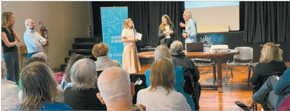
El objetivo es informar y concientizar a los vecinos de La Plata sobre estafas

El programa se desarrolla en escuelas, instituciones educativas y de adultos mayores, colonias, clubes y centros integradores, de fomento y de jubilados