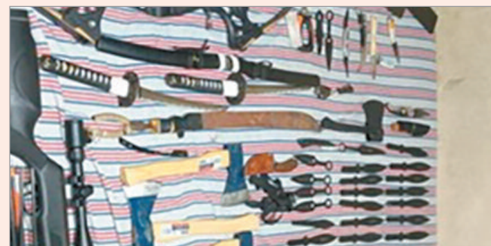
El arsenal secuestrado

Finalmente, el fiscal dispuso el secuestro de todo el material, imputó al acusado por el delito de amenazas y se ordenaron medidas de protección para las víctimas, entre ellas la entrega de un botón antipánico.