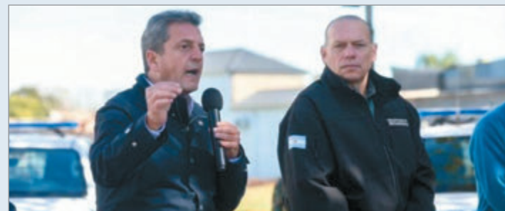
"Es el más preparado"

En tanto, el actual senador provincial también destacó la familiaridad de Massa con el funcionamiento estatal y la realidad bonaerense, y ponderó su recorrido político.