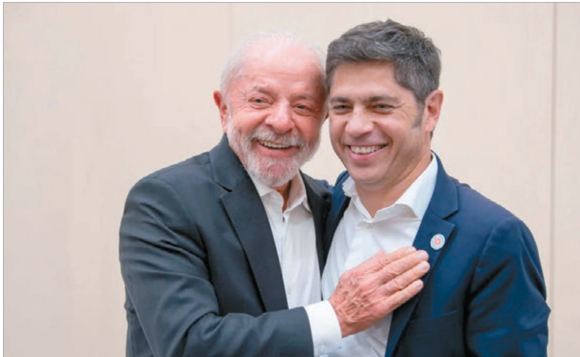
Kicillof agradeció a Lula por "mantener la esperanza encendida"

También mantuvo encuentro con la diputada italiana Elly Schlein y el expresidente español José Luis Rodríguez Zapatero. Además, disertó en la Movilización Global Progresista