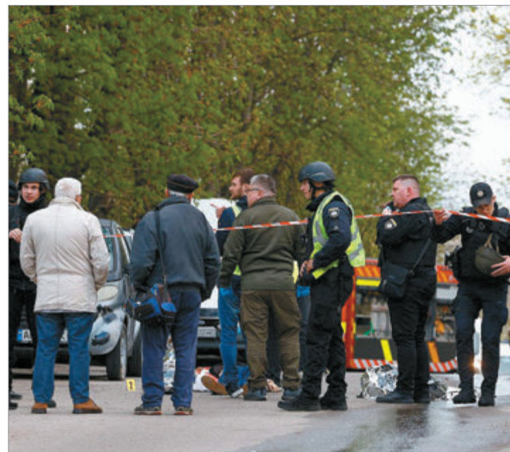
Investigan las circunstancias del hecho ocurrido en el distrito de Holoșiiv

El incidente se suma a otros episodios recientes de violencia en el país, en medio de un escenario de alta tensión y desgaste social producto del conflicto armado en curso.