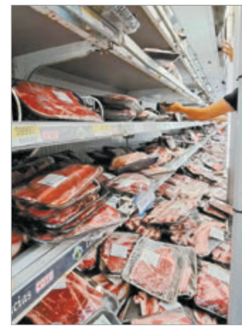
La carne sigue subiendo de precio

En las últimas cuatro semanas, el incremento acumulado alcanza el 1,7%, mientras que la proyección mensual para el rubro alimentos se ubica entre el 1,7% y el 1,8%. En tanto, la inflación general de abril se perfila en torno al 2,3%.