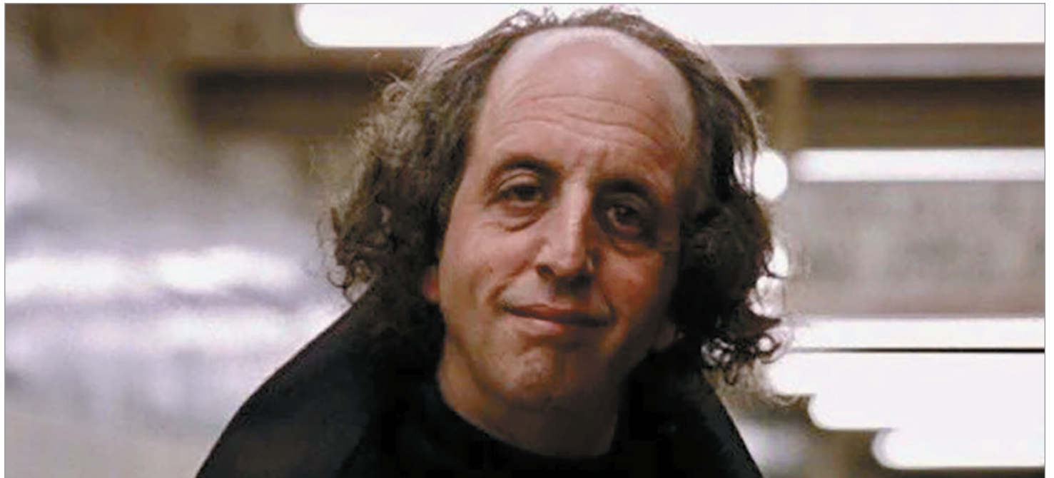
Su físico extraordinario y peculiar lo condenaron a una carrera de actor secundario

Dice que ha estado en la estación de trenes "desde que me empujaron", y se enoja cuando Sam piensa que se suicidó. Fumador, con un