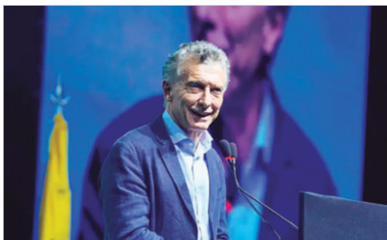
Macri llamó a romper el silencio sobre la situación real de país

falta, ese espacio lo ocupa el populismo para vendernos ese veneno”. Al mismo tiempo, agregó: “No le