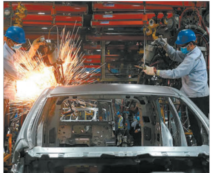
El uso de la maquinaria mostró retrocesos frente al mismo mes de 2025

El panorama general confirma que la industria atraviesa una etapa de menor utilización de su potencial, con los sectores de fuerte peso en ocupación como principales afectados.