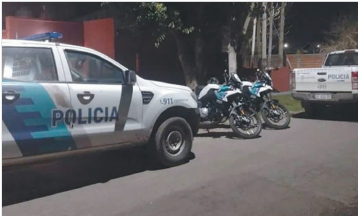
Buscan al sospechoso

La víctima tenía 32 años y según estiman los investigadores, el ataque fue durante una riña, descartando que haya sido en un asalto