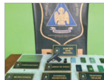
Le incautaron un arma y objetos electrónicos

El fiscal una orden de allanamiento en la vivienda del adolescente y en el procedimiento secuestraron celulares, una pistola de gas comprimido marca Fox calibre 4,5 - réplica calibre 9 milímetros-, una notebook y una munición calibre 9 milímetros de fabricación nacional.