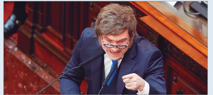
Las organizaciones denuncian hostigamiento a la prensa y recortes que vulneran derechos.

En paralelo, Amnistía Internacional endureció sus críticas contra Milei y llamó a frenar el avance de gobiernos "antiderechos" en Argentina. La organización denunció que el gasto público cayó más de 41% en términos reales entre 2023 y 2025, mientras crecieron los fondos para seguridad e inteligencia. "Mientras se recortan políticas esenciales para combatir la pobreza, la desigualdad y la violencia de género, se fortalecen los presupuestos destinados a controlar y reprimir", advirtió la organización.