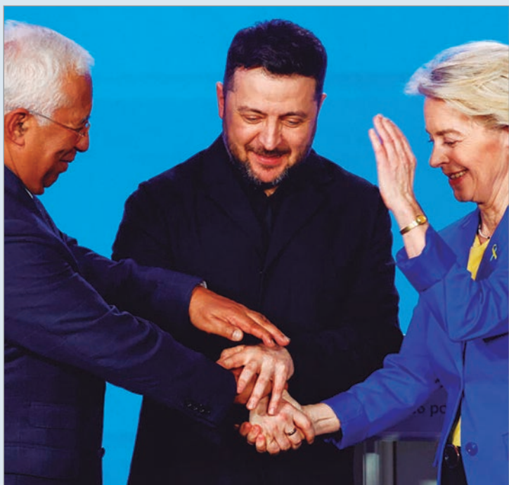
Es por 90 mil millones de euros

La Unión Europea aprobó en el día de ayer el préstamo a Ucrania por 90.000 millones de euros, después de que el presidente húngaro, Viktor Orbán, levantara el veto tras ser derrotado en las urnas en los últimos días. El capital, destinado para la defensa del país invadido por Rusia en los próximos dos años, saldrá de una deuda común, a la espera de lo que ocurra con los fondos de Moscú congelados, que suman 210.000 millones de euros. Las decisiones adoptadas por los embajadores de los 27 países miembro ante la Unión Europea aún tienen que ser confirmadas por procedimiento escrito, que debería quedar concluido esta jornada.