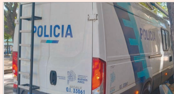
La Policía Científica trabajó en el lugar

tencia médica, de acuerdo a los portavoces policiales consultados. Una vecina fue quien lo vio y llamó al 911, y cuando llegaron los primeros oficiales detectaron la veracidad de la denuncia, y también que el auto del infortunado aún estaba en marcha. La principal hipótesis indica que se trató de una muerte natural.