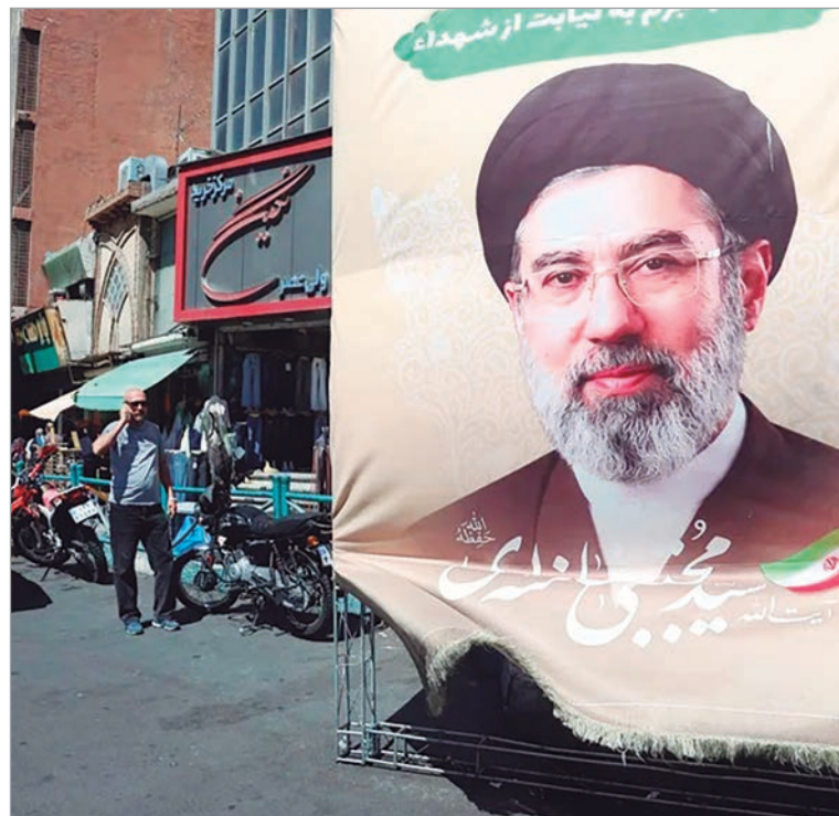
Irán dijo que sus acciones han sido en "legítima defensa"

Así, el diplomático afirmó que actuaremos "cuando lleguemos a la conclusión de que existen las condiciones necesarias y razonables", pero no explicó cuáles son esas condiciones. Sí subrayó que en cualquier caso las negociaciones buscarán "materializar los intereses nacionales y consolidar los logros del pueblo iraní al frustrar los objetivos maliciosos de sus enemigos". Acerca de la extensión del alto el fuego indefinido que anunció ayer el presidente estadouni-