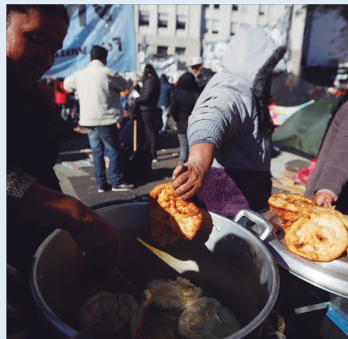
Presionan a Kicillof ante el ajuste de Milei

Pese a ello, si bien Ishii centró sus críticas al gobierno de Milei por la pérdida del poder adquisitivo, la inflación en alimentos y el endeudamiento de los hogares, el legislador también deslizó cuestionamientos a la gestión bonaerense. "La emergencia constituye una respuesta institucional urgente frente a un contexto de agravamiento del hambre y la desigualdad", afirmó.