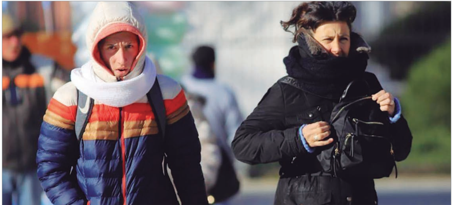
Habrá un fuerte descenso de la temperatura en la ciudad

Hasta mañana seguirá el aire templado y húmedo, pero desde el domingo empezará a notarse el ingreso polar. Para el lunes ya se esperan mínimas cercanas a los 7°C en el Gran La Plata, con una tendencia a seguir bajando durante la semana. Además, podrían registrarse las primeras heladas del año en