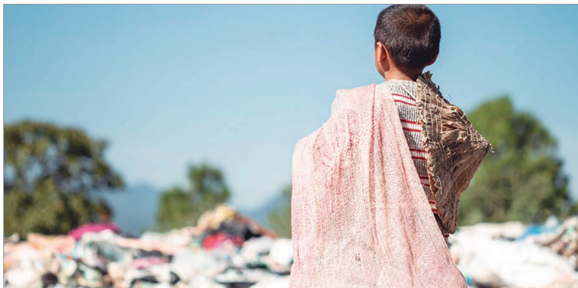
El 53,6% de los menores en Argentina vive en la pobreza

Para la investigadora del ODSA, Ianina Tuñón, las políticas de asistencia estatal “no fueron diseñadas para cubrir por completo los ingresos de los hogares, sino para equiparar el salario familiar de un trabajador formal con el de uno informal”. “Por eso, es clave mejorar las condiciones laborales de los adultos”, aseguró en la presentación