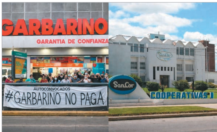
El colapso de dos firmas históricas revela la profundidad de la crisis

nuidad acotada en aquellos establecimientos que aún mantienen contratos vigentes, aunque será transitoria. Los salarios generados durante esta etapa tendrán prioridad de pago, pero la incertidumbre domina entre los trabajadores que acumulan meses de haberes impagos.