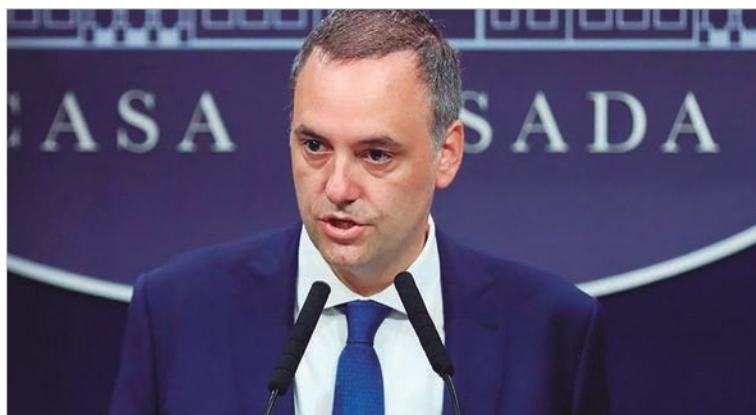
La Justicia sospecha que Adorni compró meno

Otro de los elementos que analiza la Justicia es la intervención inicial del