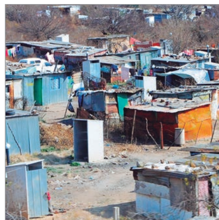
Buscan diagnosticar los problemas de los barrios platenses

Universidades de La Plata realizarán un relevamiento integral de los barrios populares de La Plata para saber cómo viven. Del trabajo surgirá una base de datos y un profundo análisis que podrá ser insumo para que