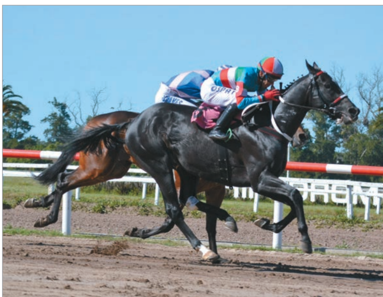
Es nuestro candidato. Glorioso Rim cuenta con un excelente presente y esta tarde va a la búsqueda de la victoria en la carrera central

Hándicap reservado para todo caballo de 4 años y más edad, ganador de tres o más carreras, ocupa el sexto turno de programación, con un inte-