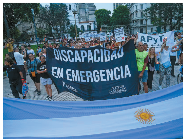
Instituciones y familias marcharon en todo el país para exigir cumplimiento de la ley y rechazar recortes

La convocatoria fue organizada por el Foro Permanente para la Promoción y Defensa de los Derechos de las Personas con Discapacidad, que reúne a instituciones de todo el país. Al concluir la manifestación, la organización advirtió que, de no aplicarse la ley y los aumentos previstos en las prestaciones, podría producirse un cese generalizado de atenciones.