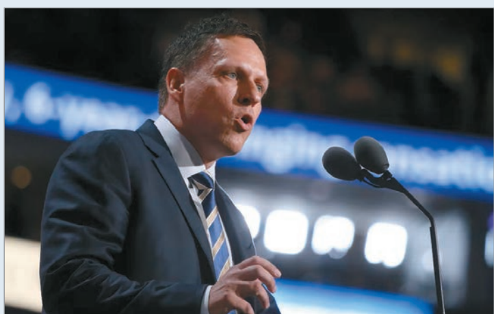
El Presidente se reunirá con el influyente empresario tecnológico en el marco de su visita al país