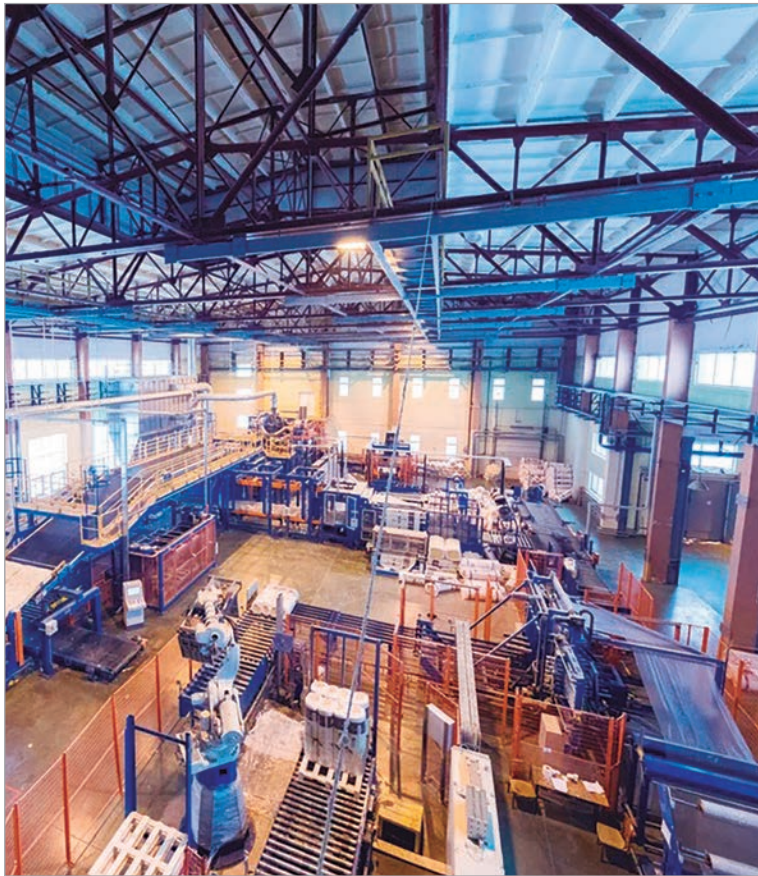
El desplome expone la fragilidad del arranque económico de 2026 y golpea a sectores clave

Estos resultados reflejan un escenario de marcada heterogeneidad, donde algunos sectores vinculados a recursos naturales lograron sostenerse, mientras que ramas clave para el empleo y el consumo interno continúan en retroceso. Cabe recordar que el ministro de Economía, Luis Caputo, había anticipado días atrás que el indicador podía mostrar un desempeño negativo. "Se están haciendo las cosas que hay que hacer para que el país salga adelante. ¿Va a ser una línea recta? No,