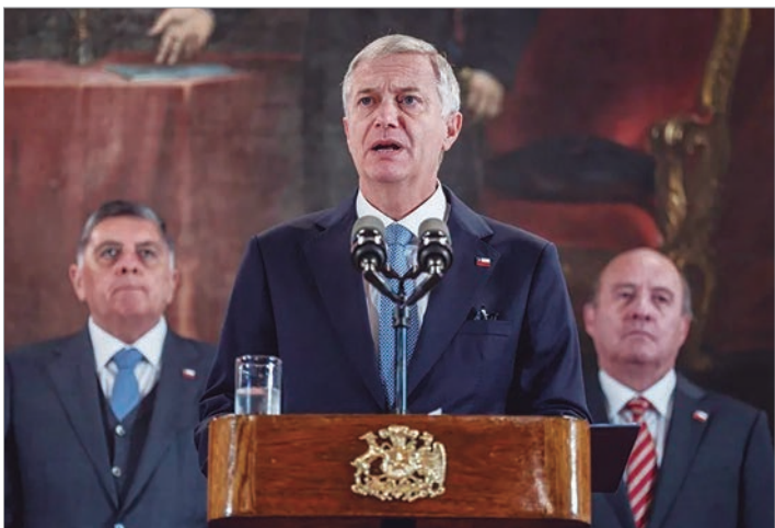
El gobierno chileno busca elevar el crecimiento mediante importantes bajadas de impuestos

Las posiciones divididas en torno al proyecto anticipan un debate álgido en el Legislativo, espacio en el que la coalición de gobierno necesita los votos de la extrema derecha libertaria, que no forma parte del gobierno pero es oficialista, y de la oposición. En su presentación, Kast agradeció la "disposición" del Partido de la Gente (PDG) para llegar a un acuerdo, formación populista que juega un rol bisagra en la Cámara Baja al contar con votos decisivos para cualquier iniciativa legal. La oposición de centro y de izquierdas, en tanto, ya ha anunciado que votará en contra y acusó a Kast de impulsar "una reforma tributaria encubierta", que beneficiaría a los más ricos y reduciría de manera considerable la recaudación tributaria.