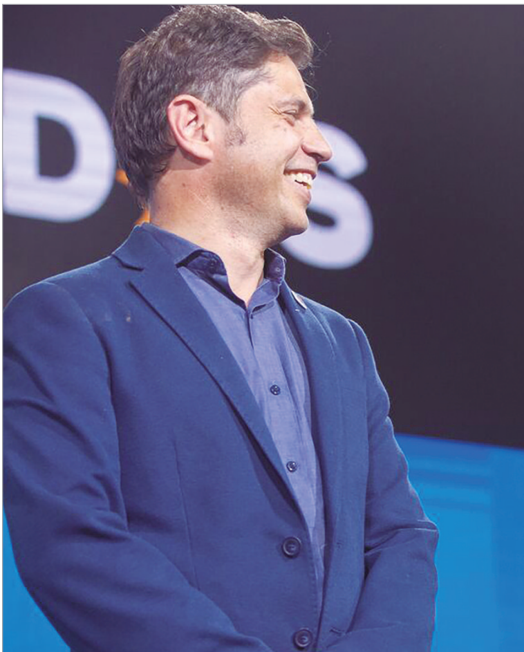
Primera reunión de rosca del PJ con Kicillof a la cabeza

El gobernador convocó a una reunión del Consejo Provincial para este viernes. El temario está centrado en los cargos, las afiliaciones y analizar la coyuntura política