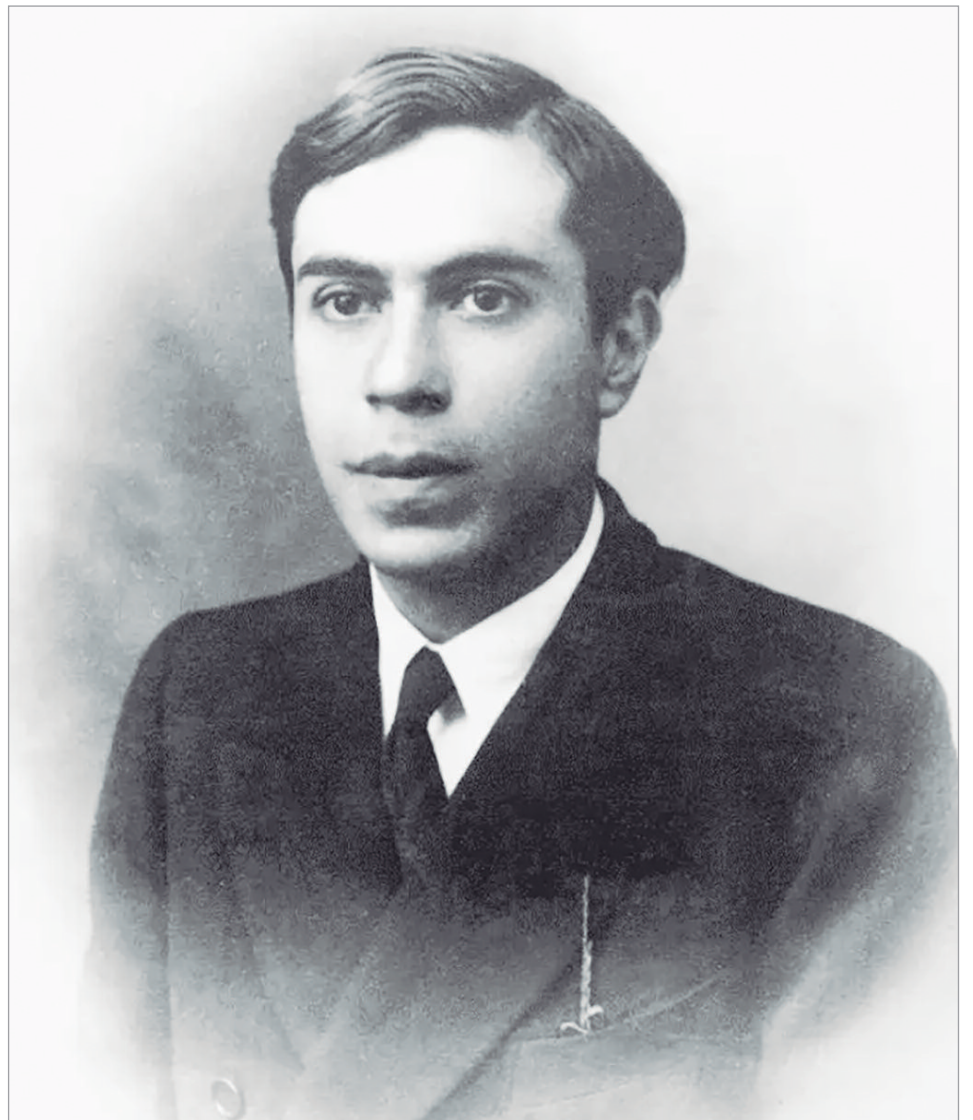
Retrato de Ettore Majorana.

encuentra; son los vivos los que desaparecen") y, a continuación, una anotación de puño y letra de Il Duce: "Quiero que lo encuentren".