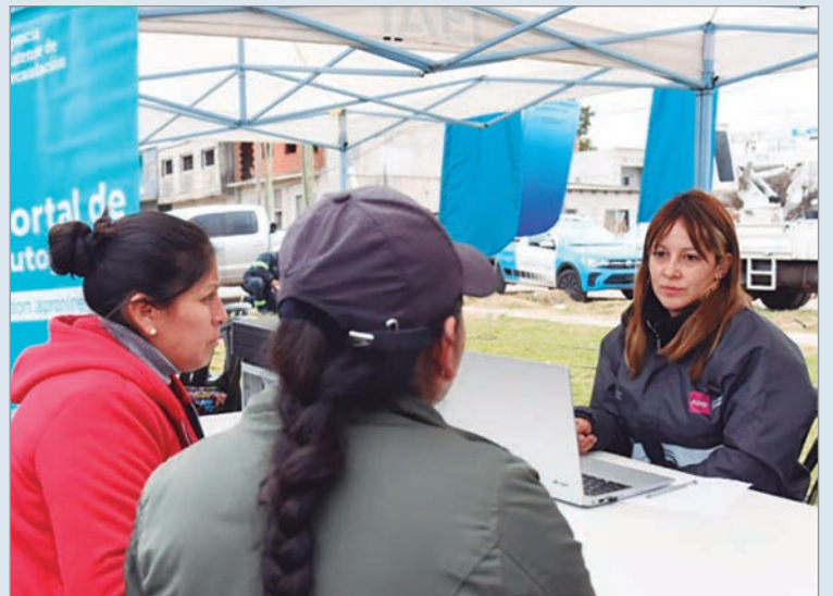
La comunidad de la localidad del oeste podrá obtener DNI y tarjetas SUBE

Por otro lado, un equipo de la Cruz Roja estará brindando información, orientación y asistencia en adicciones y personal especializado en cada área, asesoramiento sobre personería jurídica, regularización dominial, derechos y obligaciones de los