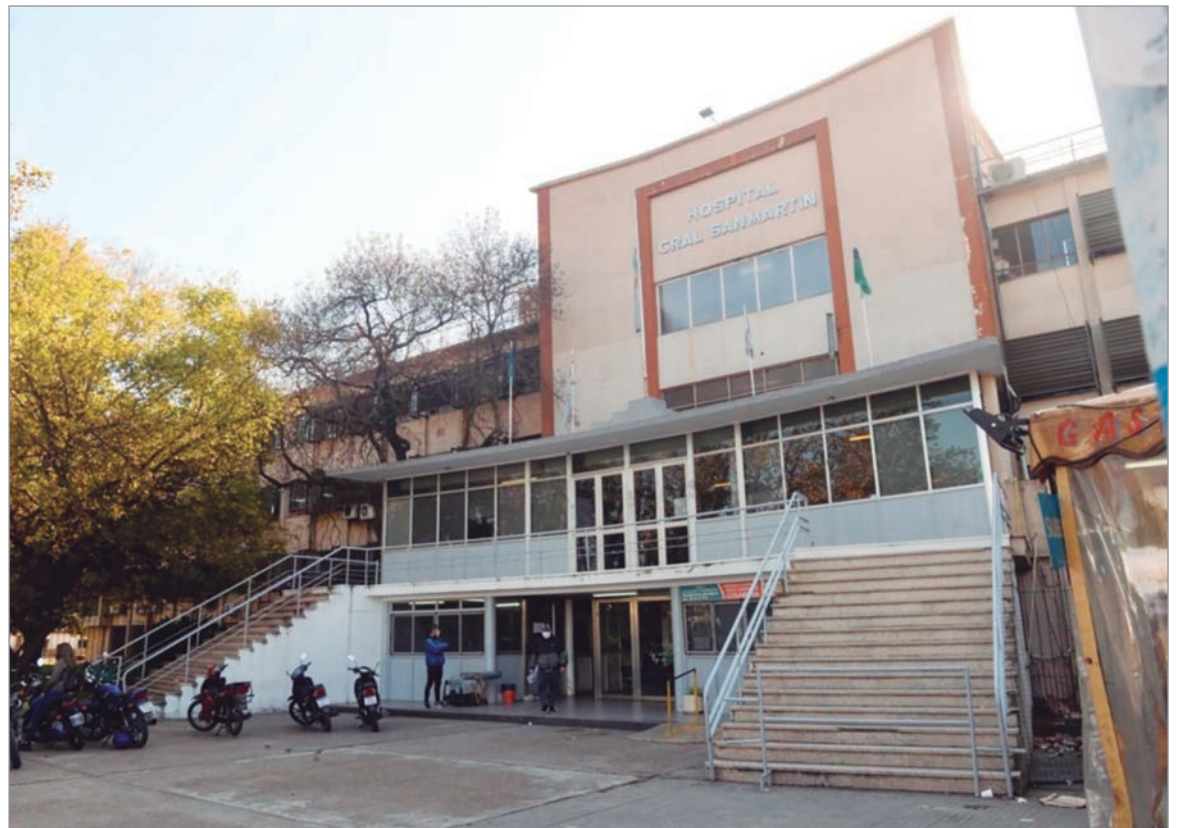
La víctima continúa internada en el San Martín

En tanto, se conocieron datos relevantes sobre el violento asalto aportados por la pareja de la víctima, quien sostuvo que momentos antes, otro conductor le había advertido que estaba siendo perseguido por una moto sospechosa. Luego fue alcanzado por los ham-