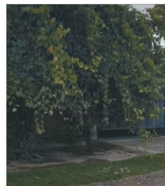
La casa del horror

“Vi a la señora toda ensangren-tada, fui a buscar el celular y el hombre salió con el auto”, relató una vecina, al tiempo que medios locales sostuvieron que los descendientes fueron quienes dieron aviso de lo que ocurría a quienes viven alrededor, con el fin de que se comuniquen con personal de asistencia.