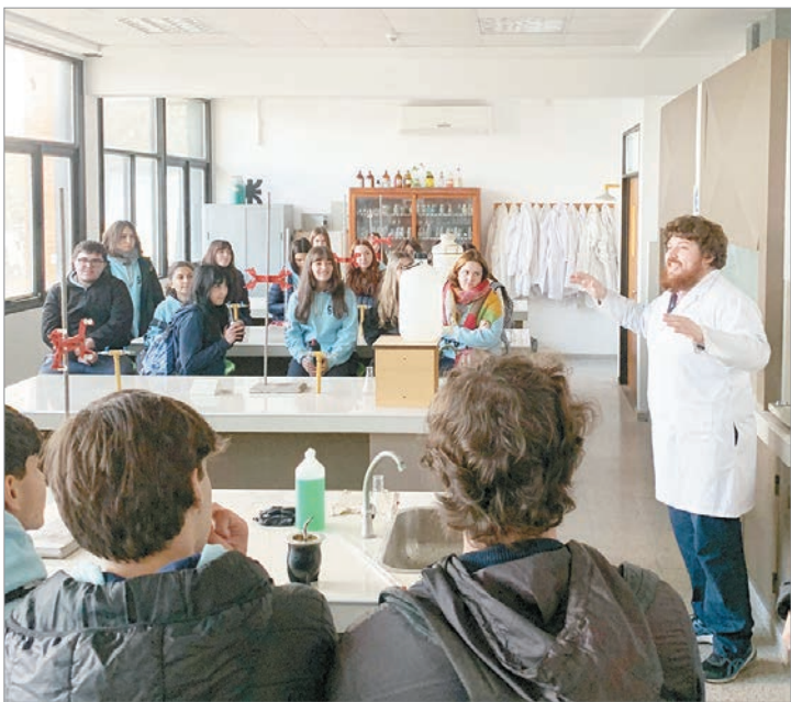
Se busca despertar el interés por las distintas especialidades de ingeniería

Asimismo, para obtener más información relacionada al Seminario Universitario de Ingreso pueden ingresar a la web, donde encontrarán que es nivelatorio y necesario aprobarlo para el cursado de cualquiera de las ingenierías, donde se retomarán contenidos de matemática de 5° y 6° año de nivel secundario.