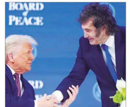
La administración nacional repudió el intento de ataque contra el presidente estadounidense

En paralelo, Javier Milei condenó en redes la “retórica violenta de la izquierda” a la que responsabilizó por generar un clima que habilita este tipo de episodios. La administración nacional instó a garantizar el orden frente a hechos de violencia política.