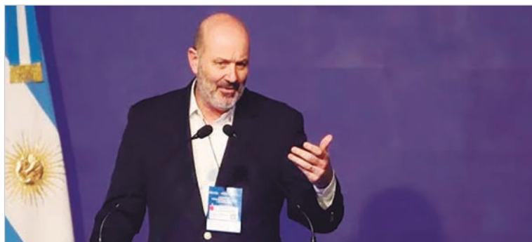
El ministro justificó la reducción de personal en el organismo y anticipó más cambios bajo la idea de modernización

Según sus cálculos, cada estación requiere siete empleados para tareas que podrían reemplazarse con equipos automáticos capaces de