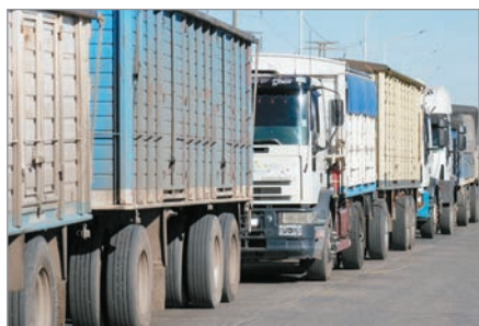
Carbap criticó el bloqueo en y advirtió por pérdidas millonarias en plena cosecha gruesa

Tras el levantamiento del paro de transportistas, la Confederación de Asociaciones Rurales de Buenos Aires y La Pampa (Carbap) cuestionó la medida de fuerza que bloqueó el Puerto Quequén y alertó por sus consecuencias en el mercado de granos. La entidad señaló que la imposibilidad de completar cargas