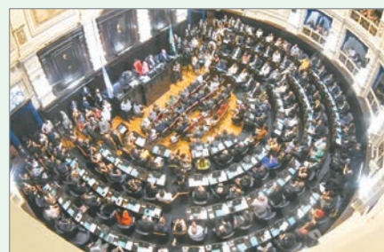
El proyecto busca que adolescentes desde 14 años sean juzgados con penas de hasta 15 años

El senador Guillermo Montenegro presentó en la Legislatura bonaerense un proyecto para reformar el régimen penal juvenil y bajar la edad de imputabilidad a los 14 años, en línea con la Ley 27.801. La iniciativa, respaldada por todo el bloque del PRO, propone modificar la Ley 13.634 que regula el fuero penal juvenil en la Provincia, con el objetivo