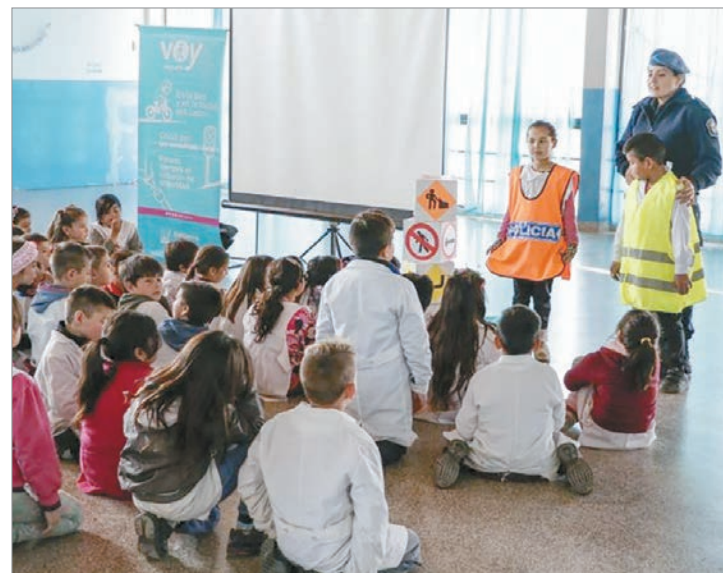
Diputados de la Provincia proponen incluir educación vial en todas las currículas escolares

En un contexto de altos índices de siniestralidad, los proyectos reflejan un consenso creciente en torno a la necesidad de incorporar la educación vial como política estructural dentro del sistema educativo bonaerense. La discusión legislativa vuelve a poner en agenda el rol de la educación como herramienta clave para generar cambios culturales sostenidos y duraderos.