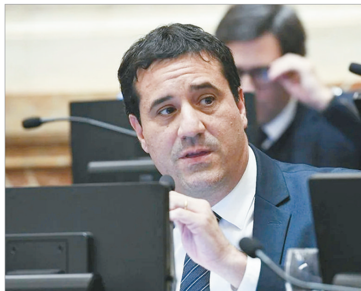
El radicalismo pone reparos a la reforma electoral

Respecto a la boleta única de papel, criticó la propuesta de unificar en un mismo instrumento las categorías nacionales, provinciales y municipales en elecciones simultáneas. Según detalló, esa modificación "va a contramano del objetivo de simplificar el voto", ya que el elector "se va a encontrar con múltiples categorías, lo que hará más dificultoso el proceso y menos ágil la votación".