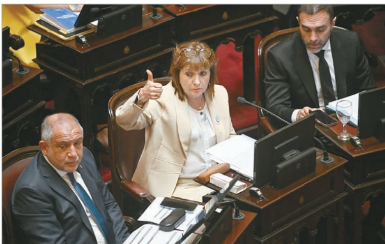
El Gobierno busca aprobar el pago a fondos buitres

Es que actualmente el Gobierno nacional no cuenta con los suficientes votos para aprobar la reforma electoral. Por ejemplo, el radicalismo, un aliado central porque tiene 10 votos claves, no apoya la eliminación de las PASO. Están de acuerdo en su modificación para que sean optativas en las alianzas o partidos donde hay lista única y que se mantenga el aporte estatal en esos casos. También quieren mantener aporte estatal y no comparten aumentar hasta el 35% los aportes privados.