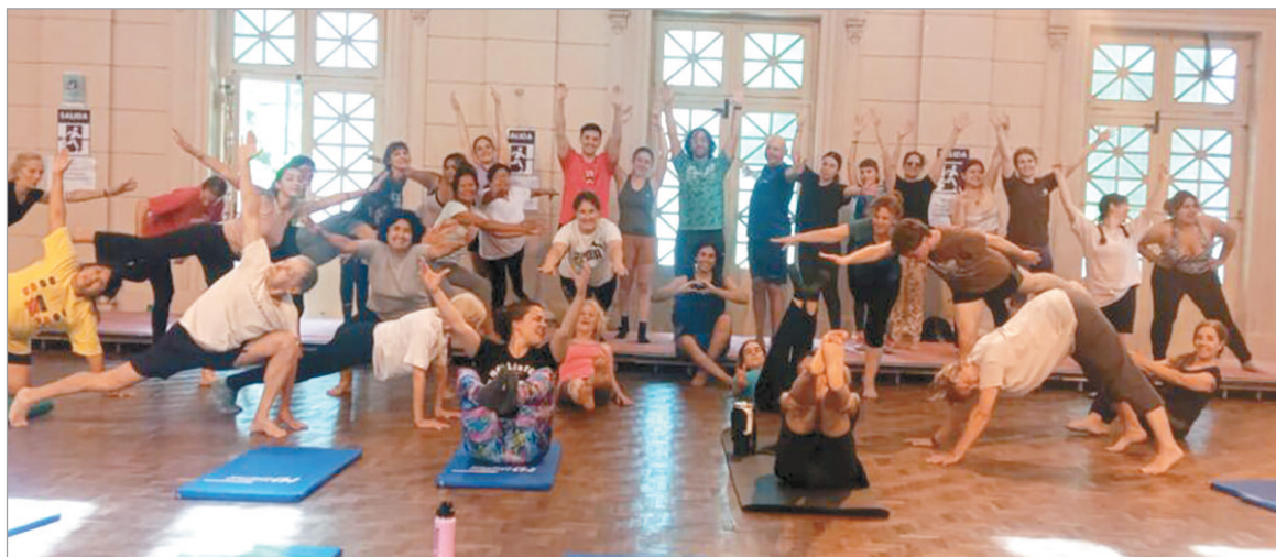
Quienes deseen participar podrán optar entre distintas actividades

A partir de esta semana se reactivarán las actividades abiertas y gratuitas que ofrece la casa de altos estudios