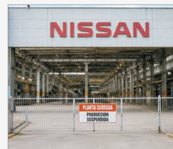
Nissan se pasa a un esquema importador

Según aseguraron, "el proceso se encuentra en una etapa de análisis que implica la revisión detallada de los distintos aspectos del negocio por parte de las compañías involucradas".