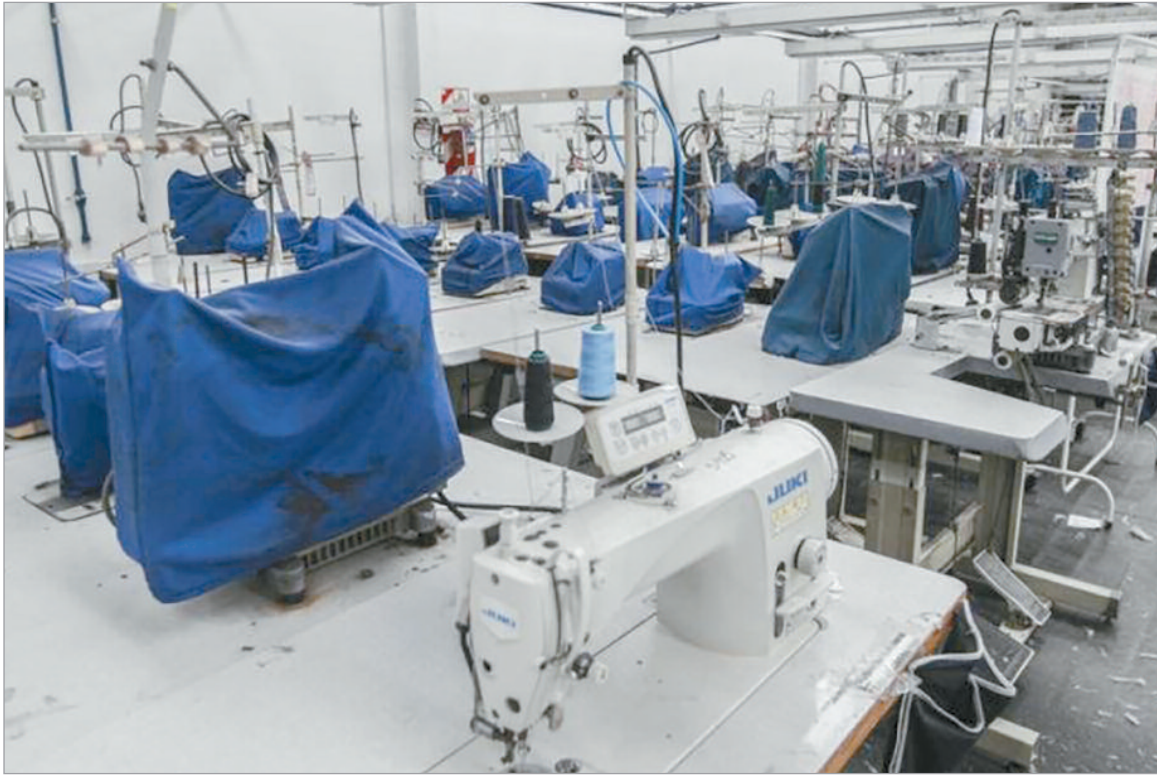
La industria textil se contrajo 36% desde 2023

La apertura importadora, la caída del consumo y el aumento de los costos son la causa de la crisis del sector