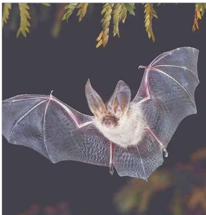
Un murciélago orejado extiende sus alas cuando alza vuelo en un bosque de Países Bajos