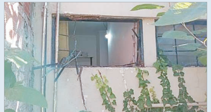
El lugar atacado

Lo más llamativo es que los agentes de la fuerza no lograron hasta el momento ninguna detención, permaneciendo el caso impune, como tantos otros en la ciudad de La Plata.