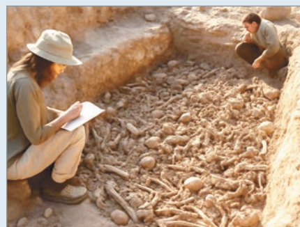
Fosa común de la plaga de Justiniano en Jerash

Los hallazgos indican que personas que habitualmente vivían dispersas por distintas regiones, en el momento de la muerte, fueron repentinamente concentradas en un solo lugar. Este fenómeno sirve como un recordatorio poderoso de que las pandemias no solo propagan enfermedades, sino que también transforman la vida y la estructura social de las comunidades.