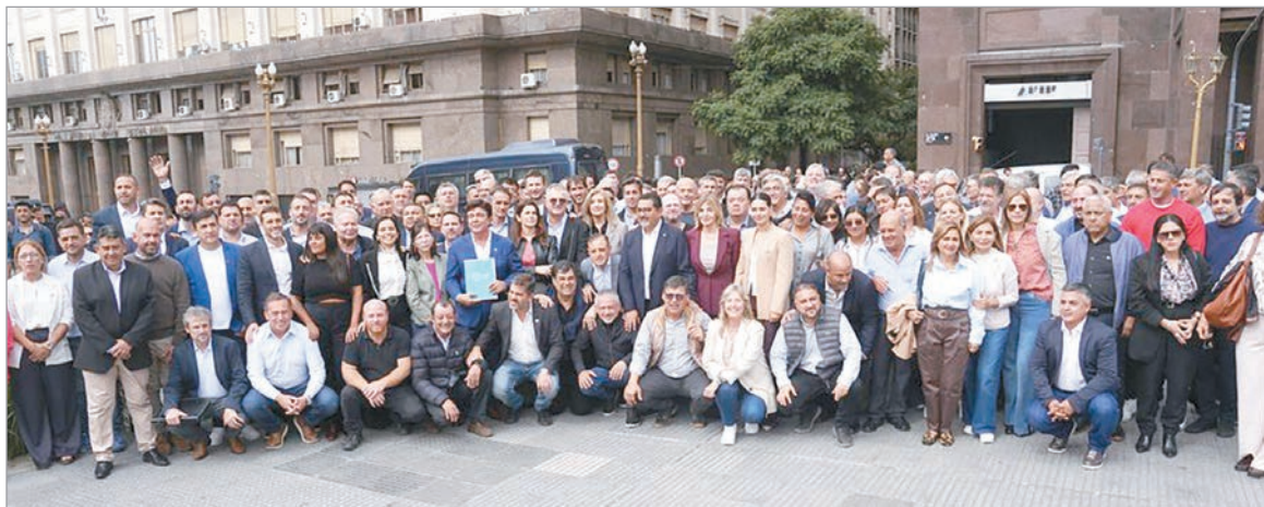
Intendentes marchan a Capital Humano y denuncian deuda millonaria del SAE

Intendentes bonaerenses volverán a manifestarse este miércoles en Capital Humano para exigir fondos que Nación adeuda