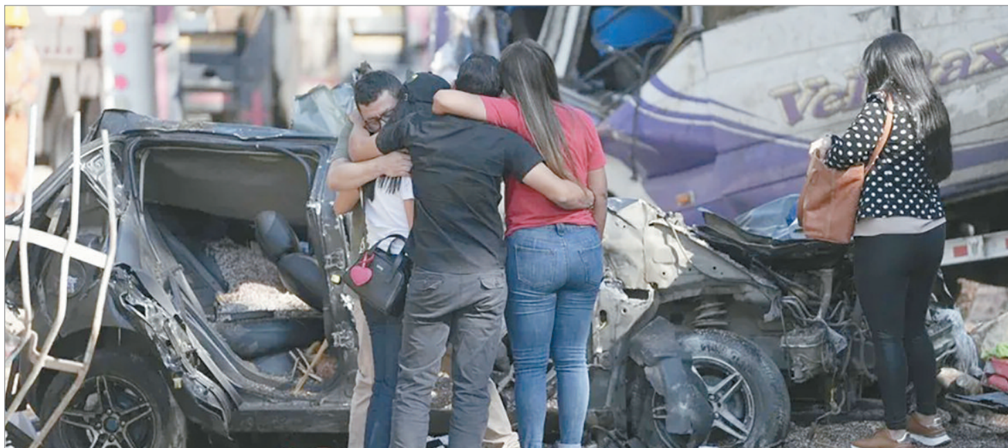
Sucedió en el departamento colombiano del Cauca

“La labor forense se desarrolla con la participación de seis equipos interdisciplinarios integrados por médicos forenses, odontólogos, antropólogos, lofoscopistas, técnicos y personal de apoyo para la identificación y determinación de las causas de la muerte”, aclaró el Instituto de Medicina Legal. El ataque fue perpetrado en un punto de la Panamericana llamado El Túnel, en el municipio de Cajibío, donde un cilindro lleno de explosivos lanzado por un grupo de las disidencias de las FARC, según el Ejército, cayó sobre un autobús y destruyó también otros vehículos que circulaban por la ruta, así como un tramo de la vía. En el decreto de tres días de duelo, la gobernación del Cauca señaló que entre el atentado en la Panamericana y otros ataques perpetrados el día de ayer, “se tiene un saldo de más de 48 civiles heridos, cinco de ellos menores de edad”. Según la información, la ofensiva de las disidencias de las FARC en el Cauca ha dado lugar a una compleja situación de orden público recrudescida por acciones terroristas consecutivas en los municipios de Caloto,