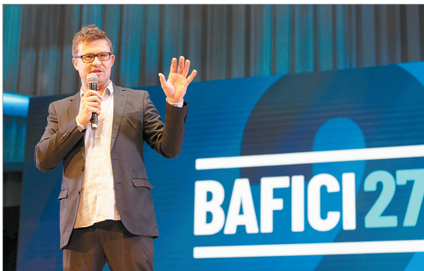
En el cierre del Festival

—¿Cómo estás viviendo esta gran edición? —La verdad que estoy muy conforme, tranquilísimo esta edición, digo tranquilísimo, yendo de un cine a otro, corriendo, pero la verdad, no tuvimos ninguna función suspendida, ninguna función atrasada, más que las