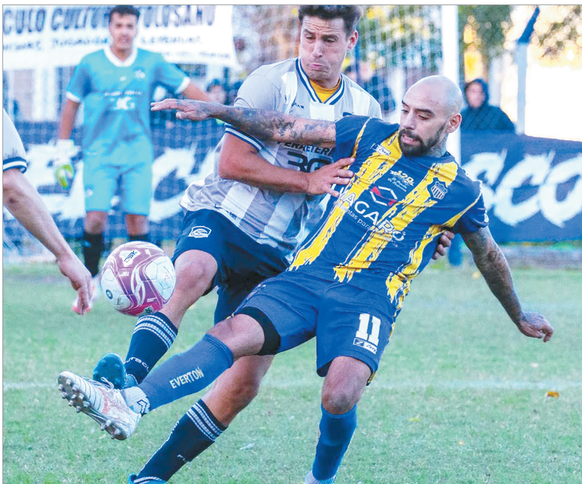
En acción. El partido entre Tolosano y Everton fue disputado y sin goles.

solida en la cima como el único líder con puntaje ideal en los seis partidos que se jugaron.