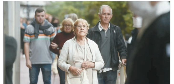
El fin de la moratoria impactó en las personas mayores

En los dos años previos, la moratoria contemplada en la ley 27.705, sancionada en 2023, permitía completar los aportes faltantes sin necesidad de abonarlos antes de jubilarse. El sistema funcionaba mediante descuentos mensuales sobre el haber, como forma de cancelar la deuda previsional en cuotas. Este mecanismo estuvo vigente desde marzo de 2023 hasta el 23 de marzo de 2025. Si bien existía la posibilidad de extenderlo, la actual gestión decidió no renovarlo. Esto redujo el universo de personas que pueden acceder a una jubilación dentro del régimen general, que exige cumplir con la edad mínima (60 años para mujeres y 65 para varones) y acreditar al menos 30 años de aportes.