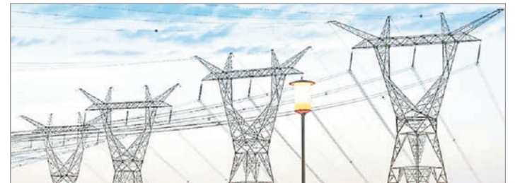
Economía aprobó la primera etapa para vender acciones en Citelec, controlante de Transener

El Gobierno sostiene que la medida busca ordenar el funcionamiento del Estado, fomentar la competencia y garantizar precios sostenibles. Sin embargo, especialistas advierten que la transferencia de activos estratégicos al sector privado puede implicar riesgos en materia de control público y acceso equitativo a la energía.