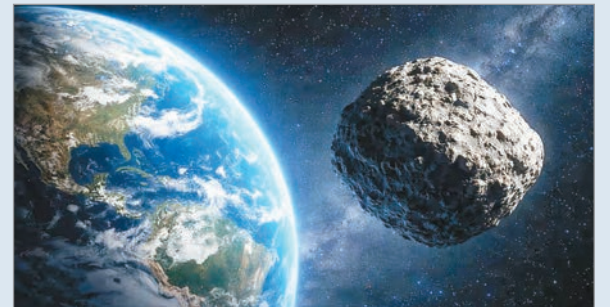
El hallazgo puede ayudar a reconstruir cómo se formaron los planetas.