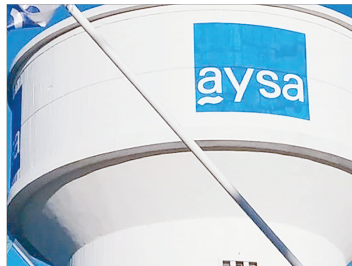
El Ejecutivo oficializó subas periódicas en agua y cloacas en medio del plan de privatización

En paralelo, el Gobierno avanza con el diseño del proceso de privatización de la compañía, en un contexto de reordenamiento de ingresos y de búsqueda de mayor eficiencia en la prestación de servicios. La decisión de aplicar aumentos periódicos busca garantizar la sustentabilidad de la empresa mientras se define el futuro de su estructura de gestión. El desafío será equilibrar la necesidad de inversión con el impacto en los usuarios, que ya enfrentan un escenario de tarifas crecientes en otros servicios básicos.