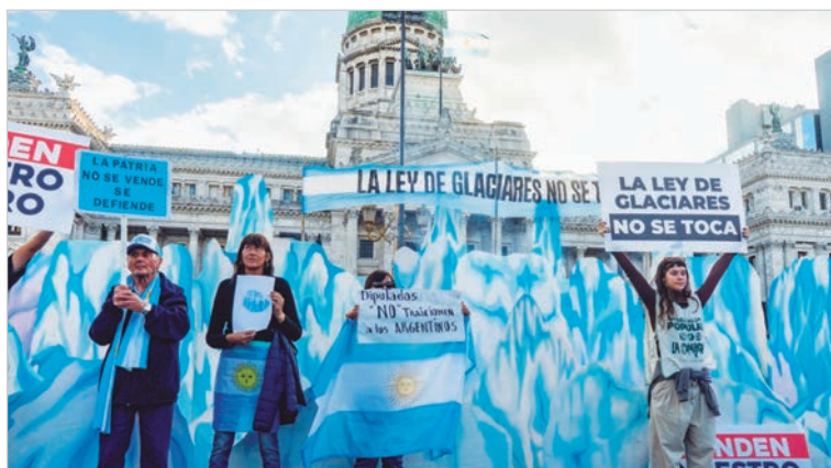
Revés judicial a favor de organizaciones ambientales

La resolución establece que el Estado Nacional deberá abstenerse de autorizar o ejecutar actividades que puedan afectar glaciares o el ambiente periglacial, hasta tanto se dicte una