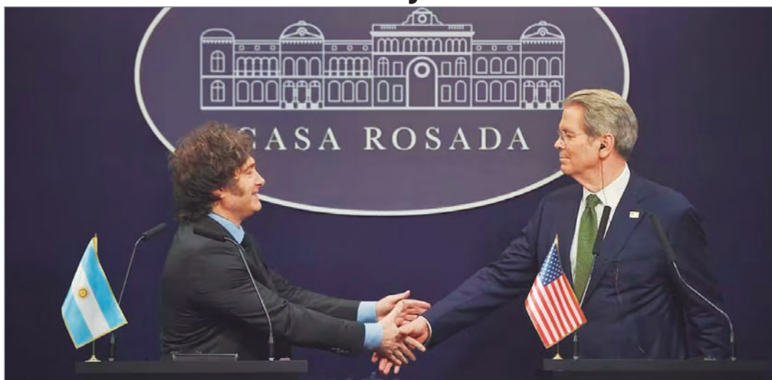
Bessent en la mira

La unidad Congressional Research Service de Estados Unidos, que funciona dentro del Congreso norteamericano, lanzó un informe que cuestiona el salvataje de Donald Trump a Javier Milei en octubre del año pasado, previo a las elecciones. De esta manera, se exigió una ley para evitar acciones similares en el futuro.