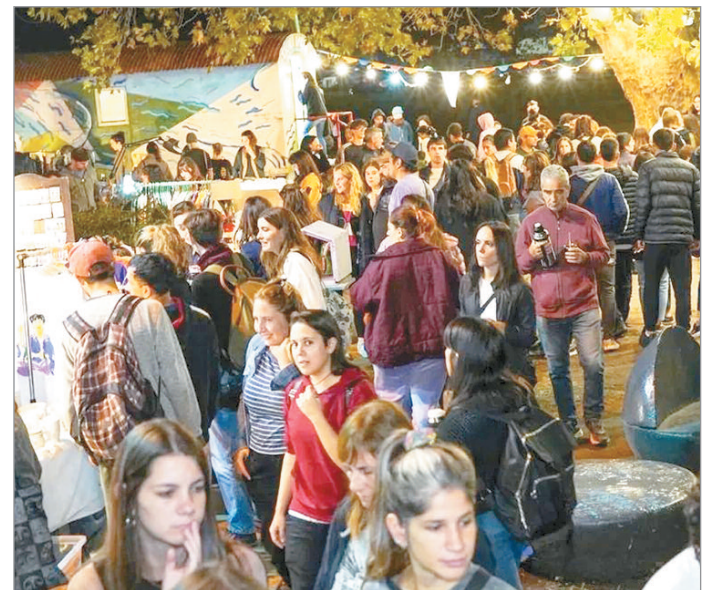
Sucedará este sábado

El próximo sábado, a partir de las 13 y hasta las 22, llega a la ciudad otra edición de La Noche de las Ferias, en el Hipódromo de La Plata, en 44 y 115. En esta nueva oportunidad, en el marco del Día del Trabajador , el objetivo es poner en el centro de la escena, más que nunca el trabajo artesanal, local y regional. "Como en cada edición, buscamos promover el consumo responsable, consciente y solidario. En esta oportunidad van a encontrar a más de 150 proyectos creativos de la ciudad y alrededores con variedad de rubros: indumentaria, accesorios, calzado, juguetes, gráfica, cerámica, cosmética natural, y mucho más. Y a 30 emprendimientos gastronómicos", indicaron desde la organización del evento. Durante toda la jornada habrá música seleccionada en vinilos, de la mano de diferentes DJs de nuestra ciudad, abarcando una amplísima variedad de géneros, desde rock nacional, pop, soul, funk, disco, hasta house.