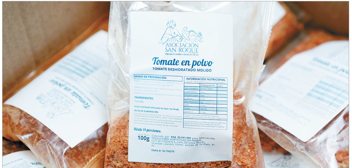
En esta primera etapa se elaboraron 400 paquetes de tomate deshidratado en polvo

producto final corresponde a las organizaciones de productores, mientras que el 40% restante se destina al Programa PAIS en concepto de costos operativos y de procesamiento. En esta primera etapa se elaboraron 400 paquetes de tomate deshidratado en polvo: 225 para la