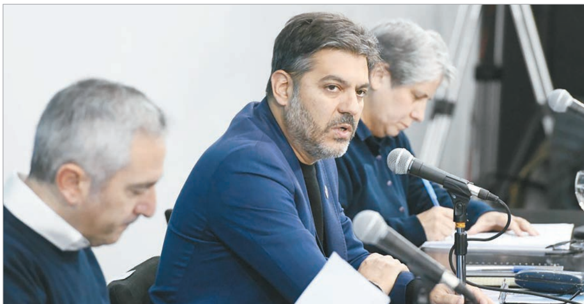
Bianco volvió a cargar contra Milei

Bianco volvió a cargar contra Milei por la retención de fondos desde Nación. Además, ante la consulta de diario Hoy , aseguró que “el Clio está disponible”