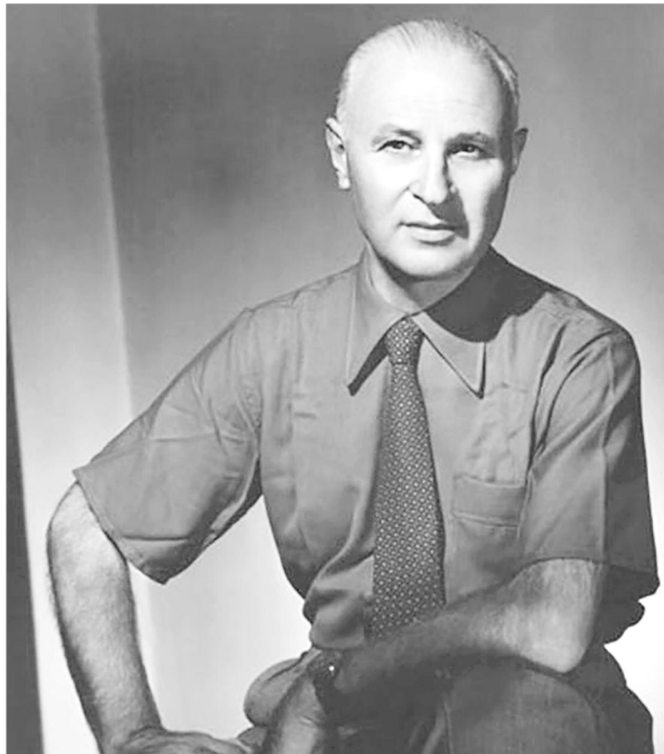
Emilio Pettoruti, pintor y crítico vanguardista.

Se instaló en Florencia, Italia, con un objetivo: copiar las grandes obras de los autores clásicos. Revolviendo en una librería encontró la revista editada por el movimiento futurista, como una cuña entró en él los postulados de ese movimiento que en su primer punto dice: "Nosotros queremos cantar el amor al peligro, el hábito de la energía