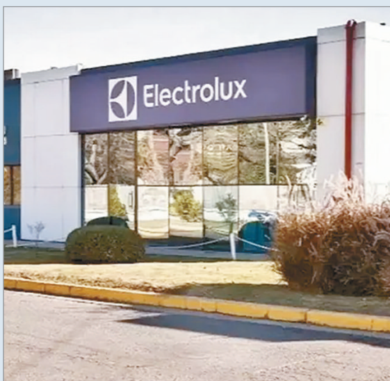
La planta de Rosario dejará de fabricar heladeras y reducirá su personal

La crisis de Electrolux se agravó con la decisión de la firma Ferimetal de discontinuar la producción de heladeras de la marca, apenas unos meses después de haber frenado la fabricación de cocinas. La medida se hará efectiva desde mayo y tendrá un fuerte impacto en el empleo, ya que de los 250 trabajadores actuales solo permanecerán 150, muy lejos de los 750 que inicialmente integraban la planta.