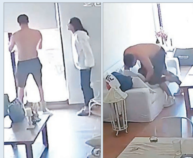
La agresión del acusado

En la grabación se ve cómo el sujeto la tira sobre un sillón y la golpea, mientras que en otro tramo se observan forcejeos y tirones de pelo.