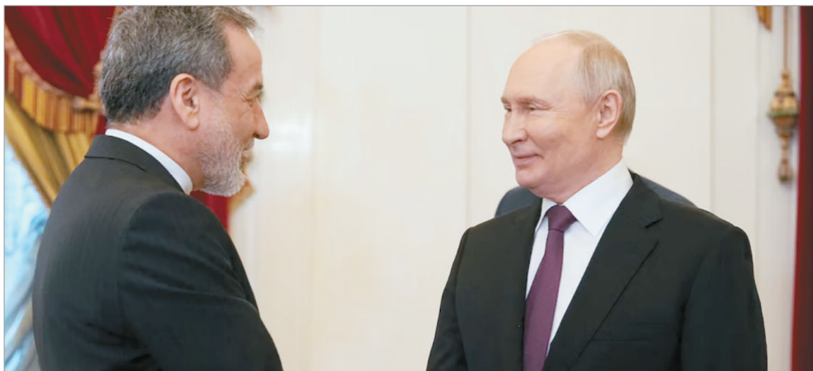
El presidente ruso, Vladimir Putin, recibió en San Petersburgo al canciller iraní Abás Araqchí

Mientras Teherán evalúa retomar el diálogo con Estados Unidos, Moscú insiste en una salida diplomática que contemple los intereses regionales y consolide su alianza estratégica con la república islámica