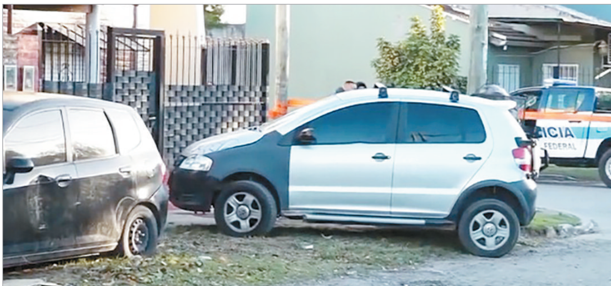
El operativo en el lugar

Durante una vertiginosa persecución, el oficial le disparó a uno de los ladrones que, a raíz de las heridas, murió poco después. Uno de sus cómplices logró escapar