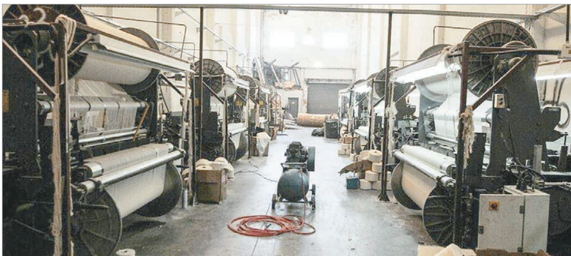
El informe de IPA advierte sobre primarización y pérdida de competitividad en la economía nacional

El sector industrial concentra el 97% de las pérdidas laborales registradas este año y acumula el cierre de casi 3.000 empresas