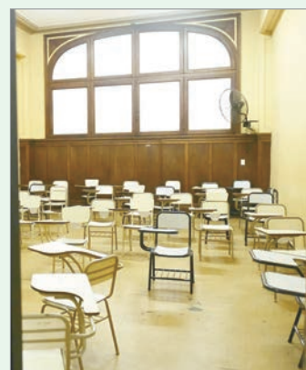
Docentes profundizan el plan de lucha

“El reclamo es claro y contundente: Milei cumplió la ley”, sentenciaron los gremios. Se trata de la segunda semana completa de paro en lo que va del ciclo lectivo, tras la misma medida aplicada de 30 de marzo al 4 de abril.