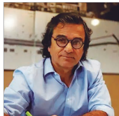
Echaron a un funcionario de Caputo