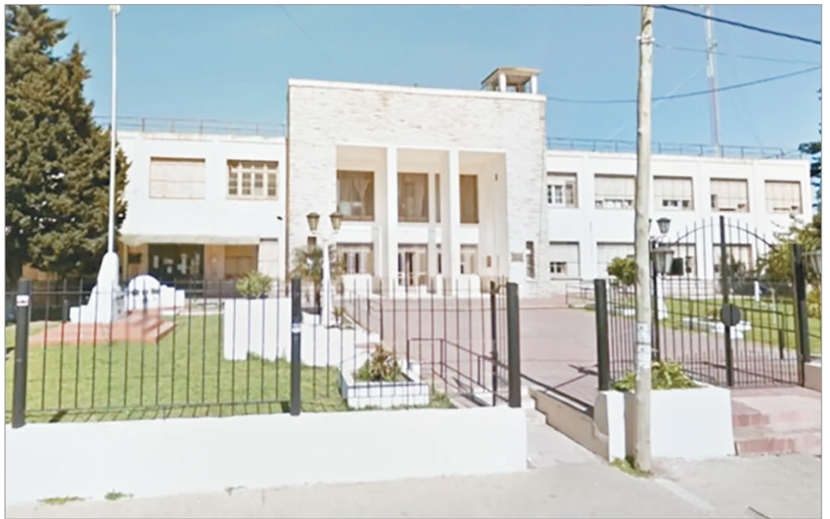
La cárcel apuntada