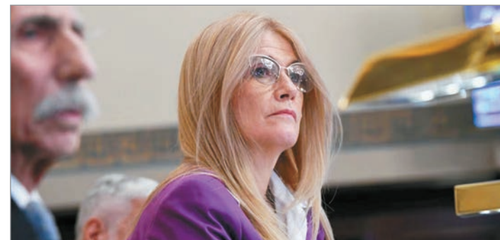
“Milei es cruel con los más débiles”

Además, la dirigente apuntó contra la posible incompatibilidad entre pensión y empleo formal. Se trata de uno de los puntos del proyecto, que elimina la posibilidad de que una persona con discapacidad pueda trabajar sin perder la asistencia estatal. Al respecto, explicó que la pensión por discapacidad ronda los $378 mil, por lo que funciona como un complemento frente a las dificultades de estas personas en el mercado laboral.