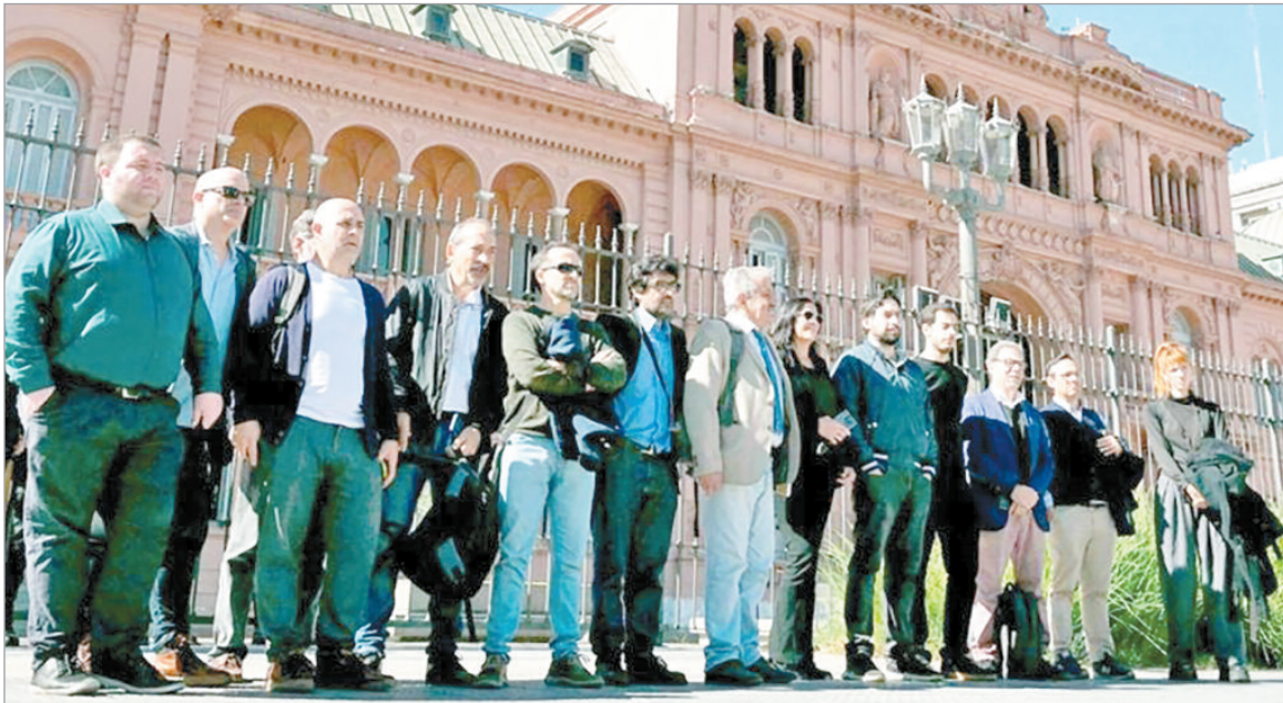
La Iglesia enfatizó erradicar discursos de odio y defender valores constitucionales

La Conferencia Episcopal repudió la suspensión de acreditaciones y exigió respeto a la libertad de expresión