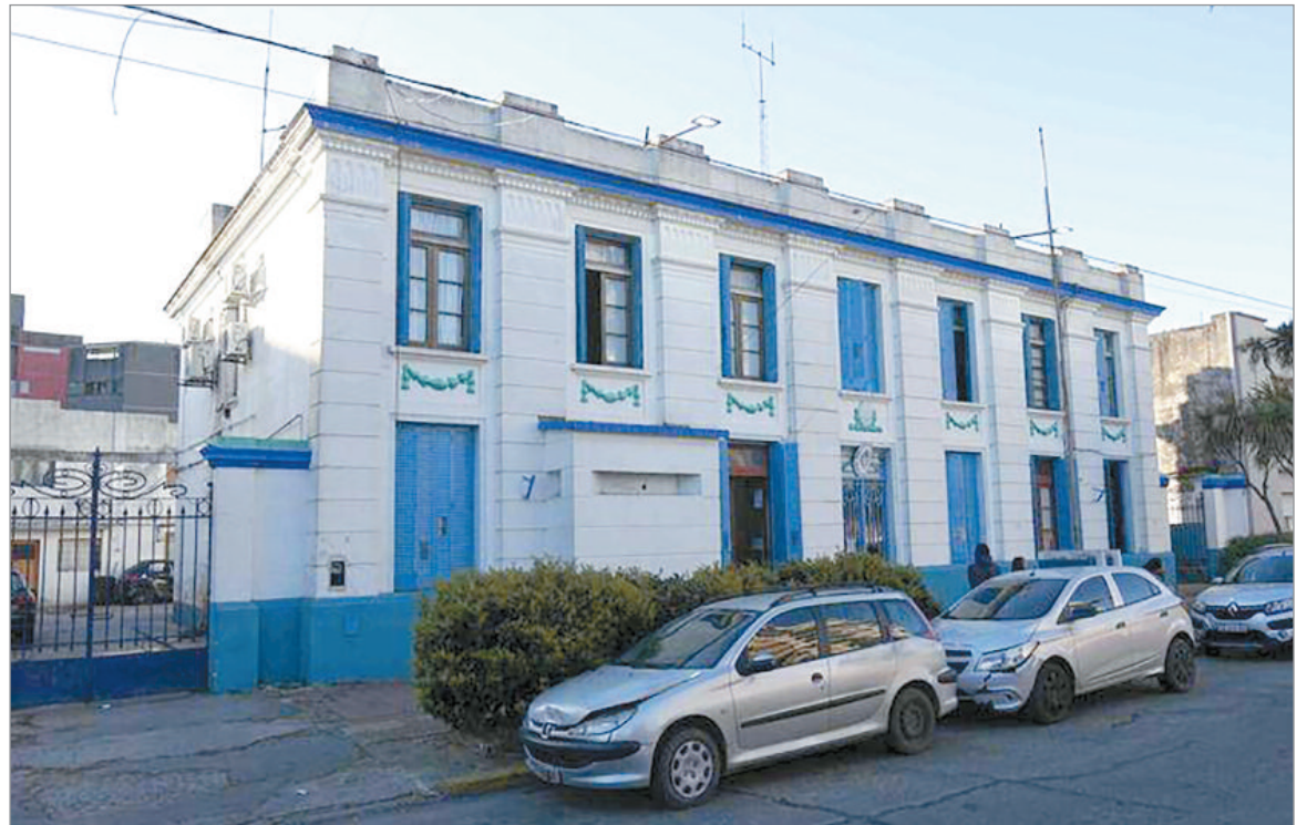
Investiga la comisaría Segunda

La hija de la señora de 80 años contó que "así no se puede seguir", y especificó que los autores del hecho emplearon guantes y, además, estaban encapuchados. Los peritos de la Policía Científica que trabajaron en la escena no pudieron recolectar huellas, y ahora los agentes de la comisaría Segunda, con jurisdicción en la