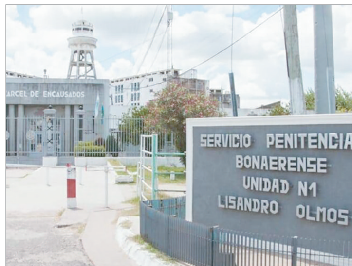
Diputados proponen un esquema mixto de concesión con control estatal en la Legislatura provincial