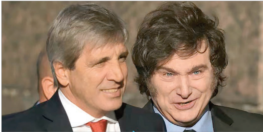
Privatizaciones aceleradas despiertan denuncias y tensiones en el Congreso

La administración de Javier Milei atraviesa un momento decisivo en su programa de privatizaciones y concesiones de activos estratégicos. La velocidad con la que avanza los procesos, no solo refleja la voluntad oficial de transferir áreas clave del Estado, sino también el temor a que el desgaste político limite la capacidad de ejecución. La caída de la imagen presidencial, los conflictos internos y los escándalos recientes, aceleraron la necesidad de consolidar negocios antes de que el poder libertario se fracture por completo. En ese marco, la venta de AySA se convirtió en un símbolo de la disputa. El Senado sorprendió al oficialismo al aprobar una moción que busca frenar la privatización, recordando el fracaso de las concesiones de los años 90. La operación des-