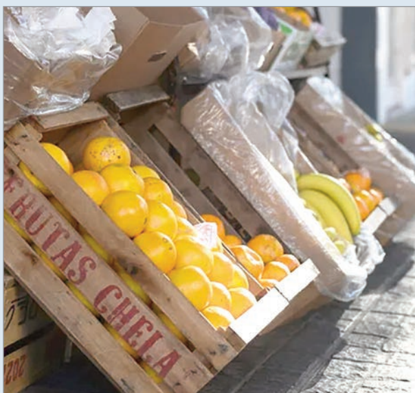
La inflación no desacelera

La Fundación FundPlata publicó su relevamiento mensual sobre la variación de los precios de los productos que componen la canasta alimentaria de La Plata. El estudio arrojó que los alimentos aumentaron en abril 2,2% en la ciudad. Se trata de una cifra por debajo del número de inflación nacional del Indec del cuarto mes del año (2,6%), pero superior al 1,5% que dio la categoría de alimentos y bebidas del Índice de Precios al Consumidor (IPC).