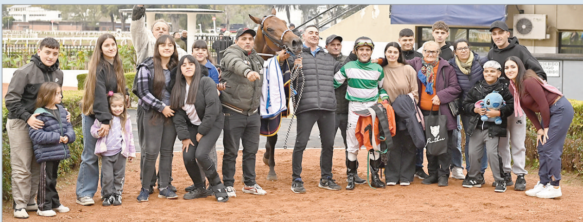
Gritó "El Rey de SAO". Exitosa reprise de Richardisong que en el disco le ganó por el hocico a Que Fachita que dio guerra hasta el final, protagonizando el final más emotivo de la tarde.

El ganador empleó 1m.13s.15/100 para los 1.200 metros de pista seca, no pudiéndose brindar los parciales porque sigue sin funcionar el cronómetro oficial del hipódromo.