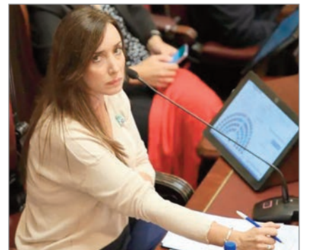
La vicepresidenta cuestionó la gestión de Petri y calificó de “fantocheda” el proyecto de Bullrich

La interna en el Gobierno sumó un nuevo capítulo con los ataques de Victoria Villarruel contra Luis Petri y Patricia Bullrich. La vicepresidenta tildó al diputado de “playmobil” y lo acusó de haber dejado paralizada la Obra Social de las Fuerzas Armadas. “Debe justificar el desastre de los últimos dos años”, sentenció. En paralelo, la funcionaria apuntó contra Bullrich y calificó como “fantocheda” la creación del Departamento Federal de Investigaciones. La interna sigue abierta y sin tregua.