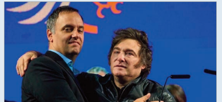
Se dilata la presentación de la DDJJ de Adorni

En relación al ministro coordinador, la posición en torno a la DDJJ tuvo variaciones. Al día posterior a los dichos de Bullrich, dijo que iba a dar a conocer ante la Oficina Anticorrupción. “Patricia me spoileó, se adelantó”, comentó. En Casa Rosada apoyaron dicha versión y dijeron, en un principio, que iba a tardar entre 25 y 30 días. Con el correr de los días, le bajaron acciones a esa posibilidad. Hoy, directamente, no hay una fecha precisa.