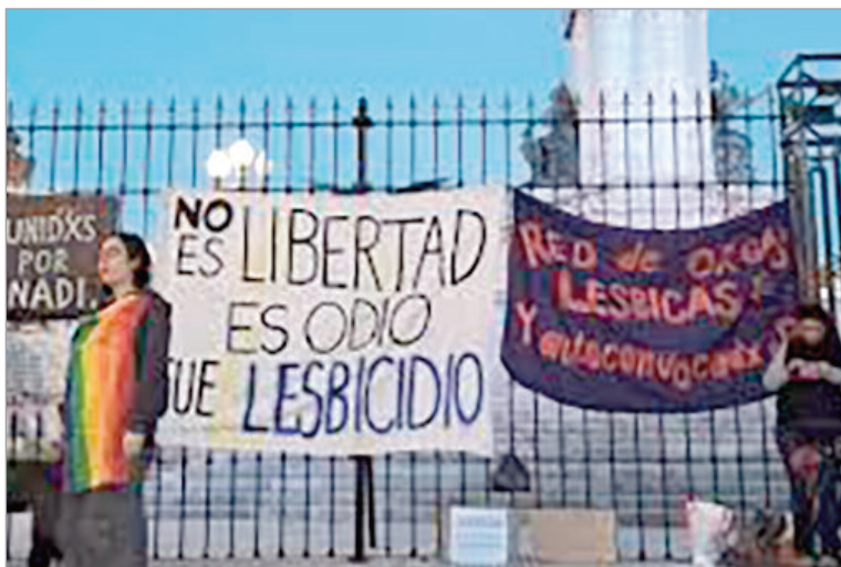
Así quedó el lugar incendiado