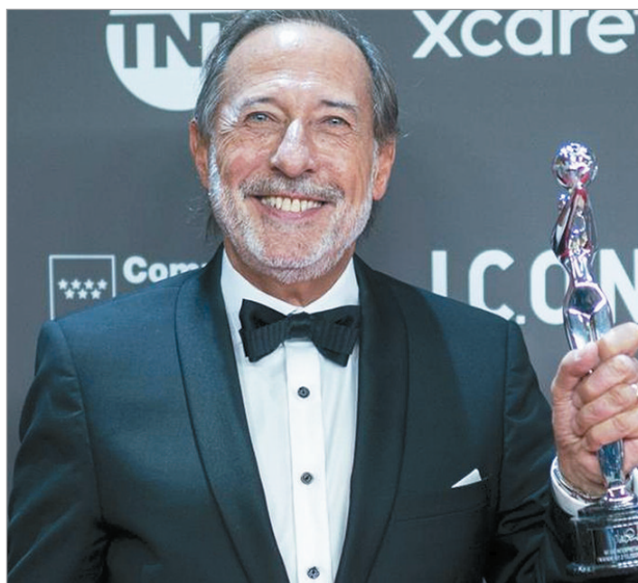
En la red carpet