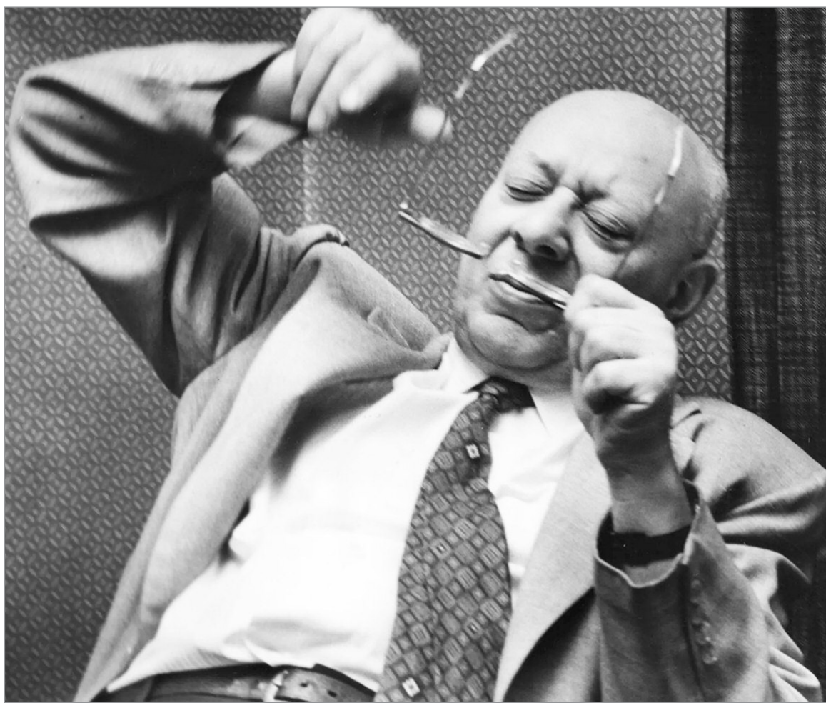
Bettelheim, venerada figura de la psiquiatría infantil

Cuando llegó a casa de su prima Edith en Chicago, ella le dijo que no podía alojarlo, pero sí ayudarlo a conseguir un trabajo como el suyo, en algún colegio secundario de mujeres. Fue de un establecimiento a otro, haciendo suplencias, y en su tiempo libre escribiendo un ensayo que logró publicar, luego de incontables rechazos en revistas especializadas, en el año 1943. Se titulaba "Comportamiento individual y de masas en situaciones extremas" y fue el primer testimonio de primera mano que se escuchaba en Norteamérica sobre lo que ocurría en los campos nazis (una de las revistas universitarias de psicología que se lo rechazó había funda-