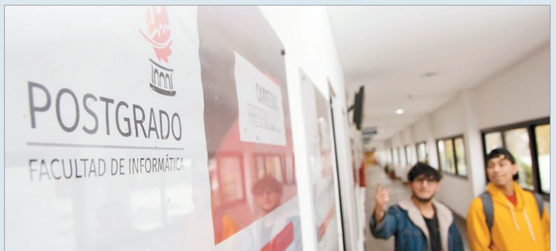
Son 25 los nuevos profesionales

Posgrado en Inteligencia Artificial Generativa dictada por la Facultad de Informática de la Universidad Nacional de La Plata. Además, ya comenzó a cursar la segunda cohorte, también bajo la modalidad a distancia. Al completar este primer ciclo, la Facultad de Informática da un paso importante en la actualización profesional en un área de gran interés. Por otro lado, los cursos de la Diplomatura articulan con la Especialización y la Maestría