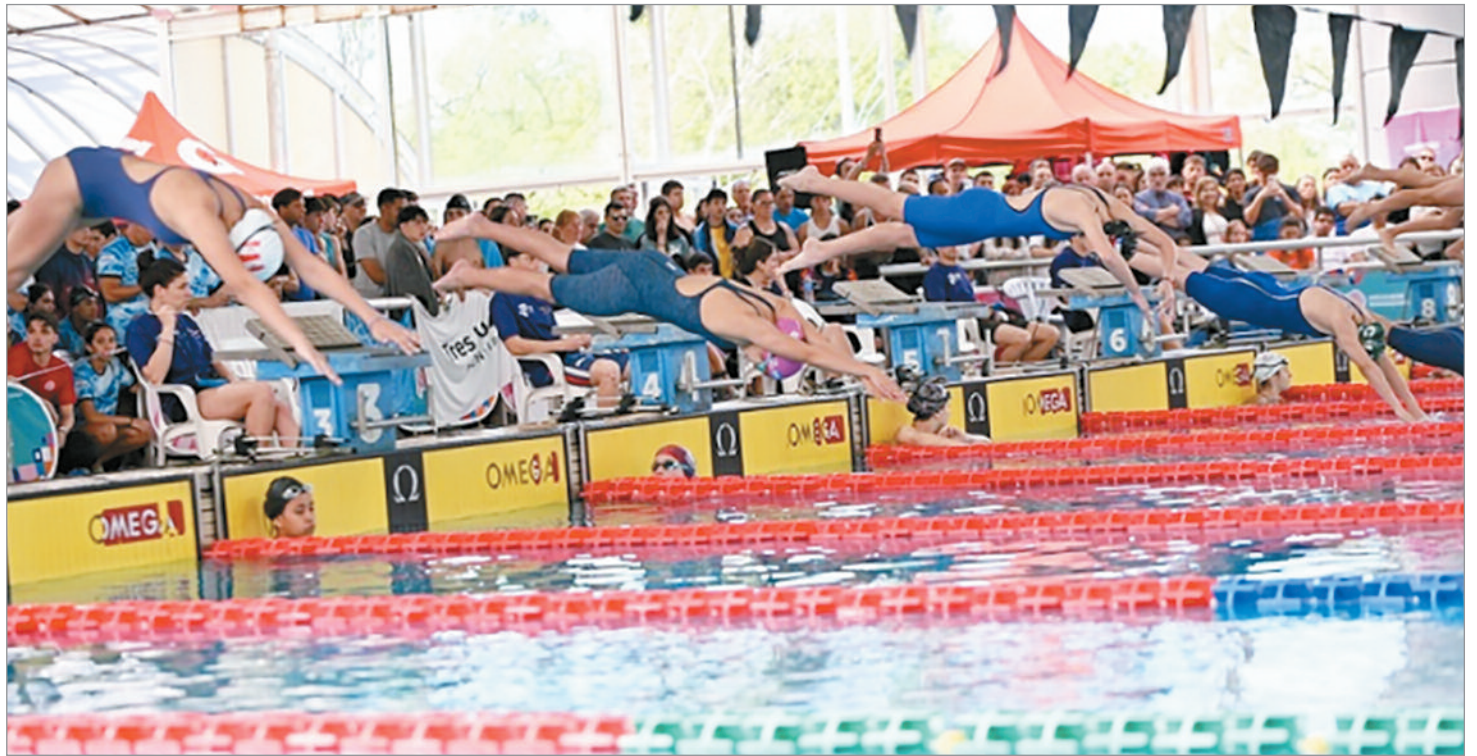
La gran final se realizará en octubre en Mar del Plata

Entre las principales novedades de este año, en juveniles se agregan nuevas categorías en ajedrez, handball, gimnasia, patín y vóley. Asimismo, en la modalidad intergeneración, se mantienen las incorporaciones de 2025, ampliando las posibilidades de interacción