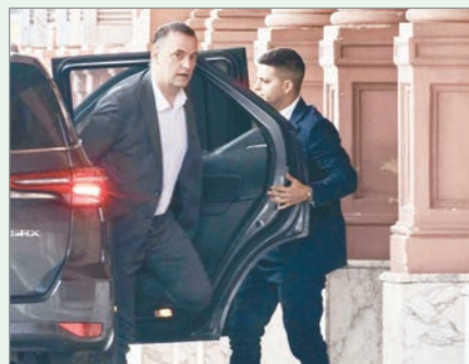
La iniciativa busca garantizar acceso universal a orientación profesional para alumnos del último año

Legisladores bonaerenses presentaron un proyecto de ley que plantea implementar test vocacionales gratuitos para todos los estudiantes del último año de secundaria, tanto de gestión pública como privada. La propuesta,