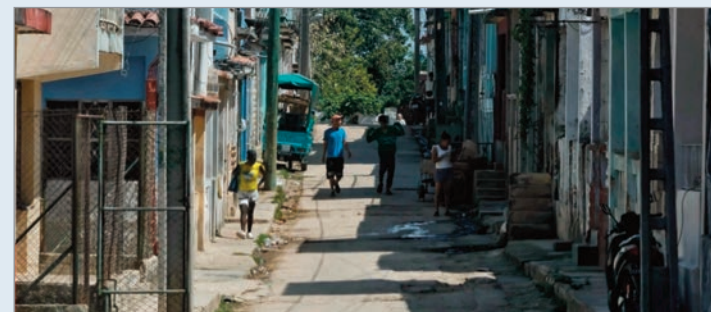
Rusia reafirma que mantendrá ayuda a Cuba ante el bloqueo yanqui

Denunció que “la administración estadounidense lleva décadas tratando de doblegar a Cuba, un país que resiste con heroísmo y logró excelentes resultados en una amplia variedad de áreas de desarrollo social”.