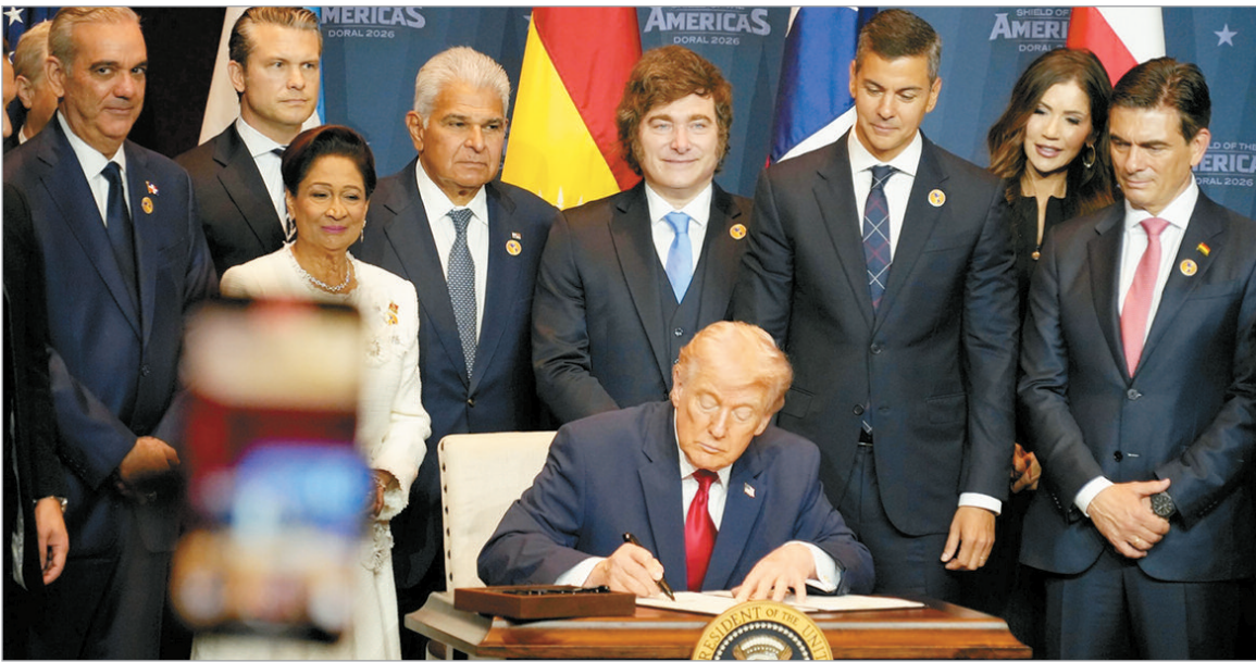
El HondurasGate salpica a Milei

La prensa internacional reveló audios filtrados que vinculan al Presidente con un presunto plan de desestabilización regional