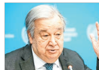
El secretario general de las Naciones Unidas, António Guterres

El secretario general de Naciones Unidas, António Guterres, celebró el sábado la extensión por 45 días del alto el fuego alcanzado a mediados de abril entre Israel y Líbano, y exigió a ambas partes el fin de toda agresión y el cumplimiento del Derecho Internacional.