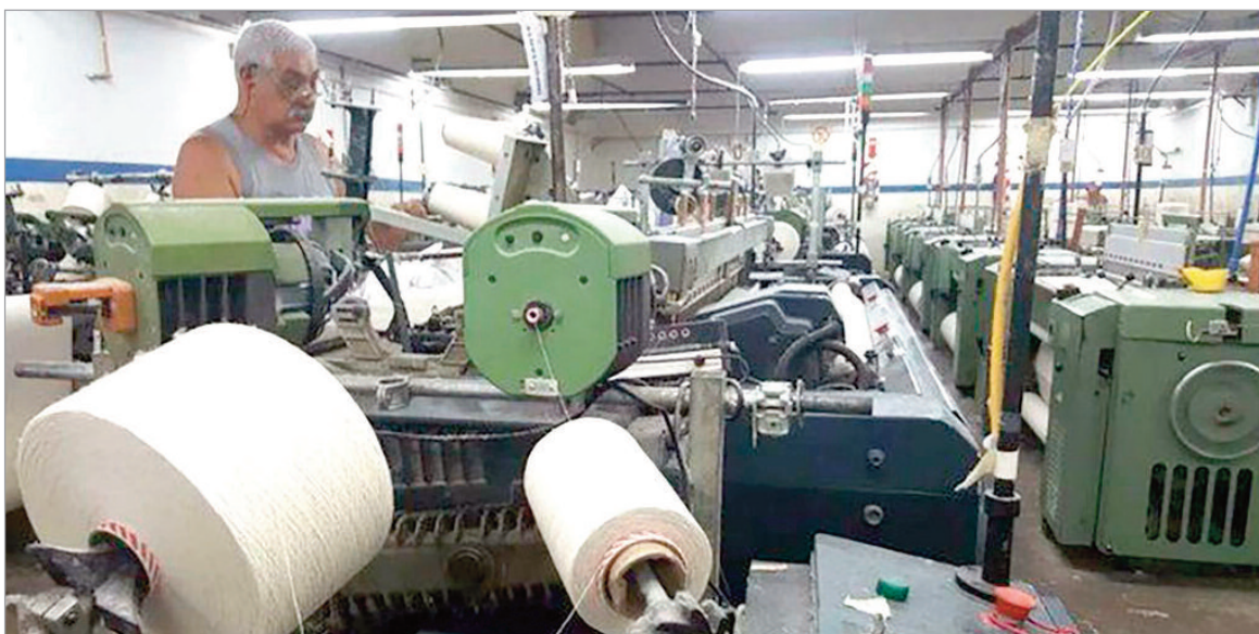
Se perdieron 75 empleos industriales

Representantes del sector advierten que la industria pierde nueve empleos por hora, lo que impacta en la estabilidad económica