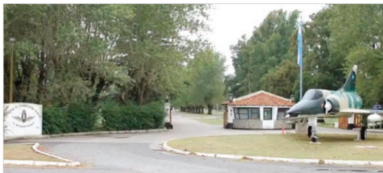
La operación por un Embraer ERJ-140LR expone sospechas de direccionamiento, sobrepagos y deficiencias técnicas

La compra de un avión Embraer ERJ-140LR por parte de la Fuerza Aérea Argentina quedó bajo la lupa tras una serie de denuncias que cuestionan la transparencia del proceso. De acuerdo a una investigación periodística, el pliego habría sido diseñado de manera restrictiva, con especificaciones que limitaban la competencia y favorecían a una sola empresa, Regional One Inc. La investigación expone que el proceso licitatorio para incorporar el avión se resolvió en menos de dos meses, un plazo considerado inusualmente rápido para una contratación estatal de este tipo. Por otra parte, el precio pagado superó los cuatro millones de dólares, pese a que existían ofertas más bajas por aeronaves similares. Un informe técnico posterior detectó