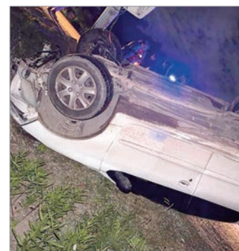
Así quedó el vehículo

Los voceros señalaron que todo tuvo lugar este domingo en el camino Centenario entre las calles 453 y 454