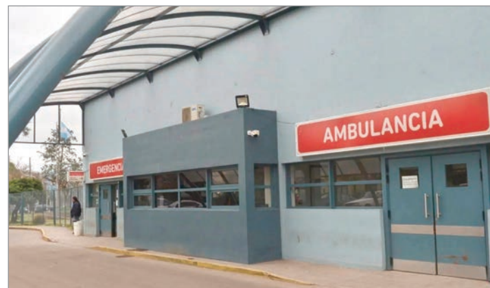
Fue trasladado al Hospital de Gonnet

“Estamos a la espera de los resultados de la autopsia”, culminó un portavoz consultado.