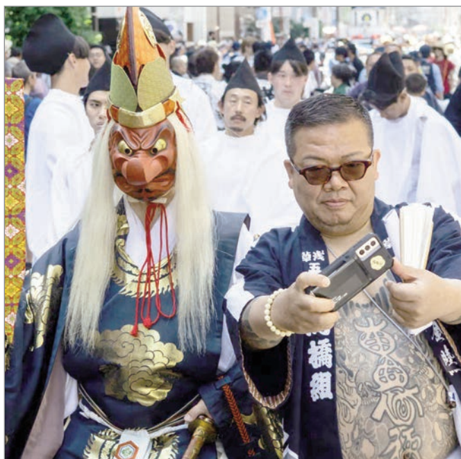
Un participante con tatuajes irezumi se toma una foto con un sacerdote que encabeza una procesión hacia un santuario en el último día del festival Sanja Matsuri, en Tokio, Japón