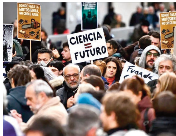
La inflación casi duplica al aumento salarial

El informe advirtió que esta brecha refleja el desfase entre la evolución de la inflación y las actualizaciones salariales otorgadas por el Gobierno nacional. En términos concretos, los aumentos quedaron sistemáticamente por debajo del costo de vida, lo que provocó una pérdida acumulada que afecta a miles de trabajadores del sistema científico y educativo.