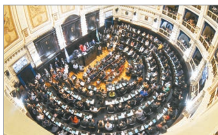
La iniciativa busca limitar contenidos riesgosos de influencers y fija sanciones económicas

La Legislatura bonaerense recibió un proyecto que apunta a prohibir que influencers promocionen cirugías estéticas peligrosas, intervenciones médicas riesgosas y dietas extremas en redes sociales. La propuesta busca limitar la difusión de prácticas vinculadas al negocio de