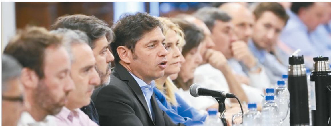
Intendentes bonaerenses se alinean con Kicillof frente al ajuste en Salud

El gobernador busca un acuerdo con los jefes comunales para denunciar el recorte de recursos y exponer el impacto en hospitales y centros públicos