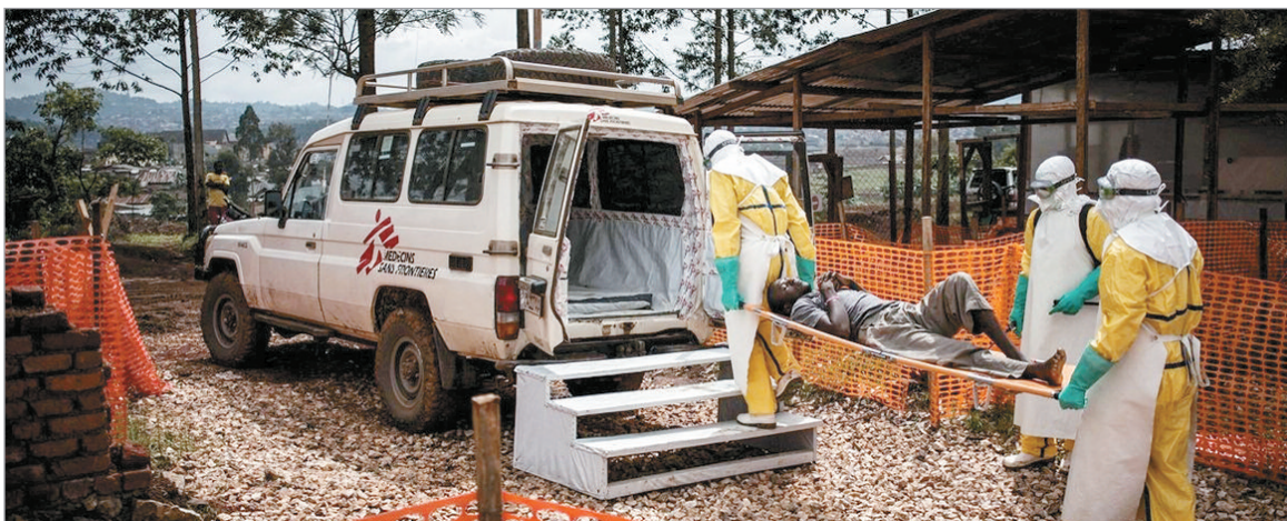
El foco del brote se encuentra en una zona de difícil acceso

La Organización Mundial de la Salud (OMS) declaró una emergencia de salud pública internacional, su segundo nivel de alerta más alto, ante el brote de una rara cepa de ébola que afecta a la República Democrática del Congo (RDC) y a Uganda