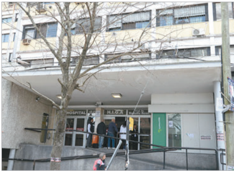
Uno de los nosocomios

El otro hecho ocurrió en el Hospital Rossi, ubicado en el Barrio Hipódromo de La Plata. Allí, un hombre de 48 años denunció que su padre murió