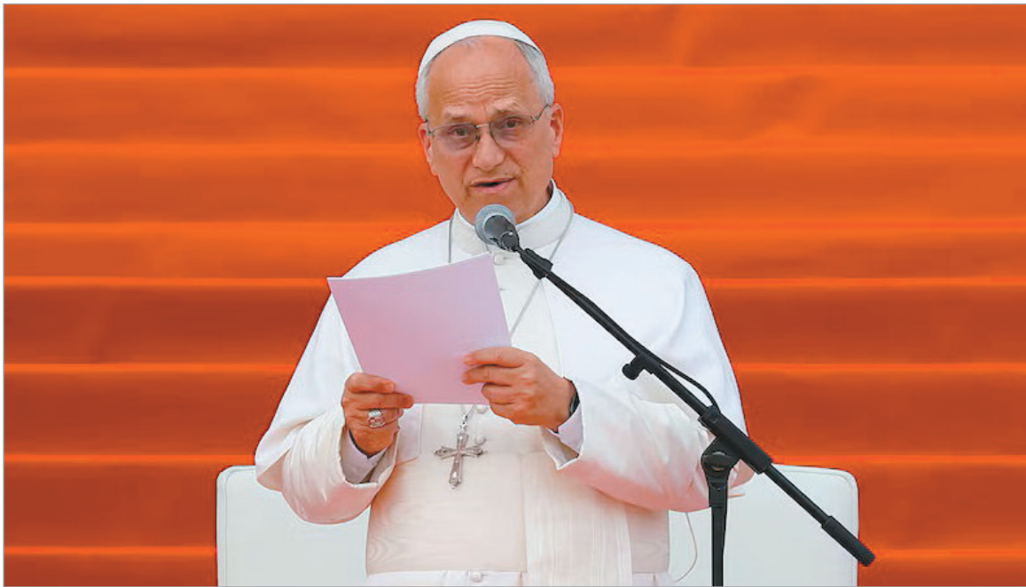
Avanzan las gestiones diplomáticas para que el Papa llegue al país en noviembre

El canciller Quirno anticipó que el Papa León XIV podría llegar en noviembre, en una visita histórica para la Argentina y la región