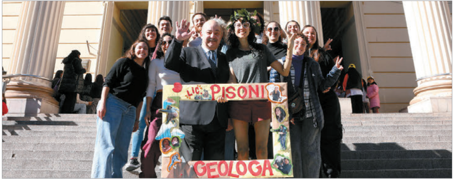
El 41% de las personas que se reciben pertenecen a la primera generación universitaria de sus familias

Para estimar la tasa de egreso, la alternativa más precisa consiste en contrastar el