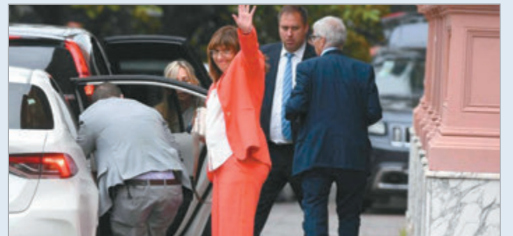
El oficialismo intenta contener la interna mientras continúan las tensiones

Ante este escenario, el núcleo duro del Gobierno estudia implementar un esquema de reuniones limitado a integrantes formales del Ejecutivo, lo que dejaría afuera a dirigentes legislativos como Bullrich y Menem y abriría interrogantes sobre el rol institucional de Caputo. Por ahora, la mesa política continuará como principal ámbito de coordinación entre las distintas terminales libertarias.