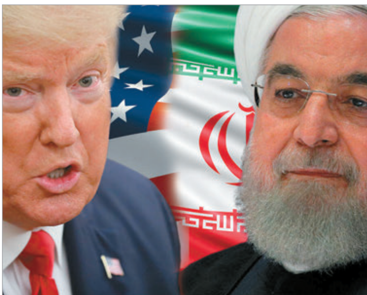
Las negociaciones internacionales buscan estabilizar el Golfo Pérsico

El conflicto se encuentra atravesado por la disputa en torno al programa nuclear iraní y el control del estrecho de Ormuz, paso clave para el transporte mundial de petróleo y gas. Según trascendió en medios árabes y fuentes diplomáticas, el posible acuerdo incluiría el cese de las operaciones militares, la garantía de