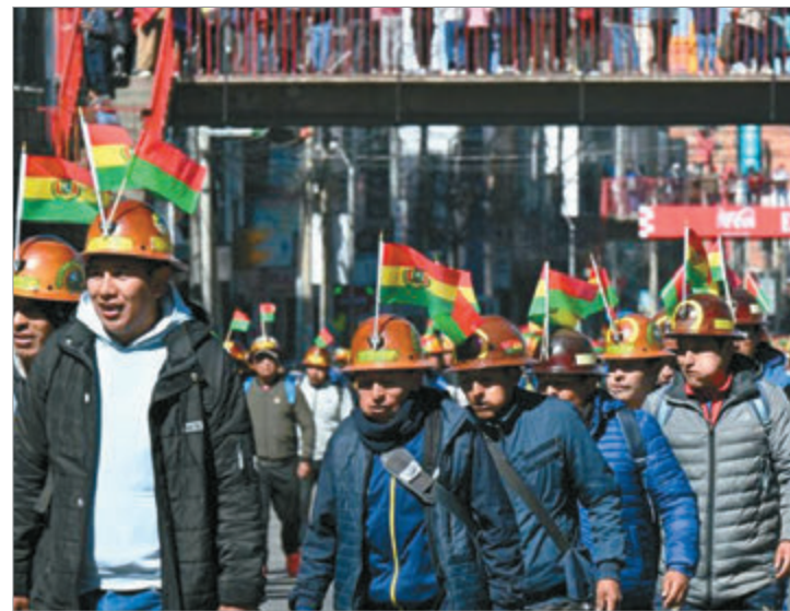
Manifestaciones exponen el delicado escenario político que atraviesa Bolivia

Con un oficialismo debilitado, conflictos sociales en ascenso y crecientes dificultades económicas, Bolivia vuelve a enfrentar un escenario de incertidumbre que reaviva las tensiones históricas entre sectores políticos, sociales y territoriales.