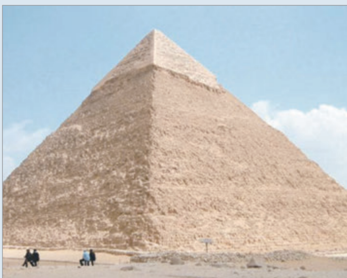
La pirámide de Keops sobrevivió a sismos históricos, como los de 1847 y 1992

Un reciente estudio internacional identificó por primera vez los factores que explicaron la resistencia sísmica de la pirámide de Keops: la mayor y más antigua de Giza, Egipto. Construida hace unos 4.600 años, la estructura soportó terremotos de gran magnitud, como los de 1847 (6,8) y 1992 (5,8), sin daños graves en su cuerpo principal, según resultados publicados en Scientific Reports.