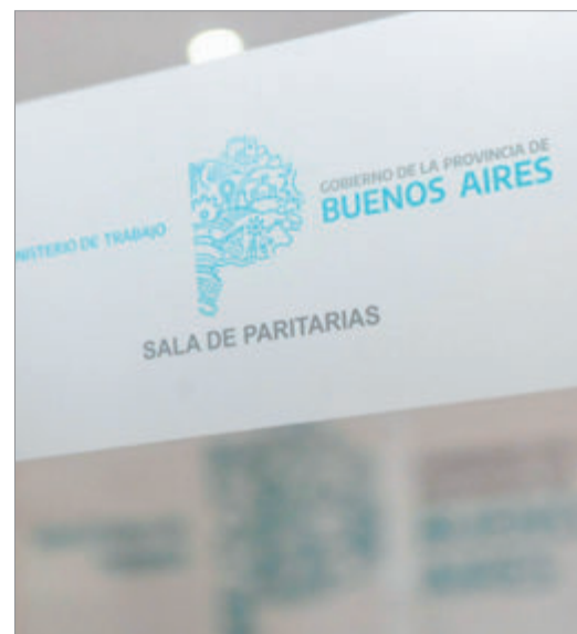
El gobierno bonaerense pospuso la oferta salarial y espera el IPC de mayo para definir aumentos.

La mesa de monitoreo permitió evaluar el impacto de la suba de precios sobre los ingresos, aunque no se avanzó en soluciones inmediatas. Los gremios ya preparan una estrategia de presión para que la negociación de junio contemple un aumento que compense la escalada inflacionaria y evite un mayor deterioro en los salarios públicos. El desafío será lograr un acuerdo que equilibre las cuentas provinciales con la necesidad urgente de los trabajadores, en un contexto de crisis que amenaza con profundizarse si no se alcanzan respuestas rápidas y efectivas.