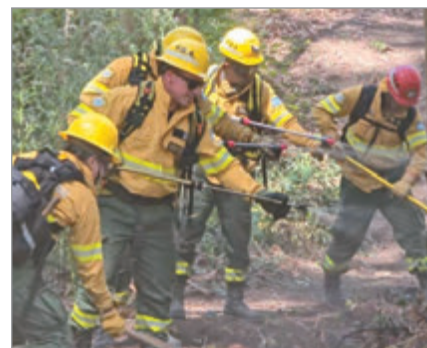
Diputados radicales exigieron al Gobierno transferencias urgentes para los cuarteles.