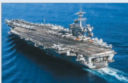
Diputados bonaerenses rechazan el despliegue y exigen garantías a Nación.