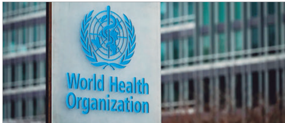
El Gobierno defendió la decisión como un acto de soberanía.

A través de un comunicado difundido en X, el canciller Pablo Quirno remarcó que Argentina cuenta con los recursos propios necesarios para afrontar sus políticas sani-