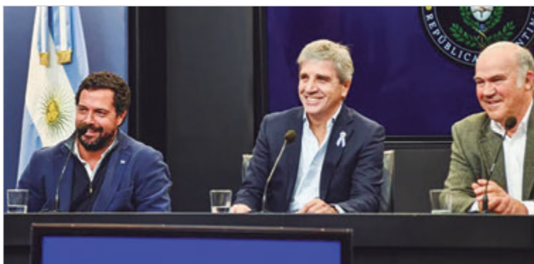
El ministro confirmó que los cultivos agrícolas tendrán reducciones impositivas desde 2027.

En el caso de la soja, la alícuota descenderá desde 2027 en 0,25 puntos porcentuales por mes, lo que la llevaría al 21% hacia el final del mandato. Durante 2028, la reducción será de medio punto mensual, con un piso del 15%. Para maíz y sorgo, la baja será trimestral: del 8,5% al 7,5% en 2027 y hasta 5,5% en 2028. El girasol tendrá un esquema semestral, pasando del 4,5% actual al 3% en