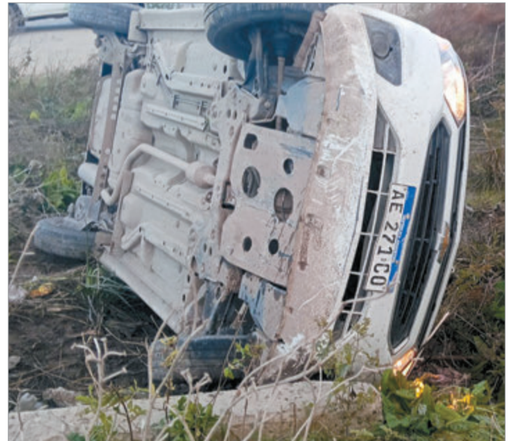
Así quedó el vehículo

La acción provocó la pérdida de estabilidad de una motocicleta que transitaba por la zona y derivó en una violenta caída de su conductor sobre el asfalto. En tanto, el automovilista involucrado nunca detuvo su marcha y huyó a gran velocidad inmediatamente después del choque.