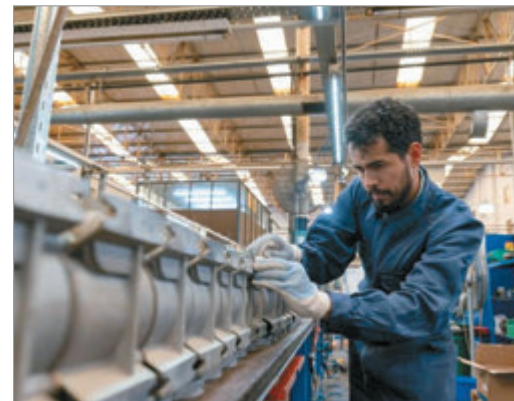
Empeoró la expectativa empresarial

Una pregunta clave del informe apunta a conocer la situación financiera de las empresas. Para el 28% de los encuestados, su respuesta fue "mala" (24% había sido el porcentaje del informe anterior).