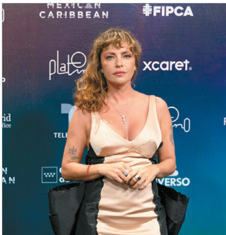
En la red carpet