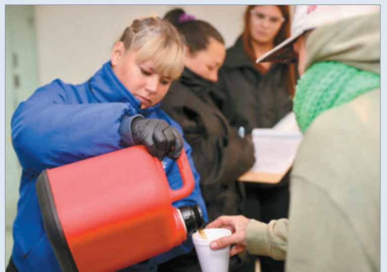
Las autoridades llevan adelante cerca de 11.400 asistencias mensuales

Los menús que se entregan en las recorridas incluyen una variedad de platos como estofado, filet de merluza con arroz, tarta de verdura, fideos con salsa, guiso de legumbres, canelones de carne y verdura y tortilla de papas con ensalada, entre otros.