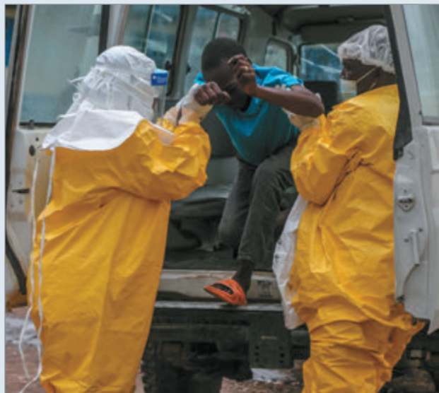
El brote se concentra en zonas atravesadas por conflictos y crisis humanitaria

La Organización Mundial de la Salud elevó este viernes al máximo el nivel de riesgo por el brote de ébola que afecta a República Democrática del Congo, donde la enfermedad continúa expandiéndose en medio de un escenario de violencia y crisis sanitaria.