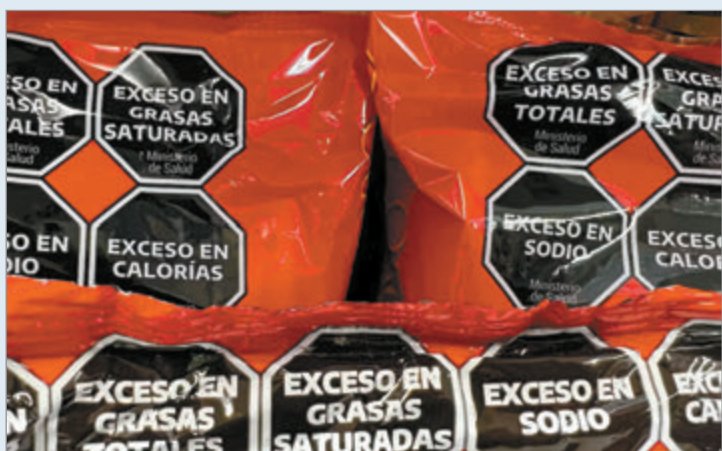
Milei busca derogar la Ley de Etiquetado Frontal