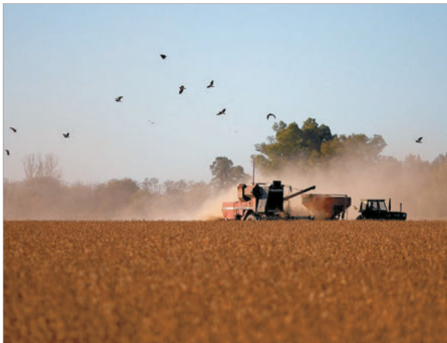
La medida abarca al trigo, cebada, soja y a sectores de la industria

La medida alcanza la cebada, el trigo y la soja, al igual que a la industria automotriz, petroquímica y maquinarias. Hay dudas en el sector empresario