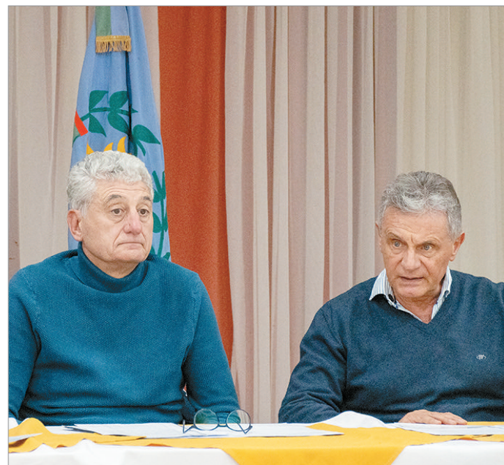
Concejales y dirigentes lanzan un "frazadazo" para frenar el recorte de Milei

La estrategia acordada incluye presentar proyectos de adhesión en los 27 concejos deliberantes y lanzar una junta de firmas para sumar respaldo ciudadano. Los dirigentes remarcaron que la quita afectará a 1,3 millones de bonaerenses y denunciaron que el oficialismo busca desfinanciar a los municipios y trasladar el costo del ajuste a las familias.