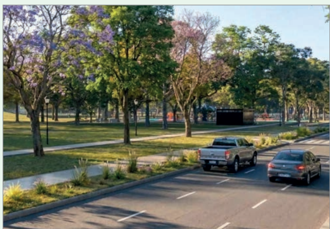
Tras los reclamos, la ciudadan a puede opinar