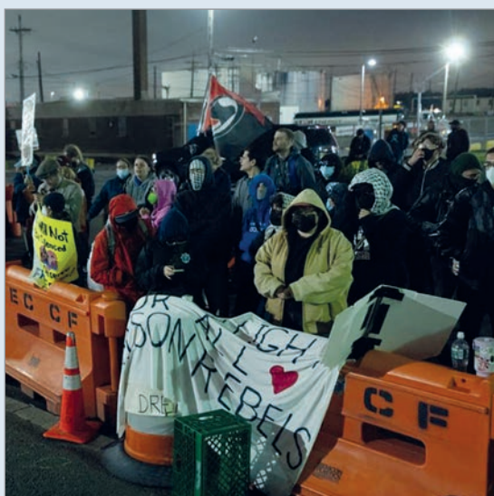
Los detenidos denuncian condiciones insalubres en el Servicio de Control de Inmigración y Aduanas (ICE)

Decenas de inmigrantes detenidos en el centro de detención Delaney Hall, en el estado de Nueva Jersey, continuaron este martes con una huelga de hambre y trabajo que ya lleva cinco días y que volvió a poner en el centro del debate las políticas migratorias de Estados Unidos.