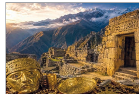
Un hallazgo arqueológico en Perú que causa revuelo internacional

El templo de Ancocagua aparece citado en la Crónica del Perú de Pedro Cieza de León (1553), donde se le menciona como uno de los cinco santuarios más sagrados del mundo inca, aunque su ubicación exacta ha permanecido desconocida hasta la actualidad.