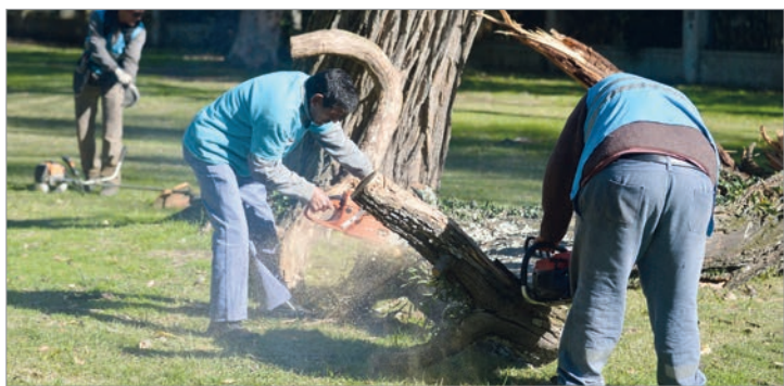
Se intervienen ramas y copas que interfieren con los artefactos de alumbrado público

Según los primeros datos correspondientes al arbolado de alineación en veredas, se registraron más de 50.000 ejemplares pertenecientes a alrededor de 220 especies diferentes, reflejando la notable diversidad y el gran valor ambiental del patrimonio forestal platense.