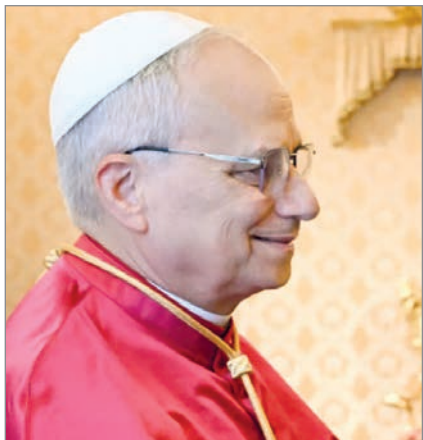
El Presidente aseguró que es muy probable que el Pontífice llegue al país este año

La eventual visita de León XIV no se limitaría a la Argentina. Todo indica que el Pontífice incluirá también a Uruguay y Perú en una gira latinoamericana de fuerte carga pastoral y política. De confirmarse, noviembre marcará un hito histórico para la región.