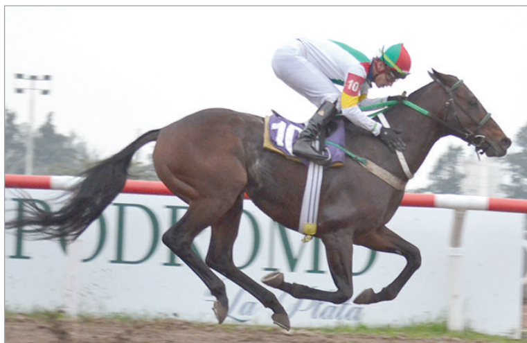
Una verdadera aplanadora. Viniendo desde el fondo Don Ernesto pasó de largo en la recta para alzarse con el Clásico "25 de Mayo de 1810" (G II-1.600 mts.)

Cotejo reservado para todo caballo de 3 años, a peso por edad, ocupó el sexto turno de la programación con diez competidores en pista ya que El Estanciero dejó en blanco su compromiso; y el cierre de las apuestas mostró el rotundo favoritismo de Campo Verde, que prometía un sport de $2.40,