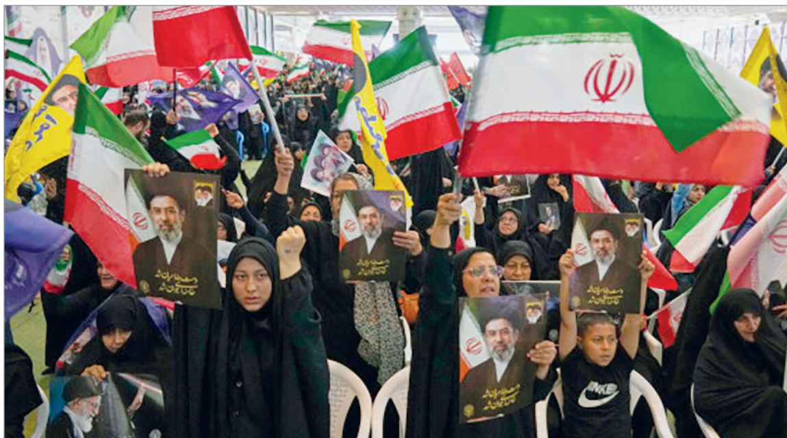
La tensión vuelve a crecer en torno al estrecho de Ormuz y al programa nuclear iraní

La respuesta iraní llegó después de que el Ejército estadounidense confirmara bombardeos en el sur de