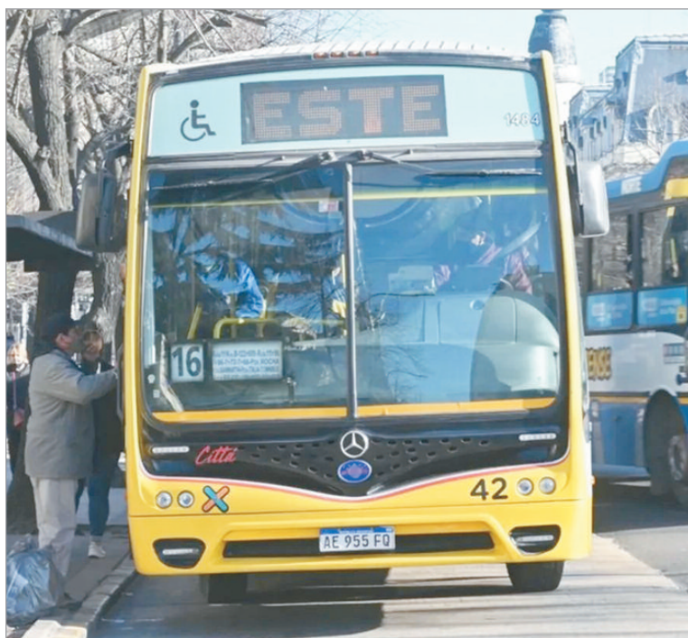
CEPA denunció que el ajuste de Milei encareció brutalmente el transporte en el AMBA

El informe advirtió que el impacto golpeó de lleno el poder adquisitivo de trabajadores y estudiantes. Mientras la inflación acumuló un 303,5% en el período, el Salario Mínimo, Vital y Móvil apenas aumentó 129%. La diferencia entre ingresos y tarifas dejó al transporte como uno de los gastos que más presiona sobre los bolsillos en el AMBA.