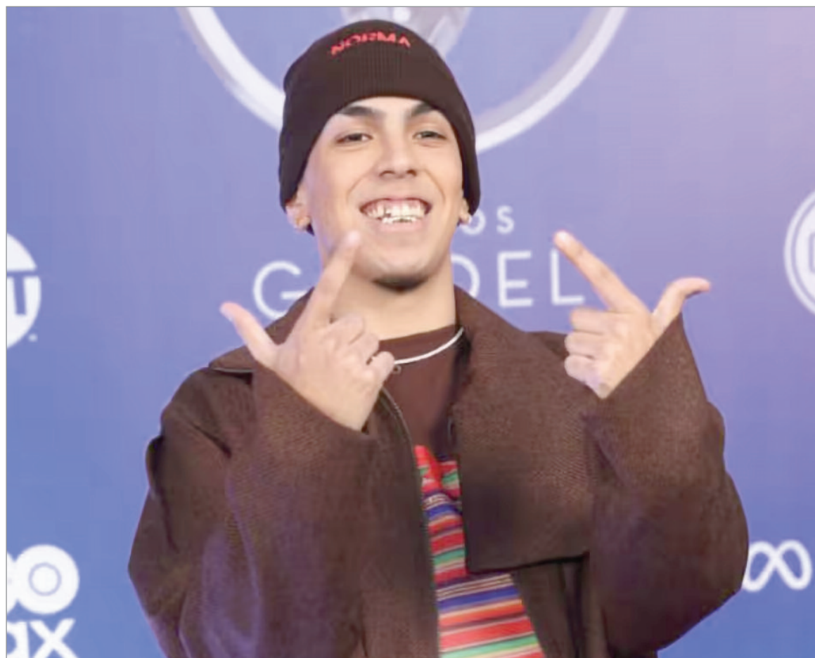
El joven fue el más premiado

Y también se entregaron Mejor álbum de Reggae / Ska ( La respuesta , de Leonchalon); Mejor álbum grupo tropical / cumbia ( El desvelo , de La Delio Valdez); Mejor