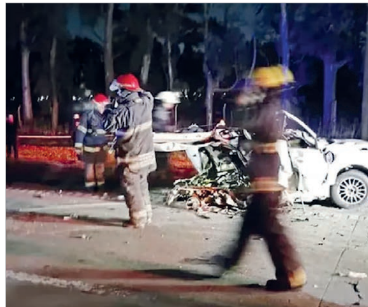
El trágico accidente