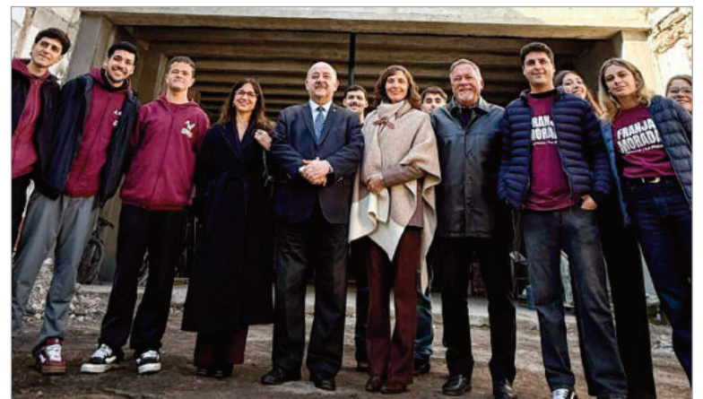
Estará orientado a la formación de grado y posgrado, pero incluirá otra amplia diversidad de usos

Cabe recordar que el Anexo de Derecho es una construcción de 8 pisos y cerca de 2.500 metros cuadrados que permitirá ampliar la oferta de actividades académicas