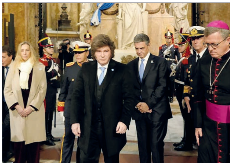
Milei cuestionó el término "terrorismo en redes"