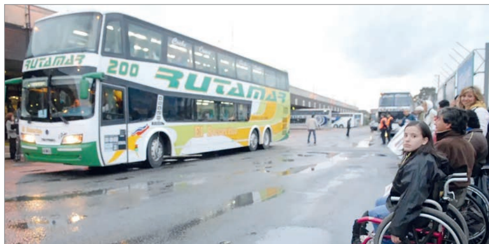
El Estado se desentiende y traslada el peso a las compañías

Hasta el momento, el régimen buscaba garantizar que el derecho a viajar gratuitamente no se transformara en una carga imposible para los operadores. Sin embargo, el Ejecutivo resolvió eliminarlo bajo el argumento de que la “libertad tarifaria” permite incor-