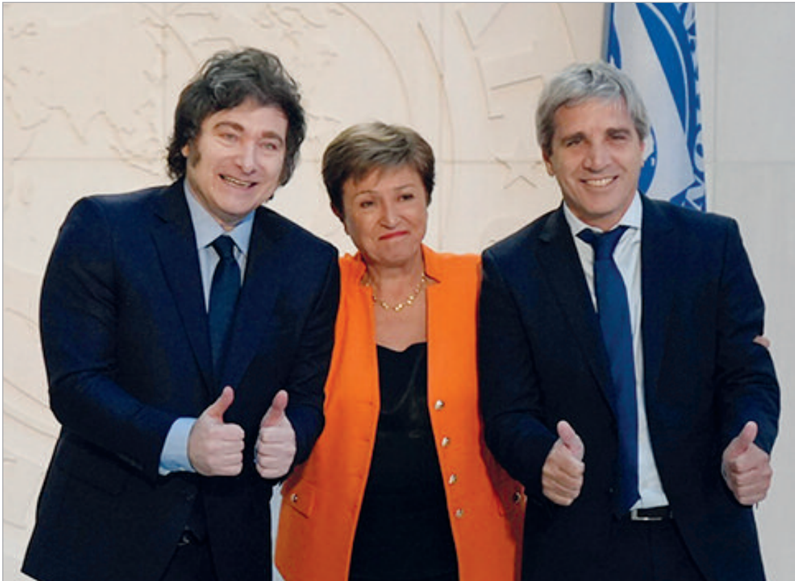
El Gobierno deberá aplicar más ajuste

El organismo multilateral le concedió un alivio fiscal al Gobierno al bajar la meta de superávit primario de junio en $1,6 billones