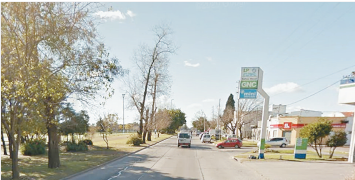
La zona del hecho

Balearon a un chofer en Altos de San Lorenzo después de que se resistiera a un robo en la zona de 72 y 22. Buscan a los responsables