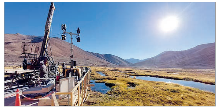
Solo se ejecutaron el 5% de la inversiones anunciadas

El informe también cuestionó el supuesto cambio de paradigma que el Gobierno atribuye al RIGI. “Los datos de la OCDE confirman las dificultades persistentes de la Argentina para atraer inversión productiva de largo plazo, incluso en un contexto donde el gobierno nacional colocó a la llegada de capitales externos como uno de los principales objetivos de su estrategia económica”, señaló el documento.