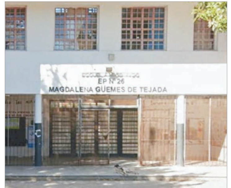
El establecimiento atacado

Los investigadores creen que escaparon por la misma ventana hacia el patio interno, tras saltar el cerco perimetral. Ahora buscan reconstruir sus movimientos con cámaras de seguridad de la zona.