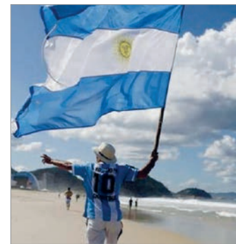
Sigue alta la cantidad de argentinos que viajan al exterior

El Indec publicó las estadísticas del turismo internacional de abril. Aunque se redujo la diferencia entre personas que ingresan al país y argentinos que viajan al exterior respecto a otros meses, el saldo continúa en niveles altos.