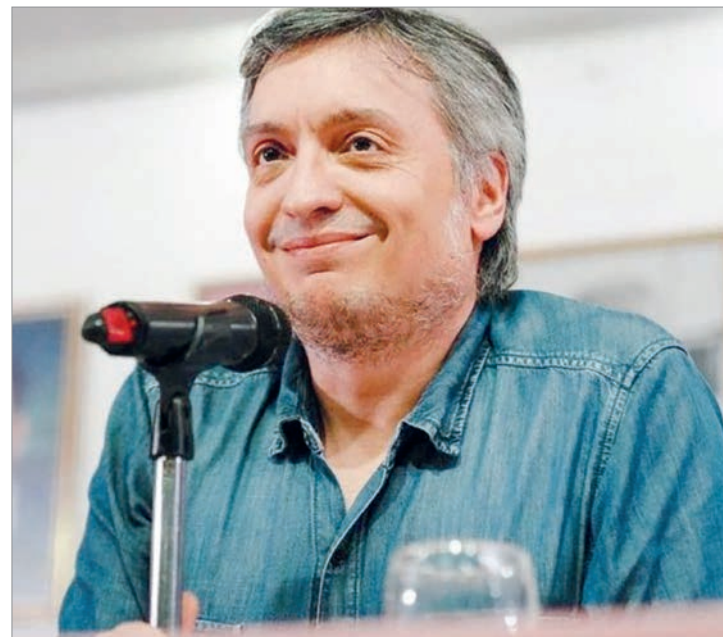
M ximo desaf o a Macri a ser candidato presidencial

"Tenerla presa a ella y extorsionar al actual presidente, no te va a servir Macri", sentenci  el actual diputado nacional de Uni n por la Patria.