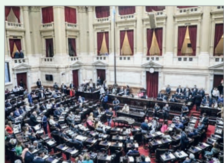
Con retraso, inició la labor legislativa

Durante todo el tiempo que duró la novela de las comisiones en la Cámara alta, desde el