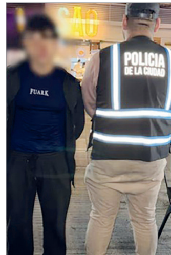
El acusado terminó detenido

El dispositivo se utiliza para administrar fluidos, medicamentos o nutrientes directamente al sistema circulatorio del paciente y era ofrecida a cambio de $850 mil, muy por debajo de su verdadero valor de mercado.