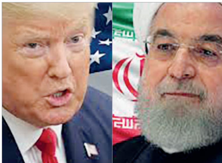
Las declaraciones se producen en medio de versiones sobre un posible acuerdo temporal de 60 días

Teherán cuestionó la continuidad de las presiones estadounidenses y aseguró que Washington no muestra una verdadera voluntad de negociación. La tensión persiste pese a los contactos diplomáticos para extender el alto el fuego