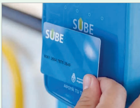
La baja del uso de SUBE continúa, y los usuarios migran a promociones bancarias y pagos QR