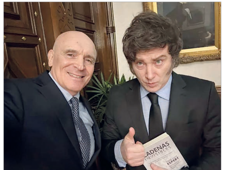
Prueban distintos instrumentos de lavada de dinero

Se trata de un “motoarbolito” de 29 años. Trabaja como delivery, y contó que en reiteradas ocasiones visitó la casa de José Luis Espert en Beccar para retirar dólares y venderlos en el mercado informal a cambio de una comisión.