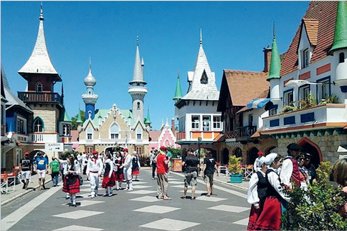
El Pasaje Dardo Rocha ofrecerá el encuentro musical Sintonía Emergente con DJ y VJ en vivo

La agenda incluye talleres, actividades infantiles, recorridos turísticos, ferias y muestras artísticas en distintos espacios culturales de la ciudad