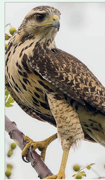
El hecho ocurrió a plena luz del día

Según los especialistas, este tipo de comportamientos puede ocurrir durante la época de reproducción, cuando las aves rapaces se muestran más territoriales y buscan proteger sus nidos o crías ante la presencia de personas que consideran una amenaza.