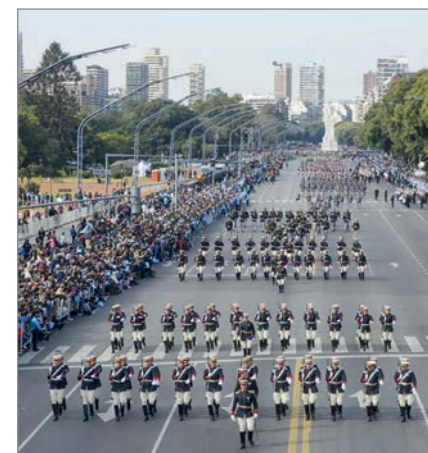
El ajuste alcanza a la tradición militar

En tanto, en las fuerzas armadas señalan que no están dadas las condiciones presupuestarias ni el clima interno para avanzar con un despliegue de gran escala.