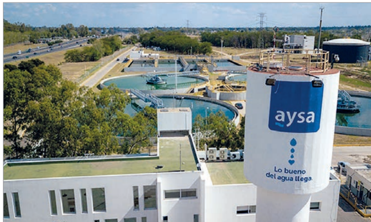
El Ejecutivo nacional insiste en transferir un servicio esencial a privados

El ministro Luis Caputo lanzó la compulsa internacional para vender el 90% de la empresa de agua y cloacas al sector privado