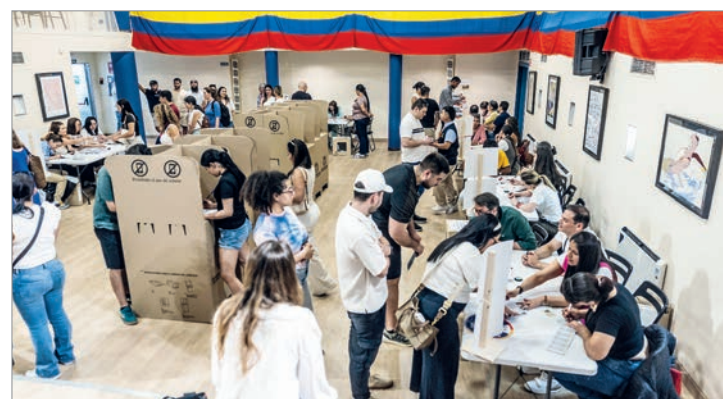
Más de una decena de aspirantes compiten por llegar a la Casa de Nariño

Si ningún candidato supera el umbral necesario para imponerse en primera vuelta, los dos más votados volverán a enfrentarse en un balotaje que definirá al próximo presidente de Colombia.