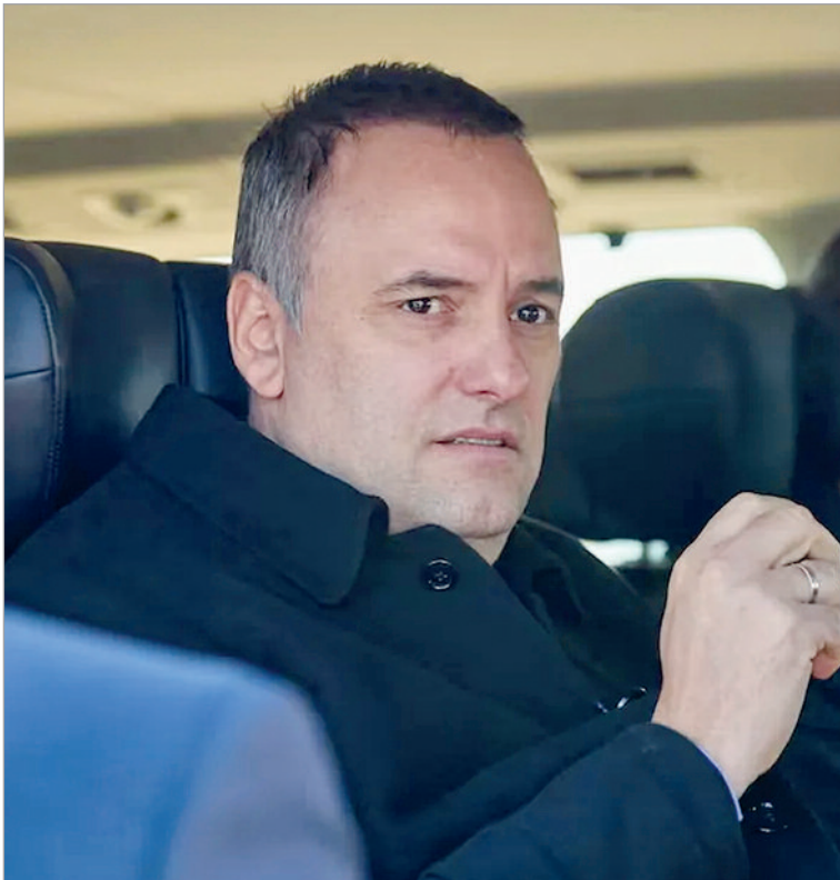
Nuevo capítulo en el escándalo de los Adorni

referencia pública al conflicto a través de un mensaje en redes sociales. “A los políticos: en 2002 murió mi papá y heredé su casa. Ahí me enteré sobre una hipoteca impaga desde 1996. Tardé años en arreglar todo, con mucho esfuerzo”, escribió.