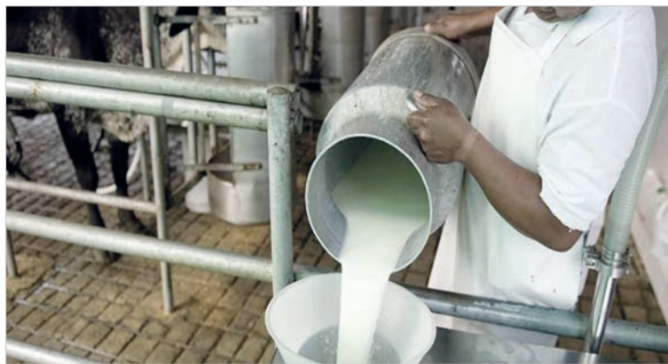
Especialistas advierten por cambios en el consumo

Al mismo tiempo, las familias modificaron sus elecciones por motivos estrictamente presupuestarios: las leches no refrigeradas (larga vida) ganan participación de mercado en detrimento