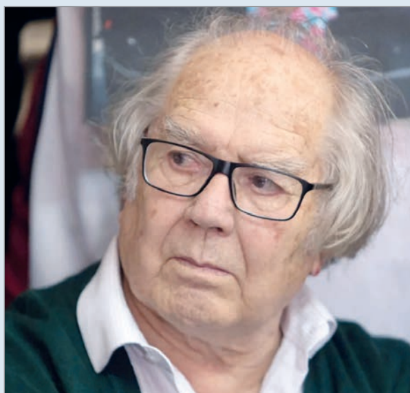
Organizan jornadas sociales de protesta contra el gobierno

El Premio Nobel de la Paz, Adolfo Pérez Esquivel, y la Mesa Ecueménica por la democracia, la vida y el bien común convocaron a una protesta en Plaza de Mayo contra el gobierno de Javier Milei. El título de la jornada es “Ayuno y oración para despertar las conciencias”, que se extenderá desde el próximo martes 2 hasta el 9 de junio.