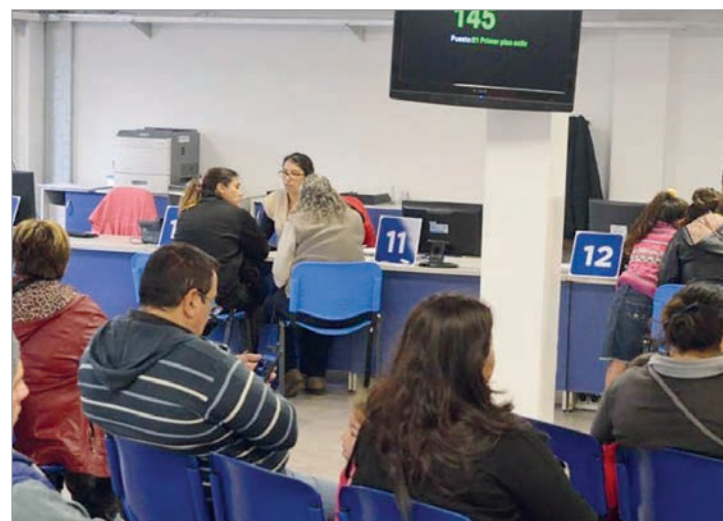
La dotación nacional cayó 6,1% interanual y mostró retrocesos en todas las estructuras administrativas.

El dato confirma que la tendencia de recorte en el sector estatal se profundizó en abril, consolidando un escenario de menor dinamismo en la gestión pública y en las empresas vinculadas al Estado.