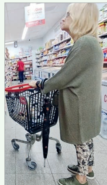
Las ventas en supermercados en su peor momento

“El consumo no solo mide bienestar: es el principal motor de la demanda. Con ingresos deteriorados, sigue en caída y no hay reactivación posible”, sentenció López.