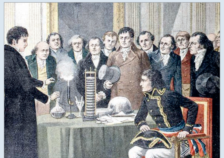
Desarrolló la pila voltaica y sentó las bases de la electroquímica moderna

La importancia de Alessandro Volta es tan grande que la unidad utilizada para medir el voltaje eléctrico lleva su nombre: el voltio. Ese homenaje refleja la influencia de un científico que cambió para siempre la relación de la humanidad con la electricidad. Su legado sigue presente en cada dispositivo eléctrico que forma parte de la vida cotidiana, desde una simple linterna hasta los sistemas tecnológicos más avanzados del mundo actual.