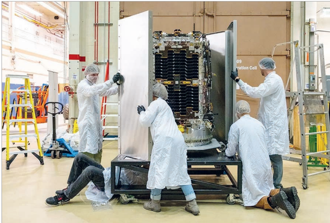
La misión representa un desafío tecnológico sin precedentes.

Una nave privada intentará localizar y elevar la órbita del observatorio Swift, que está perdiendo altura debido al arrastre atmosférico. Sería la primera operación de este tipo realizada sobre un satélite científico en funcionamiento