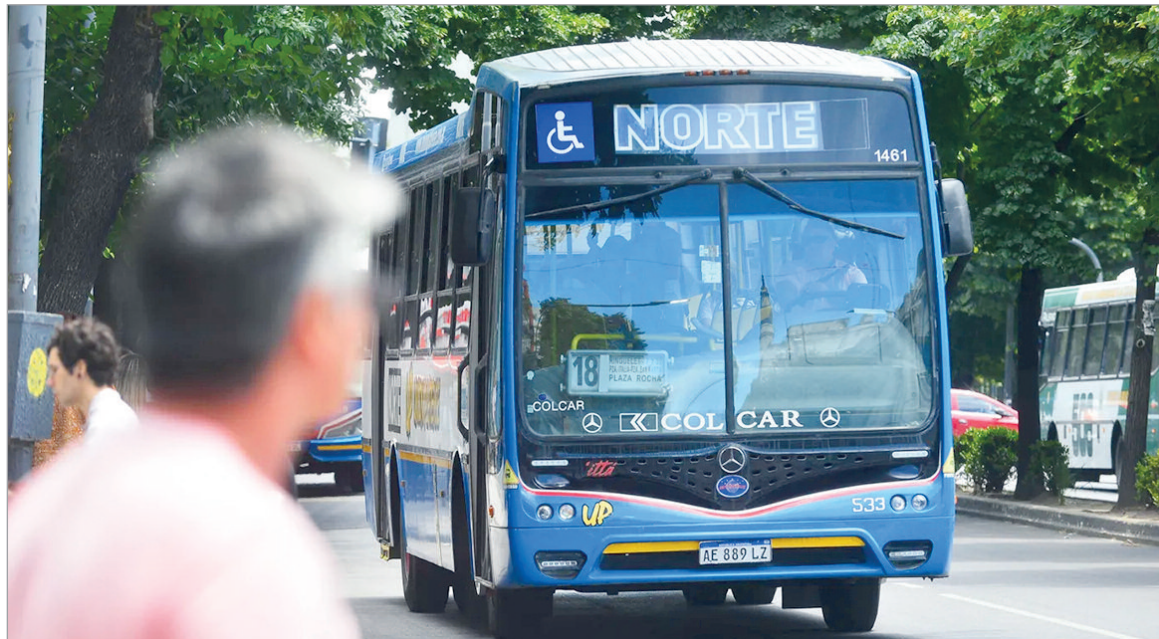
La Provincia creó un nuevo régimen de subsidios

La Provincia avanzó en la creación de un régimen propio de compensaciones tarifarias para el transporte público automotor del AMBA