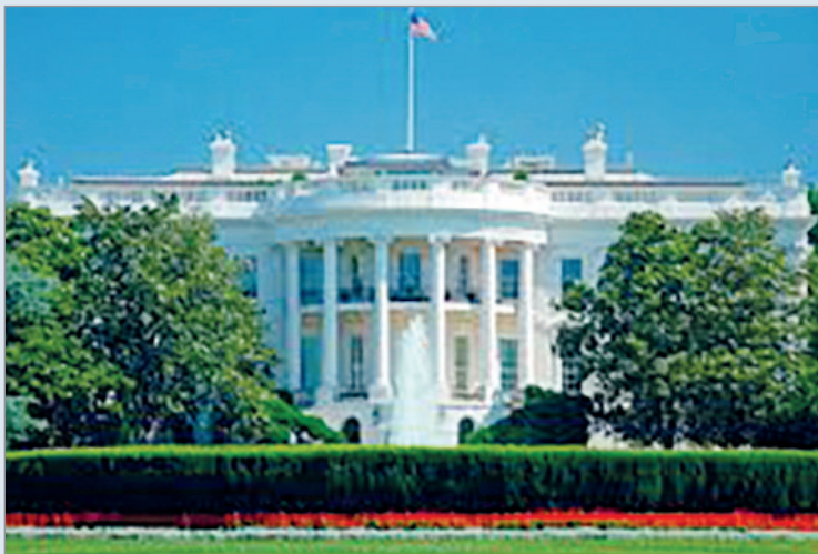
El conflicto se extendió más de lo previsto por Washington y hoy en día es un dolor de cabeza

En este contexto, Washington busca mantener abiertos los canales diplomáticos mientras intenta evitar una nueva escalada militar en Medio Oriente, en un escenario marcado por la fragilidad de las treguas vigentes y las persistentes tensiones entre los distintos actores de la región.