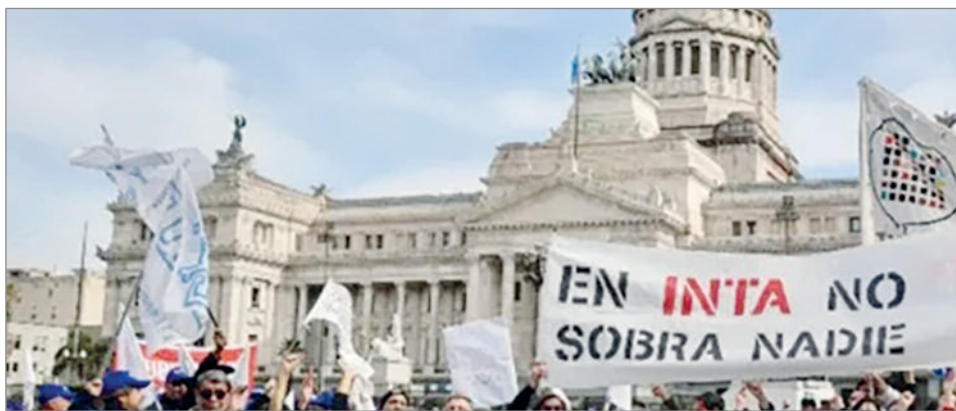
ATE celebró la medida y advirtió que seguirá confrontando al Gobierno en todos los planos

El fallo del Juzgado Federal de San Martín ordenó suspender la resolución que habilitaba cesantías y recortes en el organismo agropecuario