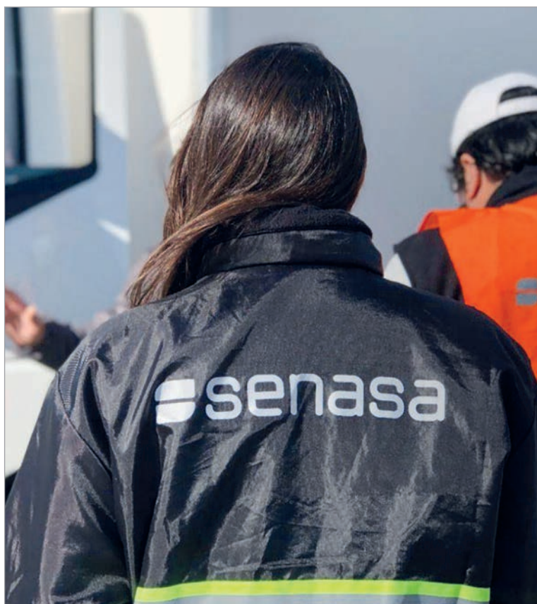
Nueva desregulación en el control alimentario

La resolución deroga artículos específicos del Capítulo XIV del Reglamento aprobado por el Decreto N° 4.238 en 1968, una normativa que sirvió de base para la sanidad alimentaria del país durante décadas. Por un lado, se elimina la obligación de utilizar sustancias específicas que permitían identificar y rastrear la composición de las grasas. Por otra parte, se levanta la restricción que impe-