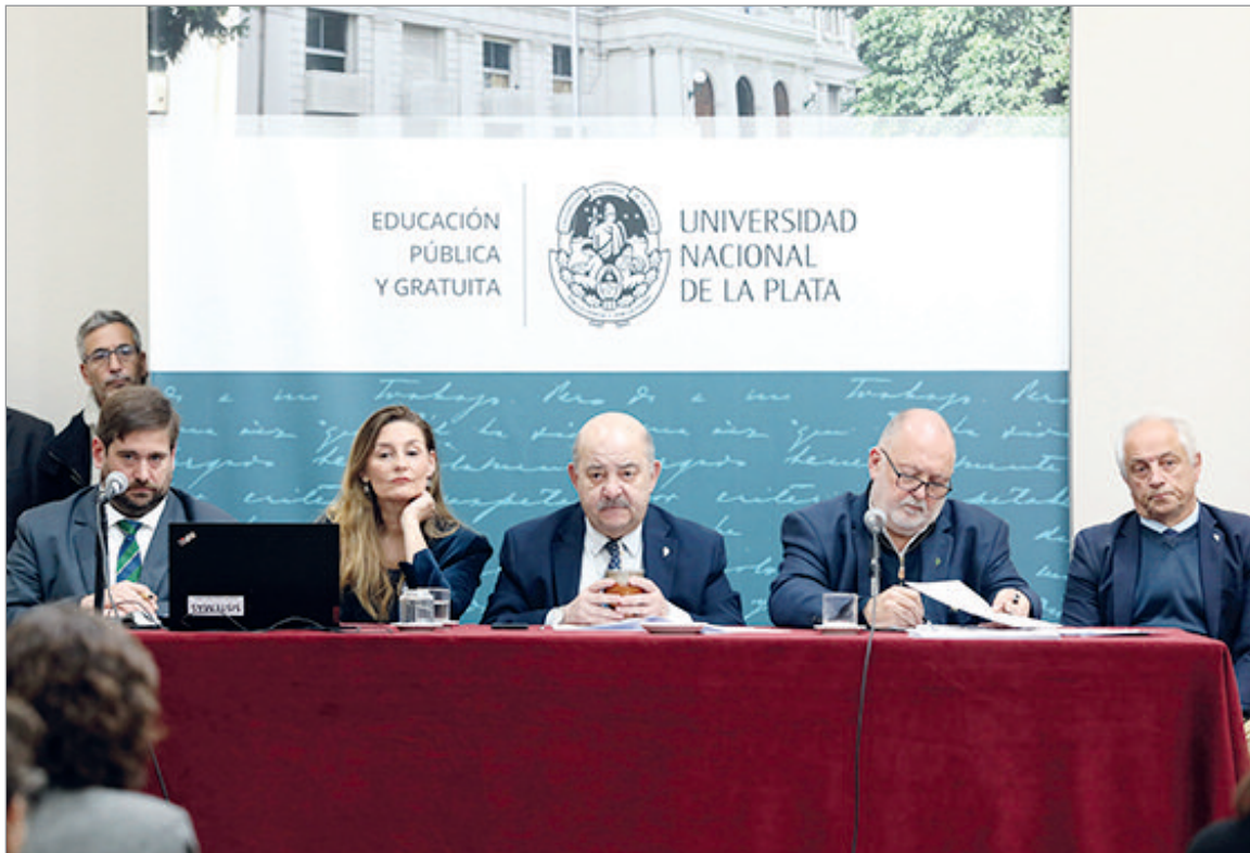
Integrarán la nueva estructura del gabinete durante los próximos cuatro años