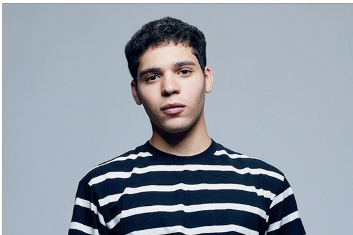
Protagonizó varias ficciones y series