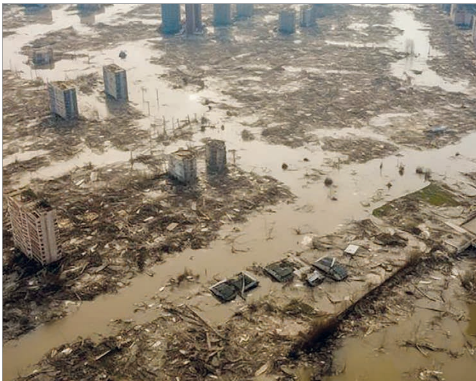
El último episodio de El Niño estuvo entre los cinco más intensos de la historia reciente

Según las proyecciones difundidas por la entidad, el fenómeno podría instalarse entre junio y agosto y mantenerse activo al menos hasta noviembre. Los especialistas también consideran elevada la posibilidad de que alcance una intensidad fuerte, con impactos significativos sobre las precipitaciones, las temperaturas y las condiciones climáticas glo-