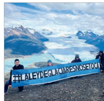
Revés a favor de la reforma de la Ley de Glaciares

Desde la Procuración del Tesoro nacional celebraron la decisión judicial, considerándola un respaldo explícito al “modelo argentino de federalismo de concertación ambiental”.