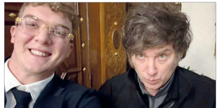
Solicitan que se garantice el presupuesto a la Ufeci

“Tal limitación afectaría el cumplimiento de medidas de prueba orientadas a reconstruir el recorrido de los fondos y analizar las billeteras virtuales involucradas, comprometiendo el avance de una investigación de evidente trascendencia institucional”, señalaron los diputados en el escrito. En consecuencia, sostuvieron que la creciente complejidad de los delitos vinculados a criptoactivos exige que el Ministerio Público Fiscal a su cargo cuente con los recursos técnicos adecuados para el cumplimiento de sus funciones.