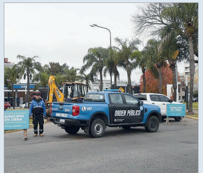
Los trabajos durarán una semana

Por este motivo, se recomienda a quienes transiten por la zona hacerlo con precaución, respetar la señalización preventiva y considerar vías alternativas en los horarios de mayor tráfico.