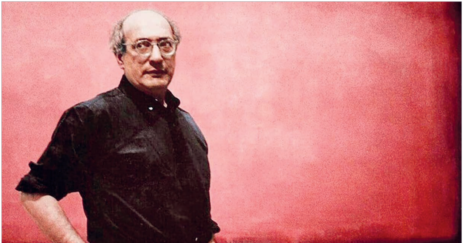
El pintor Mark Rothko, junto a una de sus pinturas

El verdadero nombre de Rothko era Marcus Rothkowitz. Había nacido en Rusia en 1903, pero emigró con su familia a Portland a los diez años. Judío, pobre e izquierdista (“A los trece años vez fui a escuchar a Emma Goldman y me cautivó su ingenua y vibrante visión del mundo”), logró ingresar en Yale con una beca para estudiar Economía, pero abandonó los estudios para sumarse a una compañía itinerante de teatro (“Creo que perdí la fe en la idea del progreso y la reforma a la par que mis amigos, en los paralizantes años de Coolidge y