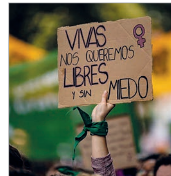
Senadores bonaerenses reclaman medidas urgentes frente al recrudescimiento de la violencia de género