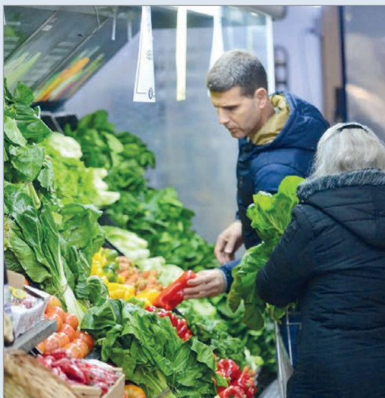
Transporte y alimentos empujaron la suba

El Índice de Precios Básicos (IPB) de La Plata registró una suba del 2,2% durante mayo y mantuvo la misma tendencia observada en abril. Con este resultado, la inflación acumulada en los primeros cinco meses del año alcanzó el 15,9%, mientras que la variación interanual llegó al 34,2%.