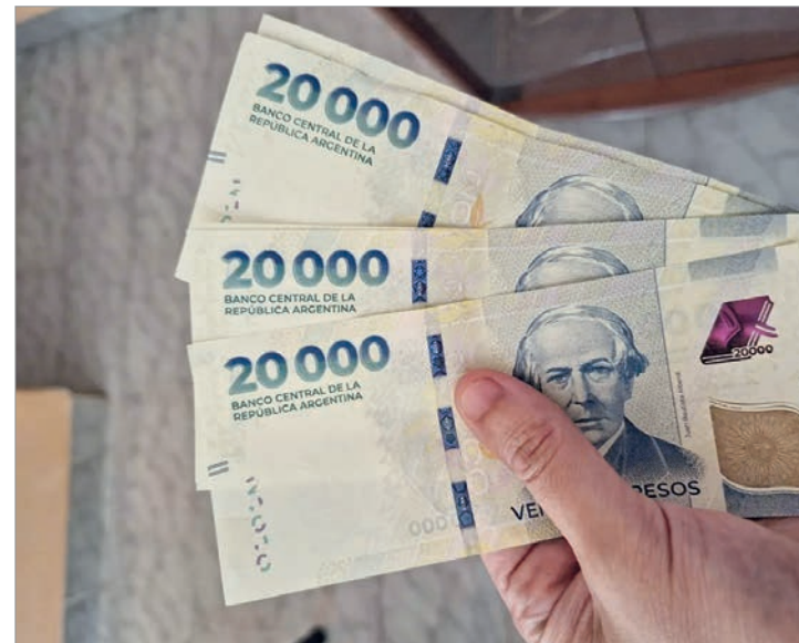
El consumo suma indicadores en contra

Se trata de un nuevo dato que desmiente el discurso de Javier Milei, que asegura que Argentina está viviendo un repunte del consumo.