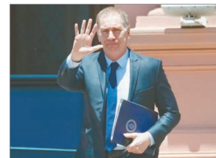
El funcionario defendió el proyecto y aseguró que la sociedad rechaza tantas instancias electorales.

Con este marco, el funcionario mantiene diálogos con gobernadores para lograr consenso y confía en que el proyecto se discuta entre junio y julio. La reforma busca reducir gastos, simplificar el calendario electoral y consolidar el rumbo político del oficialismo.