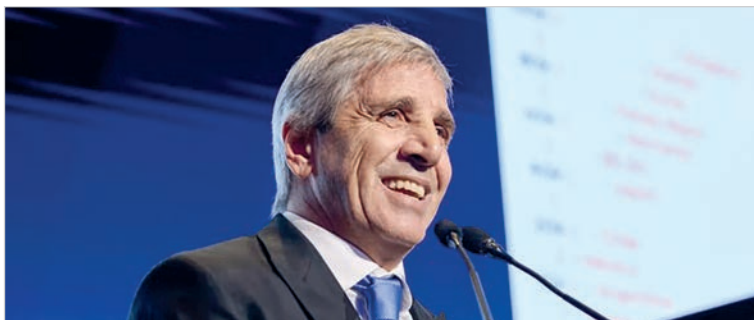
El ministro de Economía atacó al gobernador bonaerense y prometió que La Libertad Avanza ganará en 2027

Caputo insistió en que el kirchnerismo es “el infierno” y que no representa una opción para el futuro del país. Incluso apeló a referencias culturales para reforzar su idea de que “lo viejo no funciona”, y que la socie-