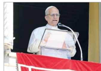
Legisladores bonaerenses piden reconocer Magnífica Humanitas, el texto del Papa sobre inteligencia artificial

En su presentación, la dirigente resaltó las reflexiones del Papa sobre empleo, cohesión social y control digital, y concluyó que el mensaje adquiere especial vigencia en América Latina, donde la desigualdad y la exclusión demandan respuestas políticas y culturales que fortalezcan la cohesión social y el compromiso colectivo.