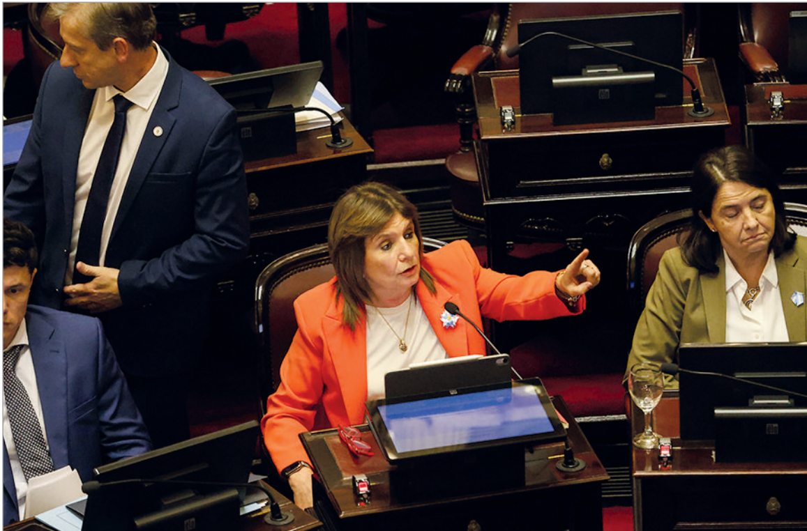
Bullrich consiguió apoyos de sectores opositores

La senadora profundiza su diferencia luego de informar que no acompañará un pedido del Presidente respecto a un pliego judicial