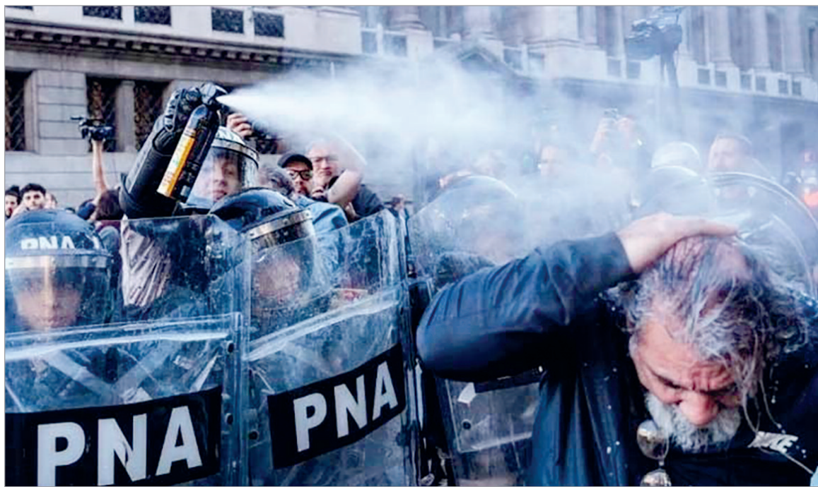
El relevamiento alertó que los derechos no están garantizados en el país

Un informe de la CSI ubicó al país en el nivel más crítico y denunció abusos sistemáticos bajo la gestión de Javier Milei