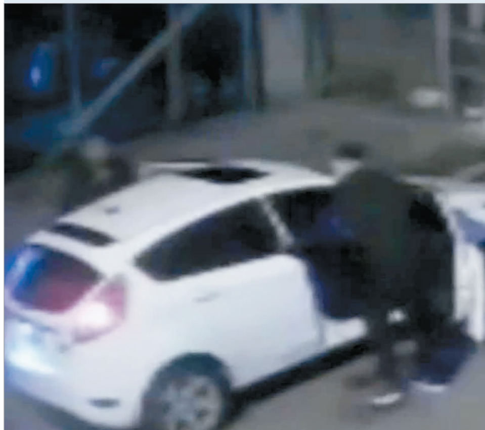
El momento del ataque

Cuatro delincuentes lo abordaron cuando fue a buscar a un pasajero y la mataron a balazos