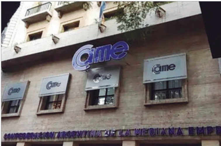
El pedido busca preservar el entramado productivo en crisis

La entidad solicitó que, en caso de que el contribuyente regularice la obli-