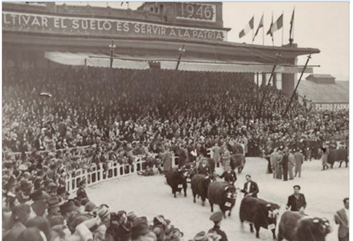
En América Latina, el término "oligarquía" tiene una larga historia

Entre Domingo Faustino Sarmiento y Juan Sasturain se puede componer un retrato del grupo más privilegiado de nuestro país