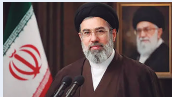
Teherán insiste en que el desafío ahora es preservar la resiliencia social

Las declaraciones se producen mientras continúan las conversaciones entre Teherán y Washington para consolidar una tregua y avanzar en discusiones sobre el programa nuclear iraní. El presidente estadounidense, Donald Trump, afirmó esta semana que un acuerdo podría cerrarse "durante el fin de semana" y reconoció públicamente el peso político de Jamenei en las negociaciones.