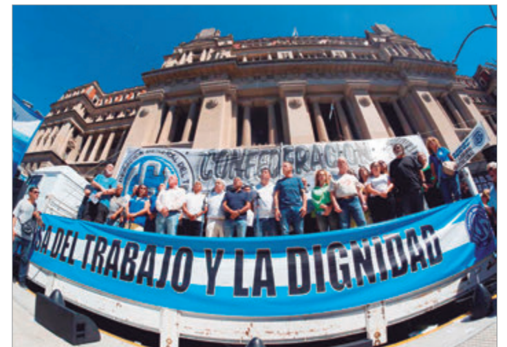
La central obrera cuestionó en Ginebra el decreto 407 y acusó al Gobierno de incumplir normas internacionales

El reclamo se produce pocos días después de que el Gobierno reglamentara aspectos centrales de la reforma mediante el decreto 407, publicado en el Boletín Oficial. El texto fija el alcance de artículos vinculados con la registración del empleo, los recibos de sueldo, las licencias médicas, las desvinculaciones laborales y los trámites jubilatorios. Para la CGT, se trata de un avance regresivo que desconoce convenios internacionales y busca disciplinar a los trabajadores.