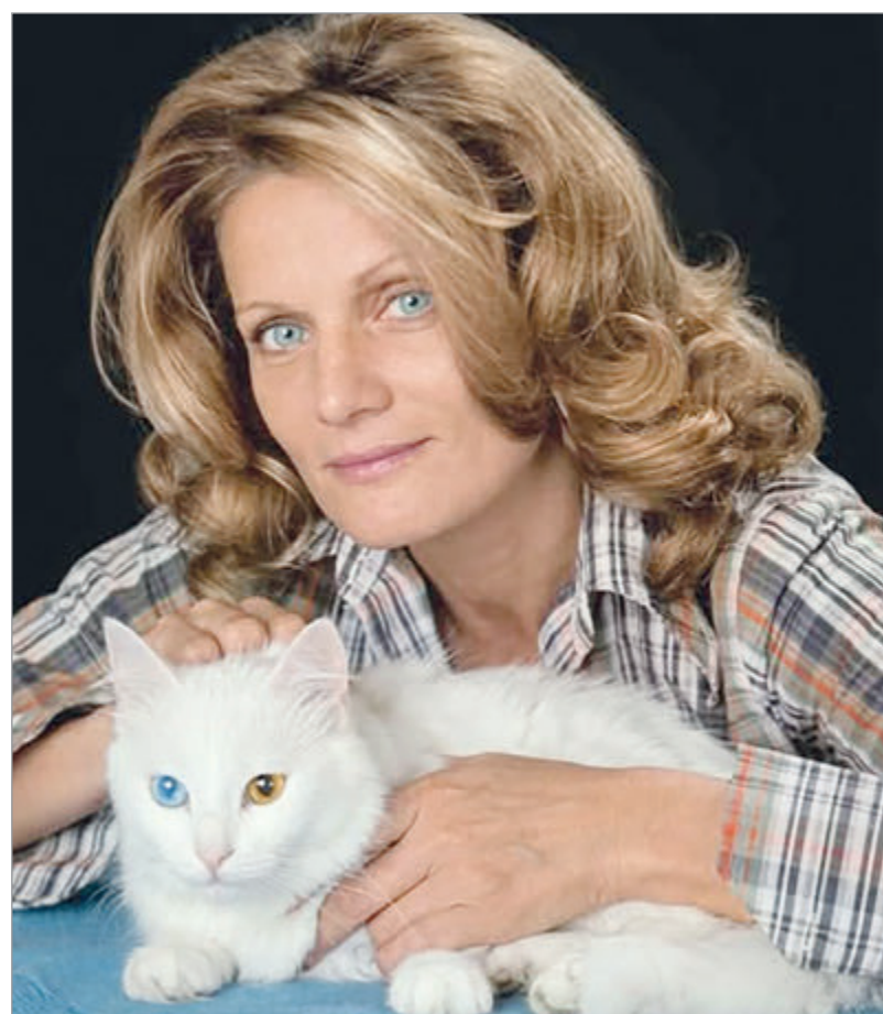
Una de sus producciones publicitarias

E lba Chunchuna Villafaña, conocida por todos simplemente como “Chunchuna”, falleció a los 92 años en Buenos Aires. La noticia la comunicó su hija Juana Molina quien, mediante su cuenta de Instagram , dio a conocer la información y le dedicó un texto emotivo para despedir a su madre. Hacía tiempo que la actriz y cantante había informado del estado de salud complicado de su madre. Escribió “queridos amigos, murió mi querida mamita. Era algo que esperaba y temía. Sucedió esta madrugada. Es un cóctel de sensaciones. Cuando volví a su casa y vi su cama vacía, me di cuenta de que la voy a extrañar mucho. Esa ausencia inmensa”, y agregó “ir a su casa a conversar era algo que hacía muy a menudo y sería incapaz de recordar alguna de esas conversaciones que duraban horas. No sé de qué hablábamos, pero hablábamos mucho”. Villafaña fue actriz, modelo y arquitecta con una extensa trayectoria en los medios y una belleza y porte distinguidos y se destacó también, además del arte, por su compromiso político con el pero-