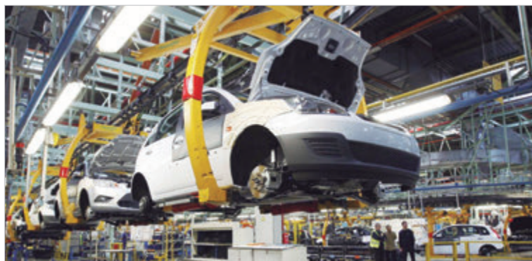
Estrepitosa caída de la producción automotriz