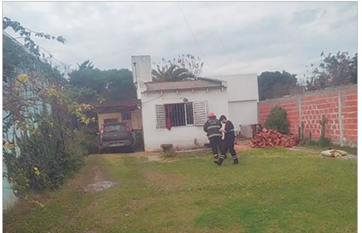
El lugar del hecho

Mientras tanto, personal especializado realizó las primeras tareas de inspección para establecer con precisión el origen del incendio y deter-