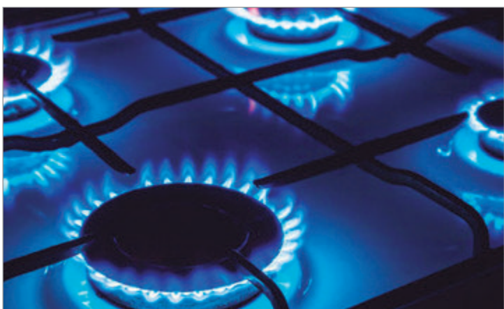
Las nuevas tarifas impactan en usuarios de todo el país y buscan readecuar costos en medio de la emergencia energética vigente