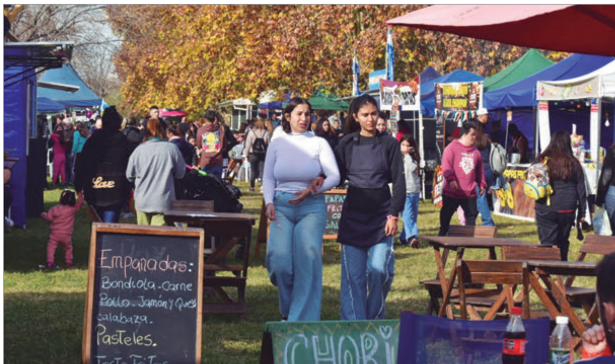
Se desarrollará un gran festival artístico y una feria de emprendedores

La jornada, que se desarrollará mañana, ofrecerá espectáculos musicales, presentaciones de danza y propuestas para toda la familia