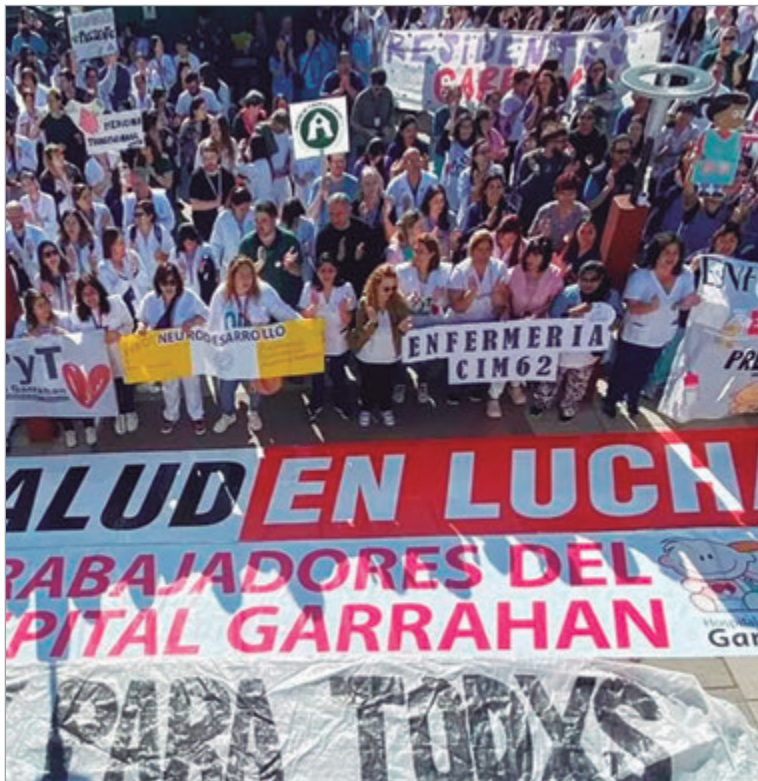
Trabajadores denunciaron que el spot oficial es una provocación y un intento de manipulación

El video omite que las mejoras salariales surgieron de la presión gremial y no de la voluntad oficial. "No pudieron juntar a un solo trabajador de a pie para reivindicar su versión", denunciaron los profesionales. También remarcaron que el Gobierno no mostró a ninguna familia de pacientes, un dato contundente sobre el aislamiento de la gestión. Para los gremios, se trata de