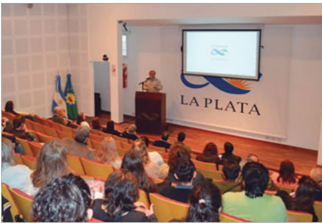
La actividad contó con una nutrida concurrencia