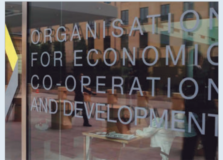
El organismo prevé un alza del PBI de 2,8% y alerta por inflación y riesgos en la confianza económica

El informe económico concluye que profundizar las reformas es clave para sostener la recuperación y evitar que la economía vuelva a quedar atrapada en ciclos de inestabilidad.