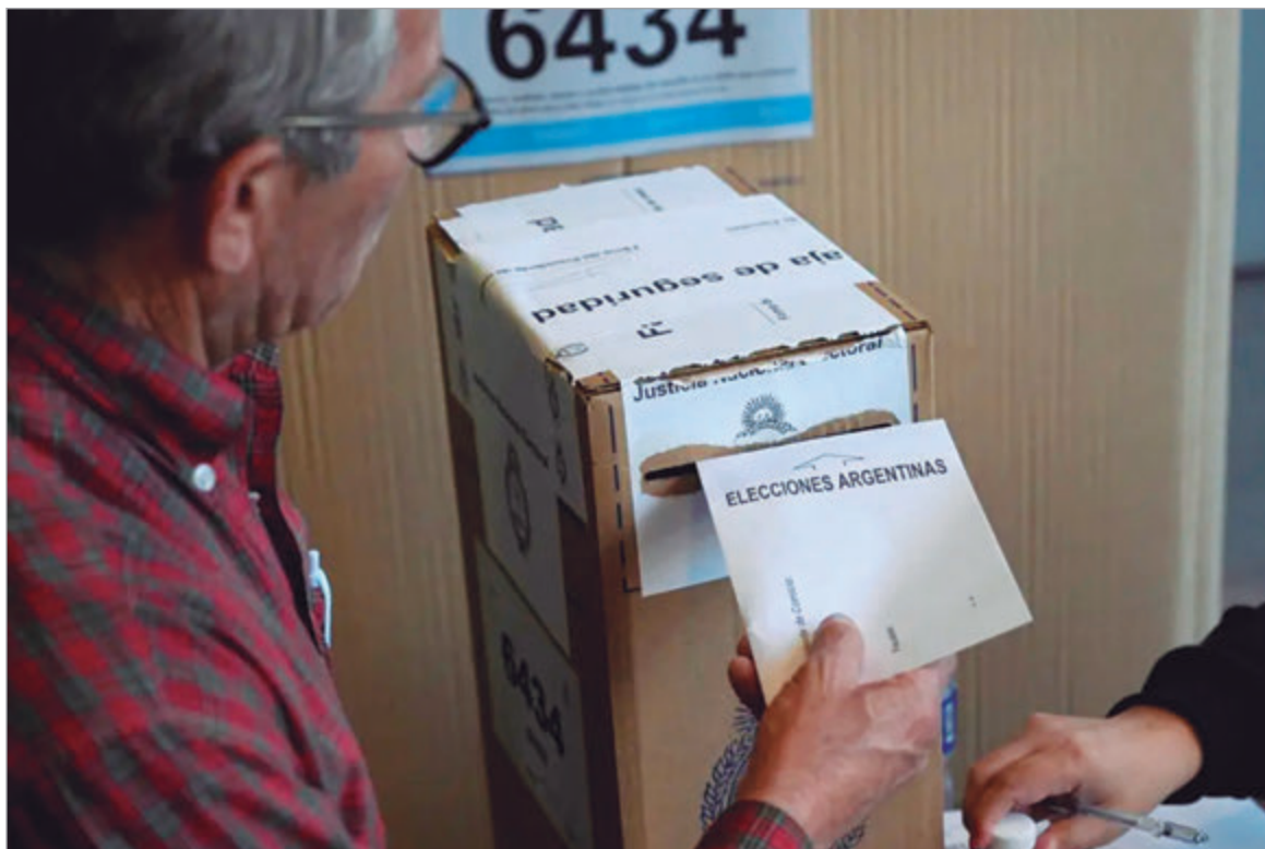
Se viene el debate por la reforma electoral

El gobierno de Kicillof impulsa el proyecto de reelecciones indefinidas. También se tratará el desdoblamiento electoral y las PASO