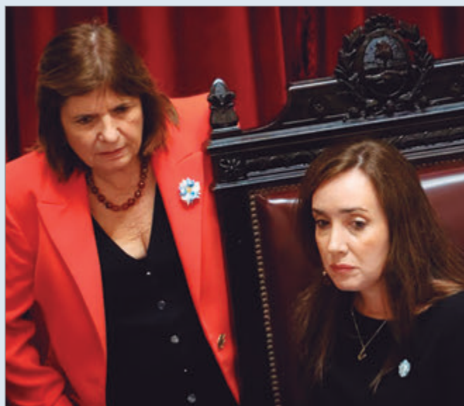
La Cámara alta avaló la designación pese al pedido presidencial de retirar la postulación de la jueza