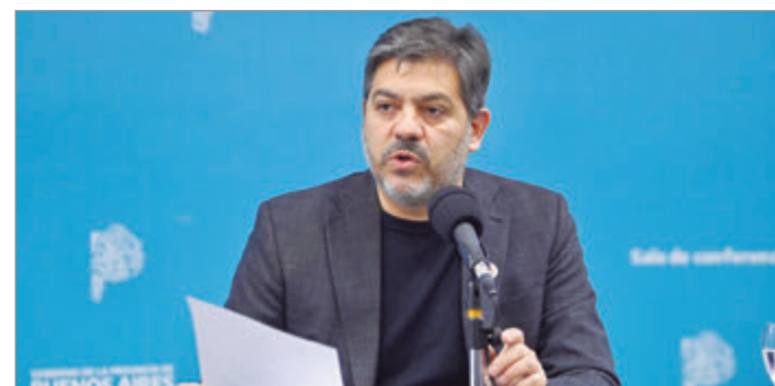
La “subordinación” a Trump no evitó la suba de aranceles

“EE. UU. está buscando recomponer sus esquemas de protección industrial (todo lo contrario a lo que hace Milei) después de un fallo adverso de su Corte Suprema contra la fijación de aranceles recíprocos”, detalló el ministro. Al mismo tiempo, informó que Argentina es alcanzada por la suba arancelaria. “Ni para esto sirve el Ministerio de Relaciones Carnales”, apuntó.