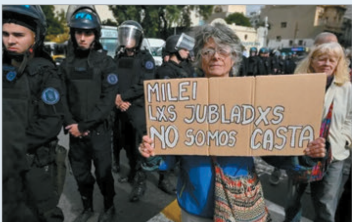
El FMI confirmó que Milei avanzará sobre las jubilaciones