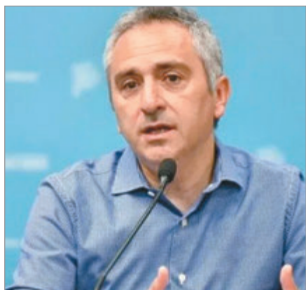
La medida busca recomponer valores frente a la inflación y alcanza a programas de niñez y adolescencia.

El Ministerio de Desarrollo de la Comunidad de la provincia de Buenos Aires aprobó una actualización de los montos de las becas destinadas a programas de inclusión y acompañamiento de niños, niñas y adolescentes.