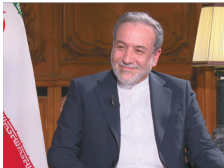
Las declaraciones se producen en medio de una tregua frágil

Las autoridades iraníes insisten en que el equilibrio regional cambió tras el conflicto y sostienen que “el enemigo se verá obligado a aceptar las nuevas reglas que Irán ha impuesto en el terreno.”