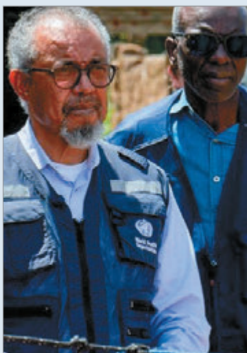
La cepa Bundibugyo, responsable del actual brote, genera preocupación

La preocupación internacional se centra en la cepa Bundibugyo del virus, considerada poco frecuente. De acuerdo con los CDC África, el brote actual ya supera en magnitud a los registrados en 2007 y 2012, lo que refuerza la necesidad de una respuesta coordinada para evitar una mayor expansión de la enfermedad en la región.