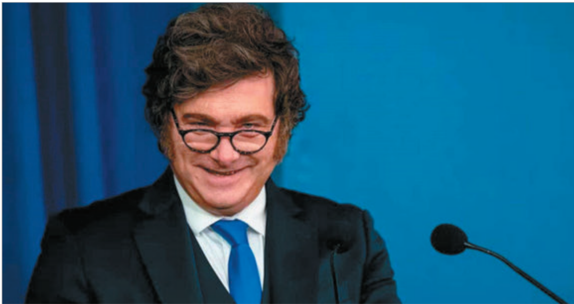
El Gobierno nacional entrega PBI al mercado y vacía al Estado

La creación del FAL desvía ingresos públicos y reduce la recaudación, consolidando un modelo que privilegia la especulación financiera