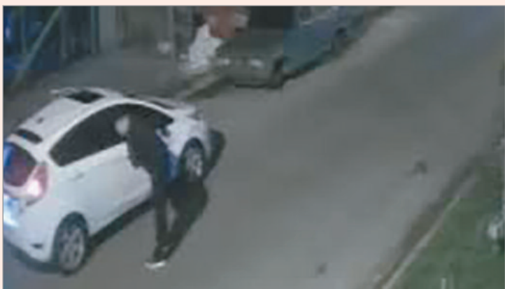
Una cámara registró el hecho