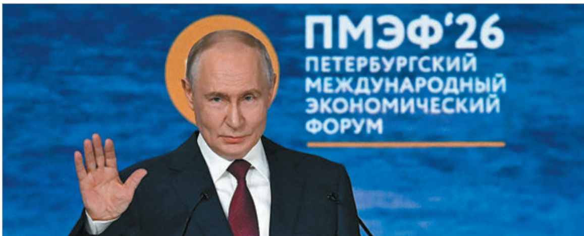
El mandatario realizó las declaraciones durante el Foro Económico Internacional de San Petersburgo

El presidente ruso consideró que un encuentro cara a cara con su par ucraniano solo tendría sentido una vez que los equipos negociadores alcancen acuerdos sustanciales