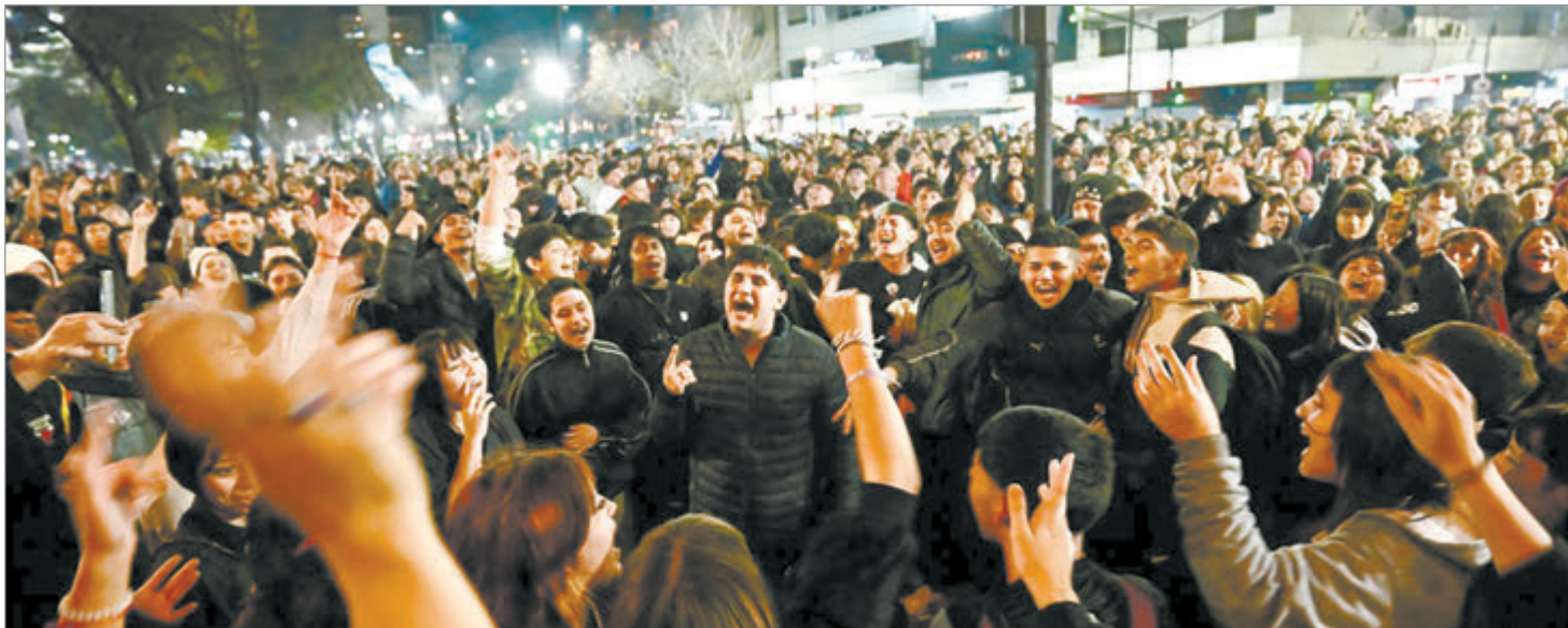
En el corazón de La Plata, los ricoteros despidieron al Indio Solari al ritmo de los Redondos

La banda ensayó en la ciudad durante sus primeros años, y supo llegar a gran parte del público universitario platense. Los primeros conciertos