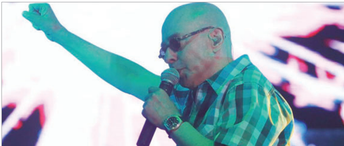
Con emoción, el arco político despidió al ícono popular.

El gobernador bonaerense Axel Kicillof se mostró visiblemente afectado durante la apertura del Congreso “Para la Igualdad” en la Universidad Nacional de La Plata. Con voz quebrada, calificó al artista como “un héroe argentino” y sintetizó su legado en tres banderas: la de la verdadera libertad, la de la alegría y la del futuro, proyectando su obra hacia las nuevas generaciones.