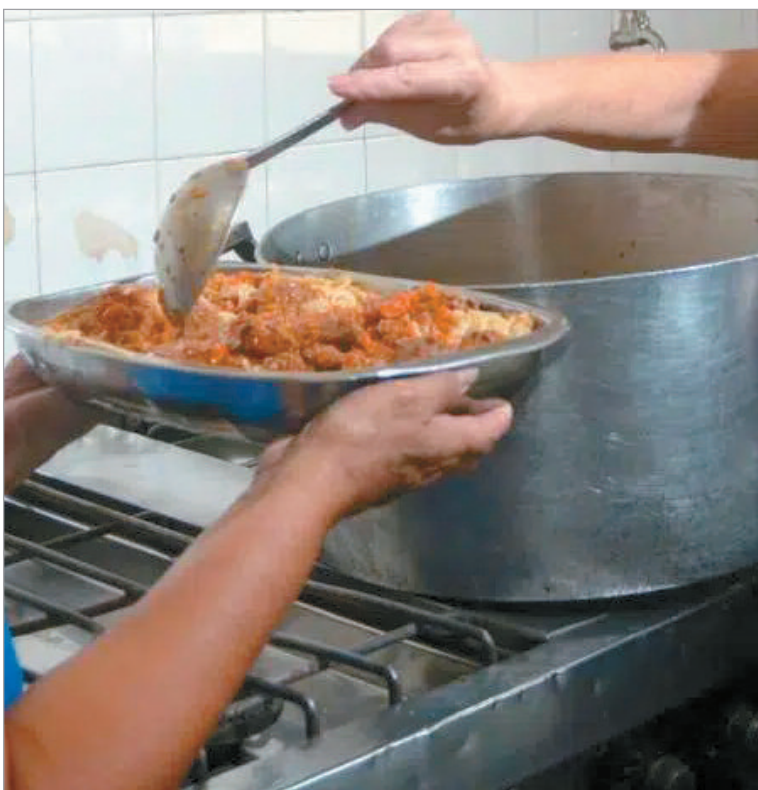
El ajuste golpea hogares que se endeudan para sobrevivir.

El relevamiento muestra que el endeudamiento ya no está vinculado a bienes o mejoras para el hogar, sino a la necesidad de garantizar la comida diaria. Más del 50% de las familias bonaerenses reconoció que debe recurrir a créditos o préstamos para poder alimentarse. A su vez, el 43% admitió que las deudas afectan directamente la posibilidad de comprar todos los alimentos necesarios, lo que obliga a resignar parte de la dieta cotidiana.