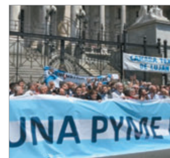
Entidades presionan por planes de pago largos y suspensión de medidas cautelares.

Las pequeñas y medianas empresas intensificaron su reclamo al Ministerio de Economía para que la Agencia de Recaudación y Control Aduanero (ARCA) habilite planes de pago extensos y suspenda embargos que complican la operatoria diaria.