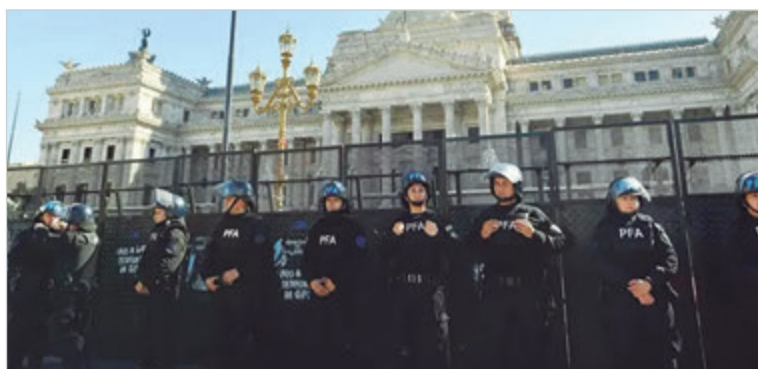
Martín Menem afirmó que el Palacio Legislativo no tiene condiciones de seguridad ni logística necesarias

En paralelo, los allegados al cantante difundieron un comunicado: “La despedida del Indio tendrá lugar el