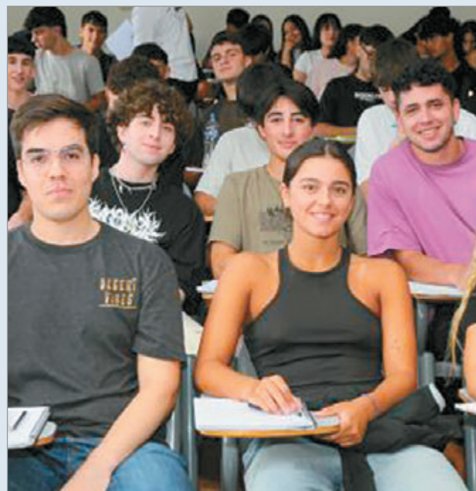
El proceso de inscripción se realizará de manera online

A partir del próximo lunes la UTN Facultad Regional La Plata habilitará el período de inscripción para aquellos aspirantes que deseen realizar el Seminario Universitario bajo la modalidad extensiva. La cursada comenzará en la primera semana de agosto y se dictará de forma presencial y semipresencial. Con el objetivo de brindar una transición acompañada y flexible hacia la vida universitaria, la Facultad lanza esta nueva convocatoria pensada especialmente para quienes deseen anticipar el ingreso con una carga horaria semanal menor que la modalidad intensiva de febrero, compatible con otras actividades personales. Las materias que se cursan son matemáticas y estrategias para el aprendizaje autónomo. El período para completar el trámite se extenderá hasta el 13 de julio inclusive. Cabe destacar que el proceso de inscripción se realizará bajo la modalidad 100% online a través del sitio web de ingreso.