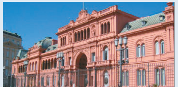
Secretarios podrán aprobar licitaciones millonarias sin la firma de ministros.

La disposición fue publicada en el Boletín Oficial y lleva las firmas del presidente Javier Milei, del jefe de Gabinete Manuel Adorni y del ministro de Economía Luis Caputo. El texto oficial sostiene que la reforma busca agilizar y simplificar los procedimientos, con el objetivo de mejorar la eficiencia en el uso de los recursos públicos.