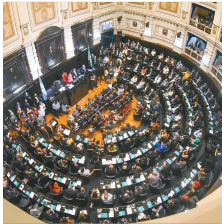
Diputados y senadores buscan reconocer post mortem al exlíder de Los Redondos.

Borgini, por su parte, resaltó el magnetismo de las “misas ricoterías” y la capacidad del Indio para convertir cada recital en un ritual colectivo. Ambos coincidieron en que su figura trascendió la música y se consolidó como un símbolo cultural que acompañó a millones de argentinos durante más de cuatro décadas, dejando una huella que se proyecta más allá del rock y que forma parte de la identidad popular del país.