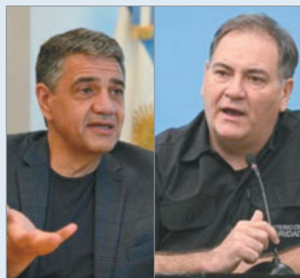
El ministro bonaerense cuestionó al jefe de Gobierno porteño y lo acusó de incompetencia política.

El ministro de Seguridad de la provincia de Buenos Aires, Javier Alonso, respondió con dureza al jefe de Gobierno porteño, Jorge Macri, luego de que este propusiera “levantar un muro contra la barbarie” para separar la