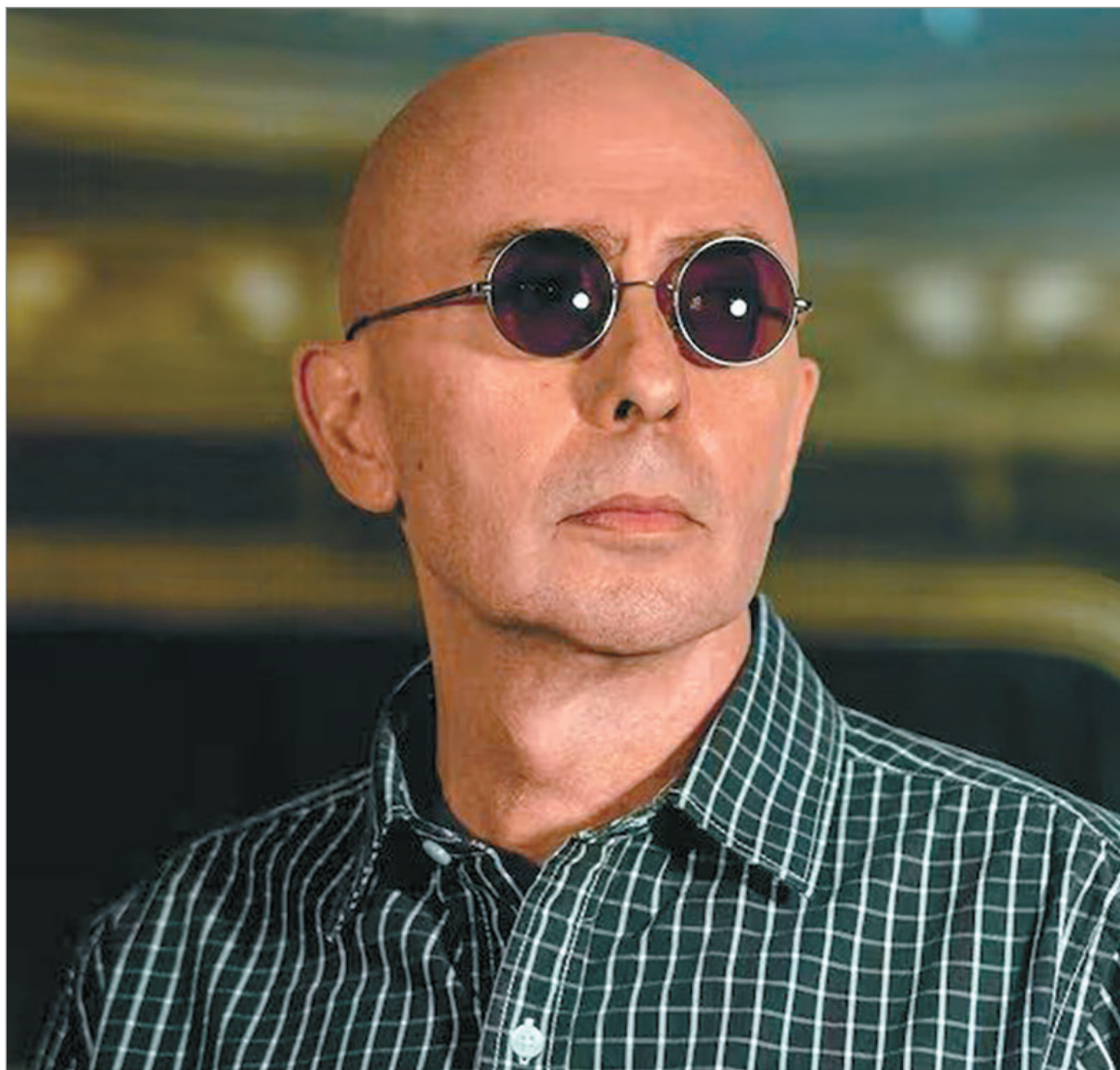
Con sus icónicos lentes

Argentina se encuentra de luto tras conocerse la triste noticia del fallecimiento del Indio Solari, a sus 77 años. El legendario cantante y compositor, nacido en la ciudad de Paraná y formado en La Plata, logró forjar un fenómeno popular incomparable y se consolidó como una de las figuras más influyentes en la historia del rock nacional argentino. Su huella imborrable en la cultura nacional comenzó a gestarse hacia el año 1976 en La Plata, cuando formó la mítica banda Patricio Rey y sus Redonditos de Ricota junto a Skay Beilinson. El grupo editaría nueve exitosos álbumes de estudio, logrando una masividad arrolladora sin contar con el apoyo de medios y publicidad, y convocatorias récord hasta su separación definitiva en 2001. En el año 2000, los Redondos lograron reunir a 70.000 espectadores en el Estadio Monumental, marcando un hito en la historia de la música. Tras un breve receso en su carrera artística, Solari inició una exitosa etapa solista. Formó su nuevo grupo de acompañamiento llamado Los Fundamentalistas del Aire Acondicionado, con el cual publicó cinco aclamados álbumes de estudio. A su