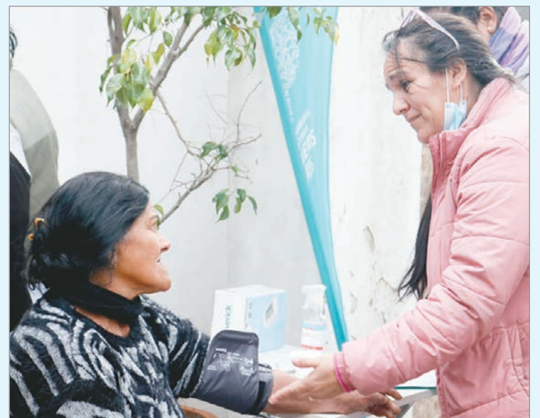
La Plata forma parte del operativo

En el marco de las acciones impulsadas por el gobierno de la provincia de Buenos Aires para hacer frente a las bajas temperaturas, el Ministerio de Desarrollo de la Comunidad puso en marcha la Campaña de Invierno, una política interministerial de asistencia integral destinada a fortalecer la atención y el acompañamiento a personas en situación de calle. En la región, se entregaron kits de abrigo y elementos de higiene, además de brindar controles sanitarios integrales, vacunación y atención odontológica. También se desarrollaron espacios de orientación destinados a personas mayores y personas con discapacidad, y asesoramiento en materia de salud mental y violencia de género. Este operativo también se realizó en otros municipios y continuará a lo largo de las próximas semanas en distintos puntos bonaerenses.