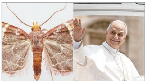
La nueva especie de polilla fue nombrada Pyralis papaleonei

En las montañas de Creta, una impresionante cordillera de piedra caliza ubicada al oeste de Grecia, fue identificada una nueva especie de polilla de colores vibrantes. Los investigadores responsables del hallazgo la nombraron Pyralis papaleonei , en alusión al papa León XIV, máxima autoridad de la Iglesia católica. La polilla alcanza unos dos centímetros con las alas extendidas y uno de sus rasgos más distintivos son sus alas anteriores púrpuras con manchas naranjas y franjas blancas. Se le encuentra en hábitats montañosos, entre unos mil a mil 200 metros de