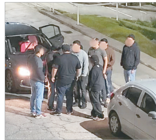
Una cámara registró el hecho

Minutos más tarde, personal de emergencias asistió al herido y lo trasladó para su evaluación médica. El damnificado sufrió politraumatismos y evolucionó favorablemente, por lo que recibió el alta médica tras permanecer bajo observación.