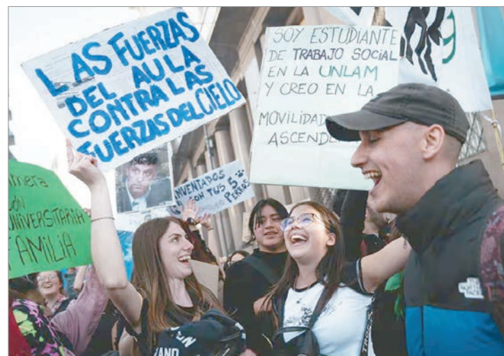
Conadu convocó al paro del 16 al 20 de junio

A la medida se adhiere la Asociación de Docentes de la Universidad de La Plata (ADULP), por lo que el paro afectará a la UNLP.