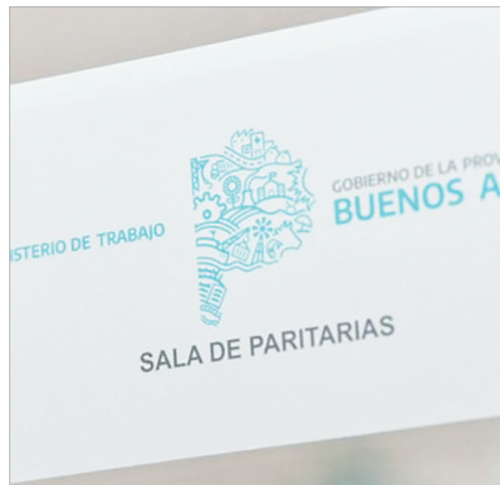
El encuentro será el 11 de junio en el Ministerio de Trabajo.

La expectativa sindical es avanzar en mejoras estructurales. Arévalo señaló que además de la recomposición salarial, buscarán un convenio de trabajo que dignifique la tarea de los estatales y que garantice estabilidad laboral. El gremio insiste en que la precarización debe terminar y que la recuperación del poder adquisitivo es urgente para sostener el funcionamiento del Estado provincial.