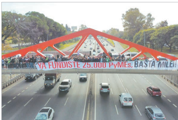
El RIGI otorga estabilidad sin exigir empleo ni proveedores locales

La sangría golpea sobre todo a las pymes. Transporte y almacenamiento perdieron más de 6.000 empresas, seguidos por comercio, actividades inmobiliarias, industria y construcción. Dentro de la industria, cuero, calzado, madera e indumentaria encabezan la caída con retrocesos de hasta 19%. Buenos Aires lidera en términos absolutos, seguida por Córdoba y Santa Fe. En proporción, La Rioja, Catamarca y Chaco son las más afectadas. Neuquén es la excepción, con creci-