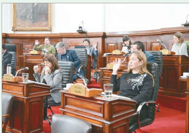
Presentan proyectos para expresar el "pesar" del cuerpo