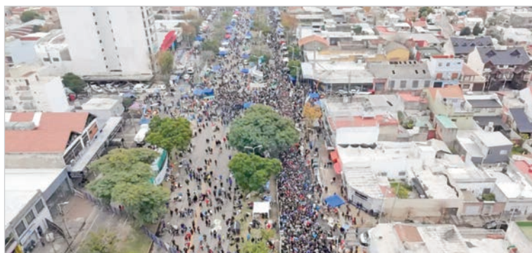
El gobernador bonaerense subrayó la organización y el despliegue en Avellaneda

Kicillof definió la ceremonia como una “peregrinación popular” que reunió a miles de seguidores y se extendió por más de 60 cuadras. Subrayó que la jornada se desarrolló en paz y que la respuesta de los fanáticos permitió que el operativo funcionara con eficacia.