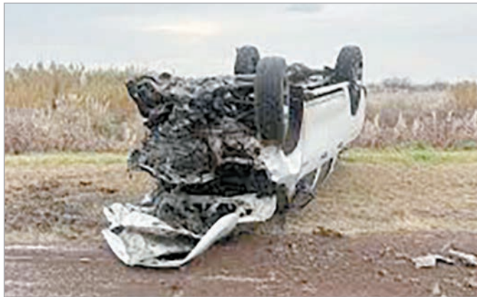
Las postales del suceso

Cuatro personas murieron en un choque frontal entre dos vehículos en la Ruta provincial 94, a la altura de la conocida "curva de García Varela", en la provincia de Santa Fe, informaron ayer fuentes policiales y judiciales.