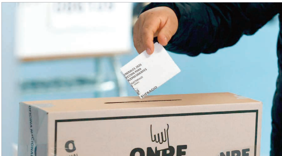
Quién termine resultando electo gobernará el país hasta el 2031

La segunda vuelta, absolutamente marcada por la polarización, tuvo como protagonistas a Fujimori y Sánchez