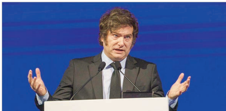
Crece los negocios de los amigos de Milei

El dato alarmante es la dinámica en la que se dio la compra de acciones por parte del FGS. El organismo compró casi a diario desde junio hasta noviembre de 2025. Hasta las elecciones del 26 de octubre, BYMA también recompraba acciones propias a la espera de un salto. Con el triunfo libertario, las acciones subieron un 80% y la