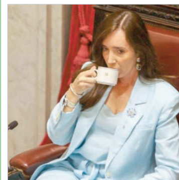
En el Día del Periodista, la vicepresidenta defendió la libertad de prensa.

A través de sus redes sociales, saludó a “quienes entienden el periodismo como servicio” y llamó a “investigar e incomodar cuando sea necesario”. Su postura marcó distancia con el presidente Javier Milei, que no realizó alusiones a la fecha y mantiene un vínculo tenso con los medios.