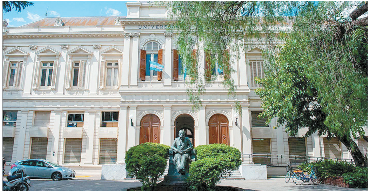
Es organizado por la prosecretaría de Pregrado de la UNLP

Algunas de las temáticas que se abordarán son: salud mental y producción de subjetividad actual en niños, niñas y adolescentes; vínculos intergeneracionales y el lugar de las personas adultas hoy; uso de tecnologías digitales, bienestar digital y cuidados en entornos virtuales;