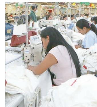
La informalidad laboral se agrava

El dato de informalidad se agrava en empresas con hasta diez empleados: allí, casi el 70% alcanza a los asalariados informales.