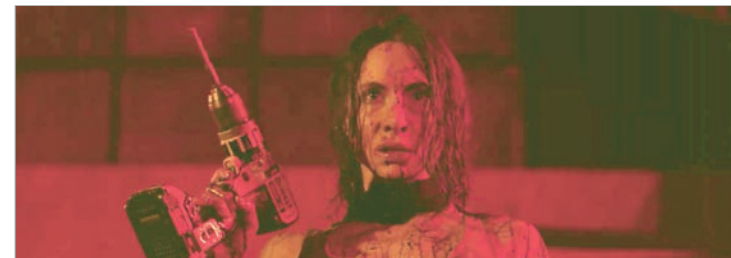
En una escena de la película

—Yo siento que hay que resistir, que hay que hacer, que hay que producir como se pueda, entre amigos o en producciones grandes. Que lo más importante es que tenemos un buen cine nacional, que nos está representando en el mundo. Ni que hablar de los títulos como Belén , como Gatillero , como películas que lo logran todo. Y mientras tanto, hay poquito, pero hay. Entonces es importante mantener, aunque sea en pequeñas producciones, que es lo que yo más amo.