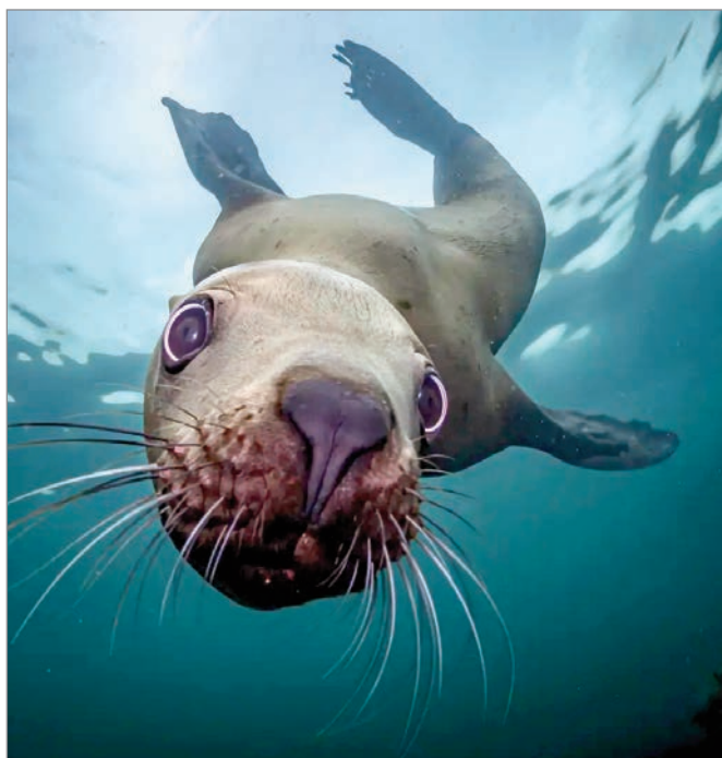
Un león marino se desliza bajo las aguas del mar de Salish, en la isla de Vancouver