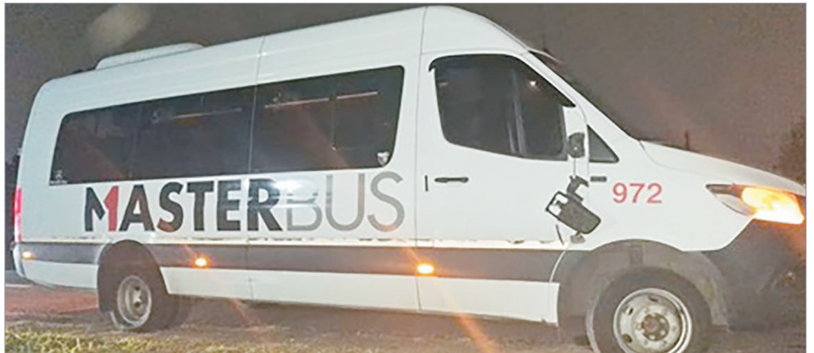
El caso en Ruta 2

cional de Instrucción N° 10 de La Plata, caratulada como “homicidio culposo”.