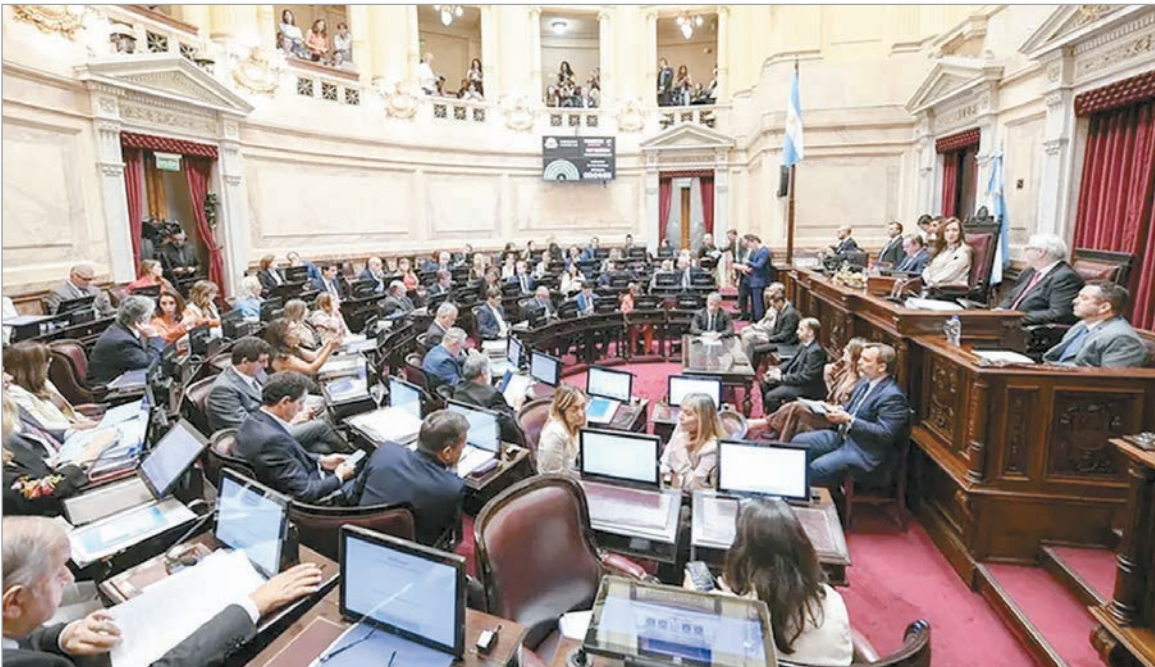
Senado patea la reforma laboral para agosto

El oficialismo no consigue consensuar con los aliados avanzar con la eliminación de las PASO y otros ítems. Por el momento, el debate se posterga a agosto