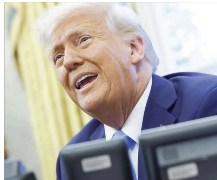
"Tenemos la mejor defensa y el mejor ataque que jamás se haya visto", remarcó Trump

Por otra parte, el mandatario afirmó que hay una "alta probabilidad" de que sepa dónde está el nuevo líder supremo de Irán, Mojtaba Jamenei, a quien describió como una figura "más racional" que su predecesor. Trump también analizó la sucesión en el poder en Teherán tras el estallido del conflicto armado y reveló que Mojtaba Jamenei se encuentra "bastante malherido" tras el ataque en el que murió su padre. "Más joven, creo, y más racional. Herido; está bastante malherido. Así que hay una cierta valentía ahí", cerró. El presidente estadounidense no dio detalles concretos, pero sugirió que los servicios de inteligencia de su país disponen de información precisa sobre dónde se encuentra el líder iraní.