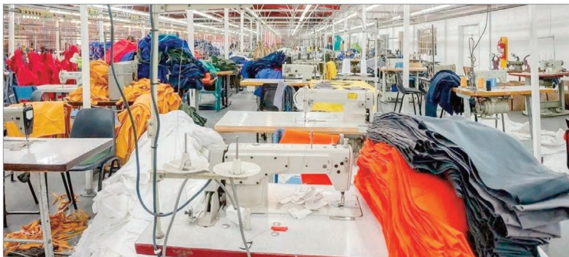
La producción cayó más de 23% y el empleo perdió 22.000 puestos privados

La industria textil continúa mostrando señales de deterioro. Según un informe de la Fundación Pro Tejer, la producción del sector cayó 23,3% en marzo respecto del mismo mes de 2024. Si la comparación se realiza con 2023, el retroceso alcanza el 31,3%.