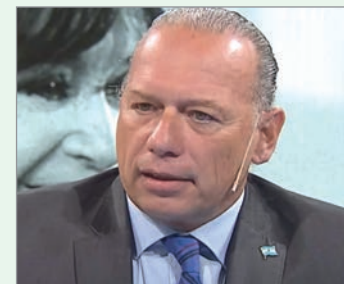
El senador bonaerense respaldó a la expresidenta y criticó el proceso judicial en su contra

En paralelo, Berni buscó instalar su mirada sobre el futuro del peronismo bonaerense. En ese contexto, evitó respaldar de manera automática una eventual candidatura presidencial de Axel Kicillof y planteó que primero deberá definirse qué representación busca encarnar el Gobernador. Esa definición, sostuvo, será clave para ordenar un frente que arrastra tensiones desde el desdoblamiento de las elecciones provinciales de las nacionales en 2025, una decisión resistida por la propia Cristina.