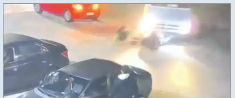
Todo quedó filmado

que el conductor abandonó el lugar sin asistir a las víctimas, dejando a ambos lesionados y provocando importantes daños en la moto. Ahora, deberá responder ante la Justicia por el delito de "lesiones culposas".