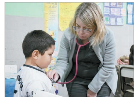
Se busca fortalecer el acceso a la salud pública.

En lo que refiere al día de hoy, se hará presente la jornada sanitaria en Ignacio Correas, en la Escuela N° 108, en 30 y 697, de 9 a 10; en Tolosa, en el Club La Plata V, en 17 y 530, de 9 a 12, y en la Unión Ferroviaria Seccional La Plata, en 2 entre 528 bis y 529, de 9:30 a 12:30; y en Altos de San Lorenzo, CAPS N° 46, en 16 y 608, de 11 a 15.