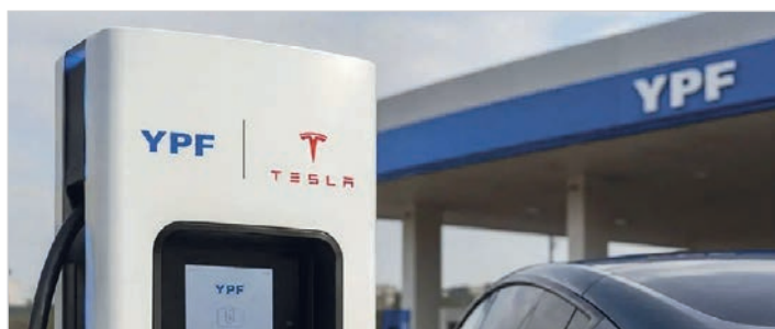
La petrolera sumará la red global de supercargadores a sus 1.600 estaciones en Argentina

El convenio prevé que Tesla aporte su red global de supercargadores y sistemas de almacenamiento de escala industrial, mientras YPF pondrá a disposición sus más de 1.600 estaciones de servicio en todo el país. “En YPF creemos que el futuro de la energía requiere un enfoque integrado que combine infraestructura, tecnología e innovación”, señaló Marín en el