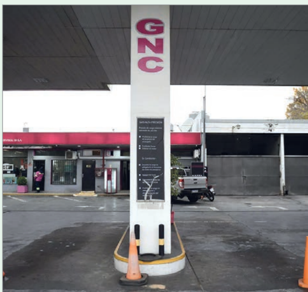
El frío obliga a priorizar la demanda de hogares e industria

Como sucedió semanas atrás, la ola de frío que azota La Plata y la región obligó a las empresas distribuidoras de gas a "racionalizar" su consumo. En este sentido, las estaciones de servicio comenzaron a restringir la venta de GNC.