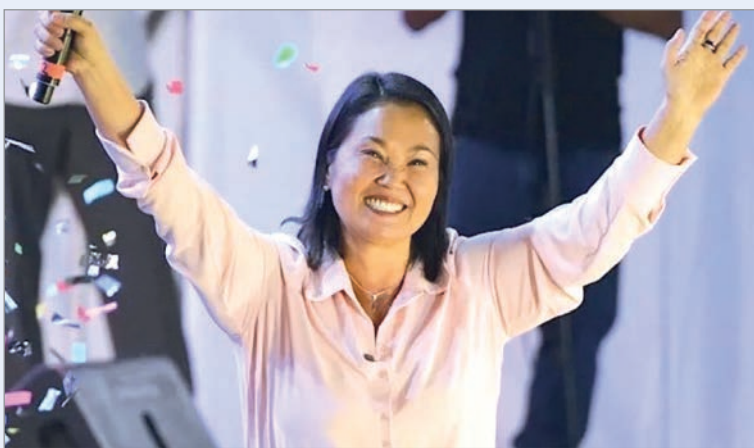
La ventaja de la candidata derechista se amplía a más de 35.000