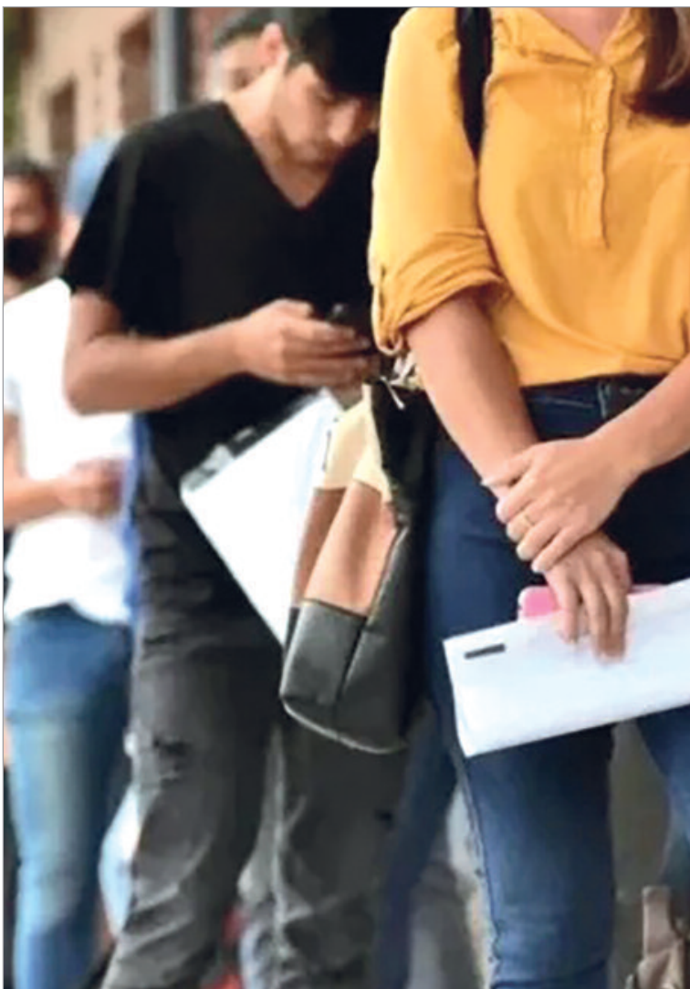
Construcción, industria y transporte concentran las mayores pérdidas laborales

La construcción aparece como la principal víctima del nuevo esquema económico. La paralización de proyectos de infraestructura y la retracción de la inversión impactaron de lleno sobre una actividad históricamente intensiva en mano de obra. También la industria manufacturera sufrió una fuerte reducción de personal, en un contexto de caída del consumo, apertura de importaciones