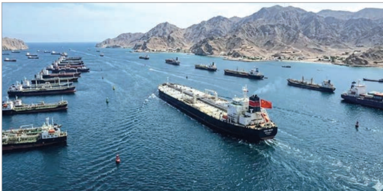
Unas 500 embarcaciones comerciales permanecen en el golfo Pérsico

Donald Trump anunció la reapertura tras el acuerdo de paz alcanzado entre Estados Unidos e Irán, un paso clave para poner fin a meses de tensión en Medio Oriente