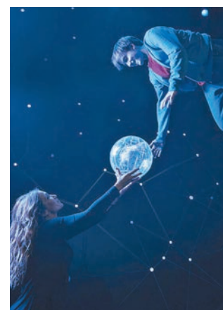
Una imagen de la propuesta