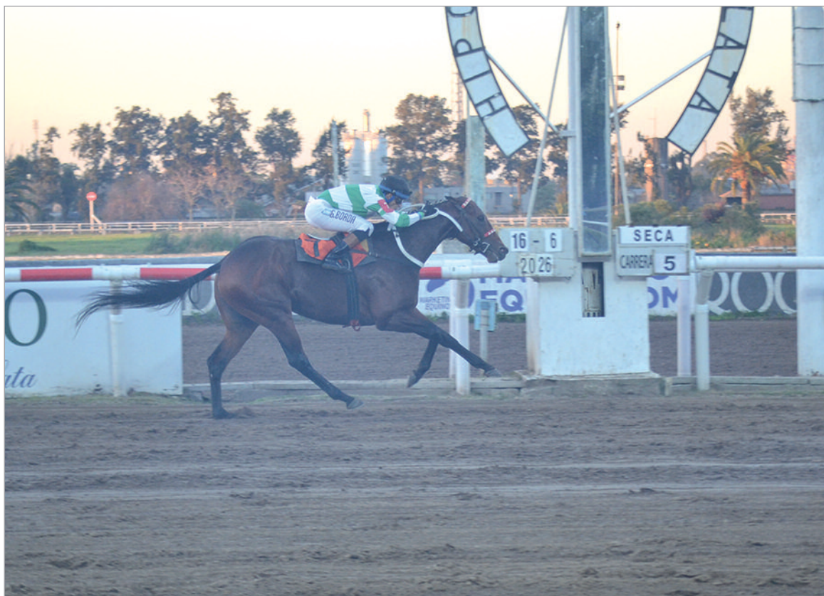
Su mejor victoria. Amuni se alzó ayer con el Clásico "Antonio Cané" dando forma al mejor desplazamiento de su campaña

Amuni siempre vino cerca del fuego que alimentaba Abrazo al Cielo para pasar al frente en el codo, para ya en la recta escapar de El Darwin. De esta forma se alzó con el Clásico "Antonio Cané" (G III-2.100 mts.), la victoria más importante de su campaña