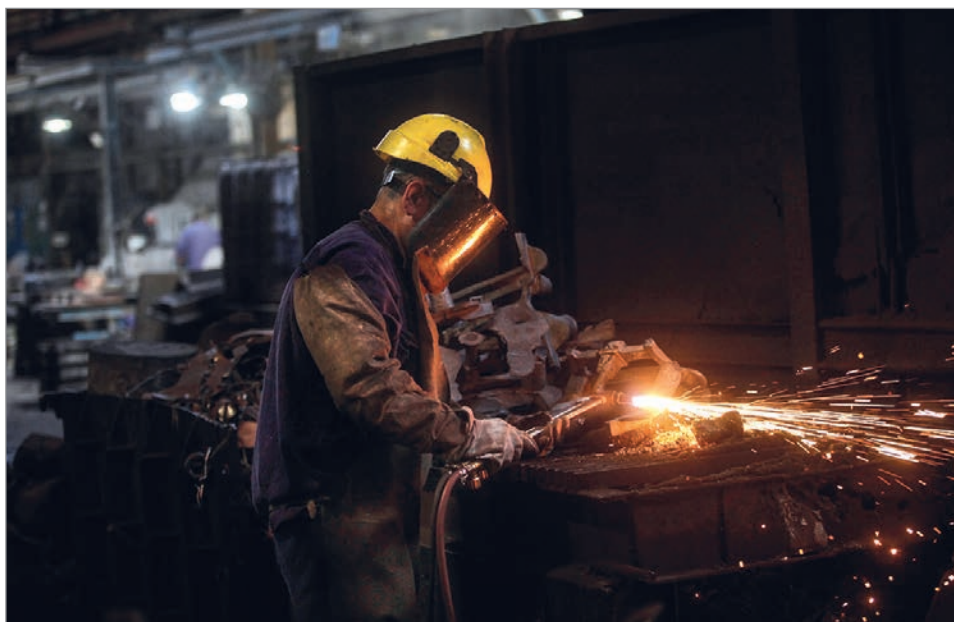
Admira alertó por retrocesos en producción y empleo en casi todos los rubros

Fundición encabezó las caídas con una contracción del 8,9%, seguida por maquinaria agrícola, que retrocedió 8,6%. También se observaron descensos en bienes de capital,