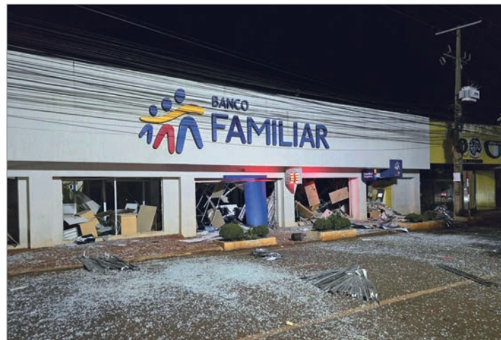
Investigan si había entre los atacantes integrantes del Primer Comando Capital de Brasil