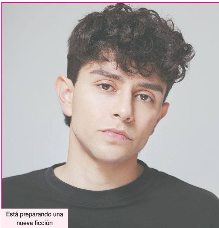
Está preparando una nueva ficción

—Bueno, estamos al lado, compartimos un montón de cultura, más de