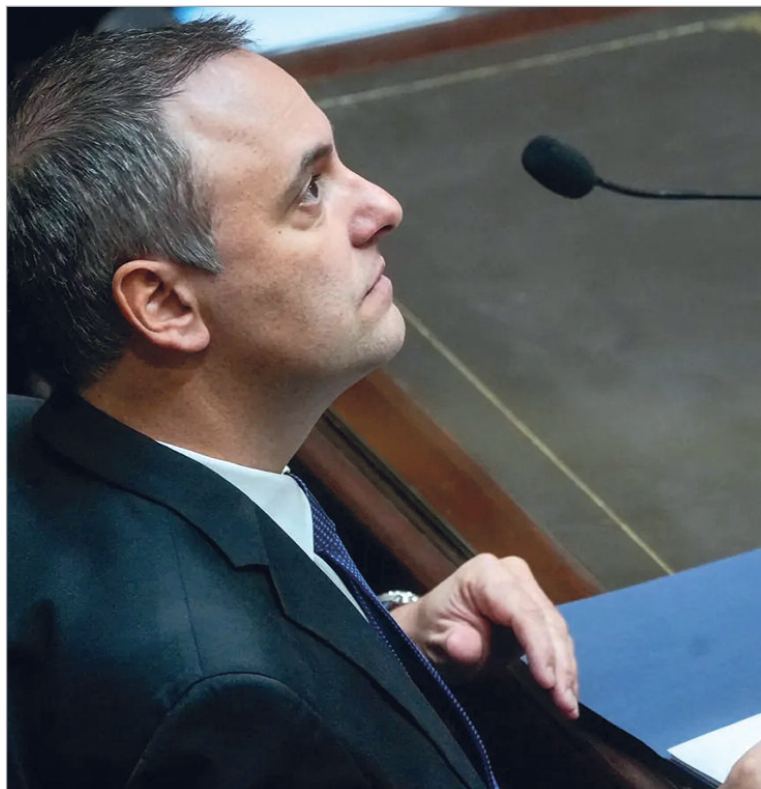
Adorni pierde apoyo

Quien también lleva adelante el trabajo de conseguir apoyos es Diego Santilli. En este camino, el ministro de Interior activó nuevos contactos con gobernadores. La