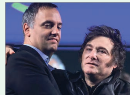
El jefe de Gabinete reaparecerá en público junto al Presidente en el acto por el Día de la Bandera

Milei compartirá la ceremonia con el gobernador Maximiliano Pullaro y el intendente Pablo Javkin, en un evento que reunirá autoridades y ciudadanos.