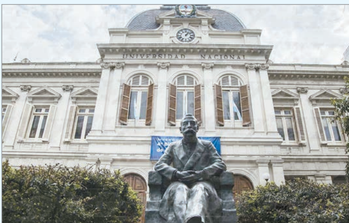
Se trata de un suplemento institucional de debate y análisis