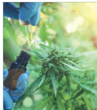
El Ministerio de Salud bonaerense creó un órgano asesor para fortalecer el programa provincial

La decisión se apoya en el Programa Provincial de Cannabis Terapéutico, formalizado este año por la Provincia para garantizar el acompañamiento integral de pacientes que utilizan tratamientos basados en cannabis medicinal.