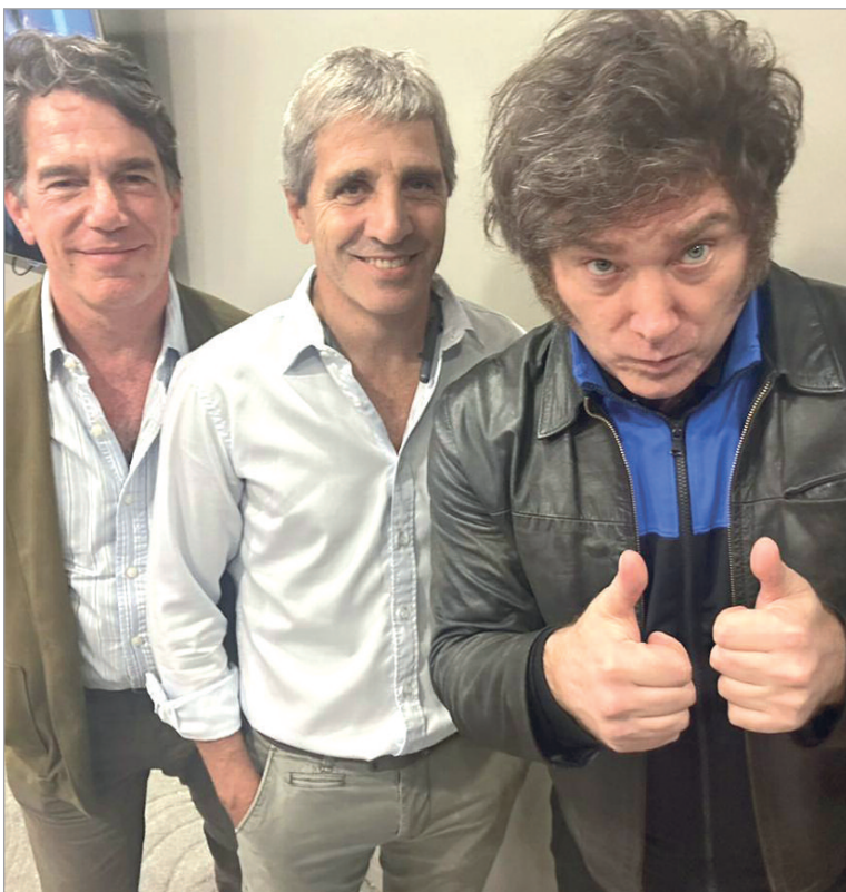
La fuga de dólares avanza

“La dolarización de los ahorros para sacarlos del circuito formal y mantenerlos ‘bajo el colchón’ o invertirlos fuera del país. Con la dolarización, el ahorro pasa a ser un esfuerzo que en lugar de destinarse