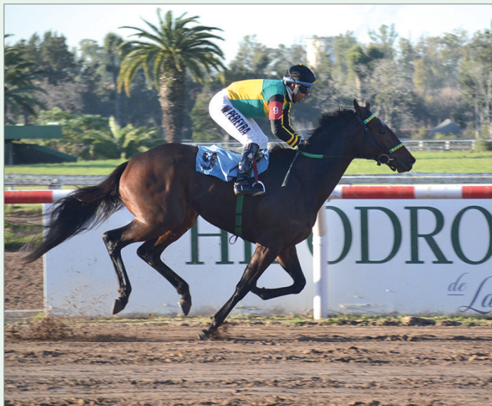
La del "Rubio B" no dejó dudas. American Model respondió a su linajuda sangre y tuvo un estreno triunfal

La potranca ganadora, empleó el buen registro de 1m.15s.18/100 para los 1.500 metros de pista seca con estos parciales: 400 mts. en 25s.71/100; 800 mts. en 50s.14/100 y 1.200 mts. en 1m.15s.18/100.