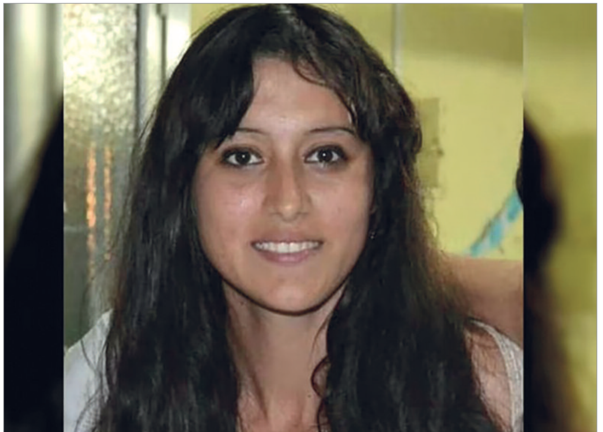
La joven fue asesinada en 2017

Hasta el momento, la Justicia no logró determinar si la joven fue víctima de un homicidio, si falleció por una sobredosis o si intervino alguna otra causa. Lo que sí se considera acreditado es que su cuerpo fue ocul-