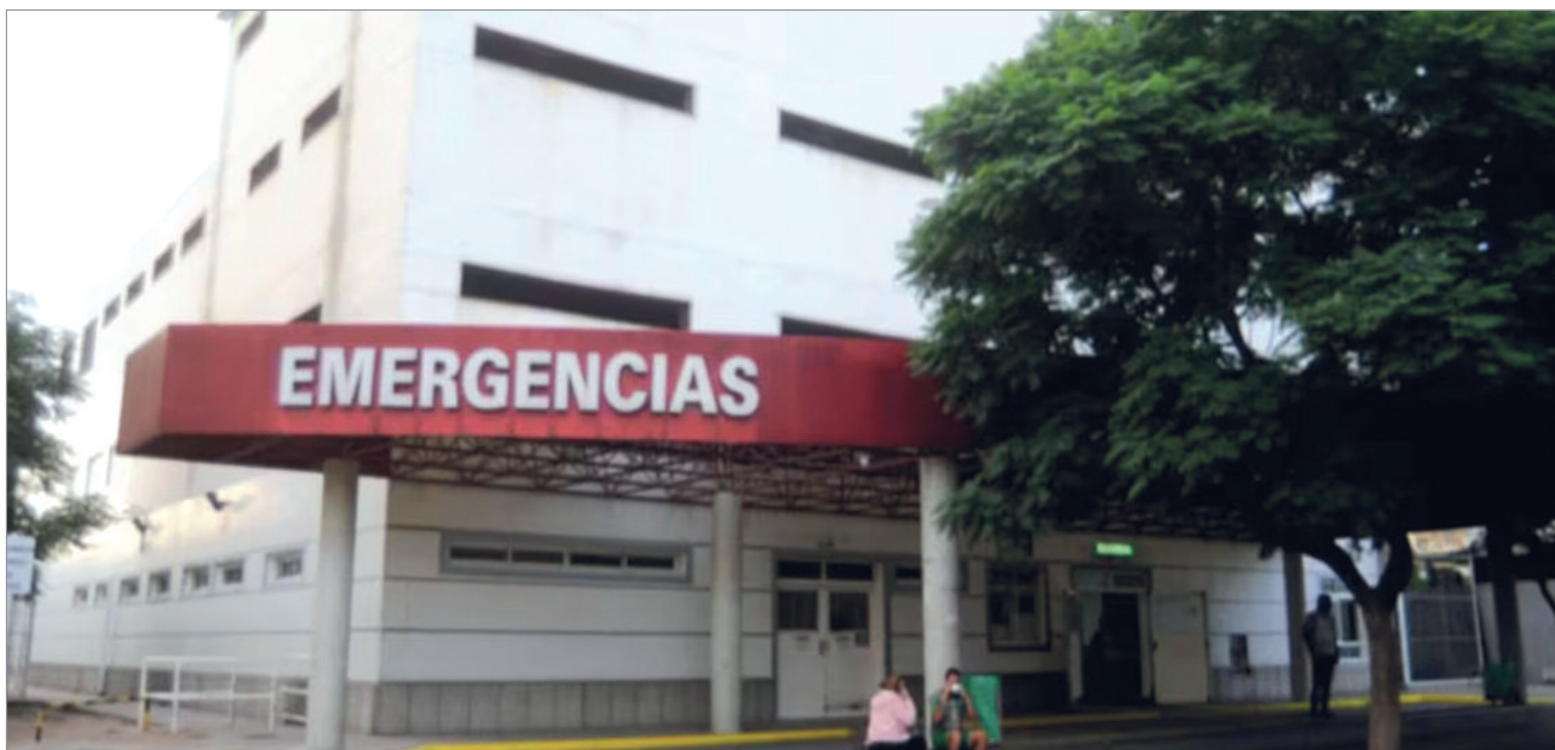
El pequeño fue trasladado al hospital

Al momento de ingresar a la guardia, la mujer manifestó que el pequeño presentaba un cuadro febril agudo y severas complicaciones para respirar con normalidad. Con el correr del tiempo, los síntomas clínicos persistían y se detectaron, además, algunas respuestas físicas atípicas, lo que derivó en unos chequeos más pormenorizados.