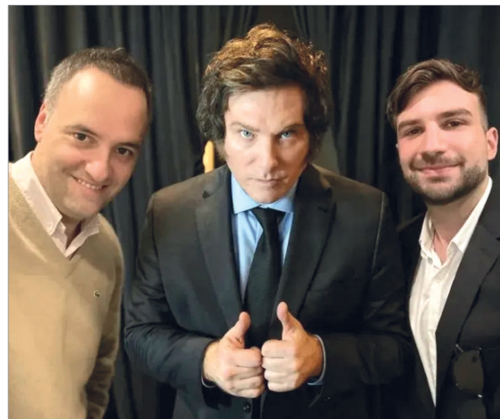
Describen el rol de "nexo institucional" de Adorni