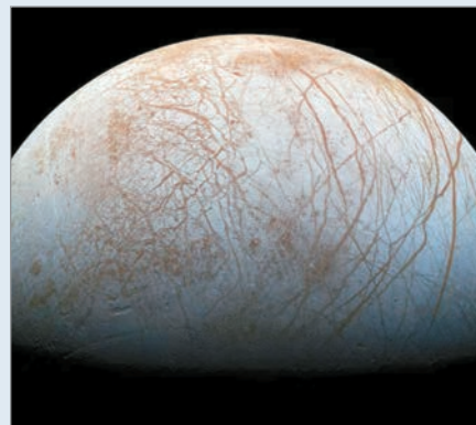
Europa, una luna de Júpiter cuyo océano podría albergar vida extraterrestre.