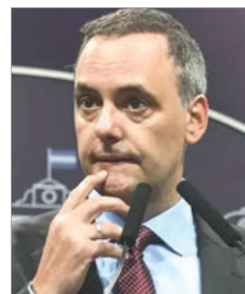
El organismo pidió a Tabar justificar ingresos y obras en la vivienda del jefe de Gabinete

La presión de ARCA se suma al testimonio del contratista y datos de proveedores, en un contexto donde cada movimiento patrimonial es observado con lupa y amenaza con complicar la situación del jefe de Gabinete