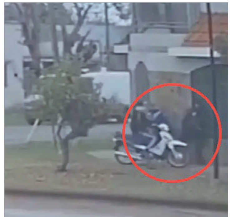
Todo quedó filmado

Tras el episodio, un automovilista que fue testigo de lo ocurrido decidió auxiliar al adolescente. El conductor detuvo la marcha de su vehículo, asistió al joven y posteriormente lo trasladó hasta su domicilio para que pudiera reencontrarse con su familia.