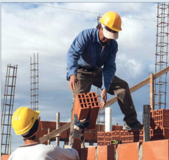
El sector acumula una inflación de 12,8% en cinco meses en el Gran Buenos Aires

El índice del costo de la construcción en el Gran Buenos Aires registró en mayo un aumento de 2,7% respecto de abril, cuando había subido 3,1%. La variación se explica por incrementos de 1,6% en materiales, 3,5% en mano de obra y 4% en gastos generales.