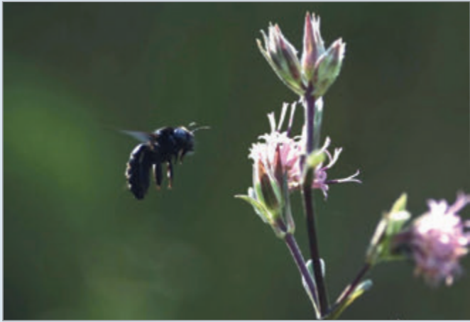
Los levitadores acústicos utilizan ondas que están por encima del rango audible

Diseñan trampa acústica para investigar abejas y moscas