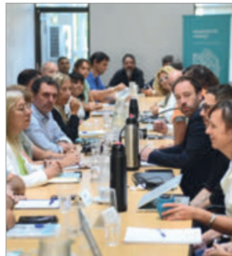
La Provincia no convoca a los gremios

El último acuerdo salarial venció en mayo. Ese entendimiento contempló una suba acumulada del 9,3% para los trabajadores estatales, aplicada en cuotas y acompañada por una cláusula de revisión.