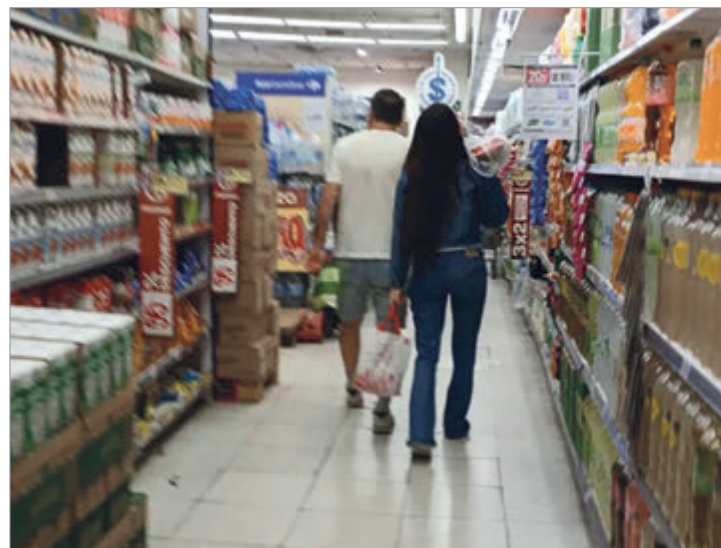
El índice subió en junio frente a mayo, pero sigue por debajo de 2025 y acumula retrocesos

El repunte mensual no alcanza para disimular el retroceso acumulado. La confianza del consumidor sigue por debajo de los niveles de 2025 y refleja un escenario complejo, que condiciona las decisiones de gasto y consumo. La pérdida interanual de 6,1% marca que, pese a las mejoras coyunturales, el humor social continúa deteriorado y la recuperación se mantiene lejos de consolidarse.