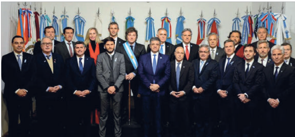
Los fondos deberán devolverse con intereses y garantía de coparticipación