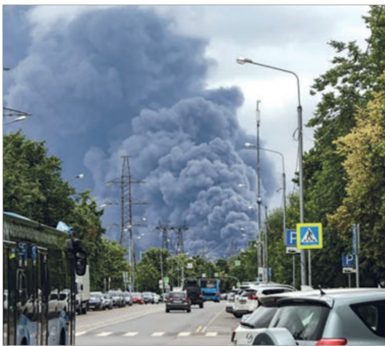
Una densa columna de humo se elevó sobre el sureste de Moscú

El presidente ucraniano, Volodímir Zelenski, confirmó públicamente la operación desde Bruselas. A través de sus redes sociales afirmó que las fuerzas ucranianas habían vuelto a atacar la región de Moscú y compartió un video donde se observa la refinera