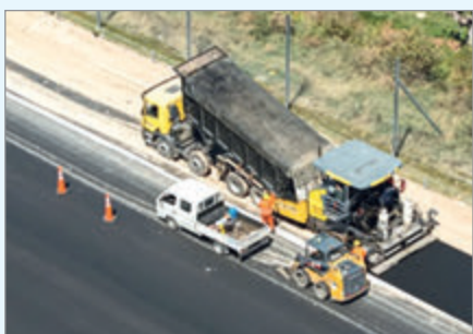
Se trata de una extensión que abarca 20 kilómetros