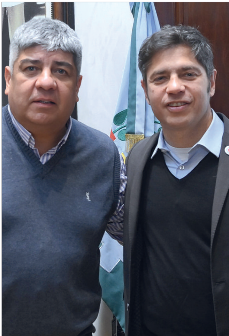
Kicillof recibió a Pablo Moyano en Gobernación

En cuanto a la situación de la interna peronista entre el espacio del gobernador y el kirchnerismo, el referente gremial renovó su clamor por la unidad del Partido Justicialista (PJ). En este camino, llamó