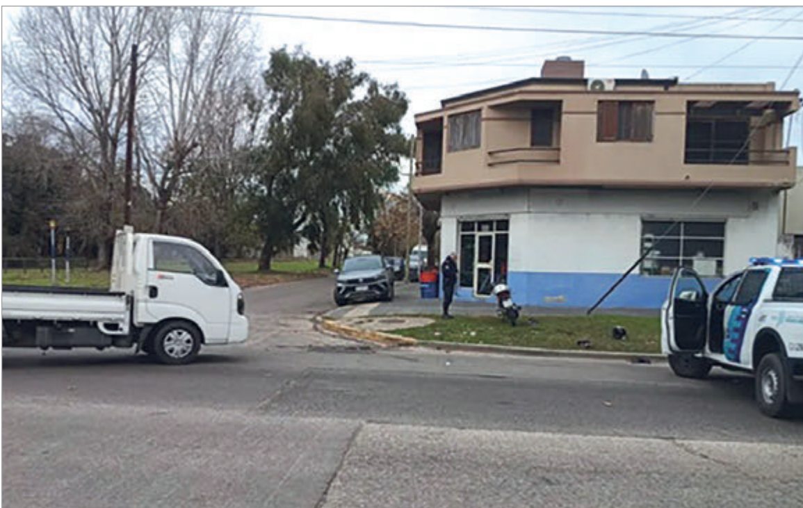
La zona del hecho

Impactó contra un camión en 120 y 527 y sufrió lesiones de consideración. Quedó bajo observación en el Hospital Rossi