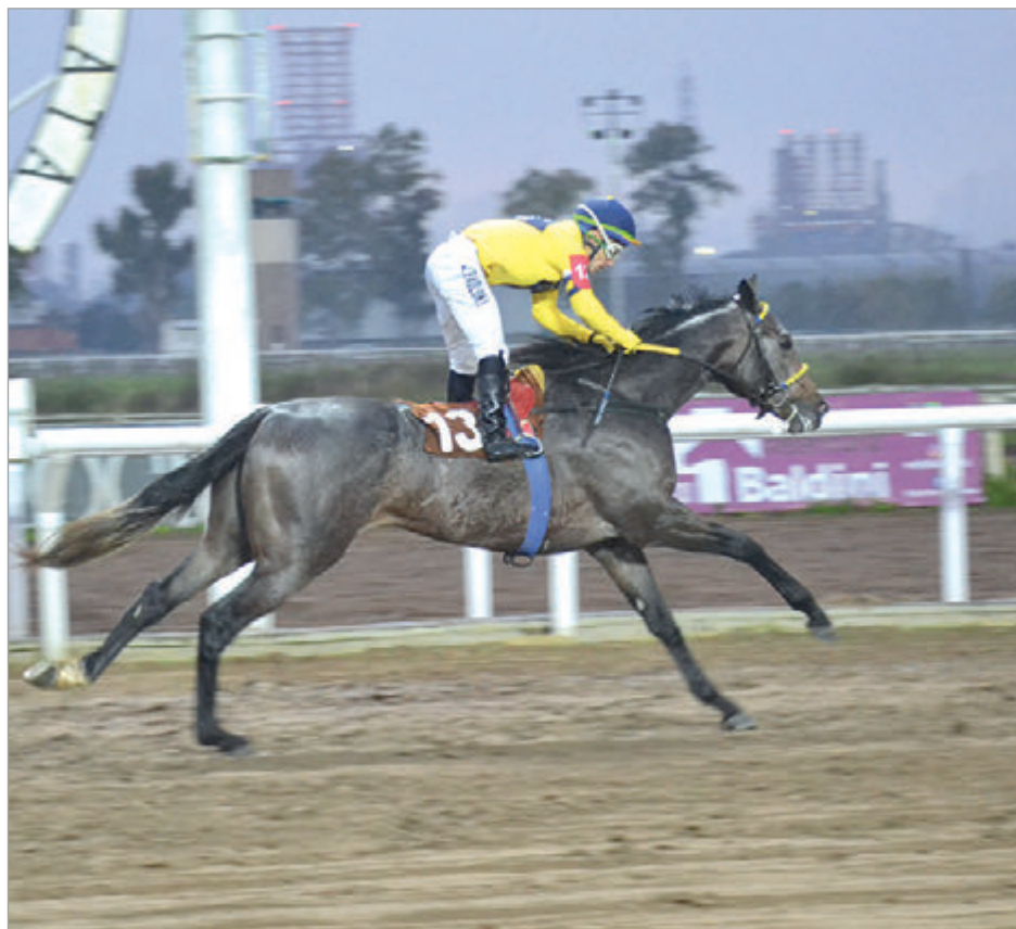
Auspicioso debut. Nuestro candidato Wiloma se impuso ampliamente en el Especial "Patria" (1.500 mts.) lo cual le abre un venturoso futuro

Cotejo reservado para potrillos nacidos desde el 1° de julio de 2023, que no hayan ganado, ocupó el quinto turno de la programación con doce ejemplares en pista, ya que Temerario Stripes y Che Capo no fueron de la partida y el cierre de las apuestas mostró el favoritismo de Wiloma, que prometía un sport de $3.25, superando levemente lo reu-