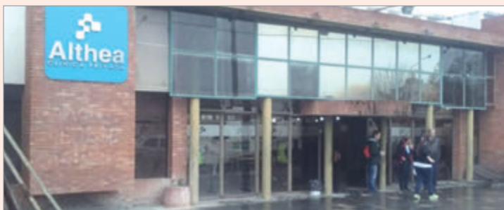
El lugar apuntado

Según se desprende de la presentación judicial, cuando los familiares solicitaron la historia clínica del paciente, inicialmente habrían recibido por error documentación correspondiente a otra persona. Luego, siempre de acuerdo a lo denunciado, desde el lugar les informaron que la historia clínica y otra documentación vinculada a la internación no podían