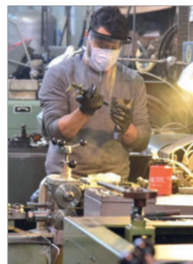
“Cada vez es más difícil”

“Ya llegamos a 26.500 empresas cerradas en dos años y medio”, recordó, y deslizo que “la gente empieza a darse cuenta” de las consecuencias del modelo de Milei.