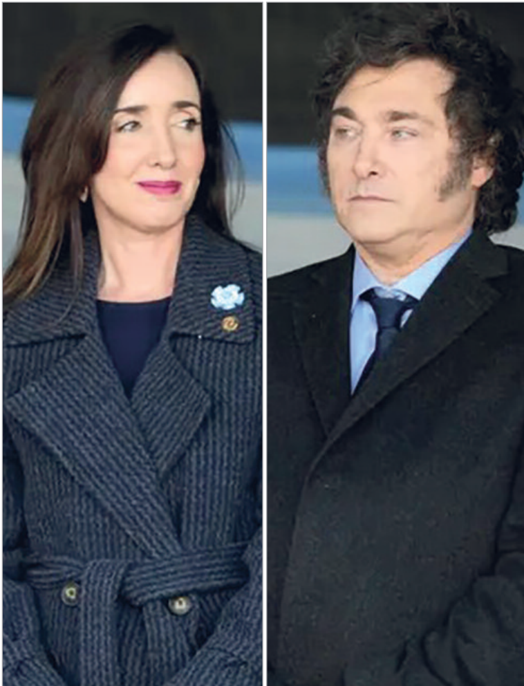
La titular del Senado asistirá al acto por el Día de la Bandera sin invitación formal del Gobierno

Uno de los antecedentes más recientes ocurrió durante el Tedeum