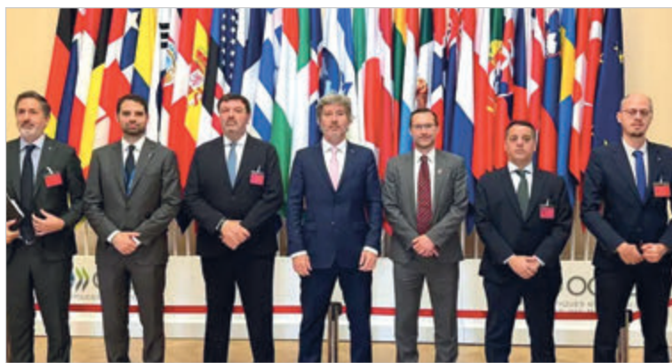
Lijo y Mahiques participaron de una reunión oficial

Aunque el comunicado oficial no menciona a Lijo, el magistrado parti-