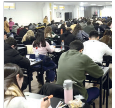
En total, más de 7.000 postulantes se inscribieron en toda la provincia de Buenos Aires

Frente a ese escenario, la Provincia impulsó un esquema propio para garantizar la continuidad, transparencia y organización del acceso a las residencias en el sistema público de salud bonaerense, preservando criterios de evaluación comunes y asegurando la formación de profesionales en hospitales y centros sanitarios de todo el territorio provincial.