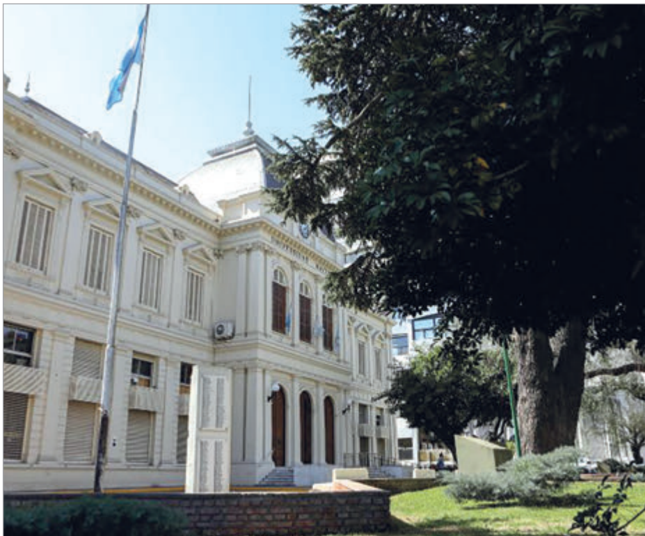
La UNLP integra el selecto grupo de las 500 instituciones destacadas a nivel global

El resultado de esta edición se inscribe en una trayectoria de crecimiento sostenido. En 2021, la UNLP se ubicaba en el puesto 651. Desde entonces, acumuló un avance de casi 180 posiciones en seis años, producto del trabajo colectivo de su comunidad docente, investigadora, graduada, no docente y estudiantil. La edición 2026 del mismo ranking marcó el punto más alto de ese recorrido con el ingreso al top 500, un hito que esta edición confirma y consolida.