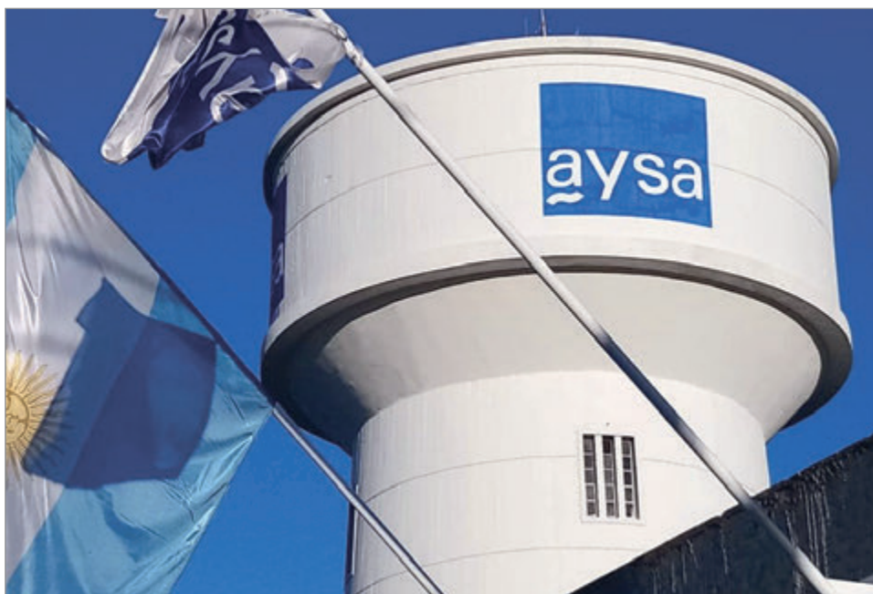
Nuevo revés judicial contra Milei