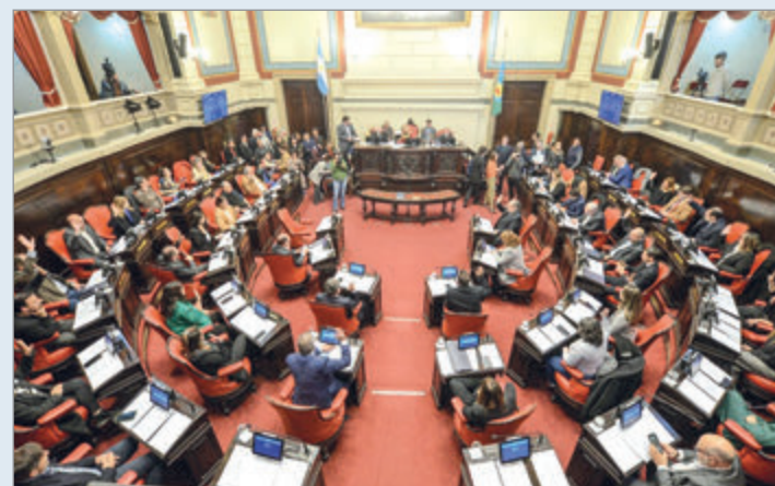
Hace ocho meses que el Senado no sesiona

En este camino, la presión se volvió insostenible. El jefe del bloque peronista, Sergio Berni, calificó la parálisis legislativa como un "papelón", la massista Malena Galmarini la definió como una "vergüenza", y este miércoles la oposición amenazó con pedir una sesión especial para forzar la reapertura del recinto.