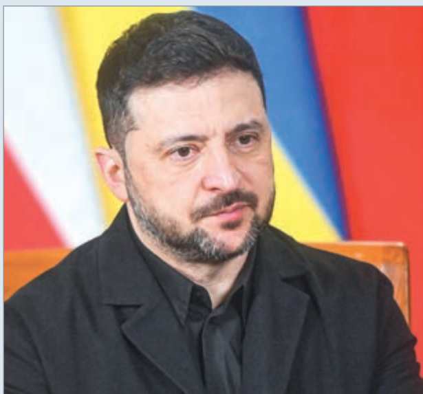
El mandatario polaco aseguró que la medida busca defender la memoria del país

El presidente de Polonia, Karol Nawrocki, anunció el retiro de la Orden del Águila Blanca al mandatario ucraniano Volodimir Zelenski, en medio de una creciente tensión diplomática vinculada a la memoria histórica entre ambos países.