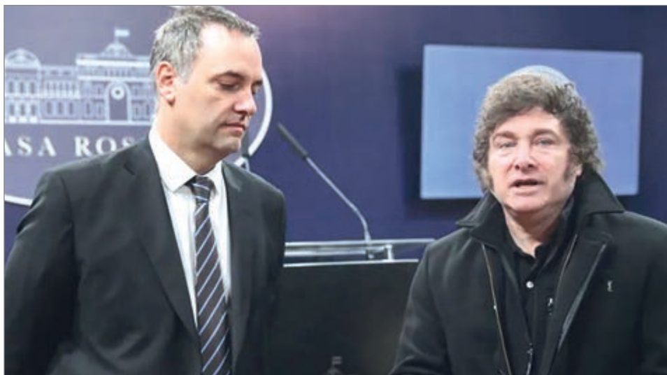
El anuncio se conoció tras una reunión en la Quinta de Olivos