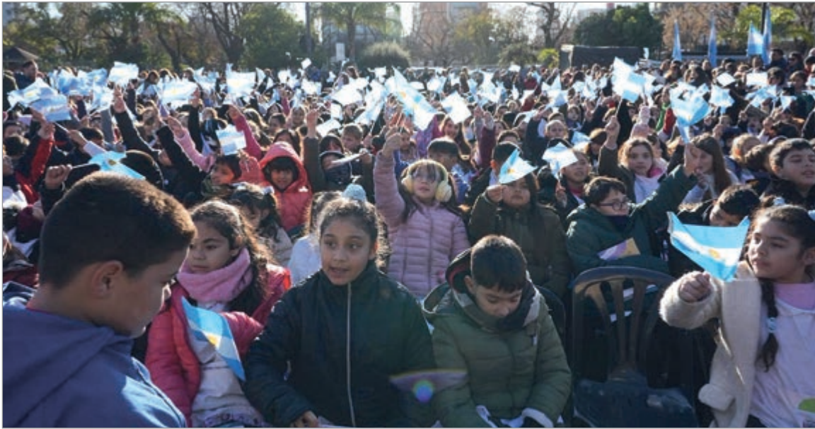
La ceremonia se llevó a cabo en Plaza Belgrano

La ceremonia se llevó a cabo en Plaza Belgrano y contó con la musicalización de la Orquesta Sinfónica Juvenil Bonaerense. En tanto, la UNLP homenajeó a la Bandera en los jardines del Rectorado