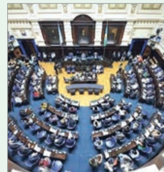
El Senado bonaerense prepara su primera sesión y Diputados suma actividad en comisiones.

El cronograma marca un intento de recuperar ritmo institucional, aunque la parálisis del Senado sigue siendo el principal obstáculo para normalizar la actividad legislativa en la Provincia.