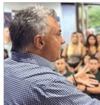
La Libertad Avanza presentó un proyecto para bajar la edad mínima en los concejos bonaerenses.