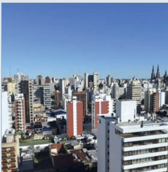
La crisis golpea al sector inmobiliario y de la construcción

El Laboratorio de Desarrollo Sectorial y Territorial de la Facultad de Ciencias Económicas de la UNLP publicó el Indicador de la actividad Inmobiliaria y de la Construcción en La Plata, con resultados preocupantes. El estudio arrojó una caída de 5,4% en el primer trimestre de 2026 respecto del mismo periodo del año anterior. Además, el nivel se encuentra 17,6% por debajo del primer trimestre de 2023.