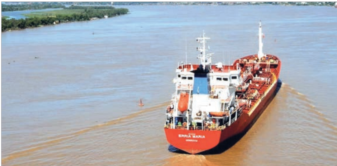
El Gobierno cerró la privatización de la Hidrovía

El Ejecutivo anunció la adjudicación de la Vía Navegable Troncal a pesar de los fuertes cuestionamientos al proceso licitatorio