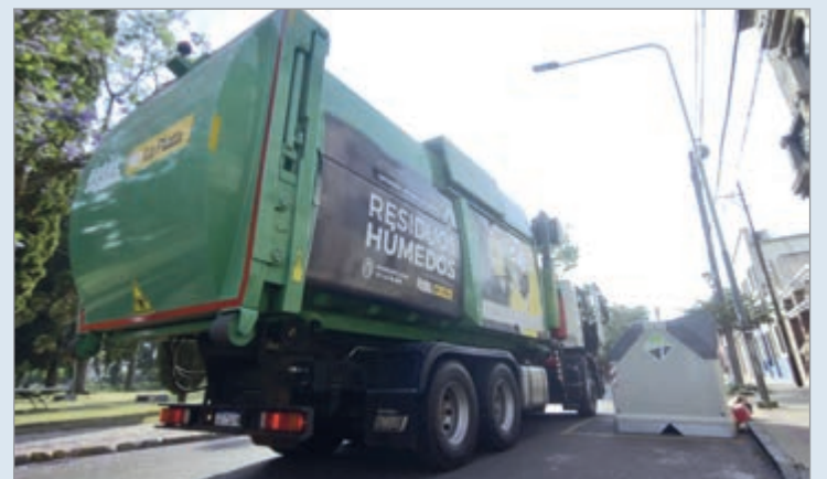
No se aplicará el sistema de Estacionamiento Medido

Fijo La Plata abrirá de 8:00 a 16:00 y el Mercado Regional permanecerá cerrado, mientras que la República de los Niños funcionará de 7:00 a 22:00 y el Parque Ecológico Municipal, de 7:00 a 21:00.