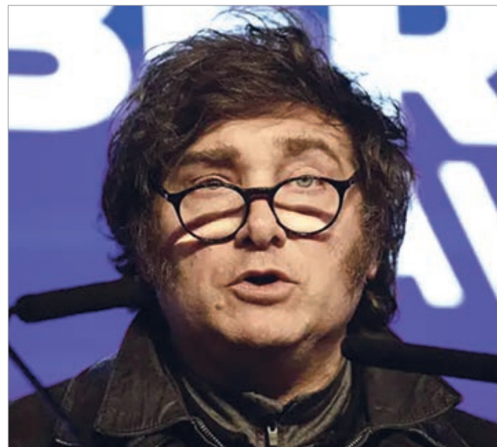
Se complica la situación de Milei en el caso $Libra