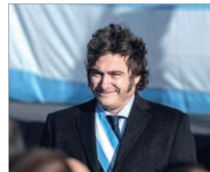
Milei encabezará el acto junto a Adorni y sin Villarruel en la comitiva oficial

Como adelantó diario Hoy en su edición anterior, Villarruel viajará por su cuenta a la ciudad santafesina para participar de la conmemoración, una decisión que profundiza la interna libertaria.