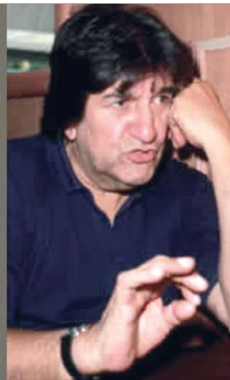
Carella debutó en 1944 en la Casa del Teatro

Pasó su infancia y adolescencia en Ramos Mejía. Pero en 1939 recaló en el Once para nunca más irse. No era hijo de actores, pero participó de una generación que vivió el teatro intensamente. Su madre conoció todas las compañías habidas y por haber; su abuelo materno, también. Pues era gente que concurría permanentemente al teatro: "Siempre digo que uno de los problemas más grandes que tiene la juventud en este momento para acercarse al teatro es la veda que se ha impuesto a los menores. Porque yo he asistido a todos los espectáculos teatrales que se daban en Buenos Aires, siempre yendo con mi familia, que no dejaba de llevarme a ninguna parte".