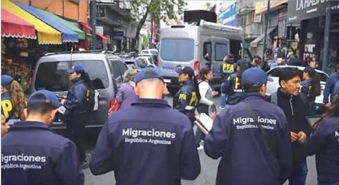
La resolución 551/2026 formalizó el nuevo esquema migratorio.

El Ejecutivo oficializó un programa que habilita a las fuerzas federales a perseguir y deportar extranjeros que estén bajo sospecha