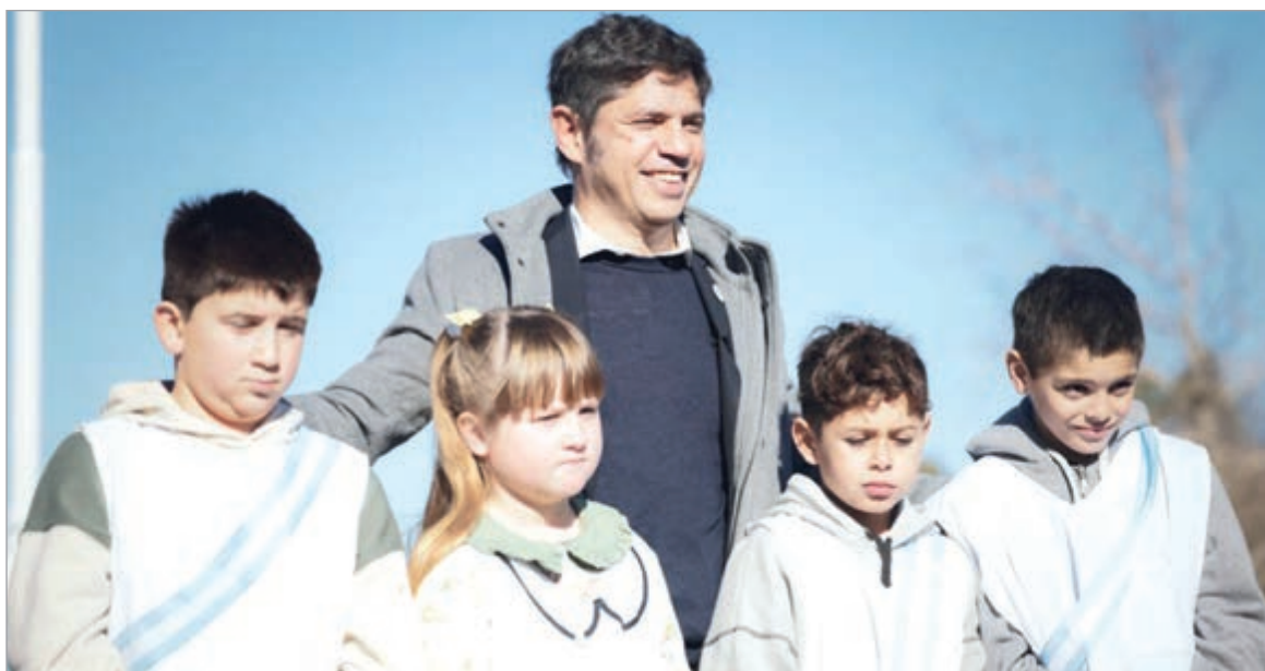
Kicillof encabezó la jura en San Jorge y marcó diferencias con la administración de Javier Milei

El mandatario bonaerense encabezó la jura a la bandera en una escuela rural donde defendió la soberanía y apuntó contra el ajuste del Gobierno nacional