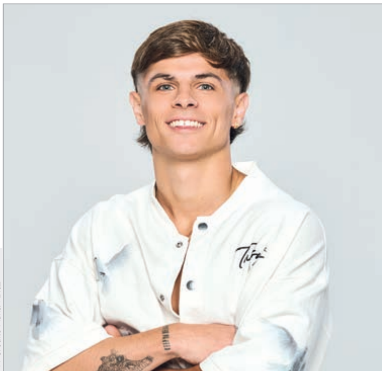
Quiere dedicarse a lo artístico

—No nunca pensé durar tanto. Me metí mucho en lo que es el juego y demás, y podía ofrecer un poco más, hasta incluso pensé que me podía llegar a quedar, no te digo que hasta la final, pero sentí que podía ofrecer muchísimo más para la casa y el juego.