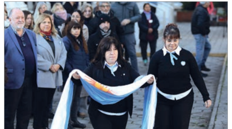
Homenaje en el Rectorado

Los organizadores remarcaron que izar la bandera e interpretar canciones patrias "es un modo de rendir tributo y representar la soberanía e identidad nacional".