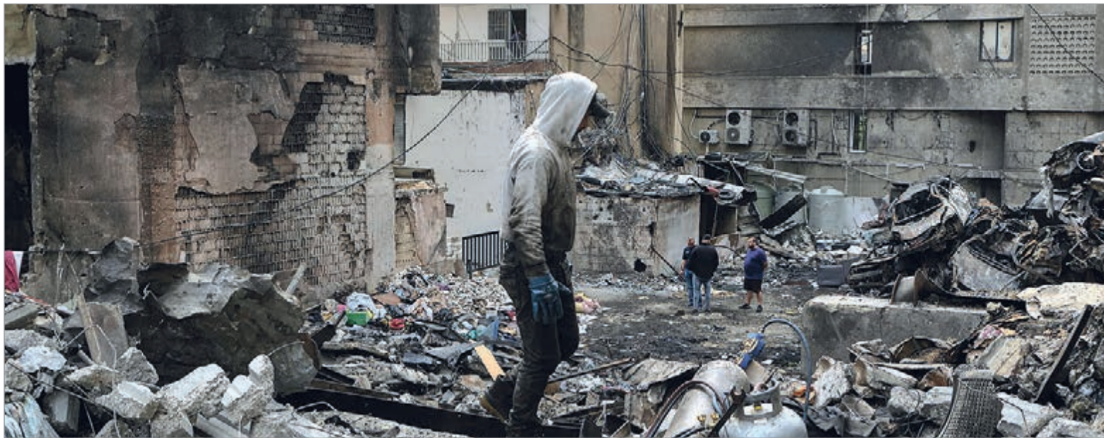
La comunidad internacional busca consolidar una tregua para reducir la tensión en Medio Oriente

Un alto el fuego comenzó a regir este viernes en Líbano luego de una nueva escalada de violencia que dejó decenas de víctimas civiles y profundizó la crisis humanitaria en una región marcada por meses de enfrentamientos. El acuerdo, alcanzado con mediación internacional, busca detener los ataques y abrir una etapa de negociación para evitar una expansión del conflicto.