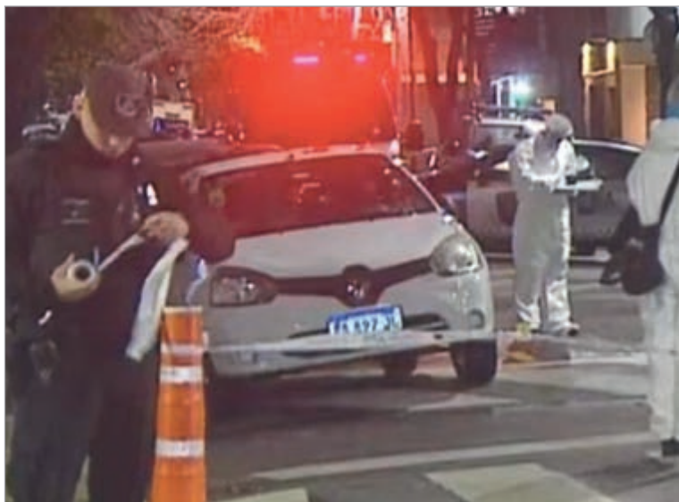
La escena del crimen

aviso a la Policía, y un grupo de numerarios arribó poco después al sitio, al igual que personal médico del SAME. Trascendió que el joven presentaba múltiples heridas de arma blanca en el abdomen, lo que le quitó la vida en cuestión de minutos y antes de los galenos pudieran hacer algo por él. "Ni siquiera pudieron trasladarlo a un centro médico", dijo un portavoz