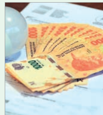
La quita de subsidios impacto en los más pobres

“Esta homologación de la tarifa subsidiada entre N2 y N3 reduce significativamente el grado de progresividad del esquema y la exigencia para que los costos energéticos no comprometan la satisfacción de otras necesidades básicas de los sectores más vulnerables”, añadió.