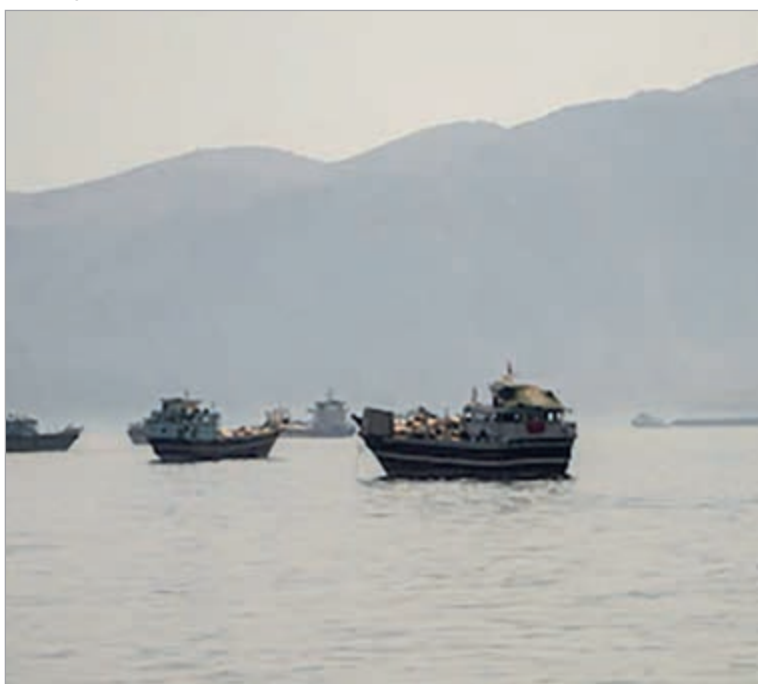
El estrecho de Ormuz vuelve a convertirse el centro de disputa

Teherán anunció la suspensión del tránsito marítimo por una de las rutas energéticas más importantes del mundo, luego de denunciar incumplimientos del alto el fuego y nuevas operaciones militares en el sur del Líbano