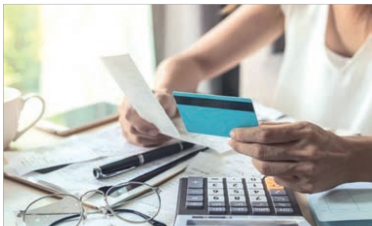
El crédito familiar se hunde mientras los bancos resisten

La magnitud del salto es alarmante. En abril de 2025 la mora se ubicaba en 3,7%, lo que significa que se triplicó en apenas un año. Actualmente, se estima que 5,3 millones de personas tienen al menos un crédito impago hace más de 90 días. Esa cifra representa al 26,7% de quienes poseen algún tipo de financiamiento en el país, incluyendo bancos, entidades no financieras y fintech.