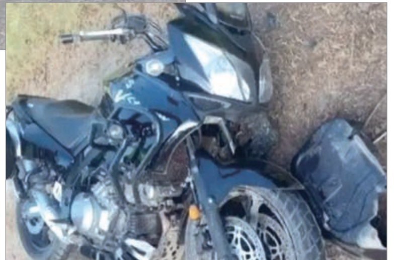
La moto en la que iba el hombre

Benítez fue trasladado de urgencia al Hospital San Roque de Gonnet, y los galenos determinaron que su cuadro era crítico, producto de un traumatismo de tórax que devino en una insuficiencia respiratoria aguda.