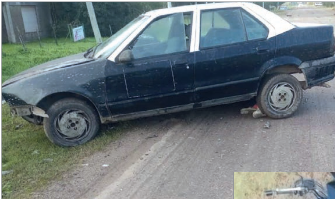
El vehículo con el que colisionó

Un motociclista se mató en Los Talas de Berisso tras chocar contra un auto. Su cuerpo quedó debajo del coche. El otro damnificado falleció en el Hospital de Gonnet