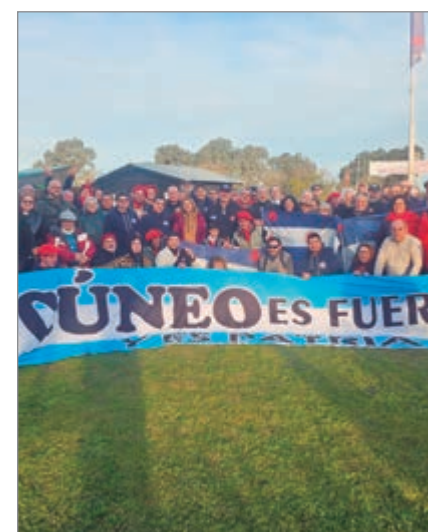
Cúneo encabezó un Encuentro Confederal

“Gracias a todos los compañeros y compañeras que se hicieron presentes. Seguimos organizándonos y creciendo en toda la Provincia”, expresó en redes sociales.