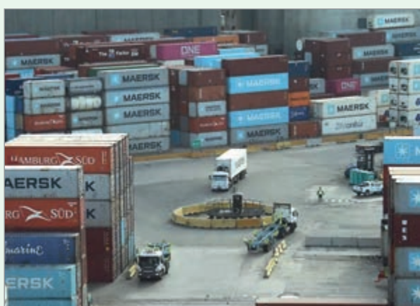
Las compras externas retrocedieron 16% y refuerzan el estancamiento de la actividad económica