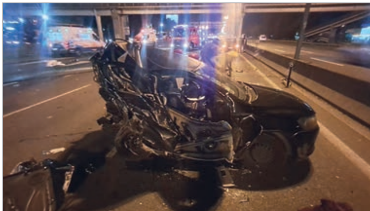
Así quedó el auto

La niña fue la única víctima fatal, aunque su madre también sufrió gravísimas heridas y permanece internada en grave estado. Hay otros dos lesionados