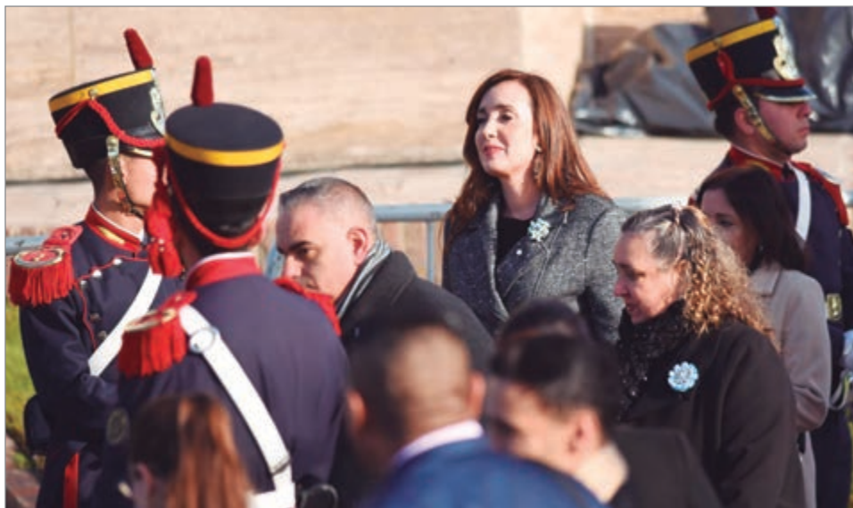
Villarruel se llevó las cámaras al darle la espalda a Milei

En el acto por el Día de la Bandera en Rosario, Javier Milei no fue el centro de atención a pesar de haber encabezado el acto. Las cámaras se fueron con Victoria Villarruel.