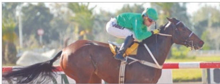
En su parada más brava. Let Me Dance viene de lograr su cuarta victoria y esta tarde accede a la competencia jerárquica