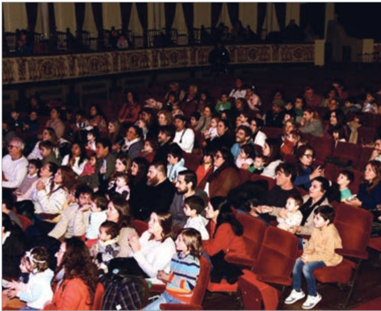
El Teatro Argentino ofrecerá a las 17 horas una nueva función de Dafnis y Cloe, Adagietto y Bolero

Por otra parte, el Teatro Argentino ofrecerá a las 17:00 una nueva función de Dafnis y Cloe, Adagietto y Bolero, mientras que a las 18:00 se proyectarán Rocambole en el camino en el Cine Select y Tristán, los días por venir en el Cine EcoSelect.