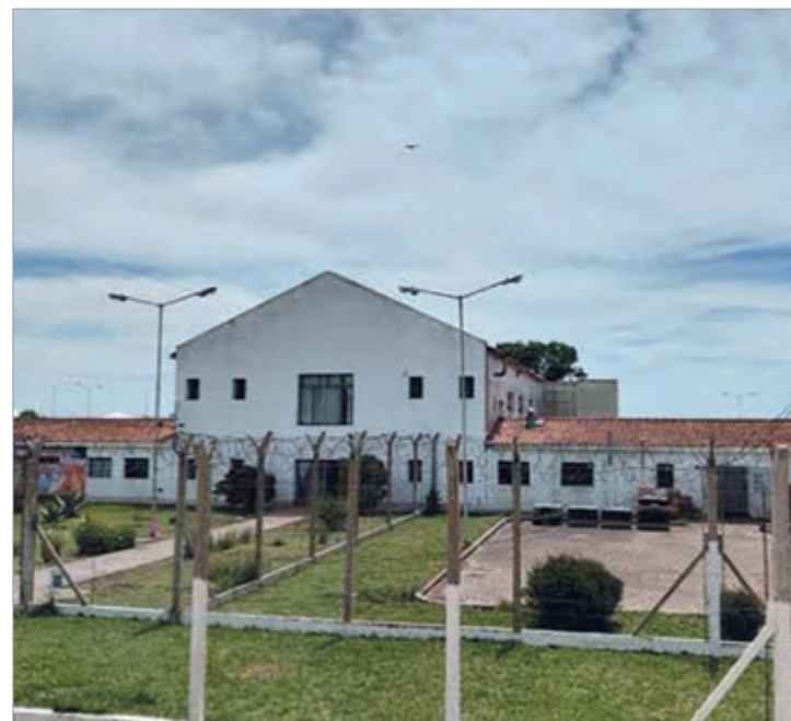
El penal 51

El escrito judicial detalla que se les sumergió la cabeza en piletones con agua para cortarles la respiración, sufrieron golpizas reiteradas y al menos dos de las víctimas fueron sometidas a abusos sexuales con acceso carnal en el sector de la escuela del penal.