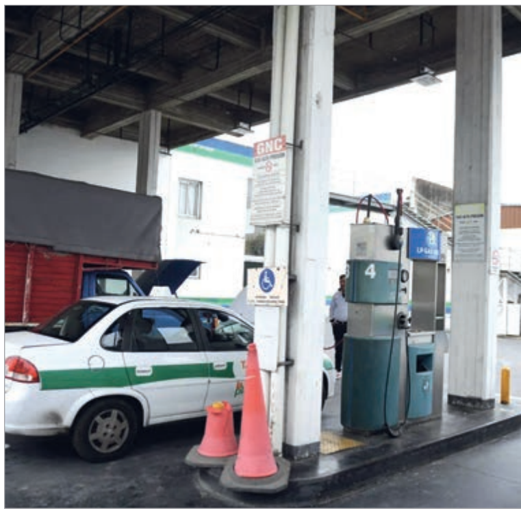
Taxistas preparan una demanda

El dirigente apunta al incumplimiento de la ordenanza vigente que establece que los taxis, remises y transportes tienen que tener prioridad con una boca de expendio cuando se producen estas restriccio-