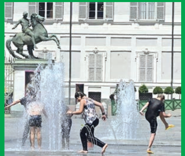
Europa sufre su segunda ola de calor en el comienzo del verano