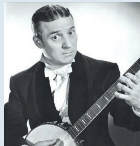
Fue actor, mimo, músico y comediante, pero su gran marca artística estuvo en la pantomima

Gene Sheldon sigue siendo recordado por su inolvidable interpretación de Bernardo, un personaje que demostró que el talento y la expresividad pueden trascender las palabras.