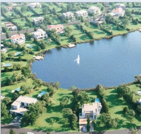
Crean un mecanismo para mayor control

La Autoridad del Agua (ADA) de la provincia de Buenos Aires aprobó un nuevo mecanismo para estimar consumos y vertidos en barrios cerrados, countries y otros emprendimientos privados que no cuentan con las habilitaciones correspondientes. El nuevo régimen permitirá determinar y calcular el canon por el uso del agua y otras tasas vinculadas al control de efluentes.