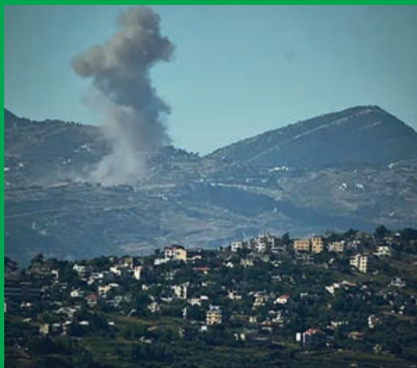
Al menos cinco muertos en el sur del Líbano por ataques israelíes