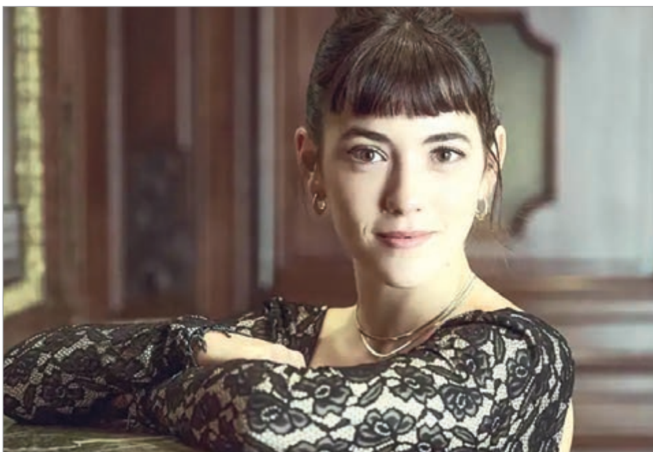
Estará en la próxima serie Cautiva

—Me preparé mucho, con bastante anticipación. Primero empezamos con un coucheo con Moira Miller, que es la coach de acento, de dialecto, digamos, y eso fue, creo que dos meses antes de arrancar. Yo quería llegar al rodaje teniendo el acento trabajado y que no sea una complicación a la hora de actuar, como poder soltar y actuar, más allá de que ahí nos pudieran corregir o acompañar. Y después mucha investigación. Bueno, obviamente la lectura del libro, que fue como una especie de biblia a