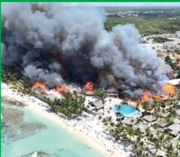
Un fallecido y 1.700 turistas desalojados en República Dominicana por un incendio en un hotel de lujo