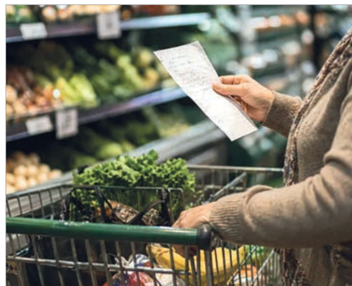
Las ventas retrocedieron 3,7% interanual y acumulan una baja de 3,3% en lo que va del 2026

El paralelo, el panorama en los autoservicios mayoristas también fue negativo. En abril, las ventas registraron una caída interanual del 5%, mientras que el acumulado enero-abril mostró una baja de 3,2% frente al mismo período de 2025. Estos datos confirman que la contracción del consumo se extiende a todos los canales de comercialización, afectando tanto a supermercados como a mayoristas y anticipando un escenario complejo para la actividad comercial en los próximos meses.