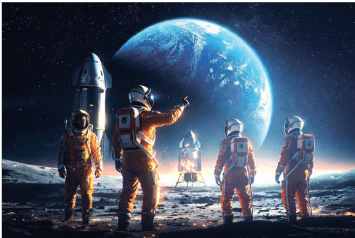
Artemis III representa una pieza fundamental dentro de la estrategia espacial estadounidense

llevará a cuatro astronautas a bordo de la nave Orion, impulsada por el poderoso cohete SLS (Space Launch System). Sin embargo, a diferencia de lo que se esperaba inicialmente, la misión no aterrizará en la Luna. En cambio, permanecerá en órbita terrestre para poner a prueba sistemas fundamentales