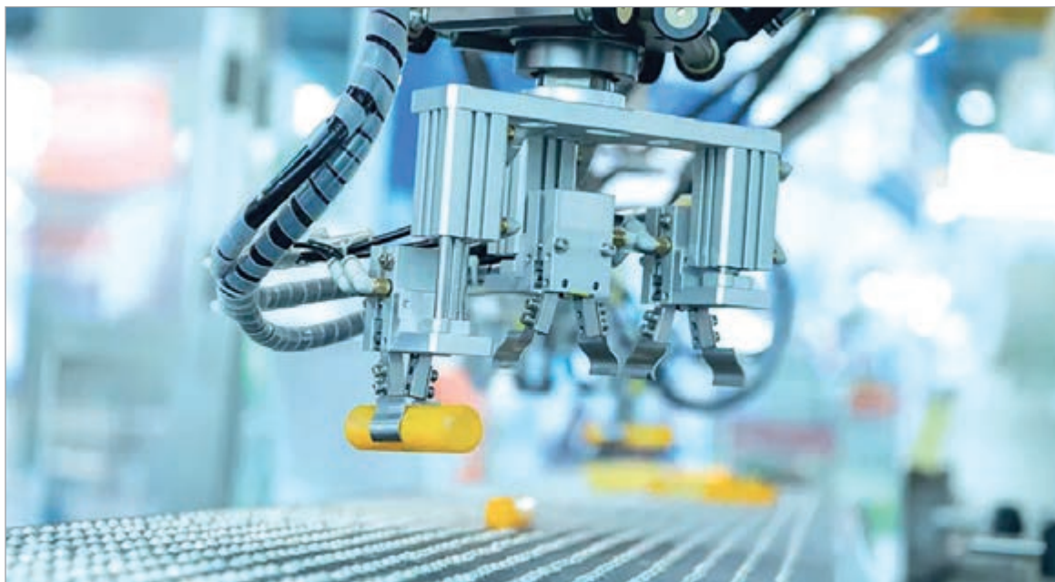
Alertan por el poder que busca conceder Milei a las empresas

Desde Amnistía Internacional y el Centro de Estudios Legales y Sociales (CELS) hasta Greenpeace: una decena de organizaciones presentaron conjuntamente un documento que desmiente los argumentos del Gobierno nacional sobre el proyecto de Super RIGI (Régimen de Incentivos a las Grandes Inversiones) que se discute en el Congreso.