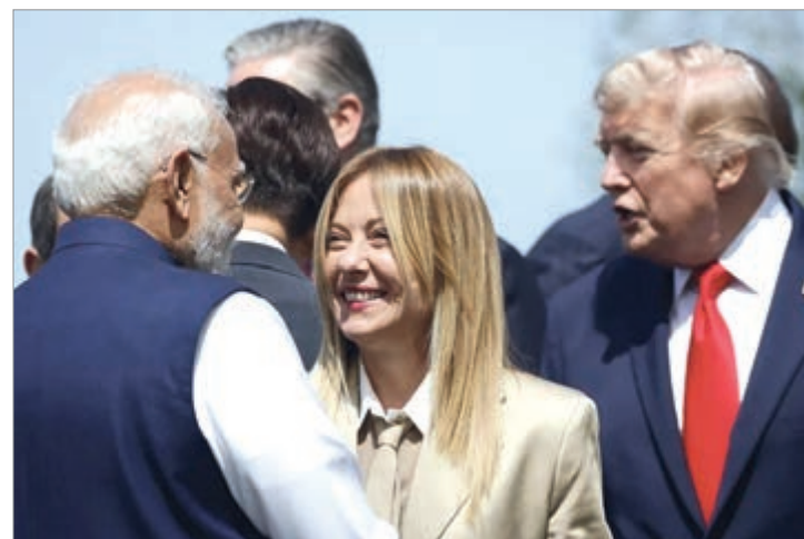
La mandataria enfrentó nuevamente al presidente estadounidense

El episodio demuestra los conflictos dentro de una alianza histórica, donde Italia intenta mantener su vínculo estratégico con Washington, pero al mismo tiempo reafirmar su autonomía en decisiones relacionadas con seguridad, política exterior y defensa de sus intereses nacionales.