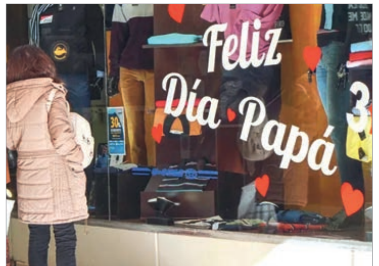
Búsqueda de promociones y descuentos para el regalo infaltable para papá

De esta manera, el Día del Padre volvió a convertirse en una de las fechas más importantes para el comercio local, con las compras de último momento como principal protagonista.