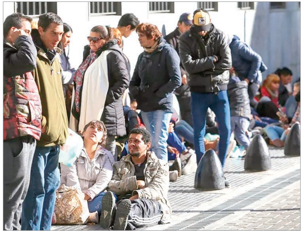
El empleo formal retrocede y el salario mínimo pierde poder adquisitivo

Las conclusiones del relevamiento refuerzan las señales de preocupación. El empleo formal continúa mostrando signos de debilidad y el salario mínimo sigue perdiendo capacidad de compra. Para los especialistas del IIEP, la persistencia de estas tendencias configura un panorama delicado para la economía argentina y plantea interrogantes sobre la capacidad de recuperación del mercado laboral en los próximos meses.