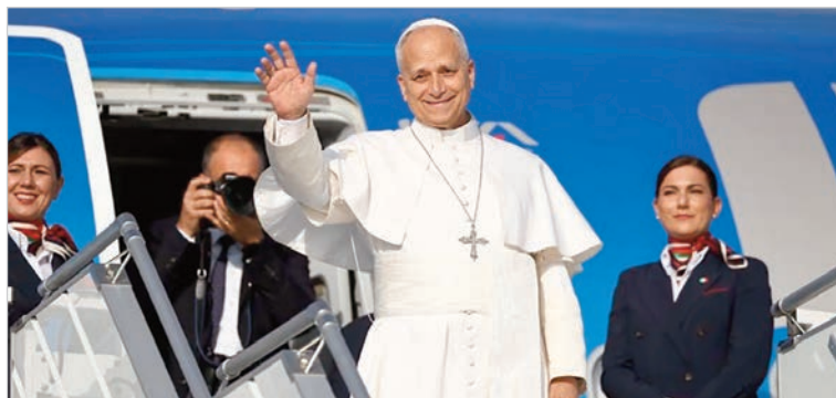
La Iglesia espera confirmación del Vaticano mientras se analizan posibles itinerarios en el país

sería la primera visita de un Papa a la Argentina en casi cuatro décadas. El último pontífice en recorrer el país fue Juan Pablo II, quien estuvo en 1982 y nuevamente en 1987, lo que refuerza