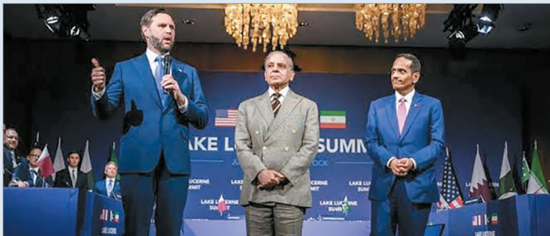
El primer ministro de Pakistán, Shehbaz Sharif, junto al vicepresidente de Estados Unidos, JD Vance, y al primer ministro de Catar, Mohamed bin Abdulrahmán

Vance señaló que la jornada de ayer representó el comienzo de una "negociación técnica" que "no resolverá todas las discrepancias pero nos permitirá sentarnos juntos, en realidad por primera vez en la historia, para determinar qué es lo más importante para las partes".