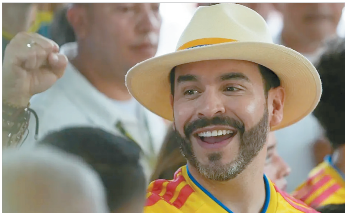
Abelardo de la Espriella gobernará al país hasta el 2030

El ultraderechista Abelardo de La Espriella, del movimiento Defensores de la Patria, ganó el día de ayer en la segunda vuelta las elecciones presidenciales en Colombia al obtener, al cierre de esta edición, el 49,65% de los votos, sobre el izquierdista Iván Cepeda, según el 99,80% del conteo preliminar elaborado por la Registraduría Nacional. El candidato del actual mandatario Gustavo Petro, registraba el 48,70% de los sufragios. Tras darse a conocer estos resultados, aseguró que el preconteo "no es vinculante" y anunció la impugnación de 33 mil mesas.