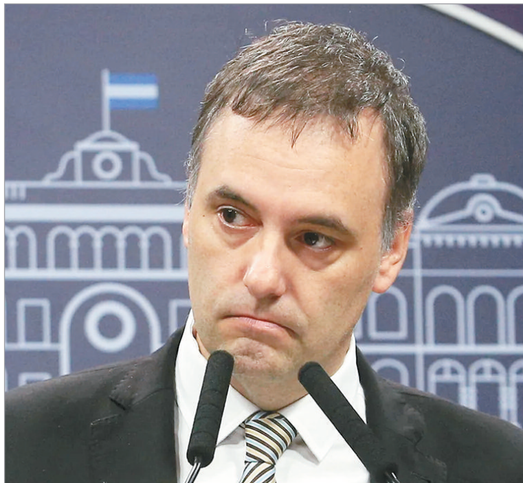
Semana clave en la causa judicial contra Adorni