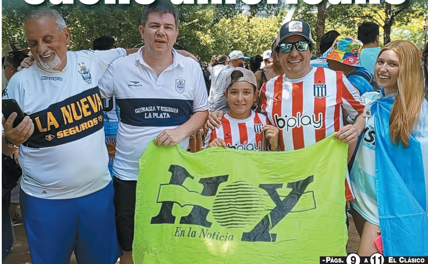
- PÁGS. 9 A 11 EL CLÁSICO