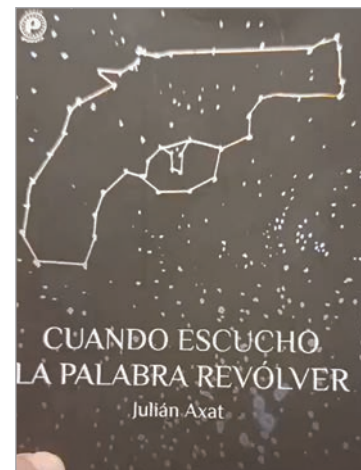
Cuando escucho la palabra revolver , el reciente libro de Axat

y escribir un poema sentado, mirando los túmulos. Así, en varios viajes que hice llevé mi libreta de notas y escribí esos poemas en distintos cementerios del mundo.