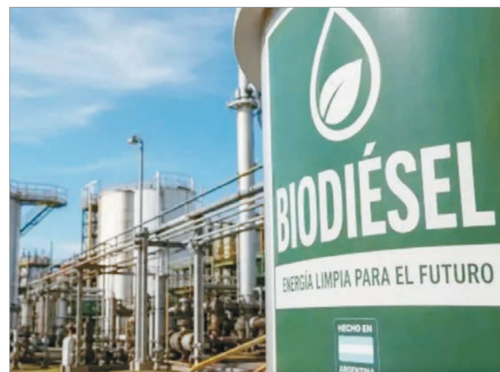
Hay resistencia de las pymes a la propuesta libertaria