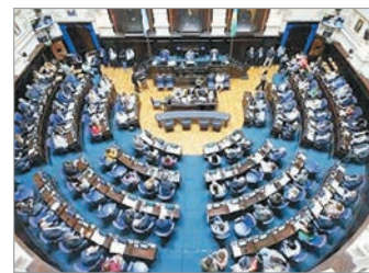
Diputados denuncian subejecución y deterioro en la red ferroviaria nacional

La iniciativa insta al Ejecutivo a ejecutar el presupuesto completo para garantizar obras de infraestructura y seguridad.