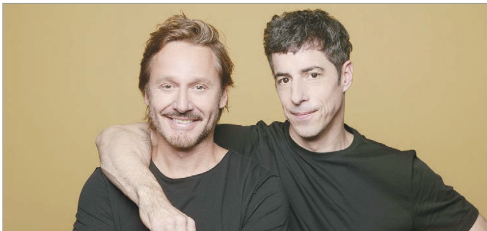
La dupla feliz por el suceso

track, que es salir y tener una conversación, mirarse a los ojos, pasó a ser como una marca registrada. Pasó a ser algo casi, te digo que hoy, imprescindible, necesario del teatro en Capital.