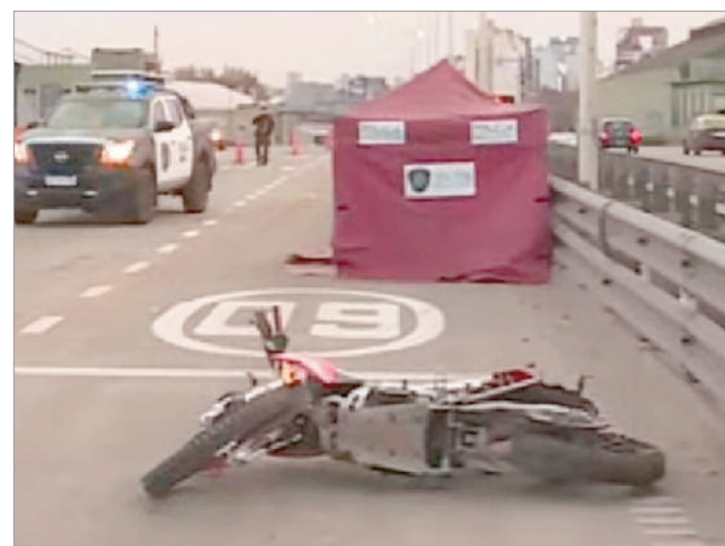
La escena del hecho

Según el reporte oficial, el conductor herido fue estabilizado en el lugar y posteriormente derivado al centro de salud mencionado en un operativo donde el personal de SAME y los efectivos policiales acudieron al lugar para asistir a los involucrados y ordenar el tránsito en la zona, el cual registró demoras en la circulación hasta que los vehículos fueron retirados y se normalizó el tránsito de los automóviles.