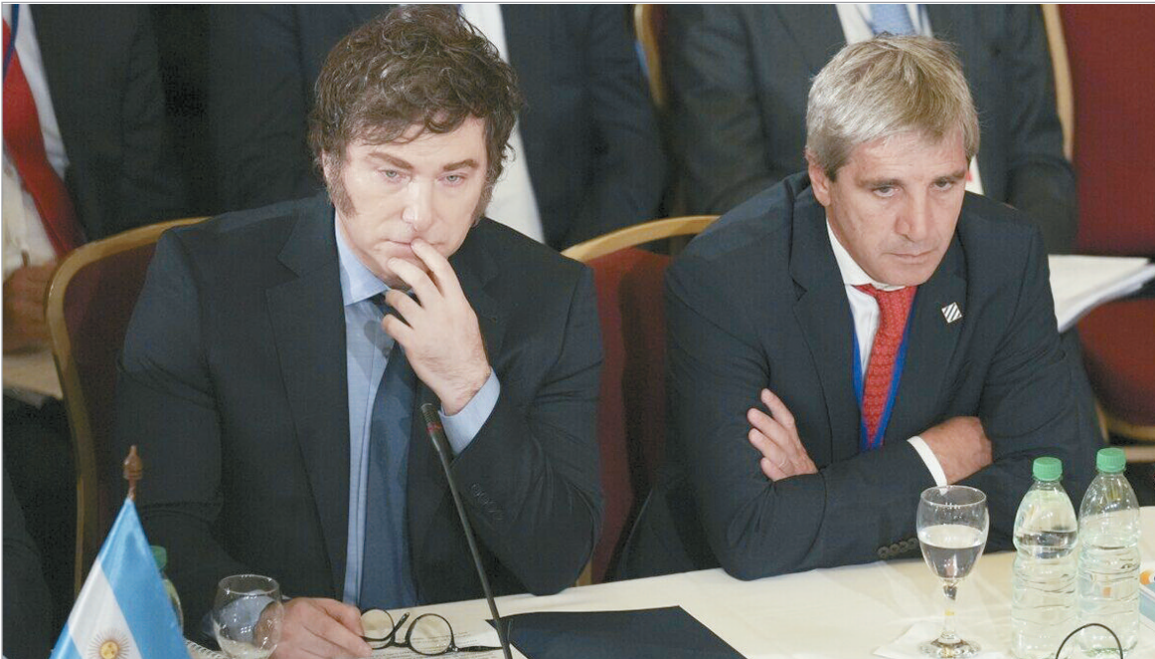
Milei y Caputo enfrentarán fuertes vencimientos

El mayor banco de inversión de Estados Unidos advirtió que en 2027 se pondrá a prueba el plan financiero de Milei por los fuertes vencimientos