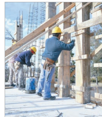
El 67% sufrió una baja en la actividad

El 67% de los profesionales del país vinculados a la construcción sufrió una disminución en su nivel de actividad durante los últimos doce meses, según reflejó el último Estudio de Opinión Construya.