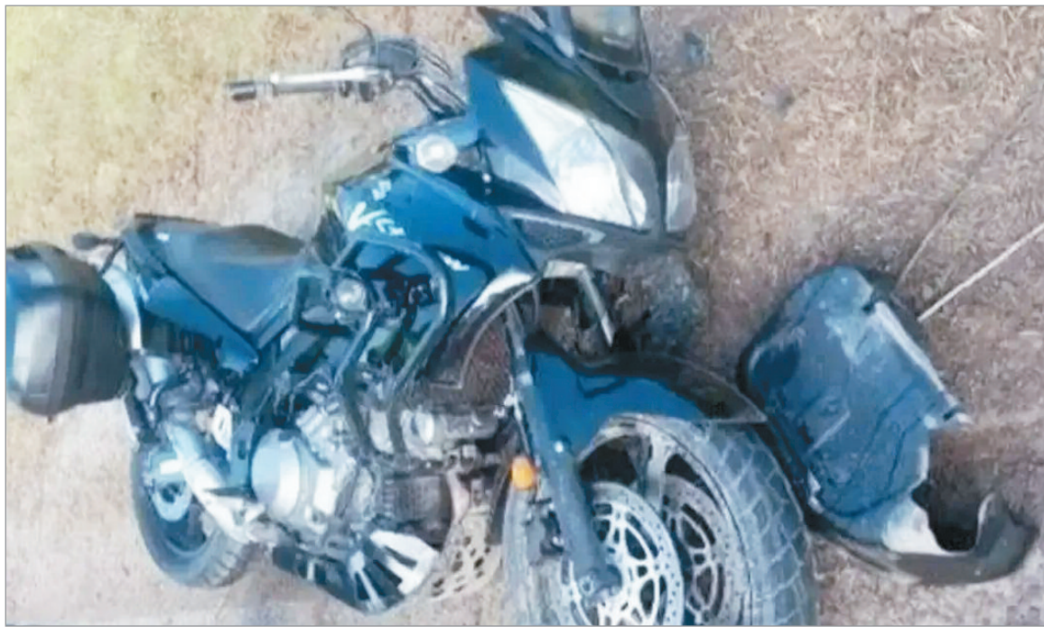
El rodado de la víctima

ciales que realizaban tareas de rutina en un destacamento cercano escucharon un fuerte estruendo y acudieron de inmediato al lugar. Al arribar encontraron una escena dramática: