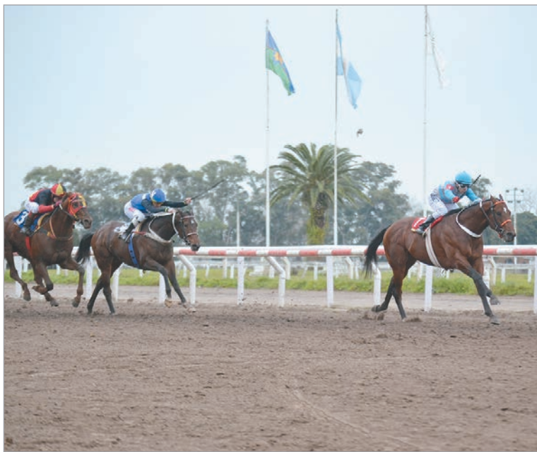
Confirmó su superioridad. El Resero Con Capa demostró que en carreras de velocidad y en esta pista, es prácticamente imbatible

Cotejo reservado para todo caballo de 3 años y más edad, a peso por edad, ocupó el quinto turno de la programación con siete ejemplares en pista. El cierre de las apuestas mostró el claro favoritismo de El Resero Con Capa, que en caso de ganar prometía un sport de $1.90,