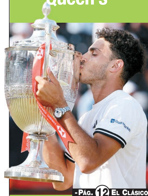
- PÁG. 12 EL CLÁSICO