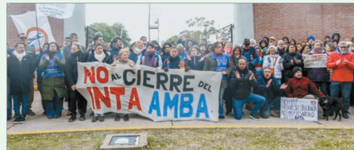
Legisladores presentaron un proyecto para impedir remates nacionales y preservar potestades locales.

Acerbo subrayó que la planificación urbana y territorial es competencia primaria de los gobiernos locales. Por ello, consideró necesario impedir que operaciones de venta masiva generen vacíos regulatorios o consoliden emprendimientos privados al margen de la planificación democrática.