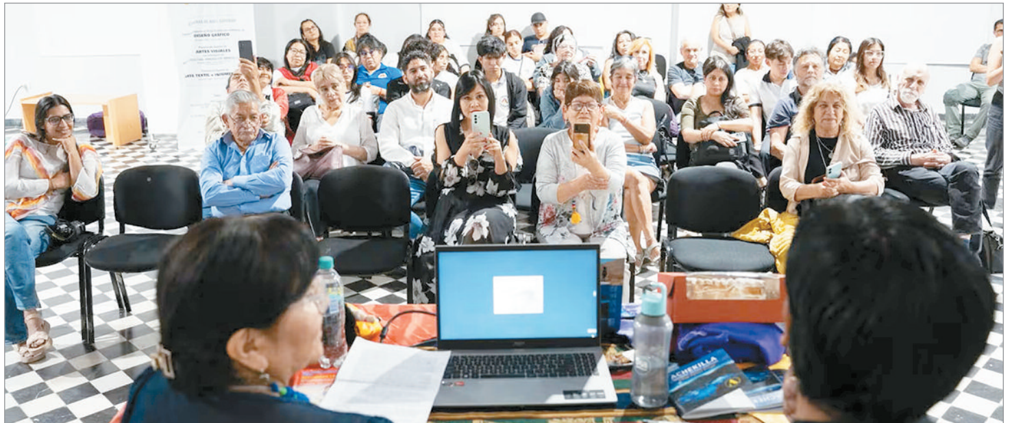
“Es necesario reivindicar la memoria y el presente indígena de nuestra Argentina”, indicaron desde el organismo a cargo

La propuesta tendrá lugar el 16 de octubre en la ciudad. En el Teatro Argentino ya están abiertas dos convocatorias tanto para editoriales, librerías y autores, como para las producciones escritas en el marco del I Encuentro Ayllu Bonaerense