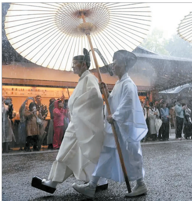
Sacerdotes sintoístas participan en una procesión en el templo Ise Jingu de Japón.¿