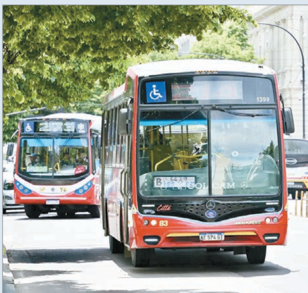
Casi el 60% dejó de usar el micro como transporte

Un informe reveló una fuerte merma de pasajeros de micros en La Plata, Berisso y Ensenada. Según el relevamiento del Observatorio de Movilidad del Gran La Plata, dependiente del Conicet y la UNLP, el 58% de los usuarios dejó de viajar en micros en los últimos dos años debido a los aumentos tarifarios y a las falencias del servicio.