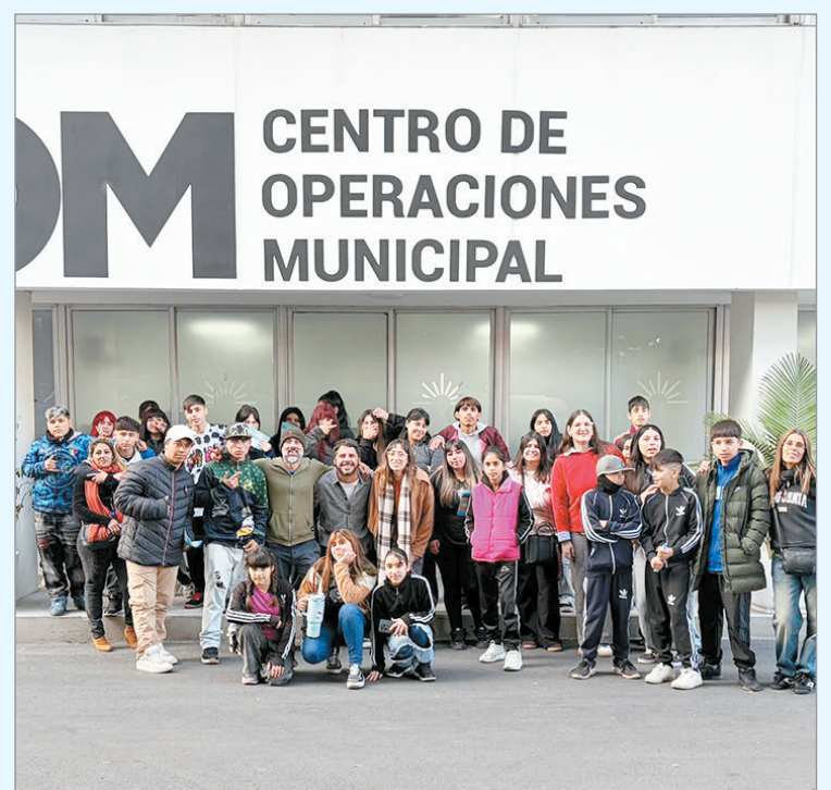
Fue a chicos de 14 a 21 años

Además, junto a personal de Control Urbano realizaron actividades de concientización vial que incluyeron el uso de gafas que simulan distintos grados de alcoholemia y circuitos guiados para expe-